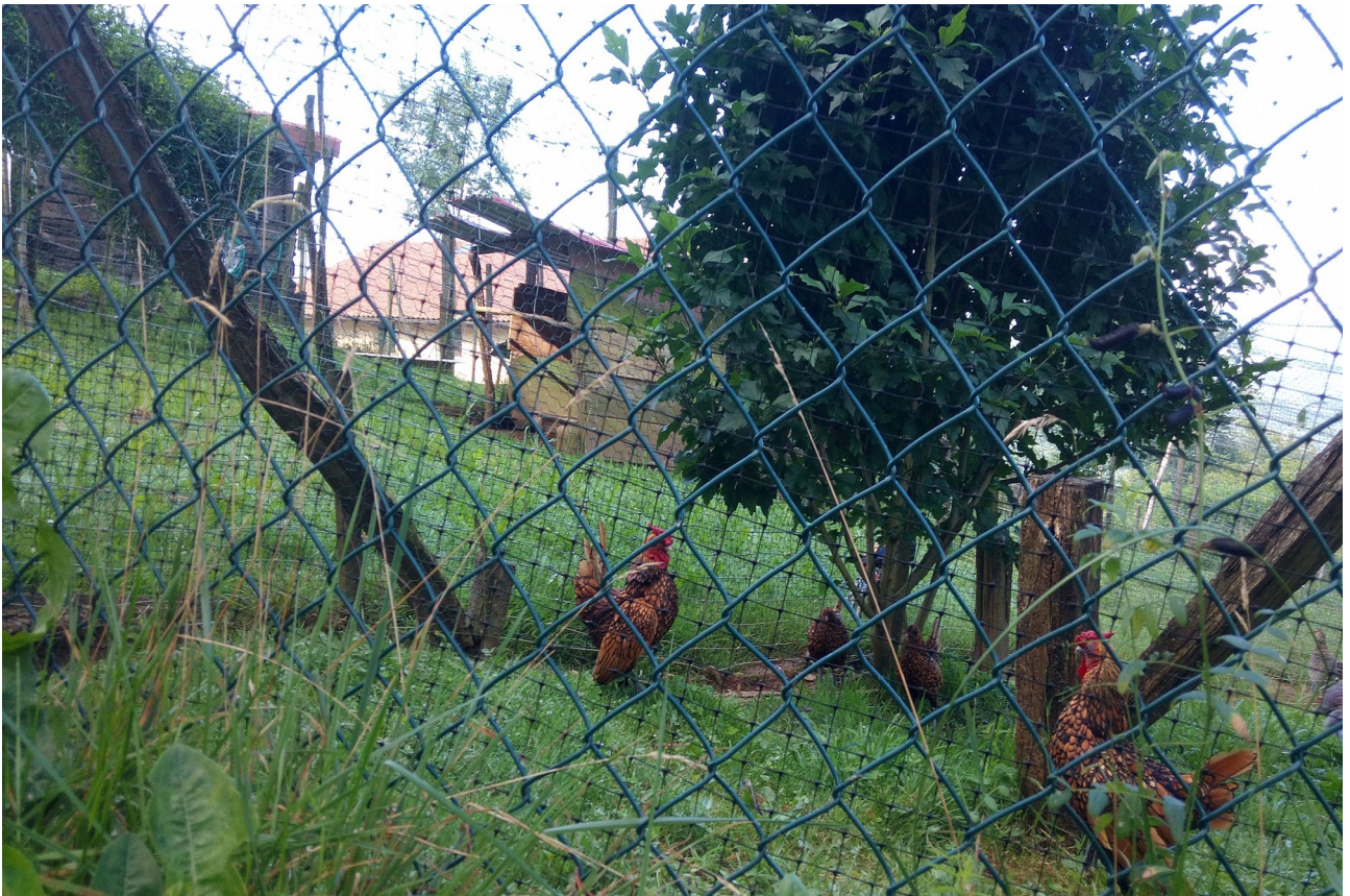
Hesi baten barruan, Urdanetan, hegazti bitxi mota askotakoak