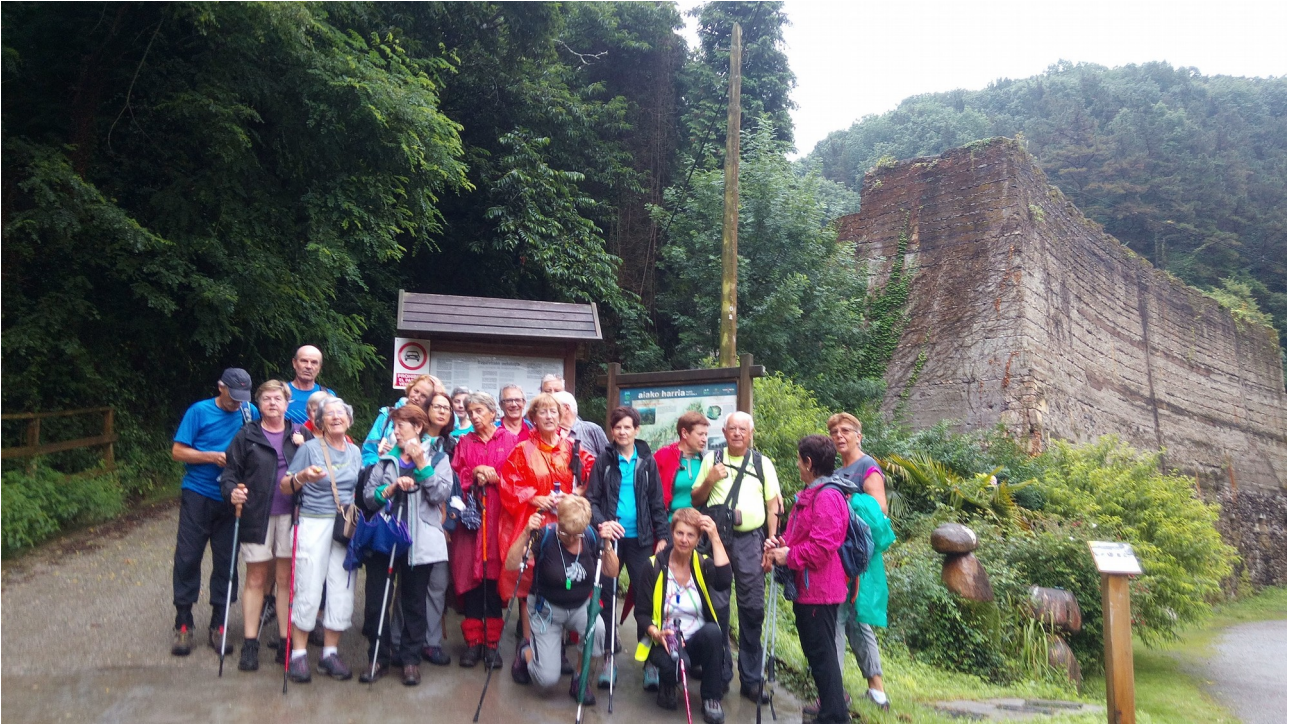
Hirugurutzetako labeen zamatokiaren ondoan