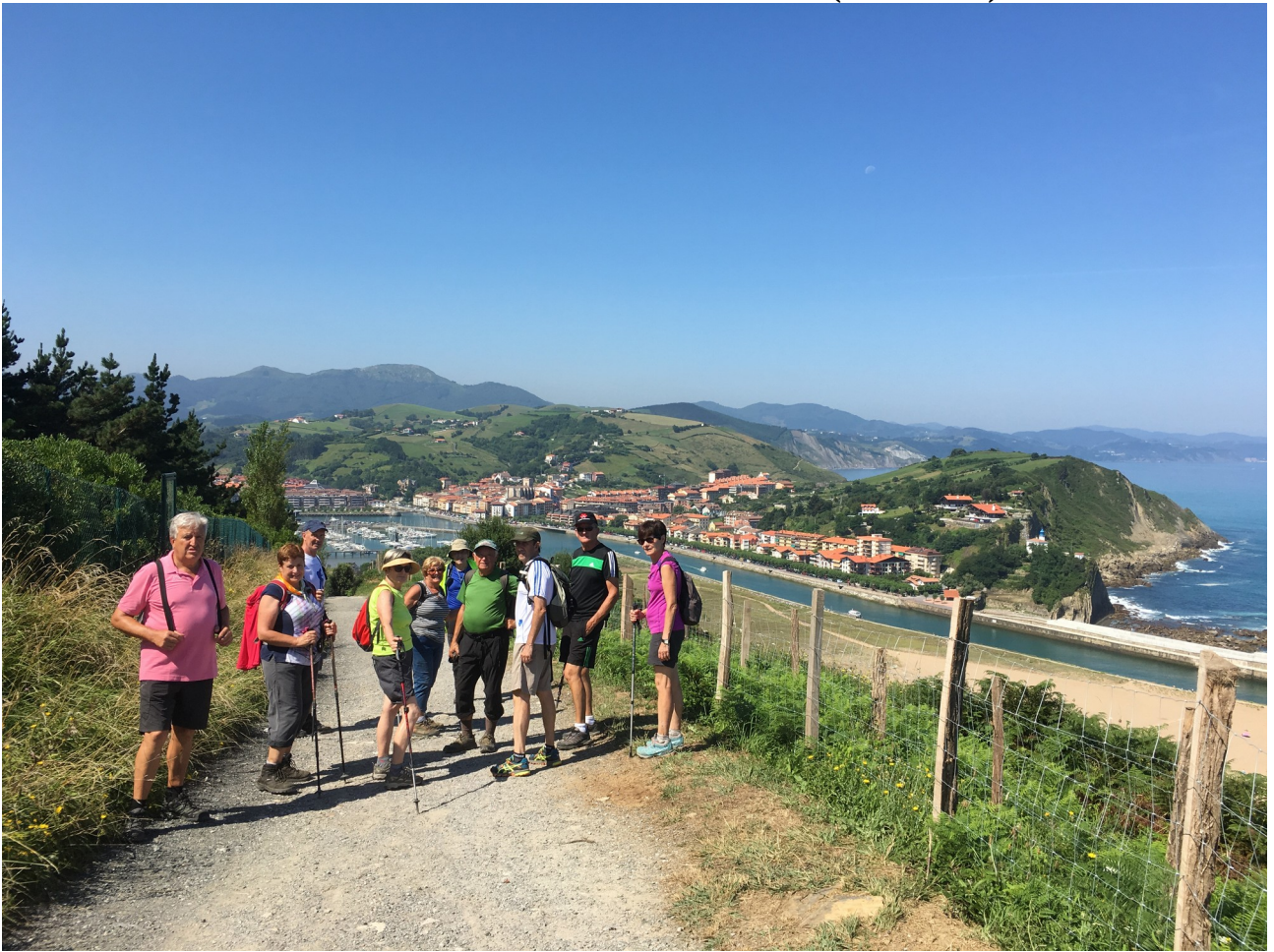
Ibilaldiaren bukaeran, Zumaia bistan dagoela