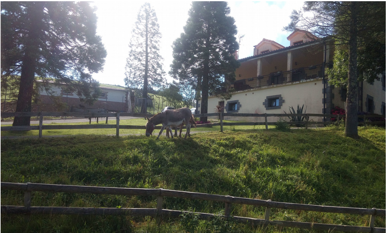
Astoak lasai askoan bazkatzen, Urdaneta auzoan