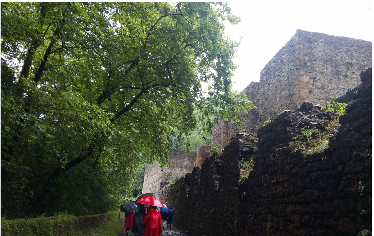
Hemendik gutxira ateri izan genuen