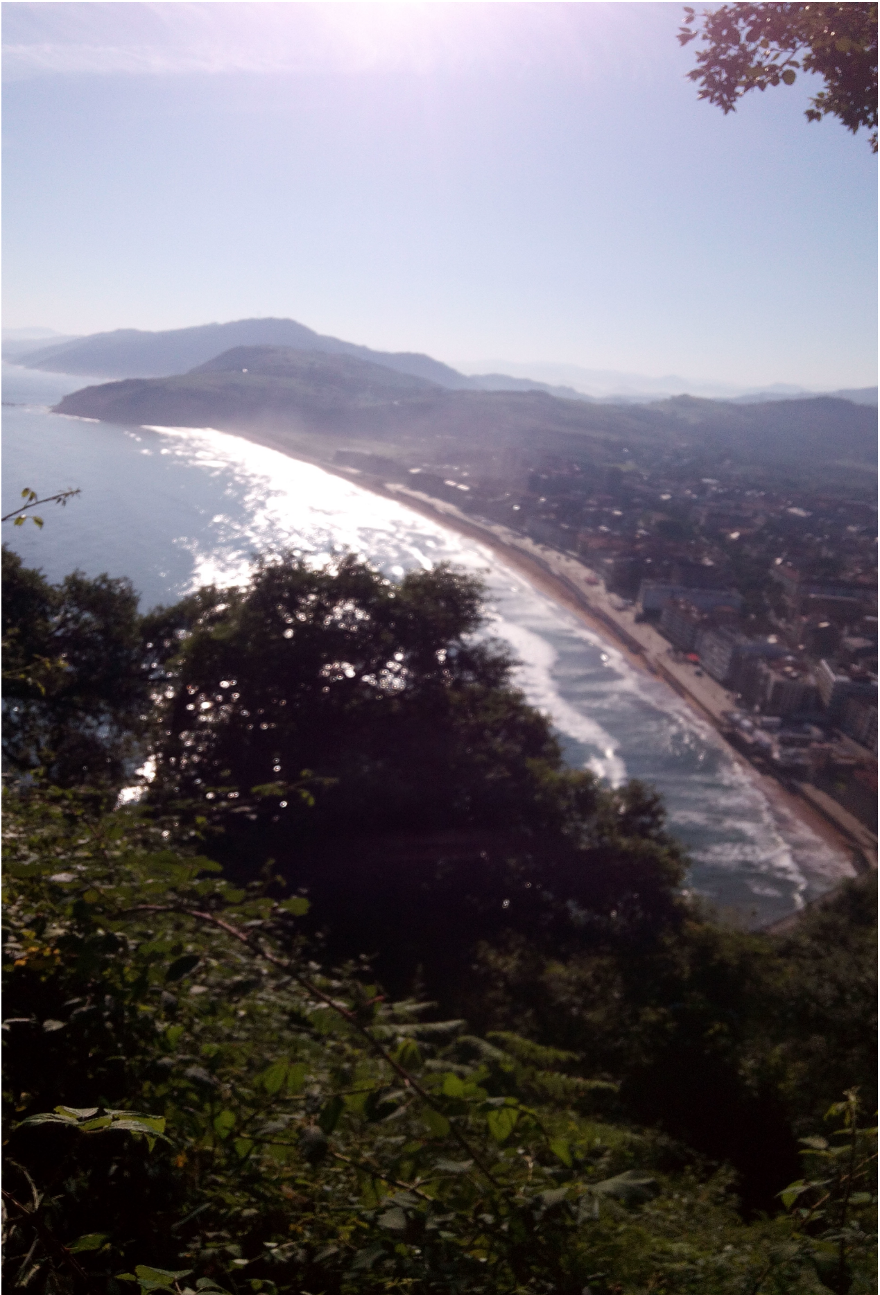
Zarauzko hondartza, Santa Barbaratik begiratuta