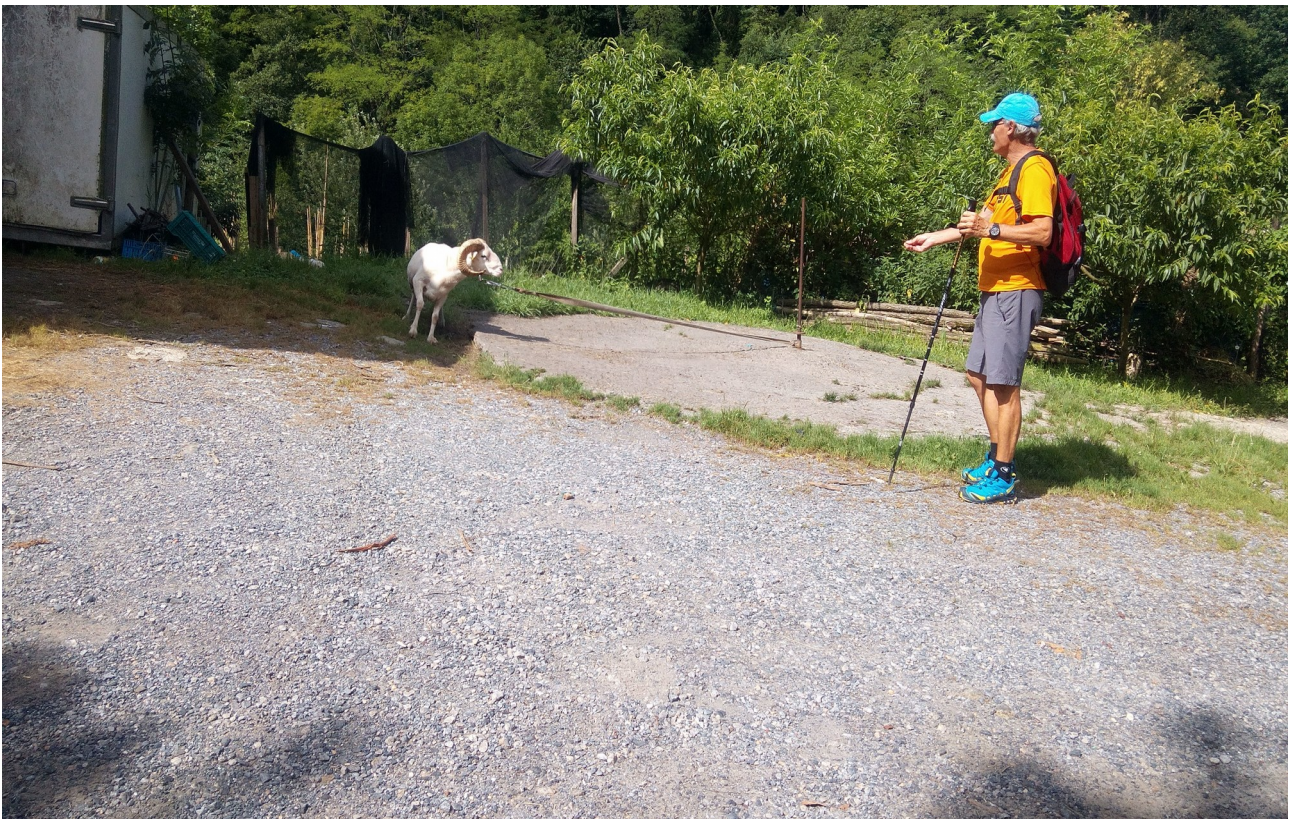
Hor jarraitzen du Endrikek aharia zirikatzen