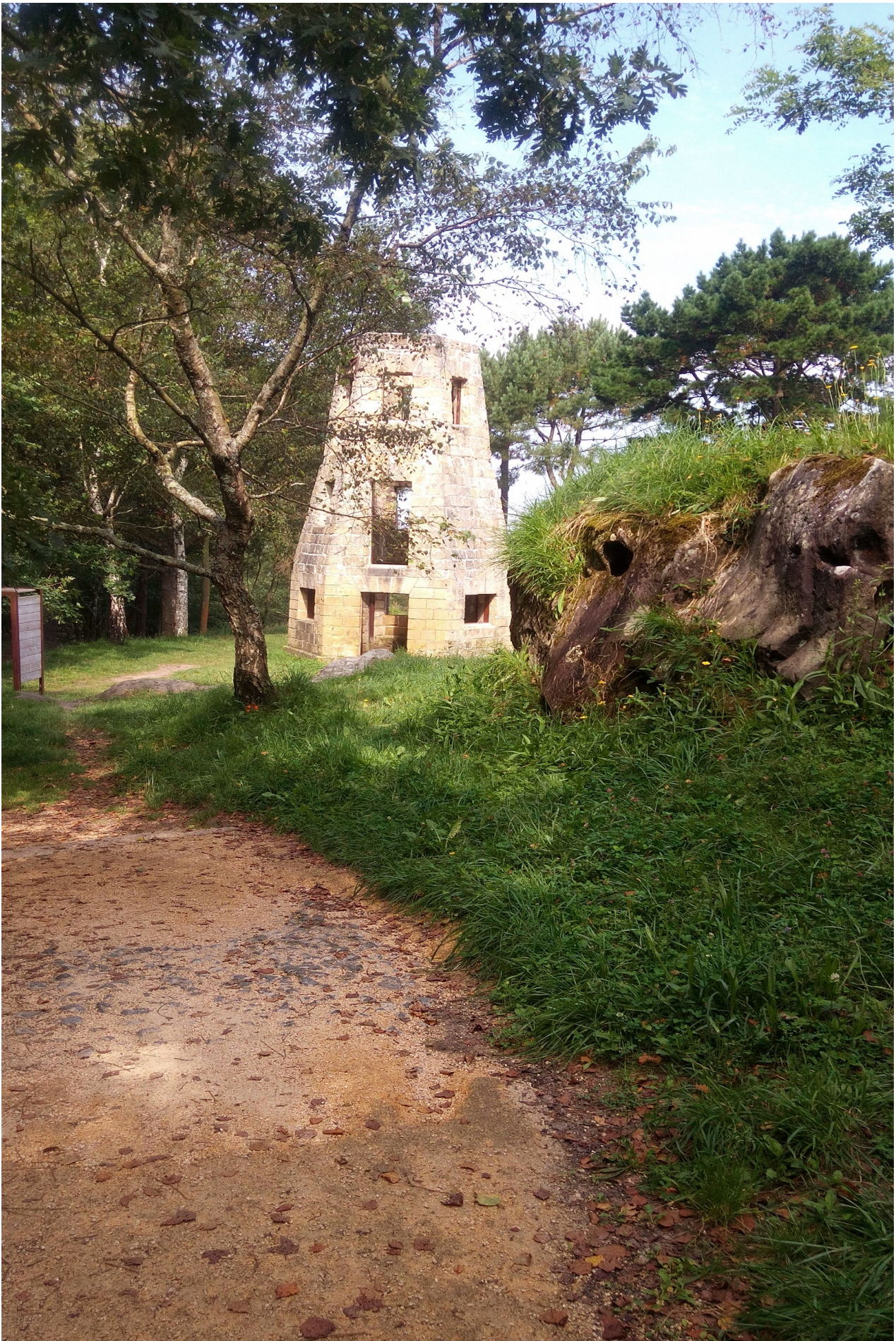
Ulia gaintik oso hurbil dagoen errota, dorre... edo dena delako hori