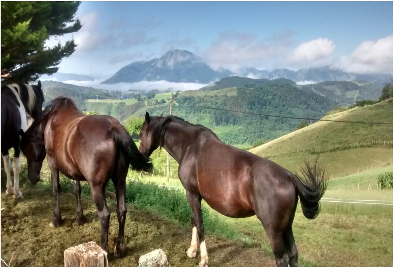
Gutxitan ikusten dira zaldi mardulak horren zaindu eta dotoreak