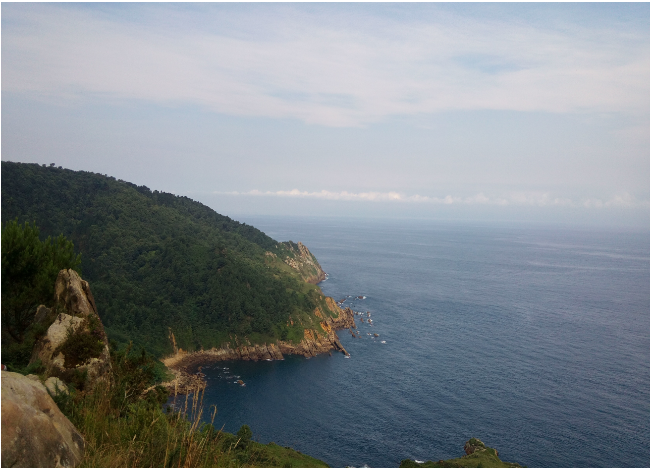
Uliako harkaitzen artean, igeritarako erabilitako itsasarte edo senaia (ensenada)