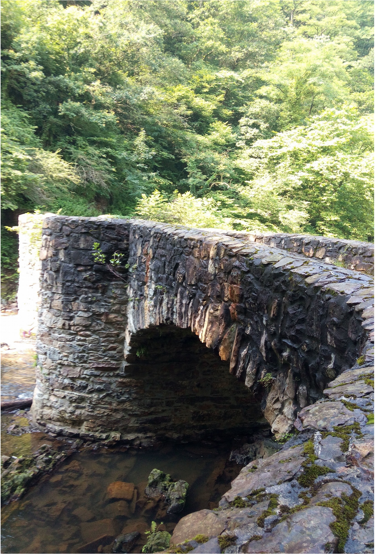
Sorginen Zubia, Andoain