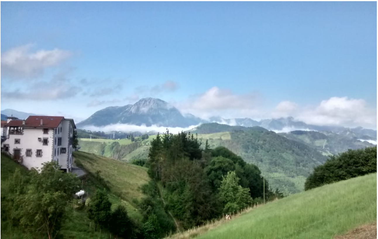
Urdaneta auzoko ikuspegia, Arlo mendia hondoan duela

Trintxerpe-Platako Itsasargia-Herri Ametsa-Mendiola-H.Ametsa-Ulia-Donostia (2018-07-27)