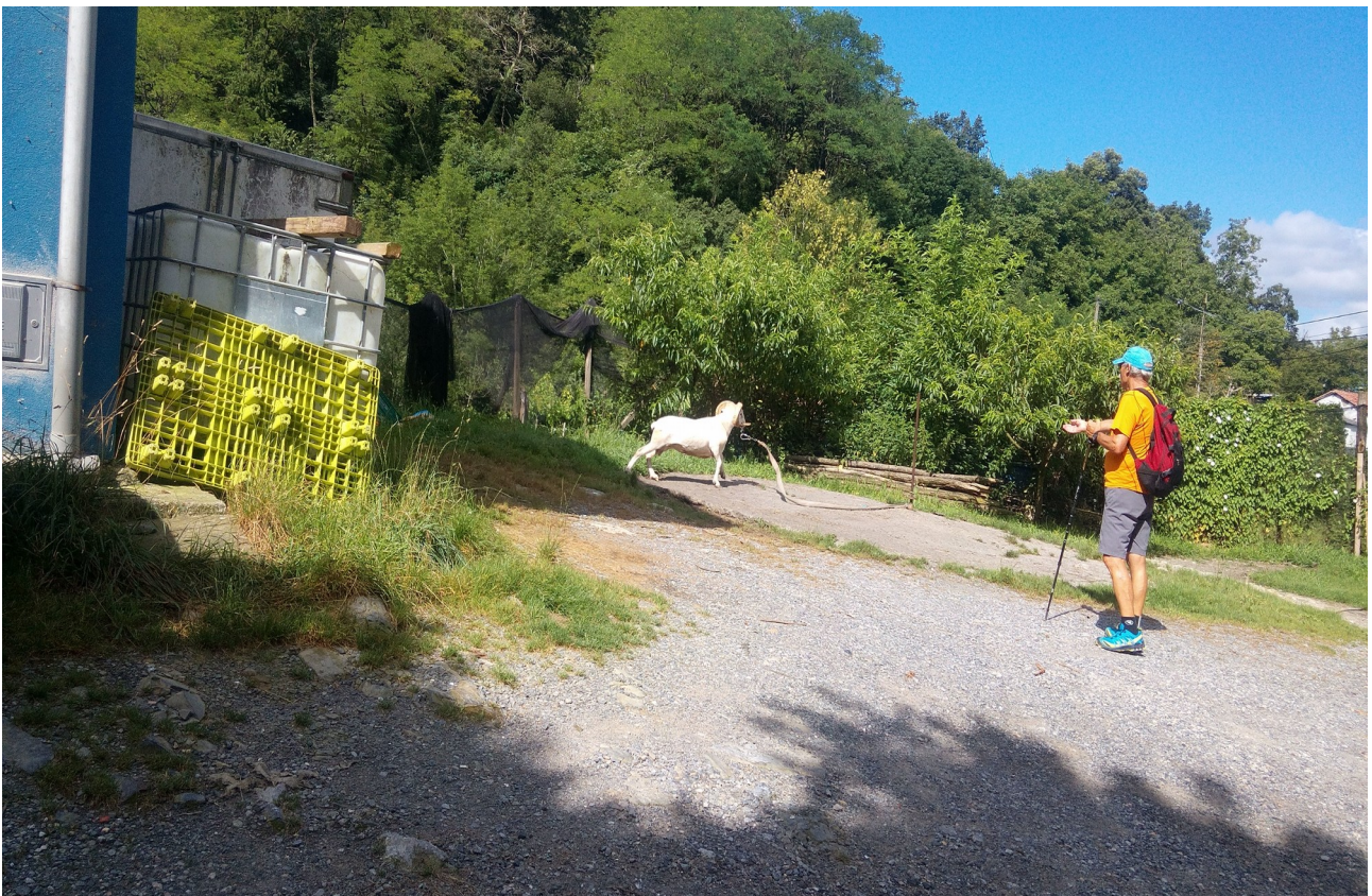
Endrike ahari batekin jolasean