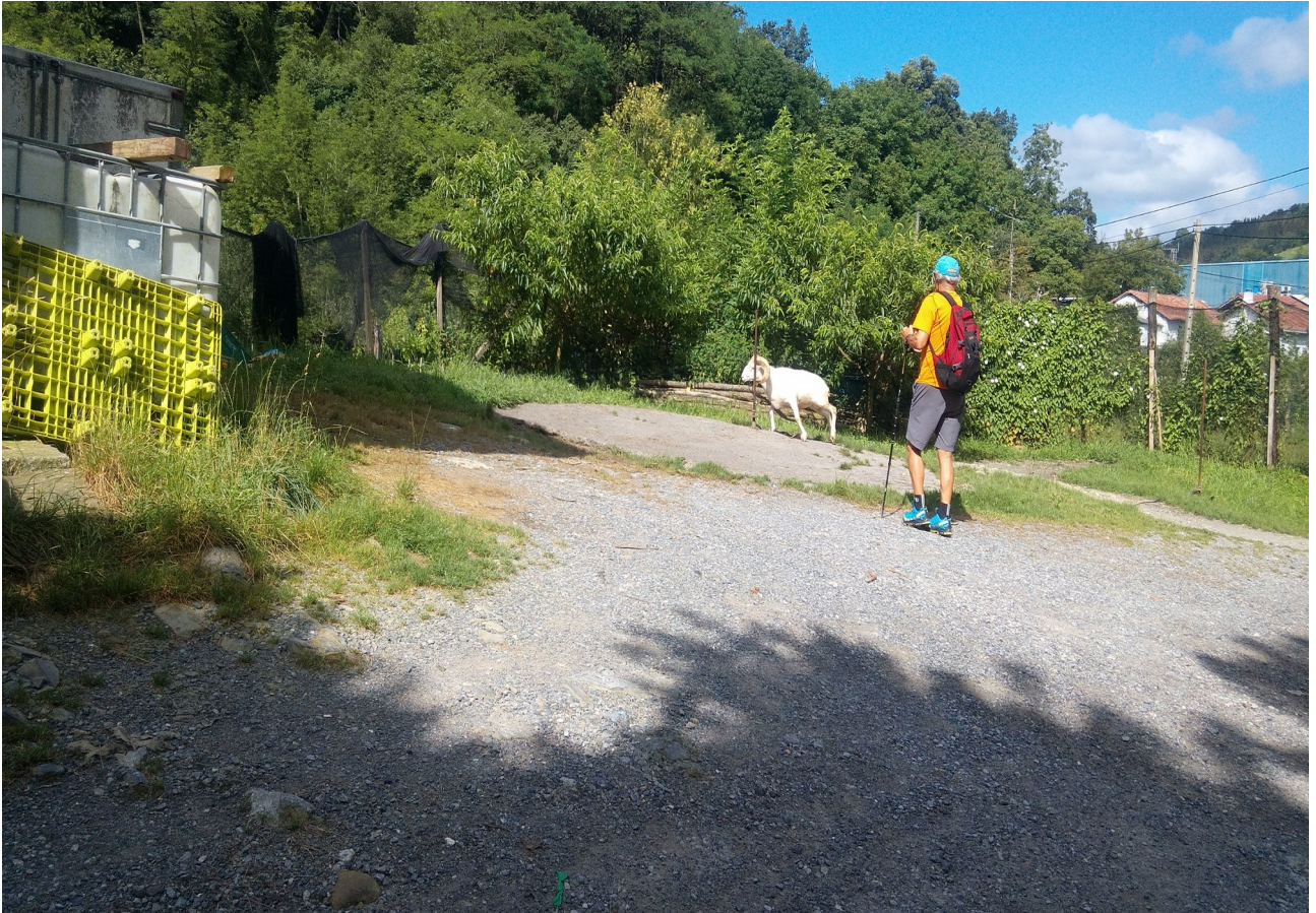
Honek ez daki ahariak talka egin dezakeela