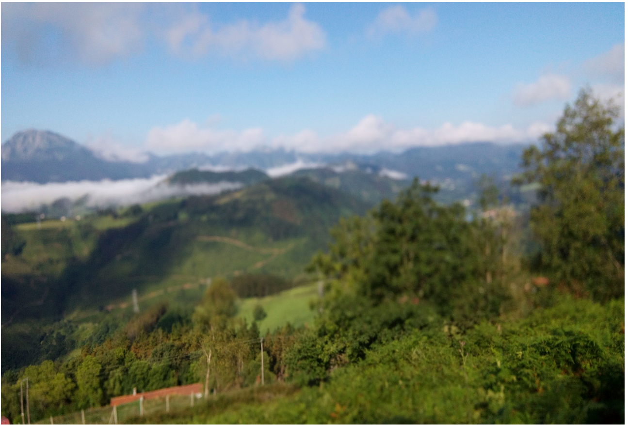
Hemen ere lainoa mendi muinoak inguratzen