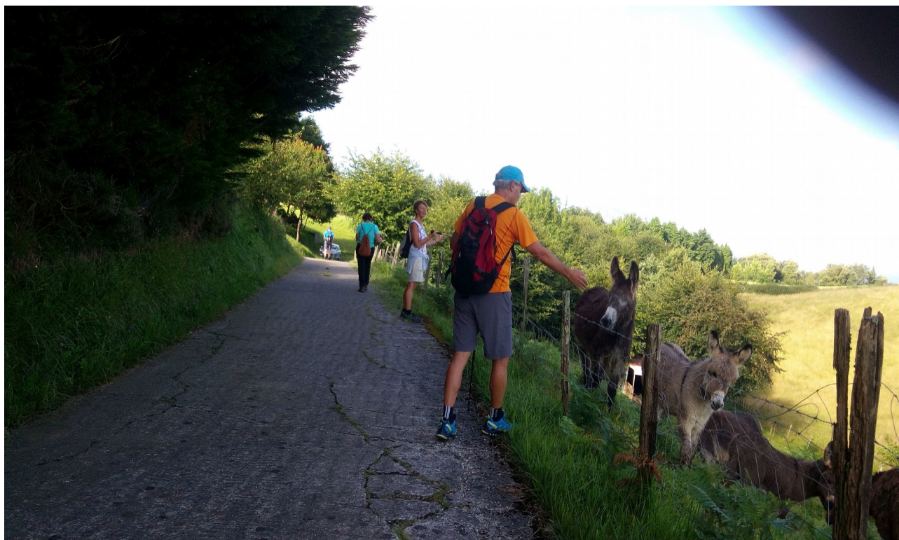
Urtetatik gora, soro batean zeuden astoak