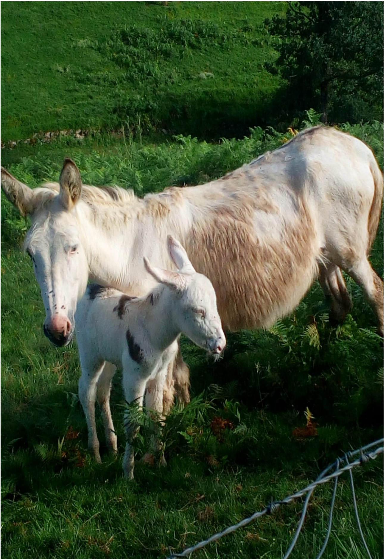
Ukimena nola lantzen duten ama-semeek