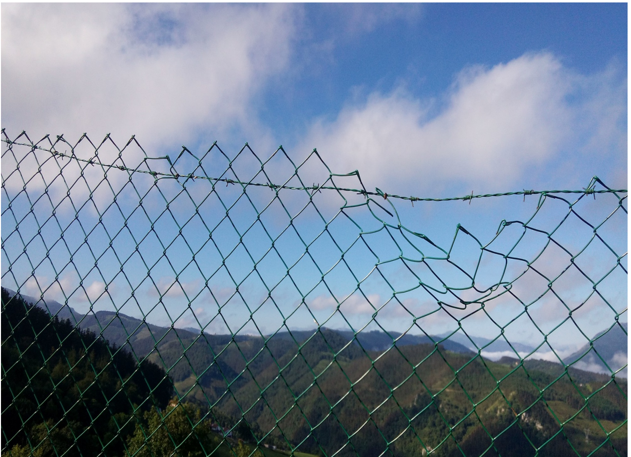
Burdinazko sarearen ondorengo paisaia