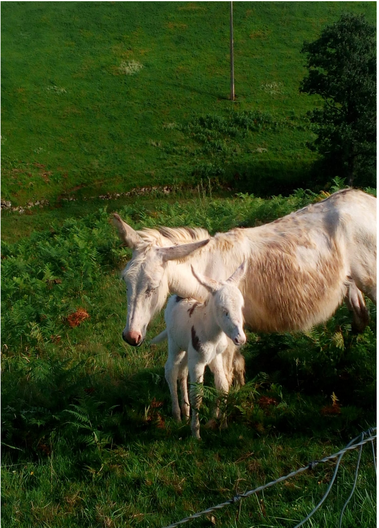
Astemea jaio berria den bere astakumearekin