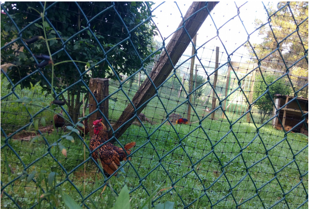
Hemen oilategiko nagusia, oilarra