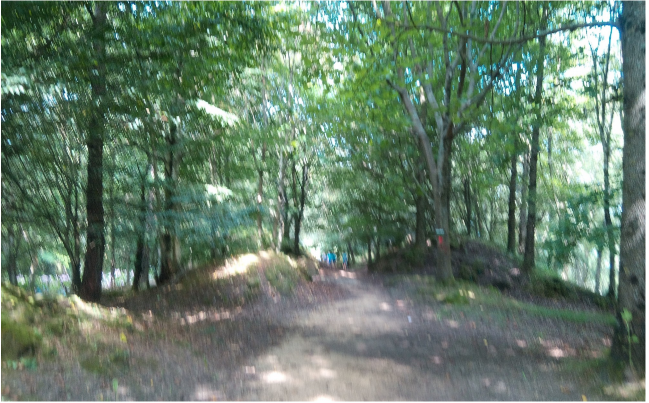
Ulia gaineko paisaia zuhaitzez josita...