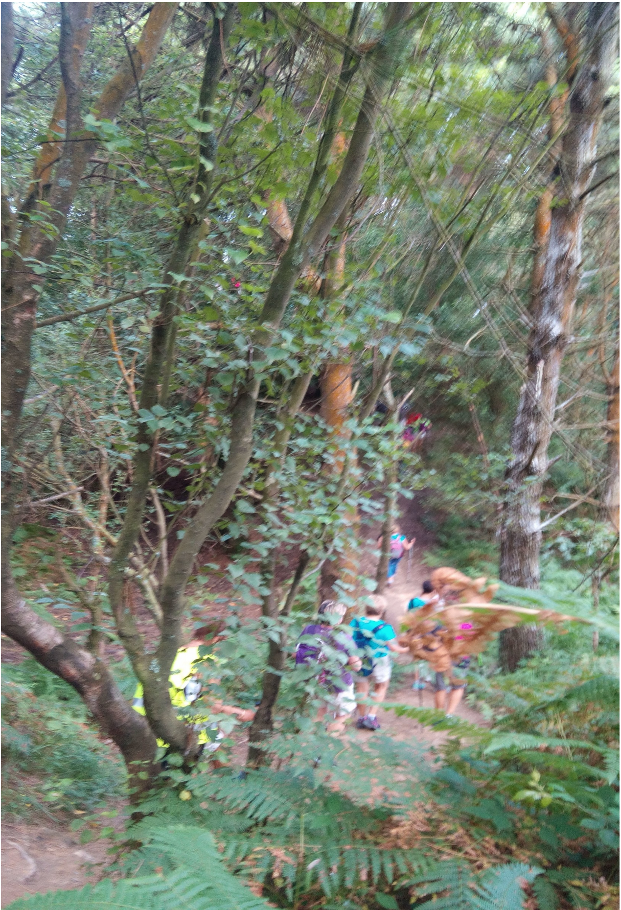
Mendiolako leku ezkutu batean zehar, zenbait ibiltari