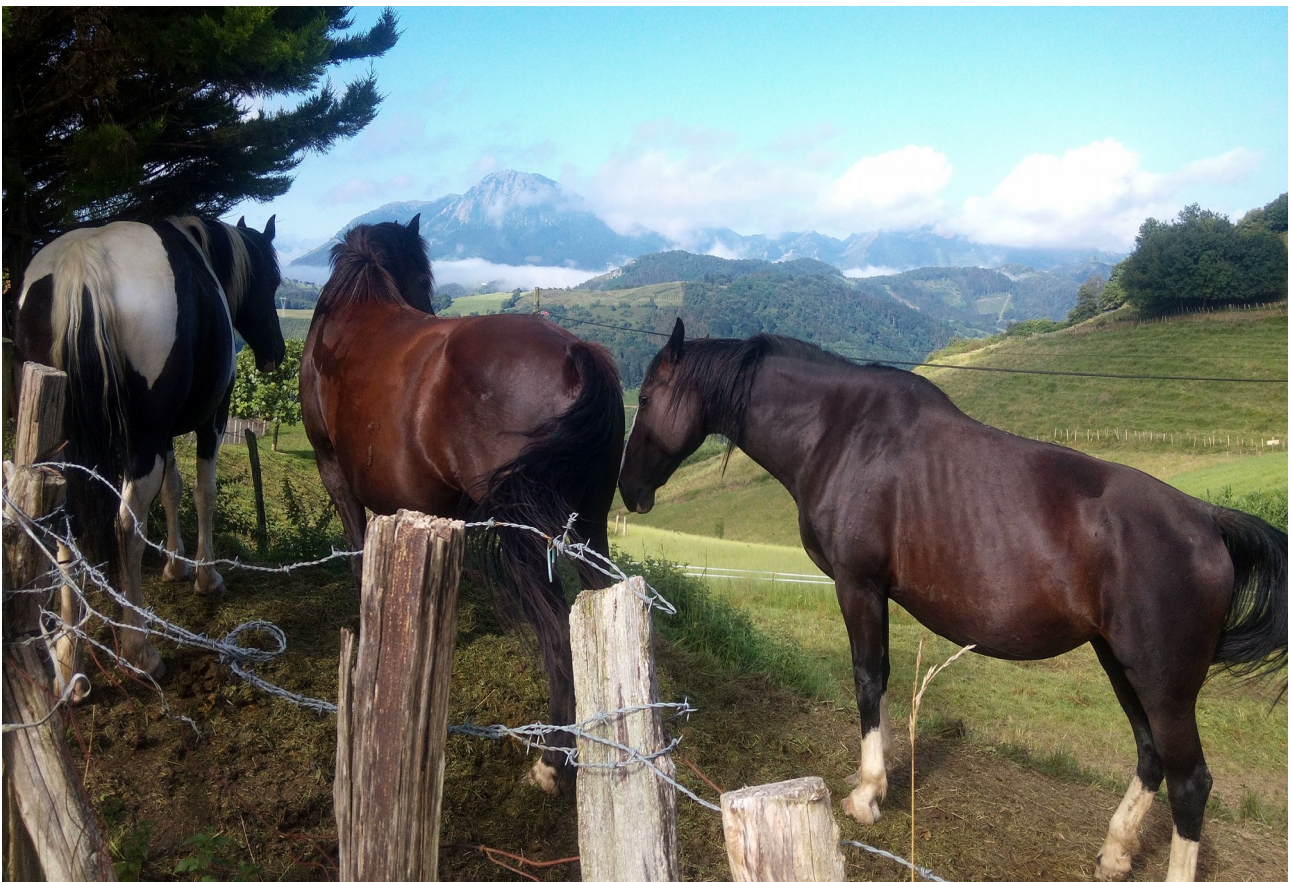
Zaldi garbi eta mardulak gerizpean, Urdaneta auzoan