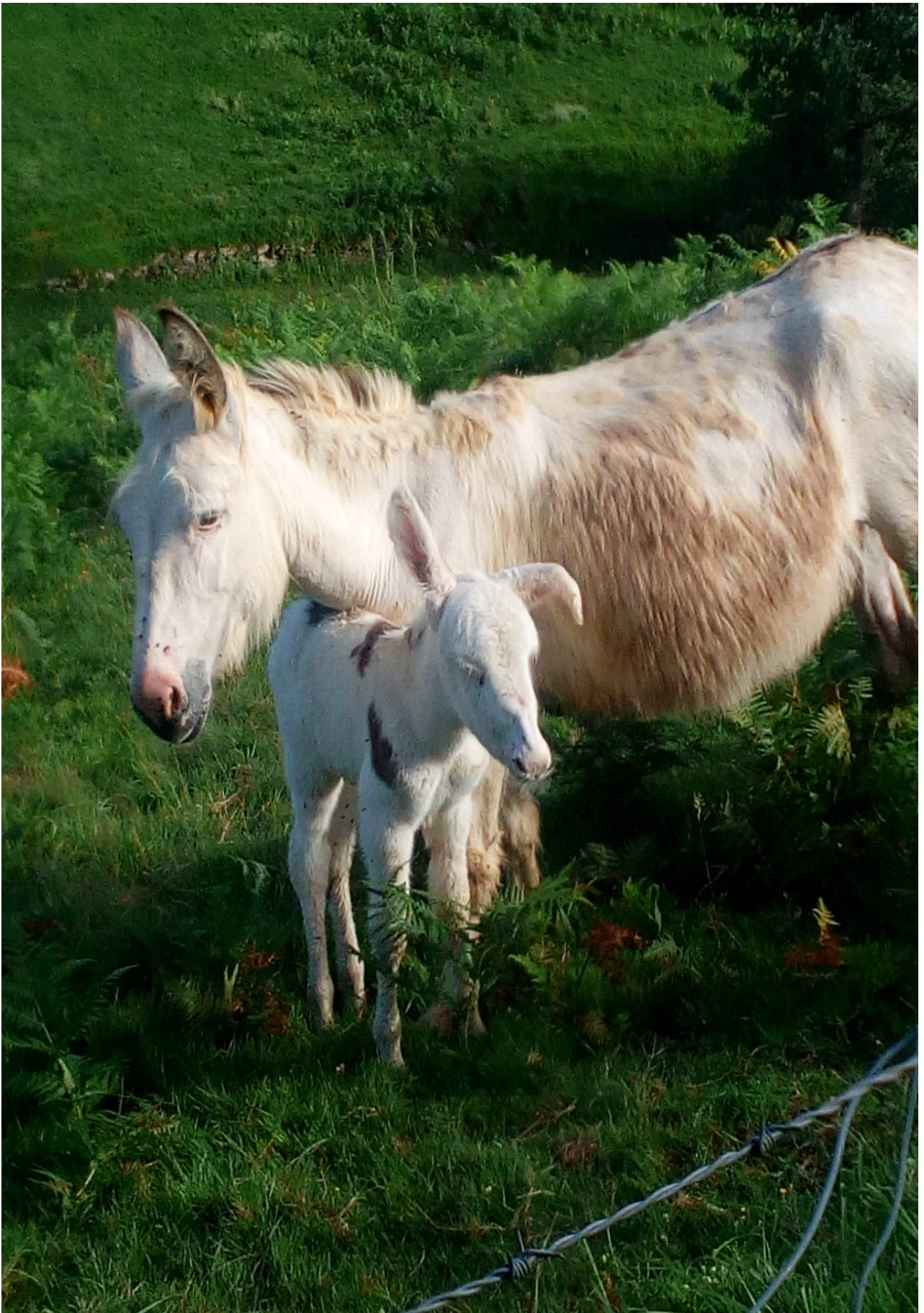
Astakumea astamaren babesa bilatzen une orotan