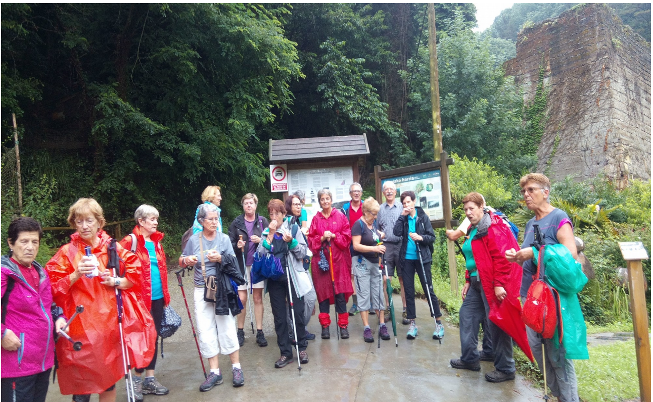
Taldeko argazkirako prestatzen jendea