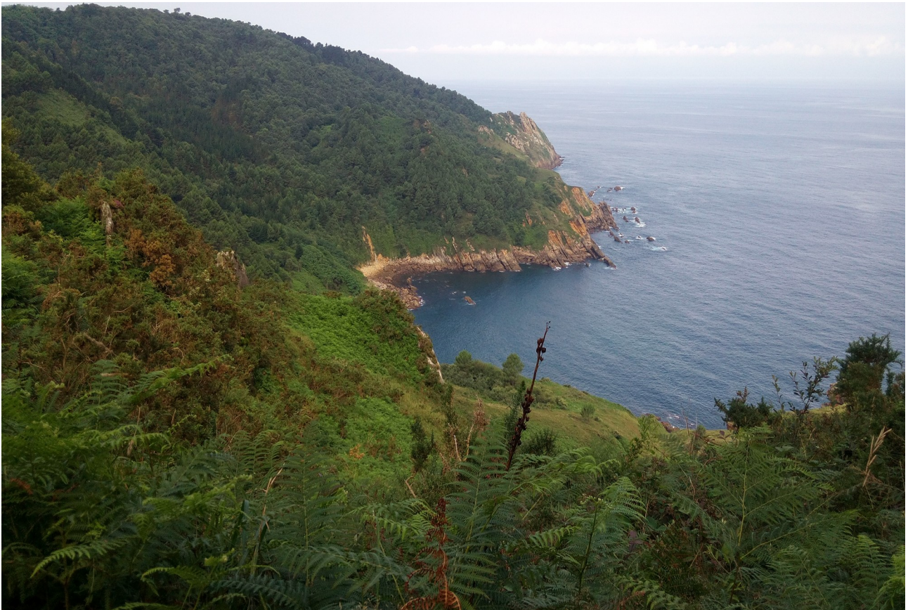
Leku bera, mendiolako ikuspegi batetik