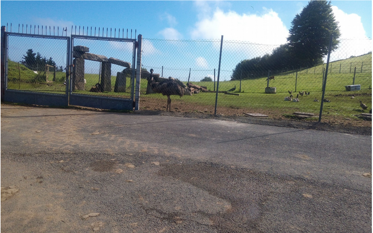
Mota guztietako hegaztiak, ostrukak barne, eta beste motako abereak