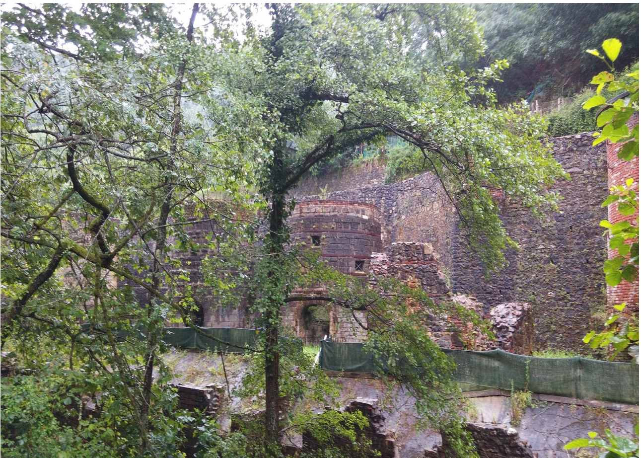
Hirugurutzetako labeen itxura, aurrez aurre ikusita