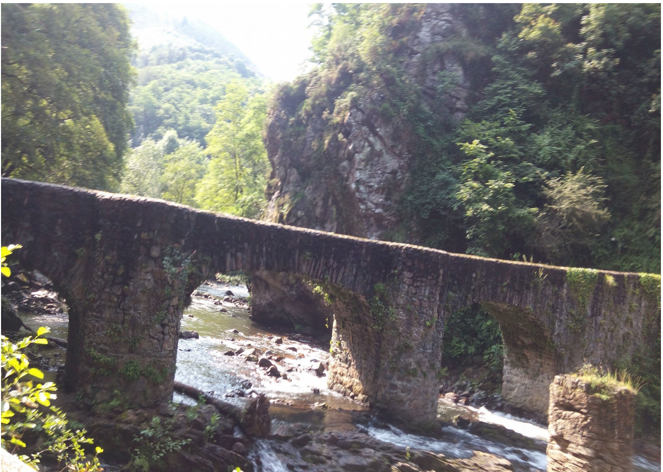
Sorginen Zubia, Andoaingo eremuetan