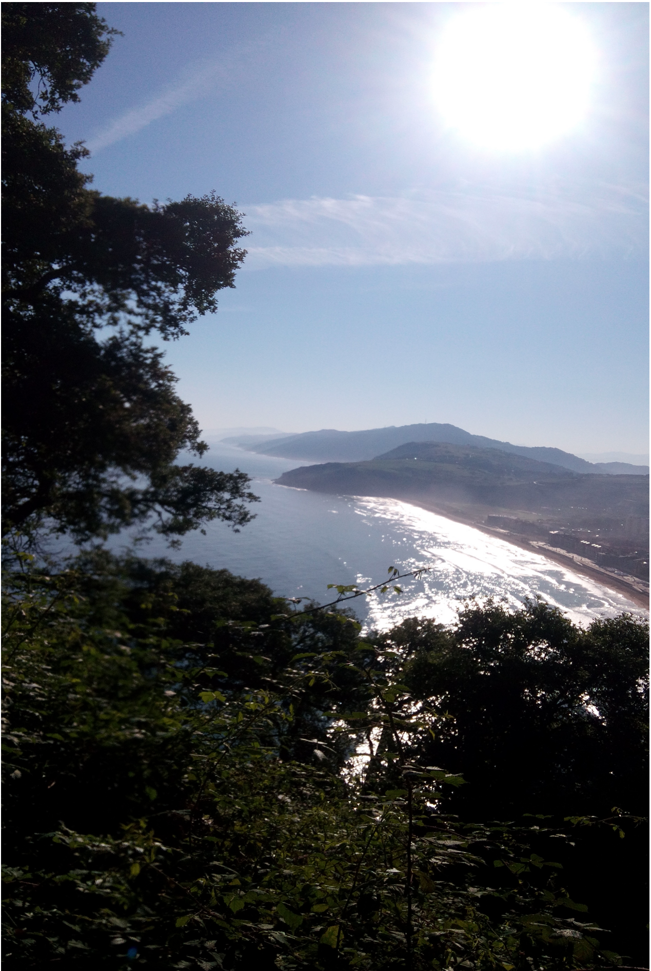
Zarauzko hondartza Santa Barbarako begiratokitik