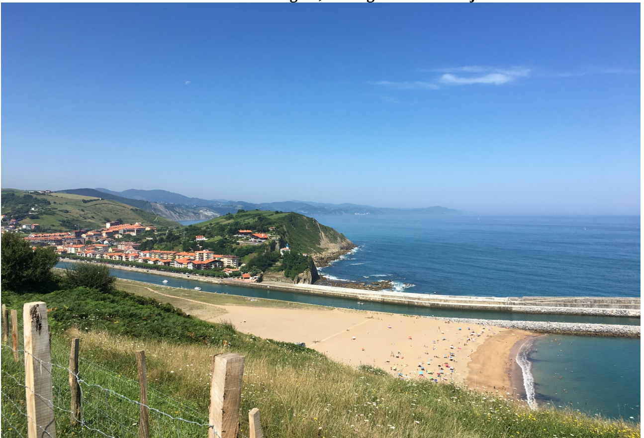
Zumaiako hondartza eta itsas hesia (malecón)