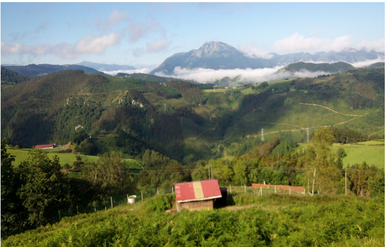
Mahasti eta berdegune artean zenbait baserri