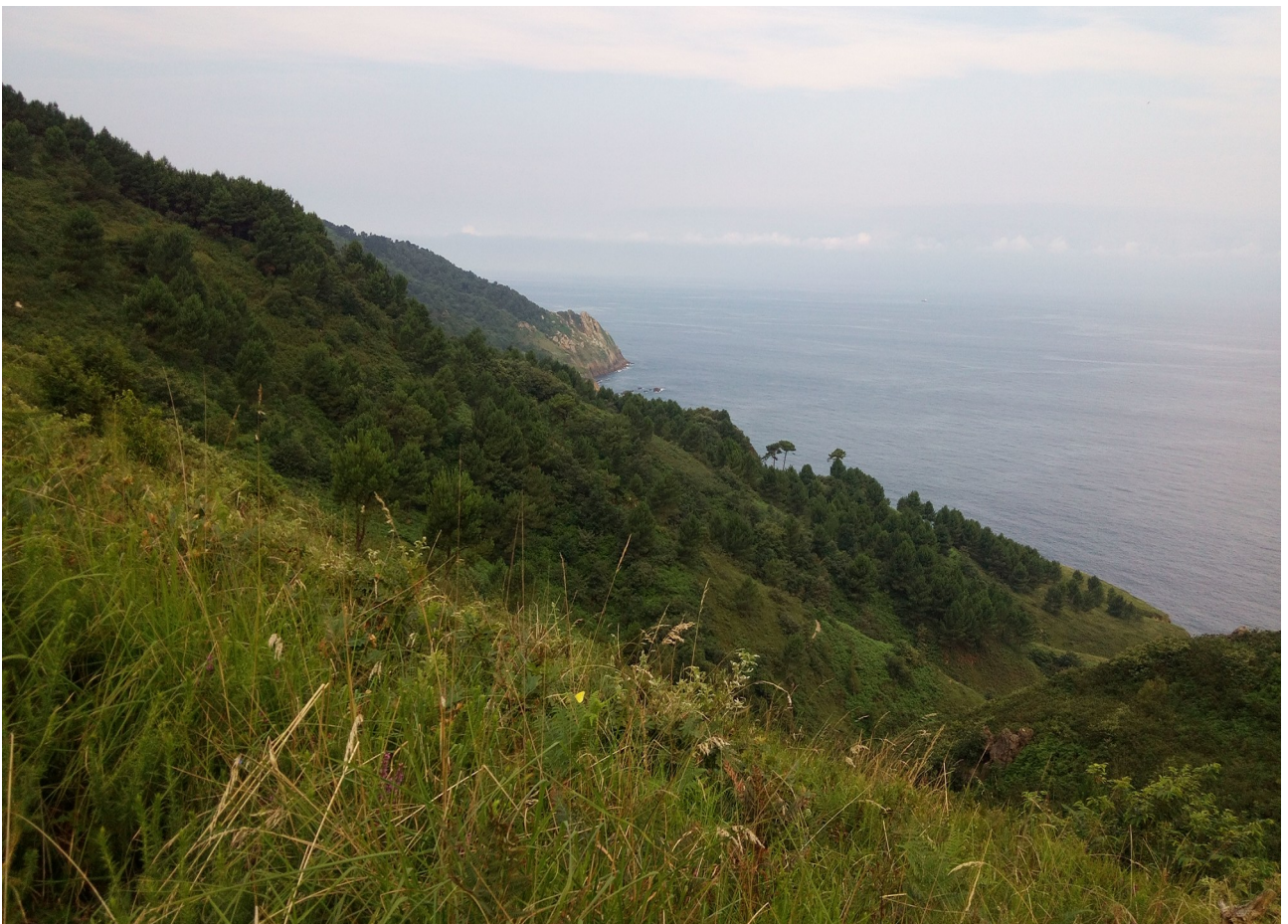
Mendiola aldeko erlaitza eta landaredia