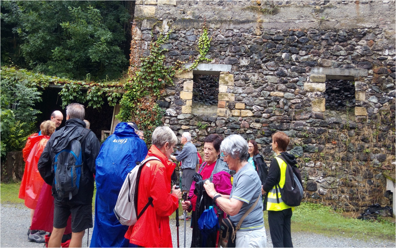
Eguraldiak atertu eta, jendea arropa eranstean