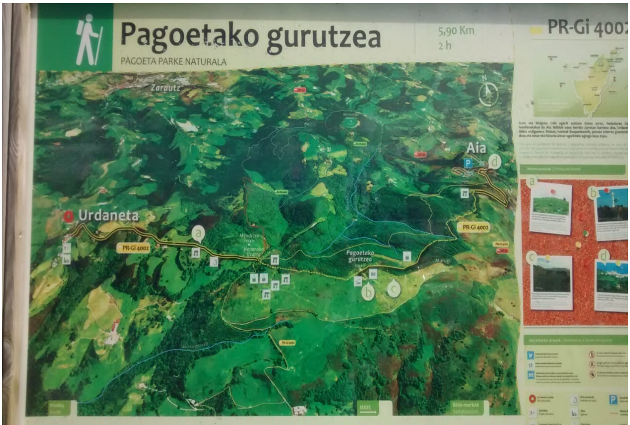
Zarautz Aia eskualdeko beste zenbait plano