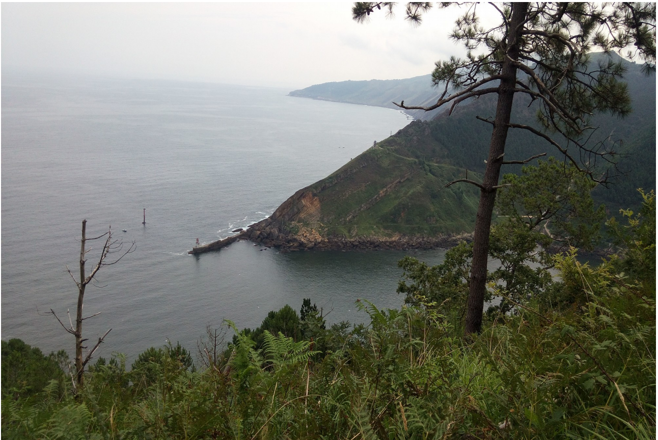
Pasaia badiaren sarrera, Arando Handia eta Azabaratza

Trintxerpe-Platako Itsasargia-Herri Ametsa-Mendiola-H.Ametsa-Ulia-Donostia (2018-07-27)