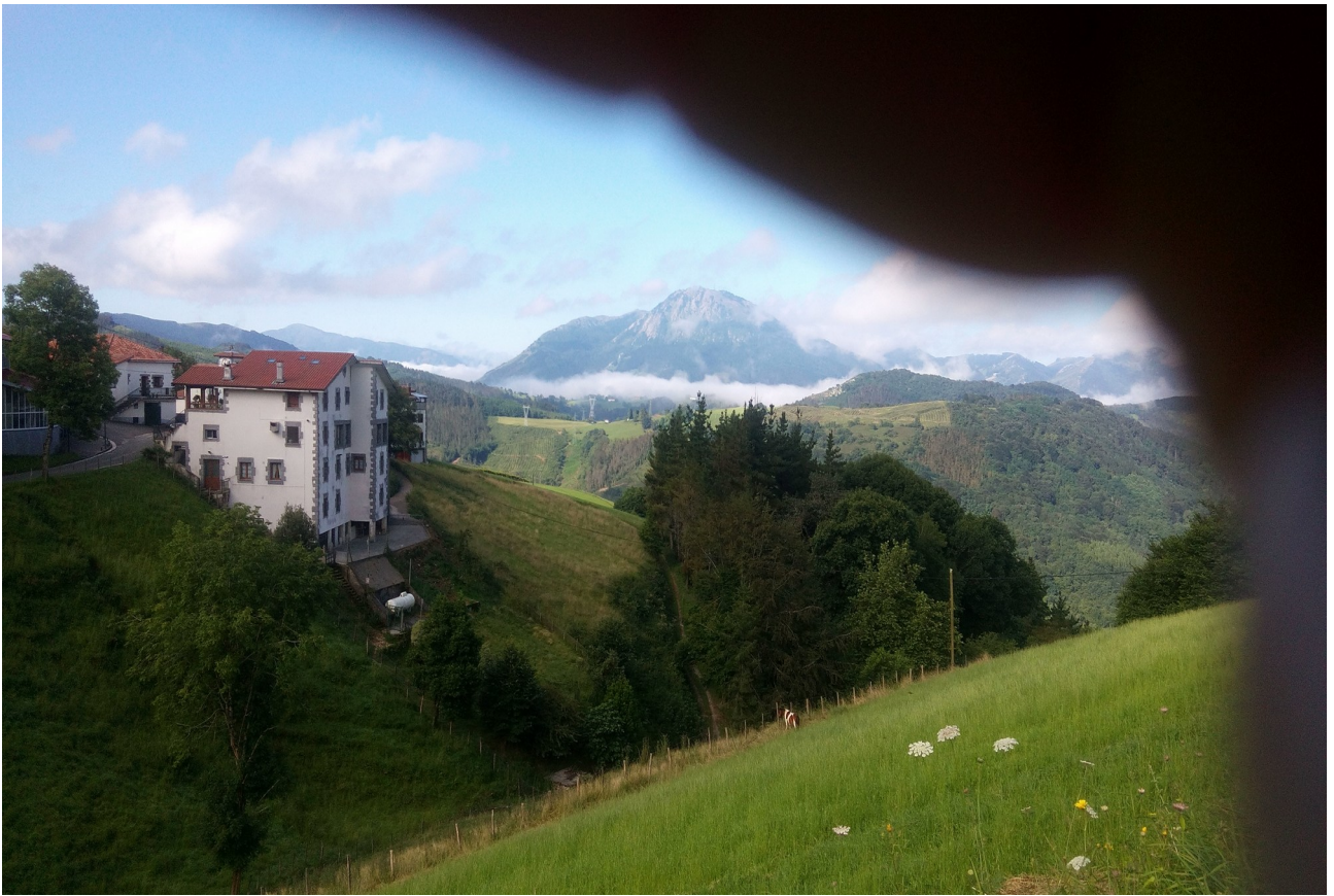
Urdaneta auzoa eta urrutira Erlo mendia