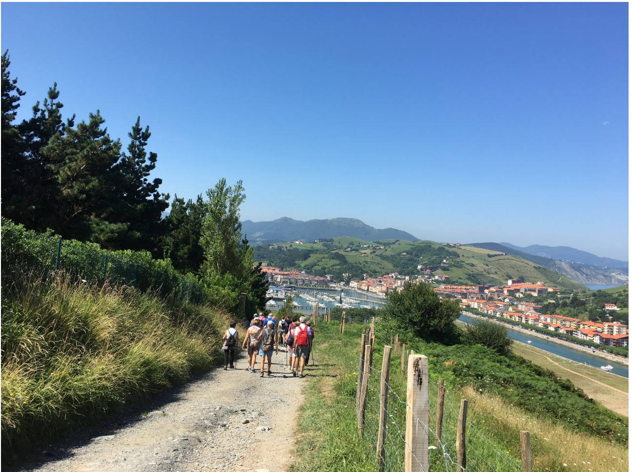
Zumaia aurrez aurre dugula, Zuloaga museorantz jaiaten