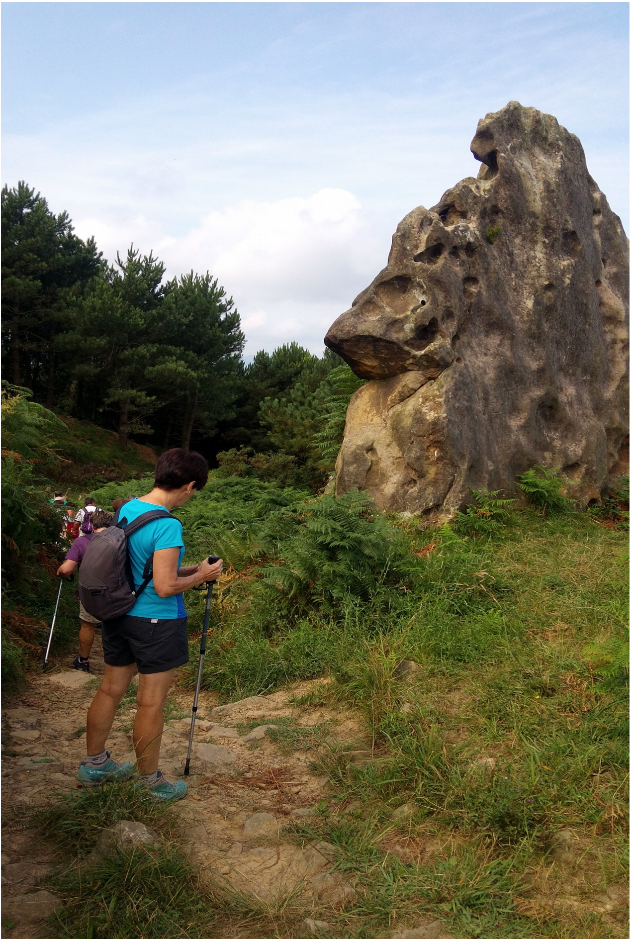
Ibilaldian zehar honelako harkaitz bitxiak ikus daitezke