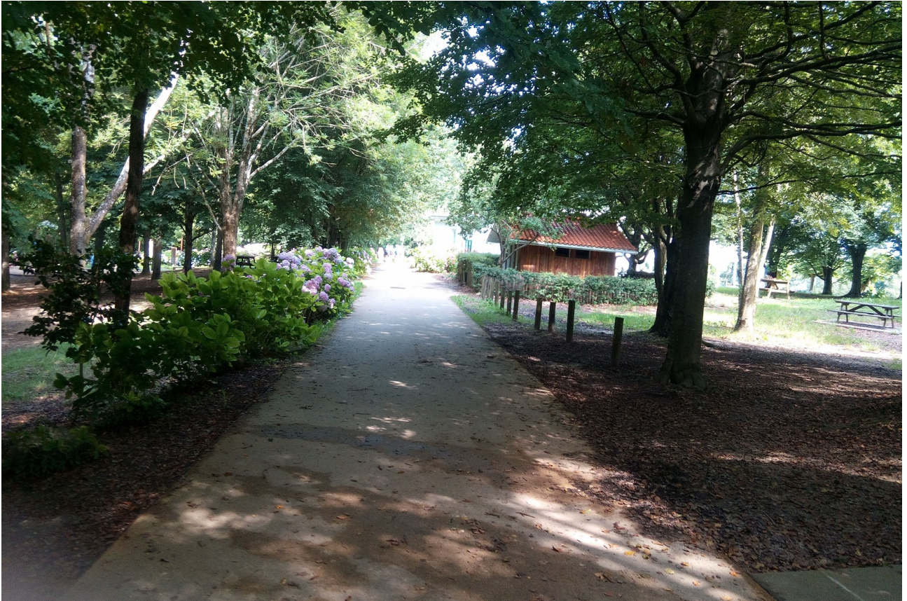
Ulia gaineko txabola, Basollua jatetxearen ondoan