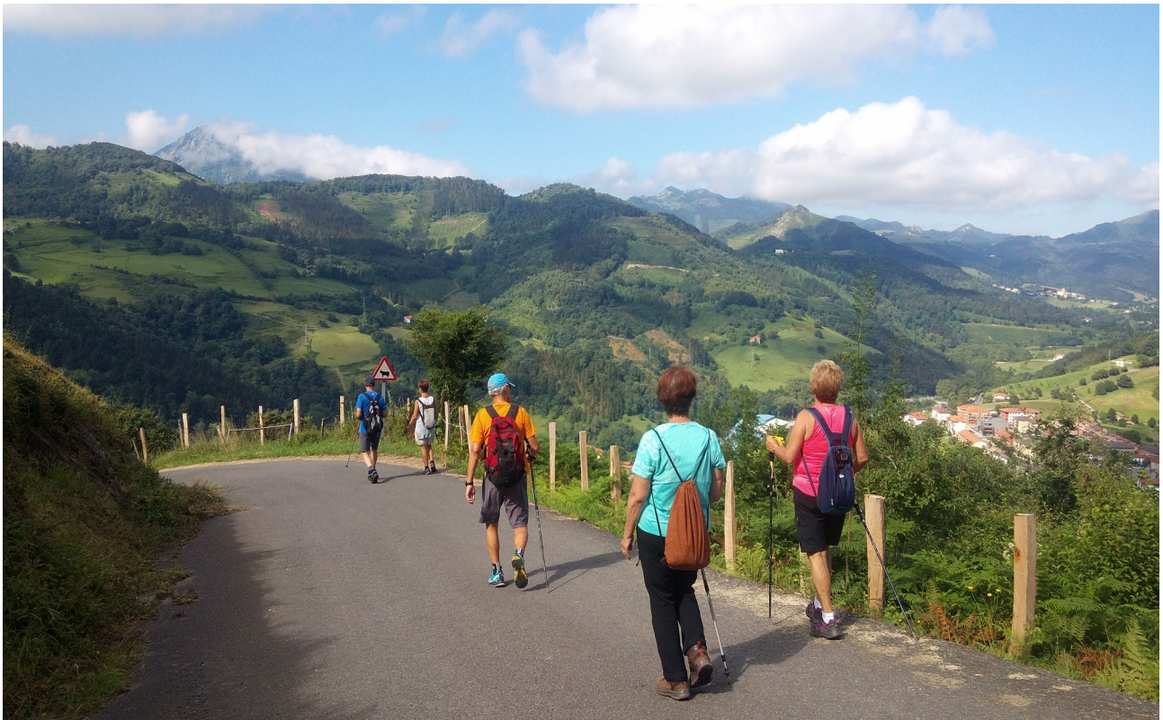
Aizarnazalerantz jaisten, paisaia ikusgarria