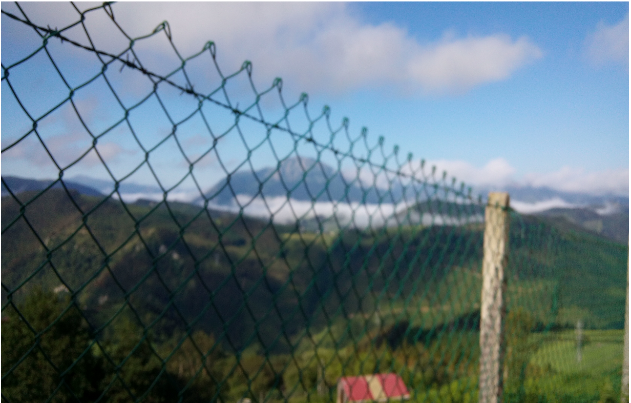
Paisaia lainotua hondo-hondoan, Erlo azpian