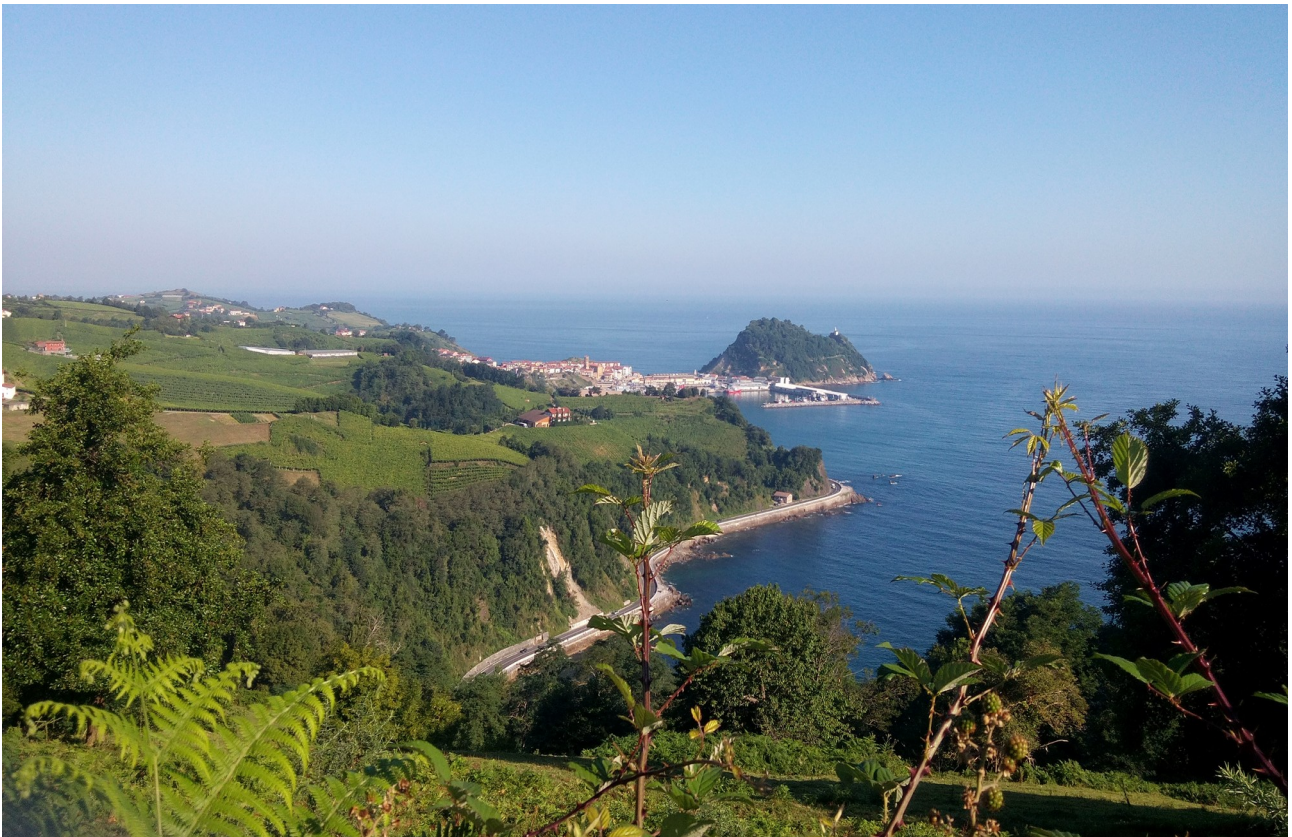
Mahastietatiko ikuspegia. Hondo-hondoan Getaria eta bere Sagua