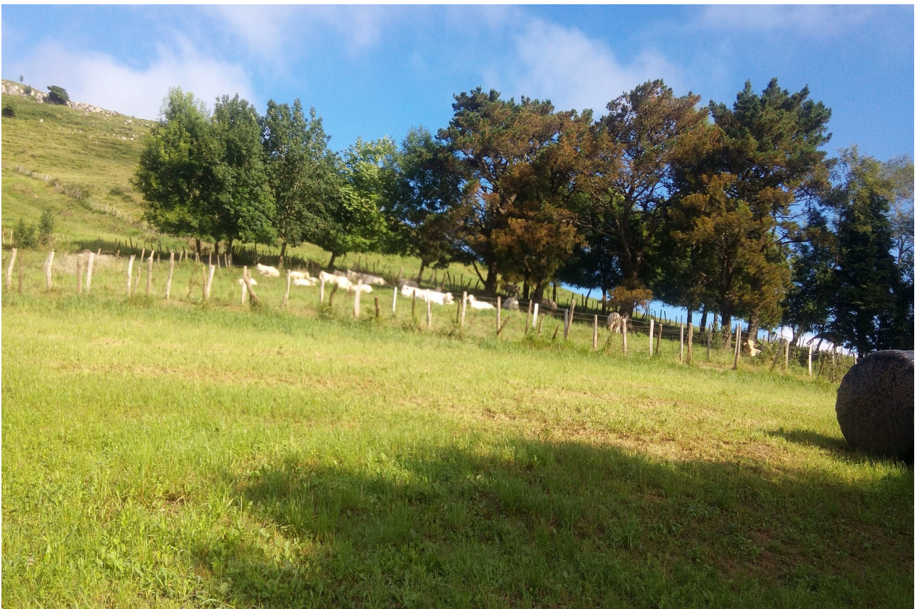
Urdanetan behialde zuria, Limousinak edo