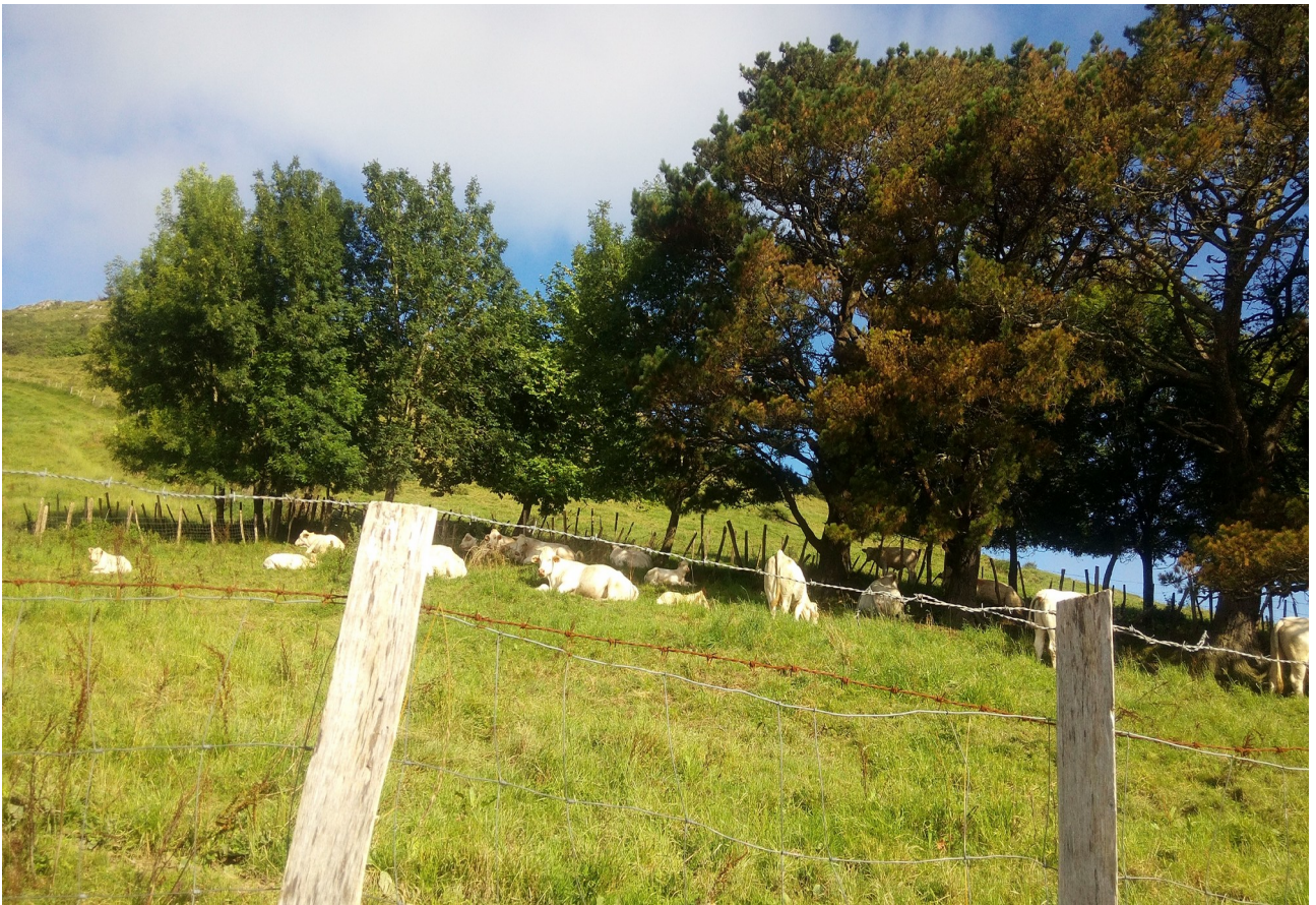
Urdanetan, behialdea abaroan