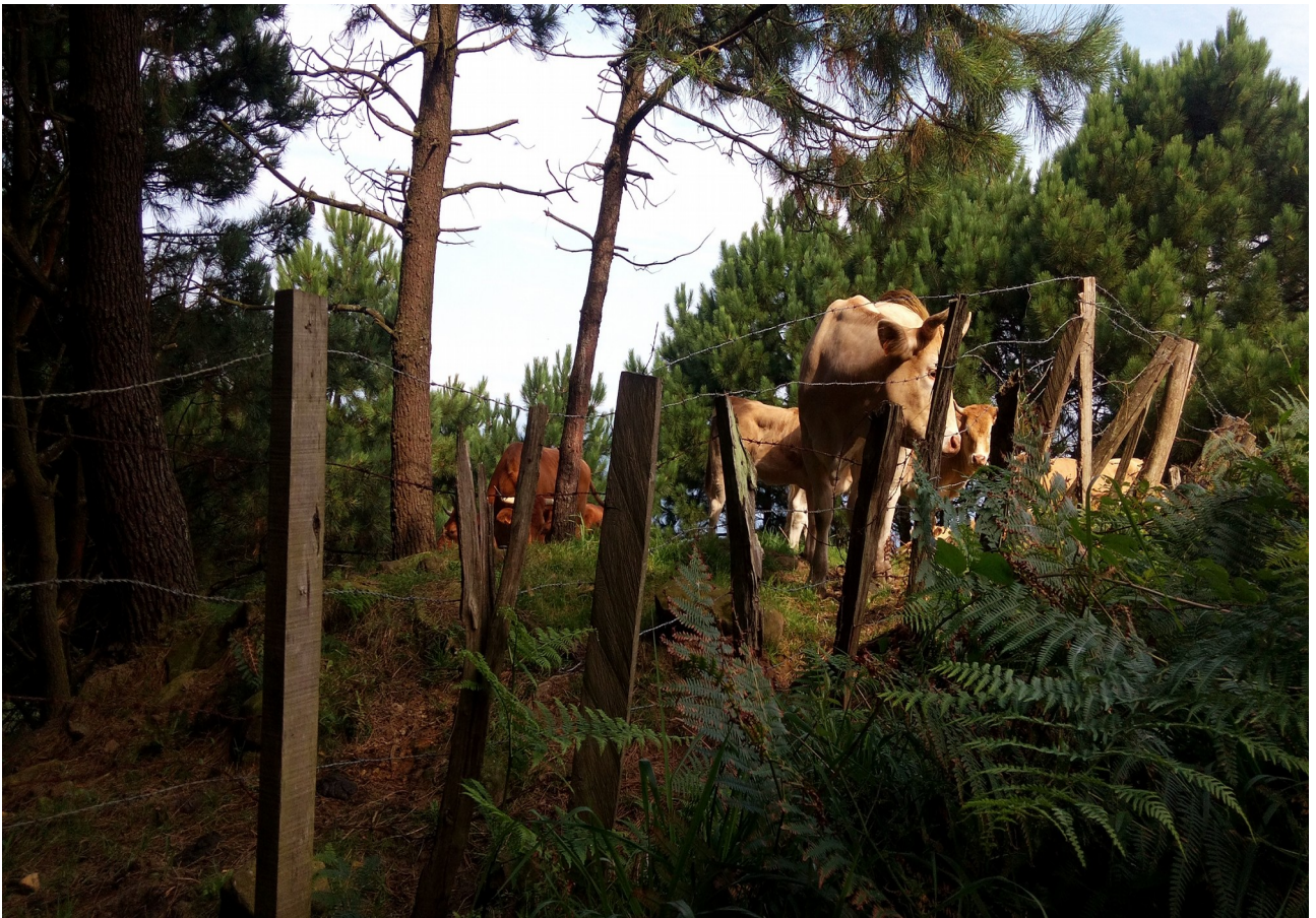
Mendiola baserriko behiak itzalpean edo elutsetan dendora pasa