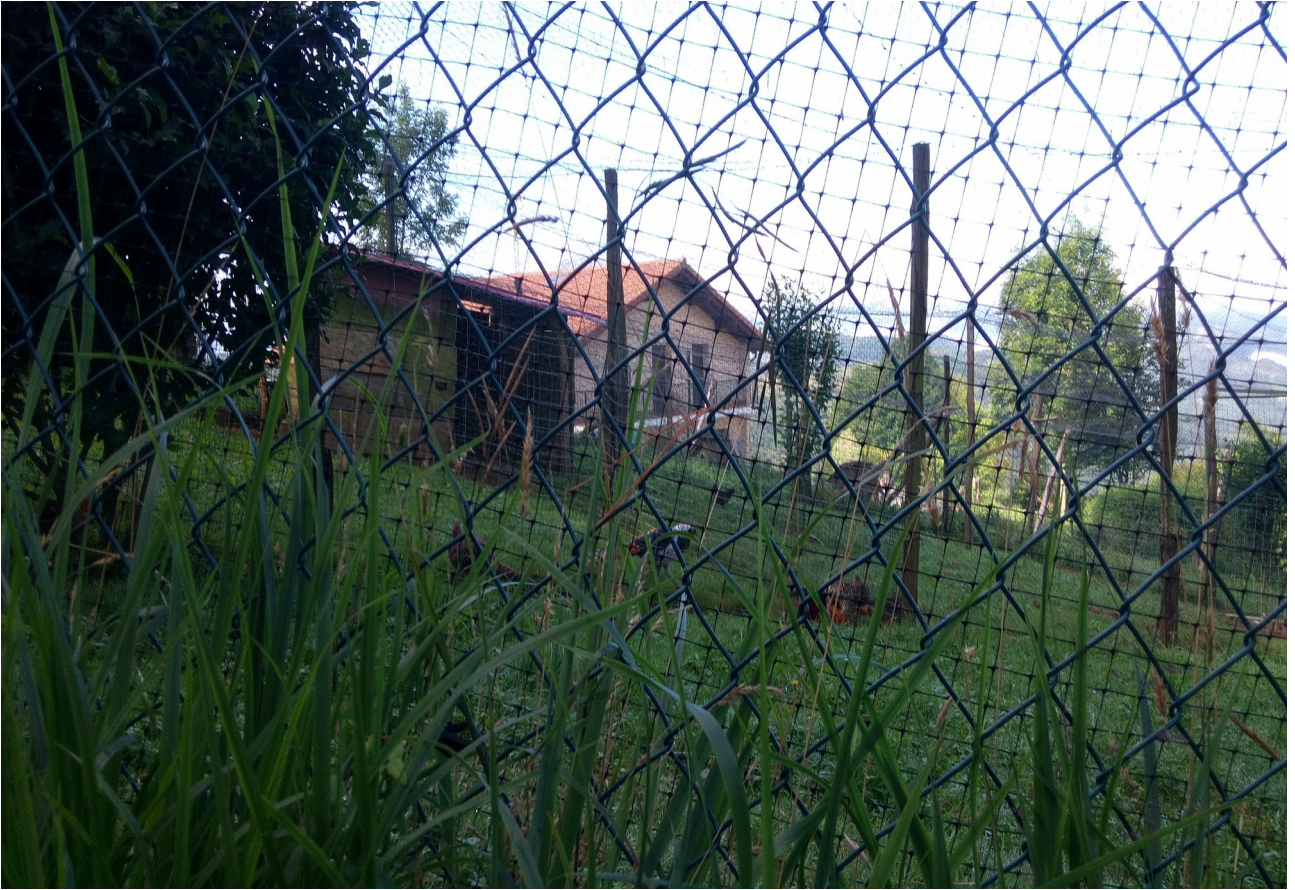
Urdanetan, oilategi berezia eta Foru Aldundiko etxea