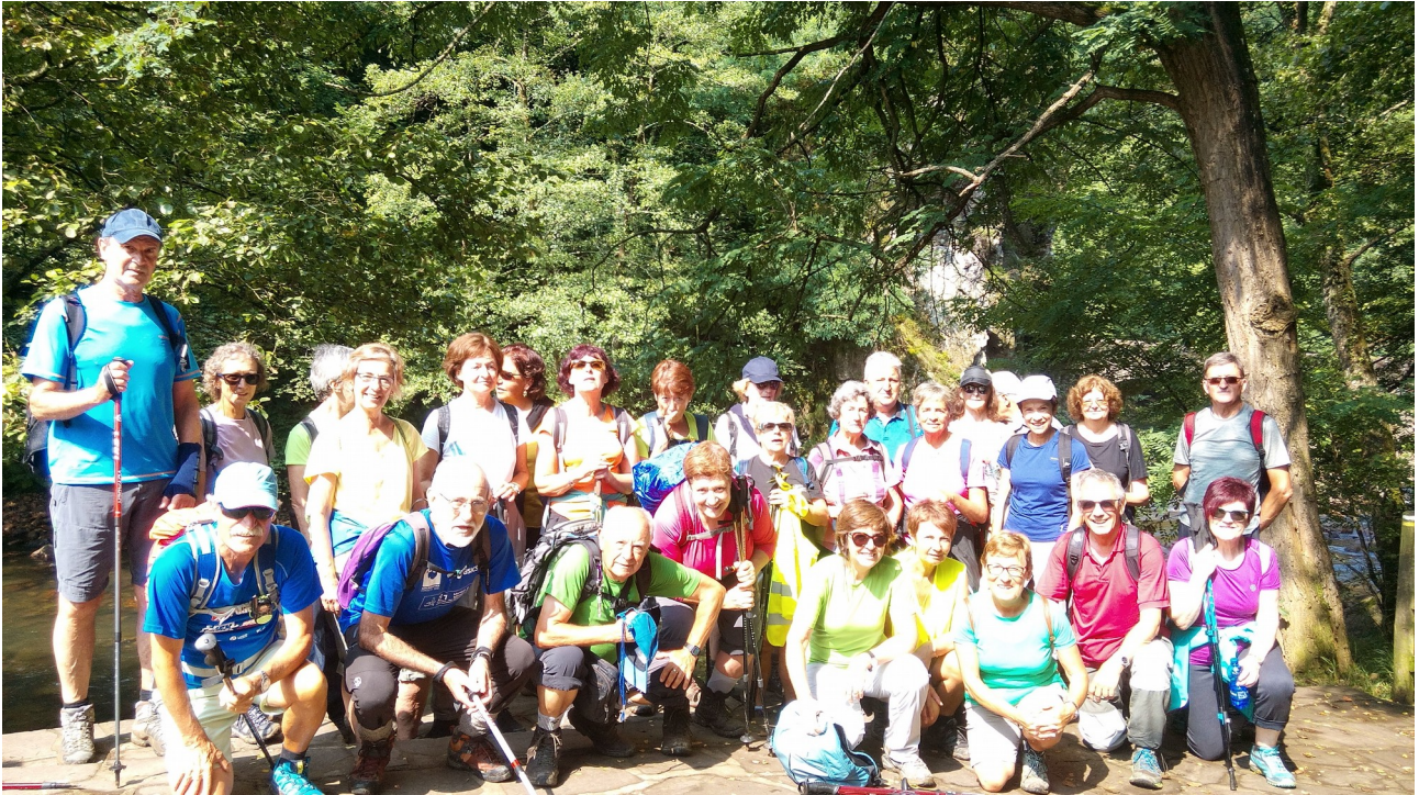
Sorginen Zubiaren ondoan talde osoa