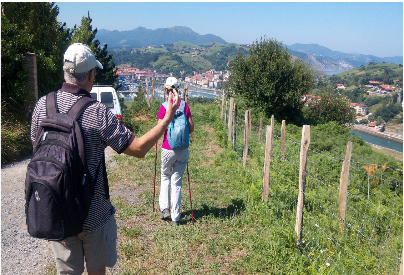
Ibilaldiaren bukaeran Zumaiarantz jaisten