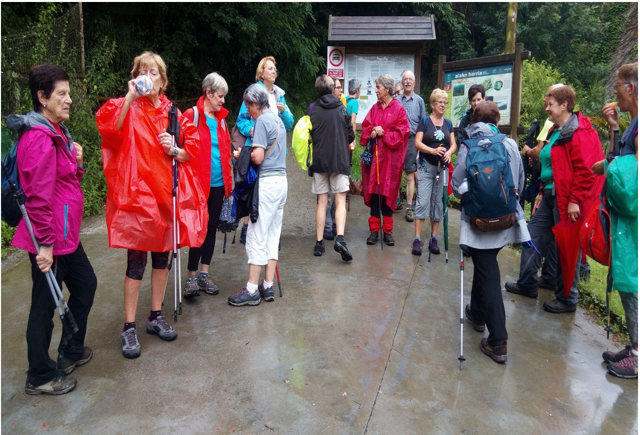
Hezetasunak eta euritako jantziek egarria sorrarazten dute