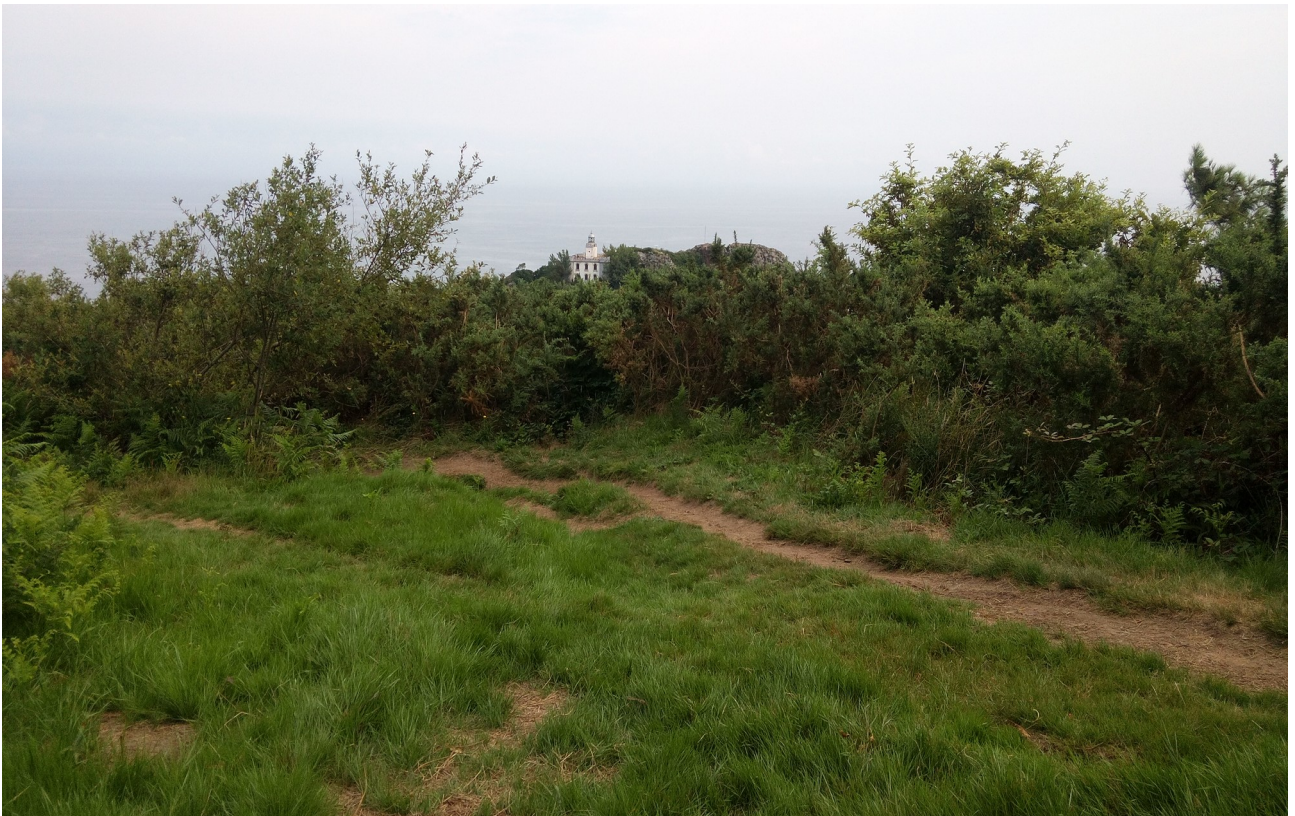
Erabilitako bidezidorra eta Platako Itsasargia hondo-hondoan