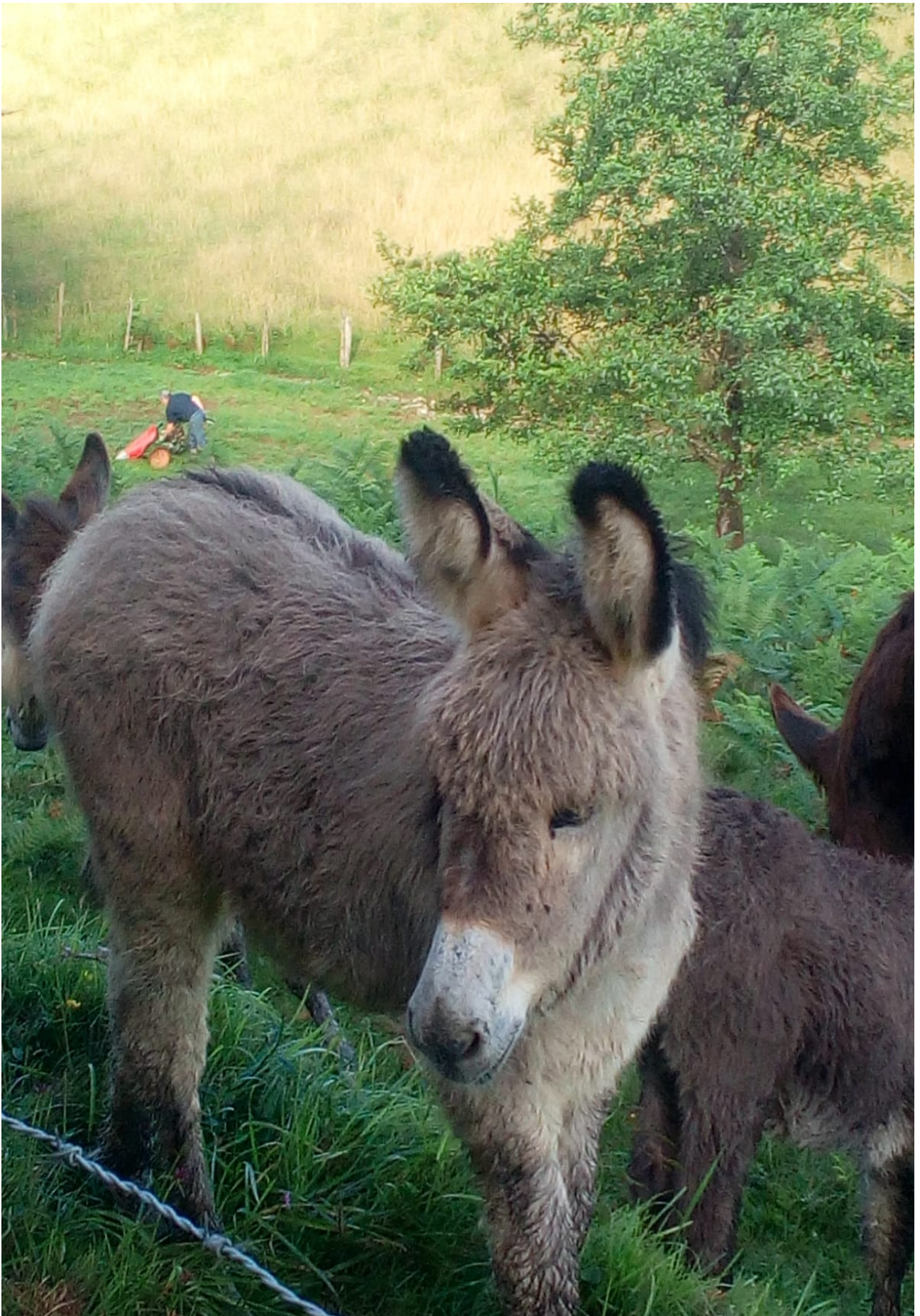
Mota guztietako astoak ikusten ziren ibilaldian