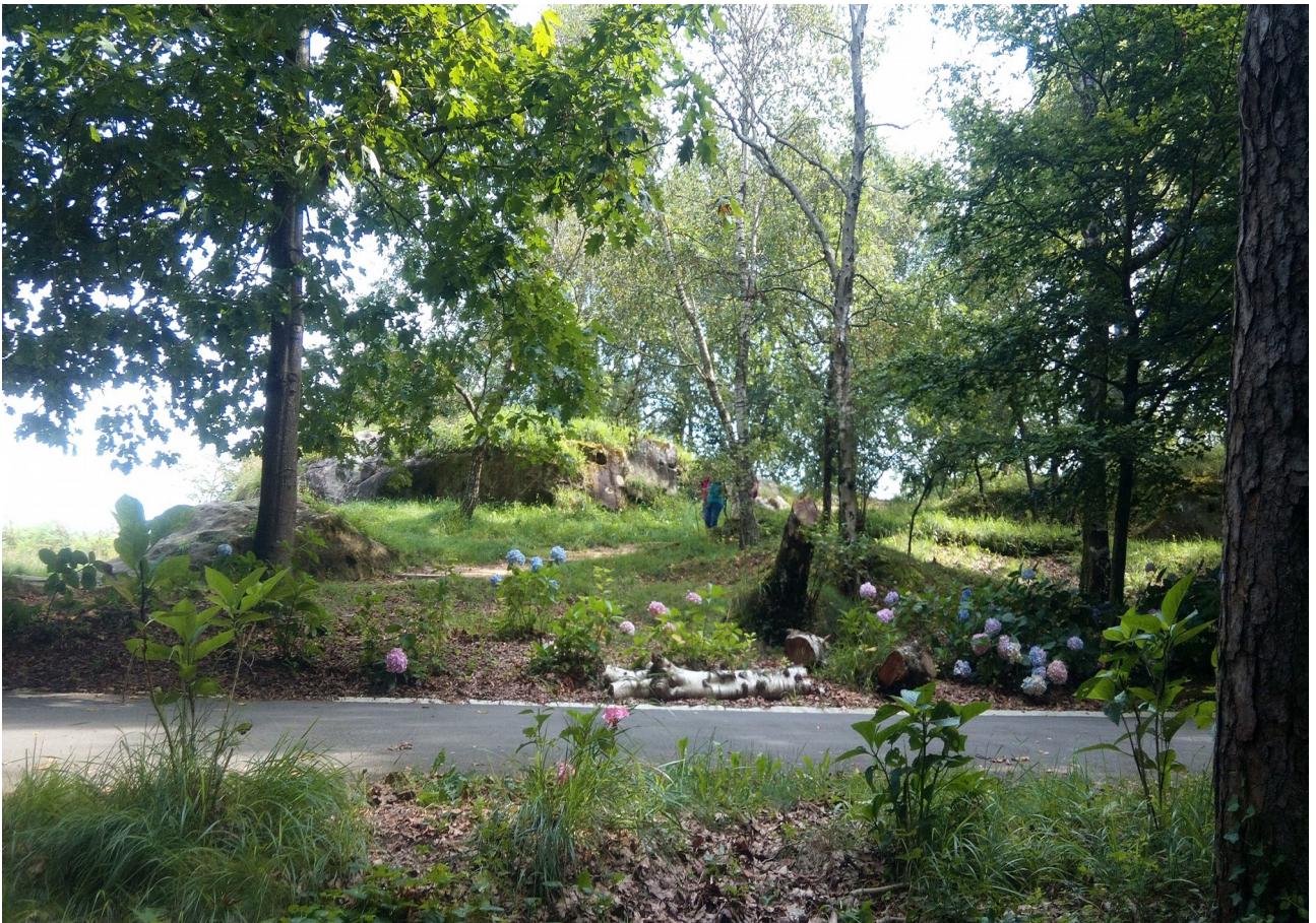
...eta baita lorez ere