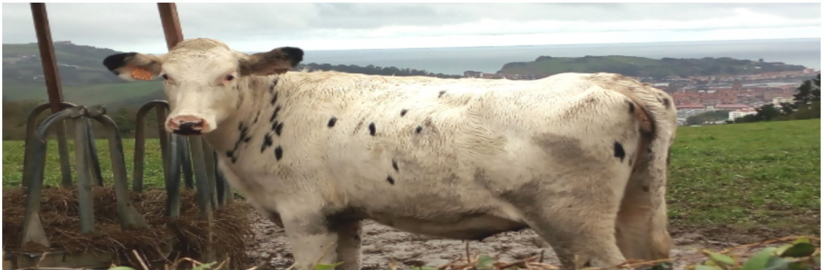
Bidean zeharreko landaredia eta behi begiluzea