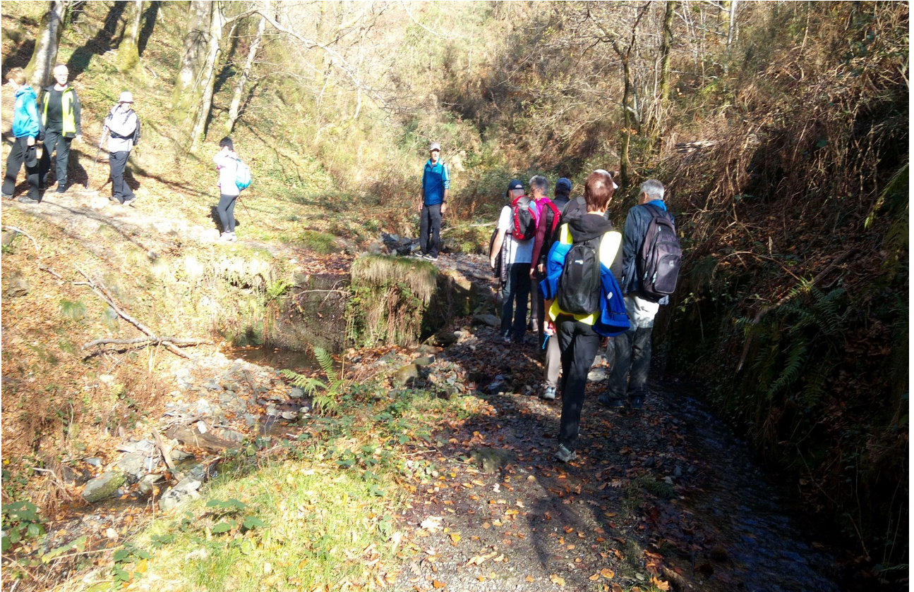
Beste harribi txikia zeharkatzen