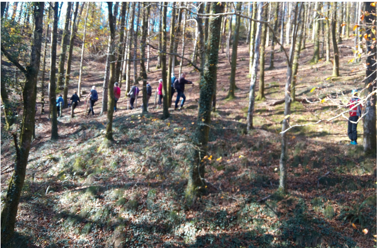
Pistatik kanpo jendea gusturago izadiaren barne-barnean