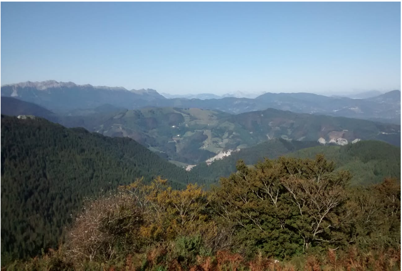
Izadi edo natura bere edertasun oparoan