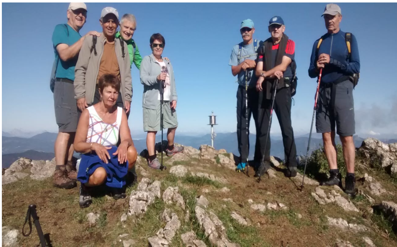
Batzordekideak eta aitzindari goierritarra mendatean