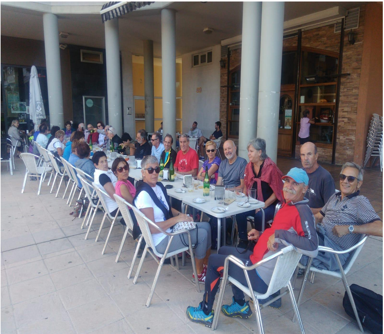
Taldea Aieteko Munto tabernan, hamaiketakoaz gozatzen