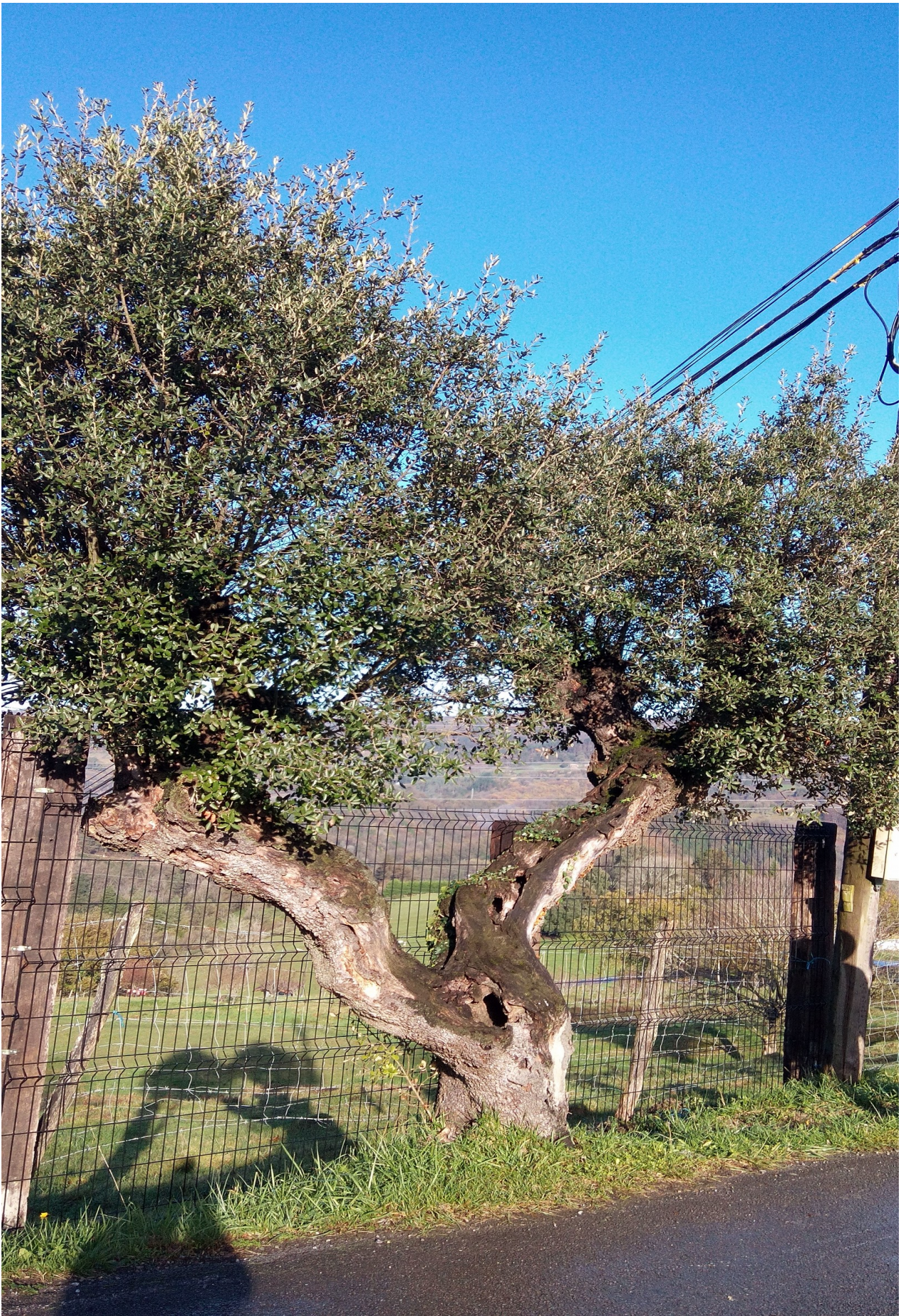
Usurbilgo San Esteban auzoko arte zahar ederra