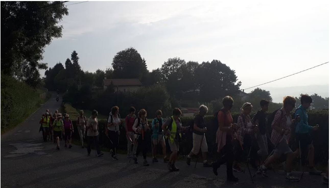
Tropela txakurtegiko bidegurutzerantz abiatuz