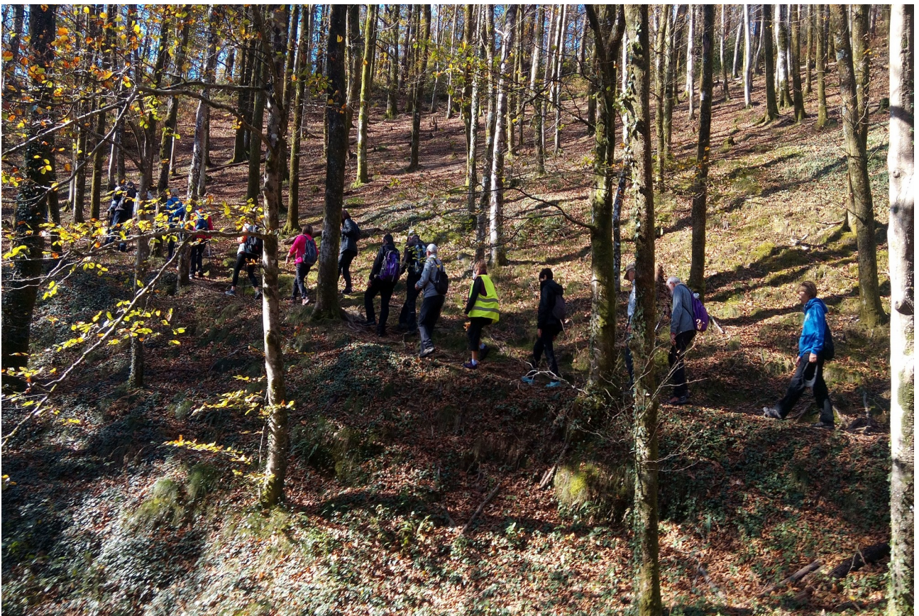
Orbela zapaltzen udazkenean, Arditurri meategiaren gainean