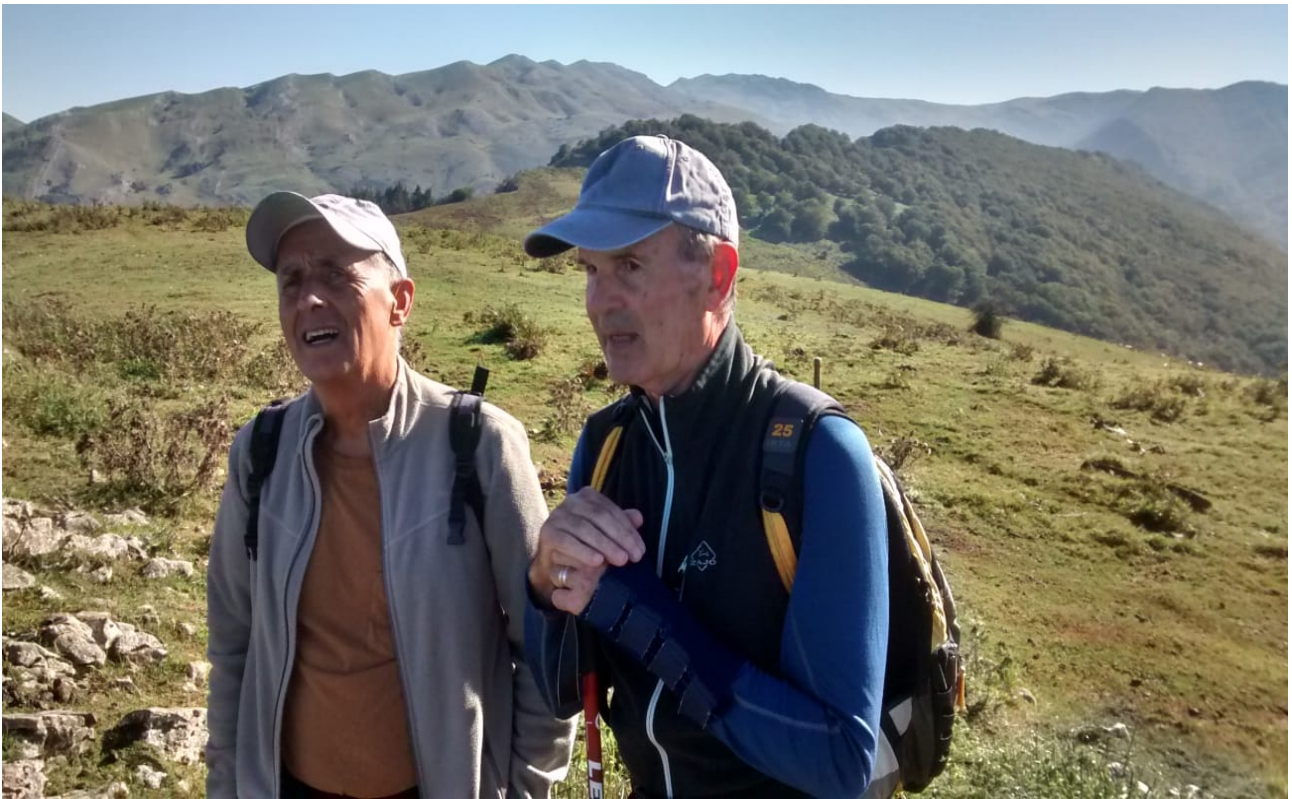
Bi hauek mendatean ahoa irekirik, hamaiketakoaren zain edo