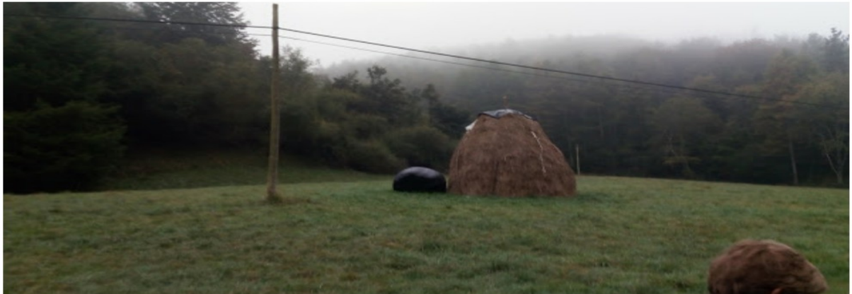
Santutxotik Santa Marinako bideko paisaia