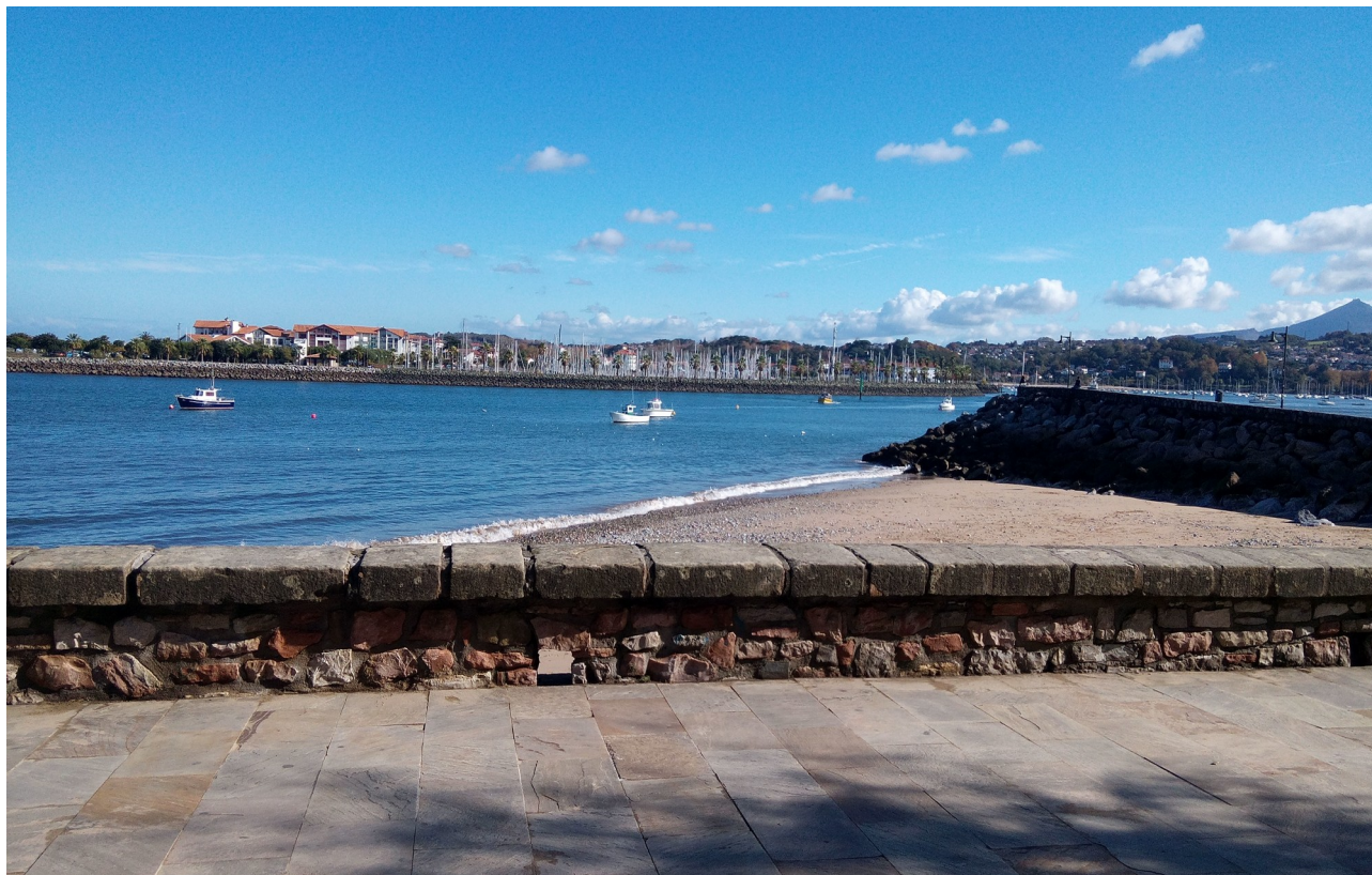
Hondarribiko Butroa pasealekua