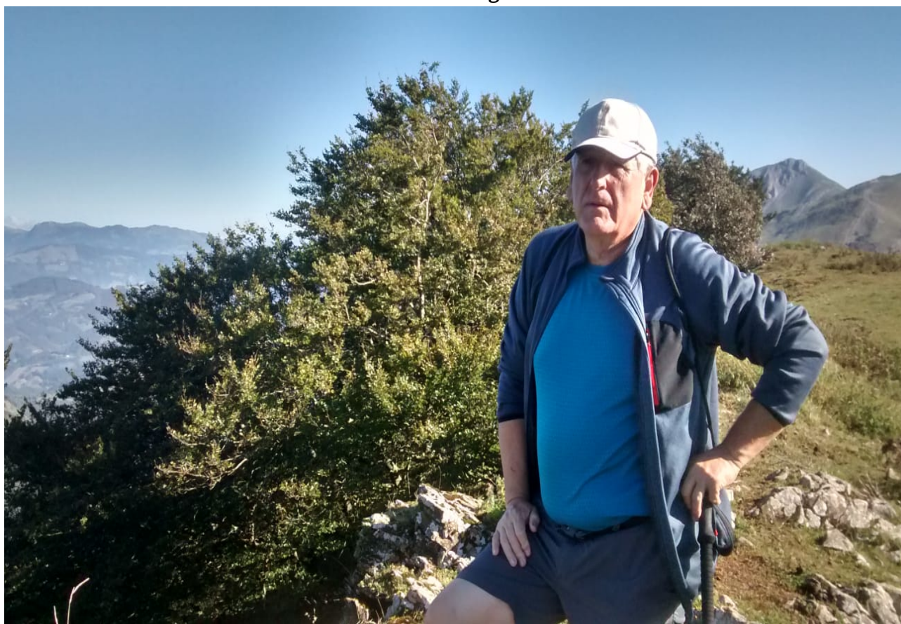
Ea nork esaten duen hau ez dela guztion buruzagia!