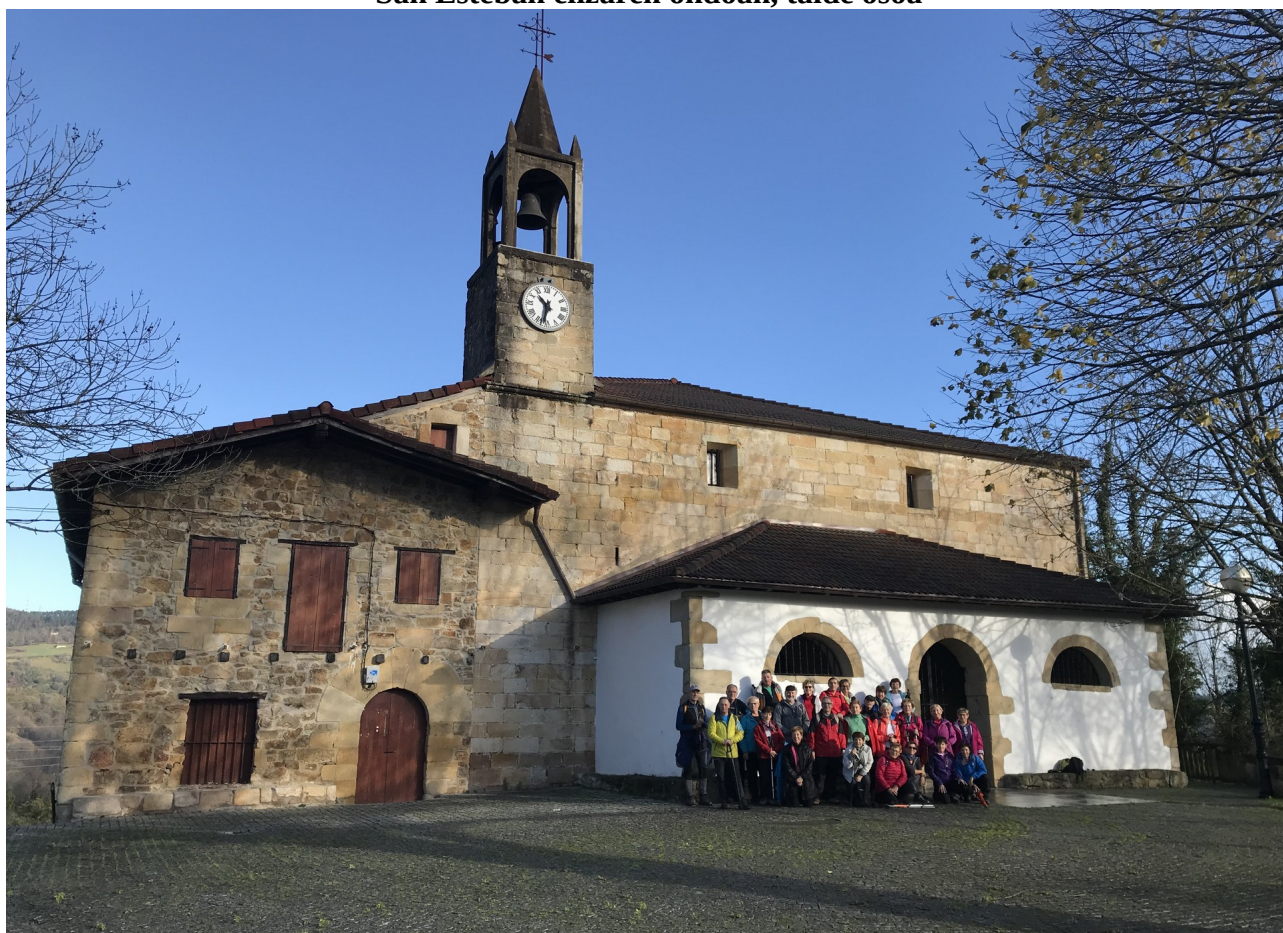
San Estebaren elizaren aurrean, talde bera