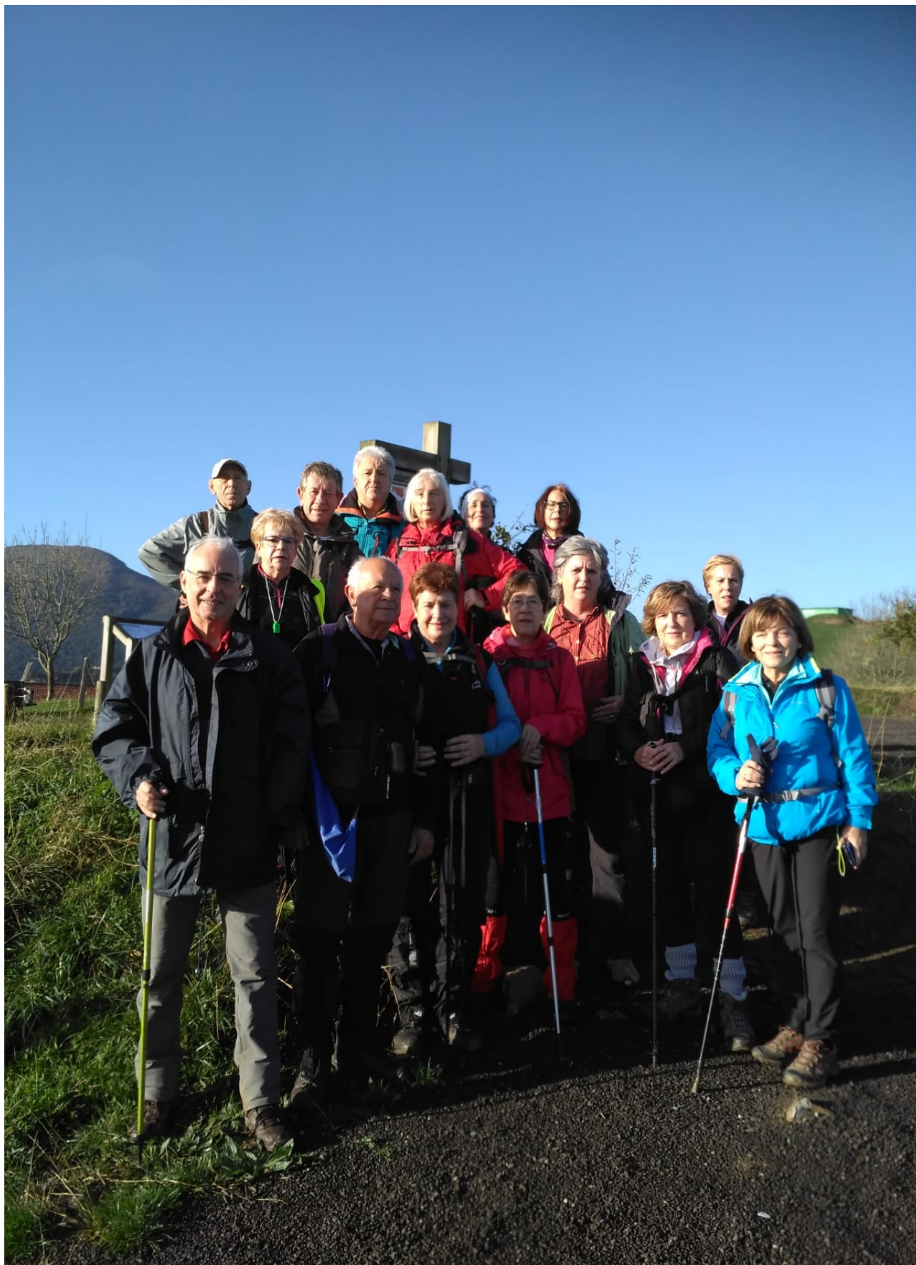
Atsedenaldian egindako argazkia