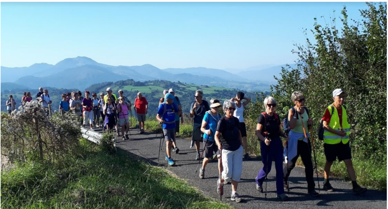
Txoritokietatik San Markoranzko bidea hartuko dute ibiltariek