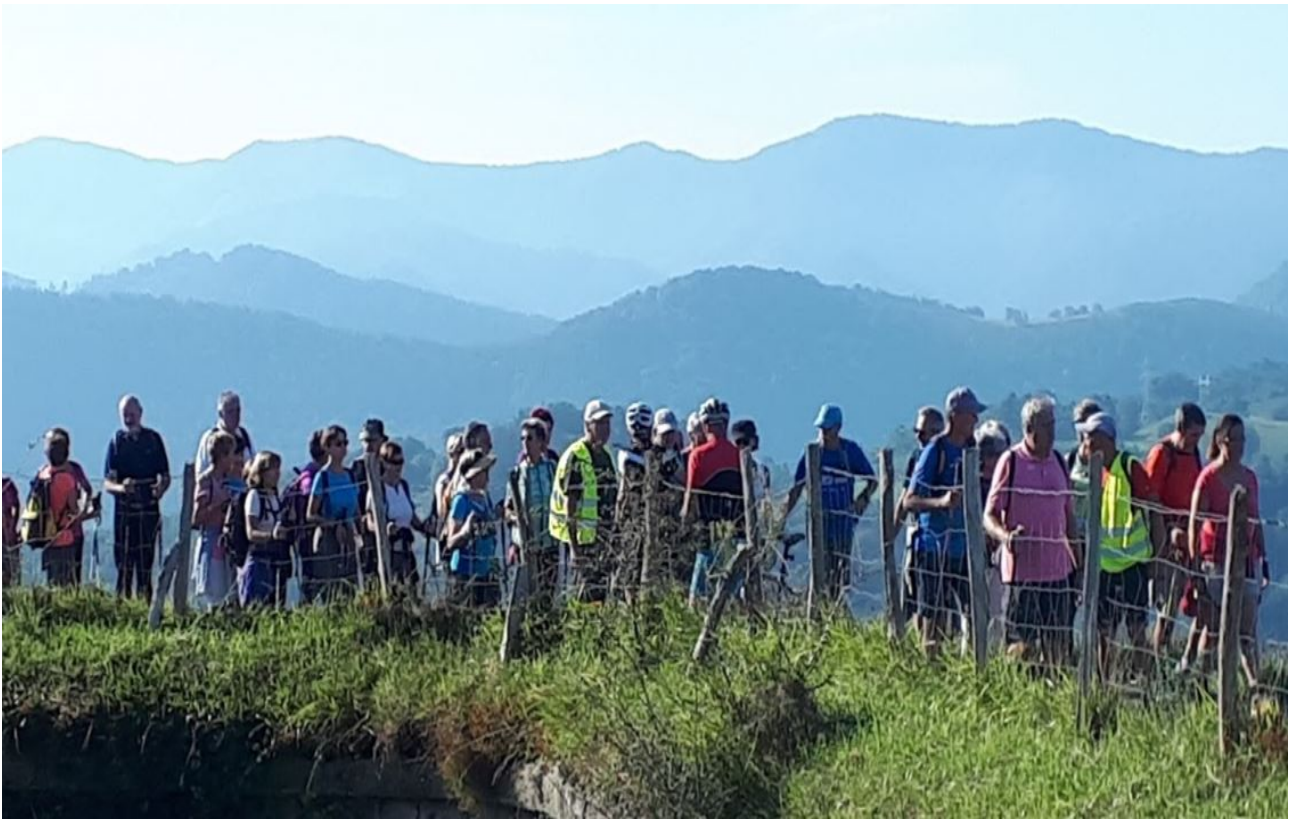
Txoritokietako gotorlekuan, atsedenaldi laburra egin eta abiatzeko prest