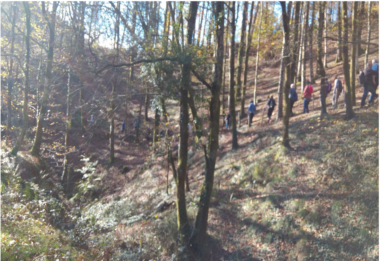
Arditurri gaineko basoan zehar