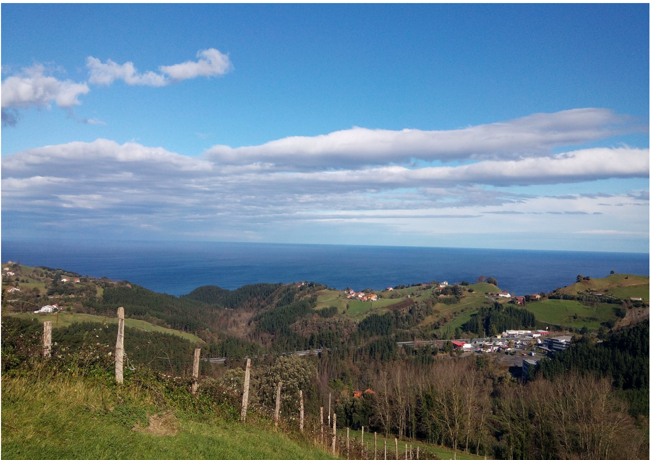
Itziartik Debarako bidean, itsaso bazterrak suma daitezke