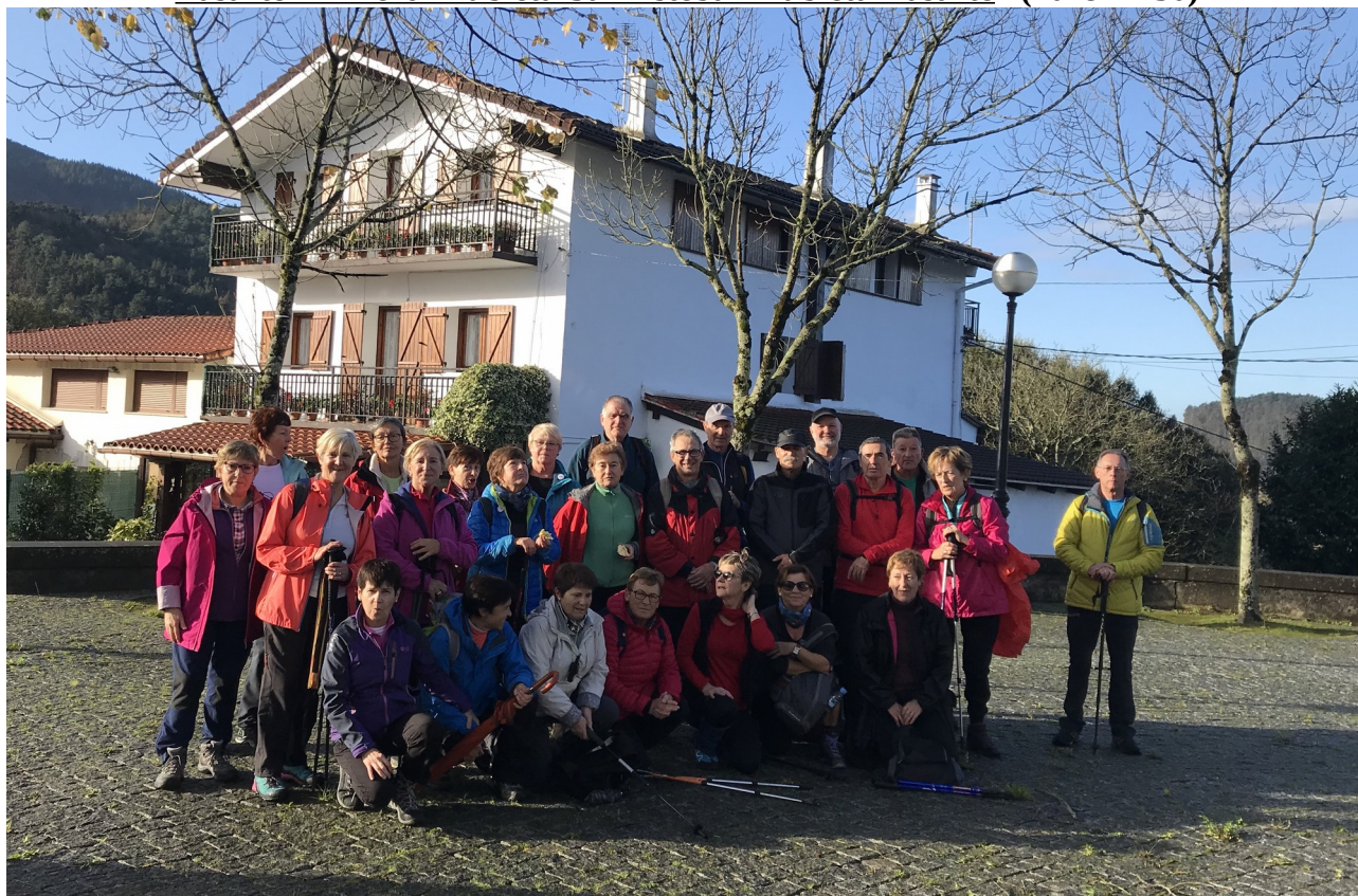
San Esteban elizaren ondoan, talde osoa