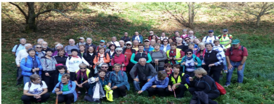
Talde osoa Arditurriko bidean