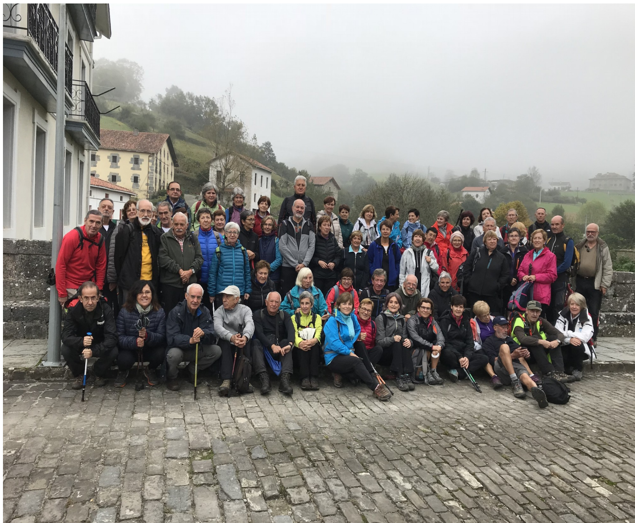
Bidania herriko plazan, talde osoa

Santa Marina leku ederra Albizturko inguruan, pena gaurkoan izan baitugu behe-laino inguruan. Txindoki ere hor aurrez aurre estaliz gure pausuan, bere irudi punta zorrotza gorderik dugu buruan.