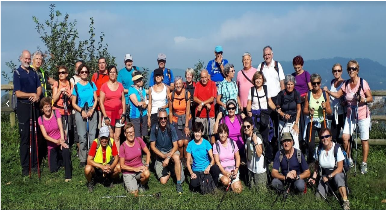
Taldea San Markoko begiratokian, Donostia eta Pasaia bizkarrean dutela