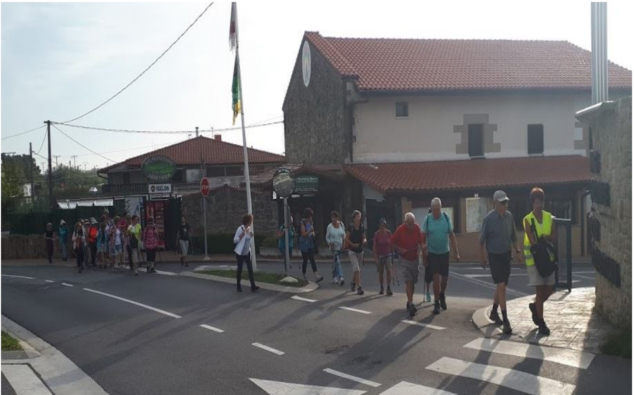
Igeldoko kanpinan, ibilaldiaren hasieran