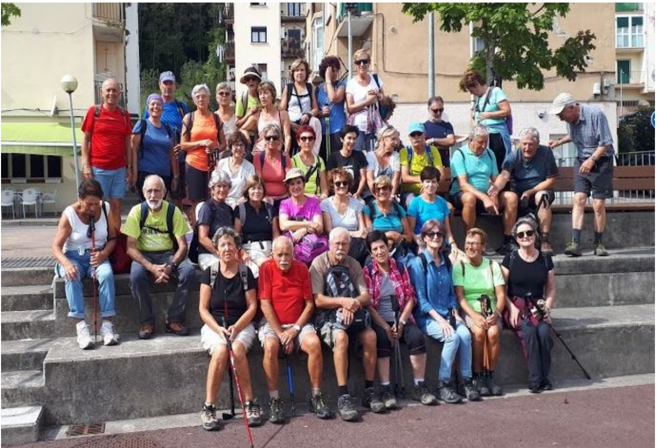
Usurbilen, hamaiketakoa hartu ondoren