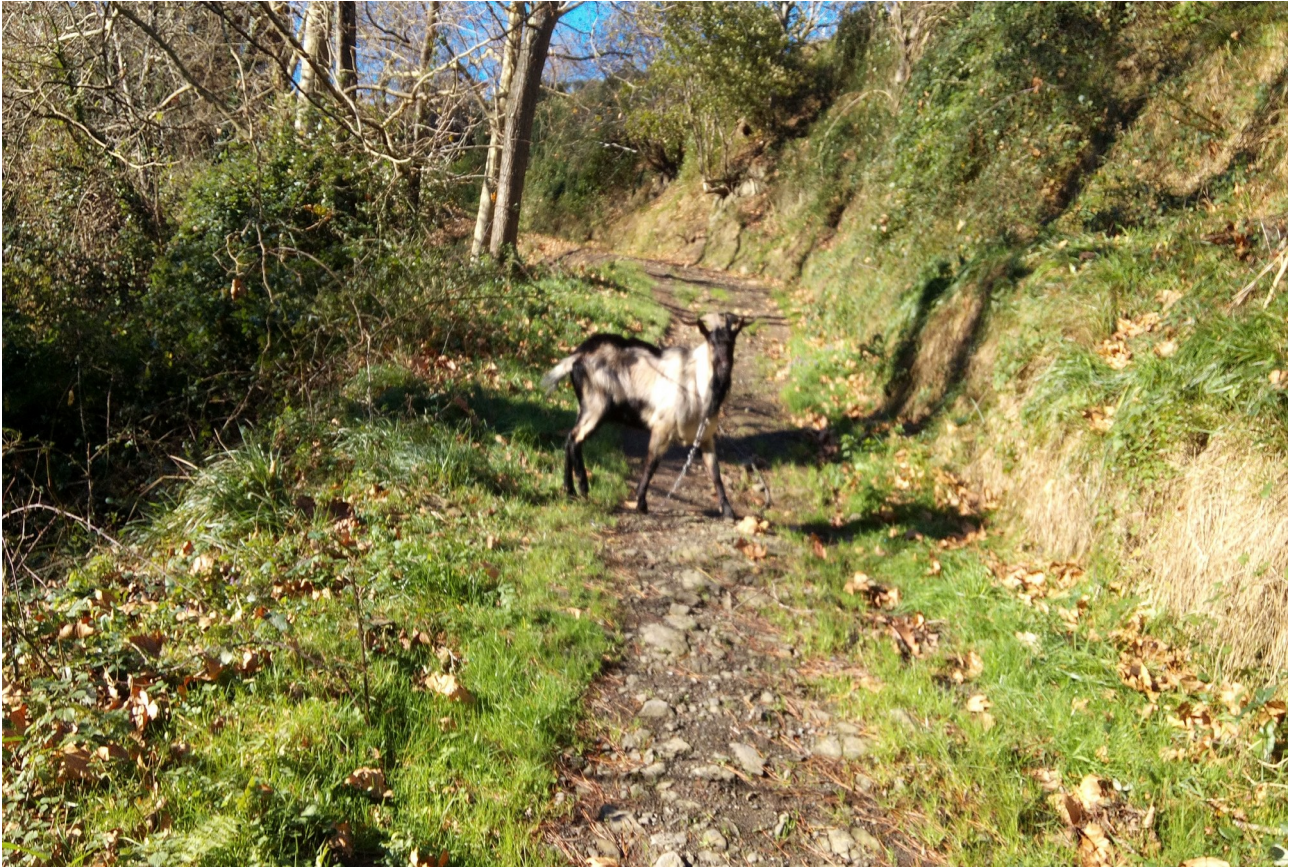
Akerrak erasokor eta oldarkor dirudi, baina ez zen horrelakoa, baketsua baizik