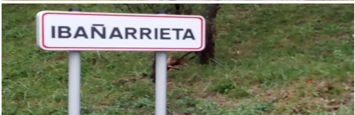
Urtainek ospetsua egin zuen bere jaiotze-auzoa