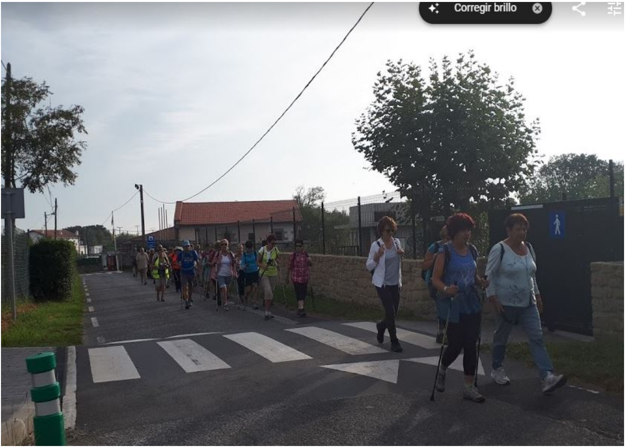
Igeldoko kanpinaren inguruan