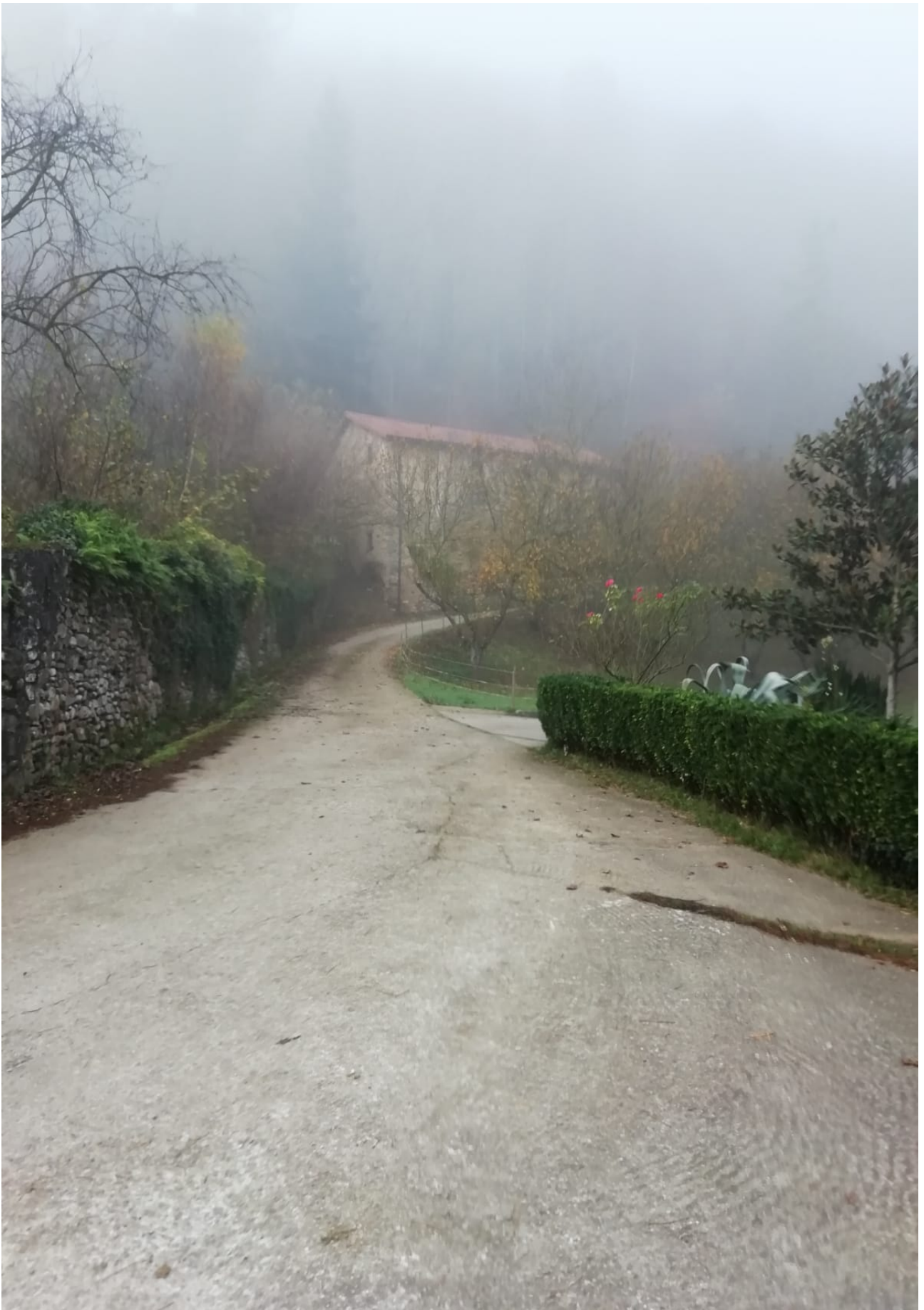
Lainoa eta bidearen edertasuna