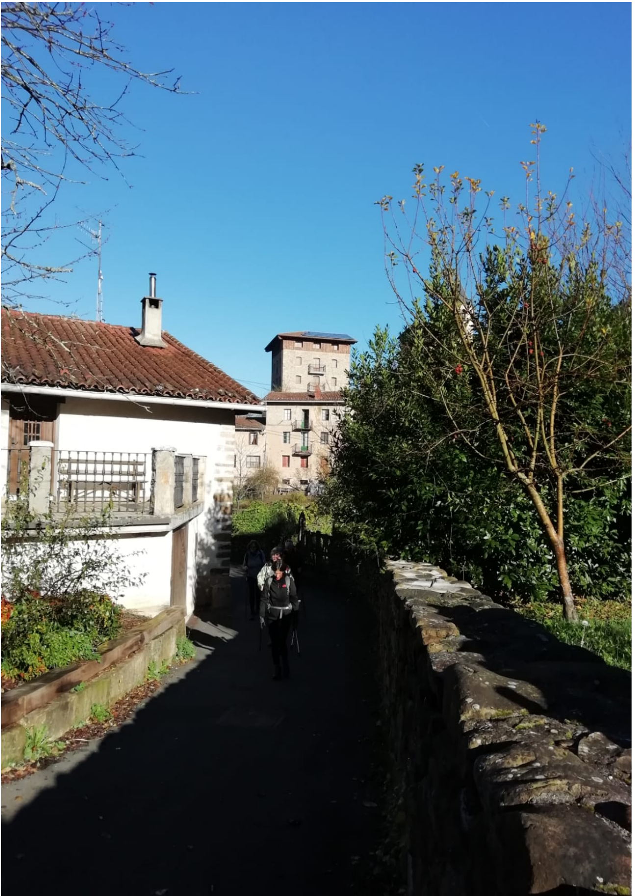
San Gregorioko Barandiaranen museoaren inguruan