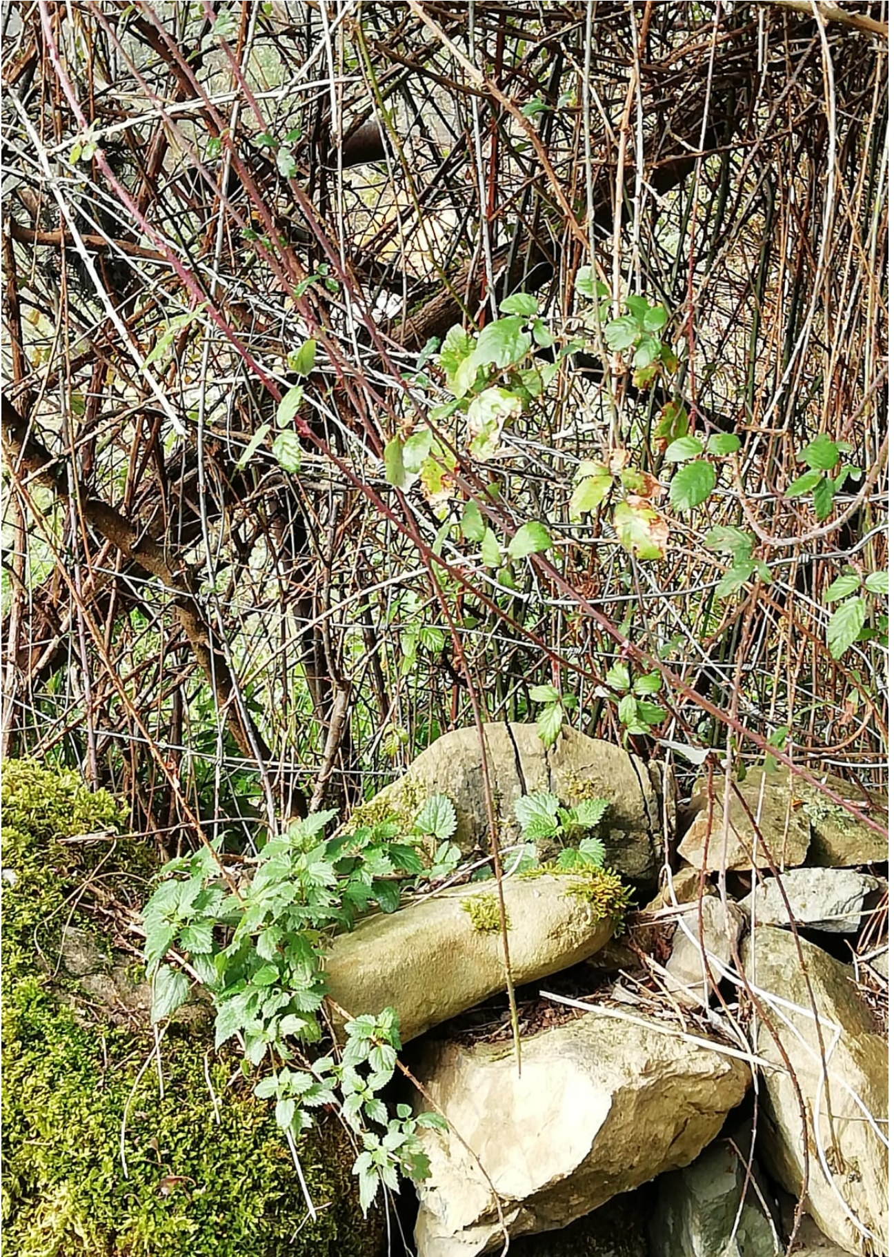
Adar eta harkaitzen arteko nahasketa ederra