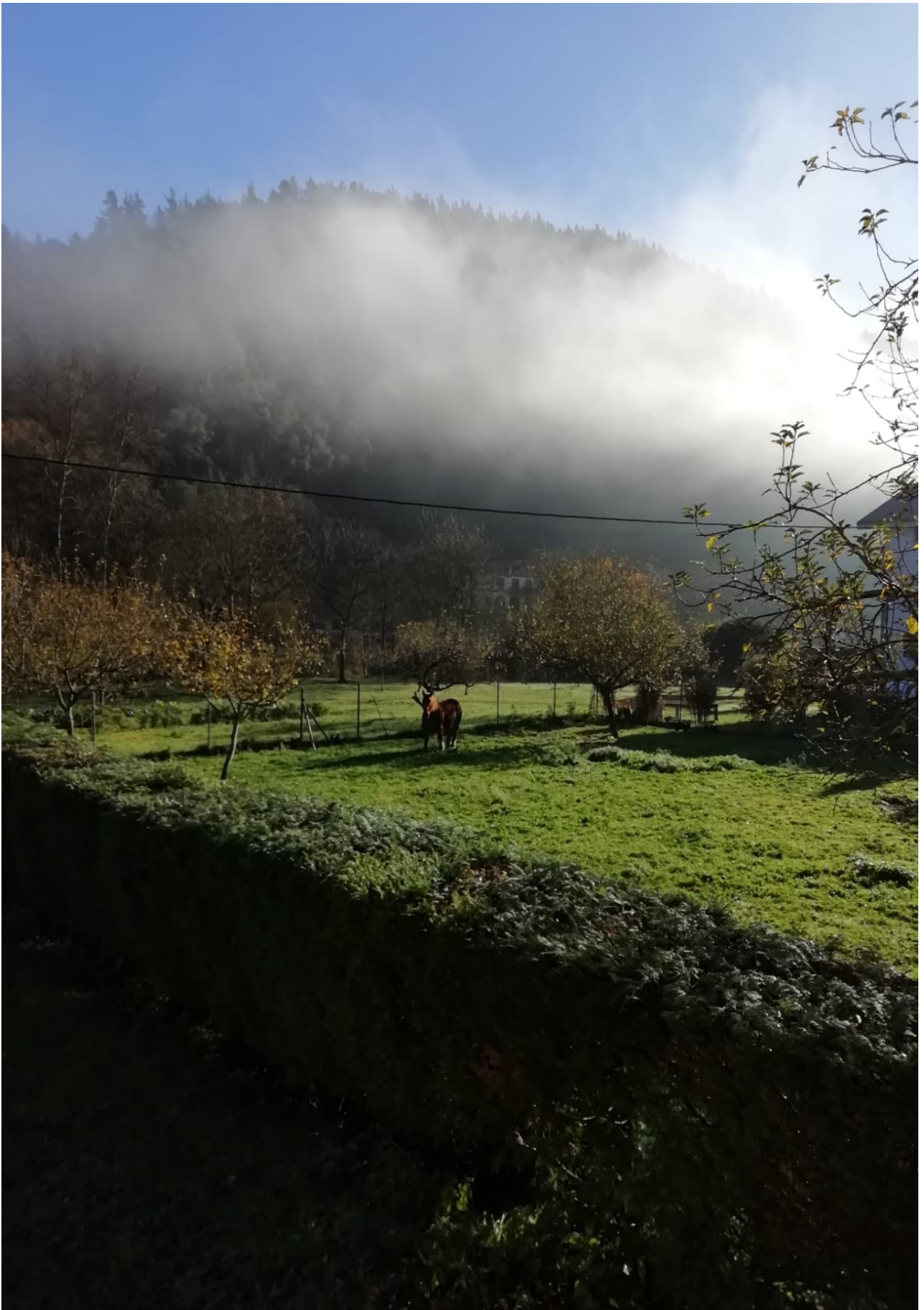
Antzeko argazkia ikusi dugu beste batean