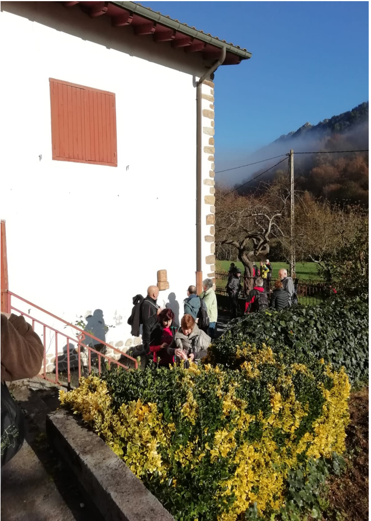
Sara etxea ikusi eta gero, abiatzeko prest