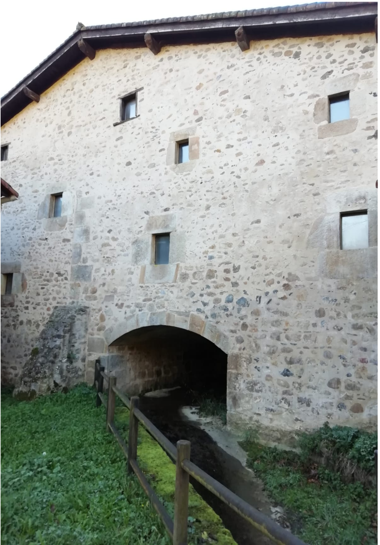
Lehen ikusitako etxetzarra, itxuraz eihera izandakoa