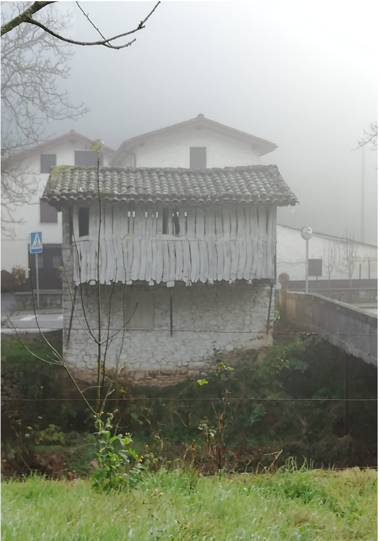
Bertako hórreo, garaia edo garau lekua