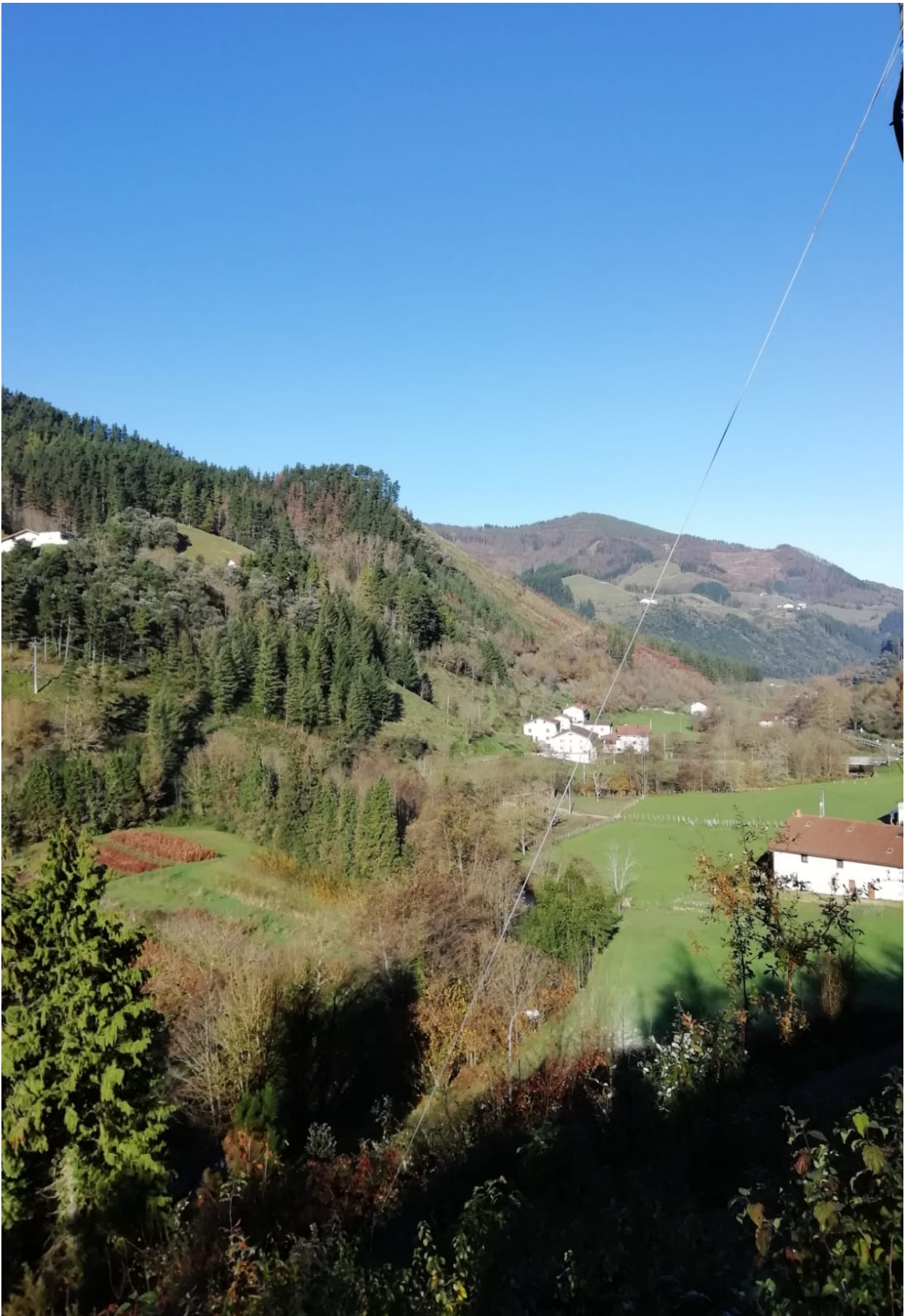
Eta antzeko beste bat