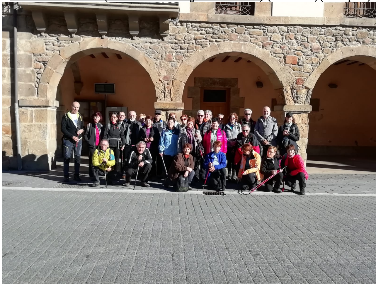
Ataungo San Martin auzoan ibilaldia eta hamaiketako bukatu eta gero