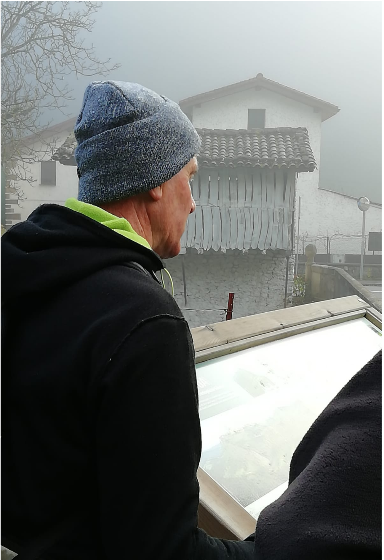
Ataungo Domoaren txartelaren ondoan, hankaluze hau Erramuntxoren azalpenak entzuten