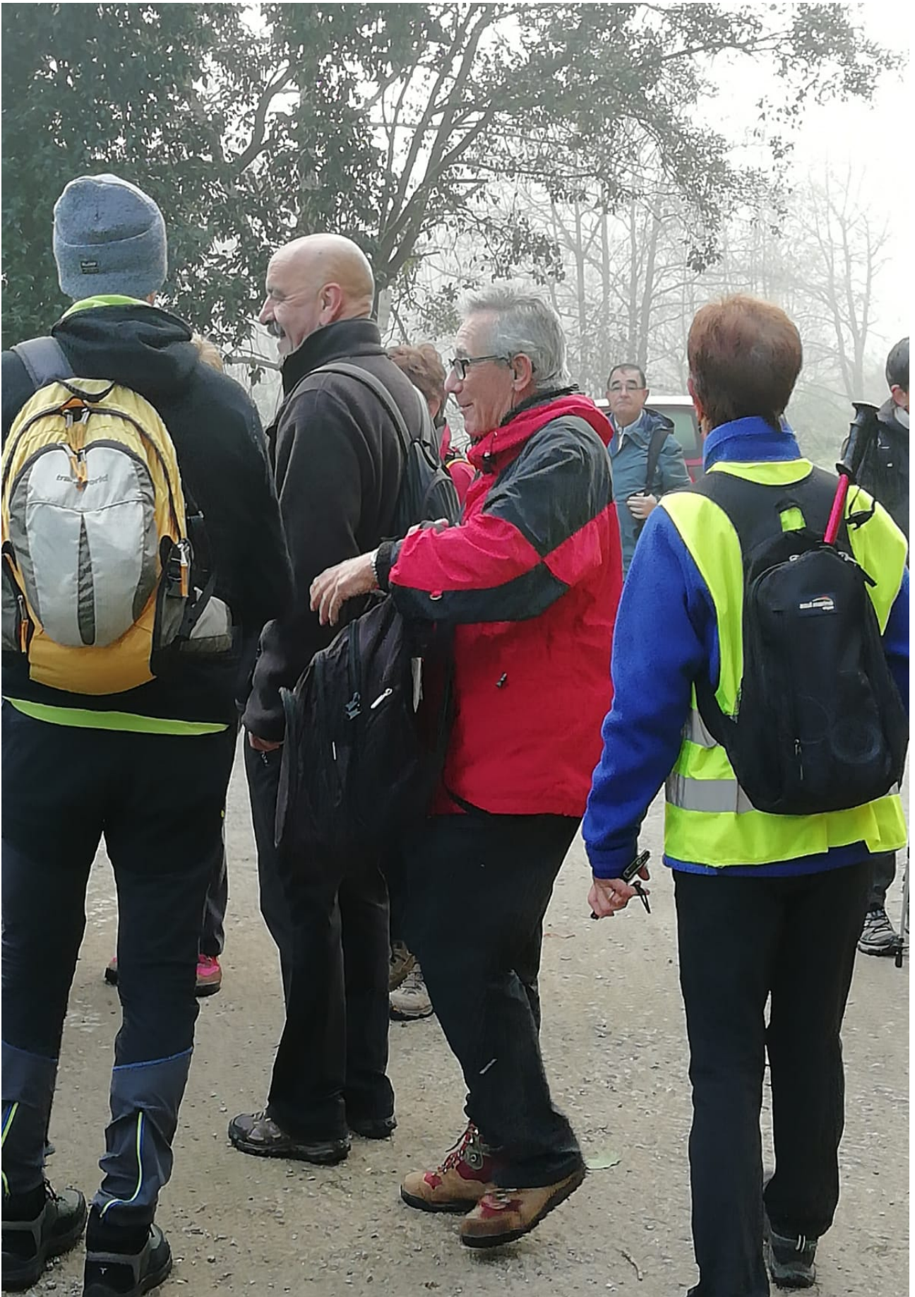
Antzeko argazkia ikusi dugu lehen