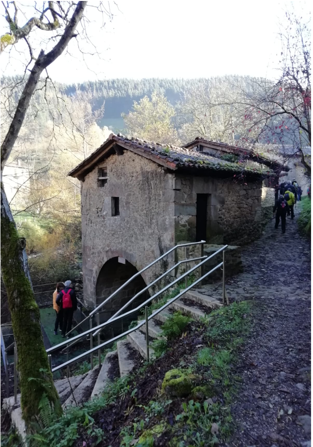
San Gregorio auzoko errota edo eihera zaharra