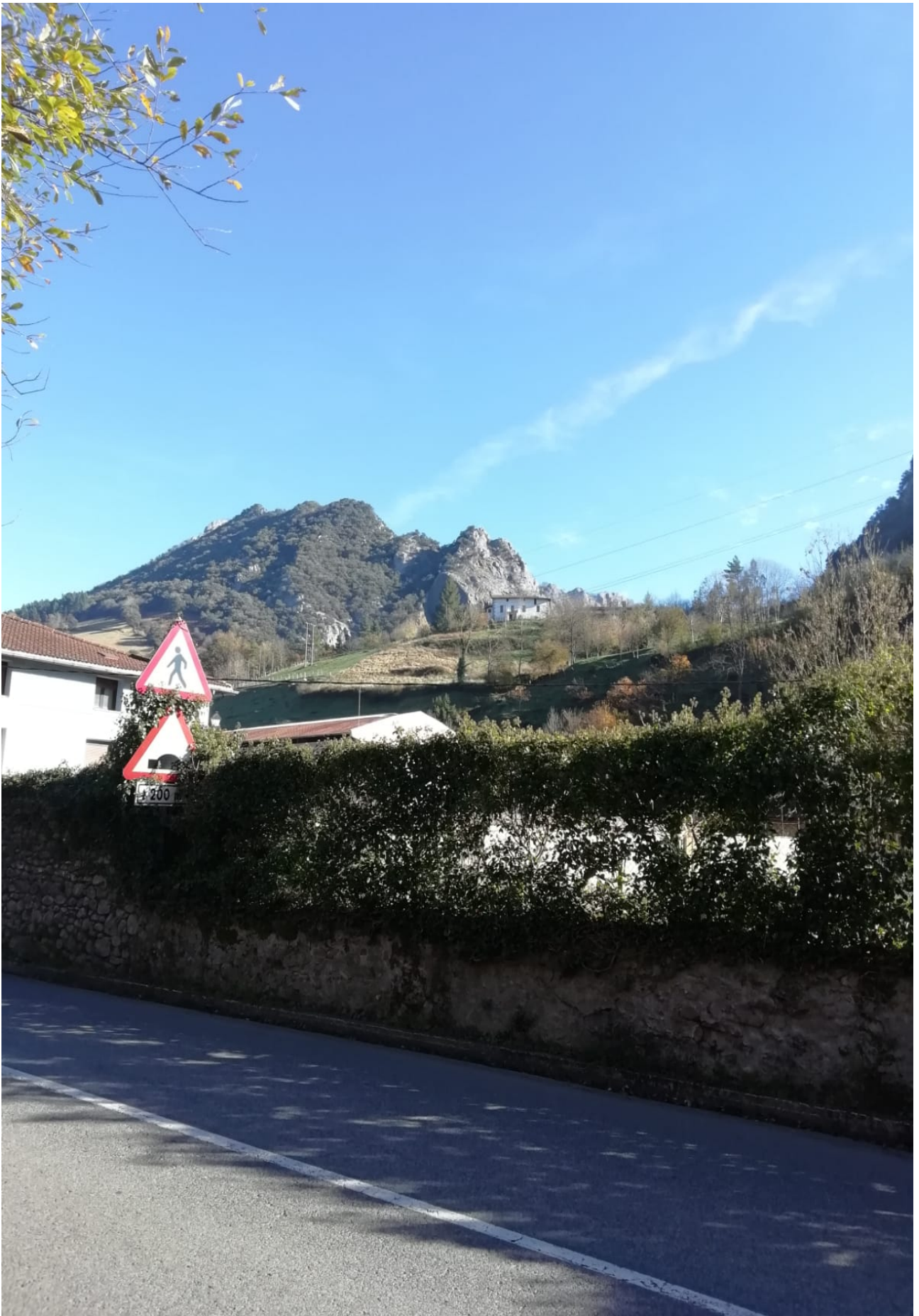
Domo aldera begiratzen duen paisaia