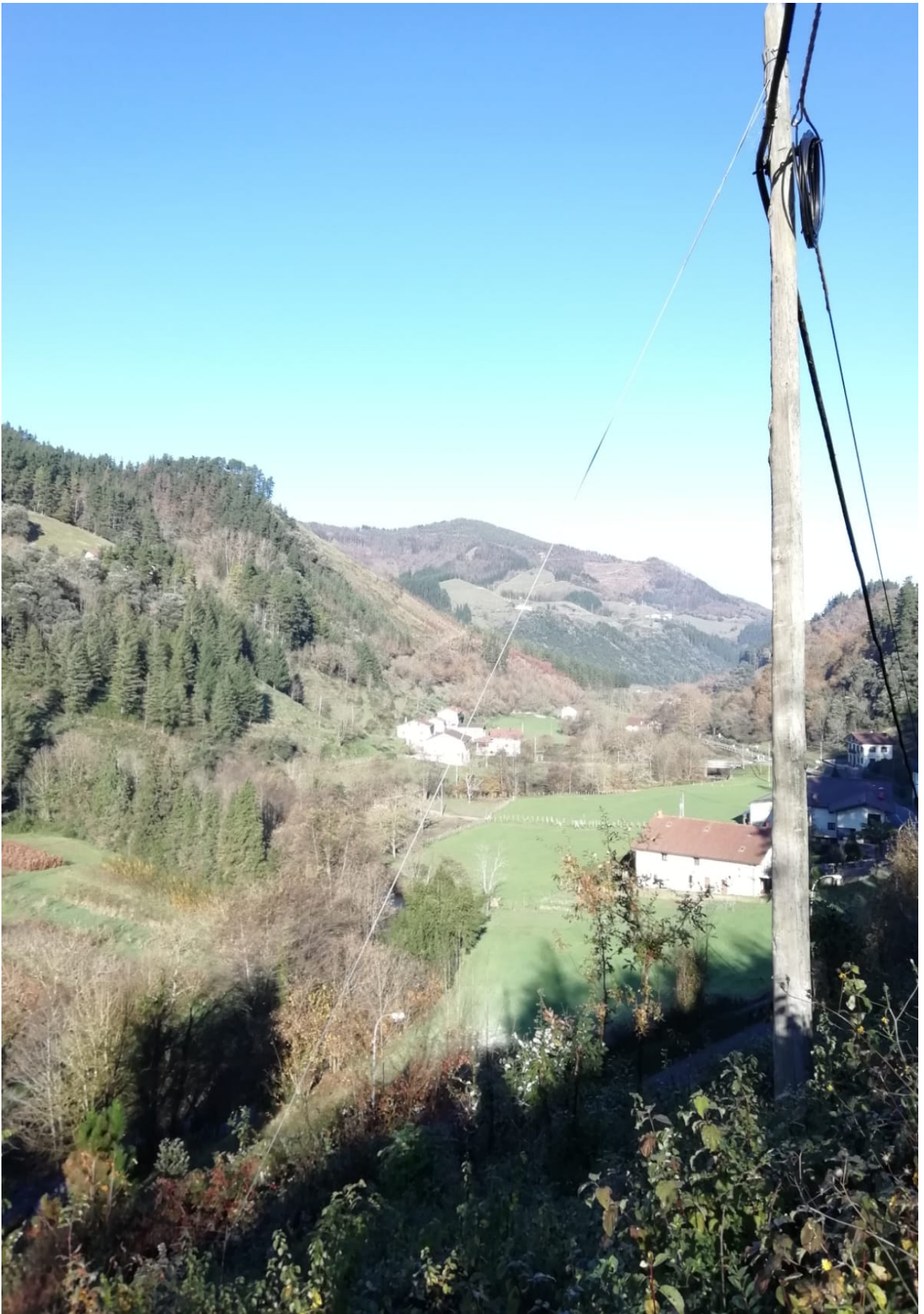
Ataungo alderdi eder bat