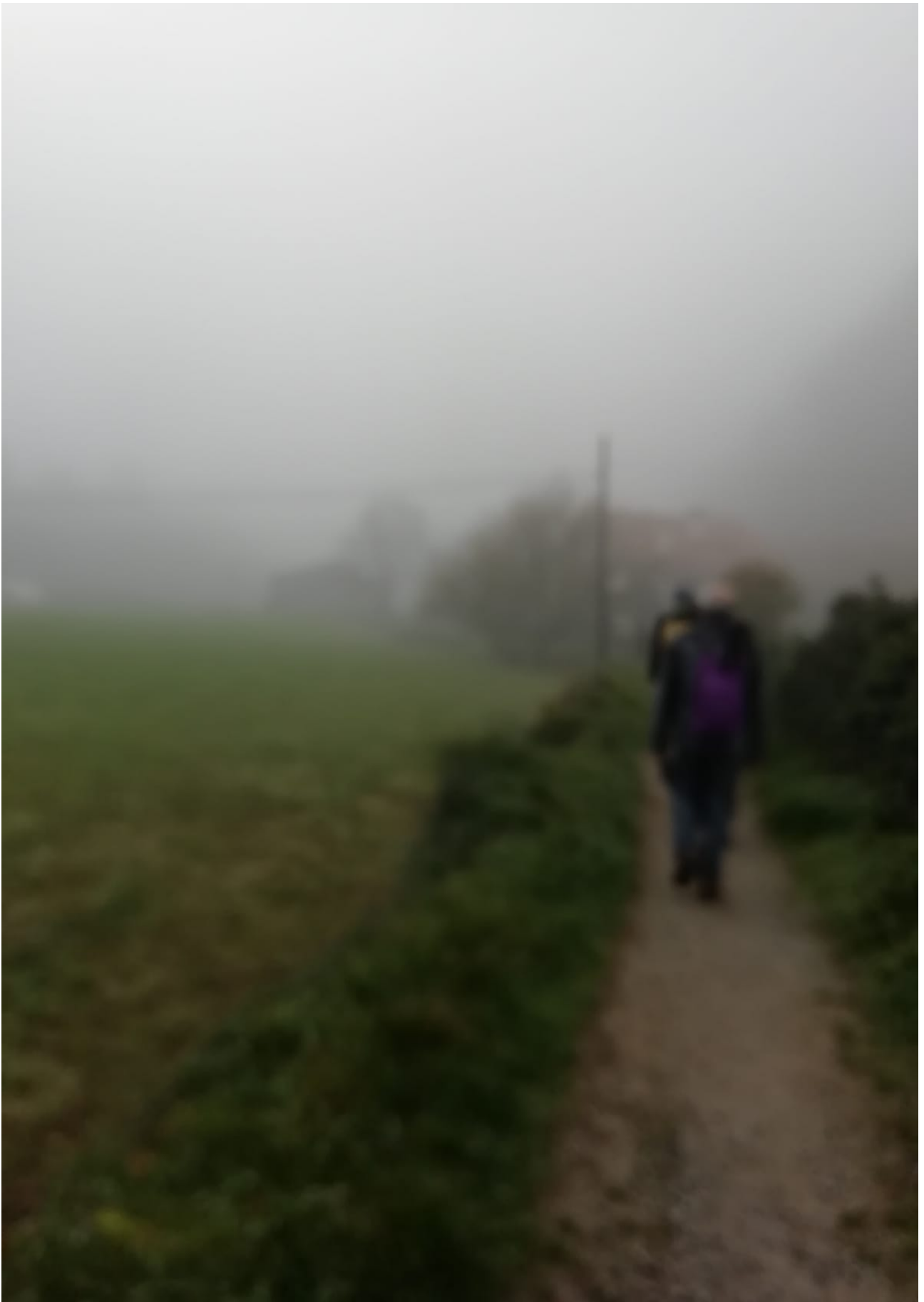
Bidezidorrean, ibiltariok laino artean