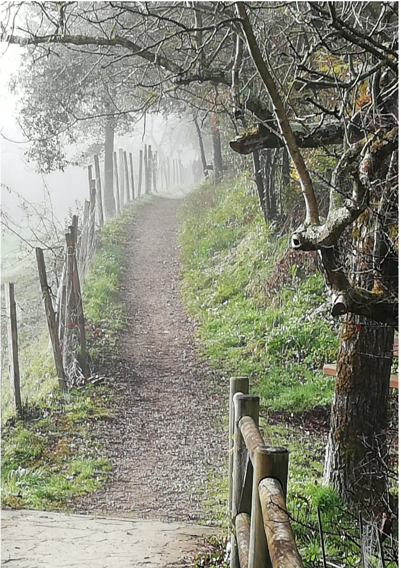
Bidezidor dotore askoa