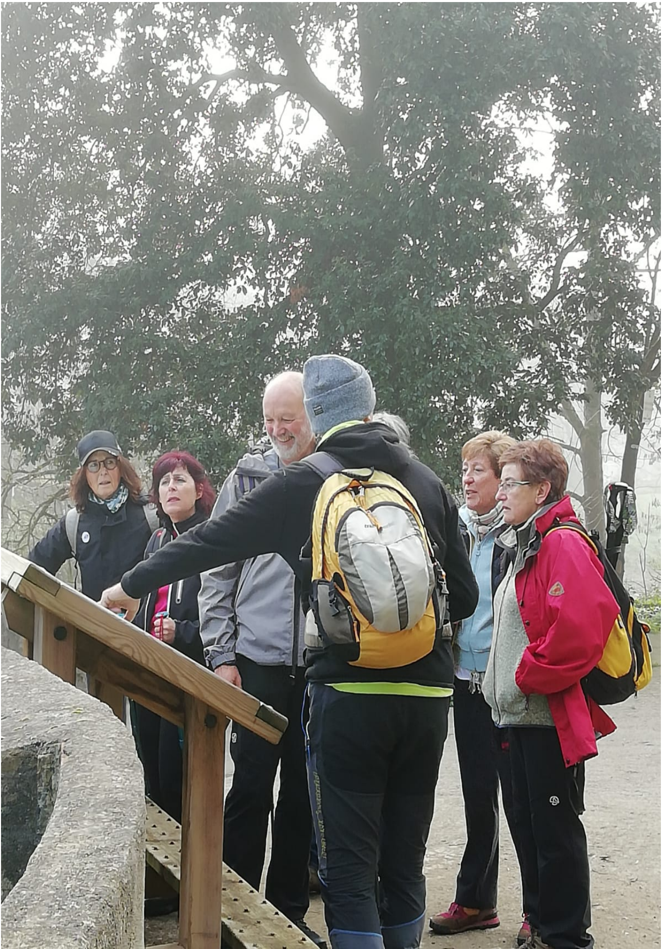
Ataungo Domoaren txartelaren aurrean zenbait ibiltari