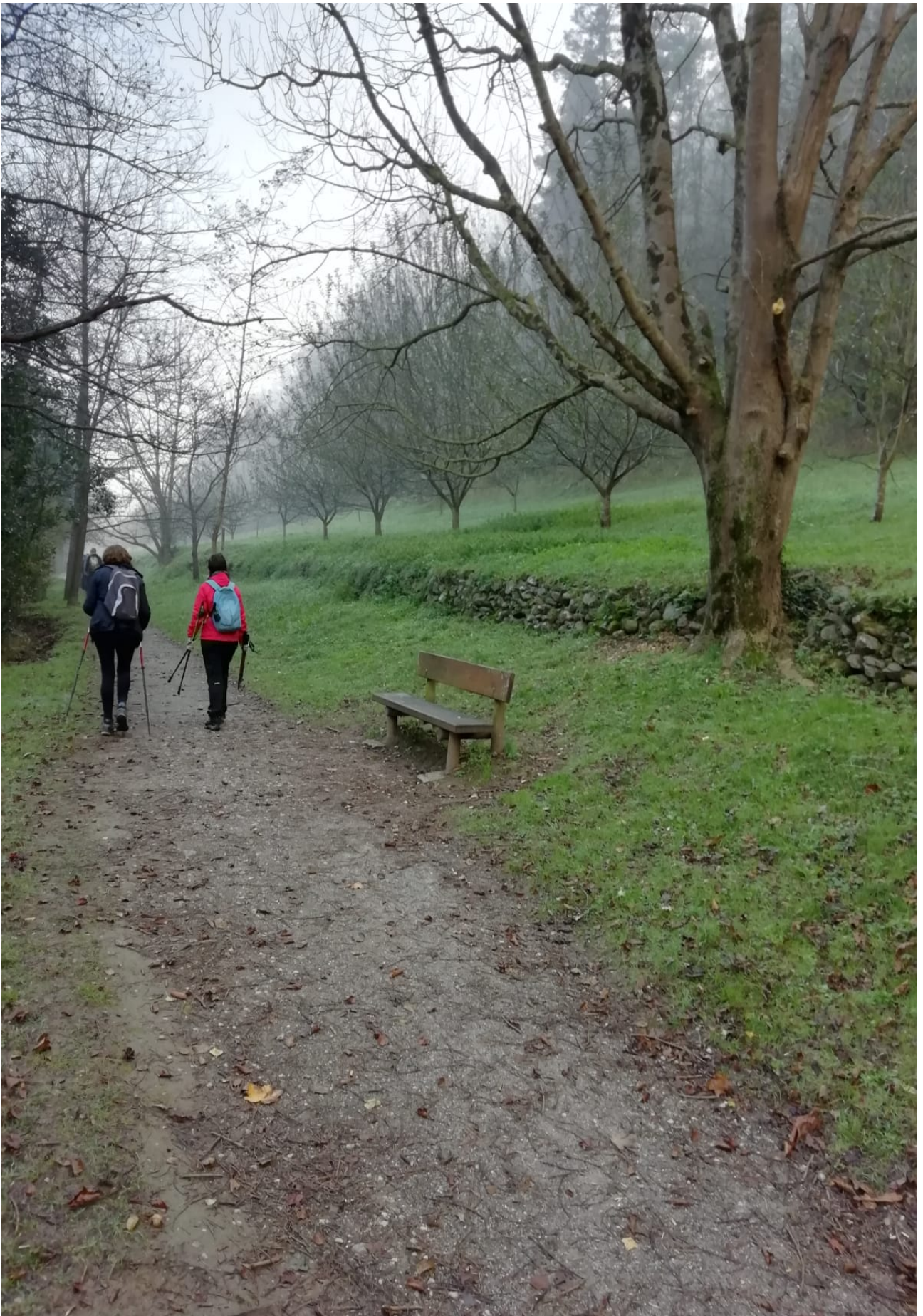
Agantza ibaiaren ondoko bidezidor bukolikoan zehar, ibiltariok gogoeta egiten