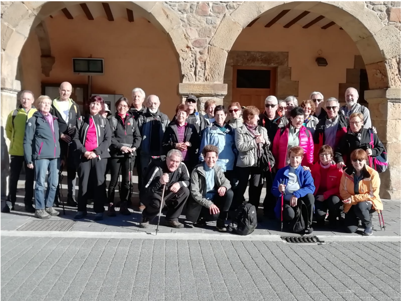
San Martin auzoan ateratako argazkia