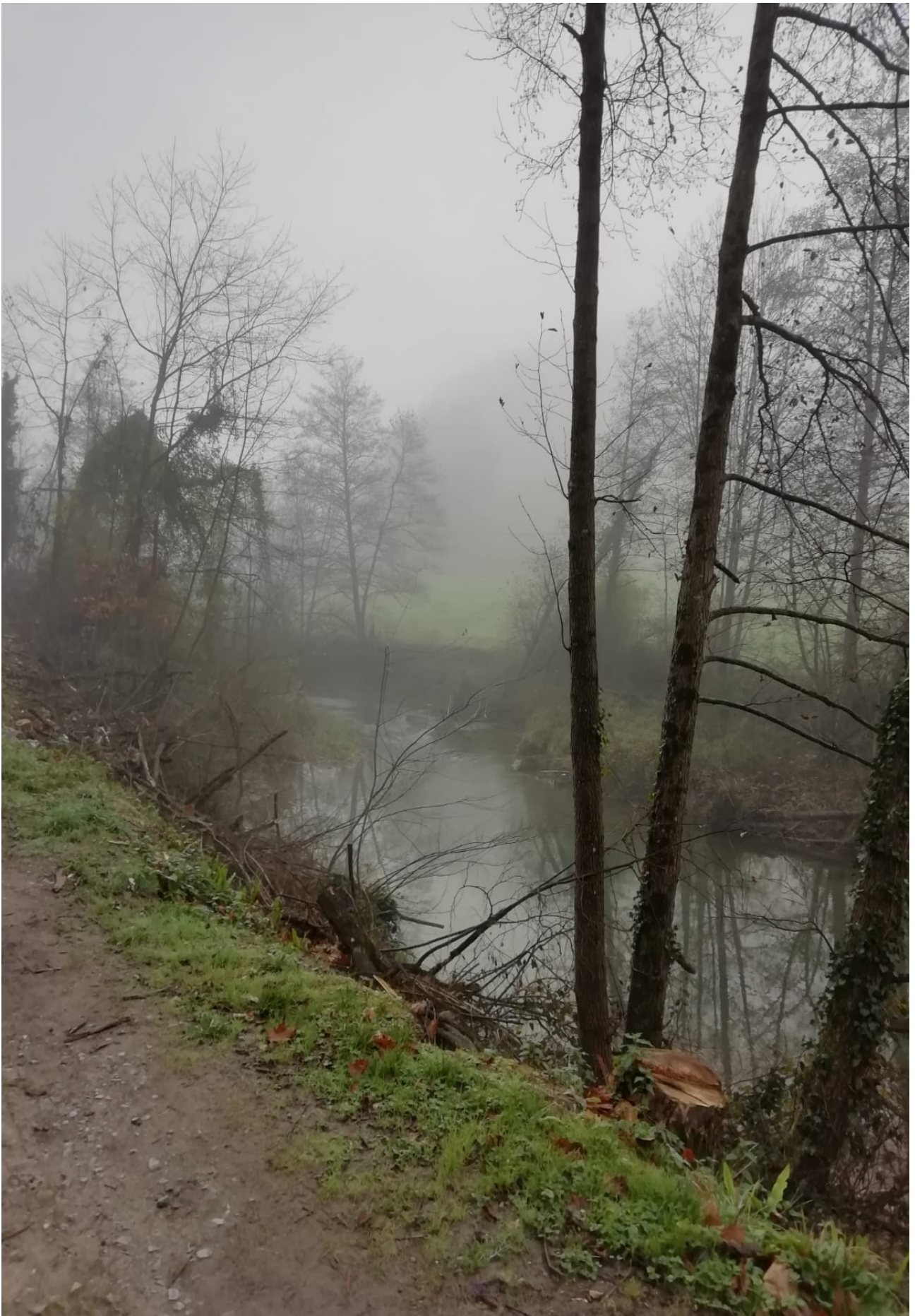
Agauntza ibaiaren ondoko paisaia lainotsua