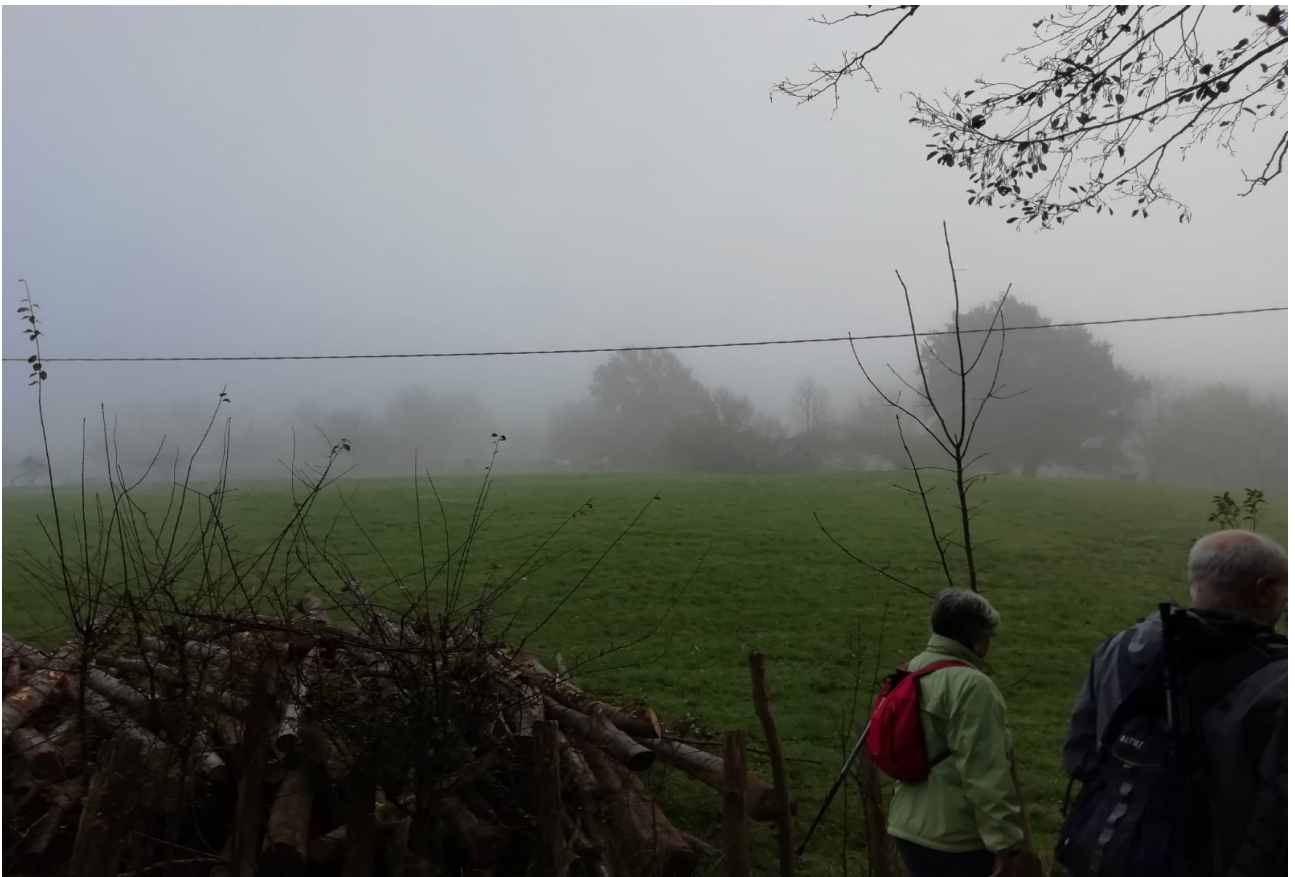
Laino artean ibilaldiaren hasieran