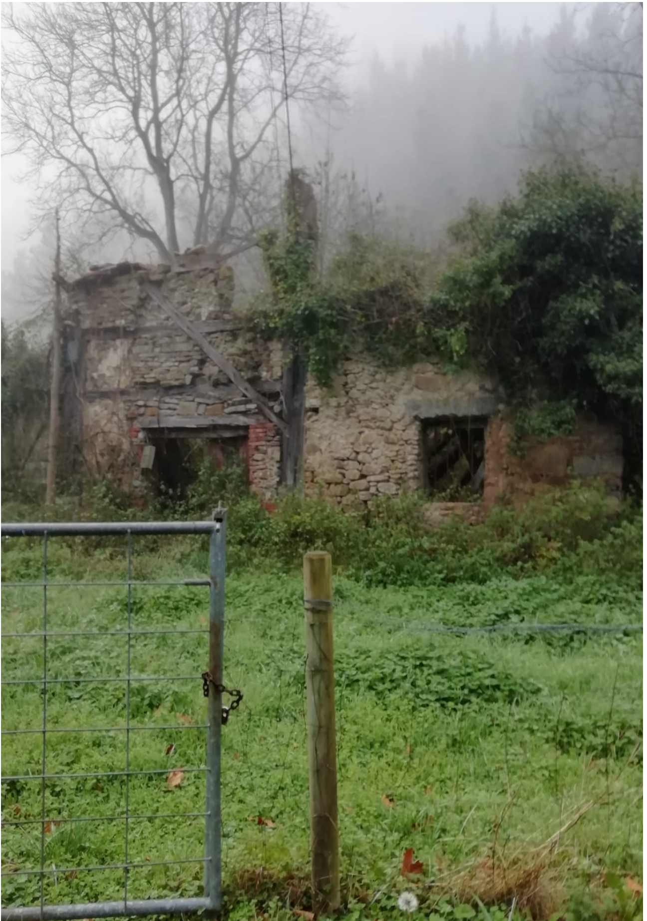
Etxe honi, gutako zenbaiti bezala, zahartzaroa heldu zaio