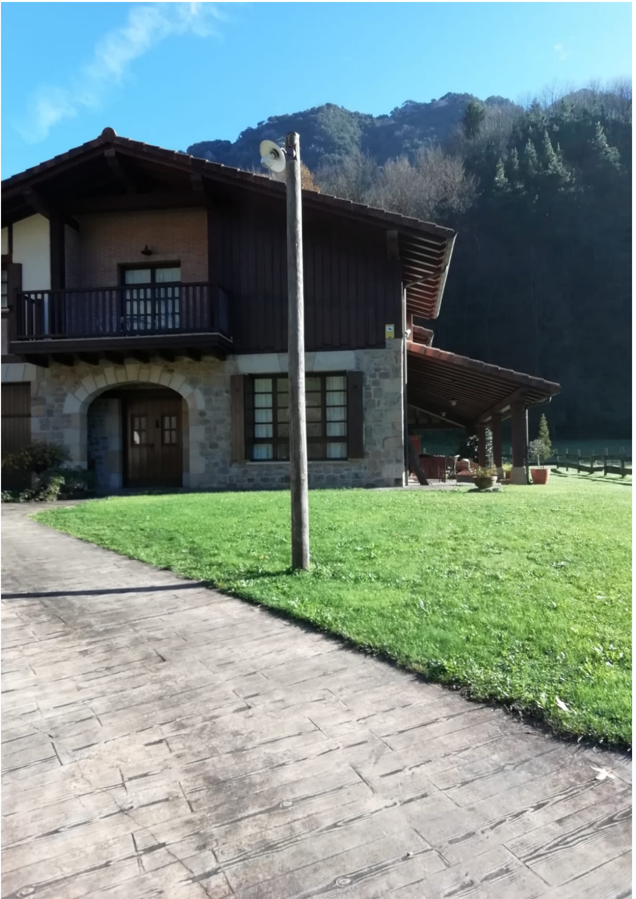
Lehen aipatu duguna: etxe ederrak ikusten dira Ataunen