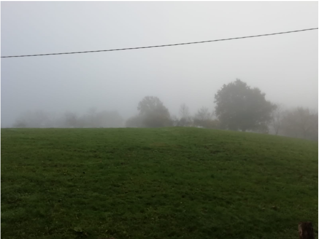
Ataungo Domoaren inguruan, laino ugari