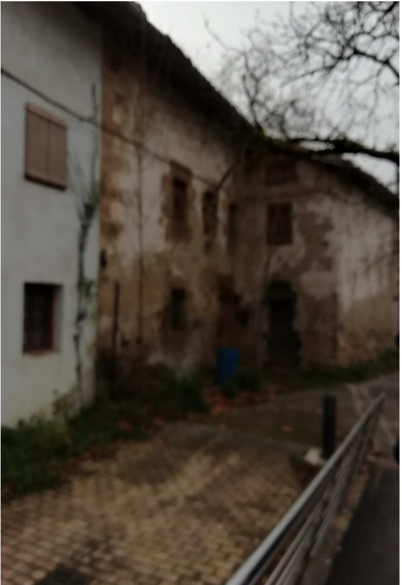
Agauntza ibaiaren ondoan, etxe zaharrak ere ikusten dira