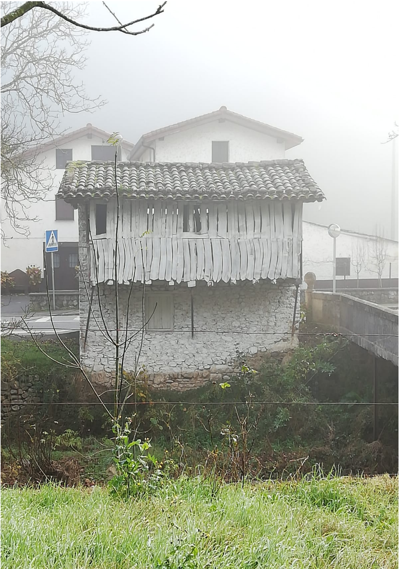
Lehengo hórreo edo garau lekua