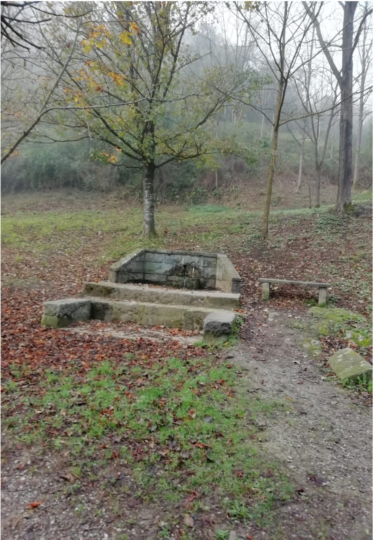
Izadiaren erdian, iturri zahar bat