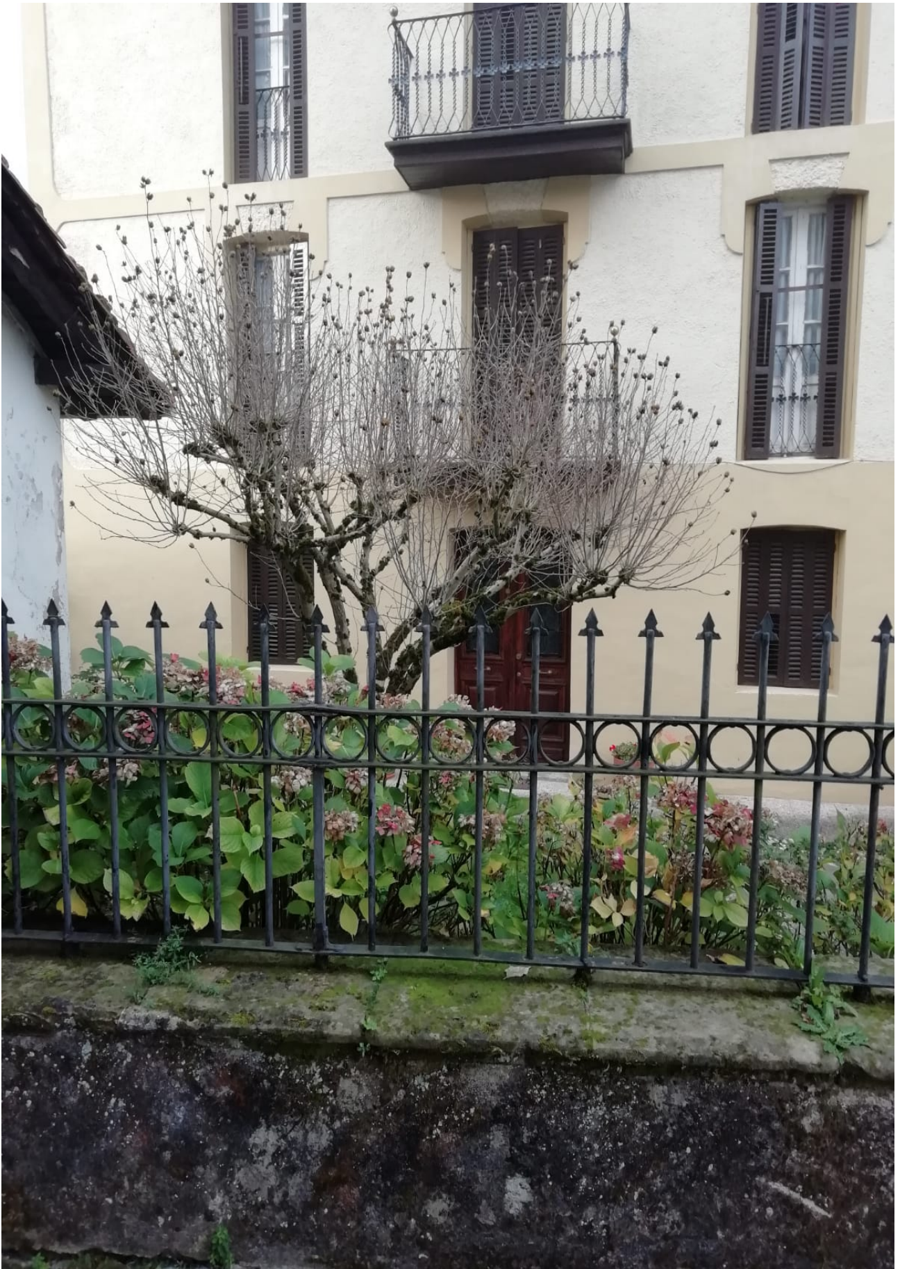
Honelako etxe eder asko dago Ataunen