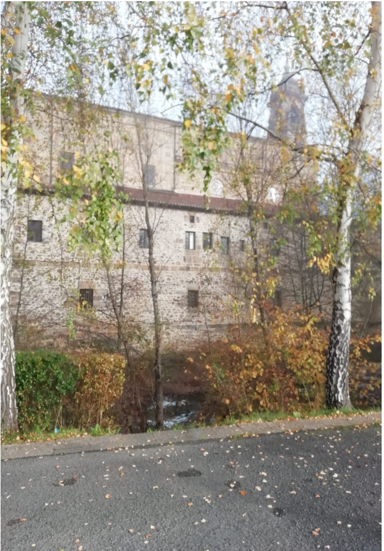
Agauntza ibaiaren ondoko etxadia