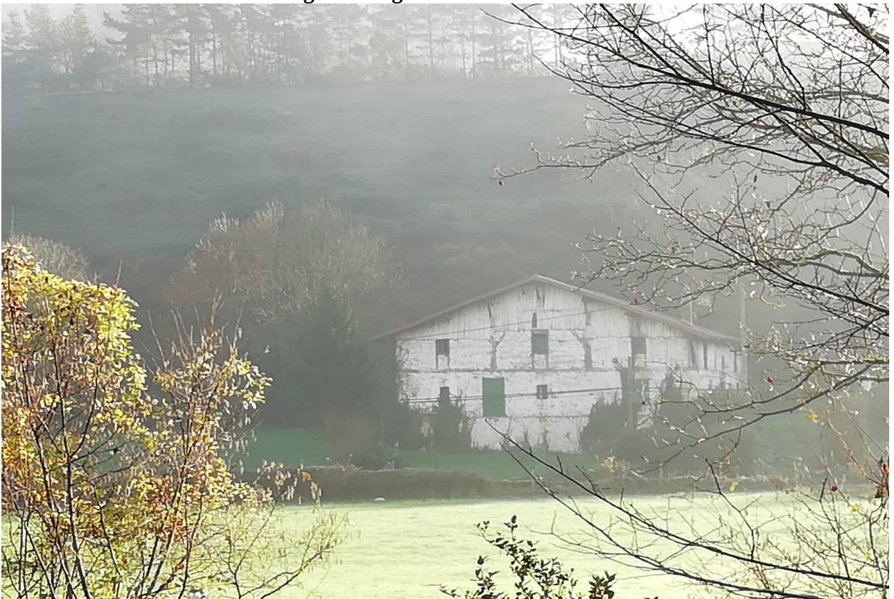
Antzinako baserriak ere sumatzen dira