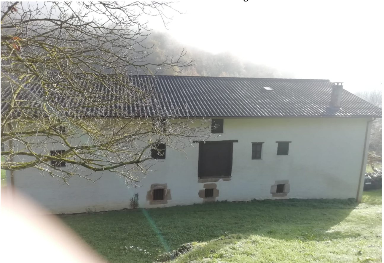
Beste etxetzar bitxia