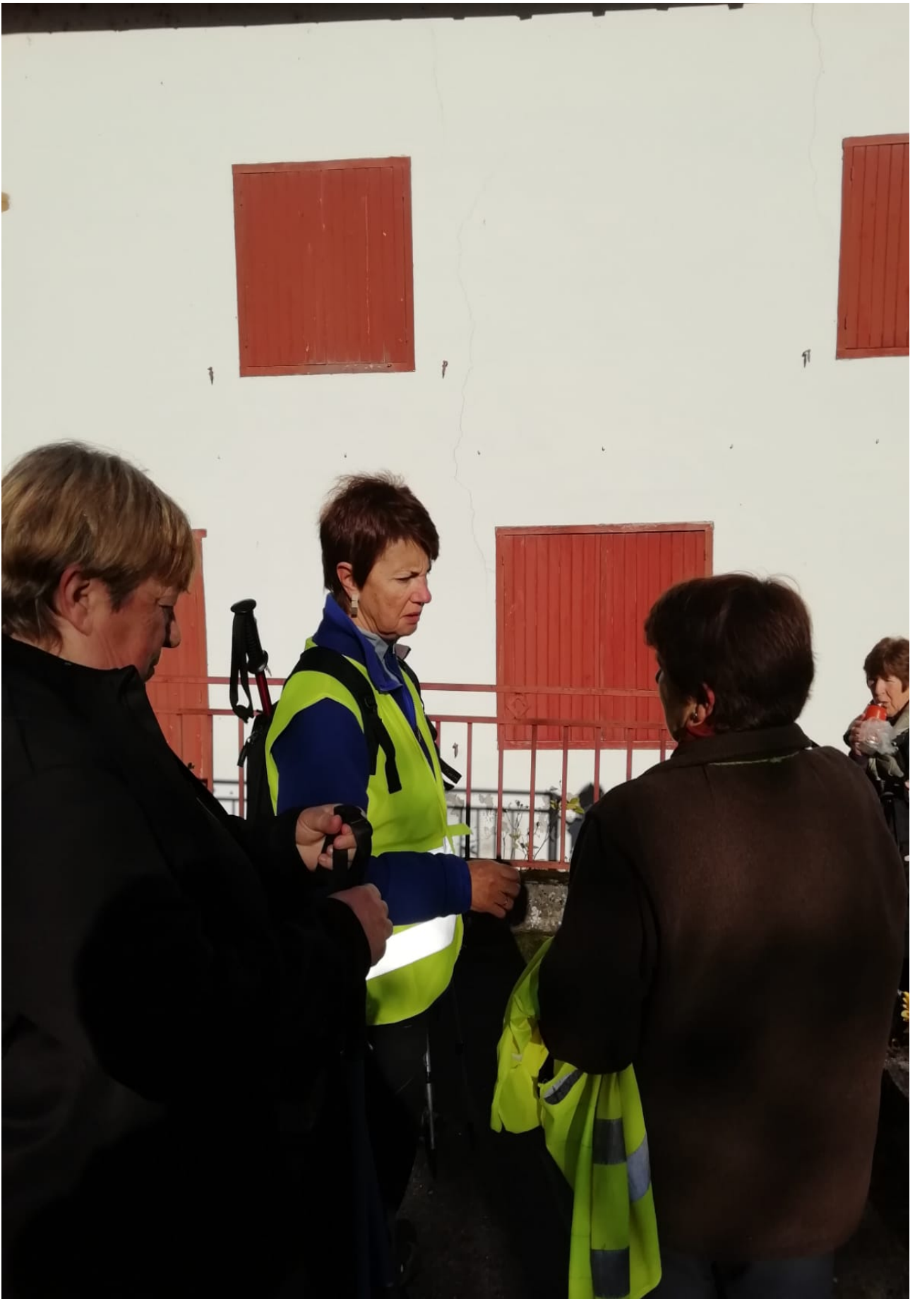
Aitzindari edo gidariak berbetan