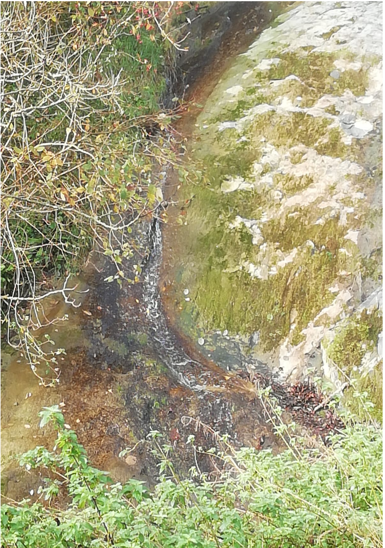
Lehengo errekatxo bera