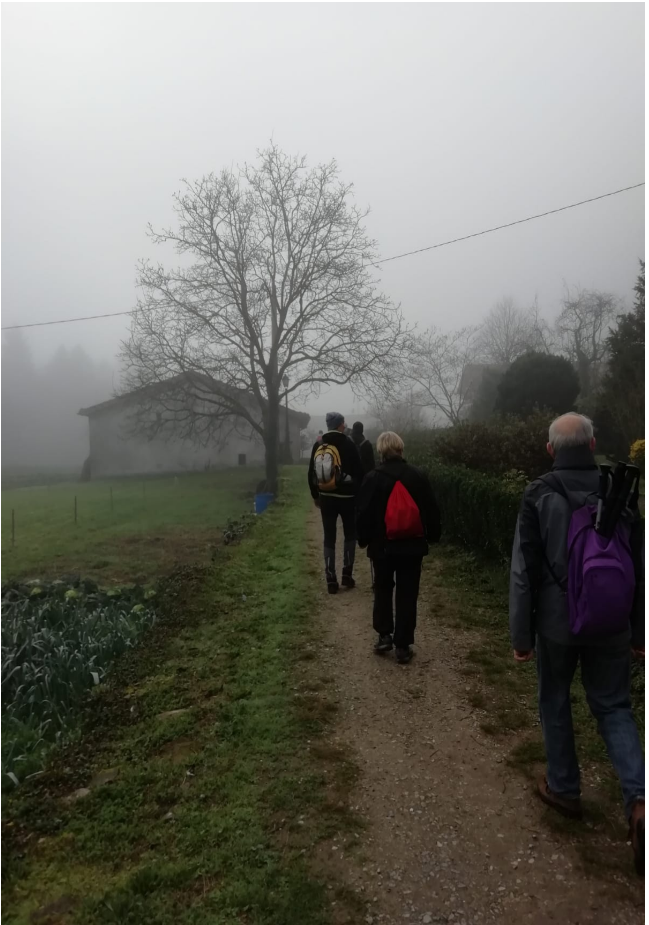
San Maitinetik San Gregoria doan ibilbidea