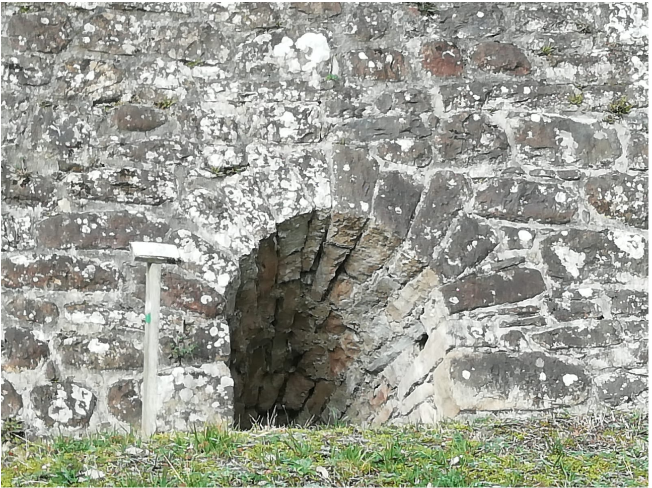
Ibilbideko karobi zaharra