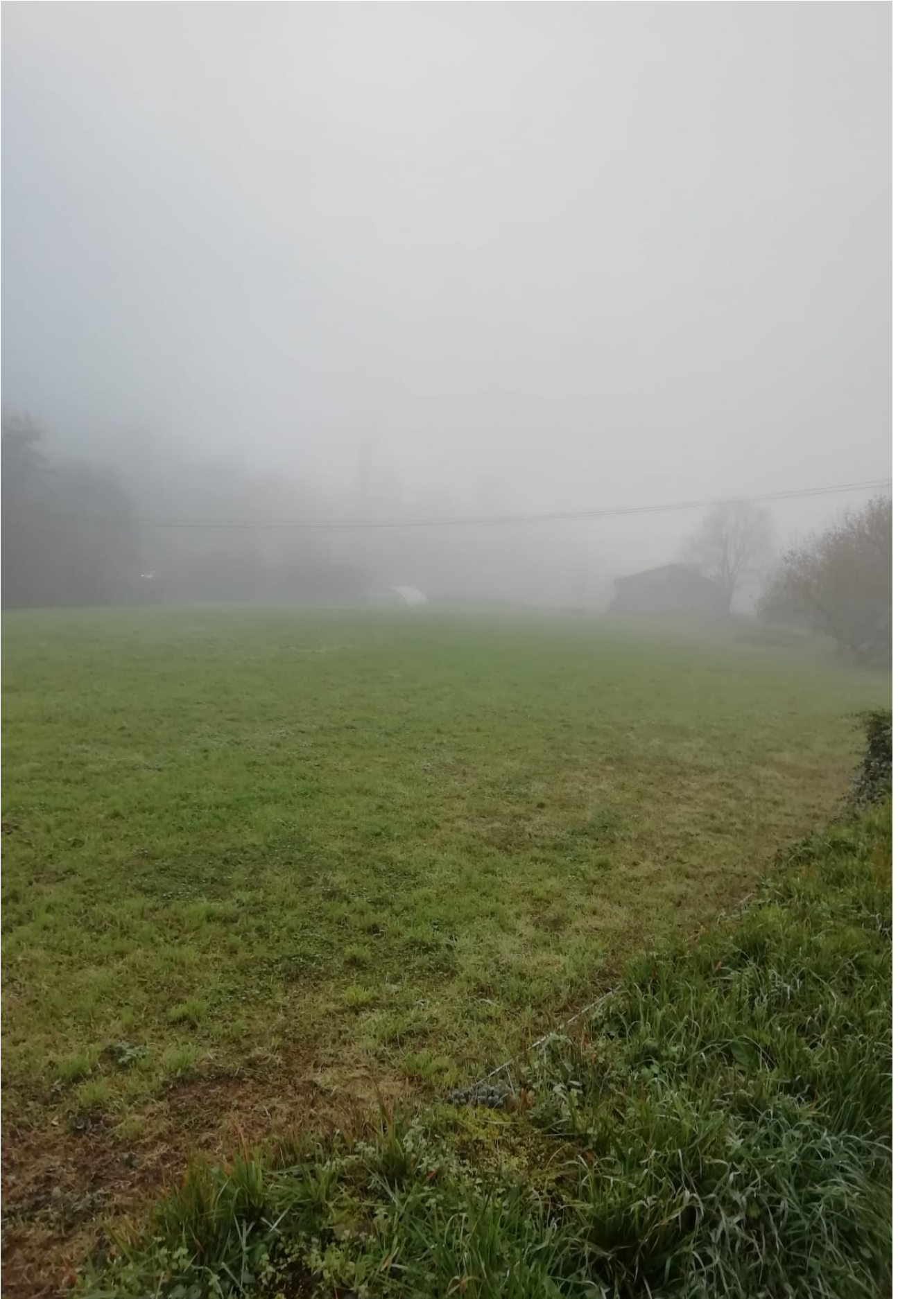
Hezetasun izugarria sumatzen da alderdi honetan