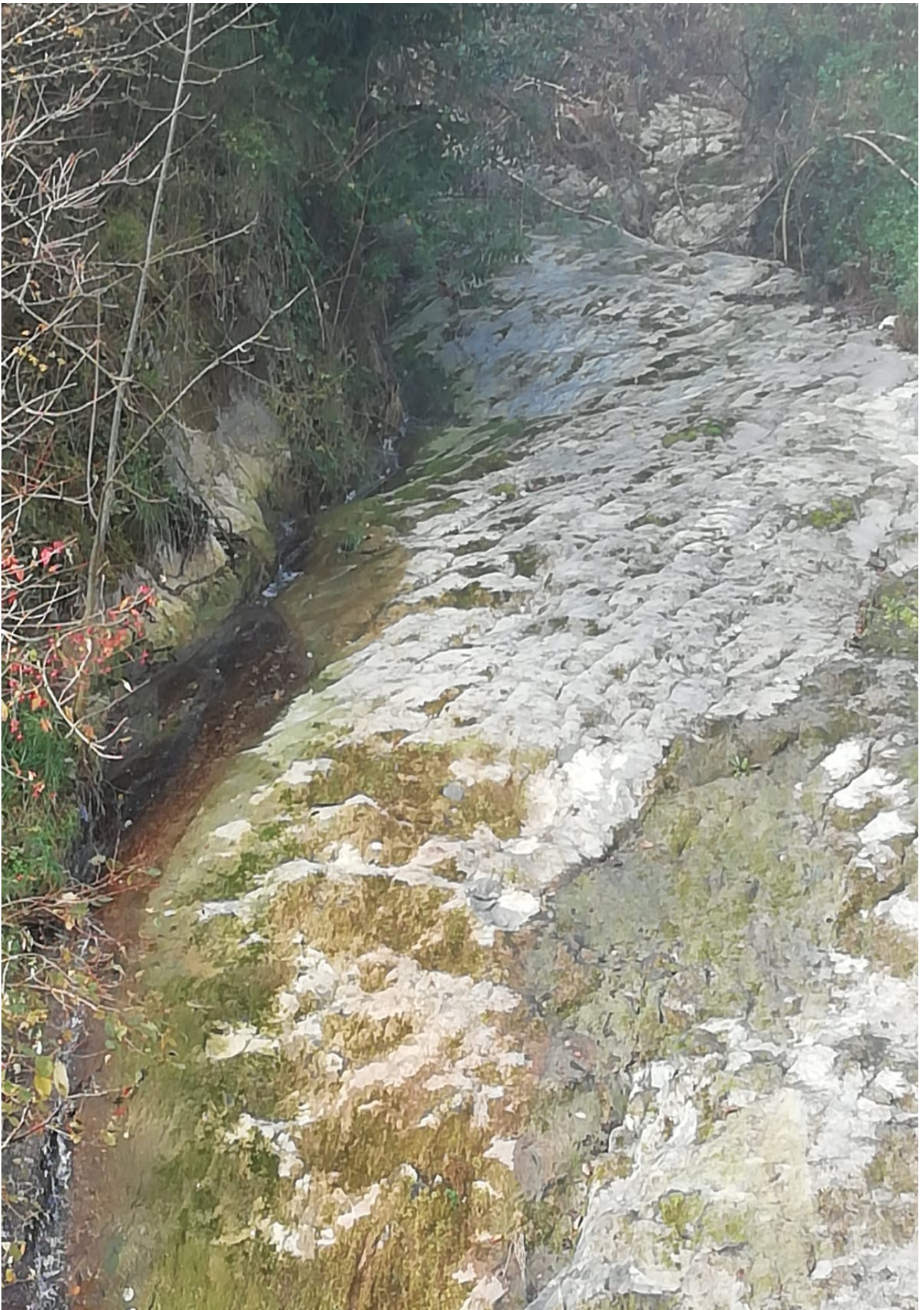
Ibilaldiko beste errekatxo bat