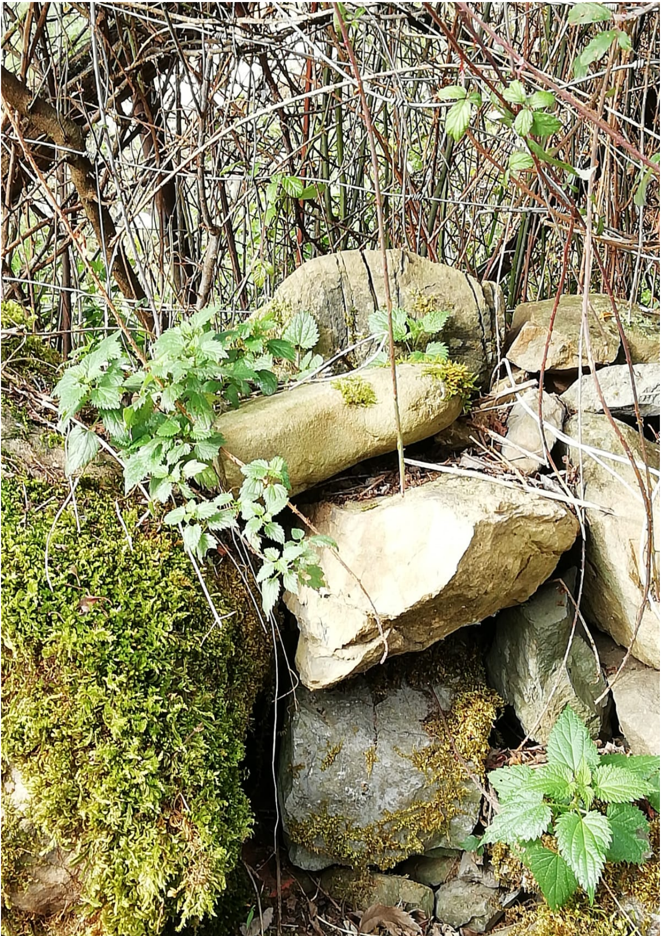
Harri eta adarren nahaste-borrastea