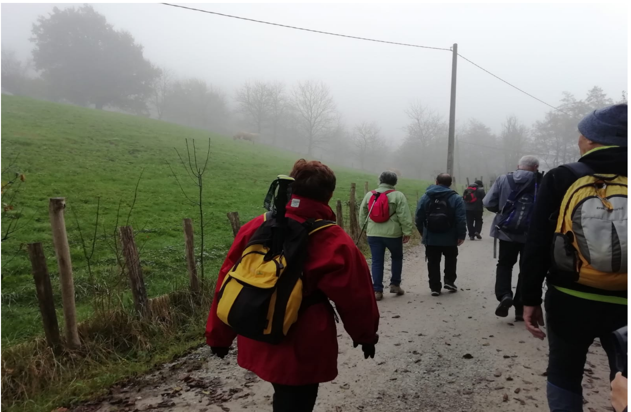
Eta baita bidezidorrean zehar ere