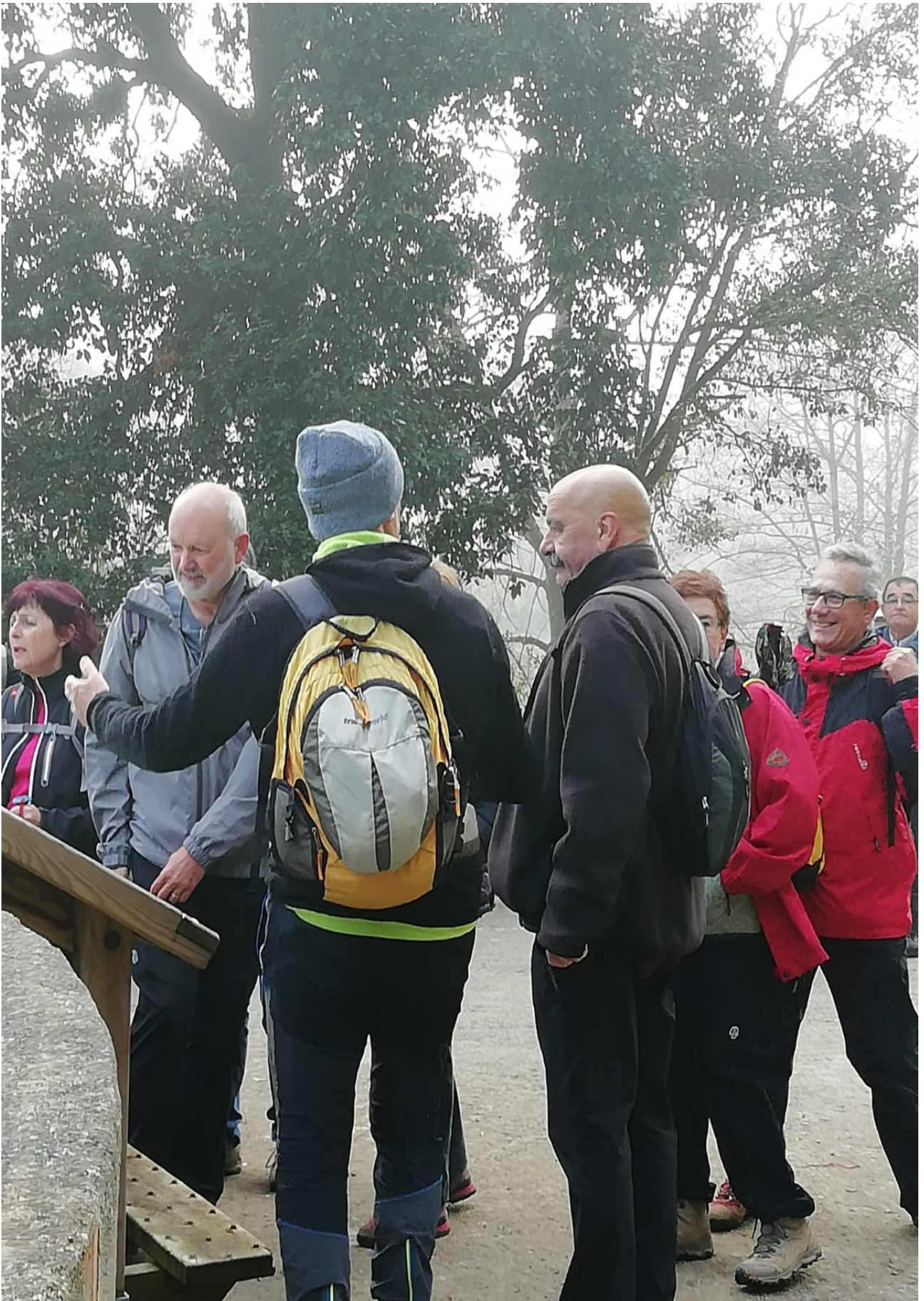
Ataungo Domoari buruz, Erramuntxoren azalpenak entzuteko zain