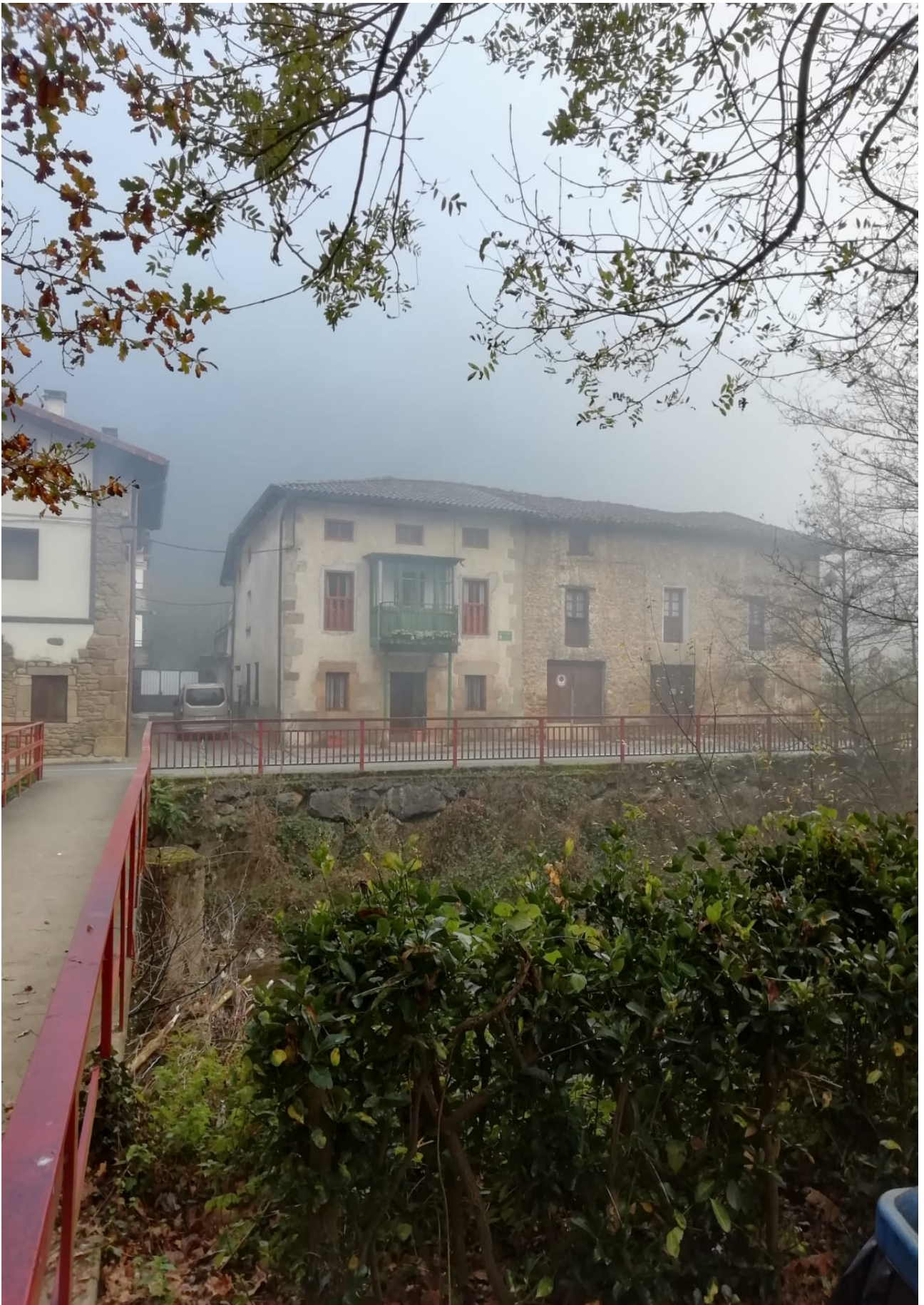
Ataungo beste etxetzar eder ibilbidean zehar