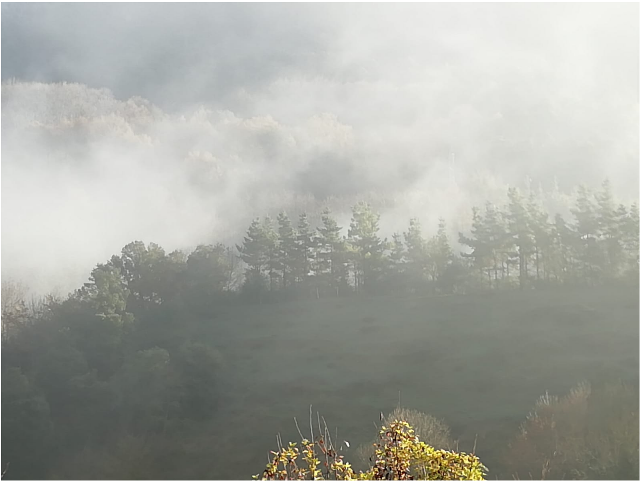
Laino ugari izan genuen ibilaldiaren hasieran