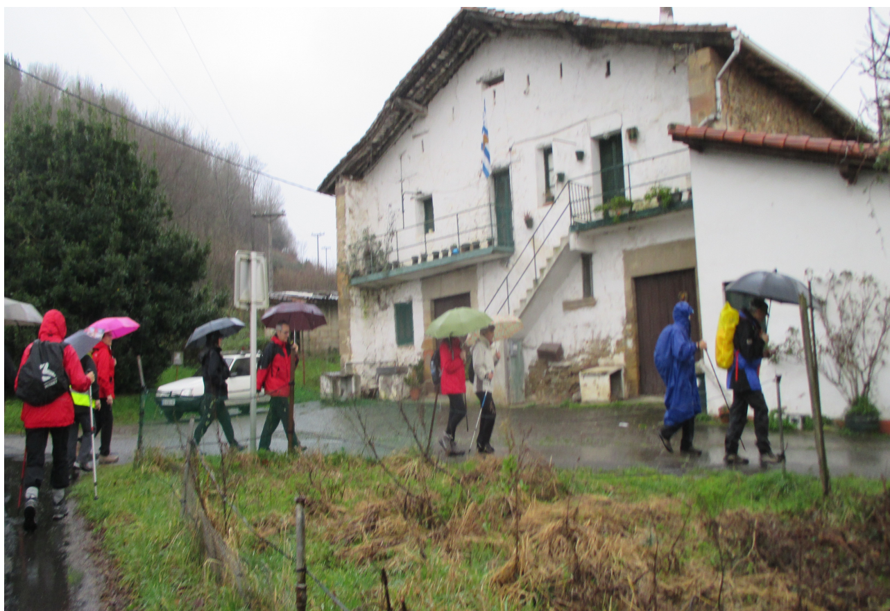
Oriamendiko inguruetan, euripean