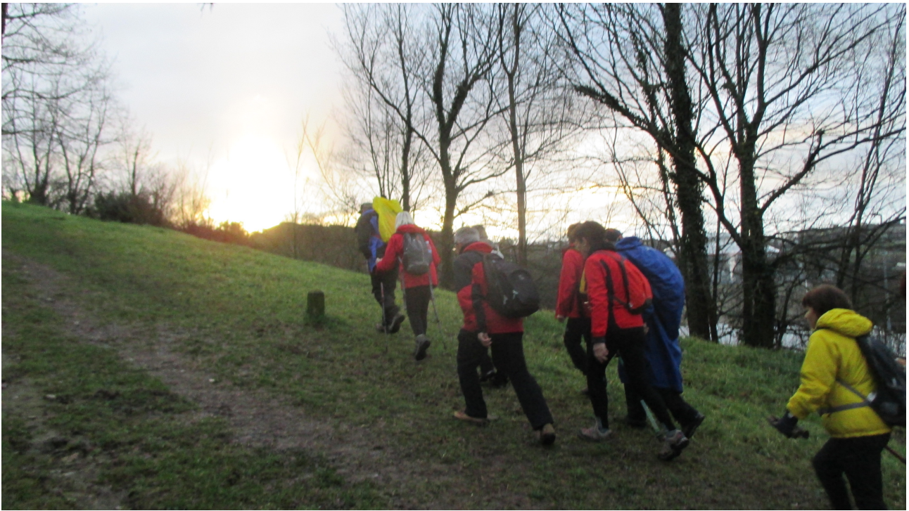
Zorroagako igoeran, ibiltariak euriari aurre egiteko prest eta euripean