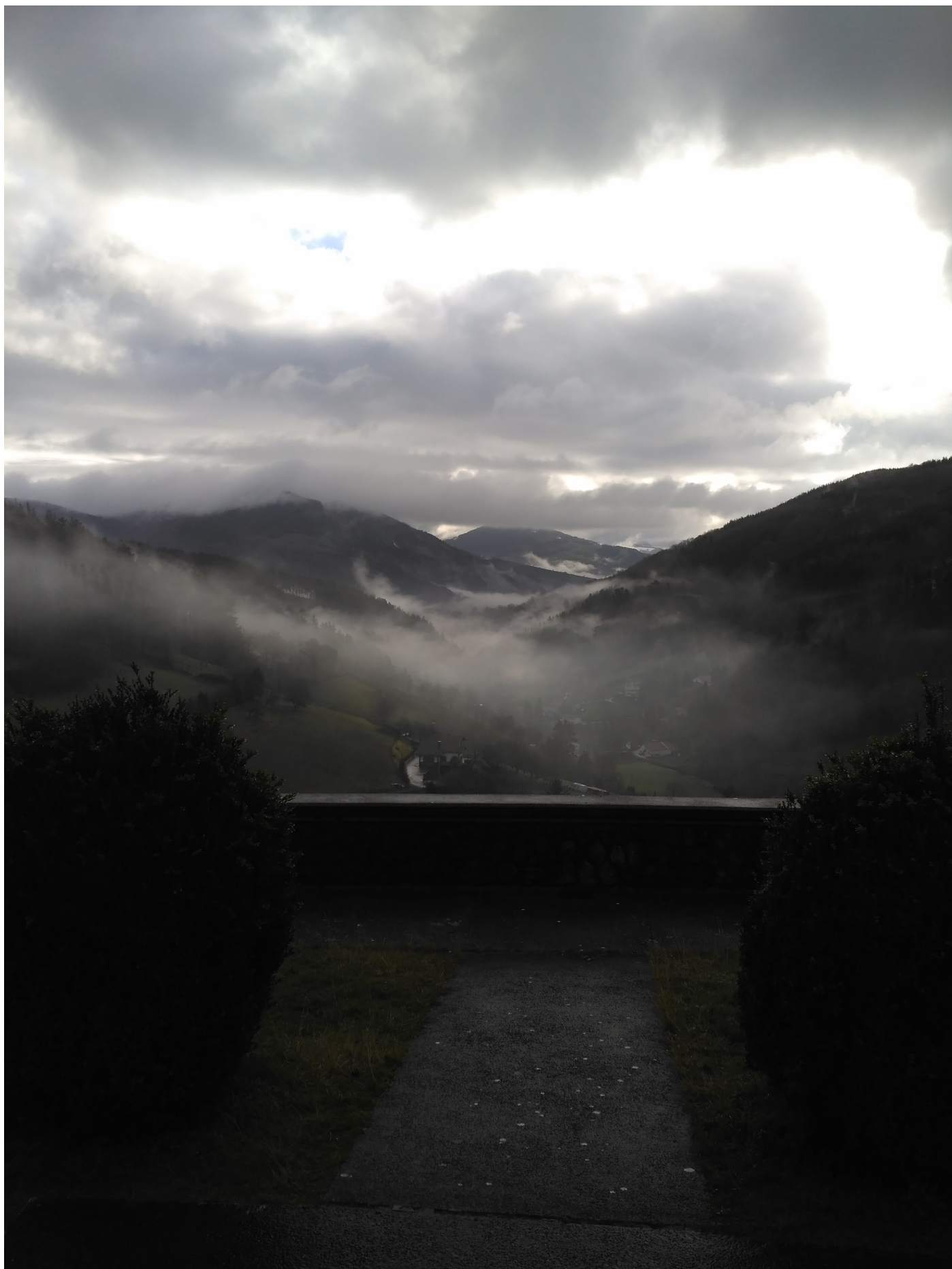
Alkizako begiratokian, laino margogaitzen jolasak behatzen