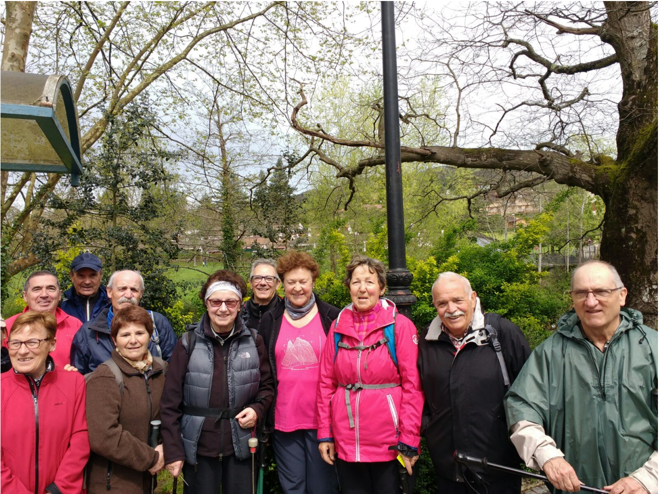
Taldea Altzibarko autobus geltokian

Hirigunetik ez oso urrun dakuskigu ezkutuak, ez ezagunak izaten diren leku eder baztertuak. Nola liteke bertan izanik gehientsuon sorlekuak, ibiltariak omen zarete baina nahiko alfertuak.