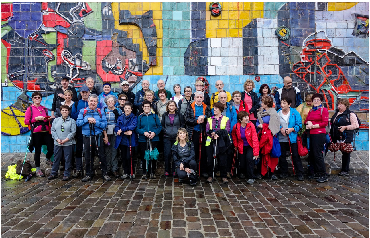
Hemen, ordea, talde osoa