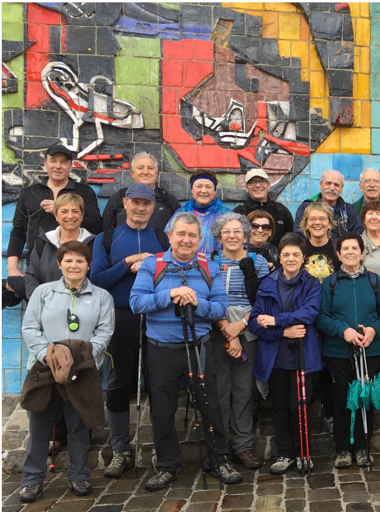
Taldearen erdia Usurbilen, Zumetaren lanaren aurrean