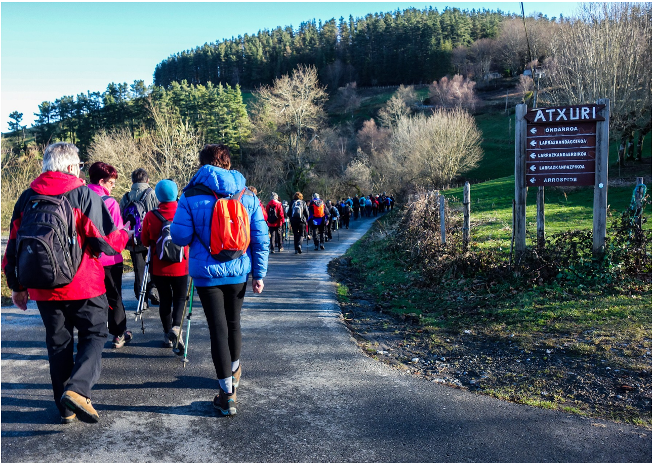
Otarre jatekxearen ondoan dagoen bidegurutzean