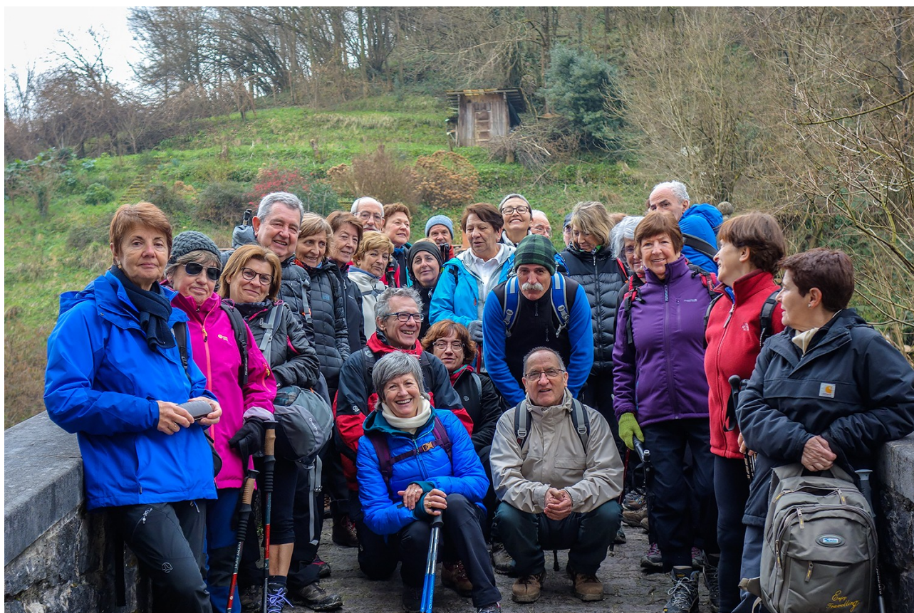
Alegiako zubi zaharrear talde osoa

Tolosa-Aldaba Txiki-Langaurre-Alegia (2018-02-23)