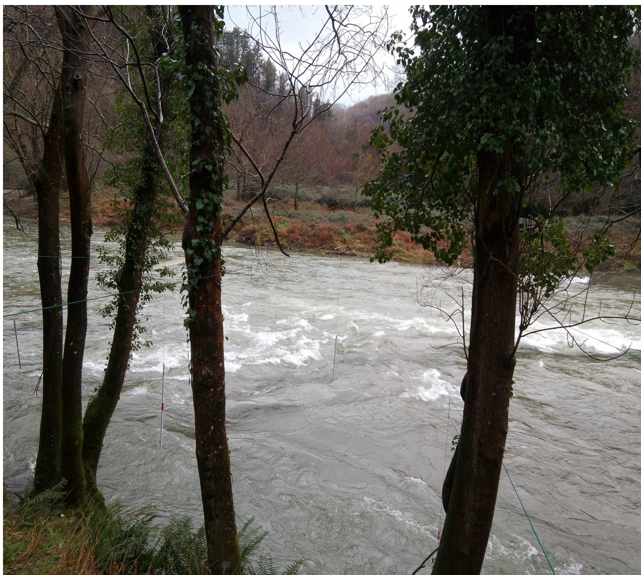
Errekak gainezka eta Bidasoa ibaia ongi horniturik