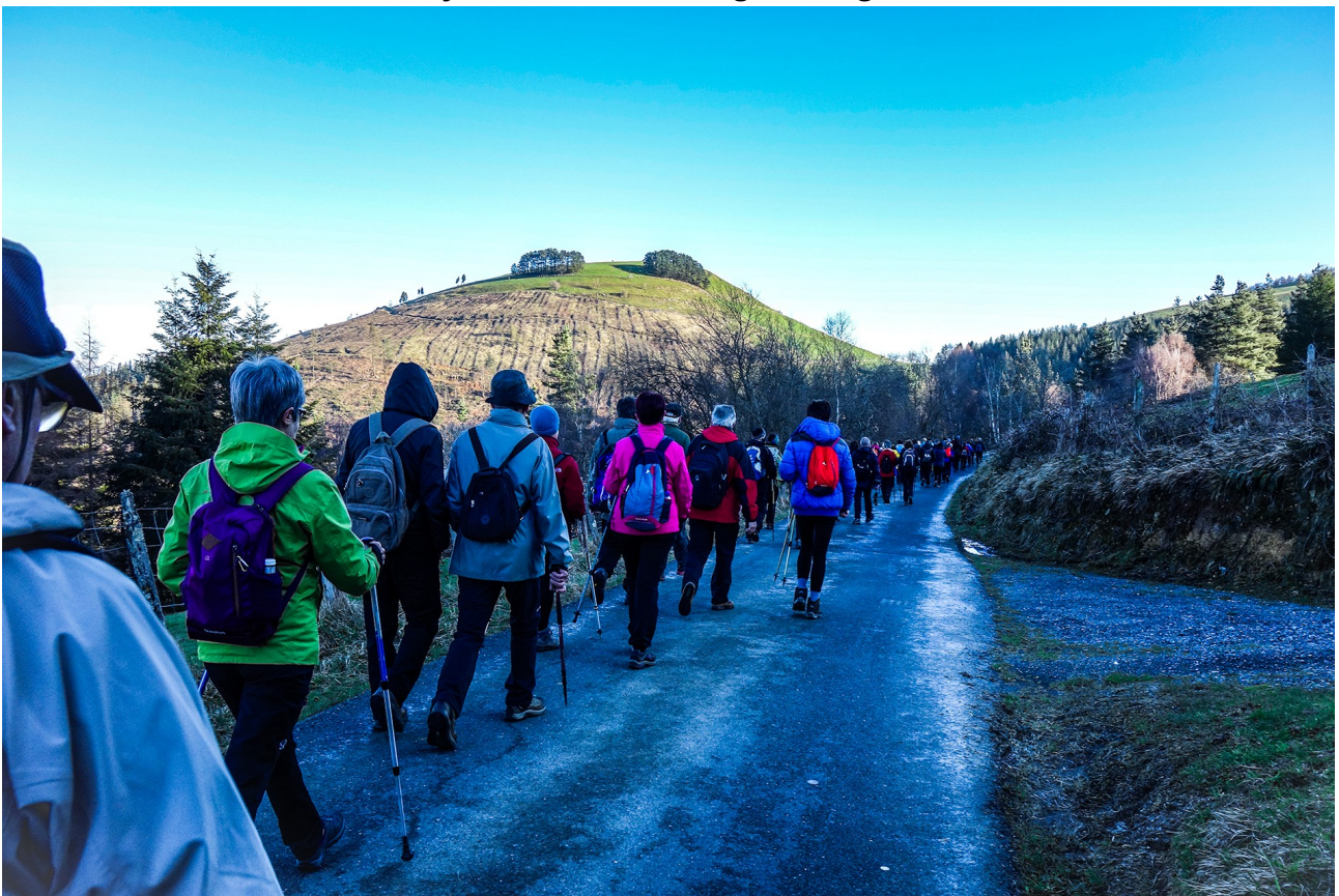
Hondo-hondoan Atxuri mendia