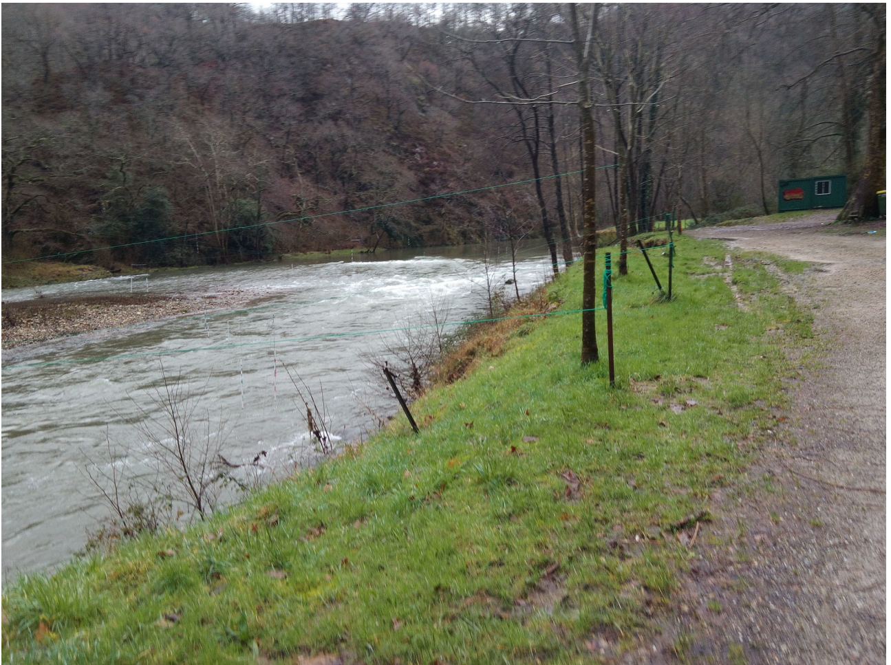
Santiagotarrak taldeko piraguisten edo kanoazaleen entrenamendu eremua