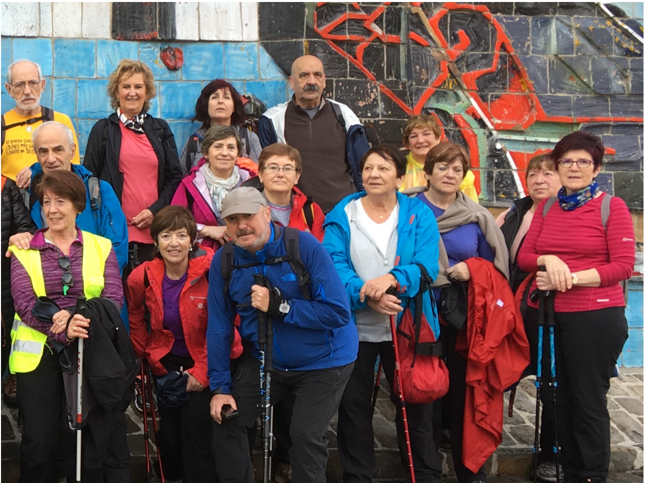
Taldearen bigarren erdia Zumetaren lanaren aurrean