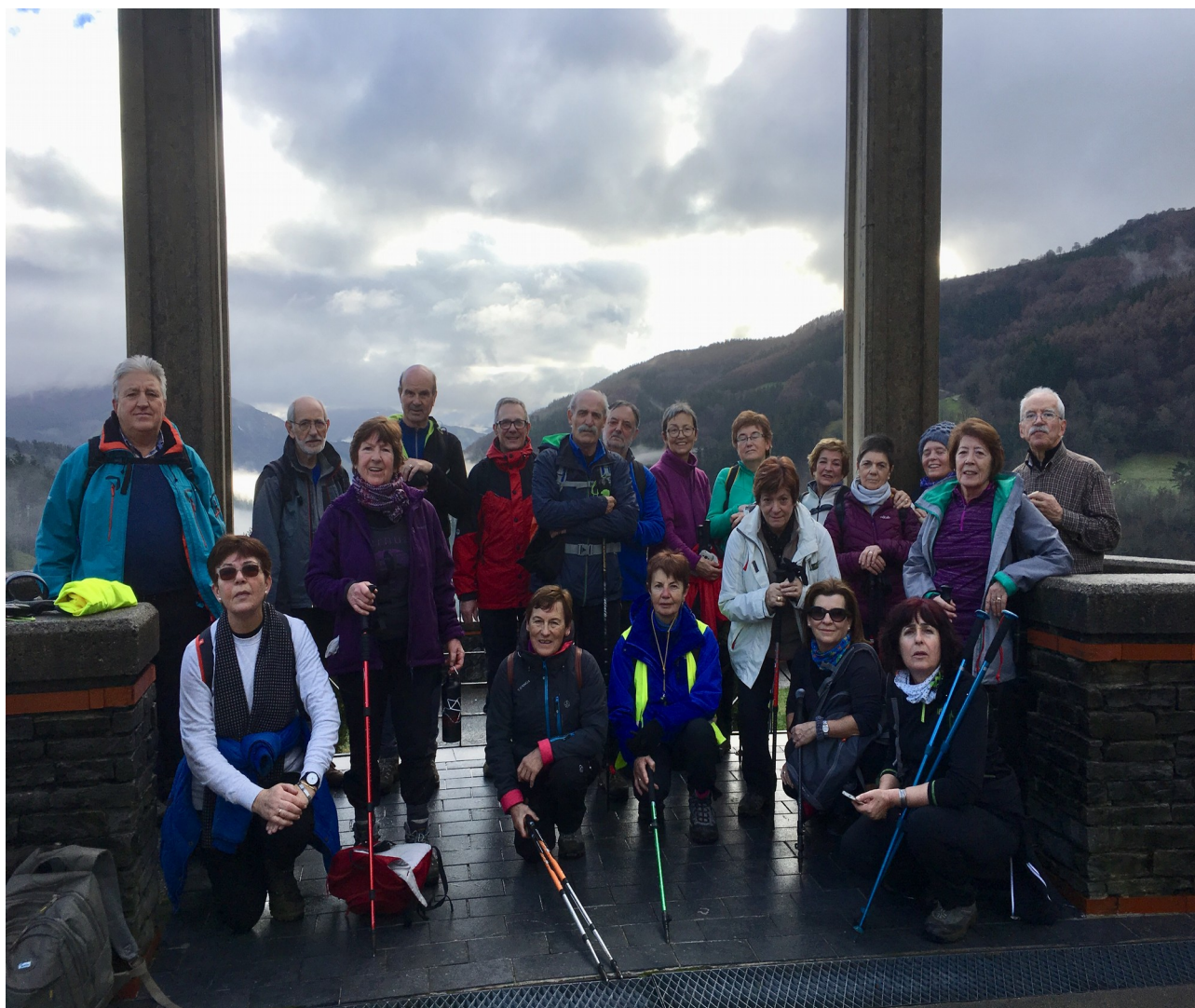
Alkizako begiratokian ibiltariok paisaiaz gozaten