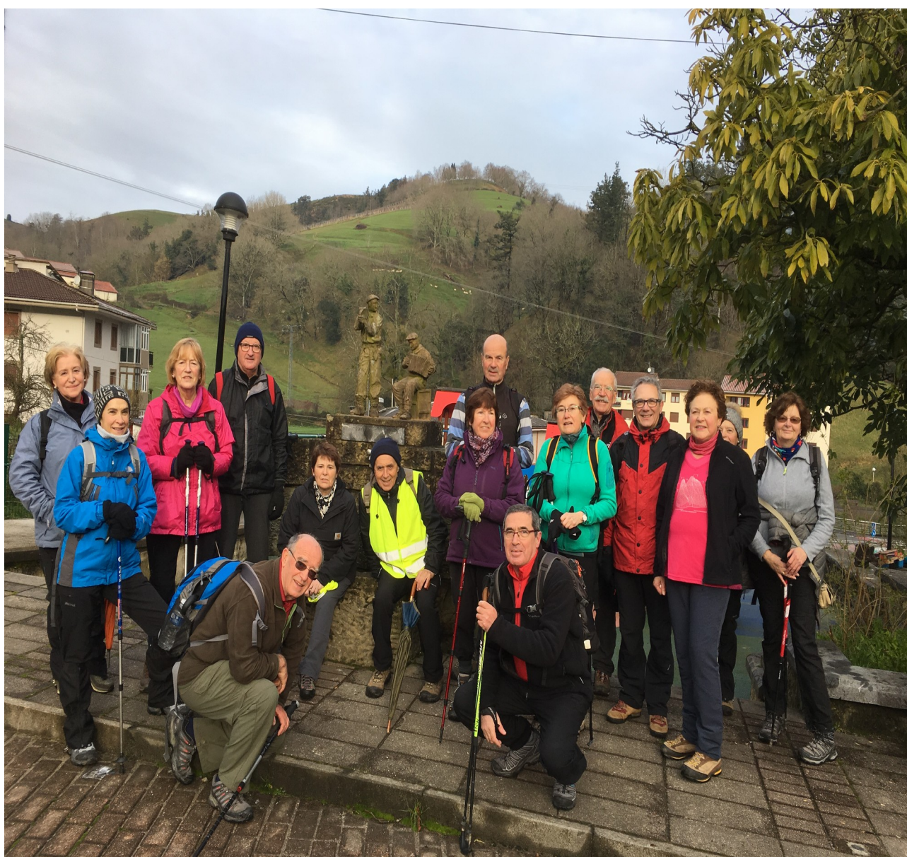
Andatzan edo Aiako San Pedro auzoan, trikikitilarien oroigarria atzean dugula