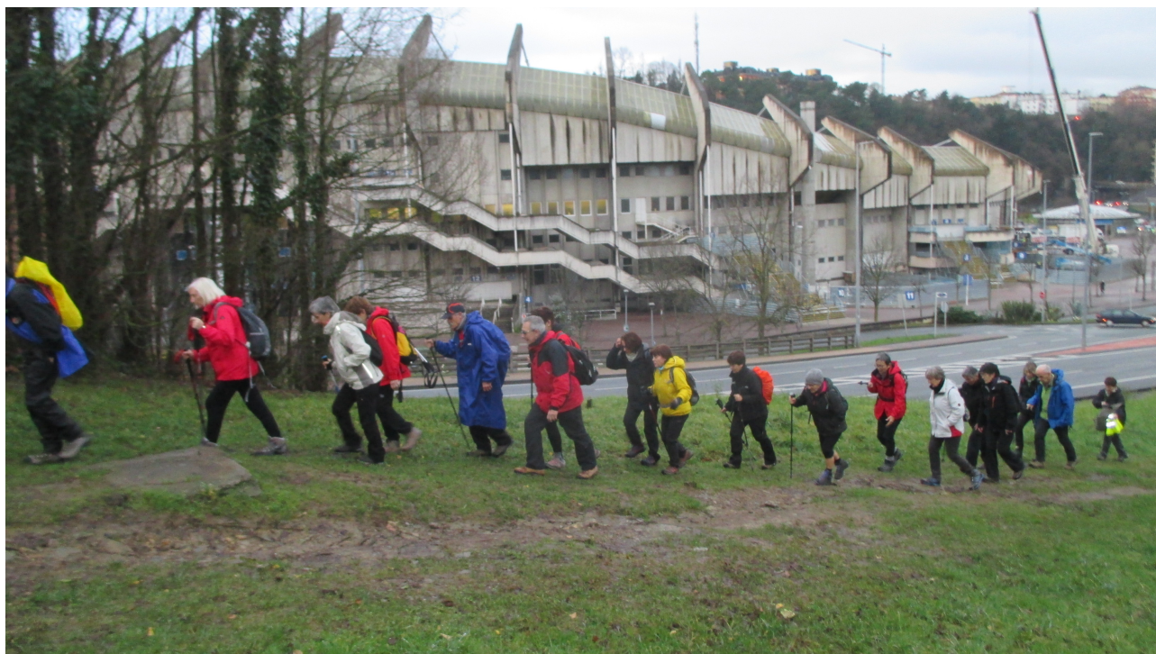
Ibiltariak Zorroagako bidean, ibilbideari hasiera emanez