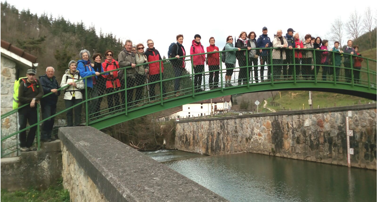
Taldea Agauntza ibaiaren zubi batean, Ataunen