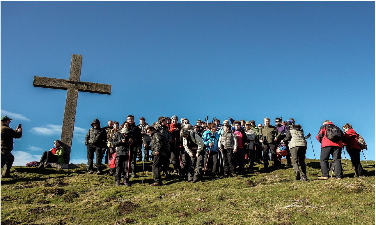
Otarre mendiaren gailurrean, haize minaren babesean