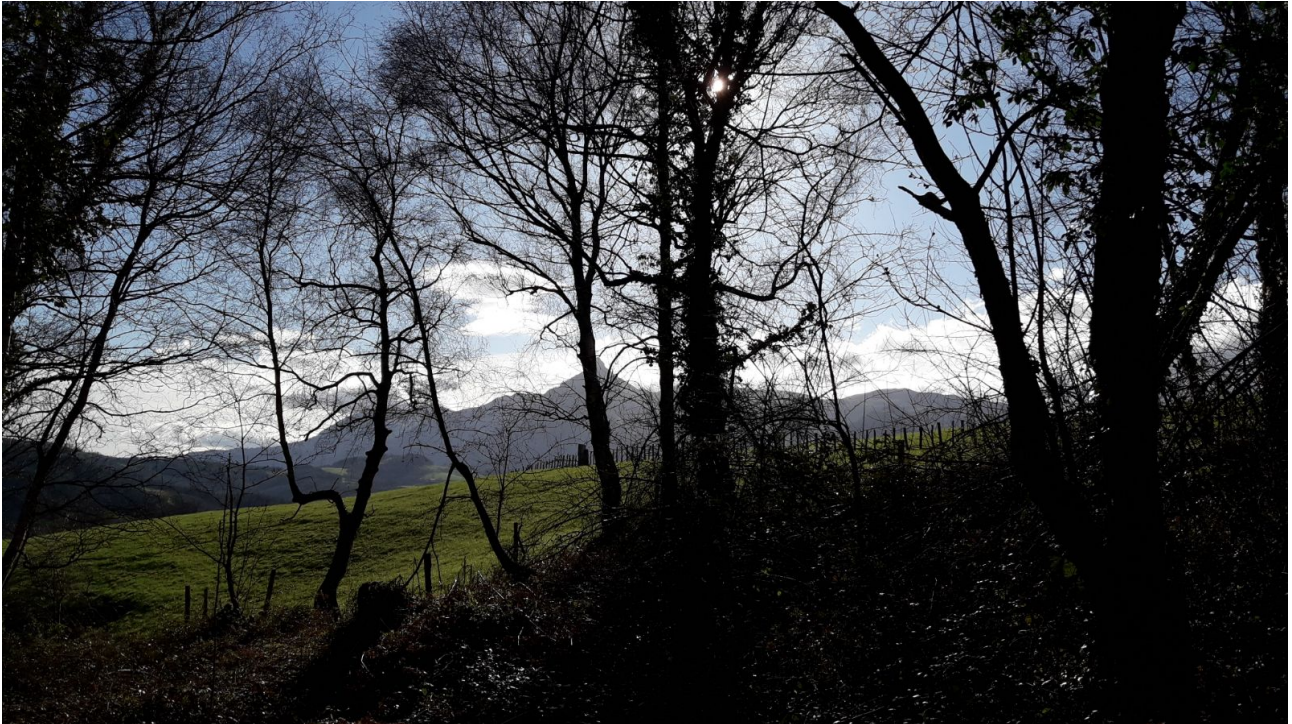
Ibilaldiko paisaia, une batzuetan lanbrotsua eta bestetan irekia