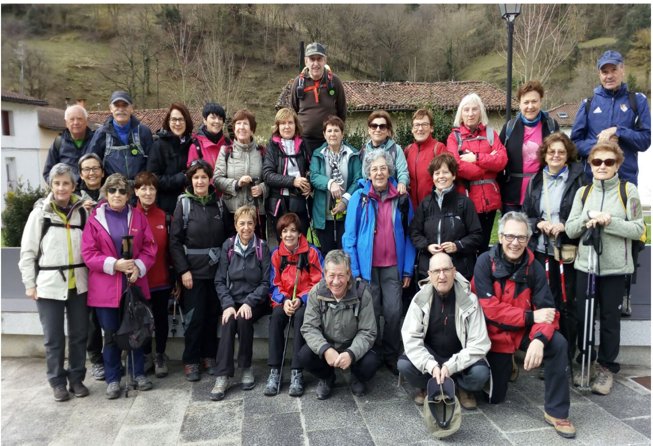
Ataungo plaza batean partaide guztiak, argazkilaria izan ezik