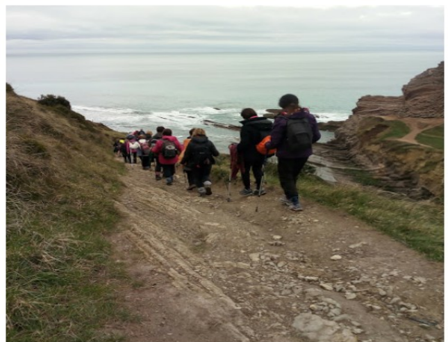
Elorriaga auzoko ingurunea eta Telmo Deumerantz jaisten