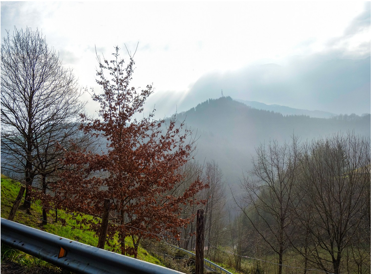
Aldaba Txikiko bidean, kolore aniztun tropela banan-banan doalaLainoak, hondo-hondoan, ez digu Txindoki ikusten Madariaga-Otarre-Madariaga (2018-03-02)