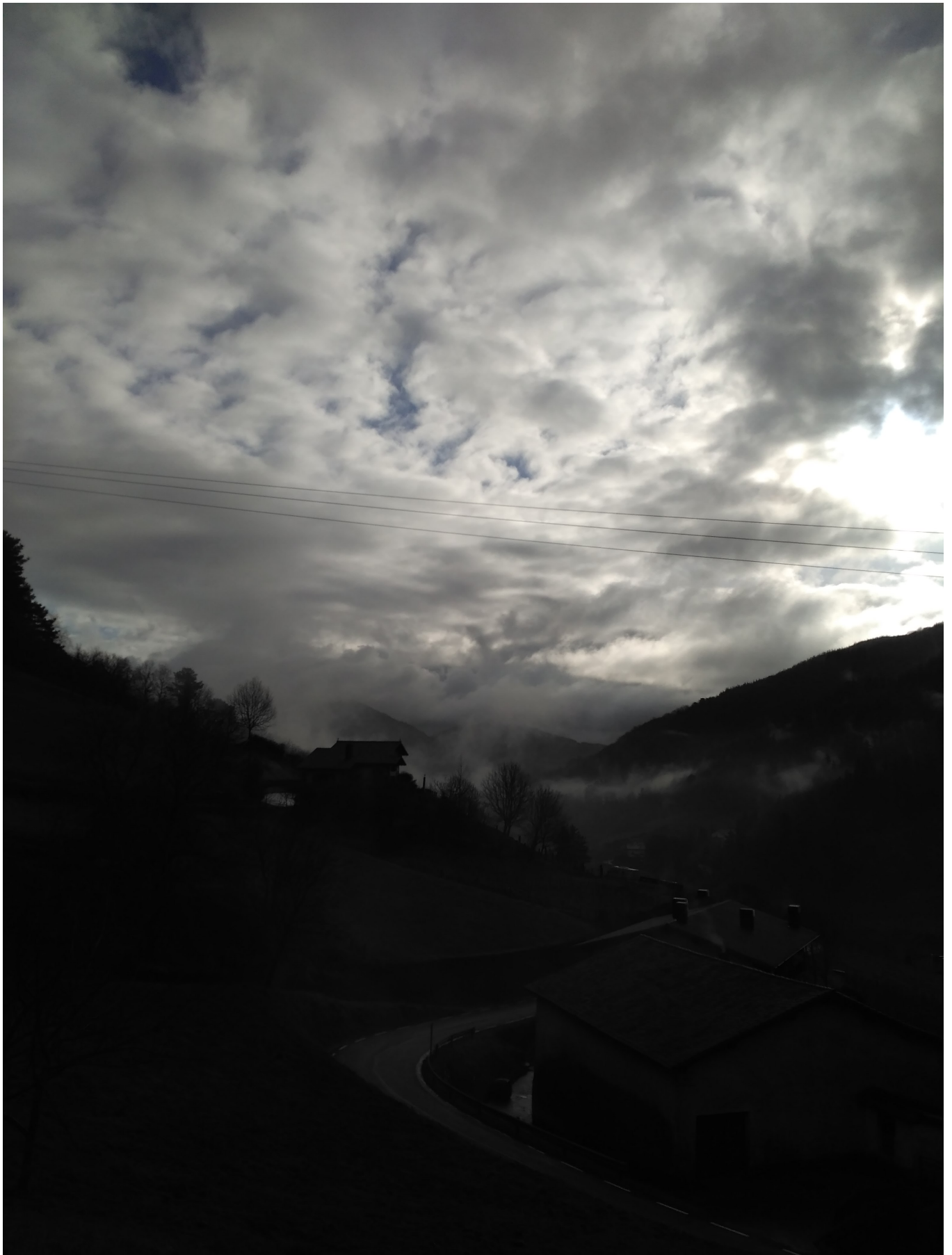
Errepidea utzi eta Alkizara doan bidezidor aldapatsuan gora goaz ibiltariok