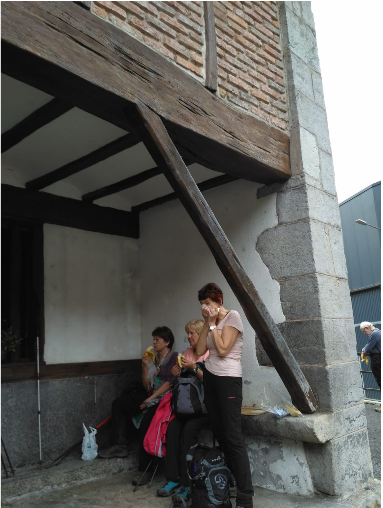
Leku berean, hiru emakume hauek platanoz indarberritzen