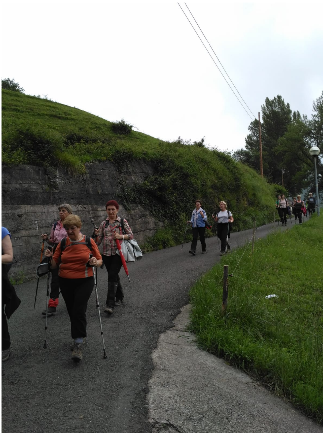
Ibilaldiaren une lasaian, malda behera