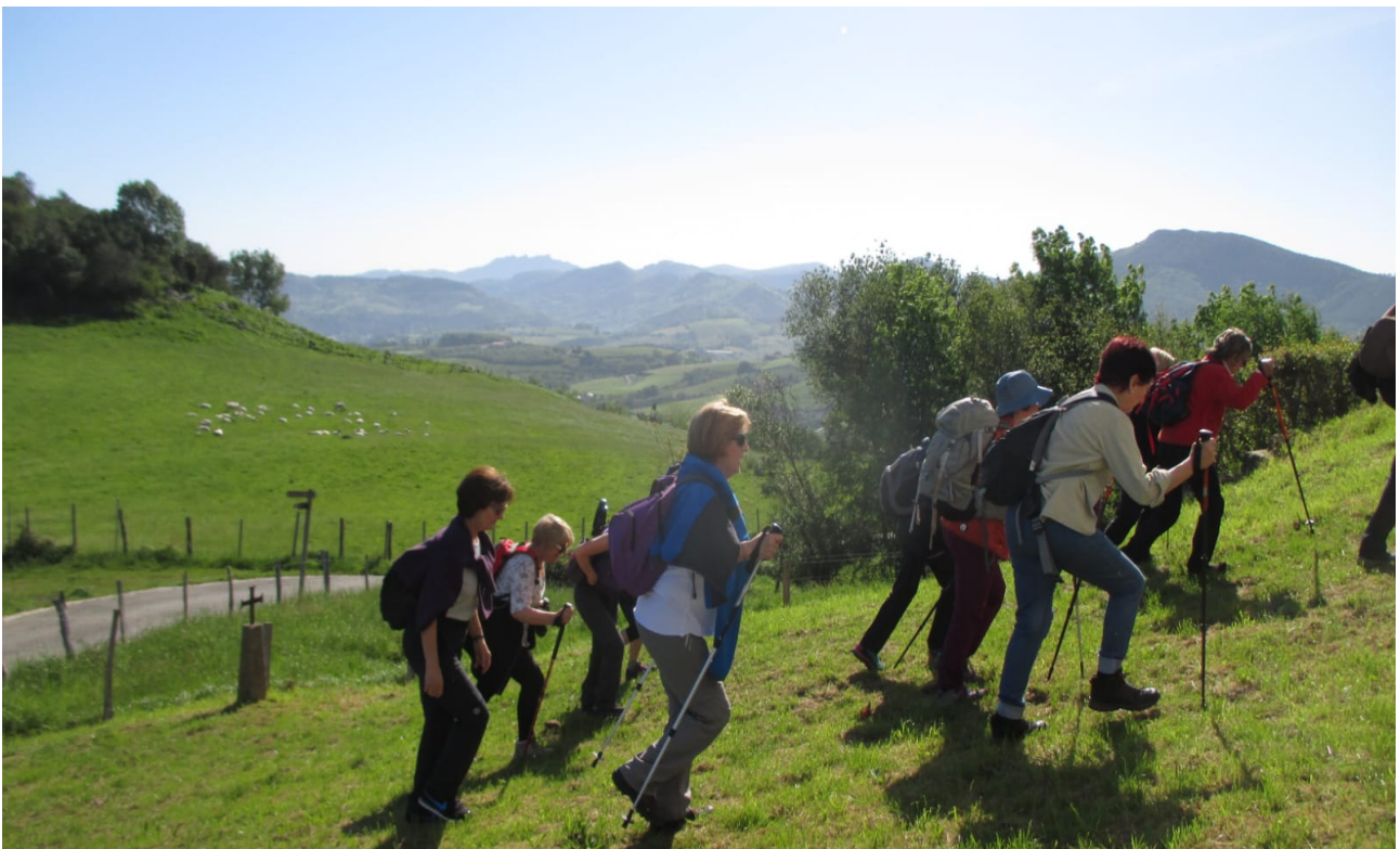
Benetan polita irudia, badirudi lehian dabiltzala