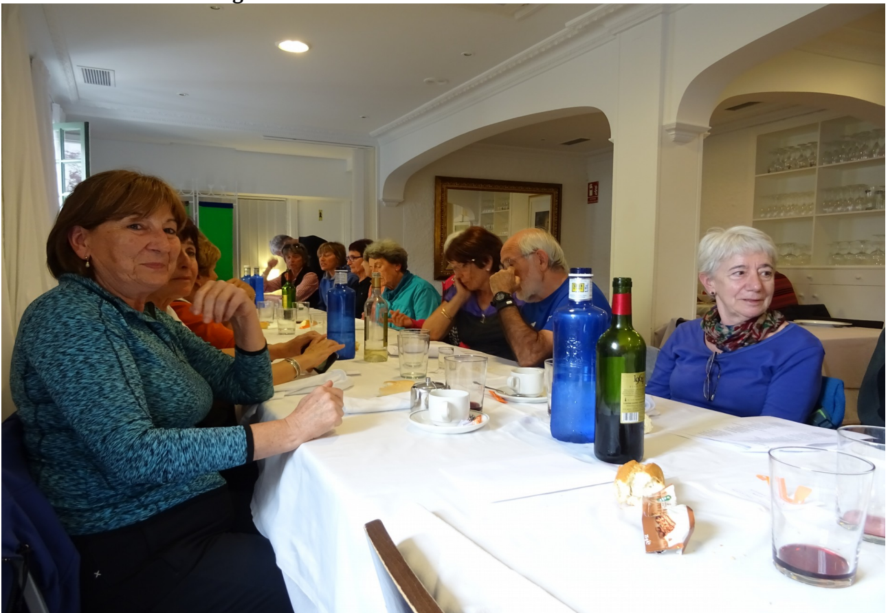
Lasai asko dago jendea bazkaldu ondoren