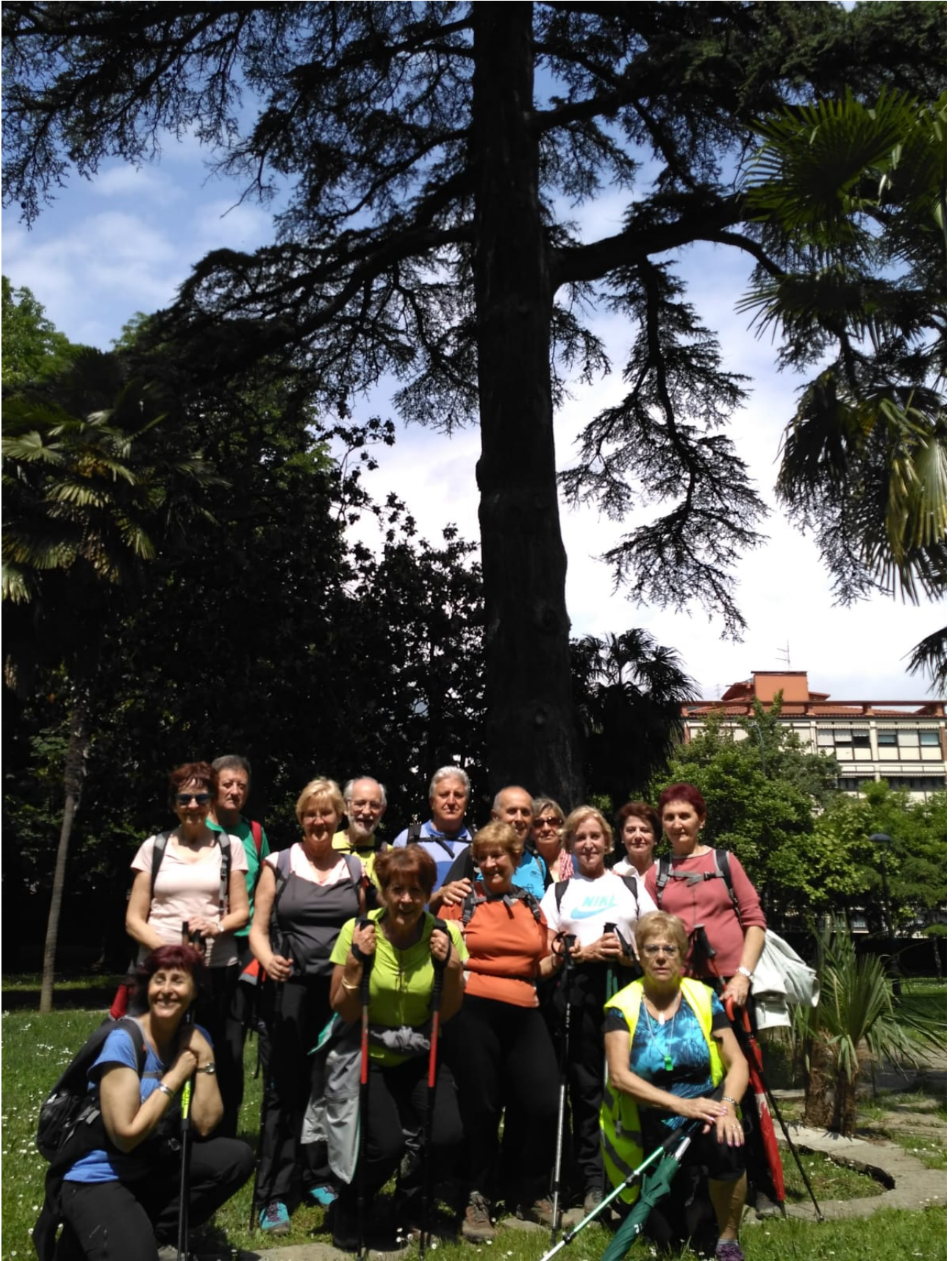
Ibilaldia amaitzear dagoela, taldearen argazkia