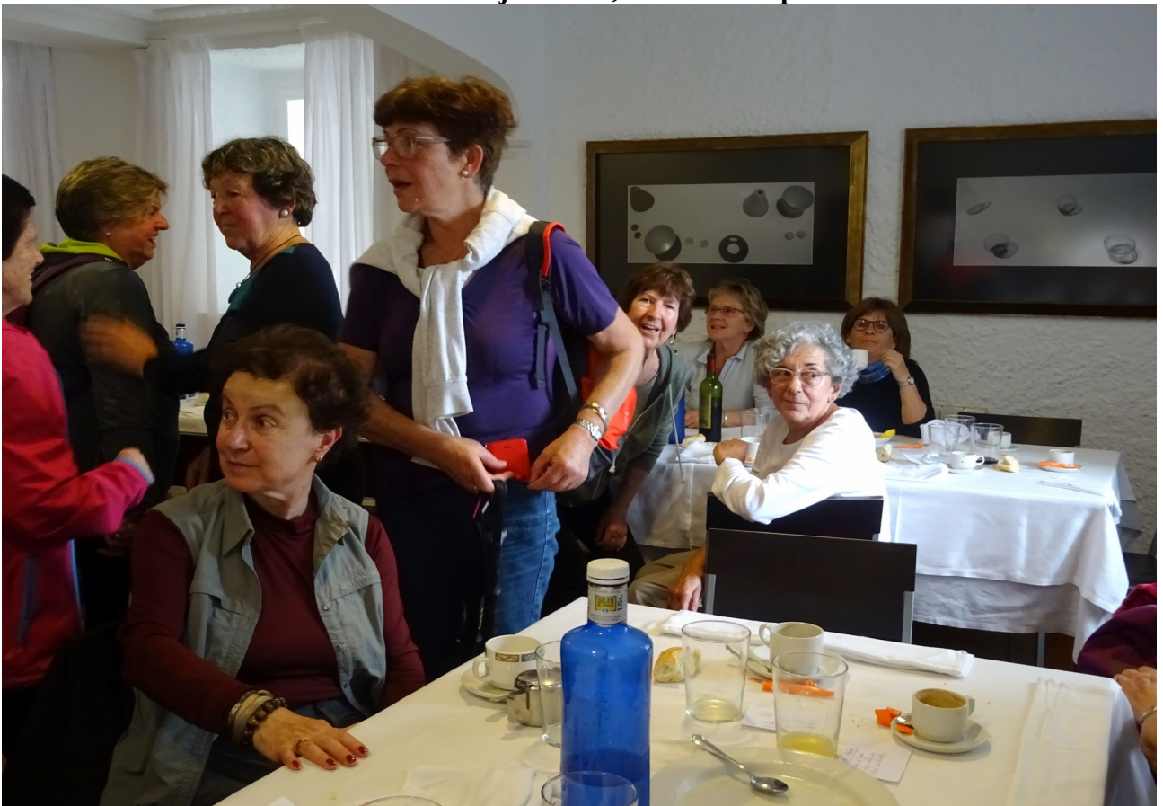
eta bazkaldu ondoren