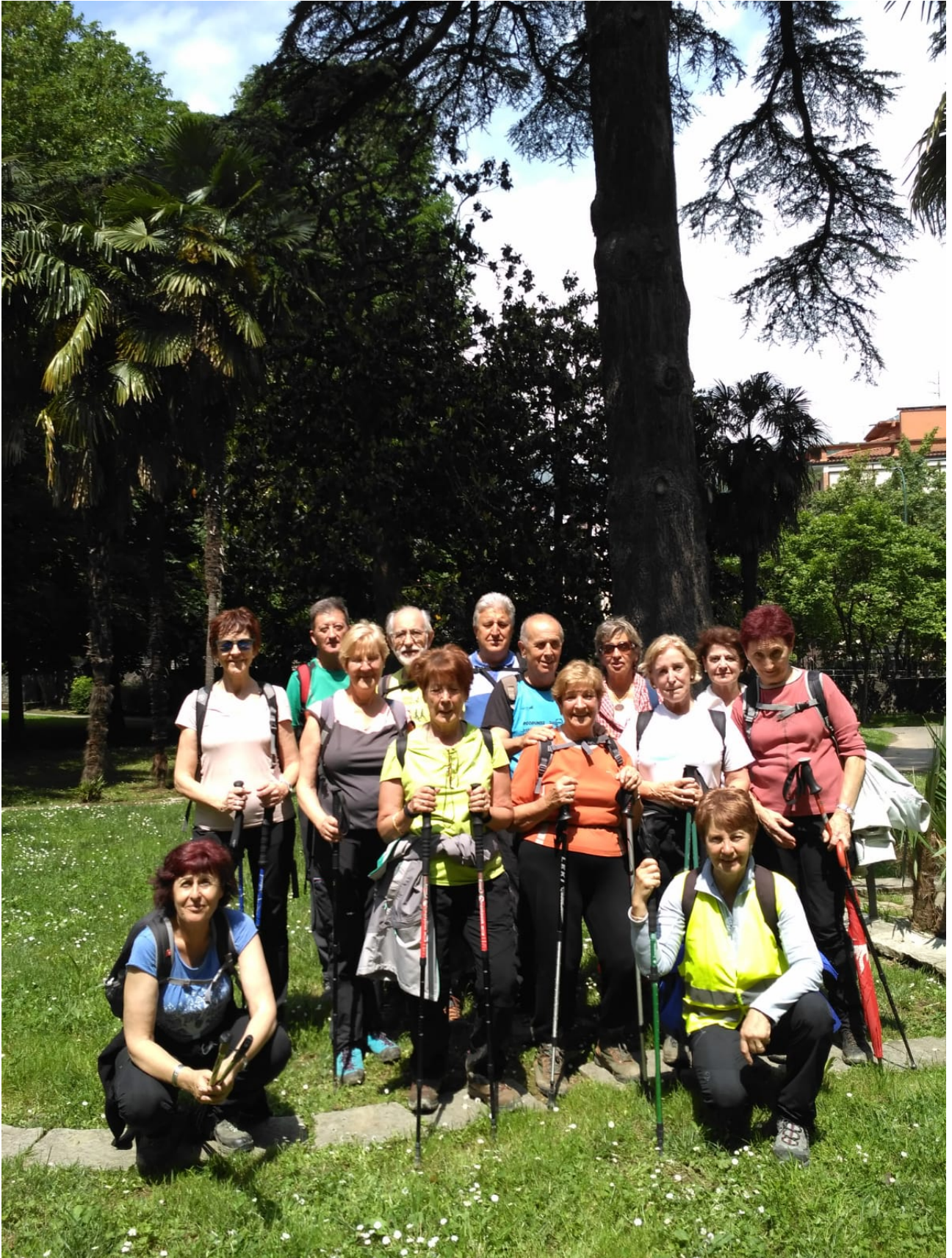
Leku berean, baina aitzindaria aginte makila eta guzti