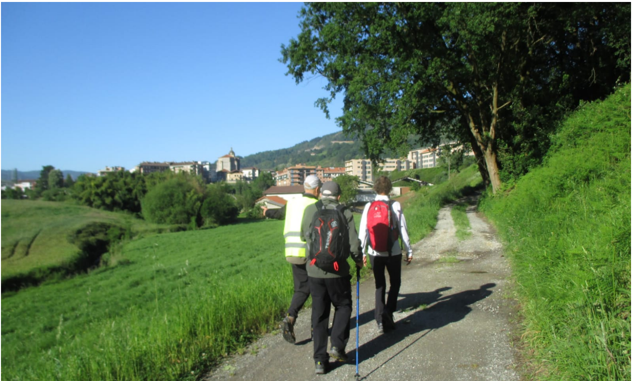
Lasarte hurbil dute hauek eta hamaiketakoa egiteko amorratzen dira