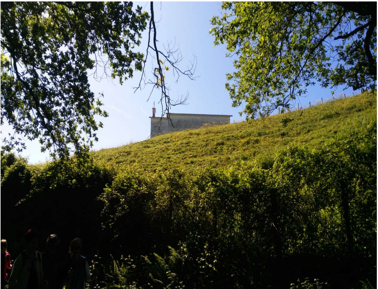
Estatuaren erdialdean hartuko lukete honelako berdegunea