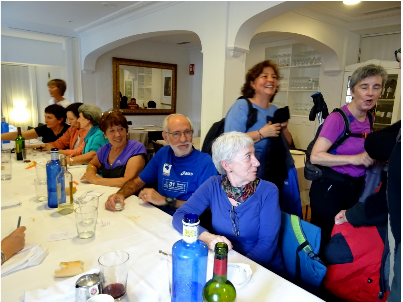
Azkoitiko Iturri jatetxean, bazkaltzeko prest...