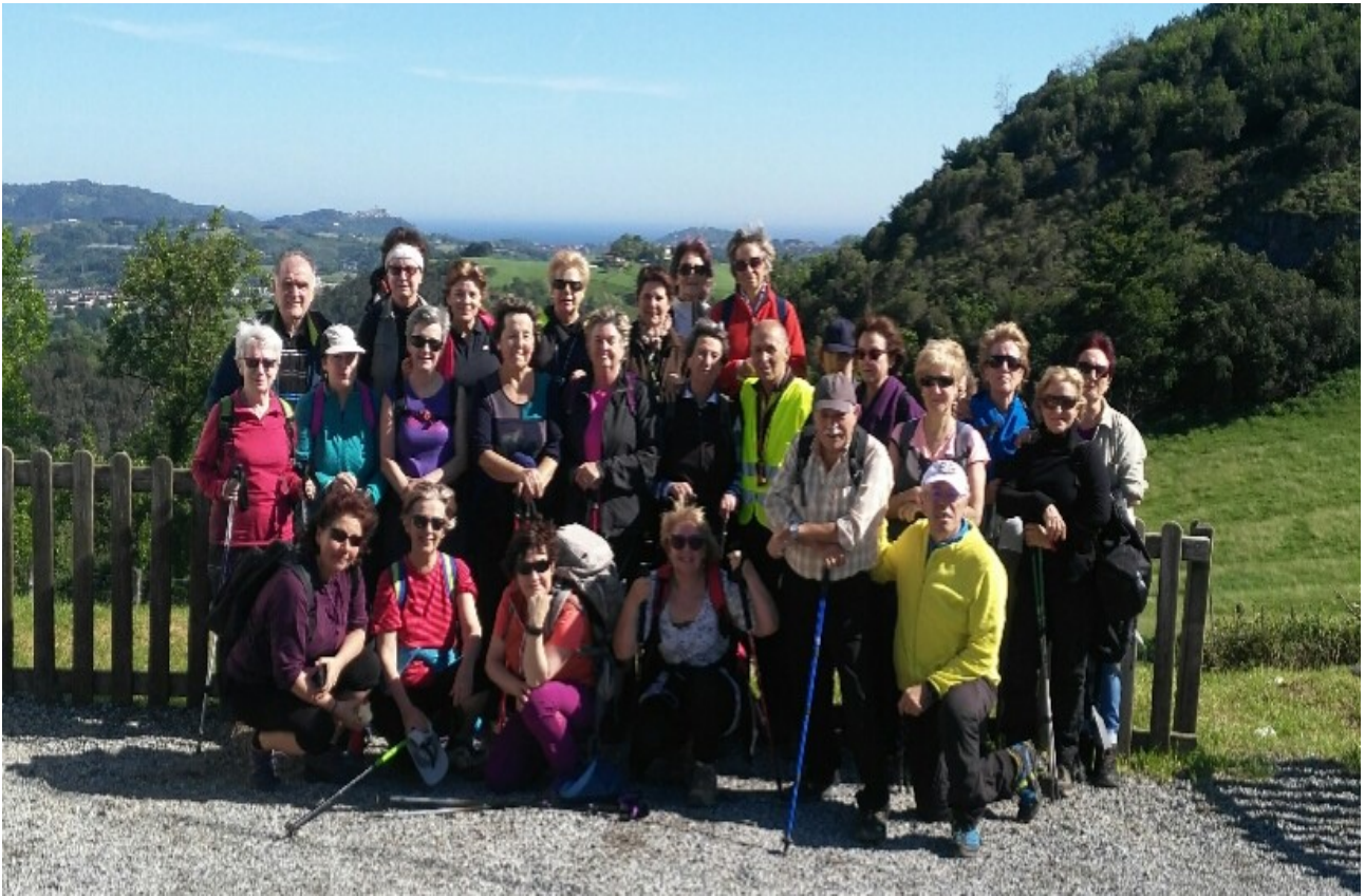
Aita-semeak tabernan daude, ama-alabak mendian...