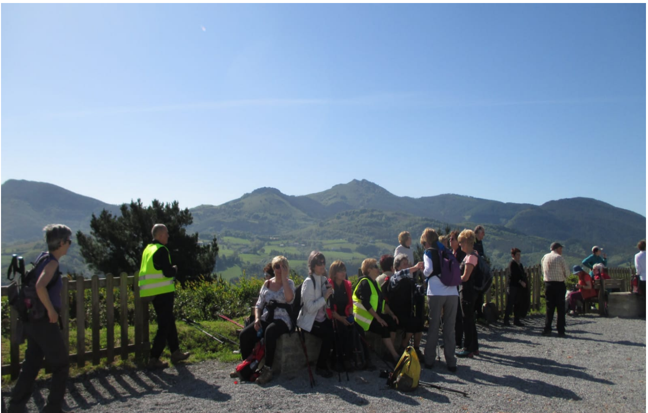
Beste atsedenaldia; bitxi samarra inork ez janzteia praka motzak horrelako eguraldiarekin