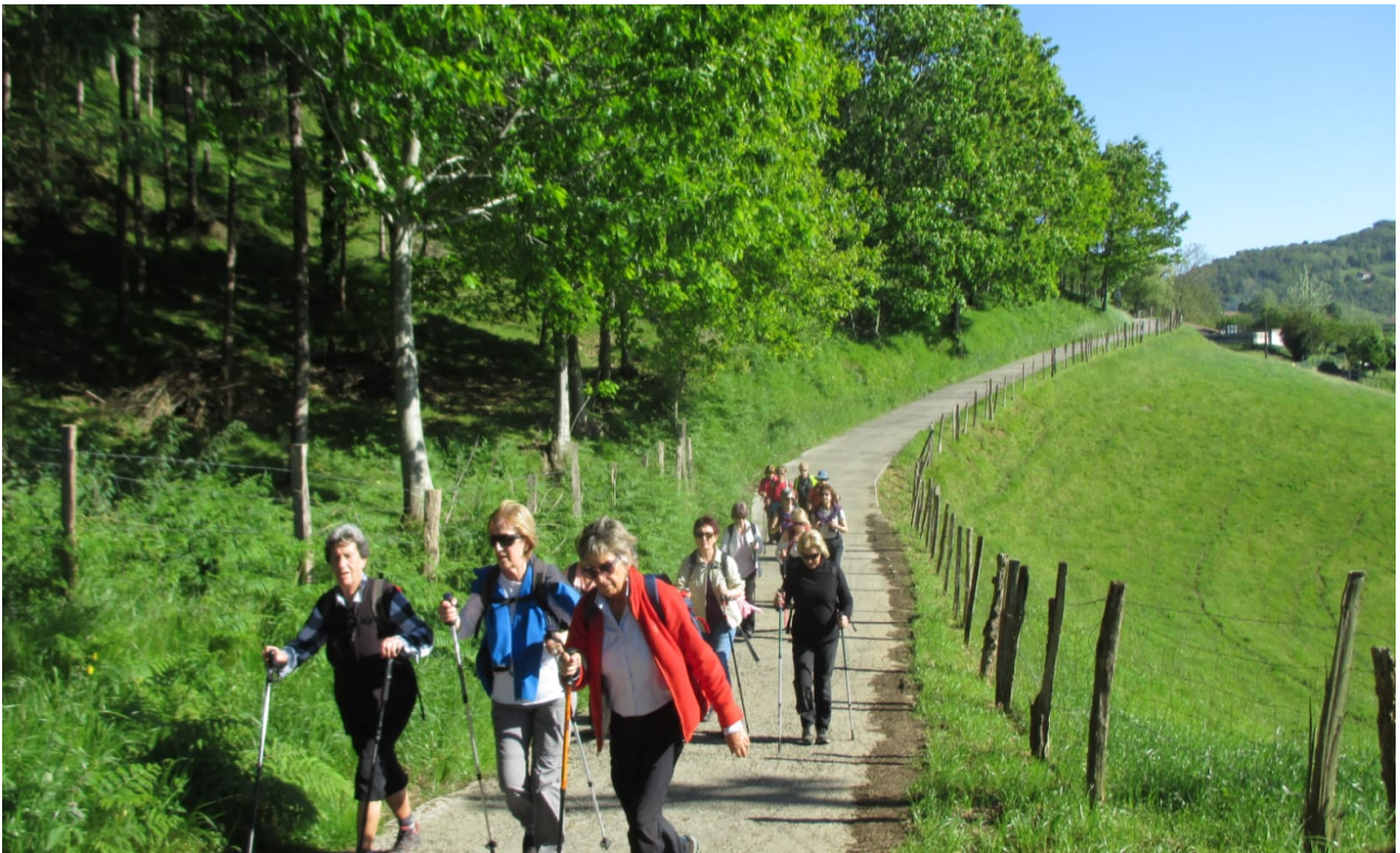
Pilartxo eta pelotoik tiratzen, erritmoa markatzen