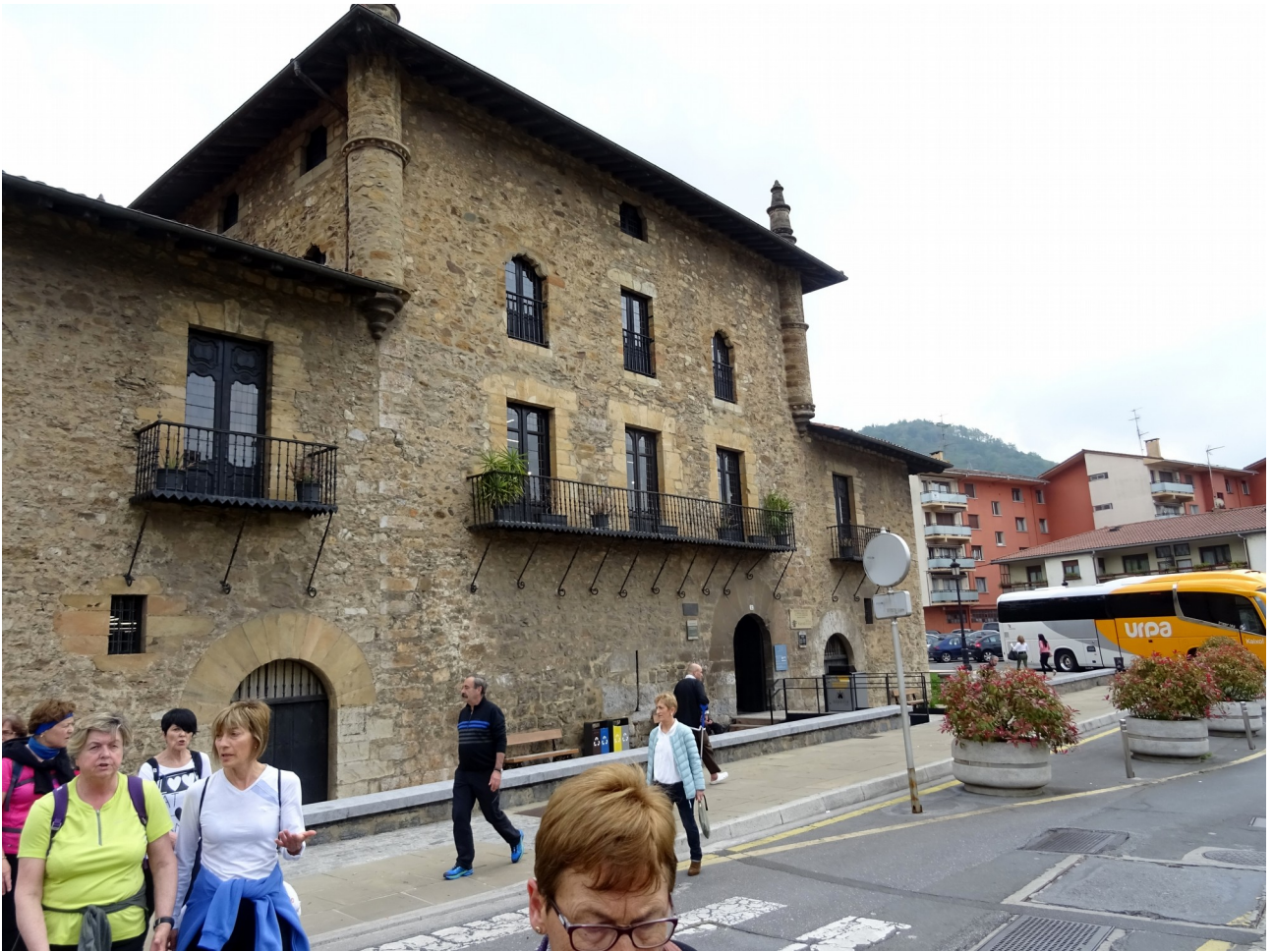
Azpeitiko etxekapare bat