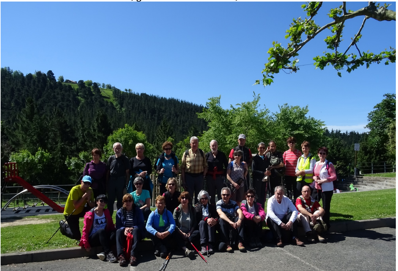
Galdonamendin, taldearen argazkia