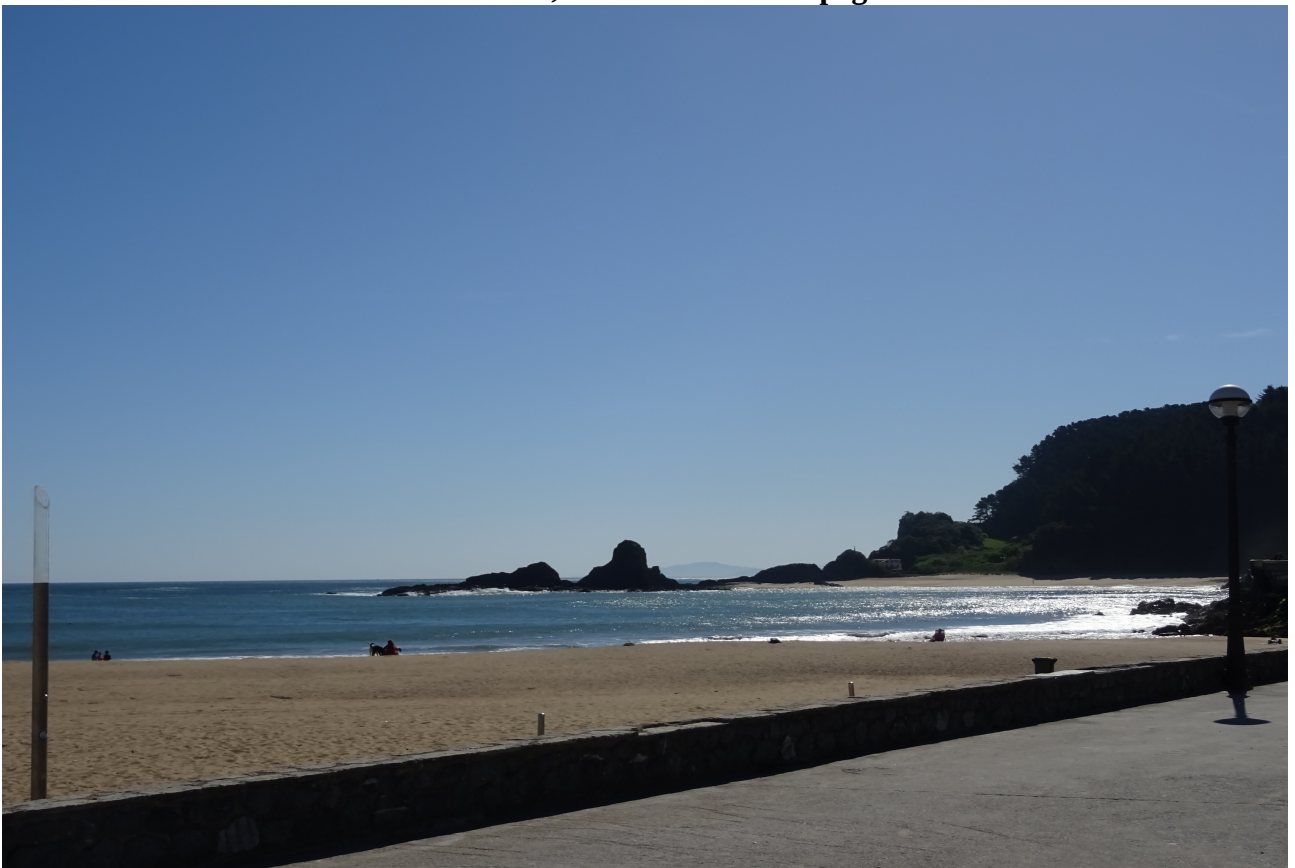
Saturraran, hondartza eta Satur eta Aran harkaitzak