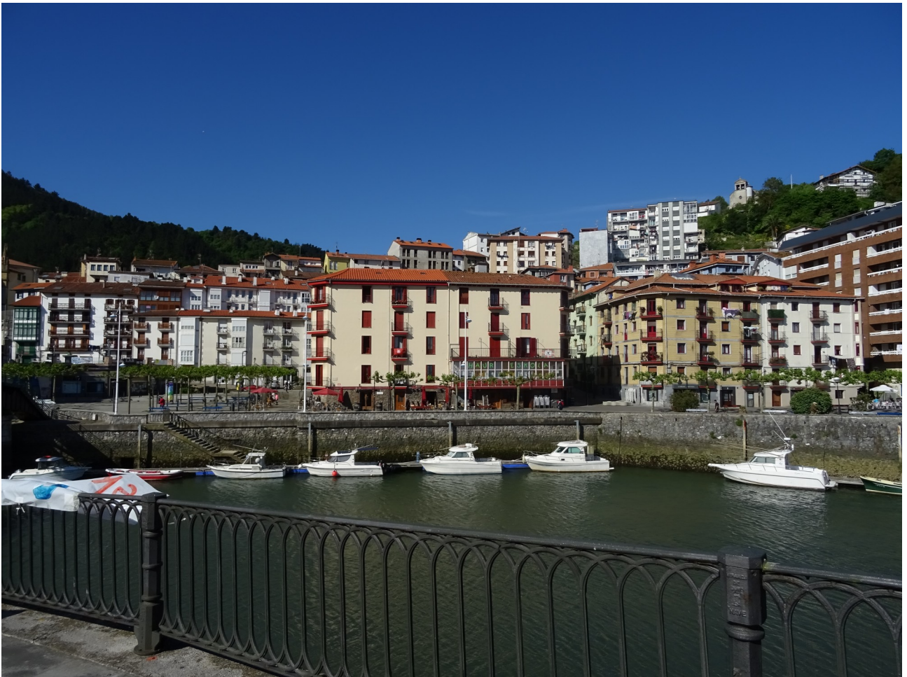
Ondarroako kai zaharra