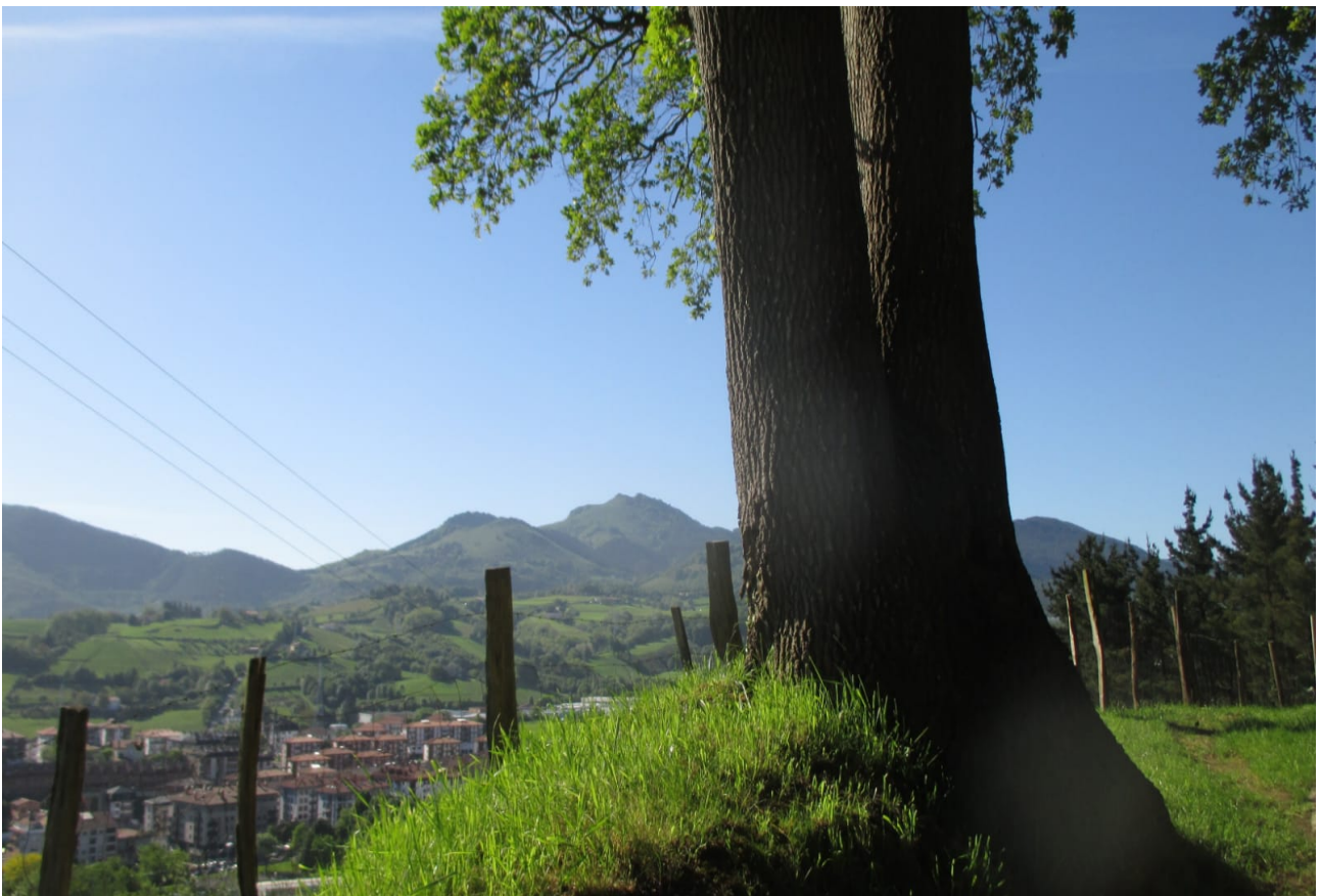
Lasarte behealdean, natura ederraren artean