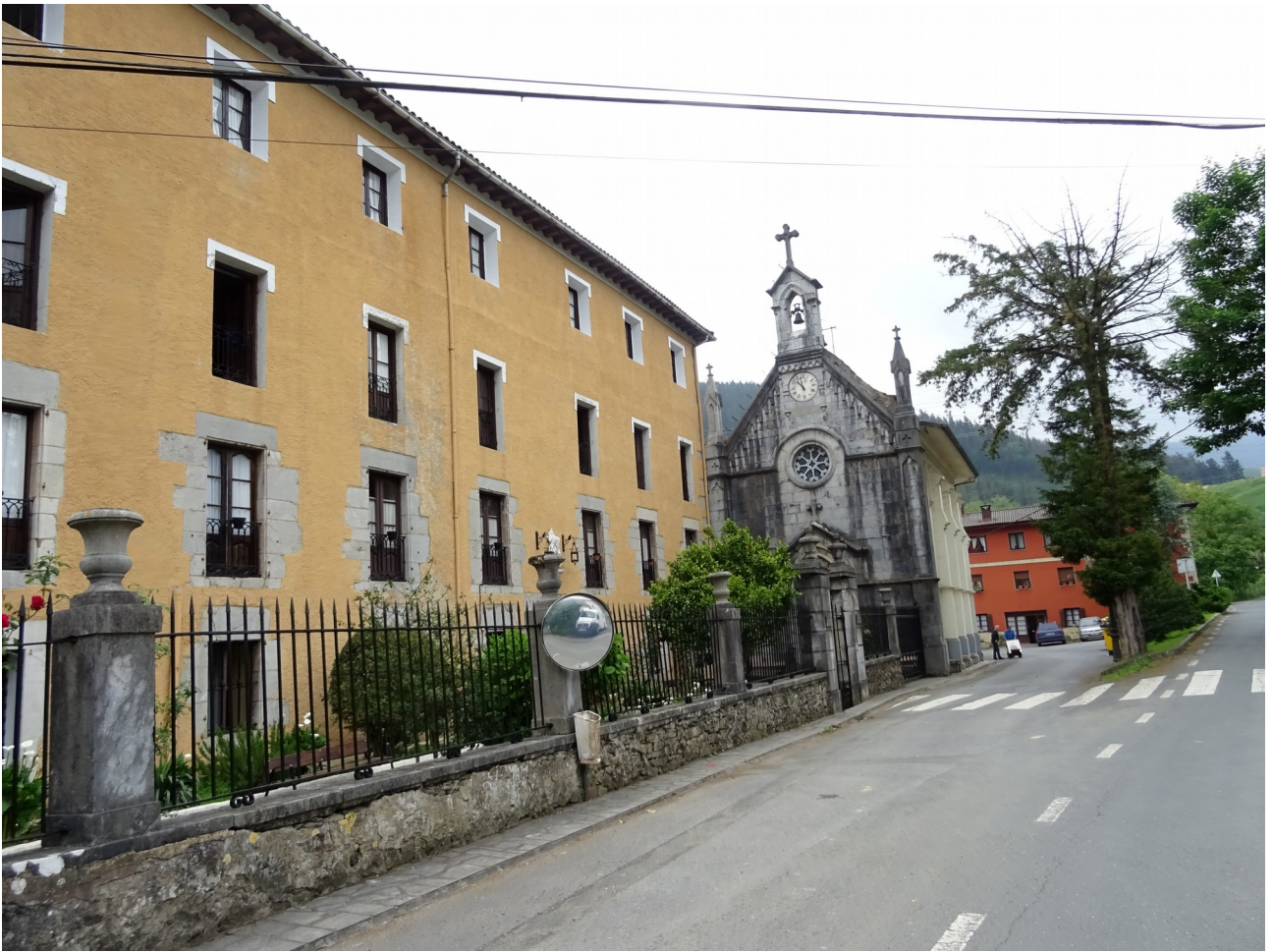
Lasao auzoa eta bertako eliza