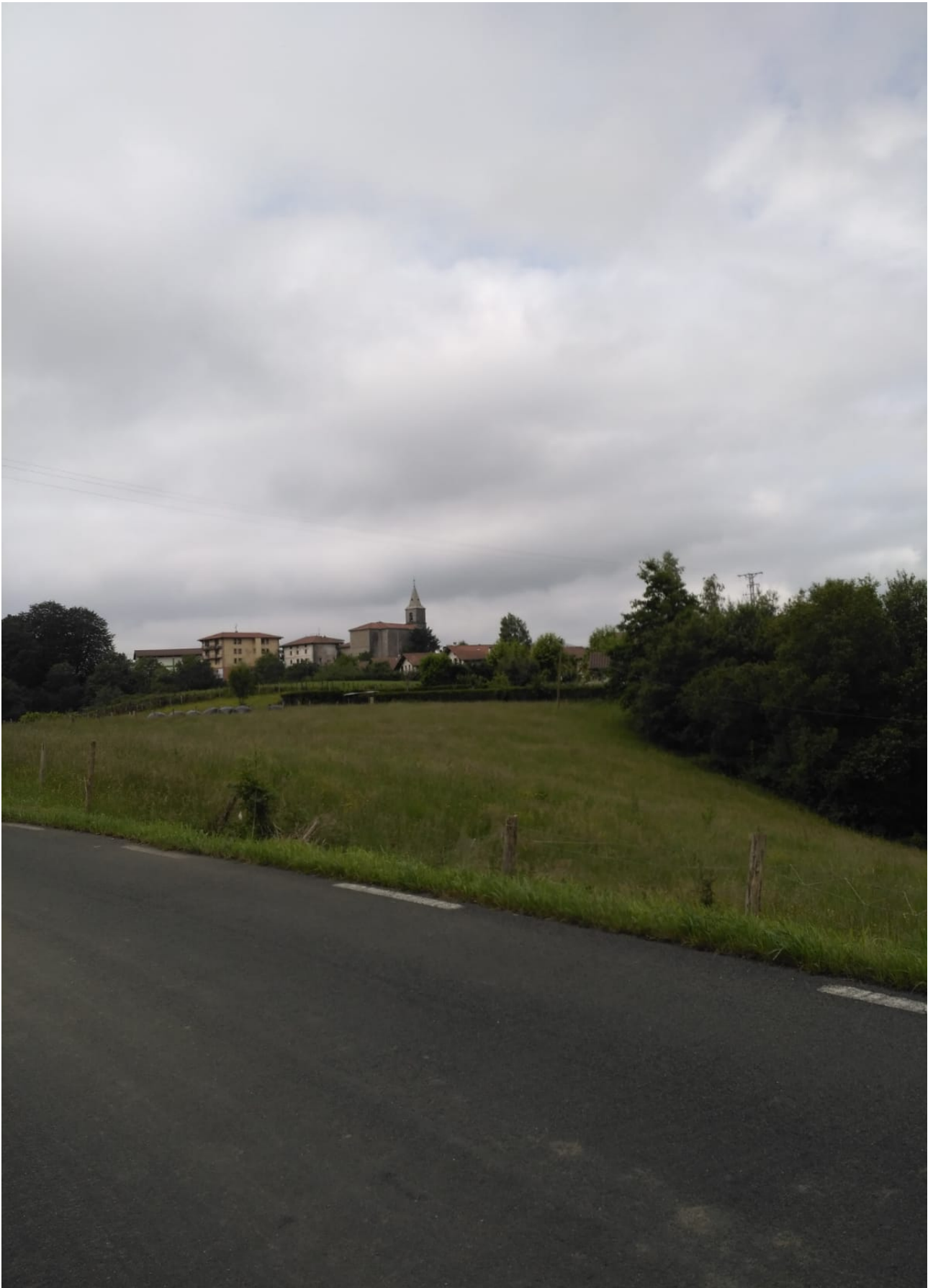
Leaburu herria mendi gainean