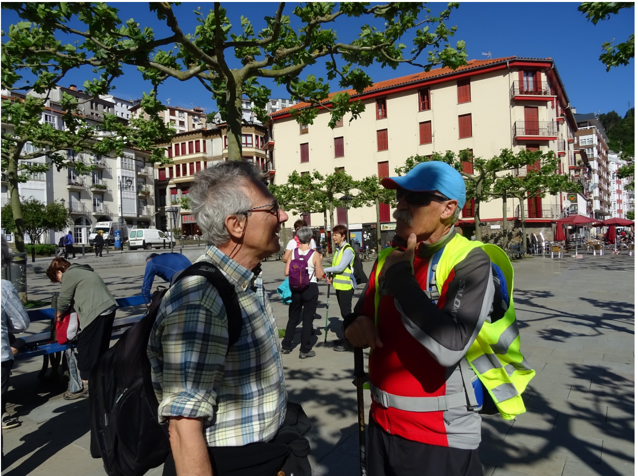
Ondarroan gaude. Bi berriketari hauetatik nork entzuten ote du?