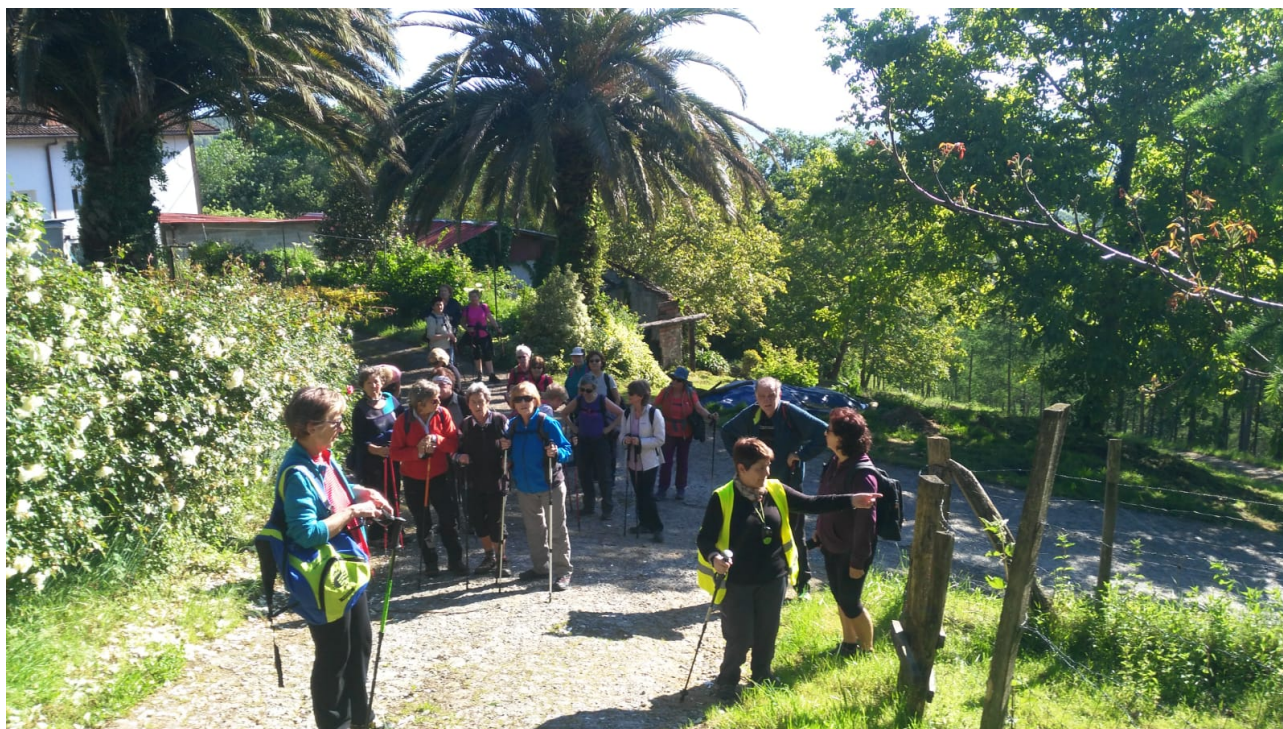
Gidaria aginduak ematen