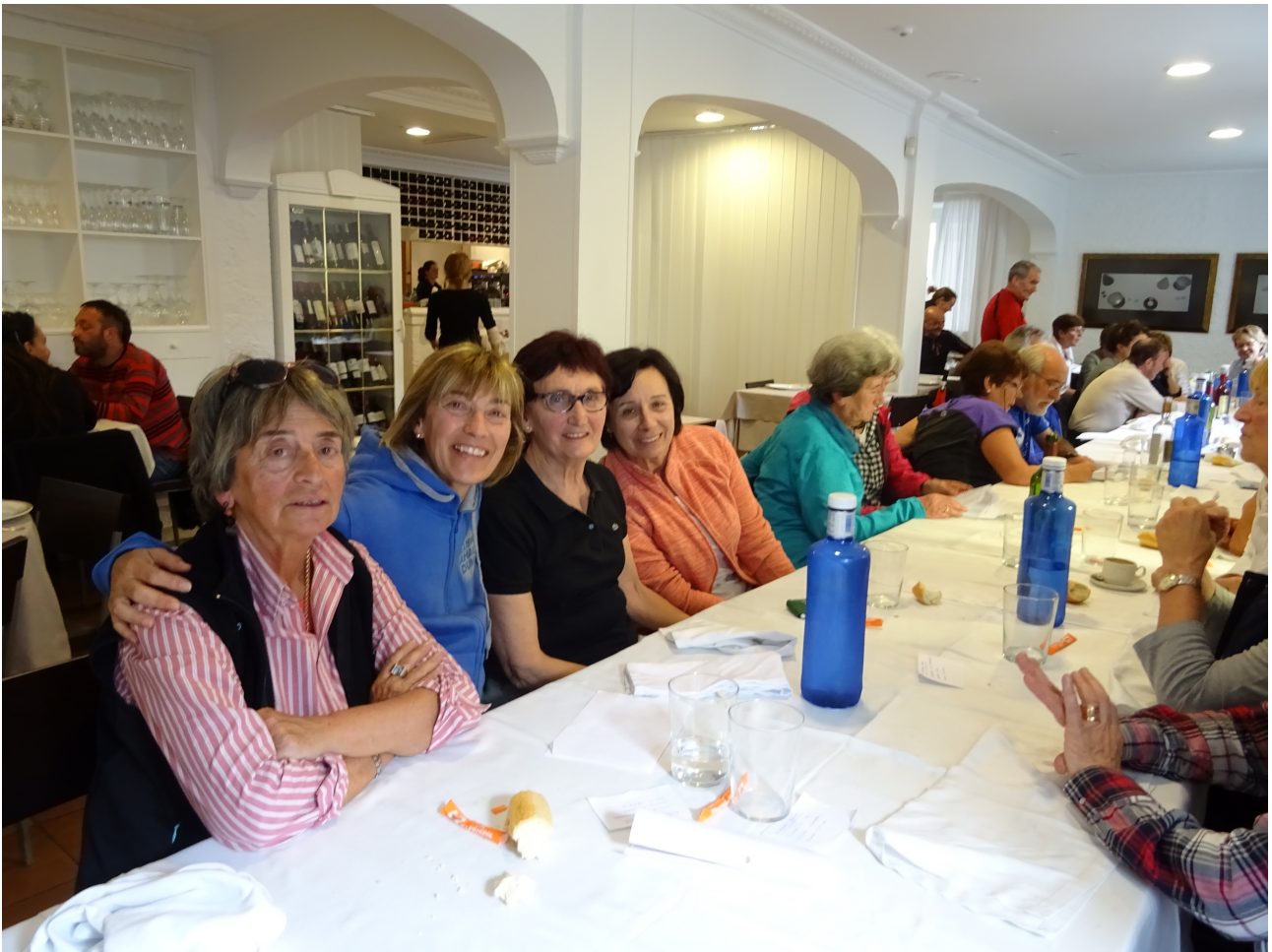
Ondo bazkaldu eta gero jendea pozik edo abesten