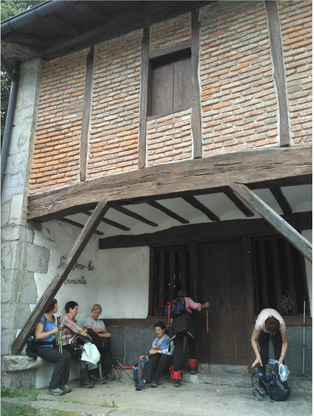
San Jose basilizan, atseden unea