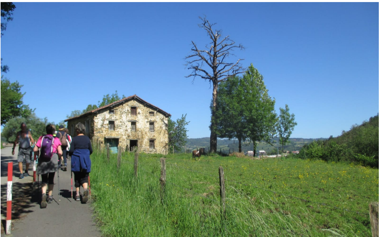
Baserri zaharrek ere zutik diraute