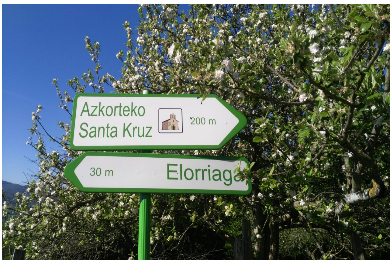
Ibiltariak gida ona du begien aurrean