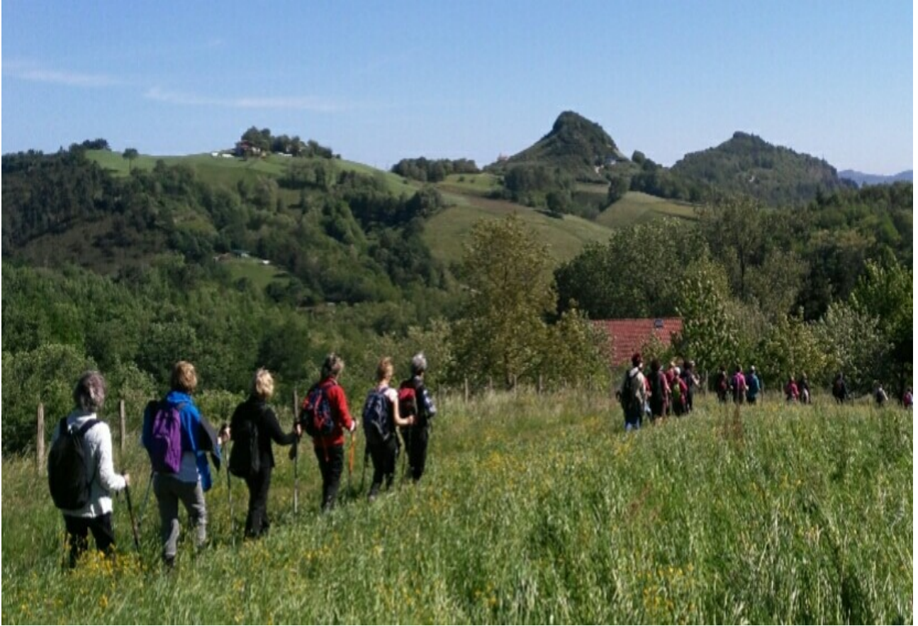
Gazteek badute eredurik hauen artean