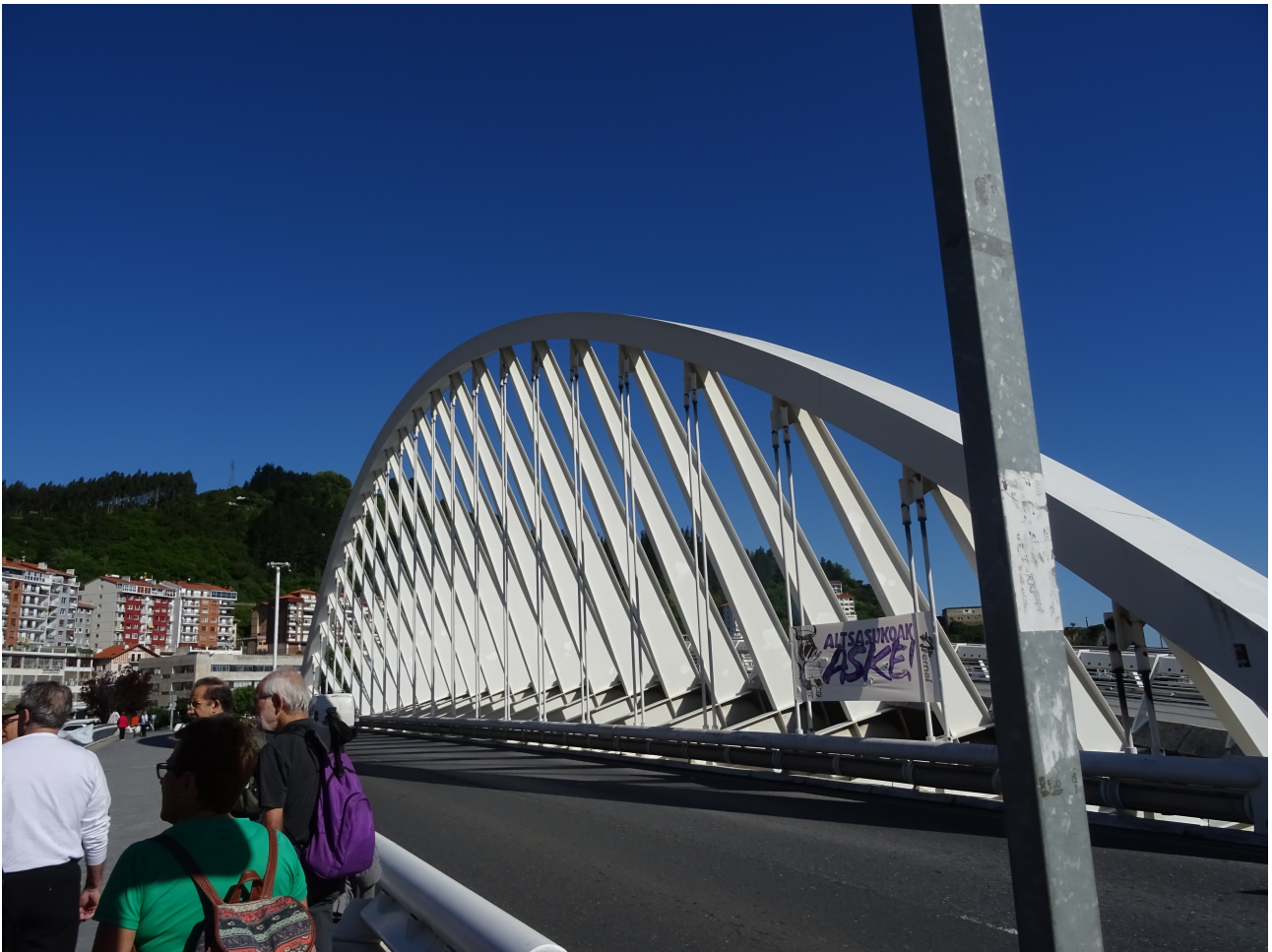
Ibiltariak Ondarroako zubi berriaren ondoan