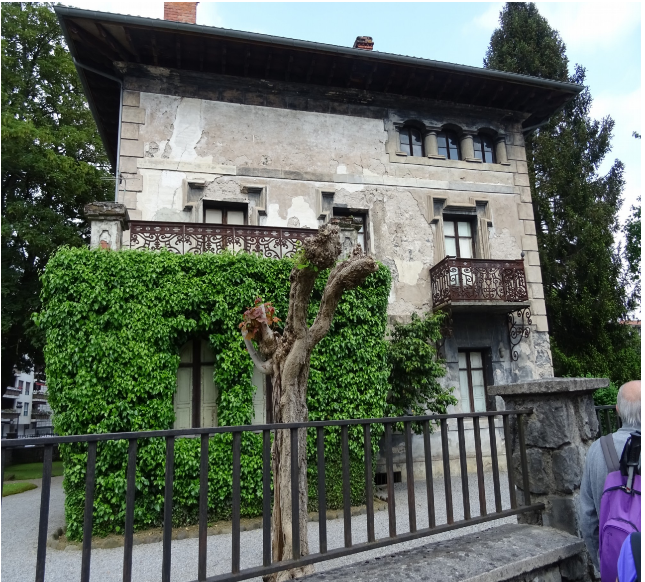
Azkoitiko beste etxekapare bat