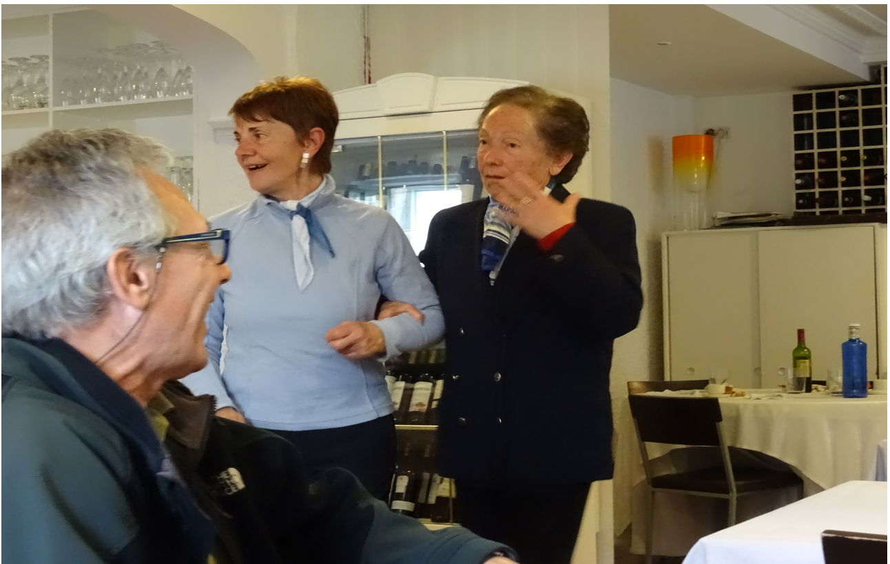
eta karmen adineko herrikide batekin dantza egiten