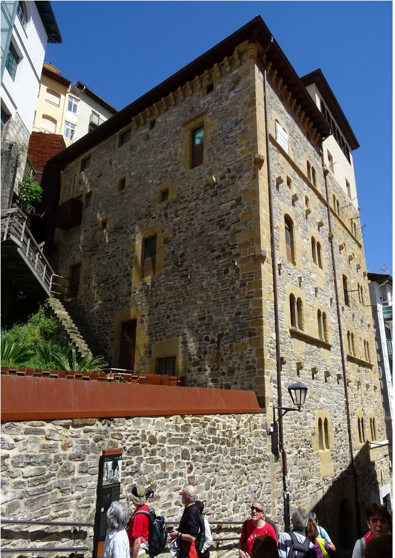
Mutrikuko Berriatua? Dorretxea. Erramuntxok, jada, azalpenak eman dizkigu