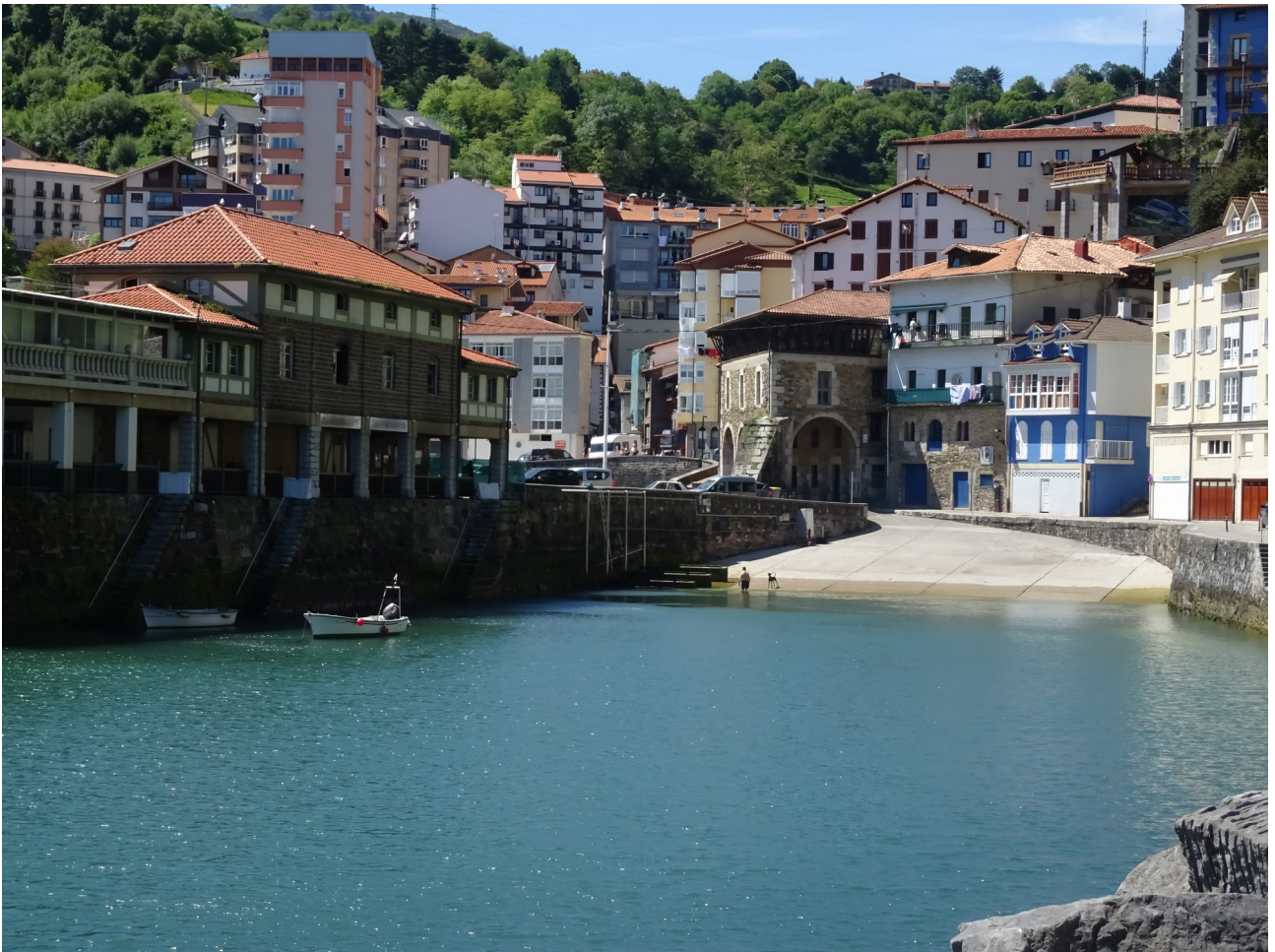
Mutrikuko kaian, gizon bat bainatzea doa, txakurra ondoan duela