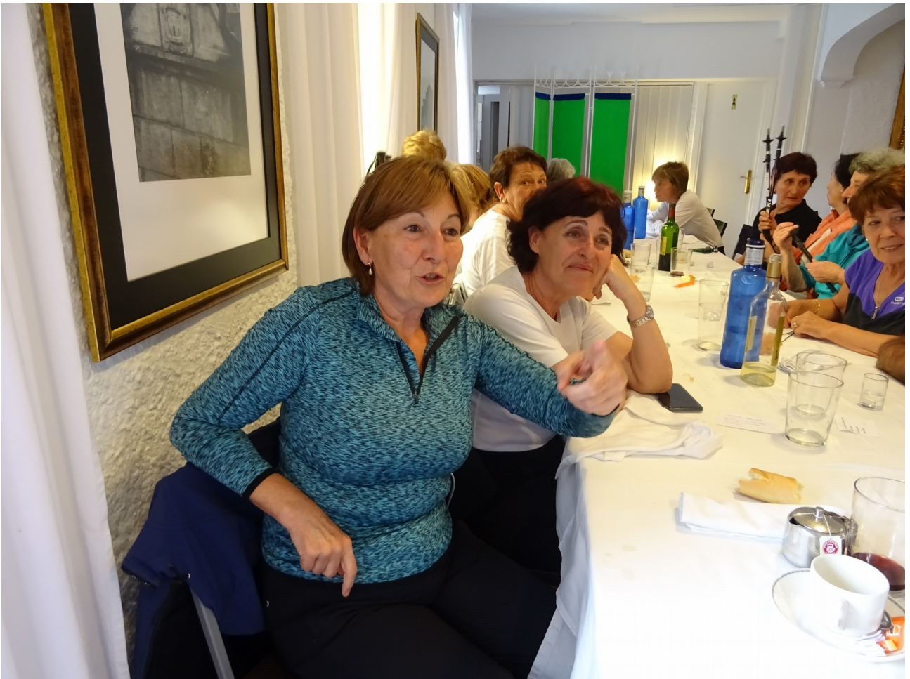
Emakume hauek, Iturri jatetxean, berriketan gustura