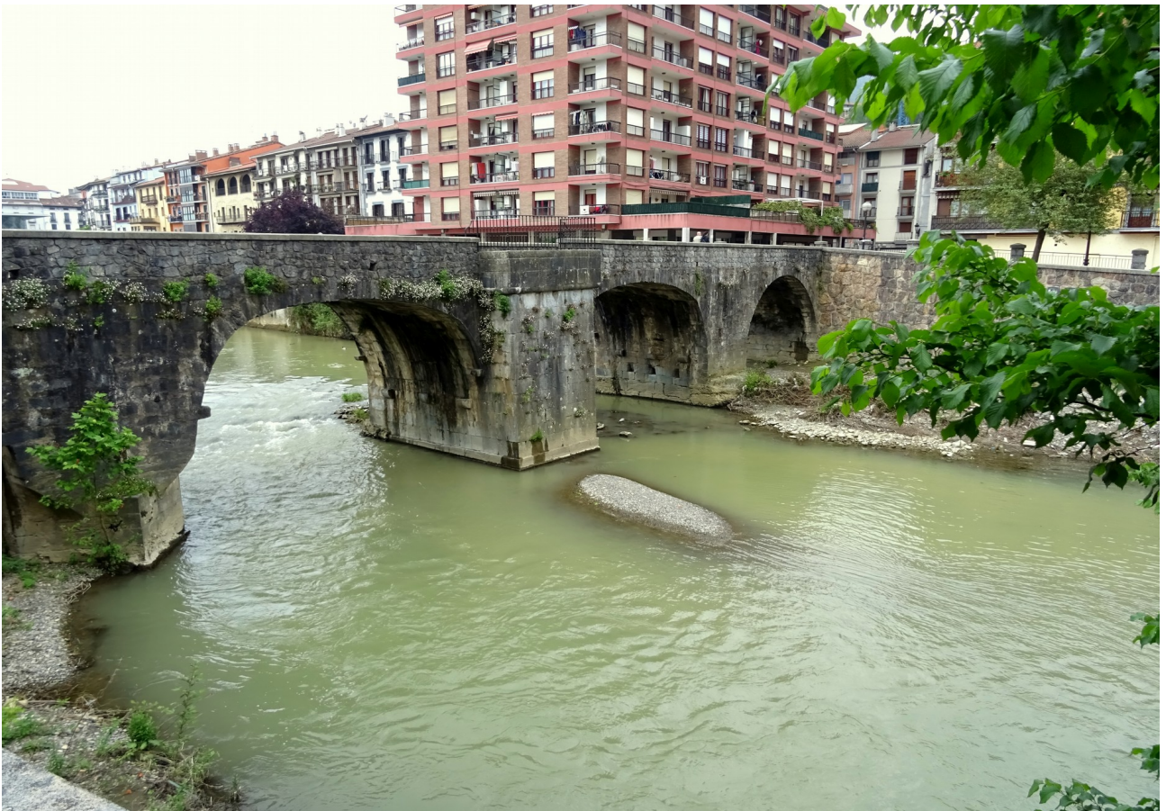
Azpeitiko zubi zaharra, herriaren sarreran