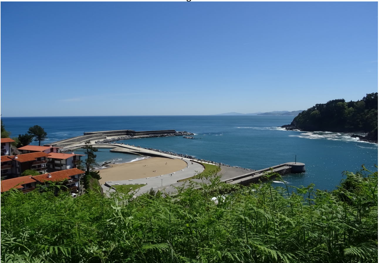
Mutrikuko ikuspegi polit bat