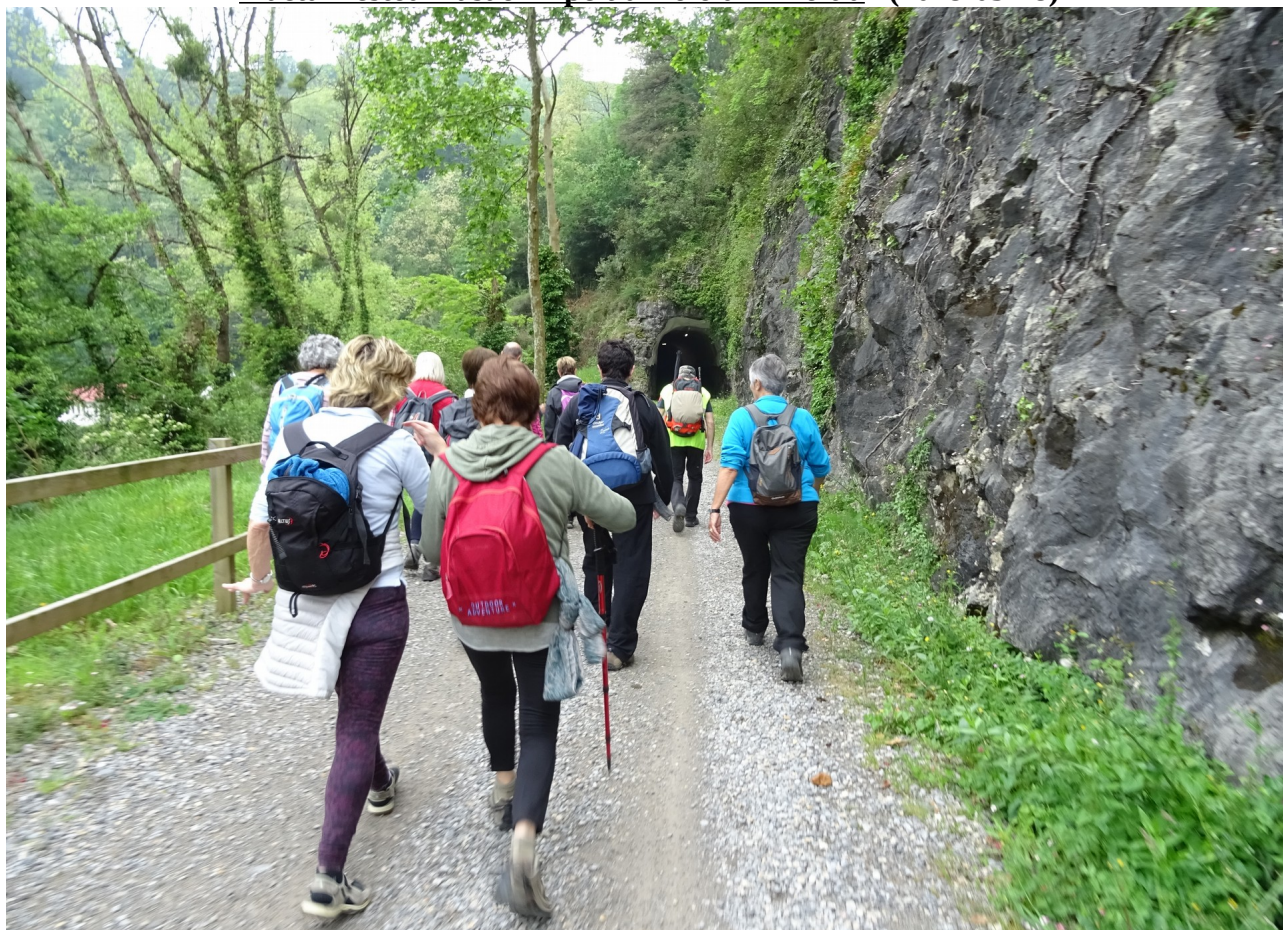
Iraeta-Zestoa-Lasao bidegorrian zehar