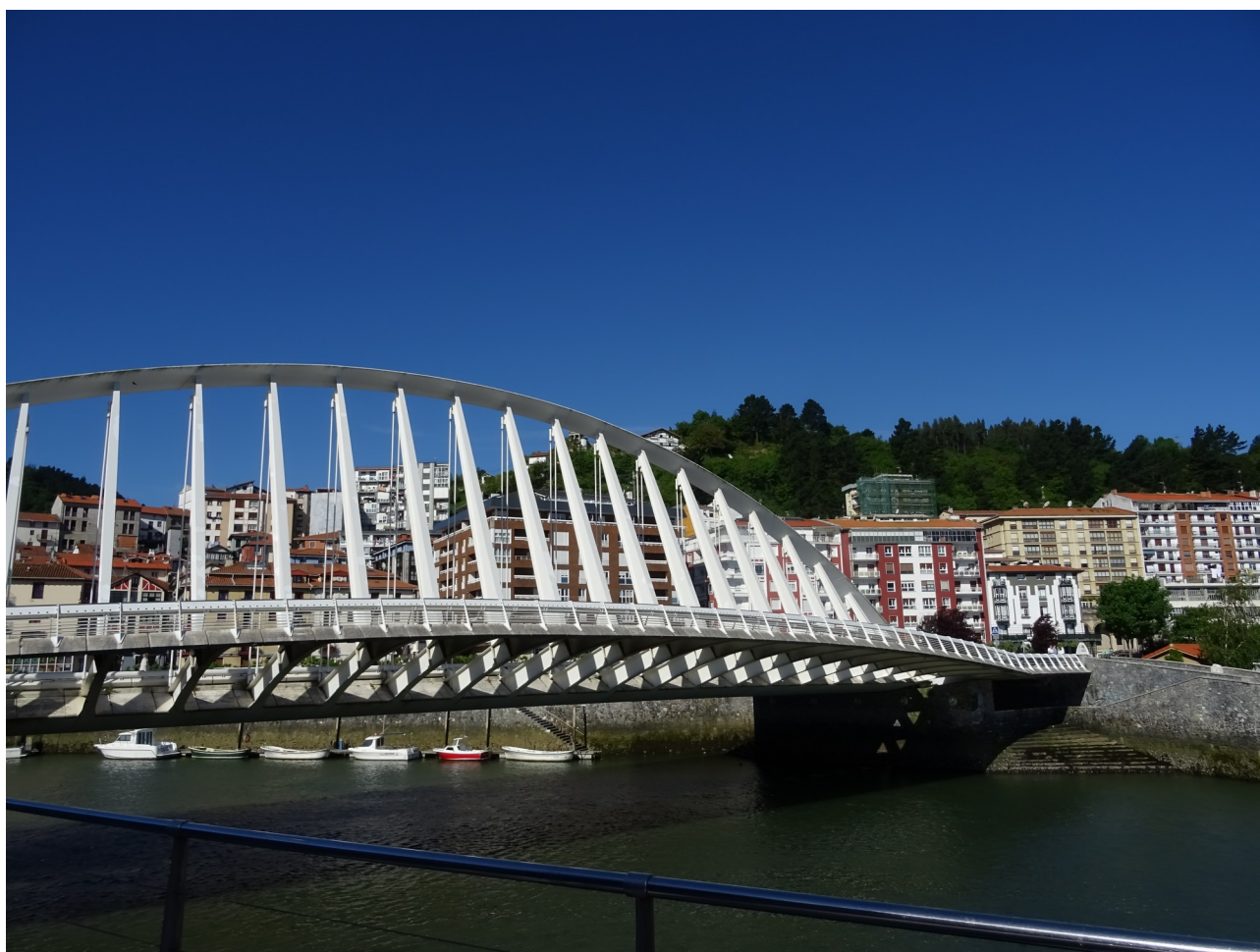
Ondarroako zubi berria

Mutriku-Galdonamendi-Ondarroa-Mutriku (2018-05-11)