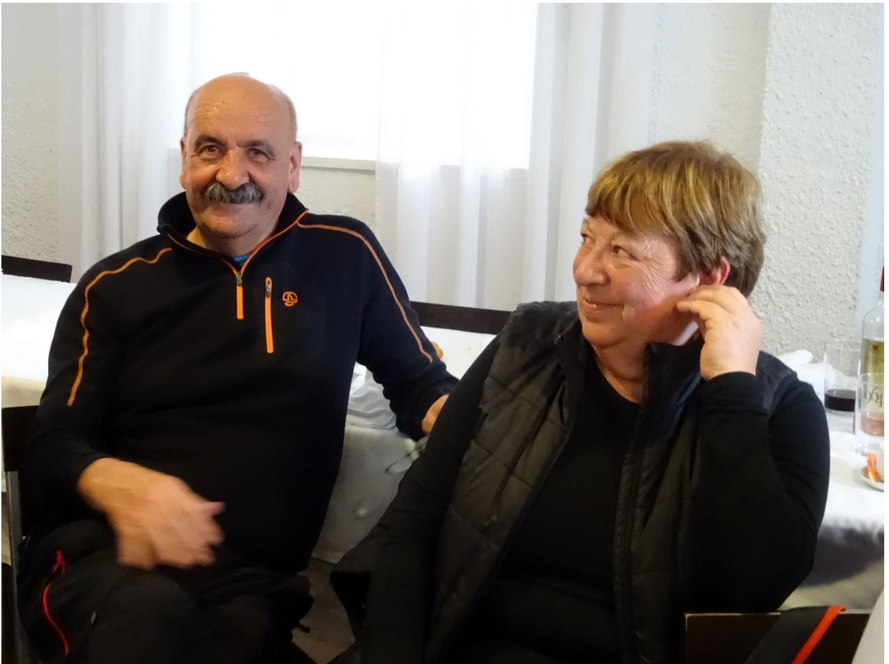
Hau da hau lasaitasuna bikote altzarrarena!