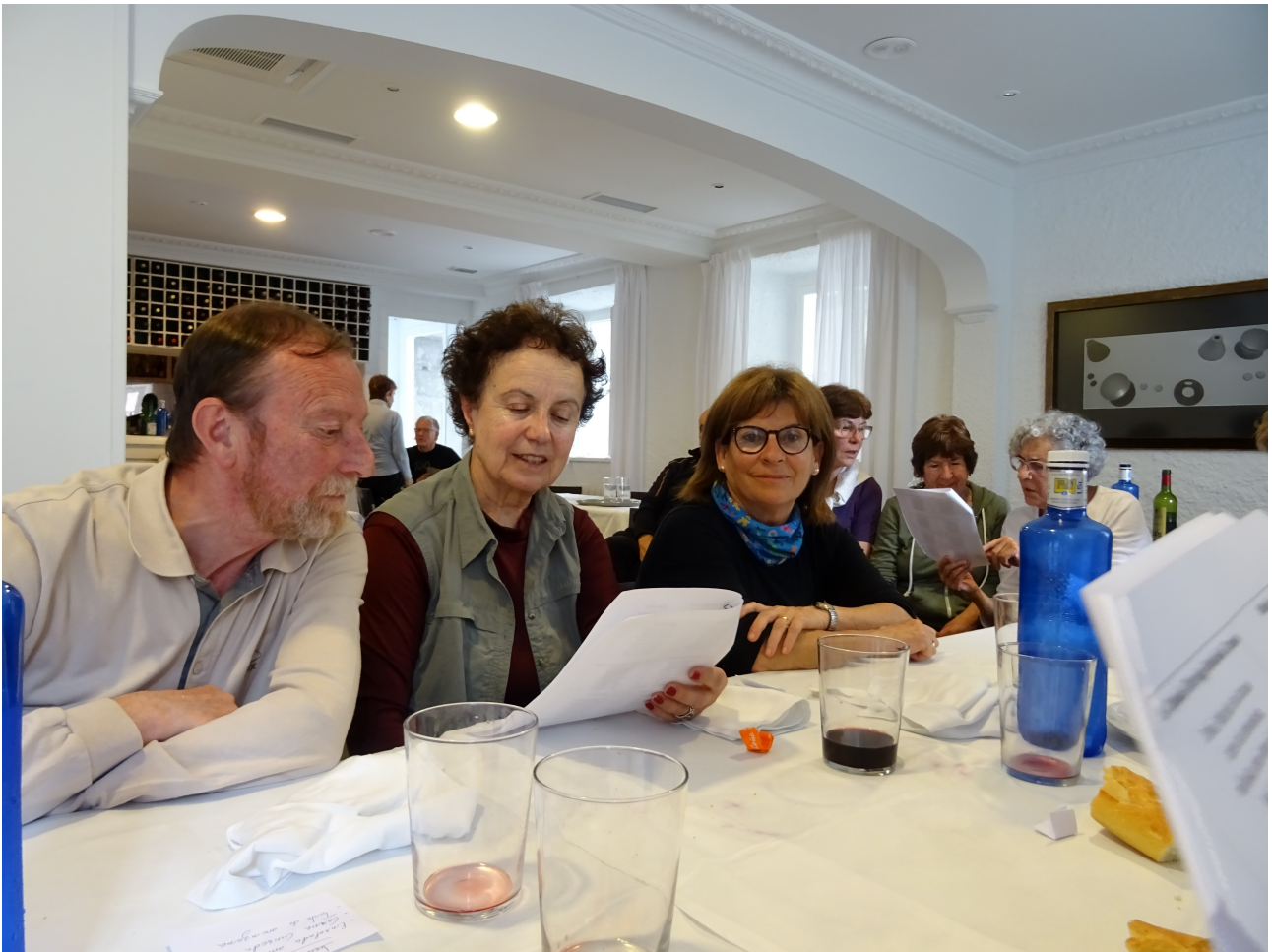
Eguna bukatzeko, jendea abesten Iturrin...