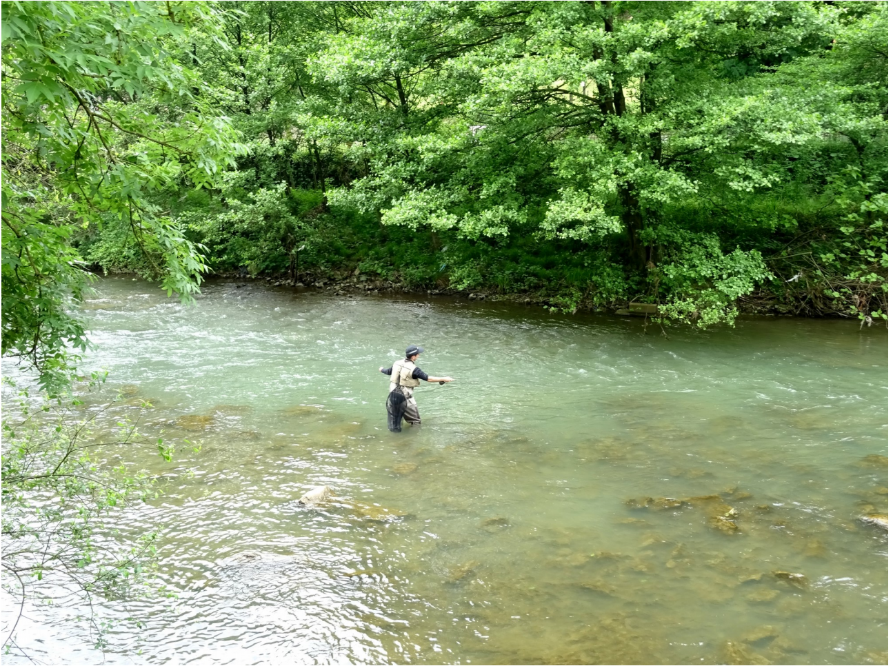
Urola ibaiko arrantzale bat