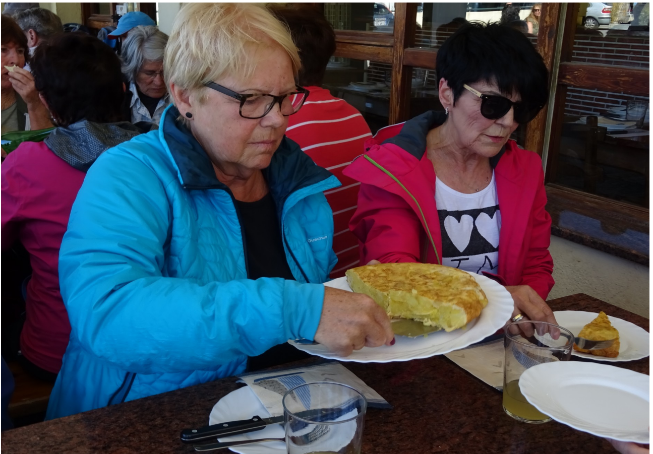
Galdanamendin, hamaiketakoaren orduan