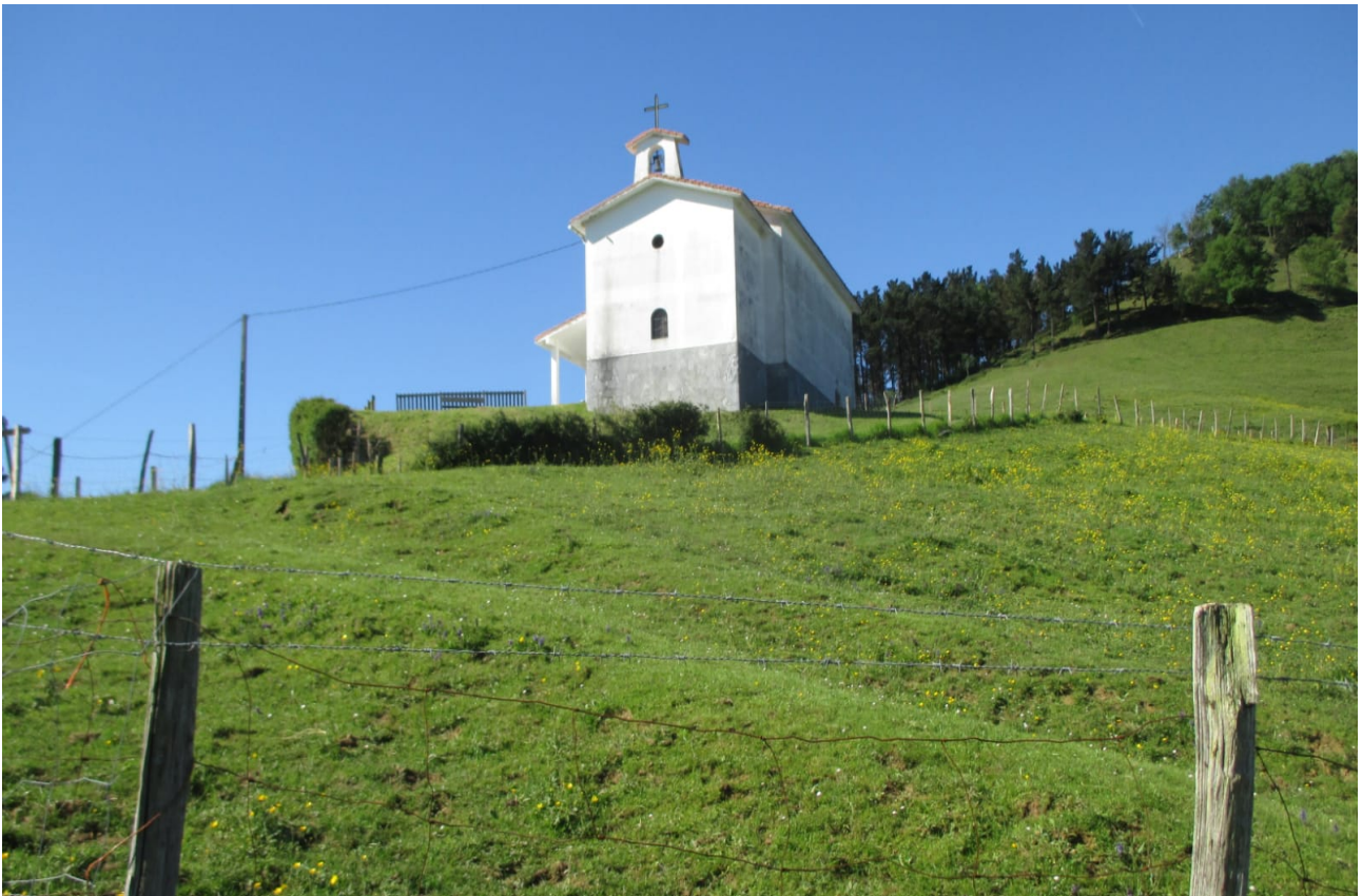
Azkorteko baseliza zuria du helburu ibiltariak