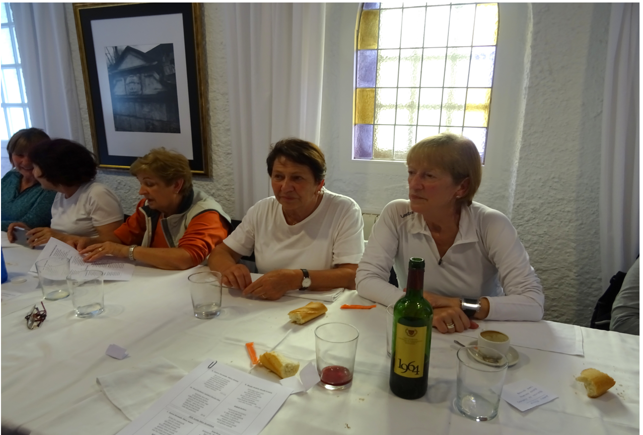
Beste hauek, berriz, filosofatzen edo gogoeta eginez