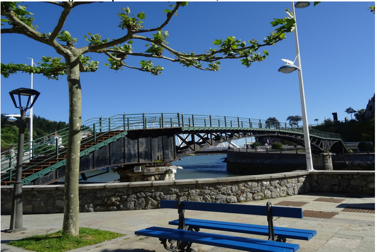
Ondarroan, zubi zaharra aurrean dugula