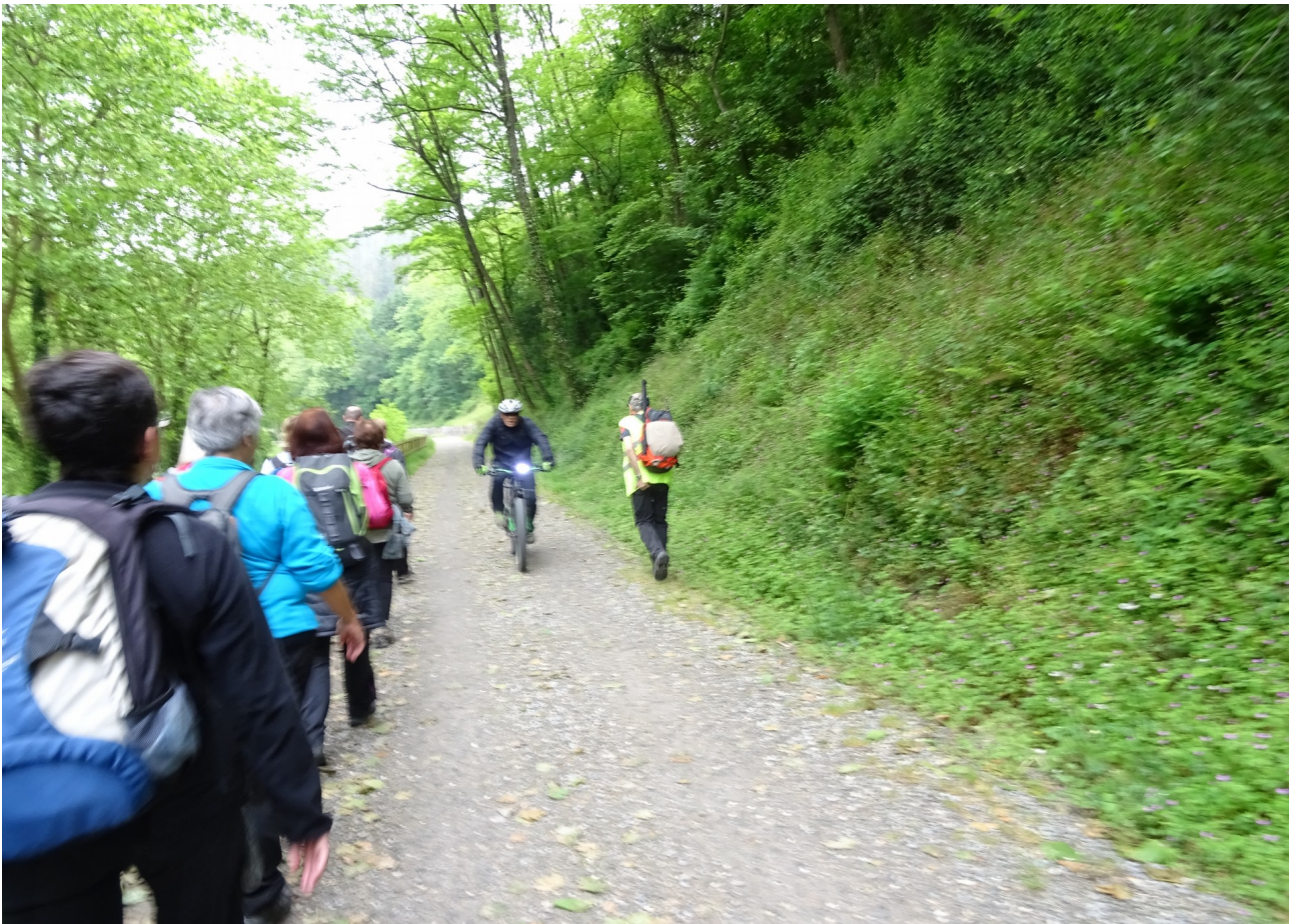
Zenbait txirrindulari topatu genuen bidegorrian eta baita landetxeak ere