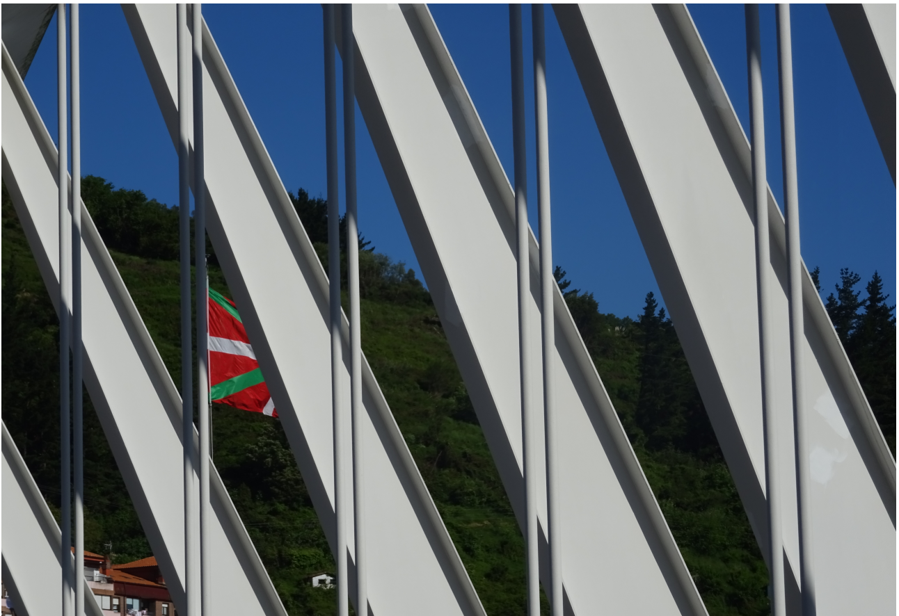
Zubiaren egitura sendoa