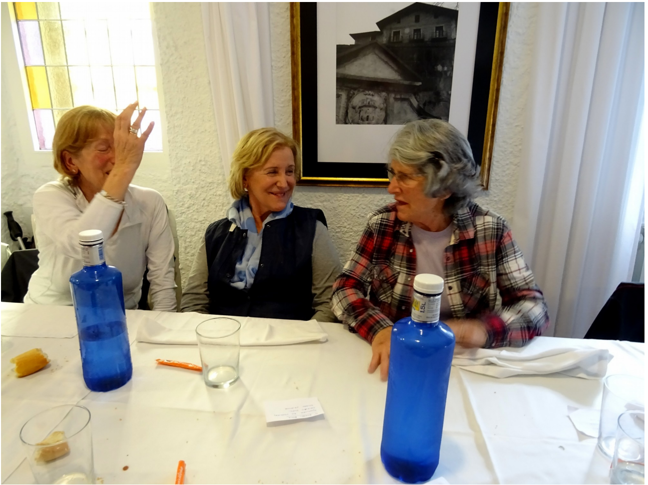
Hiru emakume hauek kontu kontari bazkalondoan