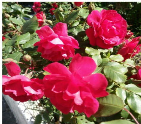
Baserria, loreak, mendia, ibiltariak...ez al da atxikimendu polita?