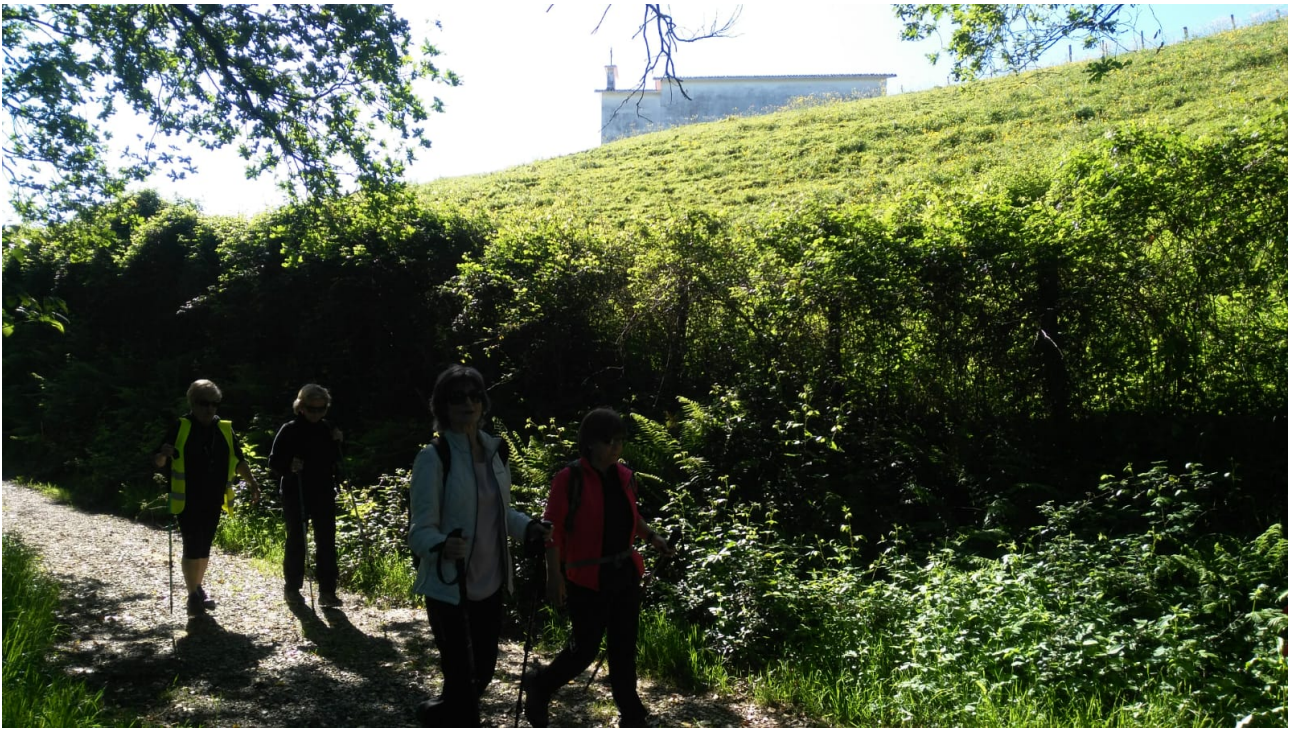
Emakumeak bidezidor kirolean beti edo gehienetan nagusi