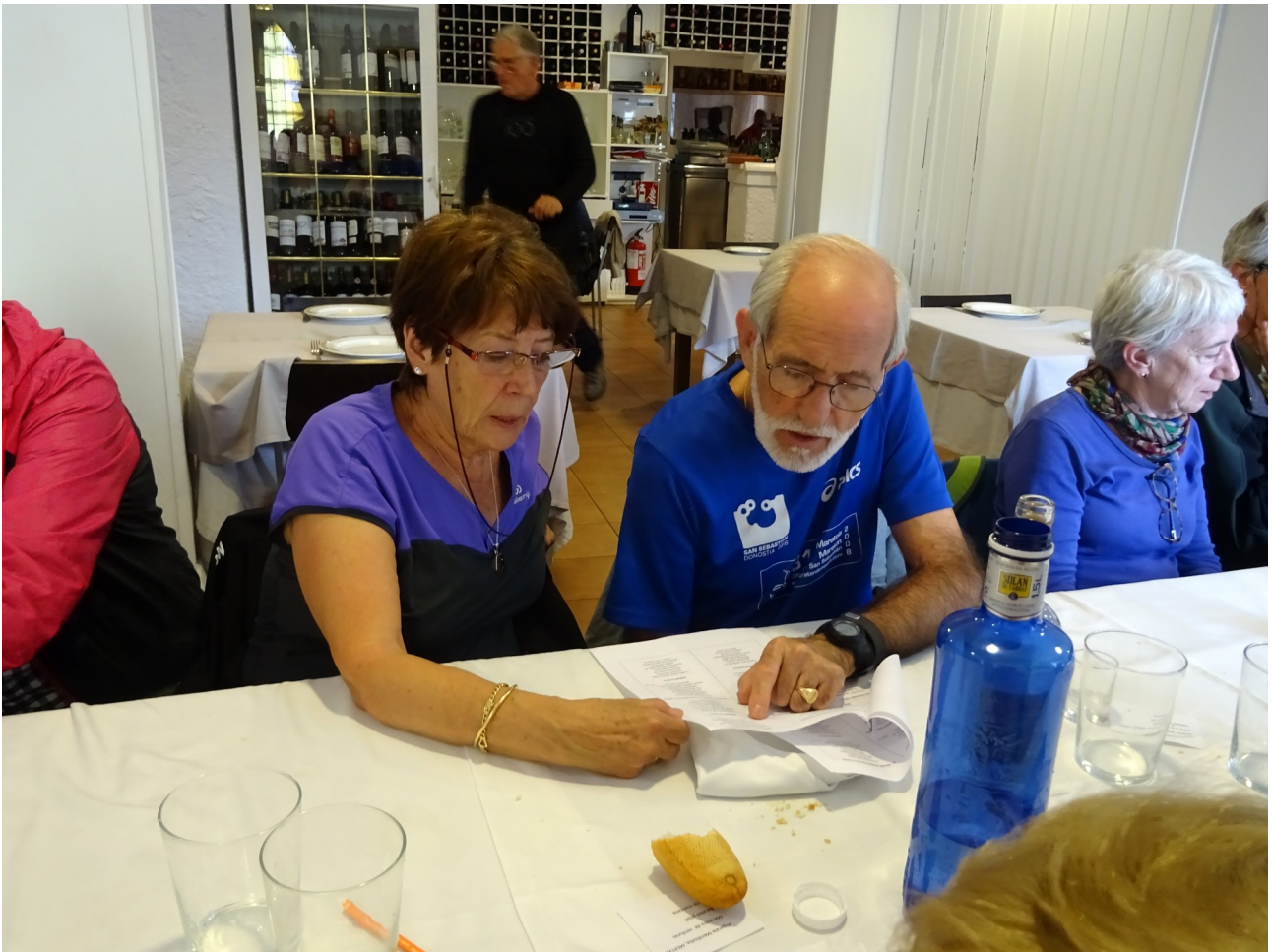
Begira nola ekiten dion “Pibeak” euskal kantuari!