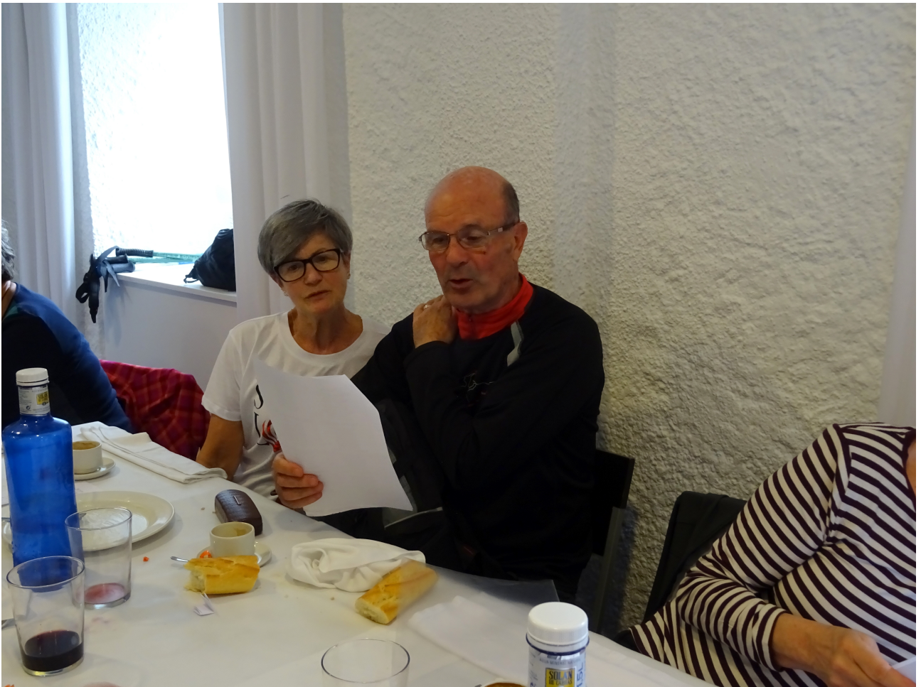
Abesteko ordua iritsi zen talde erdiak alde egin ondoren