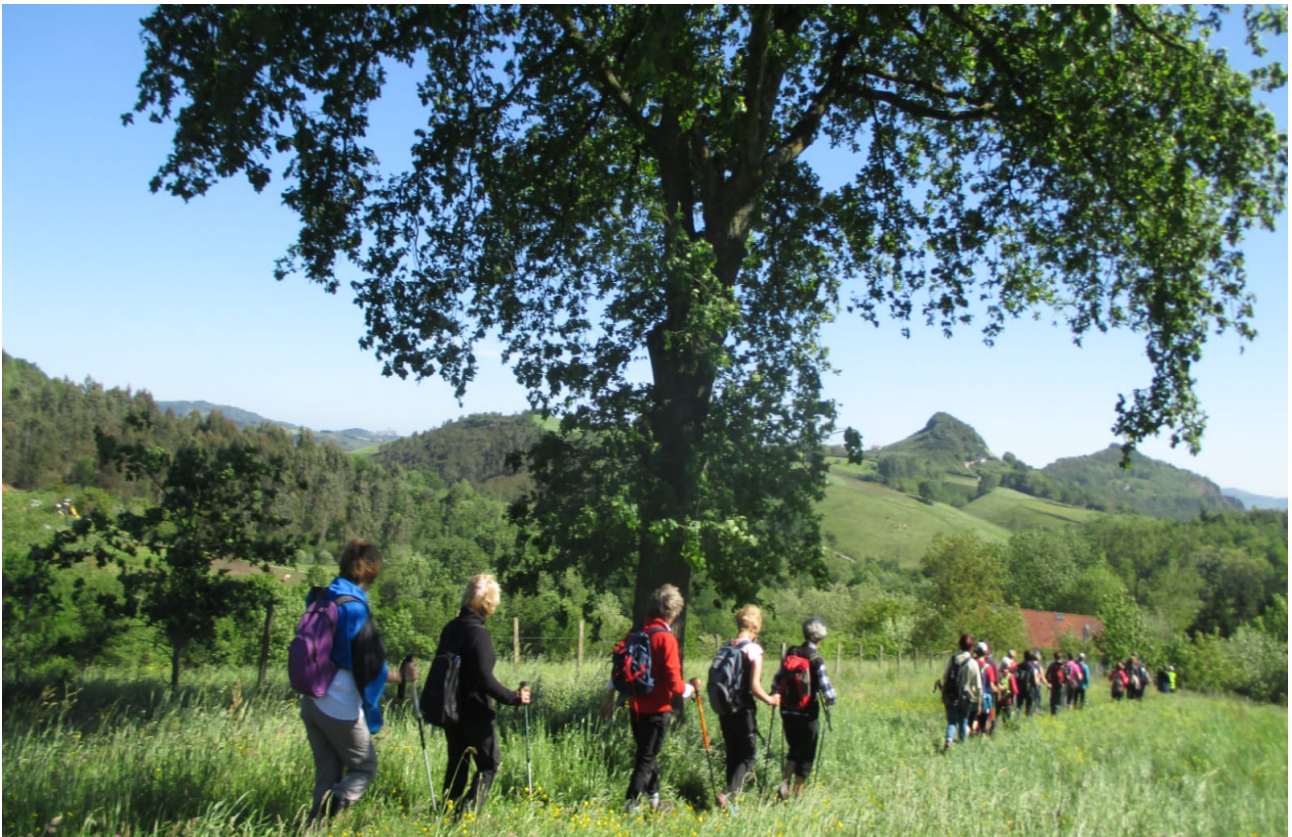
Lasarterako bidean, berdegune etengabeen mendizaleak