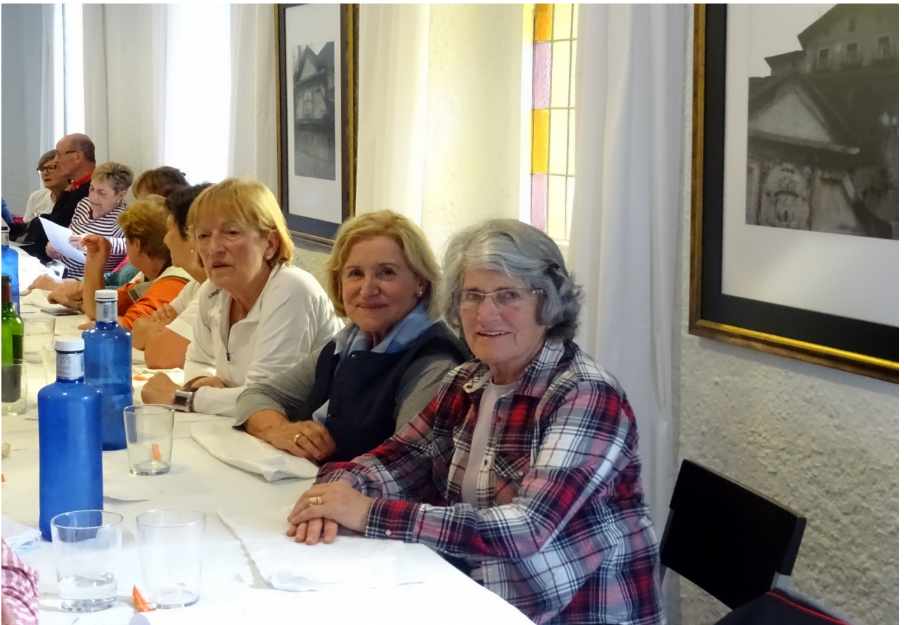
Hemen bi emakume irribarretsu eta bestea erdi lotan