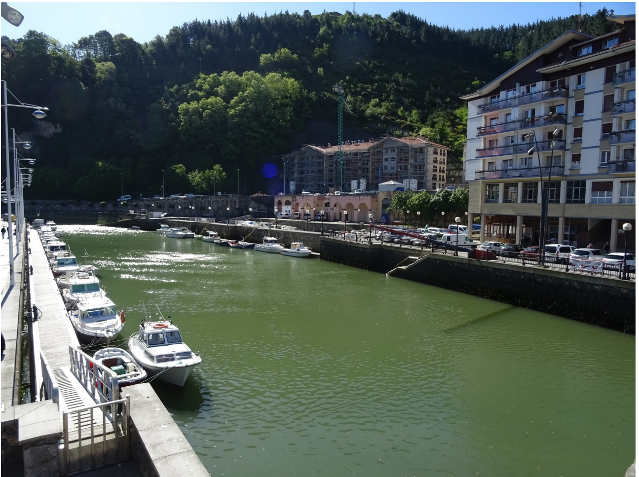
Kai zaharra, baina txalupa berri eta modernoak