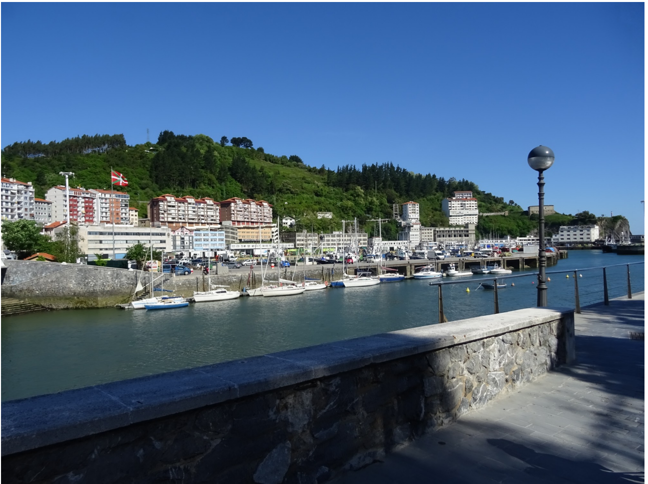
Ondarroan, beste aldetiko ikuspegia