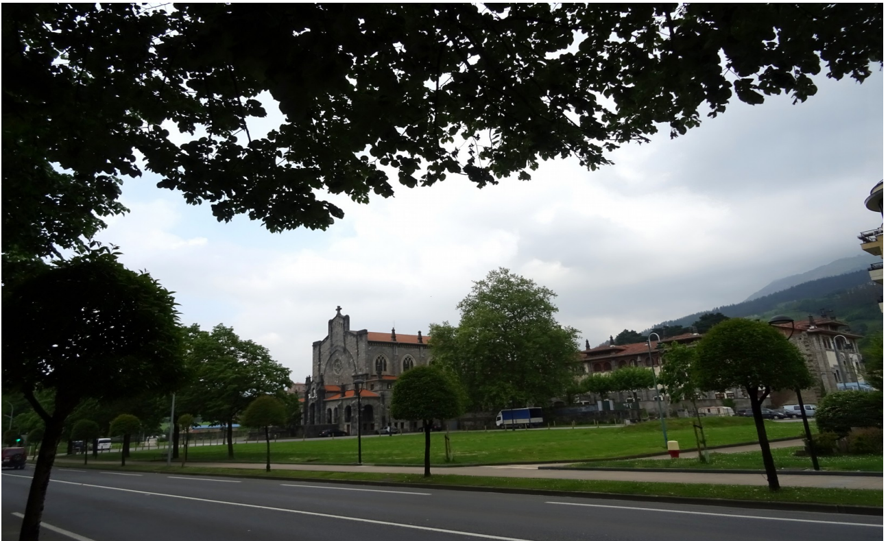
Loiola Santutegiko alderdi luze eta zabalak