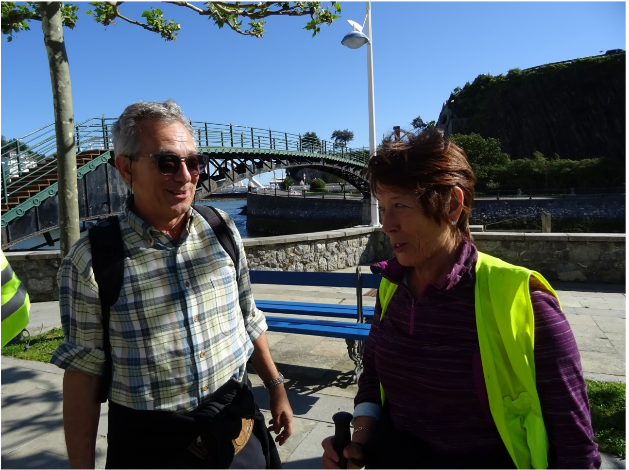
Begirada konplizea hauena! Ondarroan, zubi zaharraren ondoan