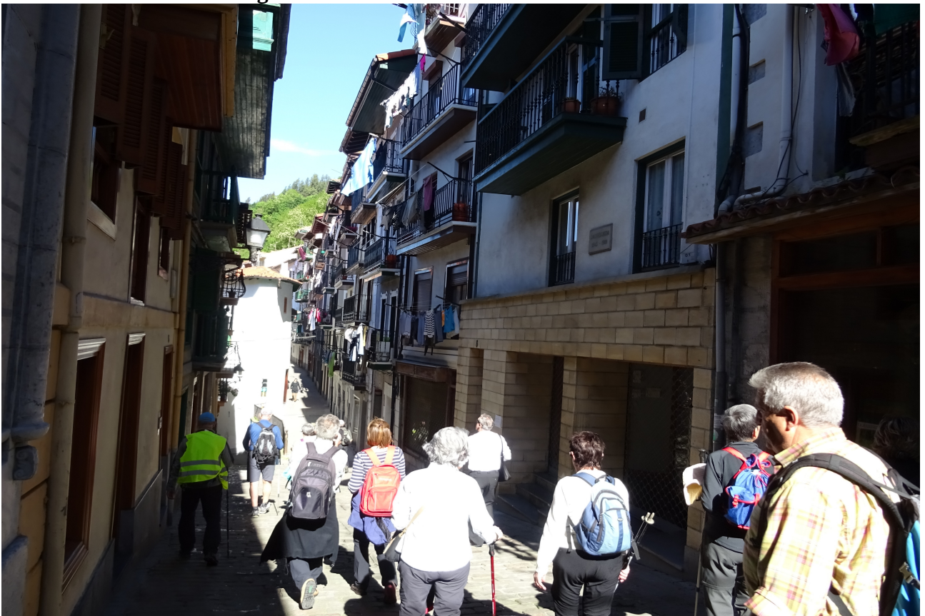
Ondarroako alde zaharrean zehar. Itsas usaina dario leku honi