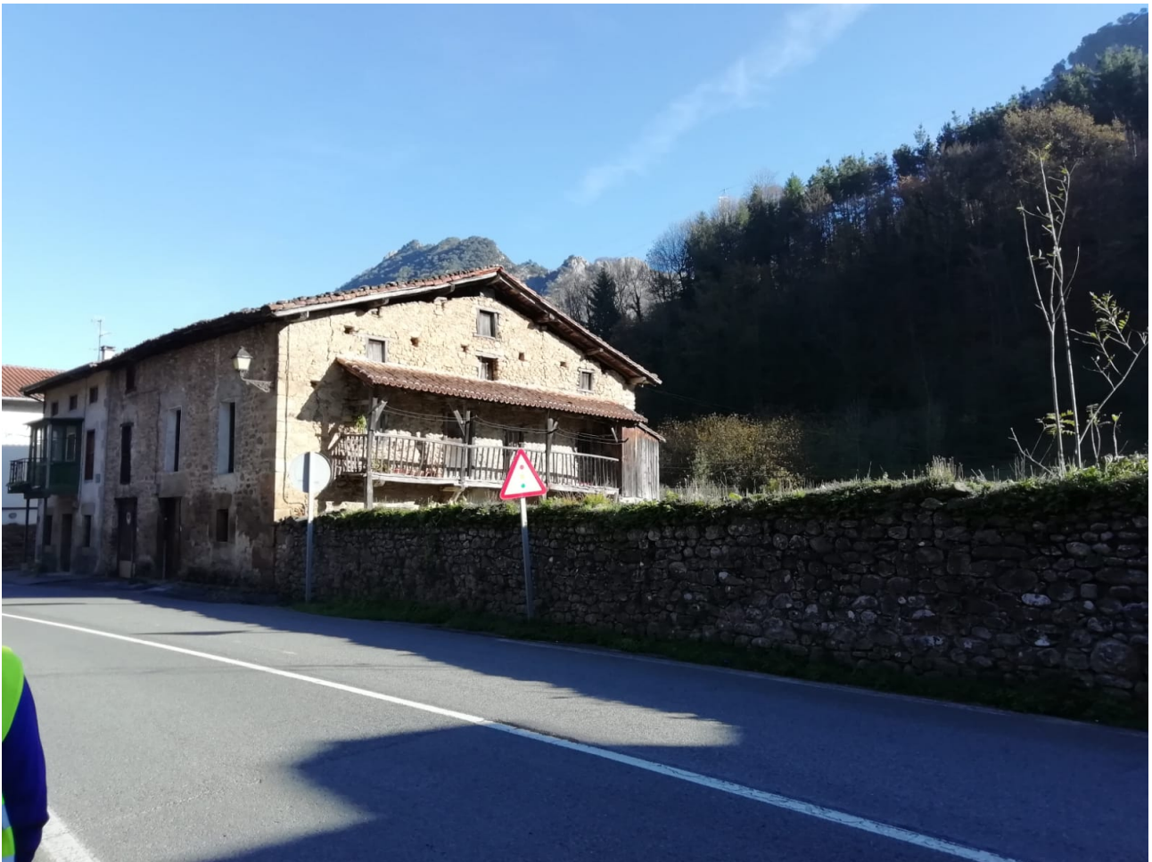
Antzinako baserri zahar bat ere ikusteko aukera izan genuen San Martin auzoan