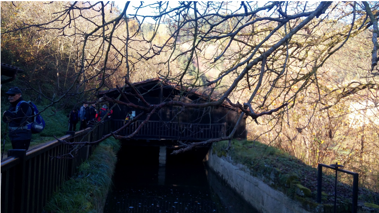
Bidean zeharreko errota edo eihera zaharra