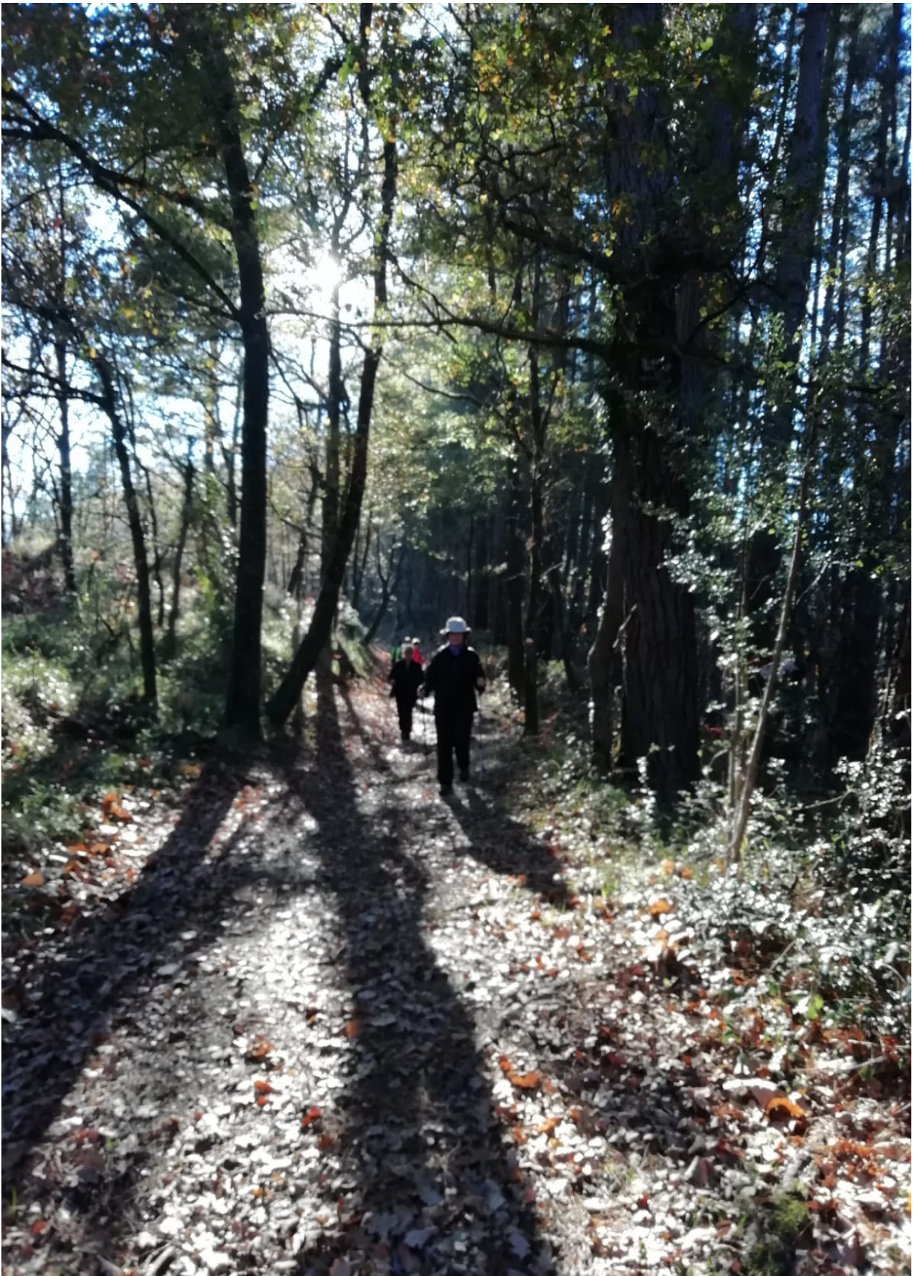
Hau baino argazki dotoreagorik...