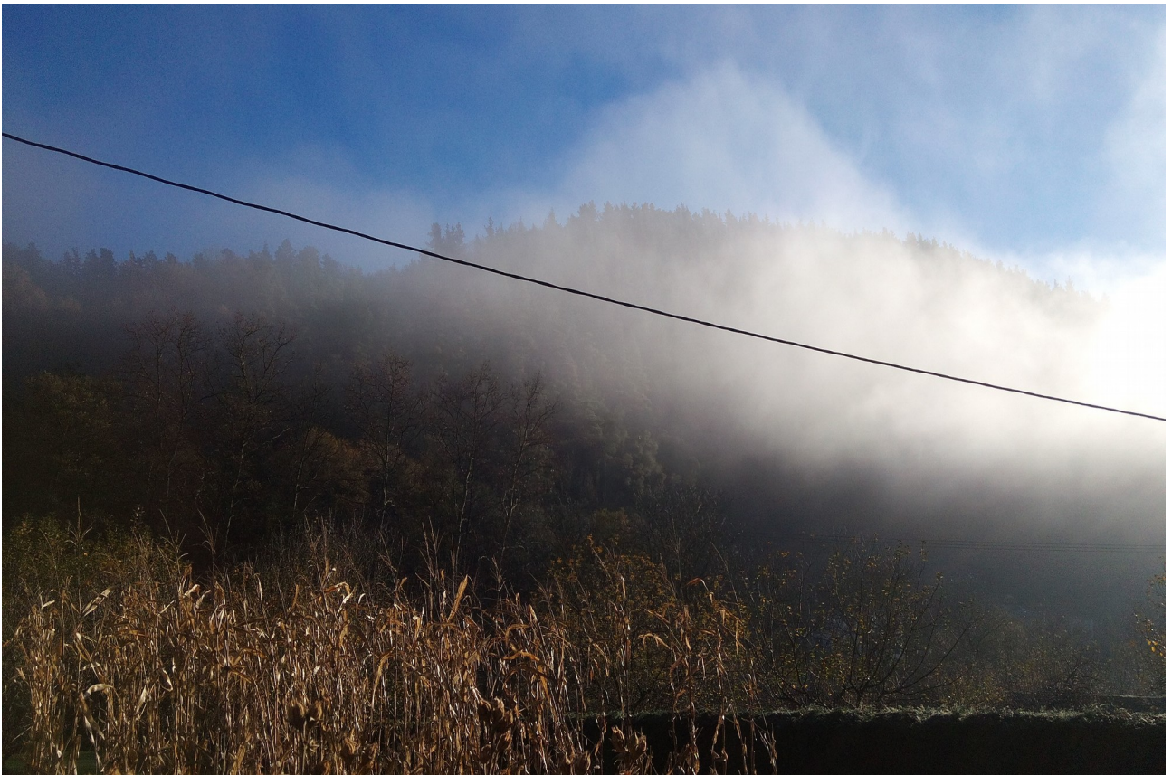
Hasieran mendialdean lainoa genuen