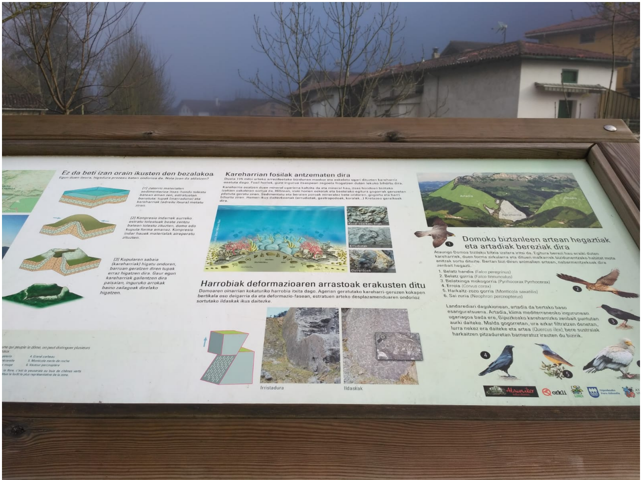
Berrito ere Ataungo Domoaren txartela dugu aurrean