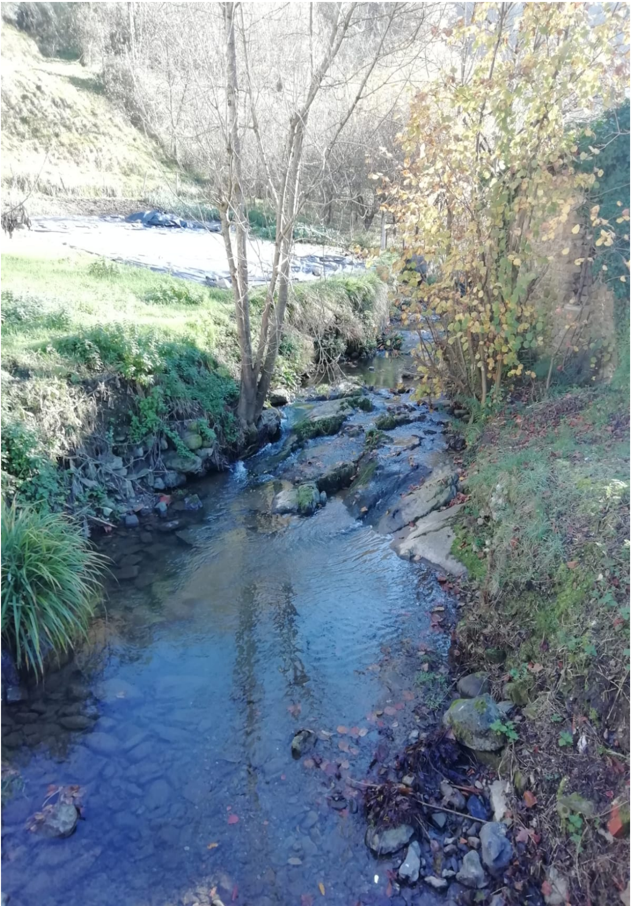
Erreka garbi askoak ikusten dira alderdi honetan