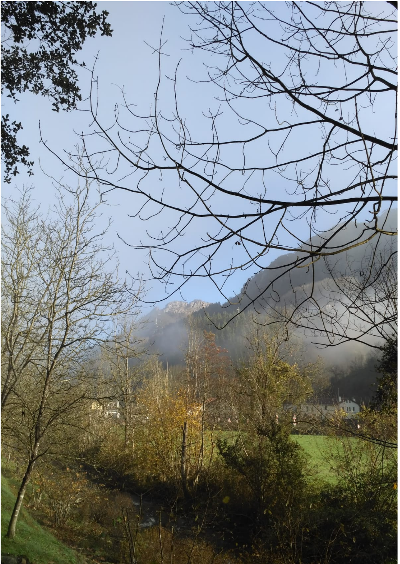
Lainoa, emeki-emeki, desagertzen zihoan