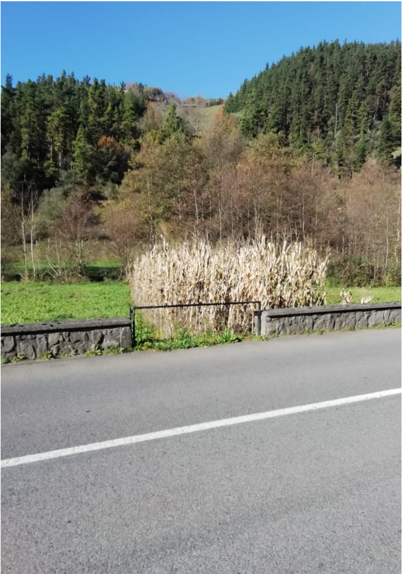
Ibilbide bukaerako eguraldi eguzkitsua