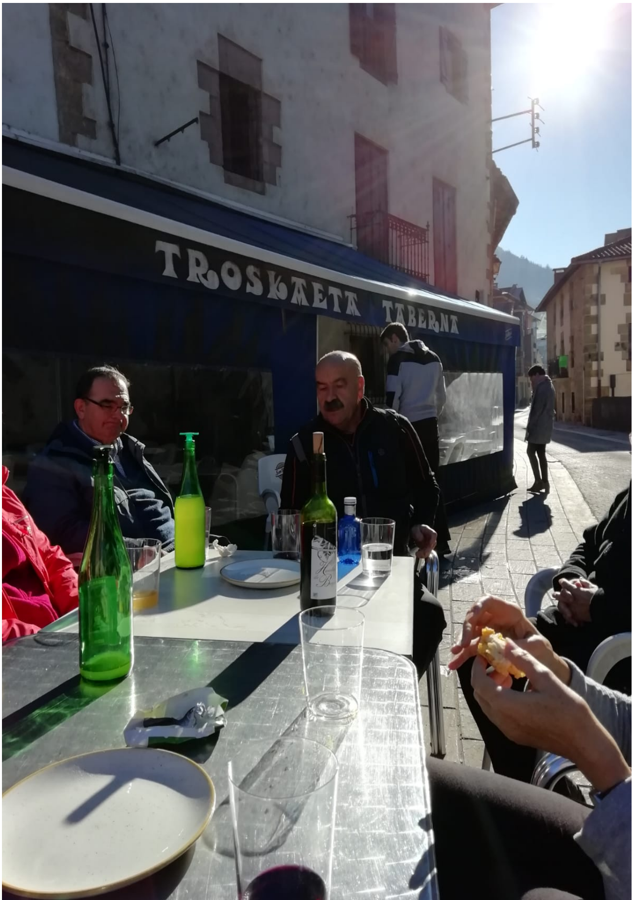
Ibilaldiaren bukaeran gerlarien atsedean goxoa, sagardo, ardo, tortilla eta guzti