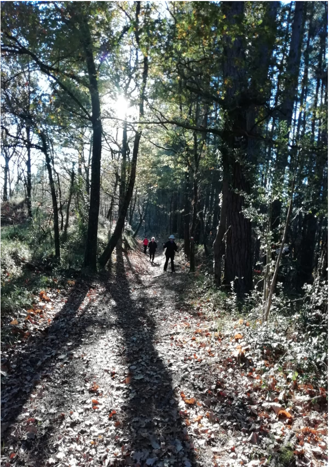
Baso izugarri polita zeharkatu genuena