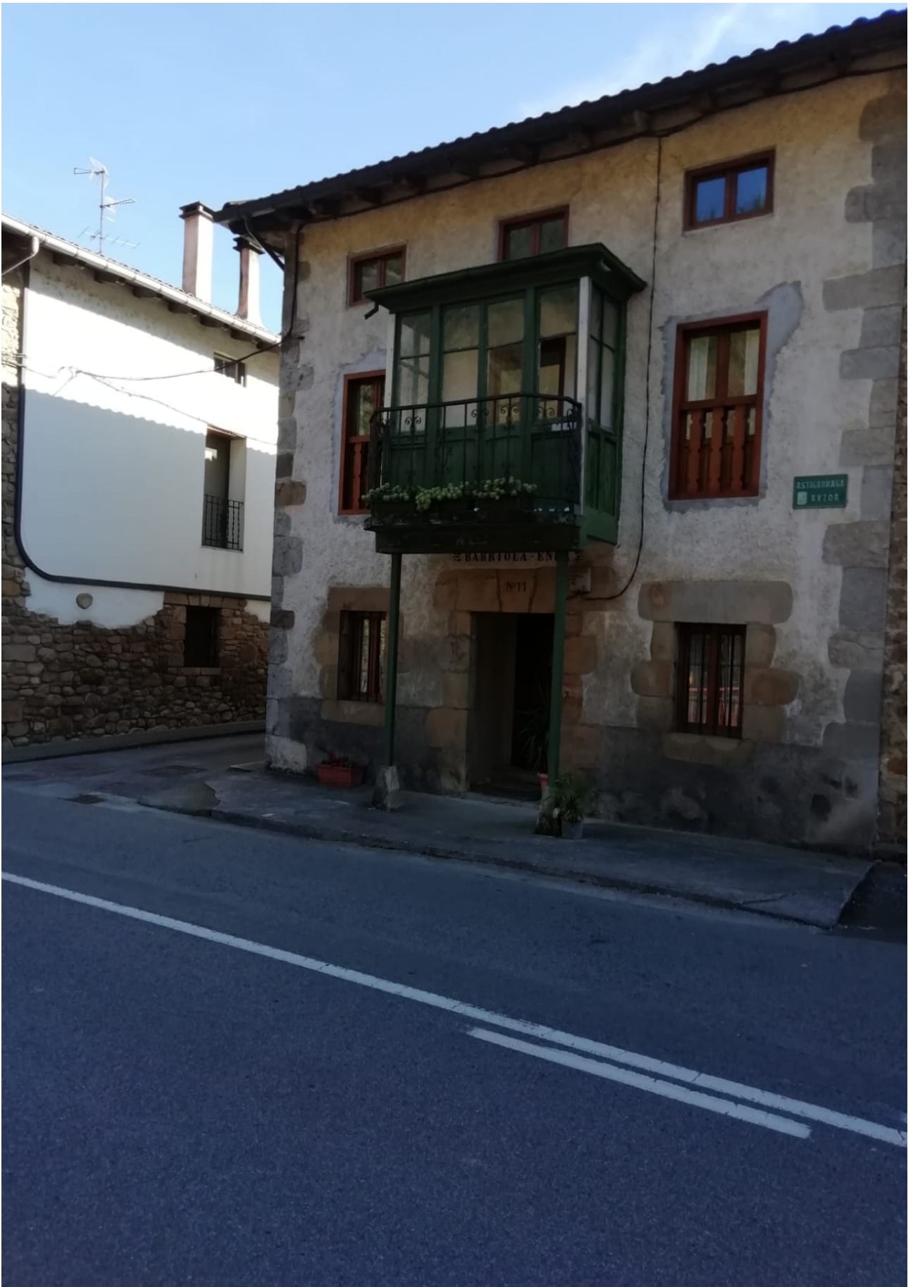
Hau ere polit askoa da