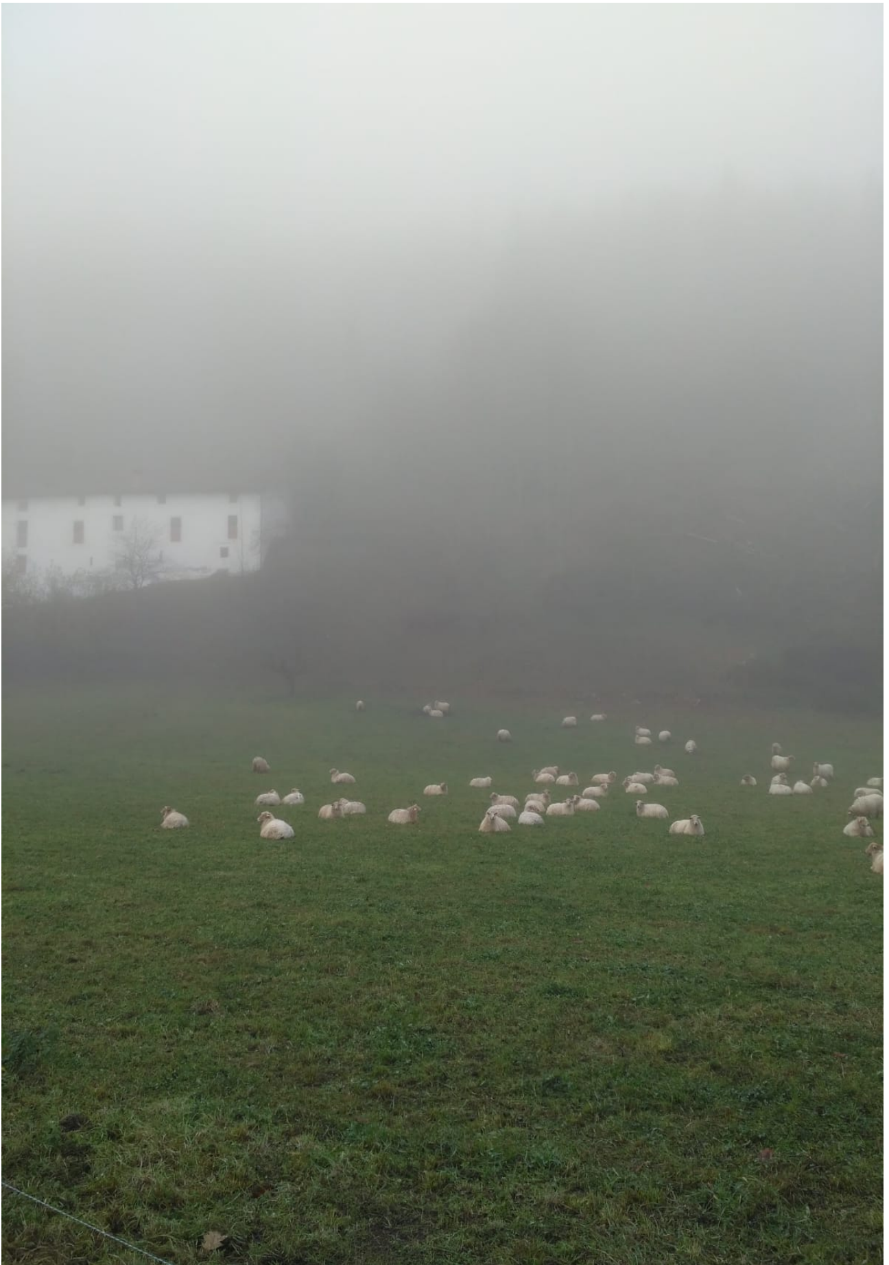
Artaldea Agauntza ibaiaren ondoan, goiko larreetatik jaitsi ondoren