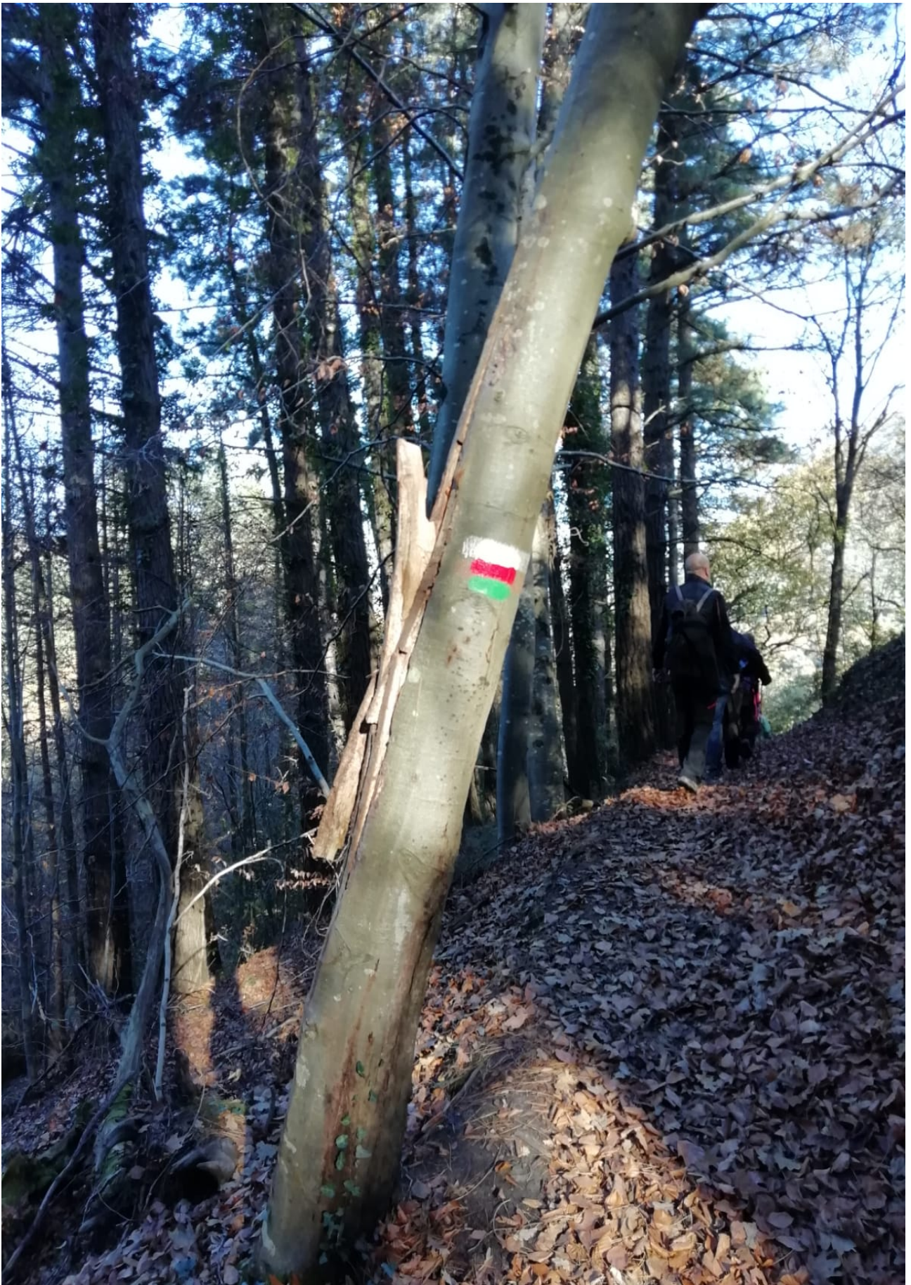
Ongi markaturiko bideari jarraitu genion