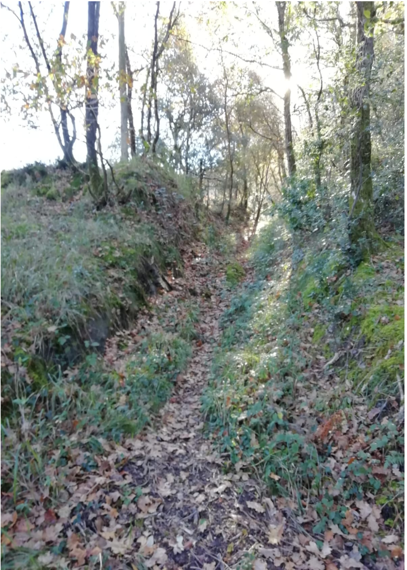
Ataungo San Martin auzorantz doan bidezidorra