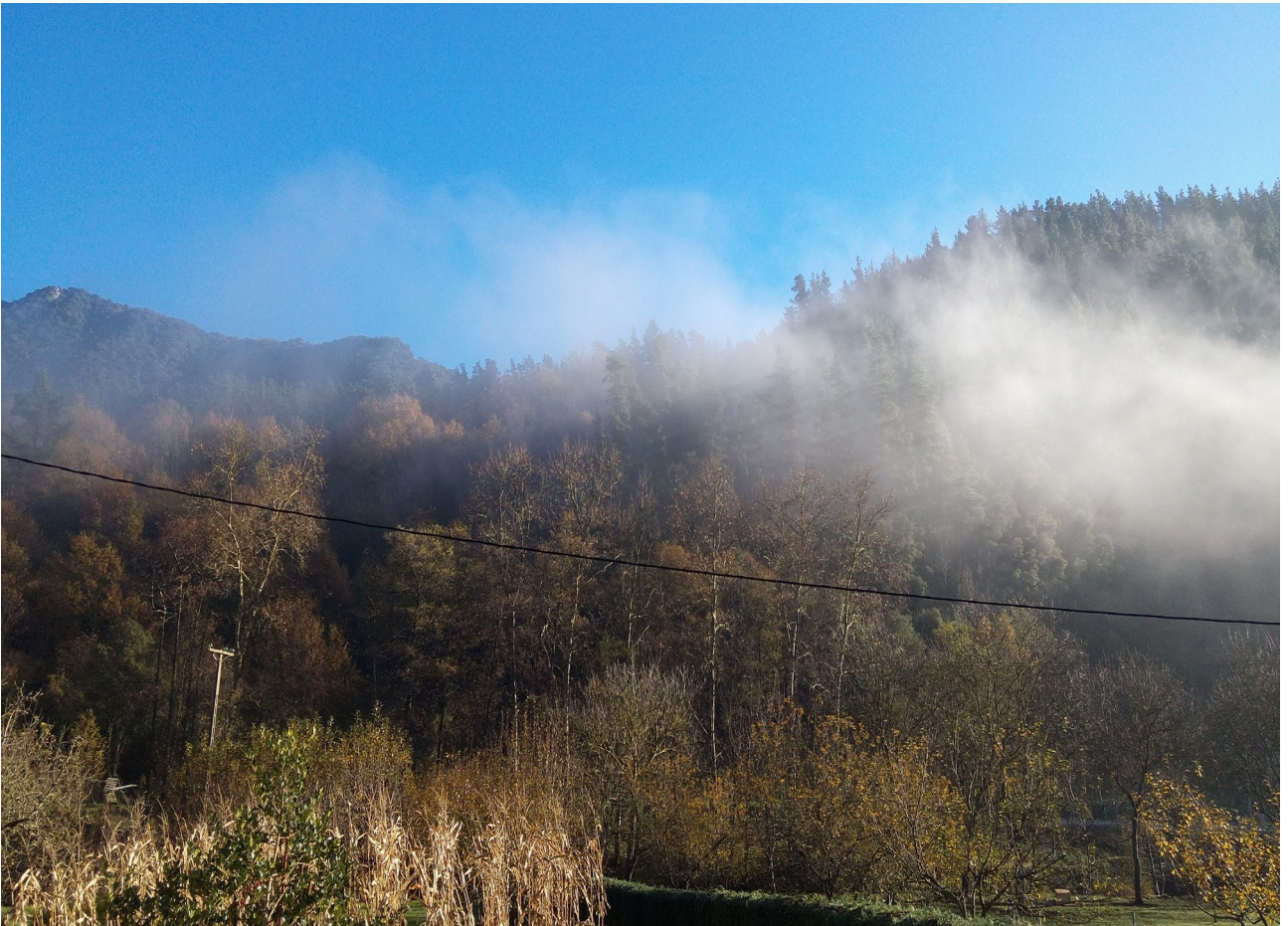
Alde batean lainoa eta bestean egutera