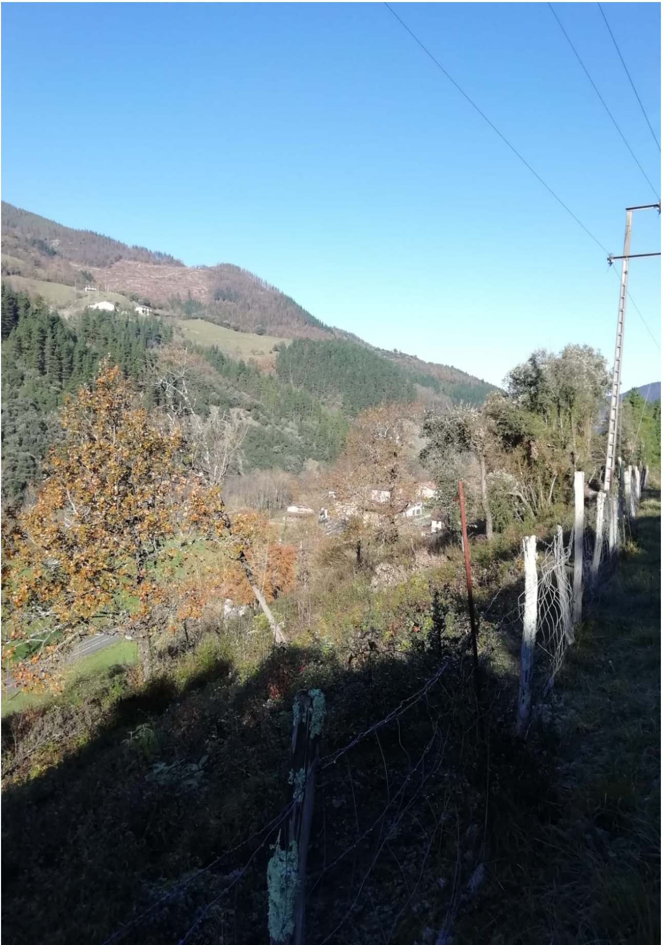
Hemen argi ikusten da eguzkia bere lana egiten ari dela