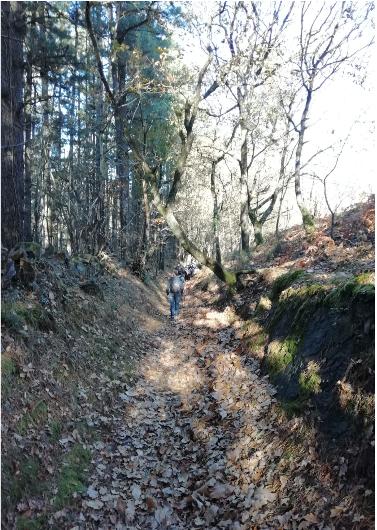
Mundutik aparte dagoela dirudien paisaia