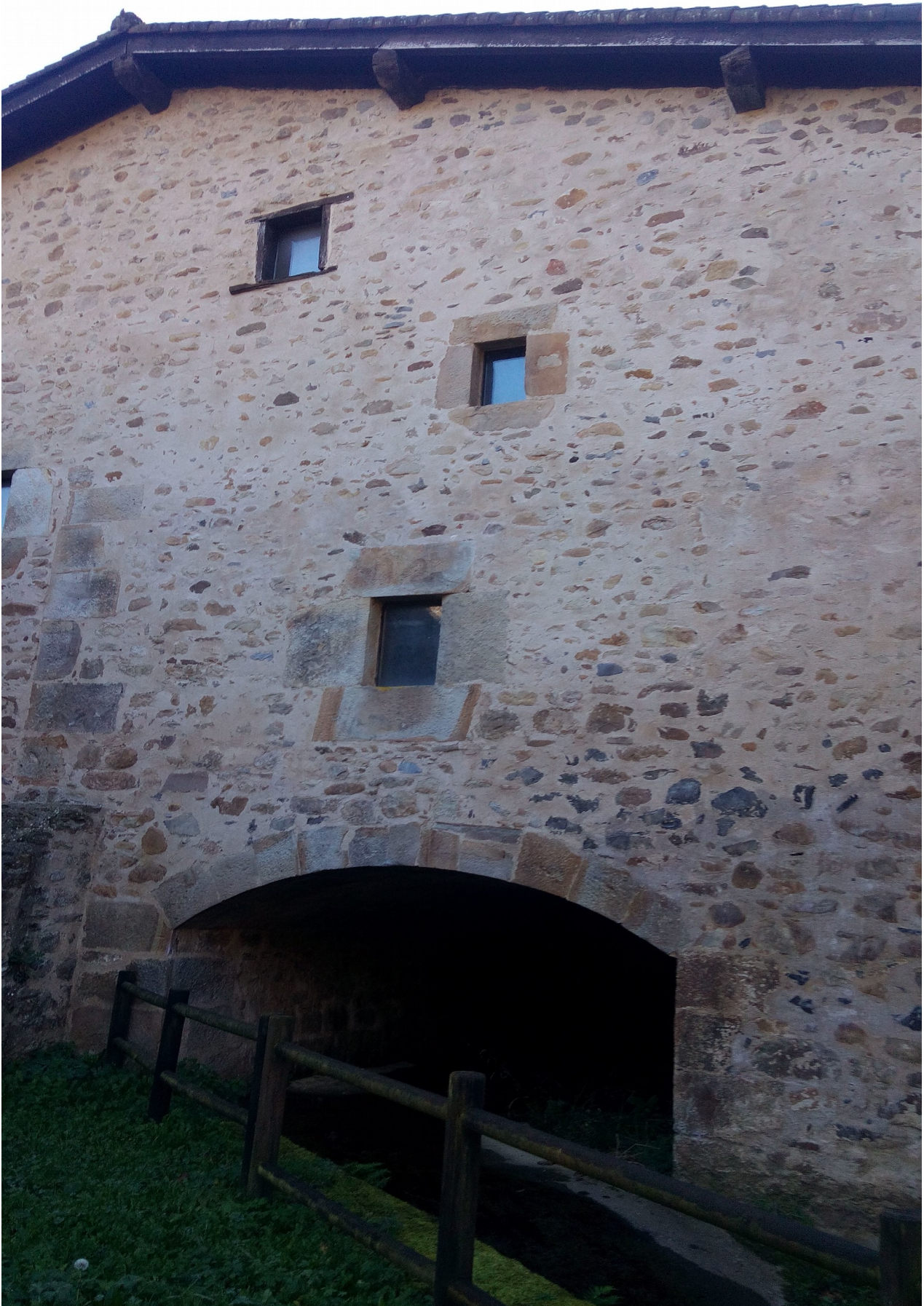
Ibilbideko etxetzar eta, aldi berean, errota