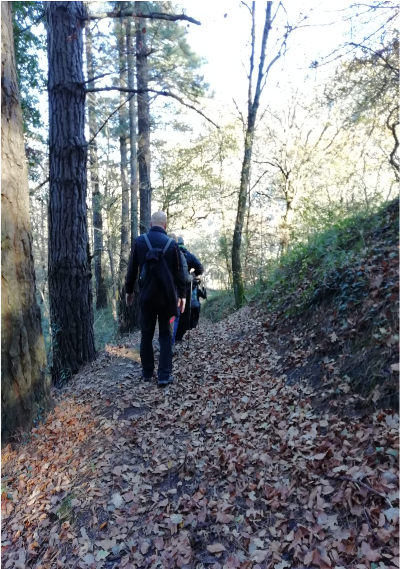
Basoan zeharreko bidezidorra