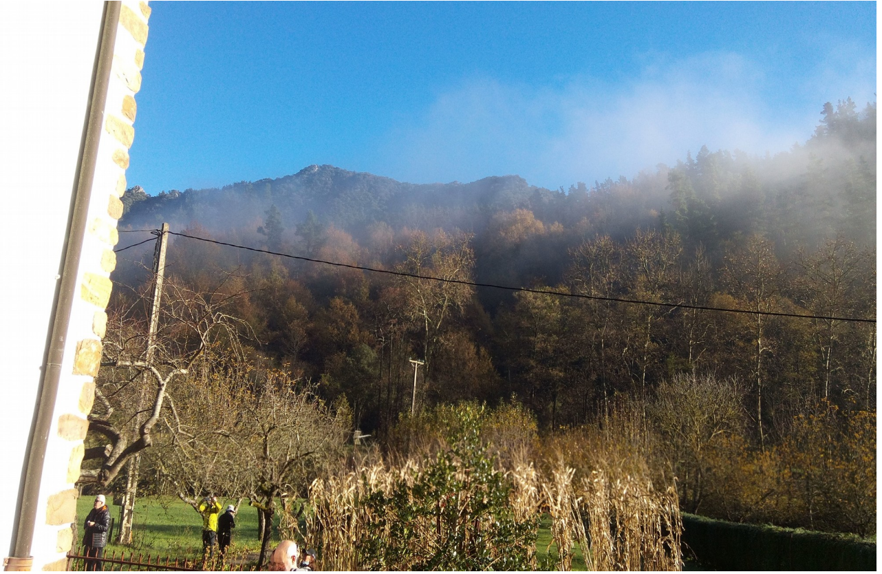
Sara etxeke baratzean ibiltari zenbait