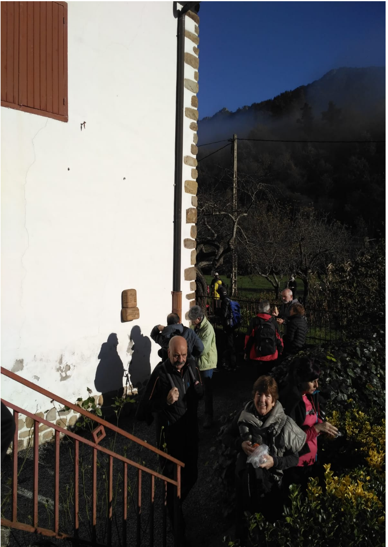
Ataungo Barandiaranen Sara etxean, atsedenaldi laburrean