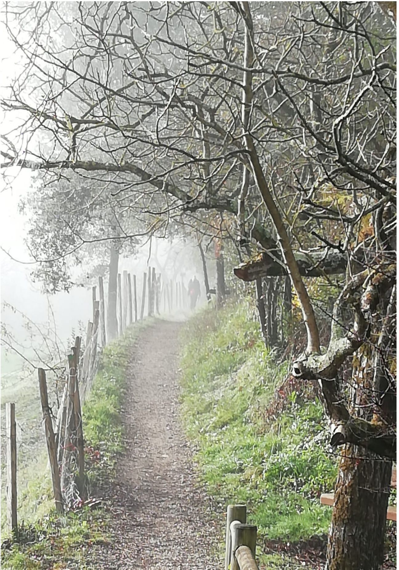
Hasierako lainoa bidezidorrean zehar