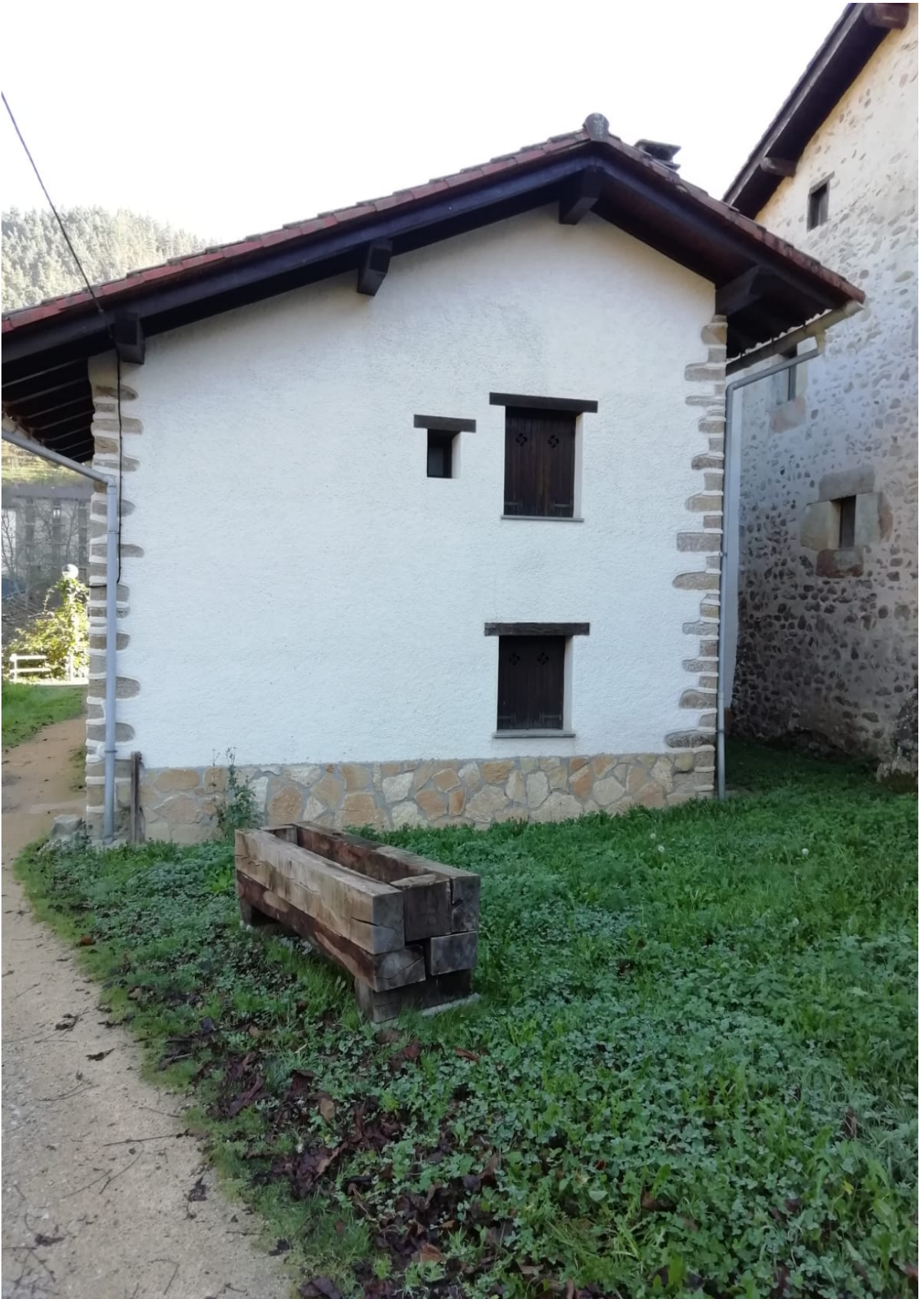
San Martin auzoko etxe bitxi bat