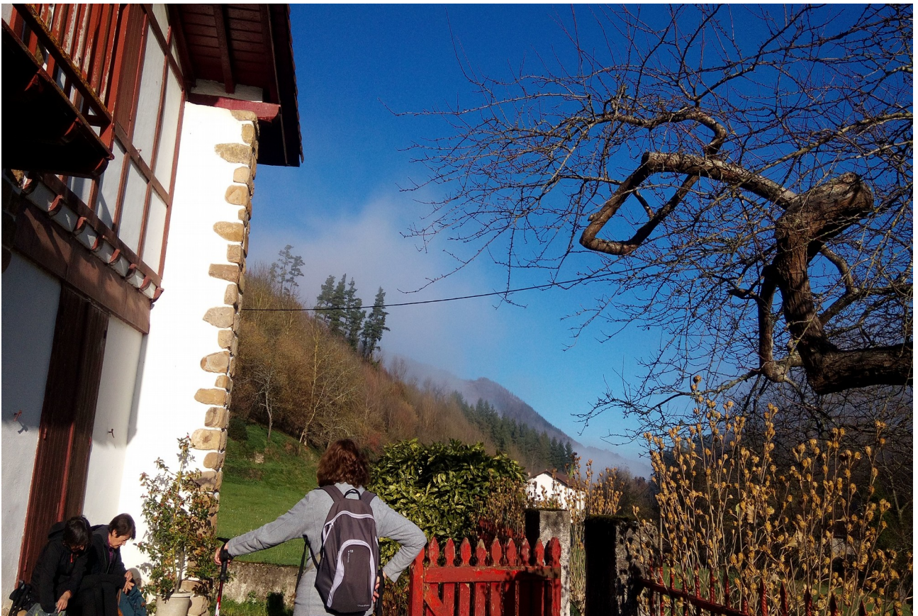
Saran atsedenalditxoa egin genuen