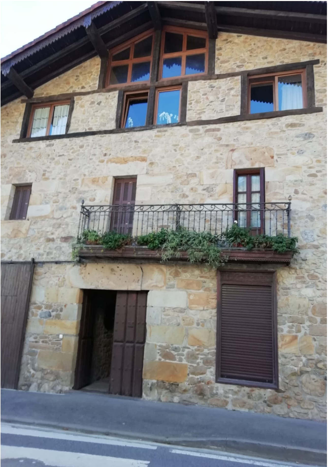
Etxe eder askoak ikusi genituen Ataunen