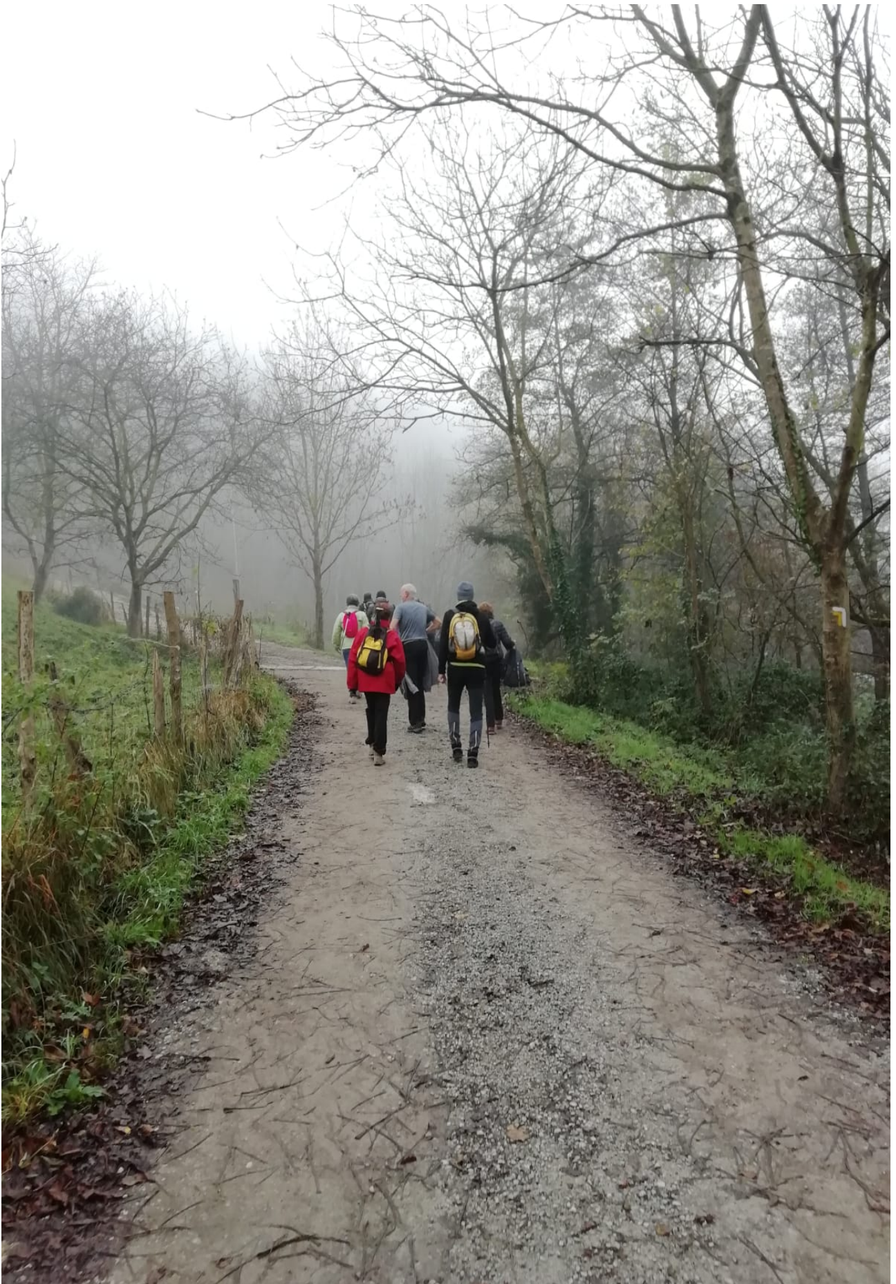
Laster desagertuko zen bruma edo laino hori eguzkiaren agerpenarekin