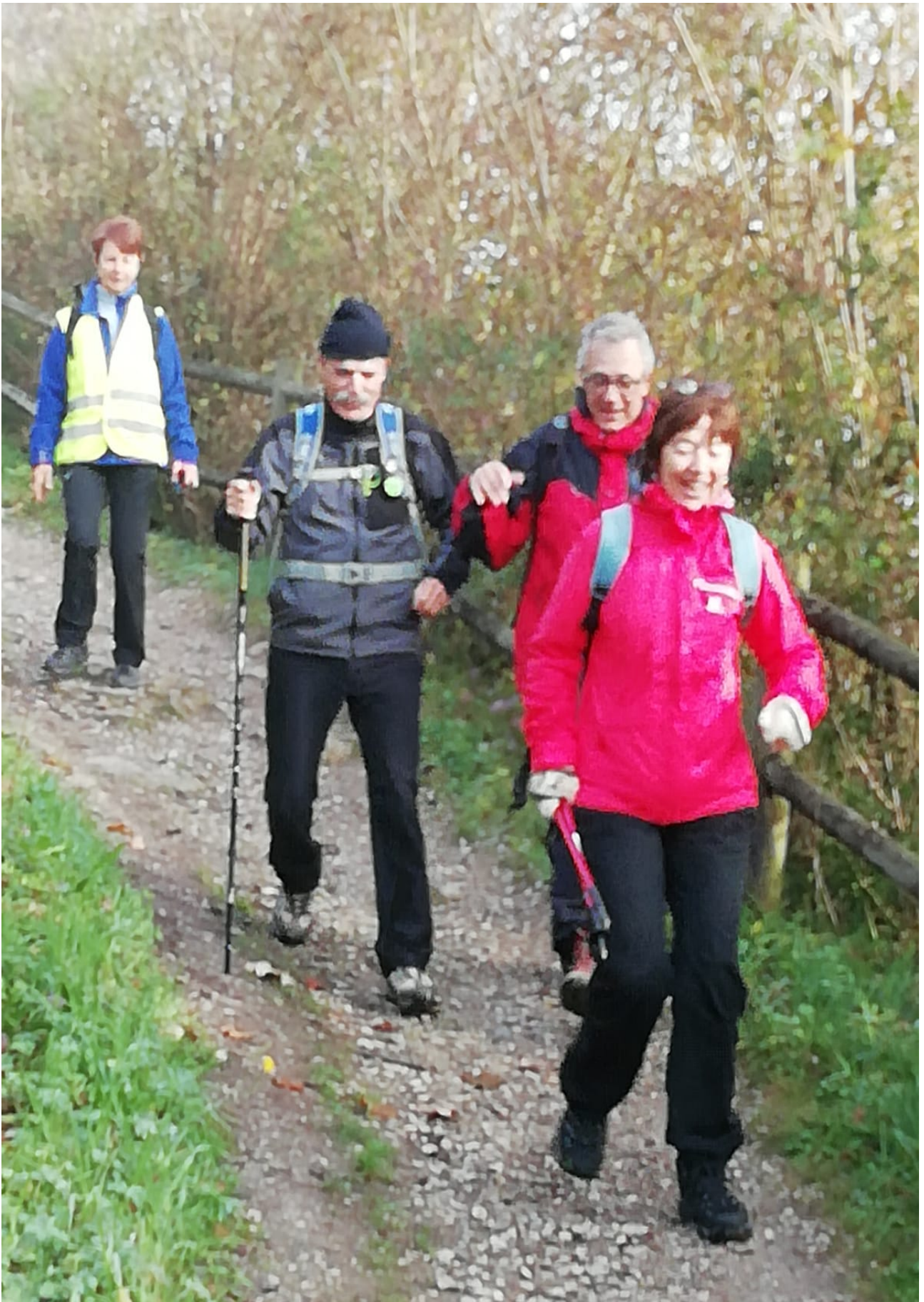
Zein pozik doazen ibiltari hauek!