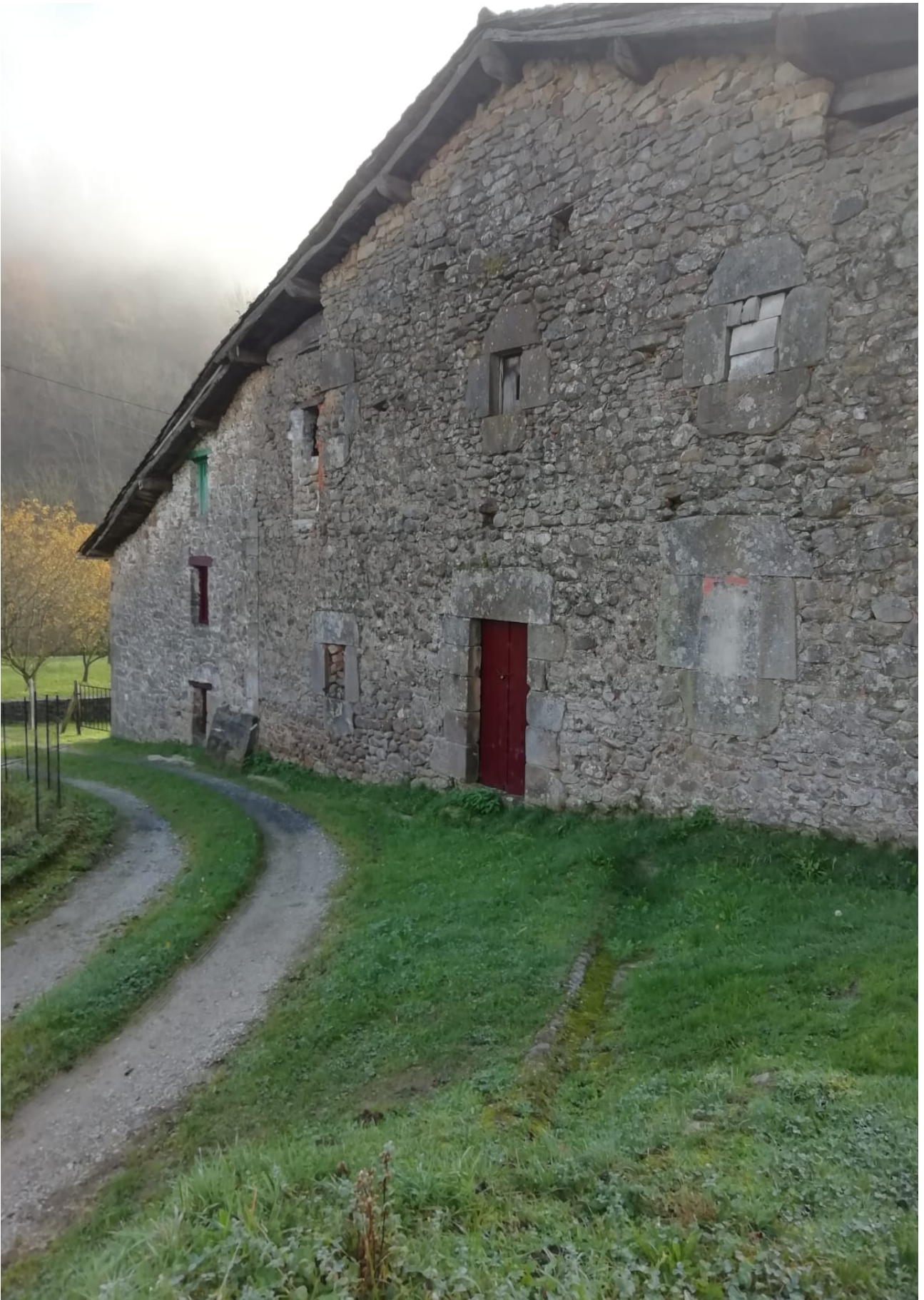
Ibilbideko beste etxetzar ederra