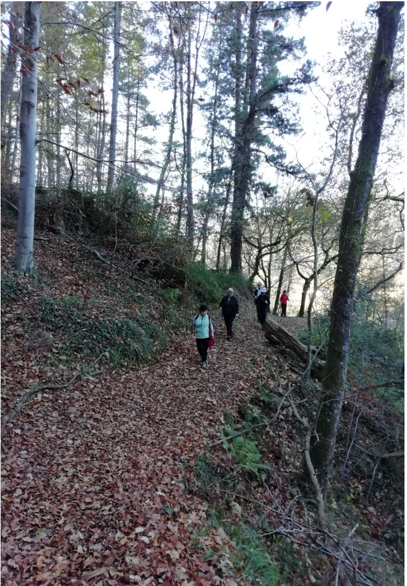
Beste ibiltari hauek ere orbelaz gozaten