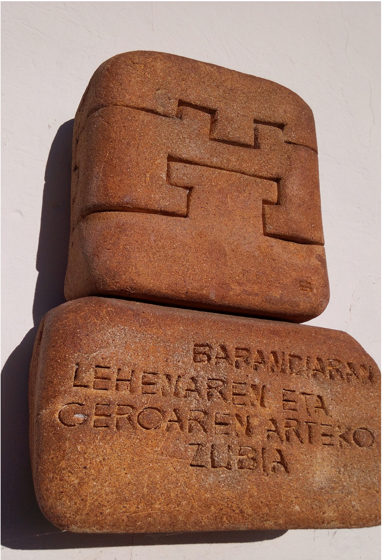
Barandiaranen Omenez egindakoa