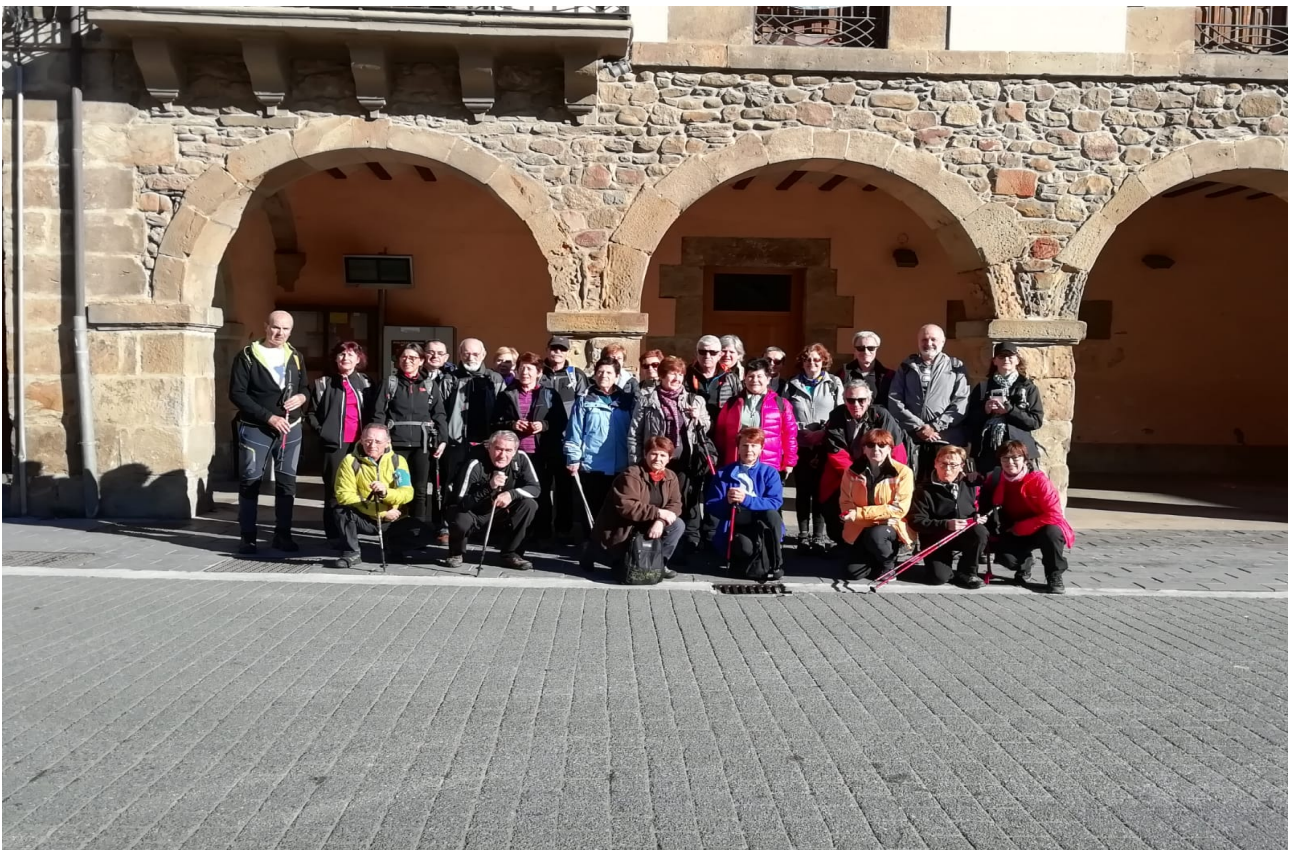
Autobus geltokiaren ondoko talde osoaren argazkia