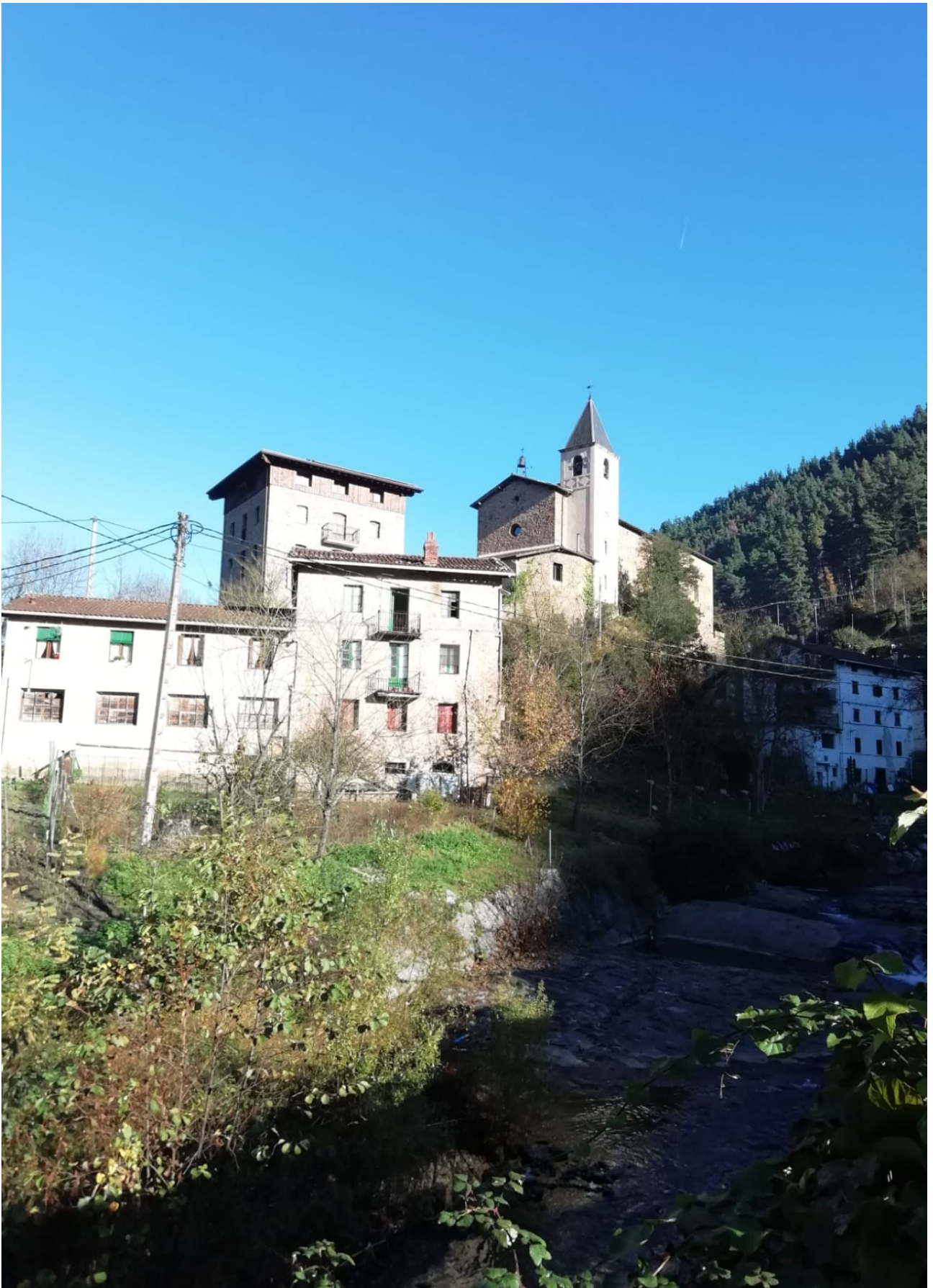
Ataungo San Gregorio auzoa eta eliza