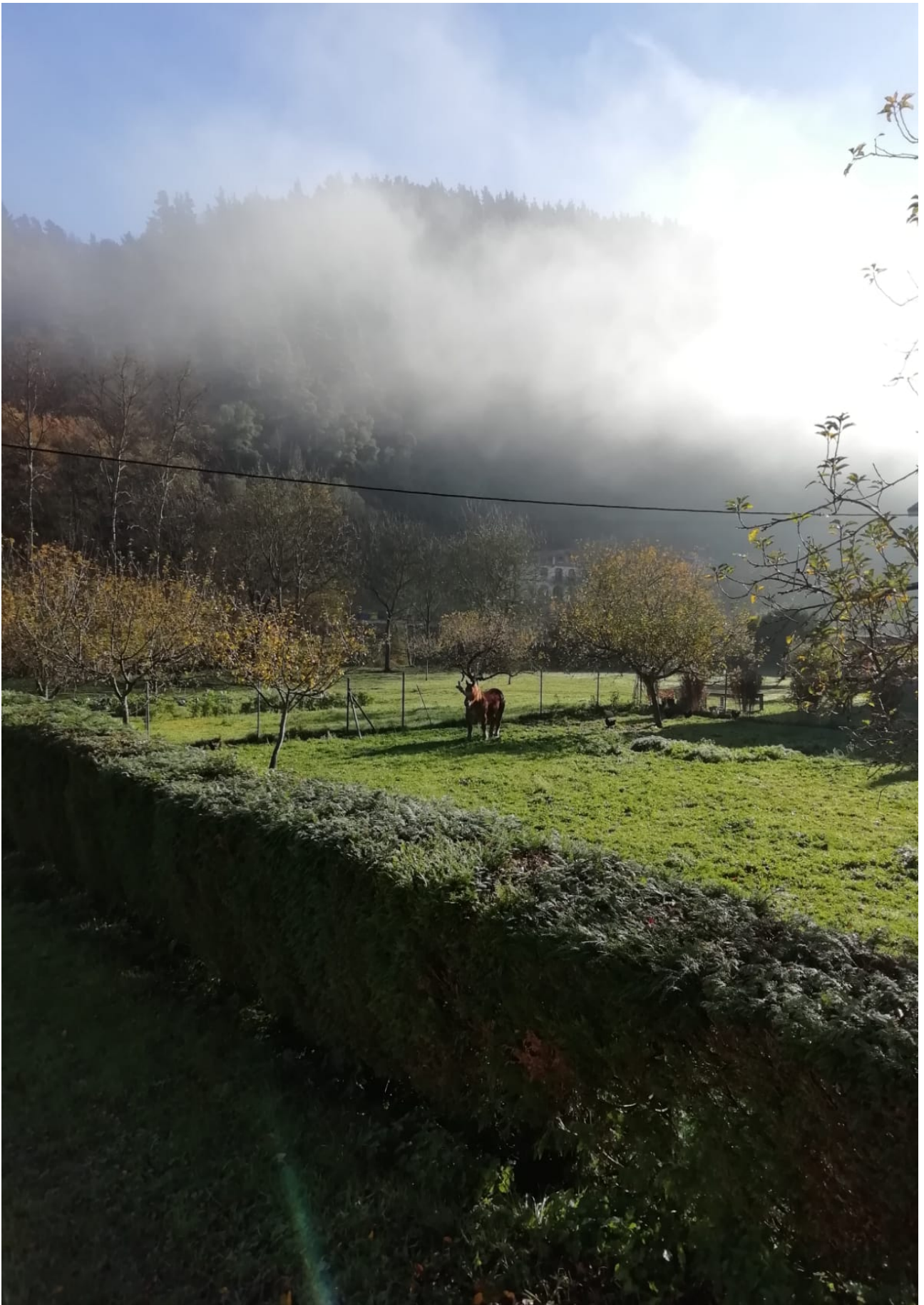
Lehen aipaturikop goizeko lainoa basoan zehar