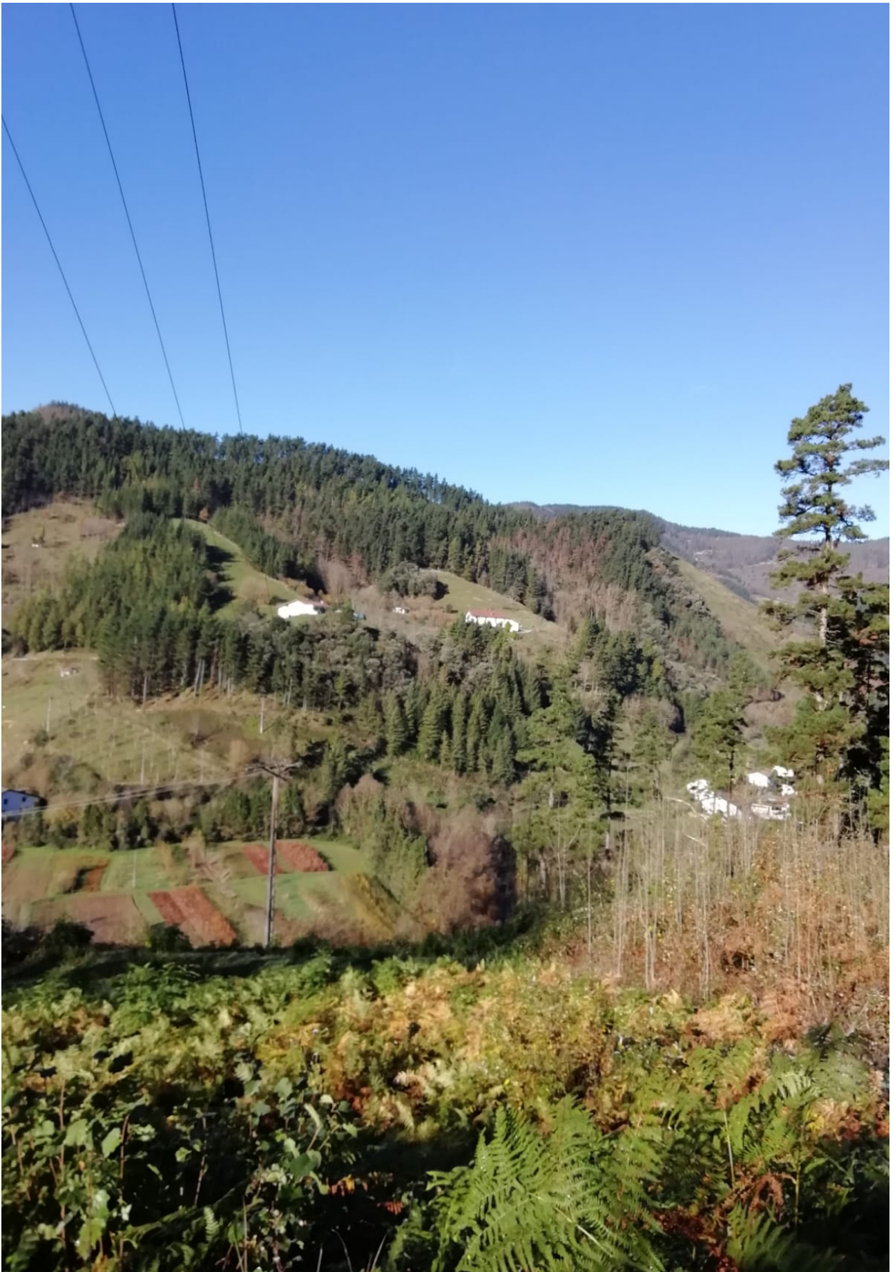
Eguzkia da nagusi ,alde honetan, behintzat