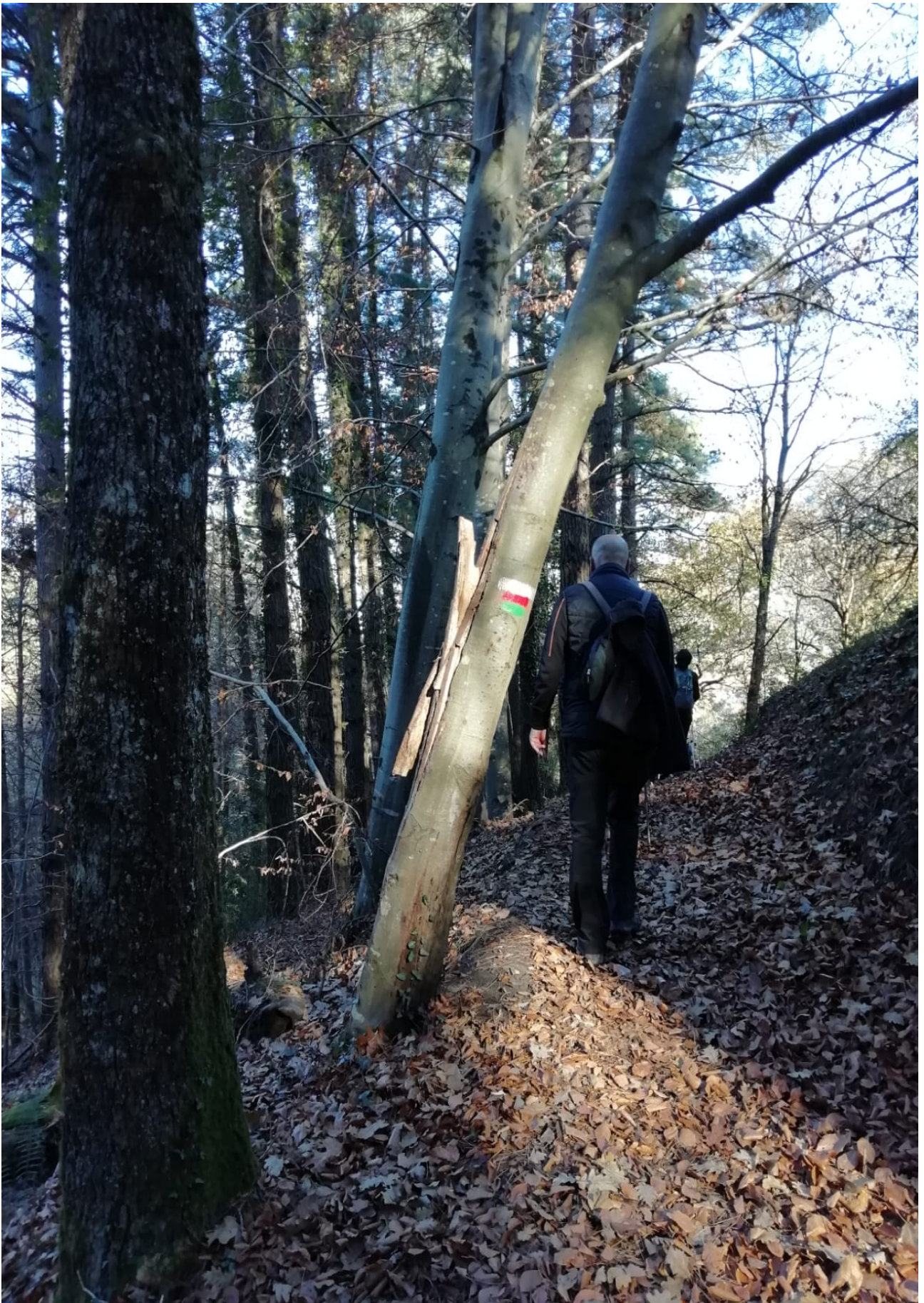
Ibilaldiko aldapatxo batean zehar