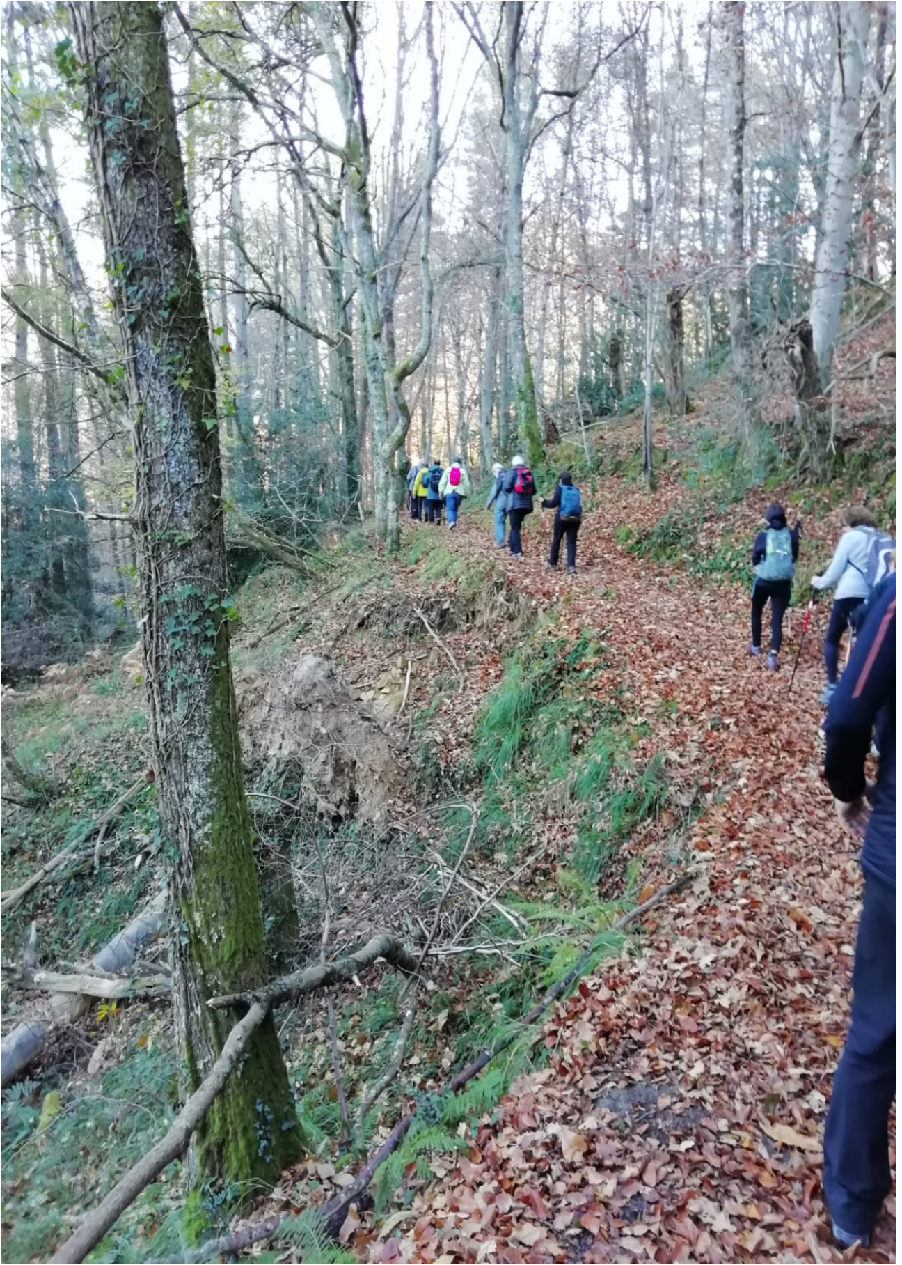
Orbelen goxotasunak ez du parerik