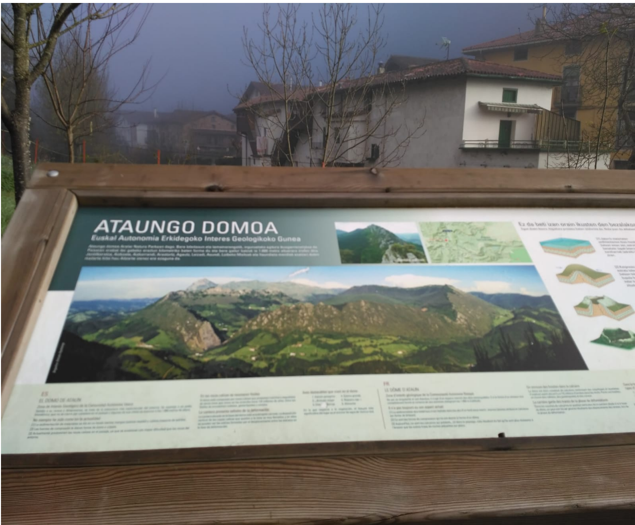
Argazki honetan primeran ikusten da Ataungo Domoa