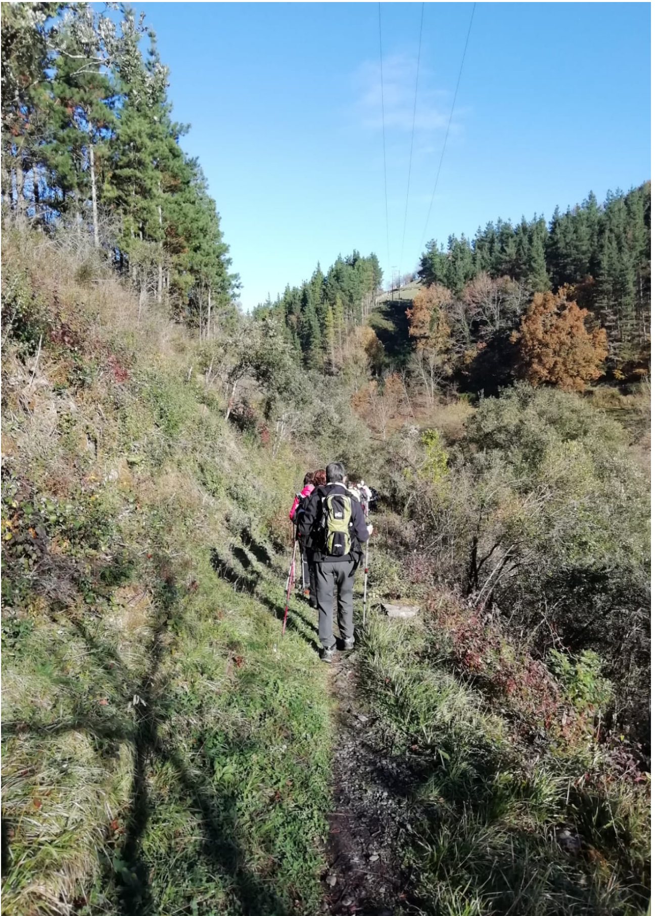
San Gregoriotik gorako aldapatxoan ibiltari hauek