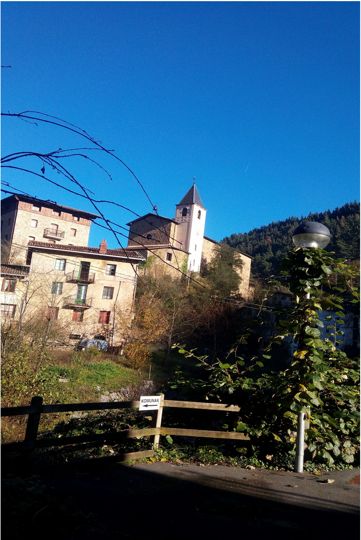
Ataungo San Gregorio auzoa eta eliza