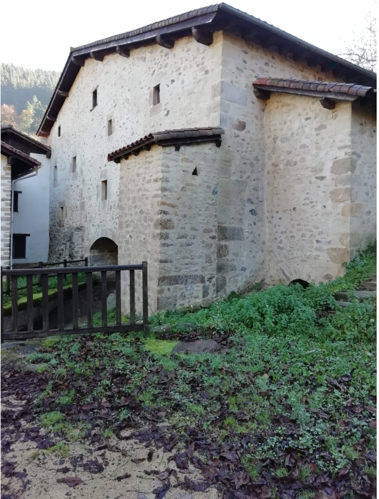
Honelako etxetzarrak ikusten dira ibilaldian zehar