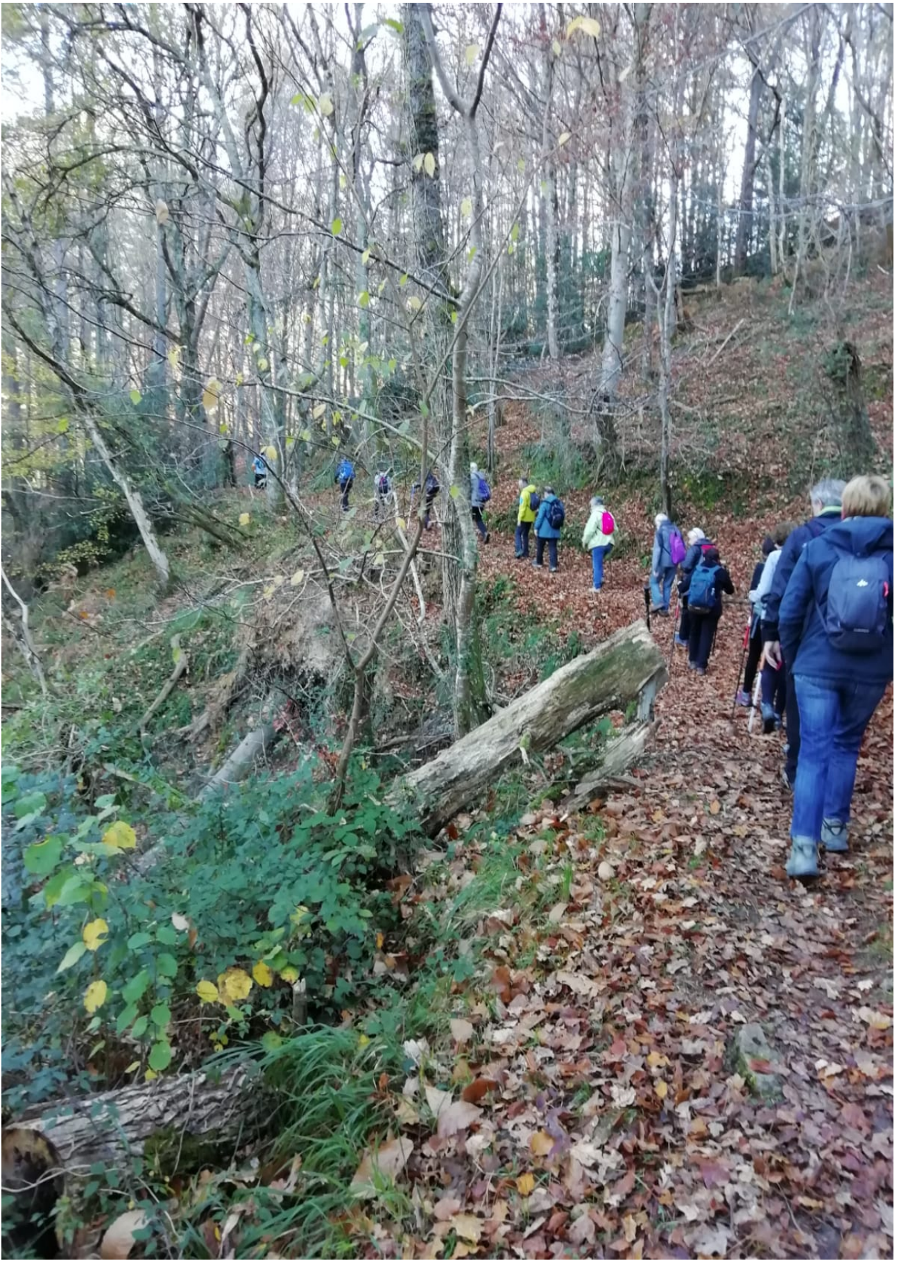
Banan-banan, mendiko giroaz gozaten