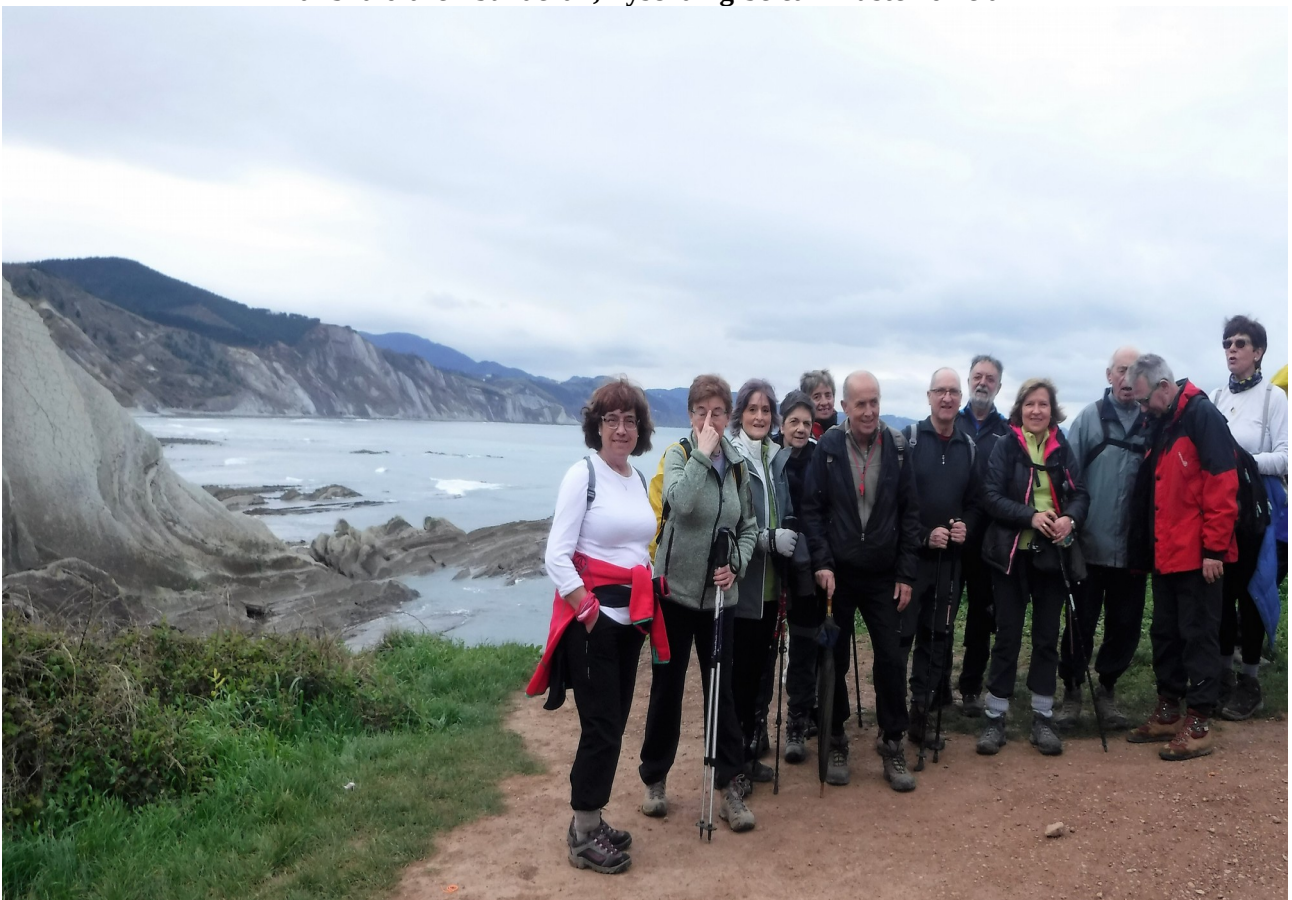
Leku berean, taldeko beste lagunak