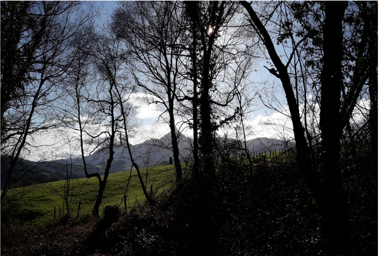
Oiangu berdegunean zehar eta Txindoki zuhaitzen artean