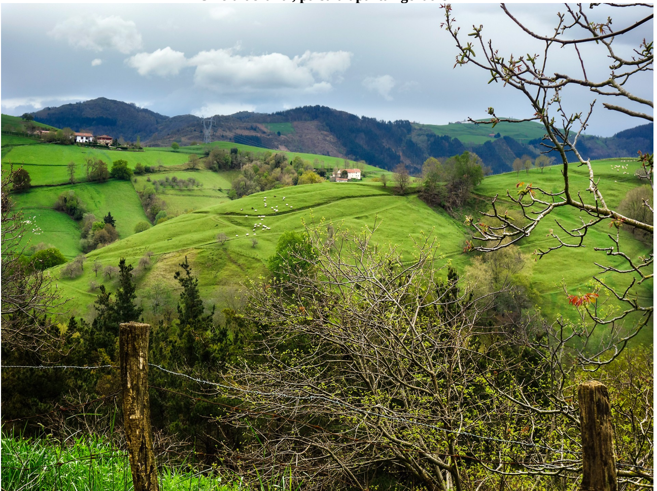
Horrelako eguraldi euritsuarekin ez da harritzekoa honelako paisaia berdea izatea