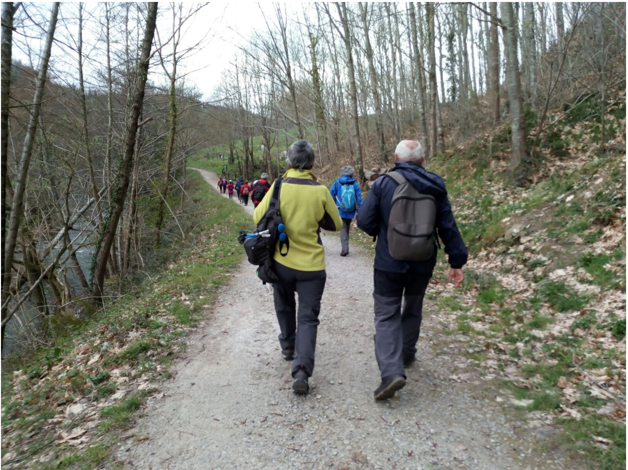
Agauntza ibaiaren ondoko pistan zehar ibiltariak