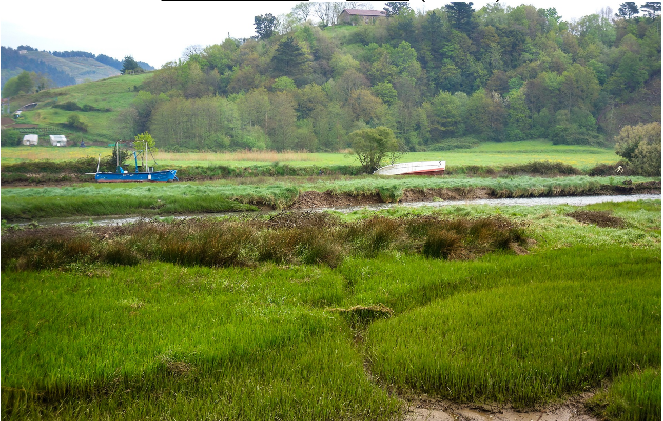
Oria ibaiaren inguruan

Orio-Aiako San Pedro auzoa-Aia-Orio (2018-13-04)