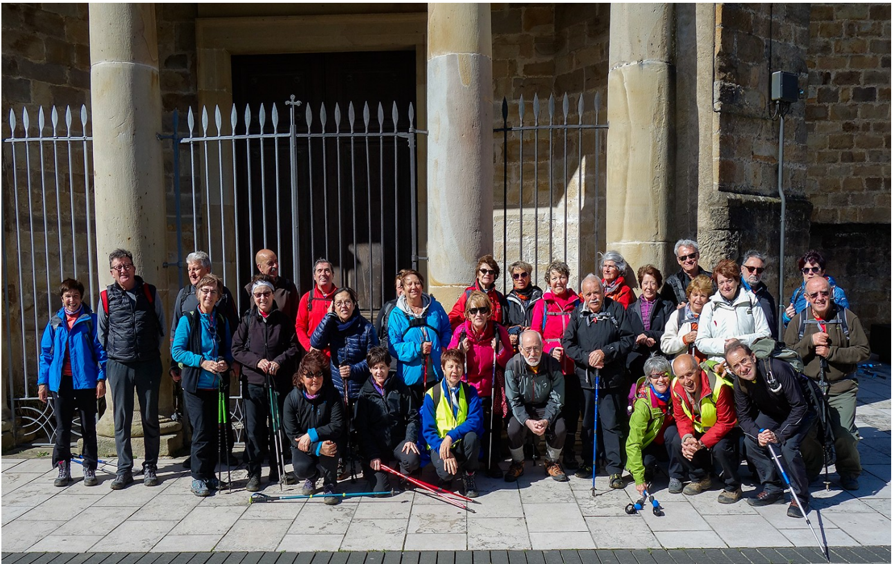
Leku berean, antzeko argazkia