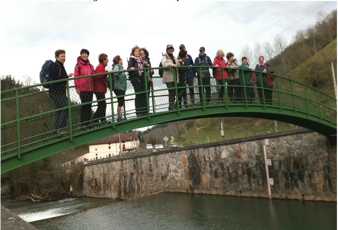
Ataungo zubi batean, Agauntza ibaia azpian dugula