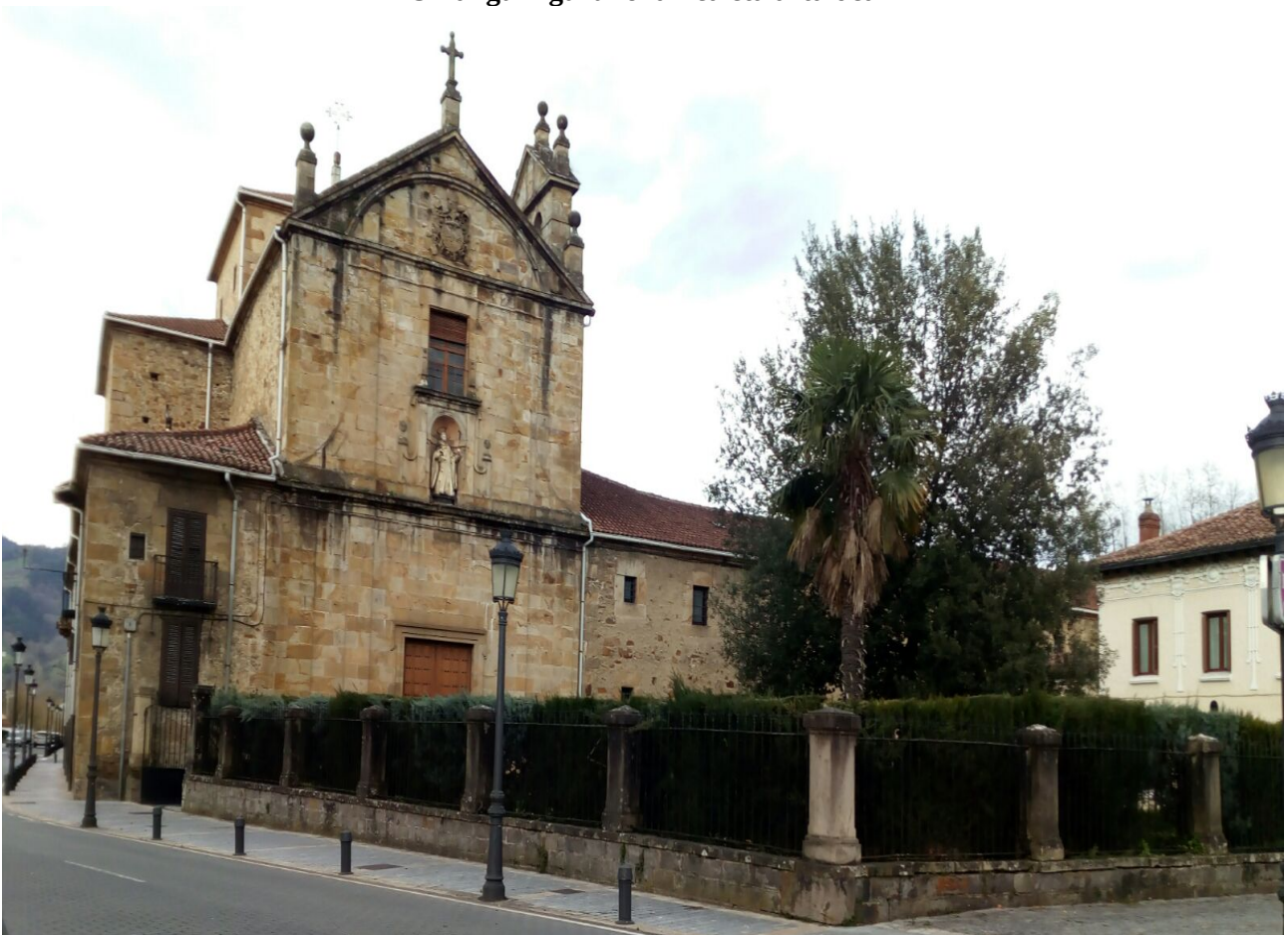
Ordiziako eliza bat