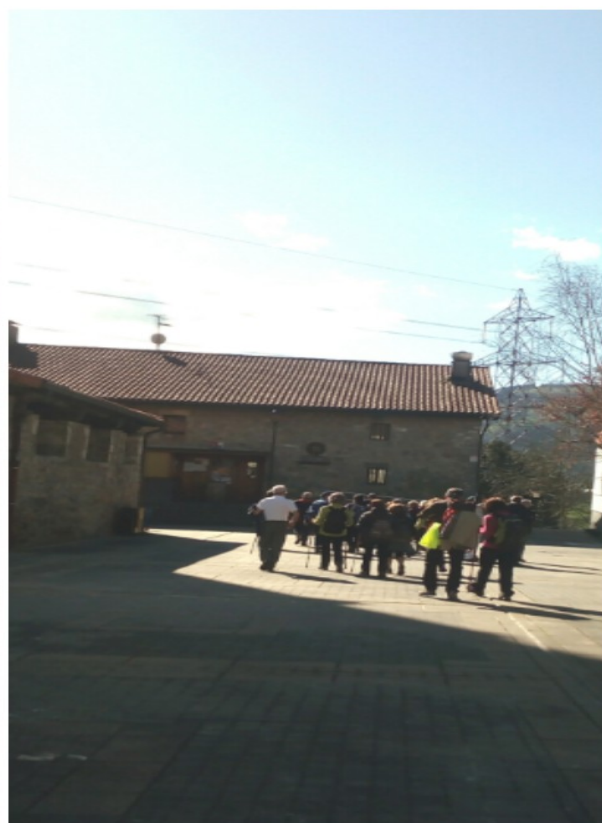
Adunako eliza ezkerrean eta Uztartza jatetxea eskuinean