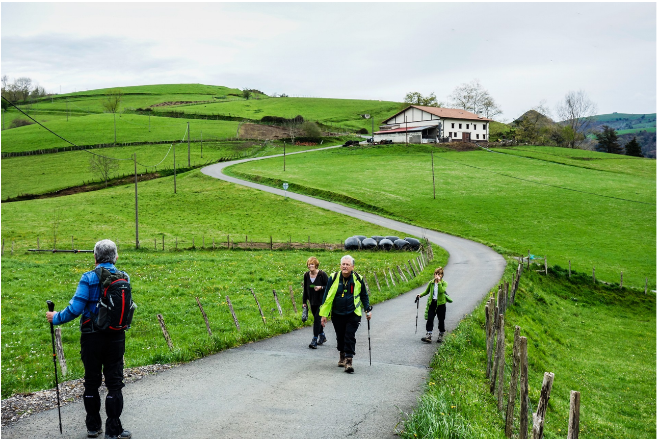
Aiara iristear, tropeleko atzealdea