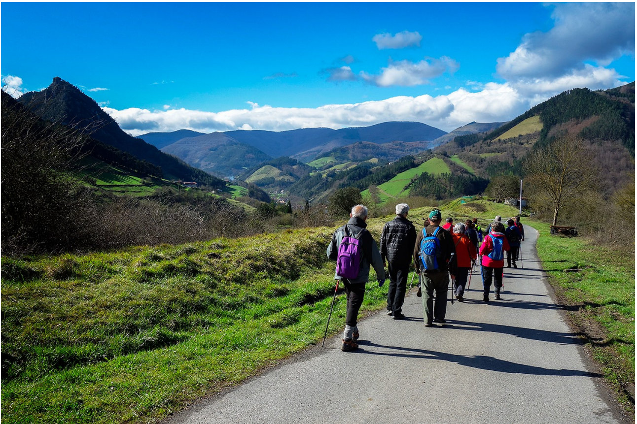
Ezkerraldean Ataungo domo edo Kratterra