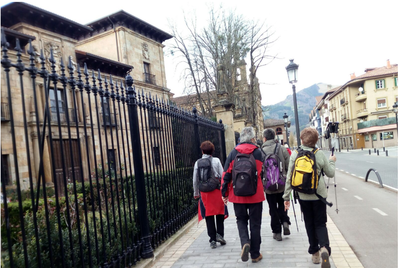
Ordiziako kaleetan zehar