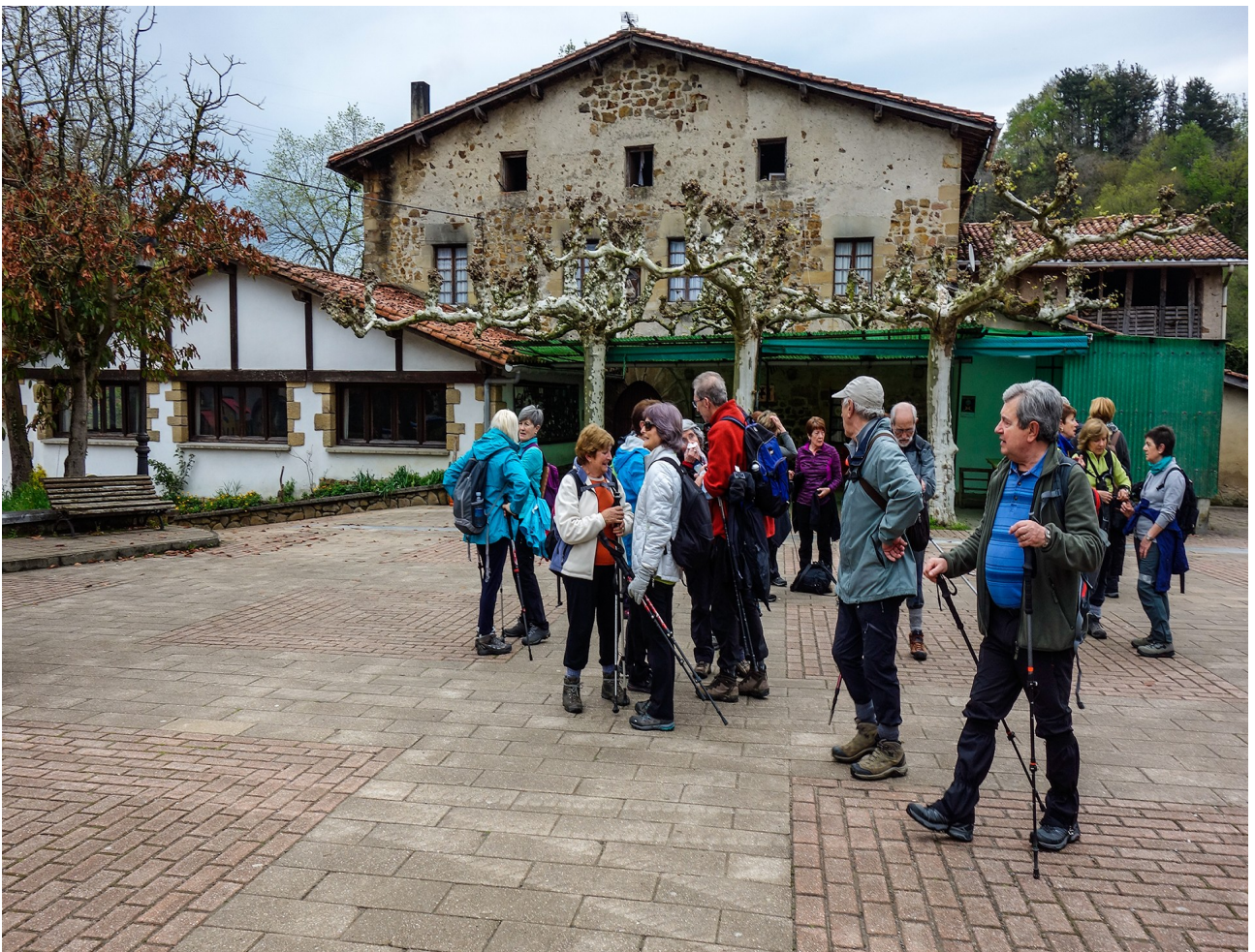
Aiako San Pedro auzoan, eguneko atseden laburrean taldea