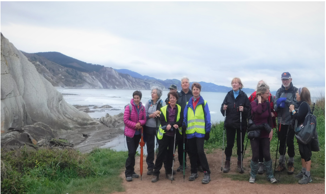
Zumaiako flyschen inguruan, Telmo Deum basilizara igo baino lehen