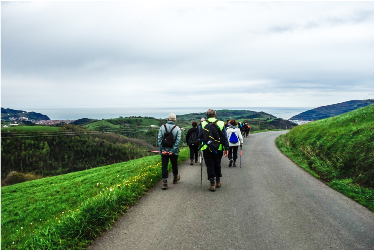
Orio alderantz, paisaia apartaz gozatzen