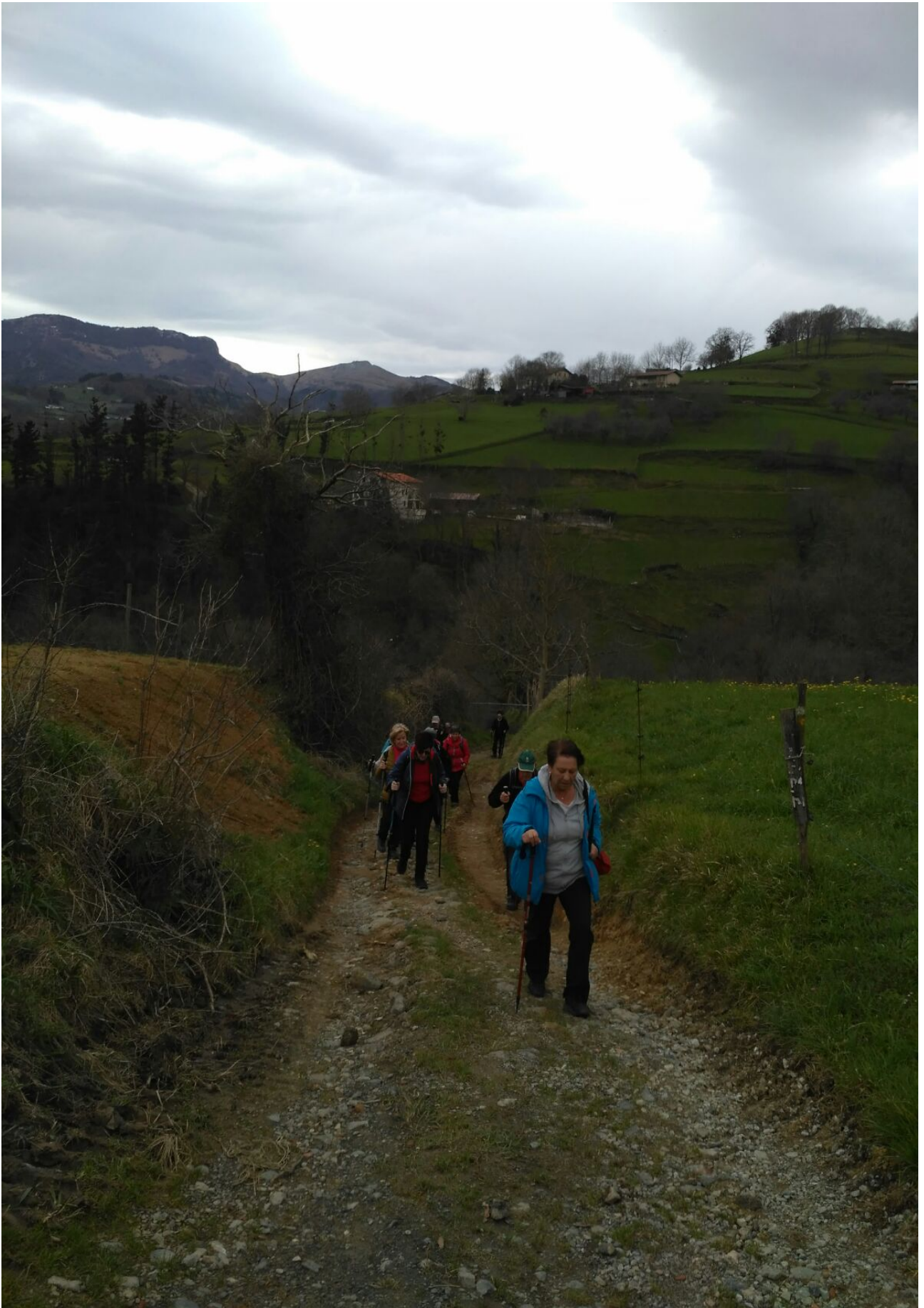
Adunara garamatzan aldapa gogorra