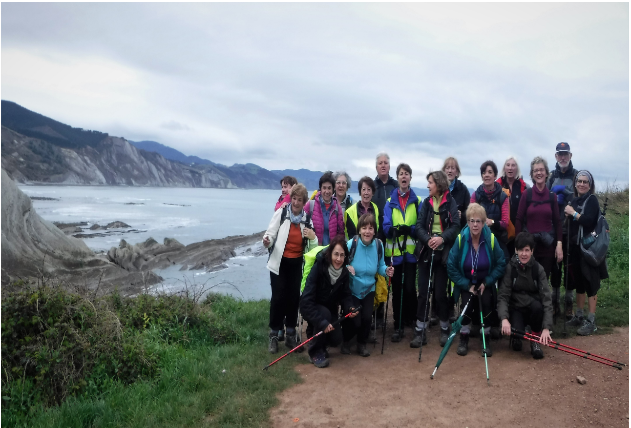
Ia ibilaldiaren bukaeran, flyschak gibelean ikusten direla