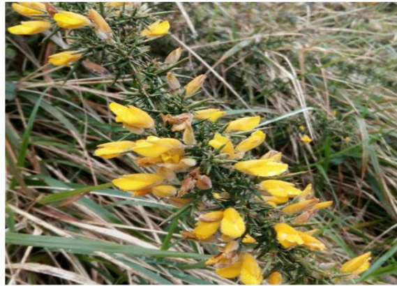
Zumaiako “fysch” alderdi bat, Elorriagako ate zaharra eta landaredia