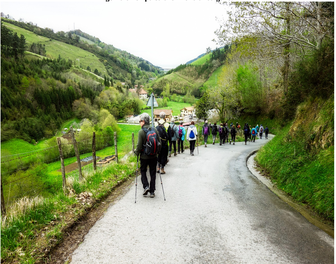
Orio alderantz, ibilbidearen azkeneko zatian