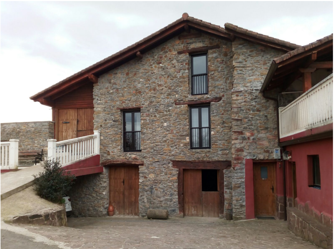
Ibilbidean zehar ikusten diren etxe ederrak