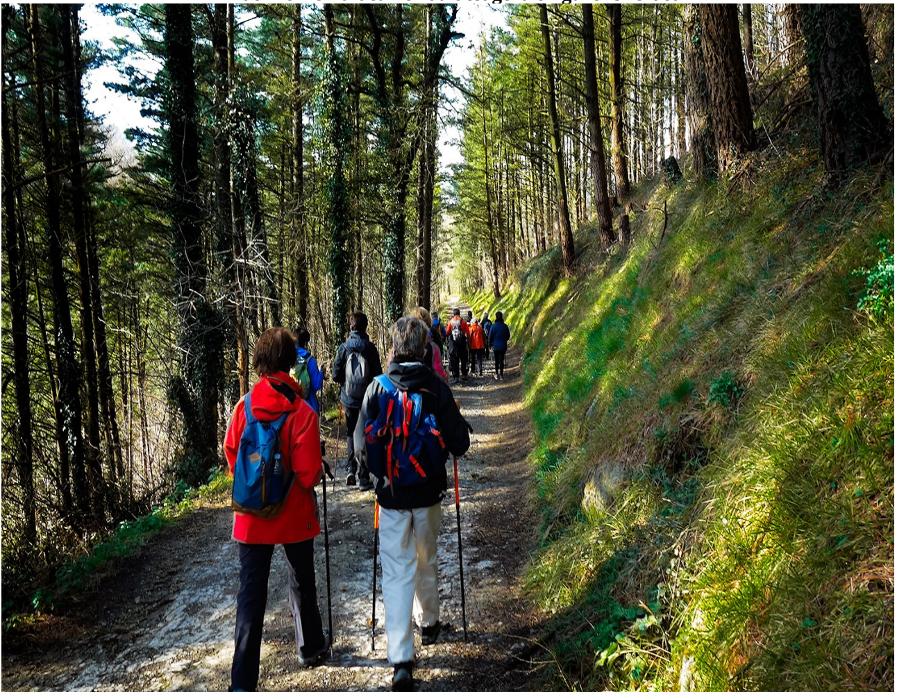
Basoan zehar Ataun alderantz ibiltariak