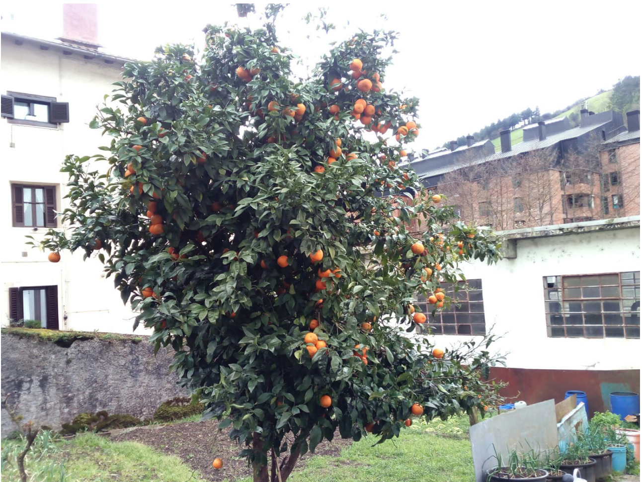
Gezurra badirudi ere, Ataungo laranjondo bat