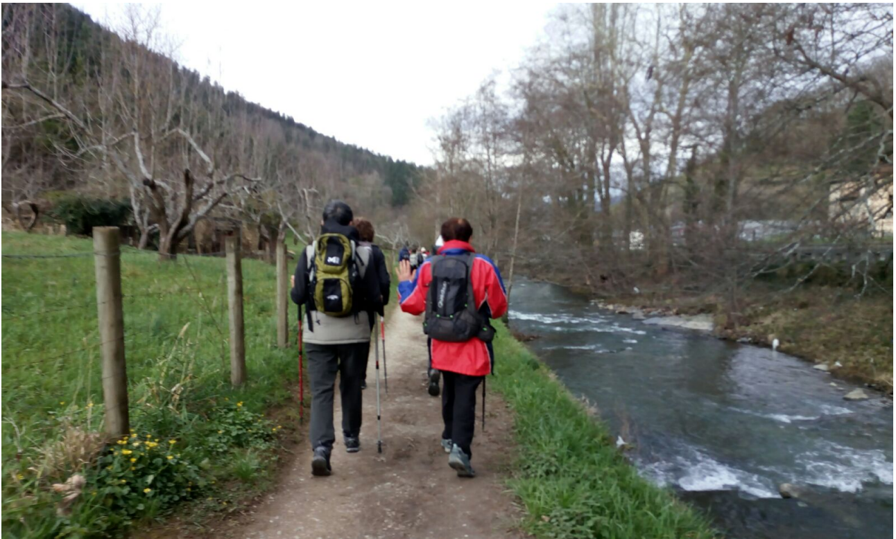
Agauntza ibaia ondoko pistatik zehar ataunen