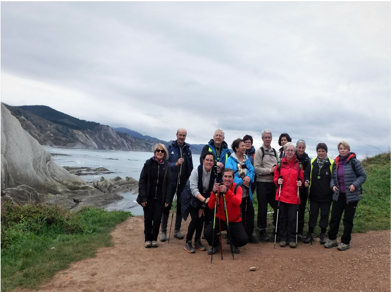
Azkeneko taldetxoa, Telmo Deum basilizara igo baino lehen