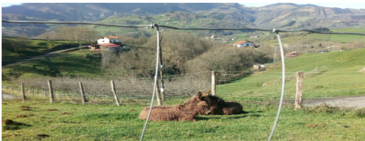
Abeletxe jatetxea eta bere inguru apartak