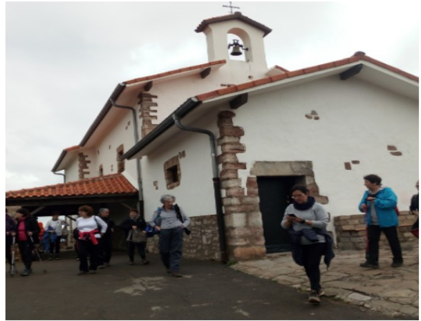
Telmo Deum basiliza eta inguruak