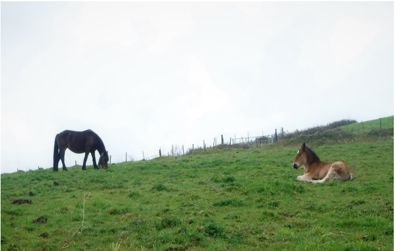
Behorra bazkatzen ari den bitartean, zaldiko edo moxala lasai askoan belardian