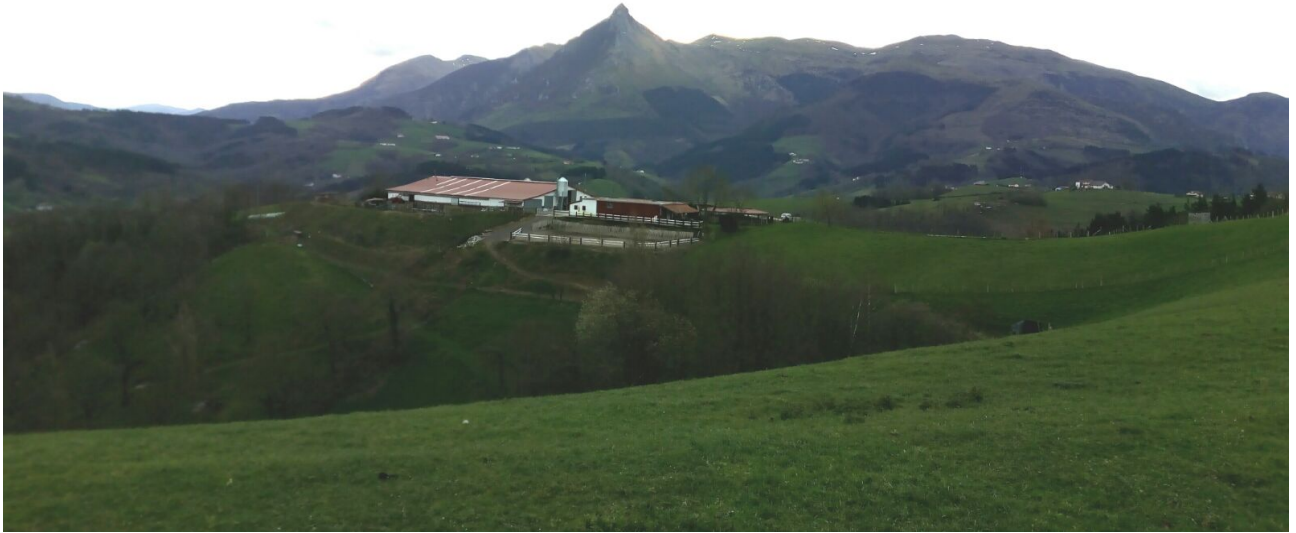
Txindoki aurrez aurre paisaia paregabea