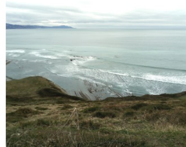
Ibilaldiko une aski ederrak