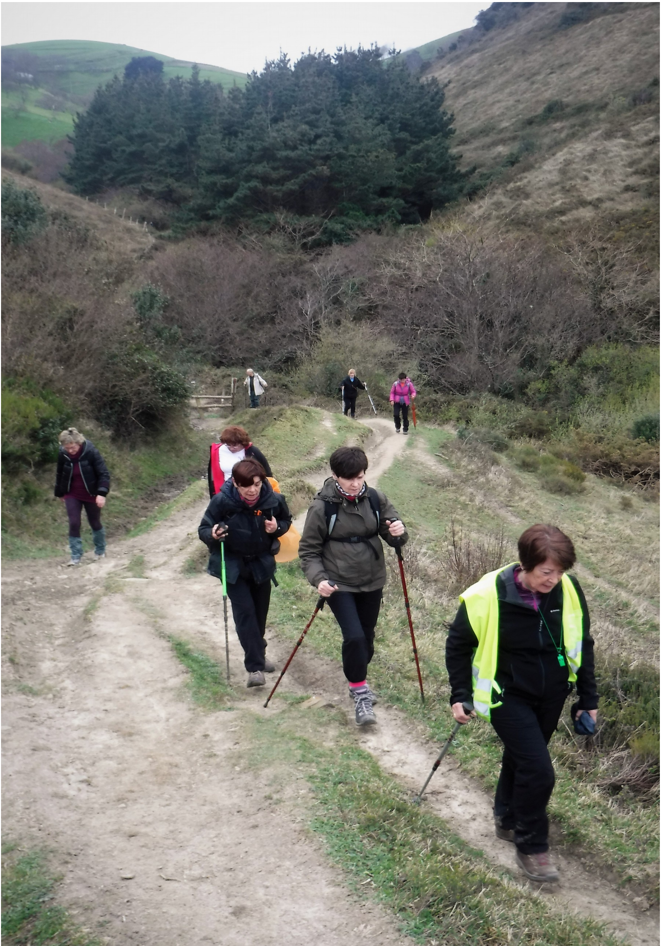
Ibilaldiko une batean, ataka edo langa igaro ondoren