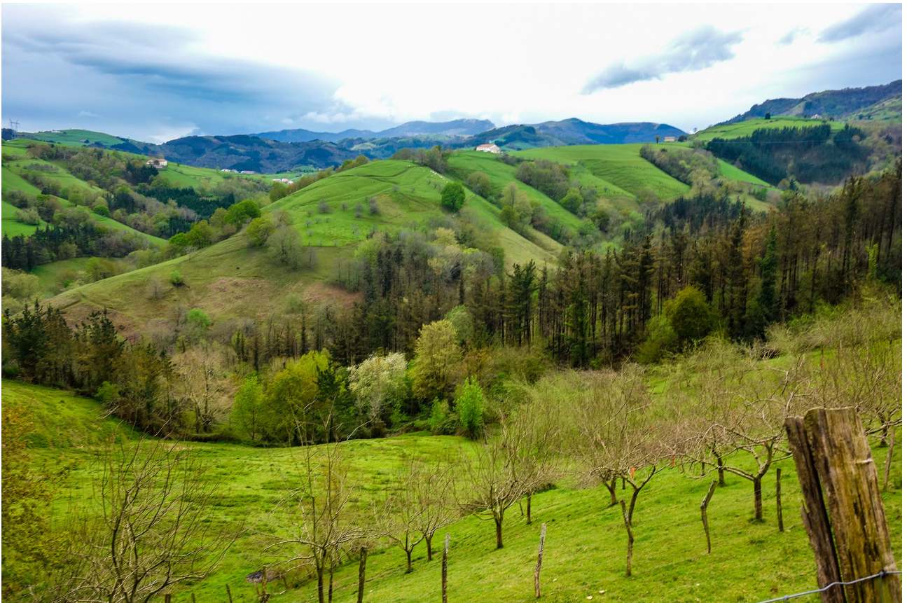
Agorra diren paisaiaren kontrakoa gurea