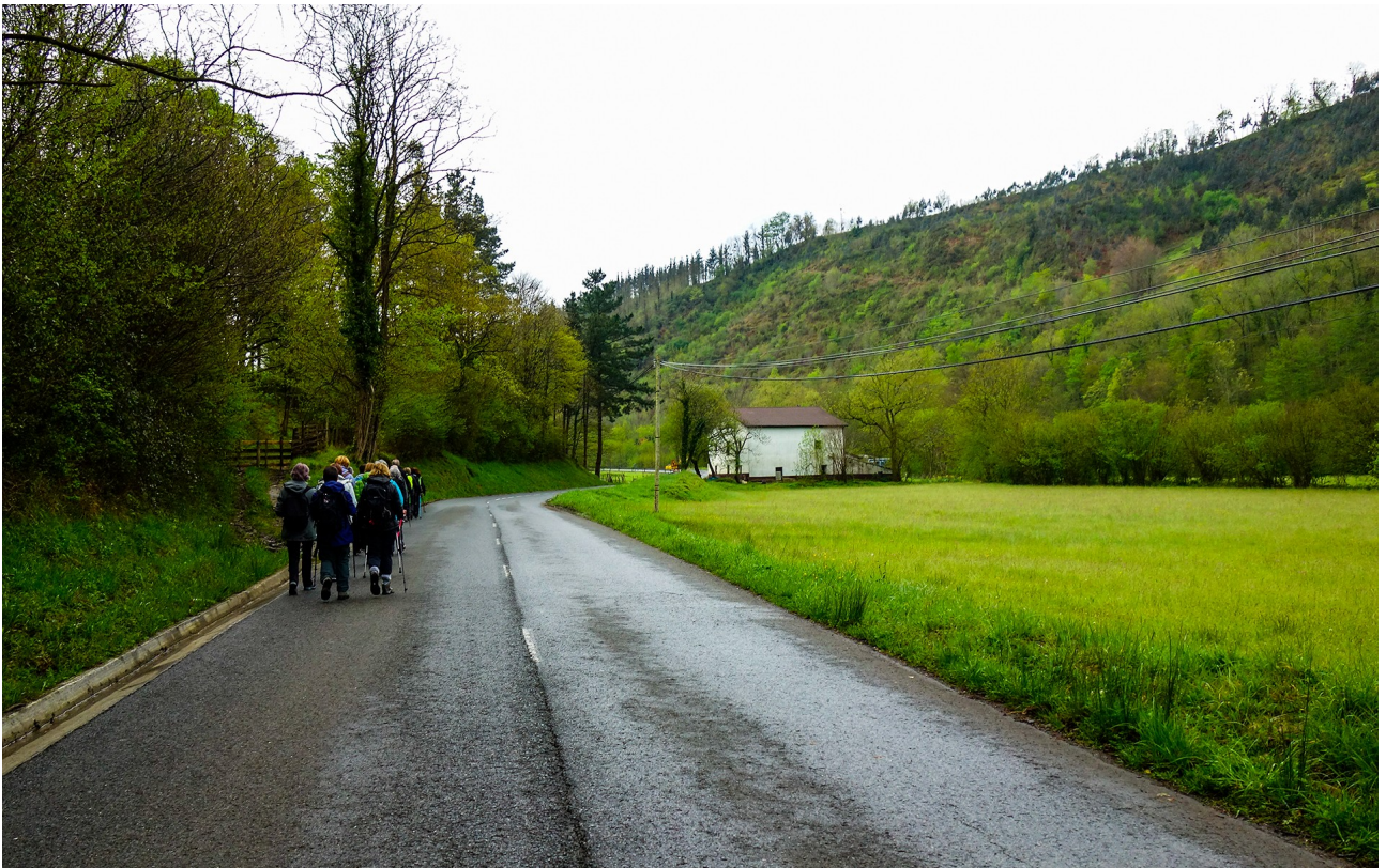
Oriotik abiatuak, Aiako San Pedro auzorantzeko bidean