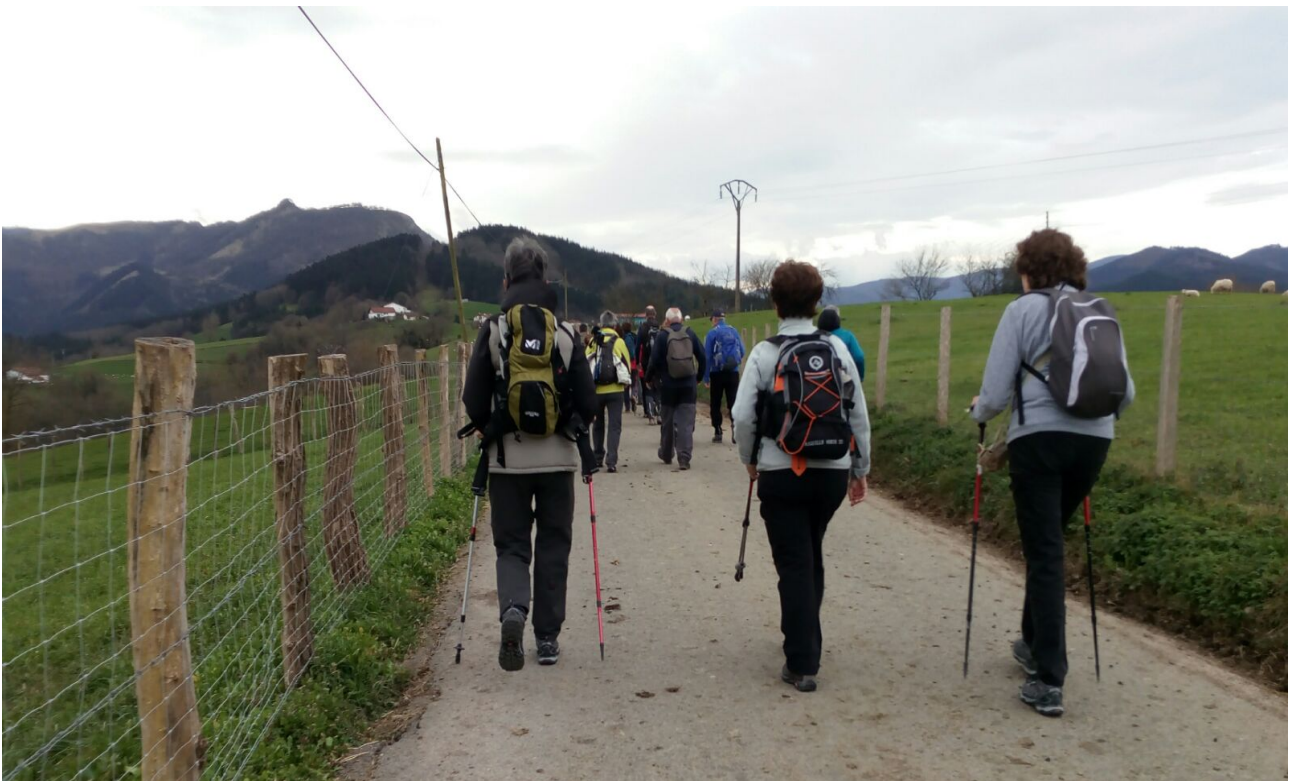
Berdegunea alderdi guztietatik Goierriko leku honetan