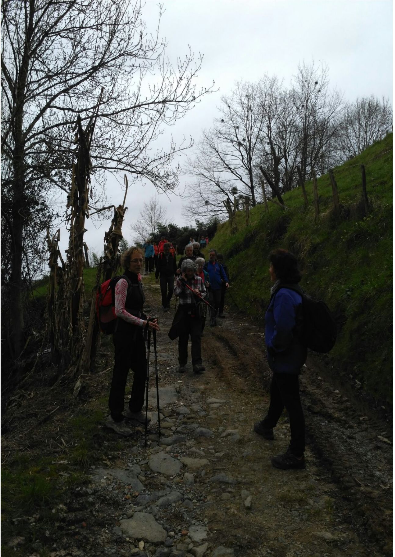
Adunara doan bidean zehar