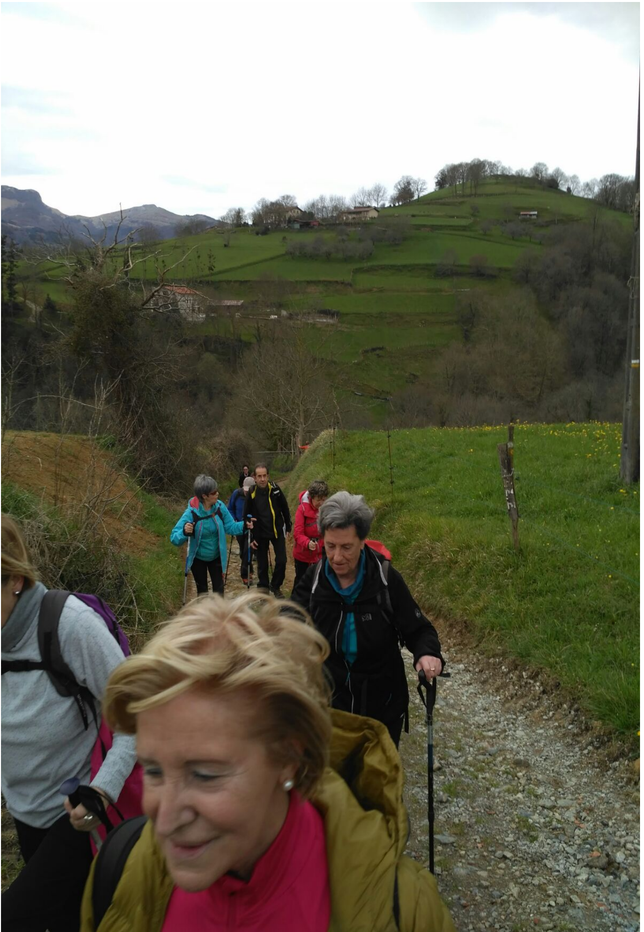
Ibiltari hauek ez ditu beldurtzen gogortasunak