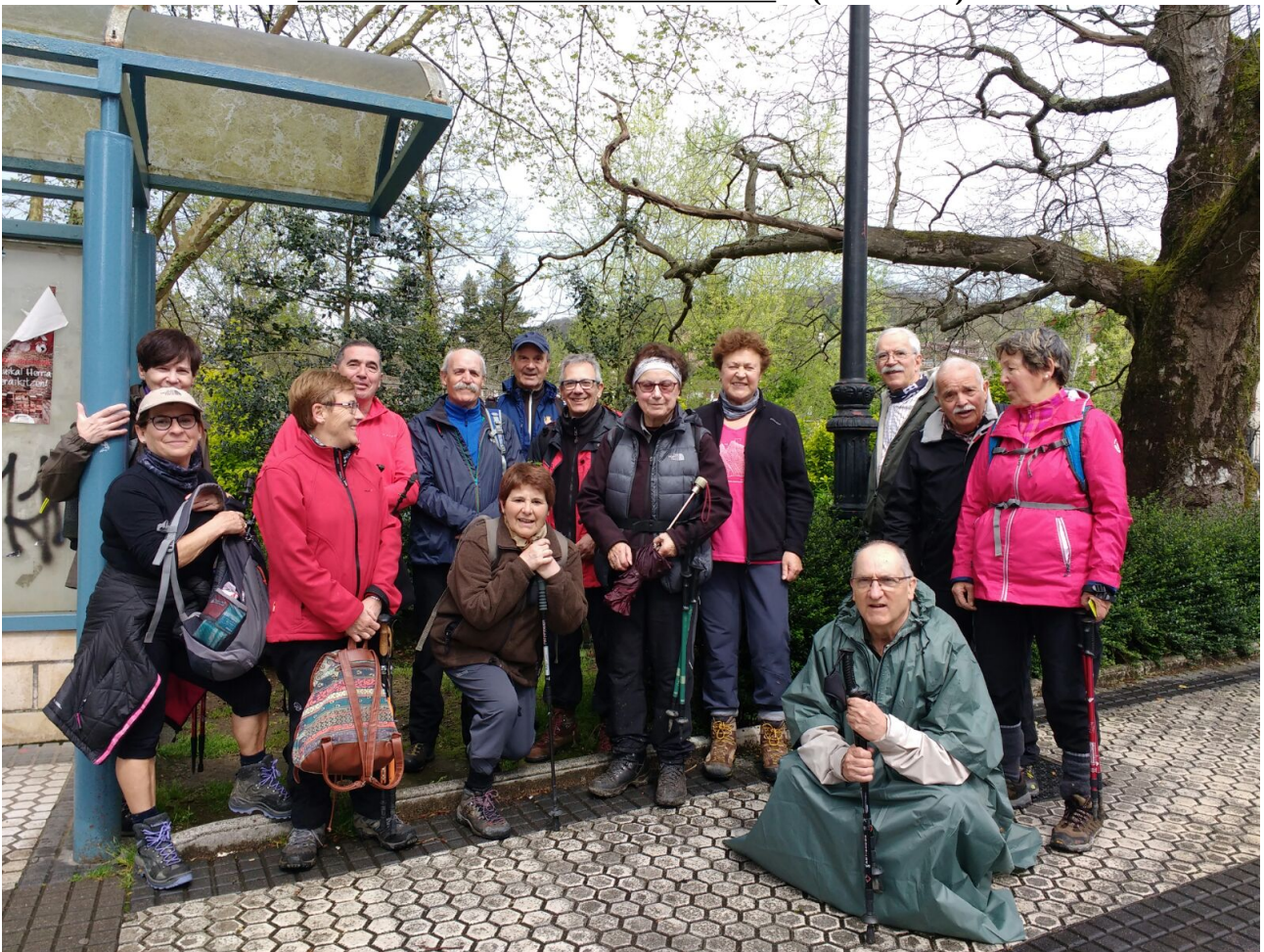
Taldea Altzibarreko autobus geltokian