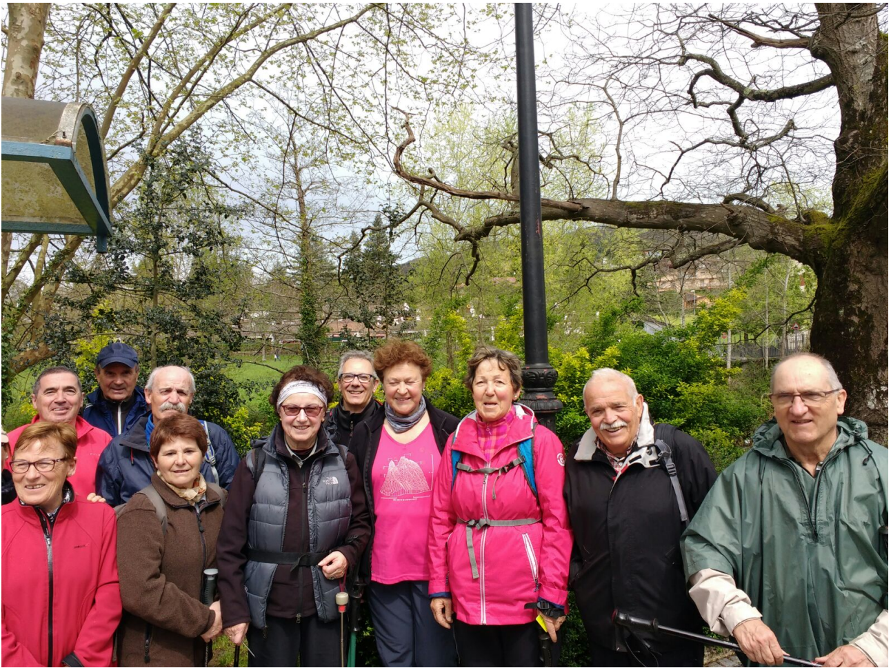
Leku berean, landarediaz inguraturik

Orio-Aiako San Pedro auzoa-Aia-Orio (2018-13-04)