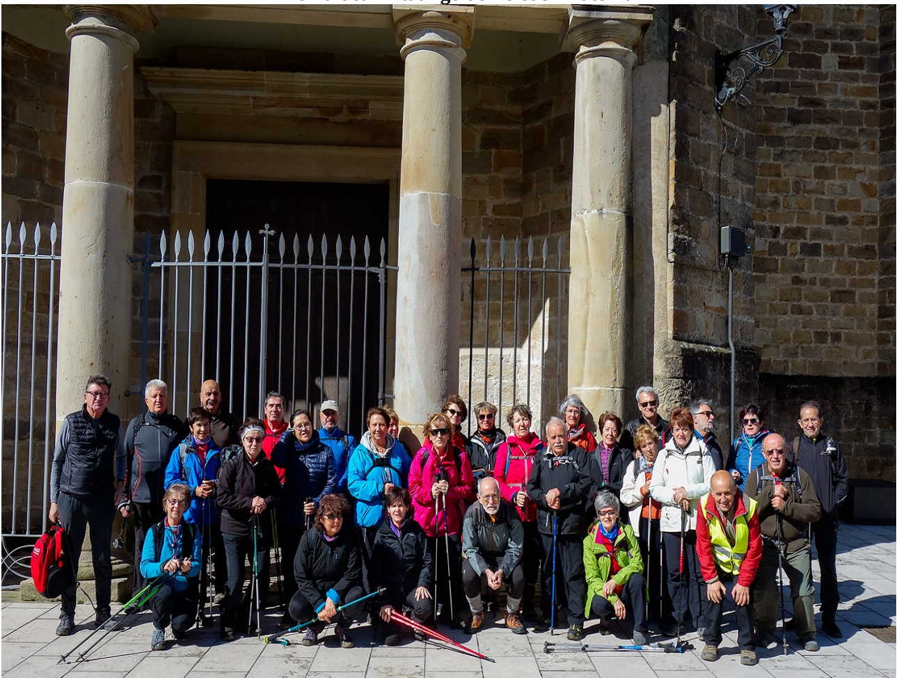
Ataungo elizaren aurrean taldearen argazkia