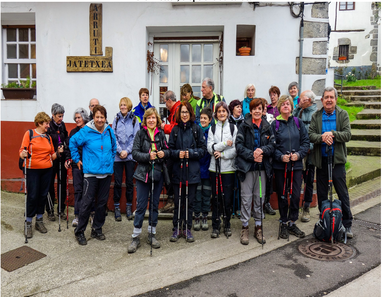
Aiako Arruti jatetxearen ondoan, hamaiketakoa hartu ondoren?