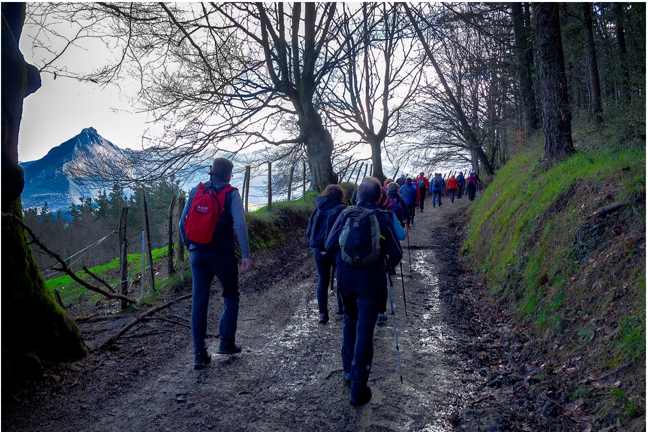
Txindoki ezker aldean ez da desagertzen gure ibilbidetik