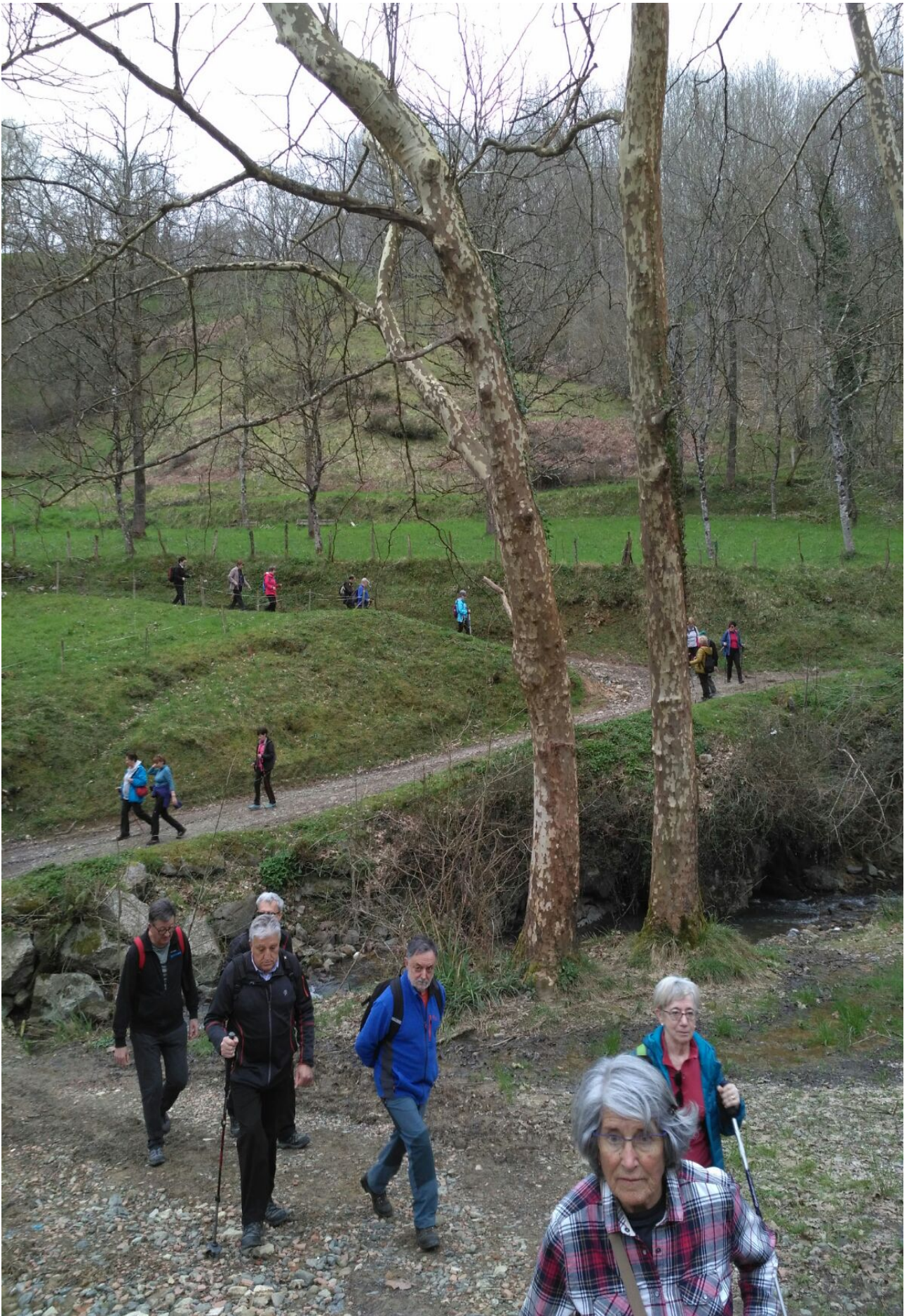
Aldapa gogorra hasi baino lehenagoko lekua