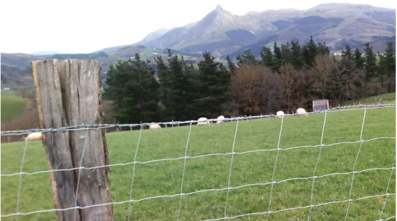
Oihangu inguruko larrea eta artaldea