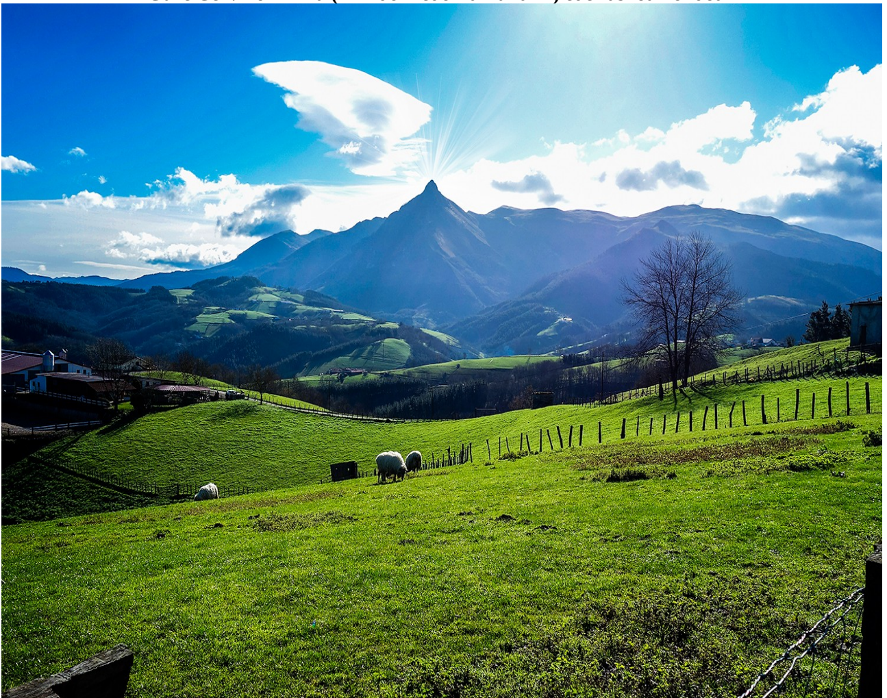
Goierriko paisaia bukolikoa eta Txindoki aurrez aurre