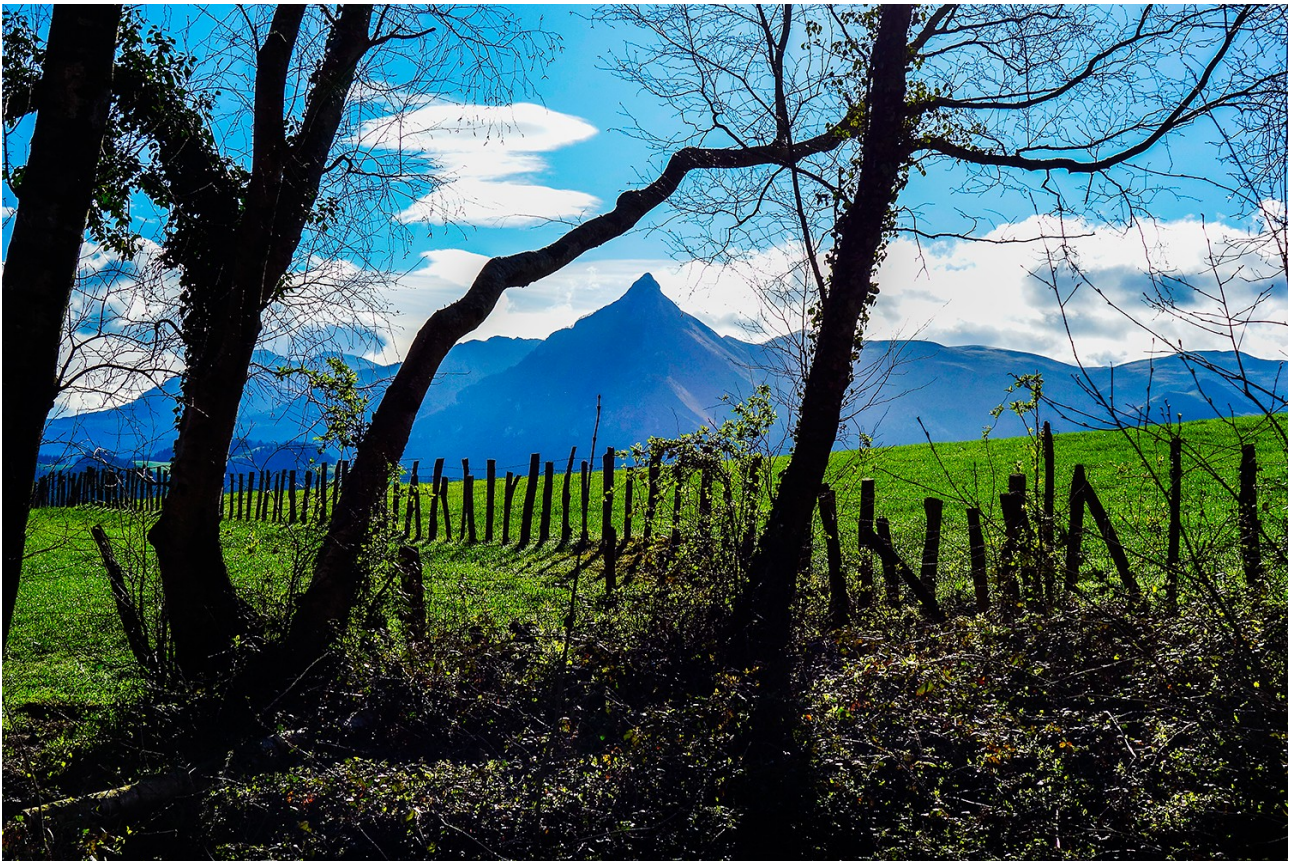
Gure Cervino Txikia (Txindoki edo Larrunarri) eder askoa hondoan