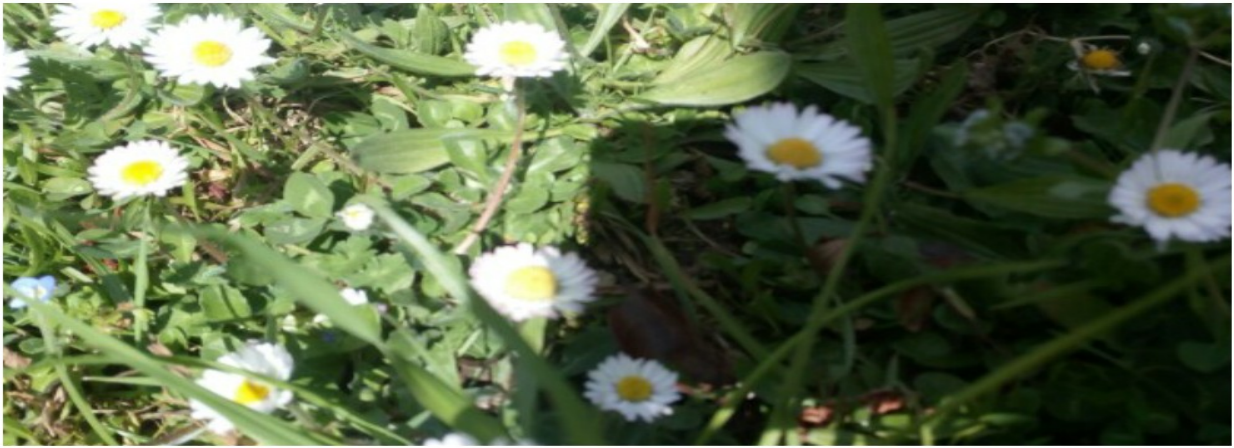
Landare eta bitxilore ederrak garai honetarako (eguberriaren seinale?)