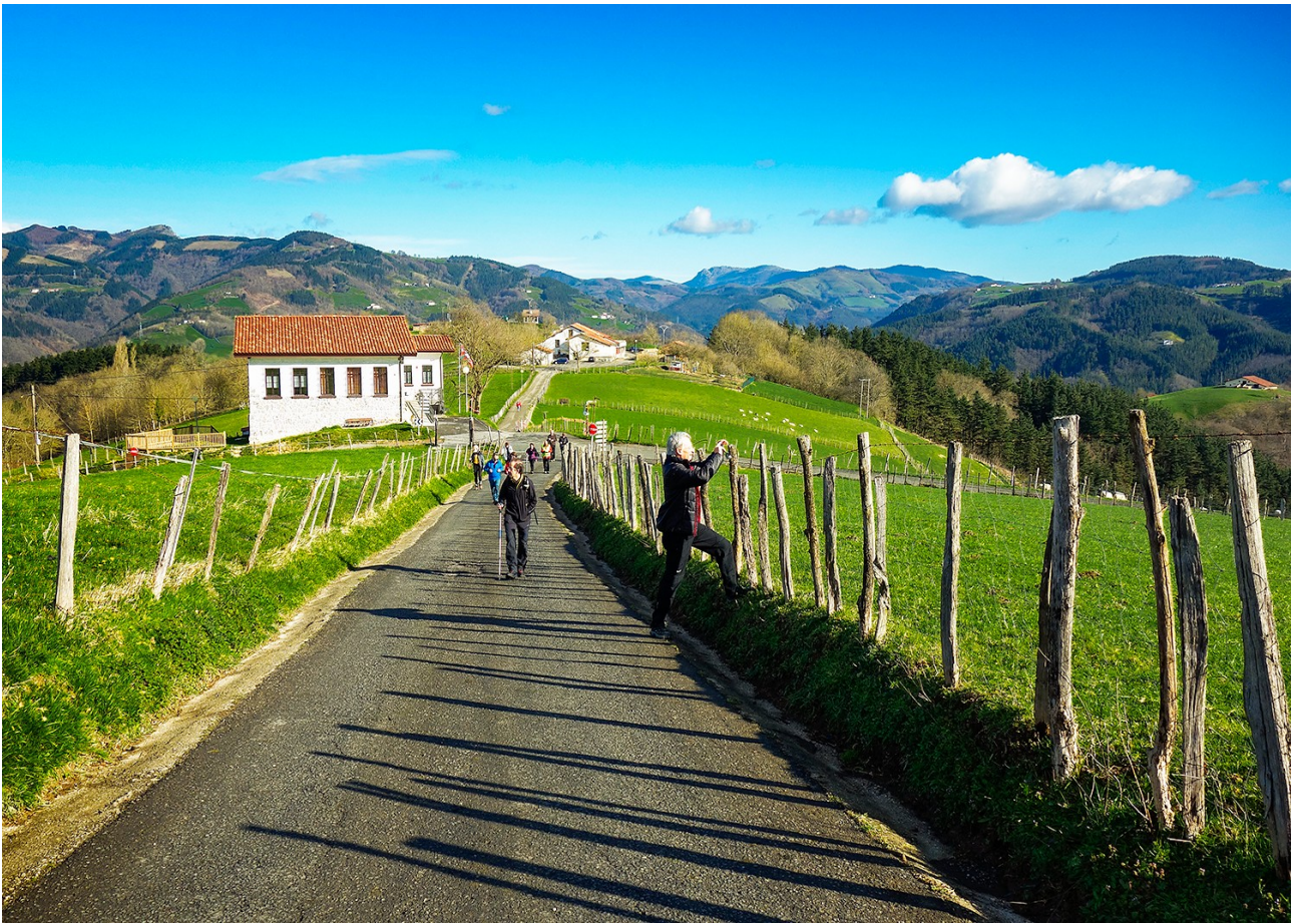
Ibilaldiko une gozagarriak