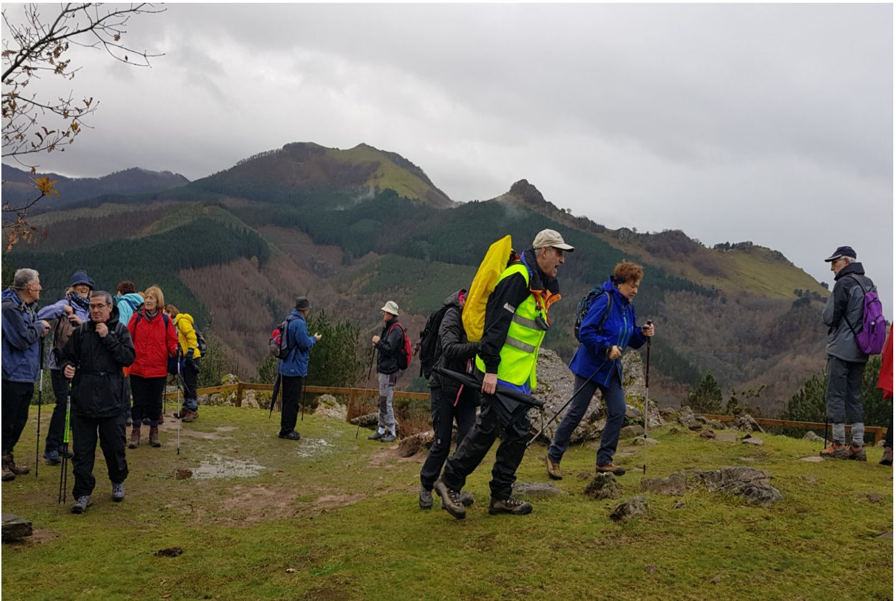
Mulisko Gainetik Urnietarantz abiatzeko prest