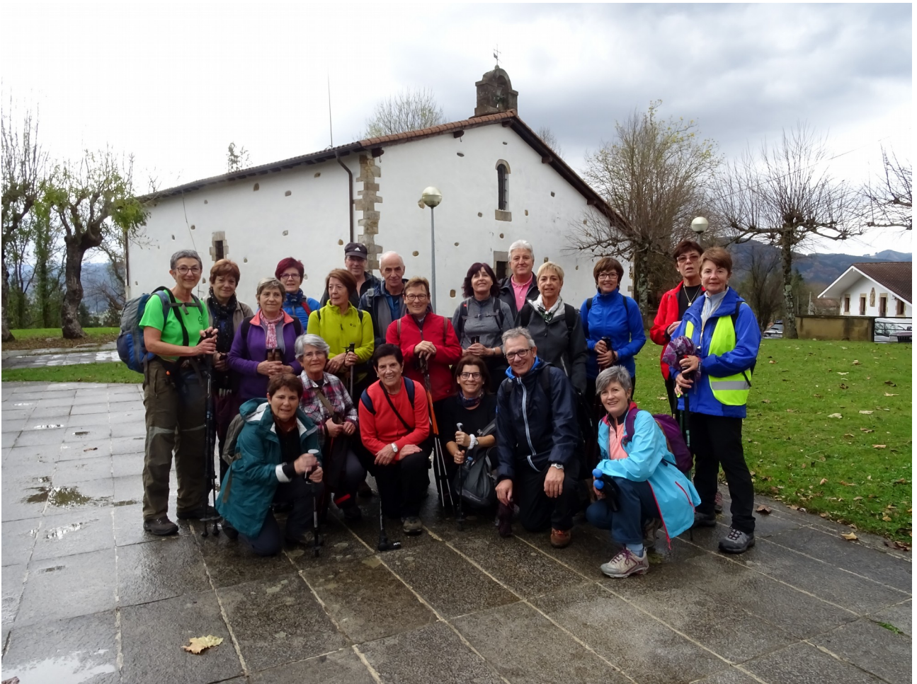
Taldearen antzeko argazkia, Lierniko basilizaren ondoan