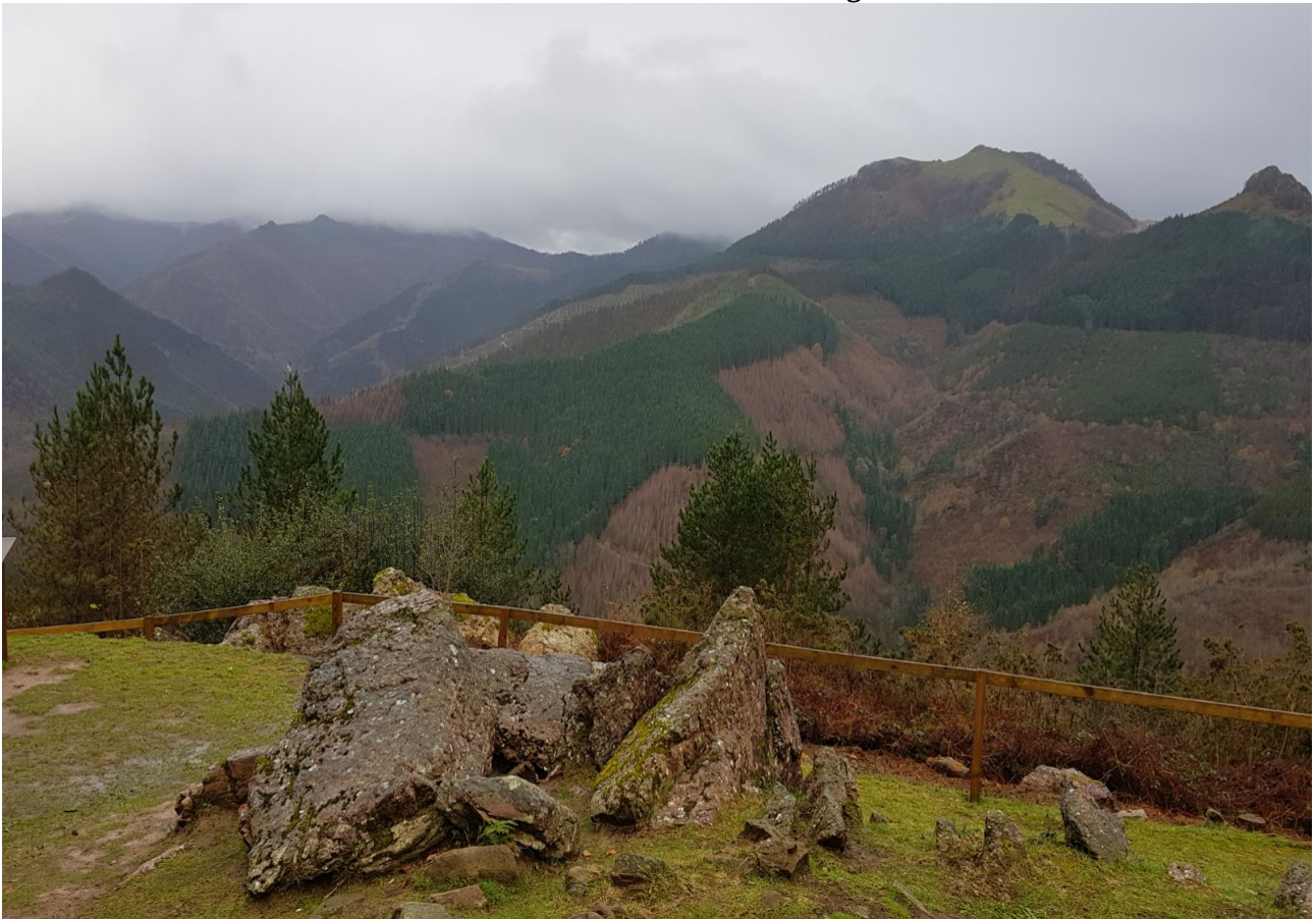
Mulisko gainetik Adarrarantz begiratzen