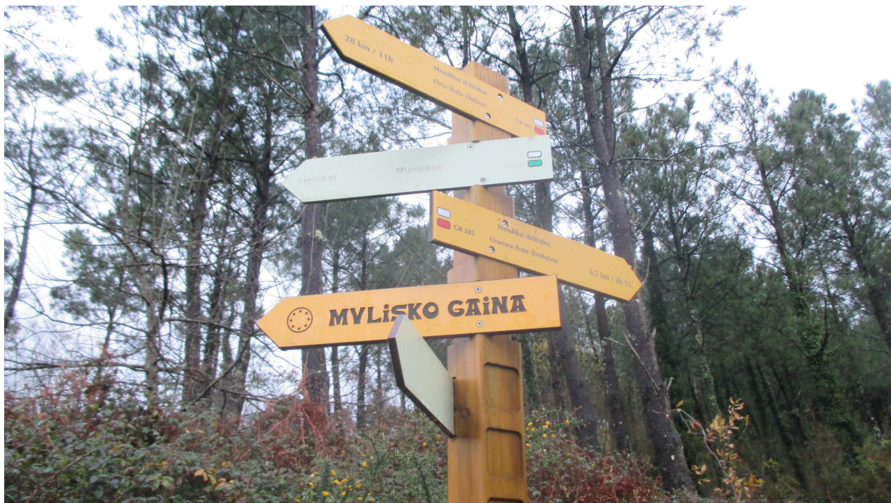
Bidegurutze bateko seinaleak, Mulisko Gaina horien artean