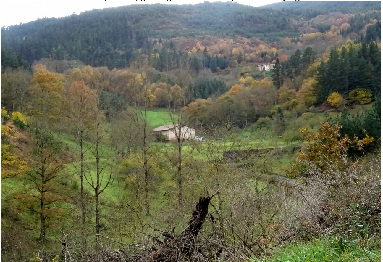
Honelako leku isolatuetan bizi da, bada, norbait