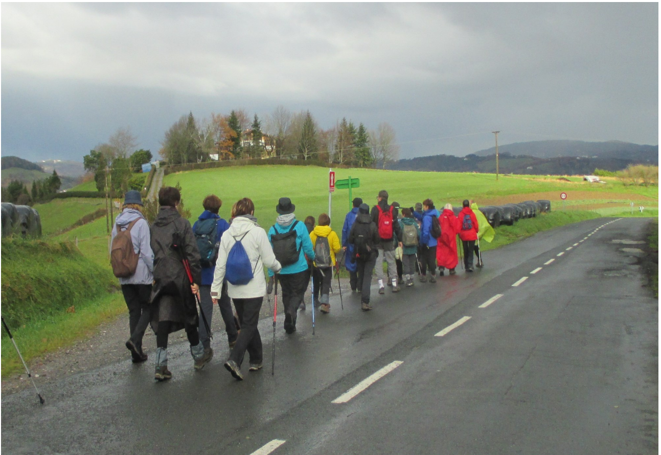
Ibiltariok, berriketan, Urnietarantz jaisten