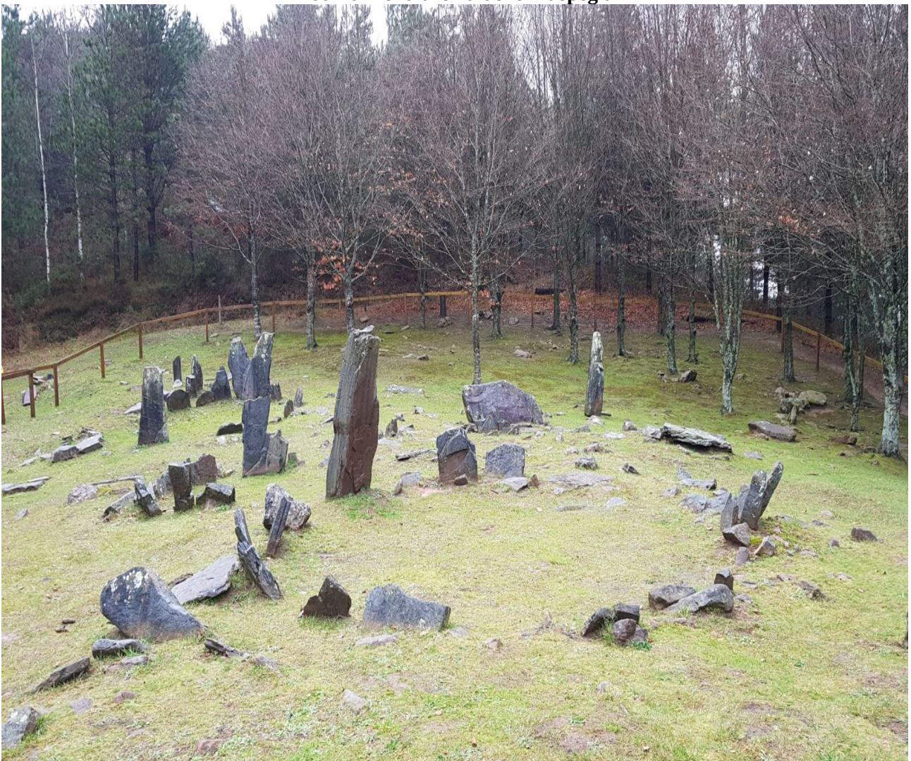
Mulisko Gaineko Mairu Baratzak edo harrespilak