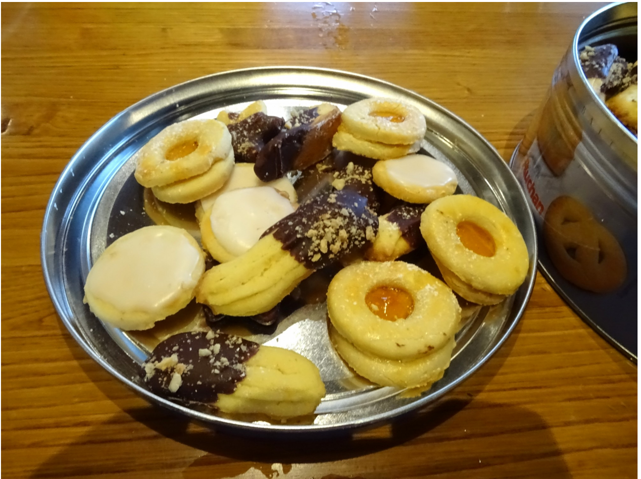
Begira nolako itxura duten pasta hauek!