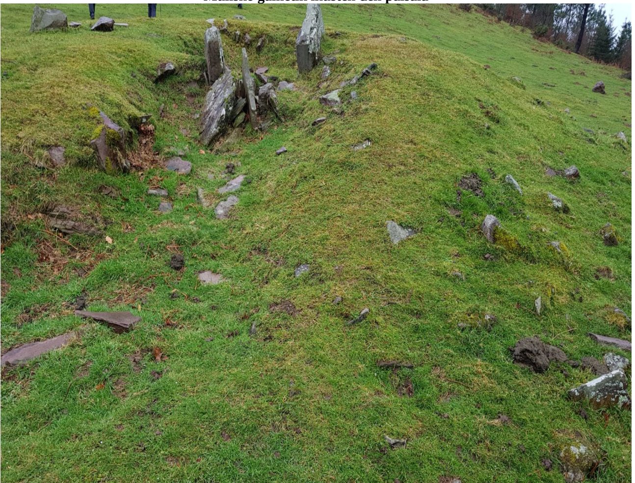
Brontze Aroko trikuharria