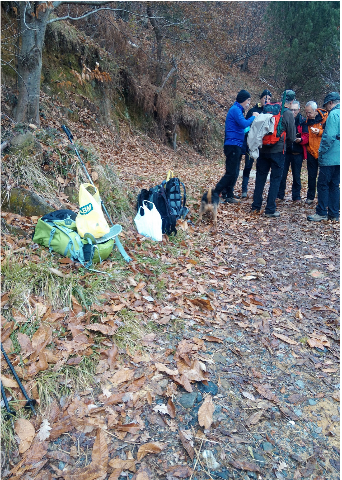
Hamaiketakoaren eta atsedenaldiaren ordua iritsi da