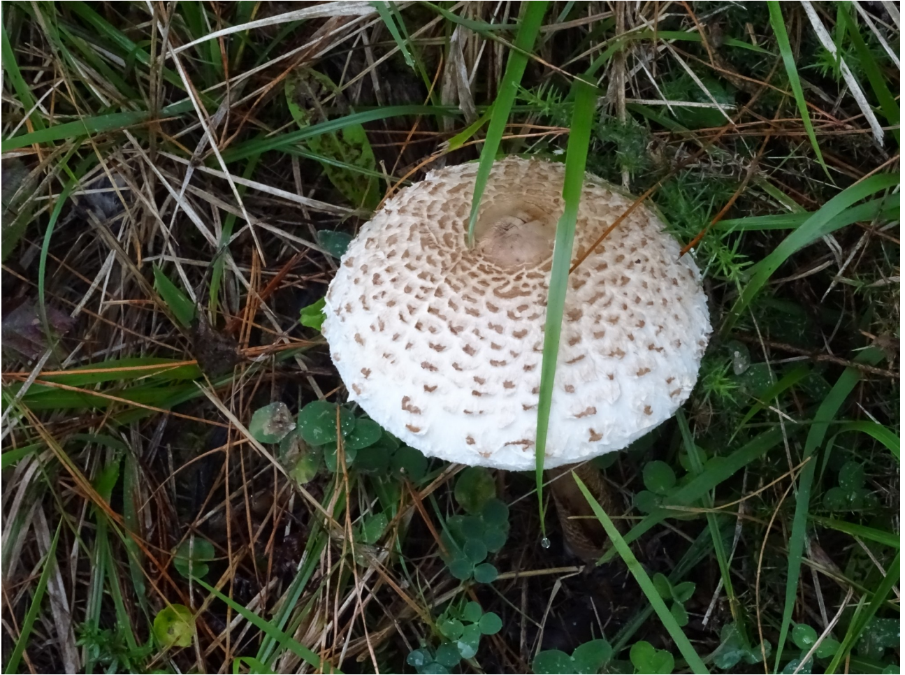
Badaezpada ere, guk ez genuke honelako perretxikorik jango