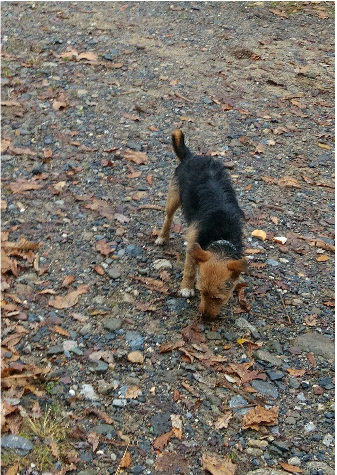
“Aurelio” bat edo batek botariko janaria dastatu nahian