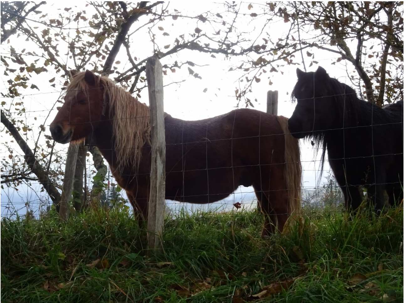
Zaldiak, ia gehienetan, gizakiarengana hurbiltzen dira konfiantza osoz