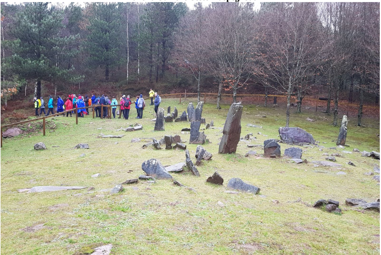
Mulisko Gaineko estazio megalitikoari bisitaldia amaiera ematen