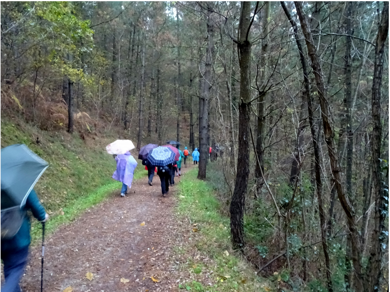
Ormaiztegitik Lierni-Mutiloako trenbidean zehar, ibiltariak euripean