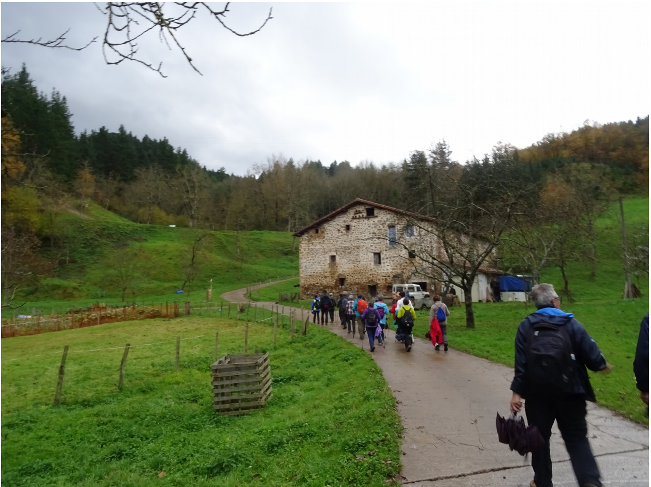
Ibilbideko une bat, ikuspegi idilikoan