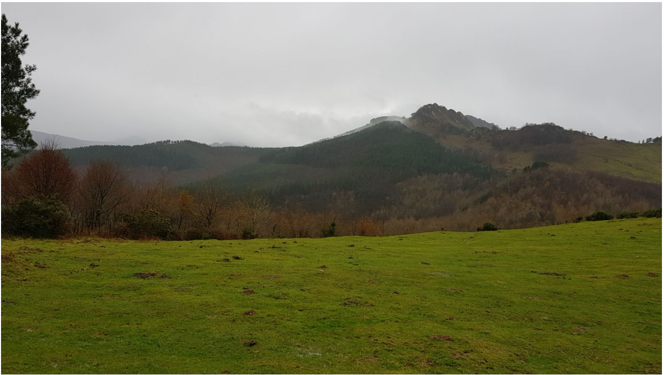
Adarra mendiaren aldeko ikuspegia