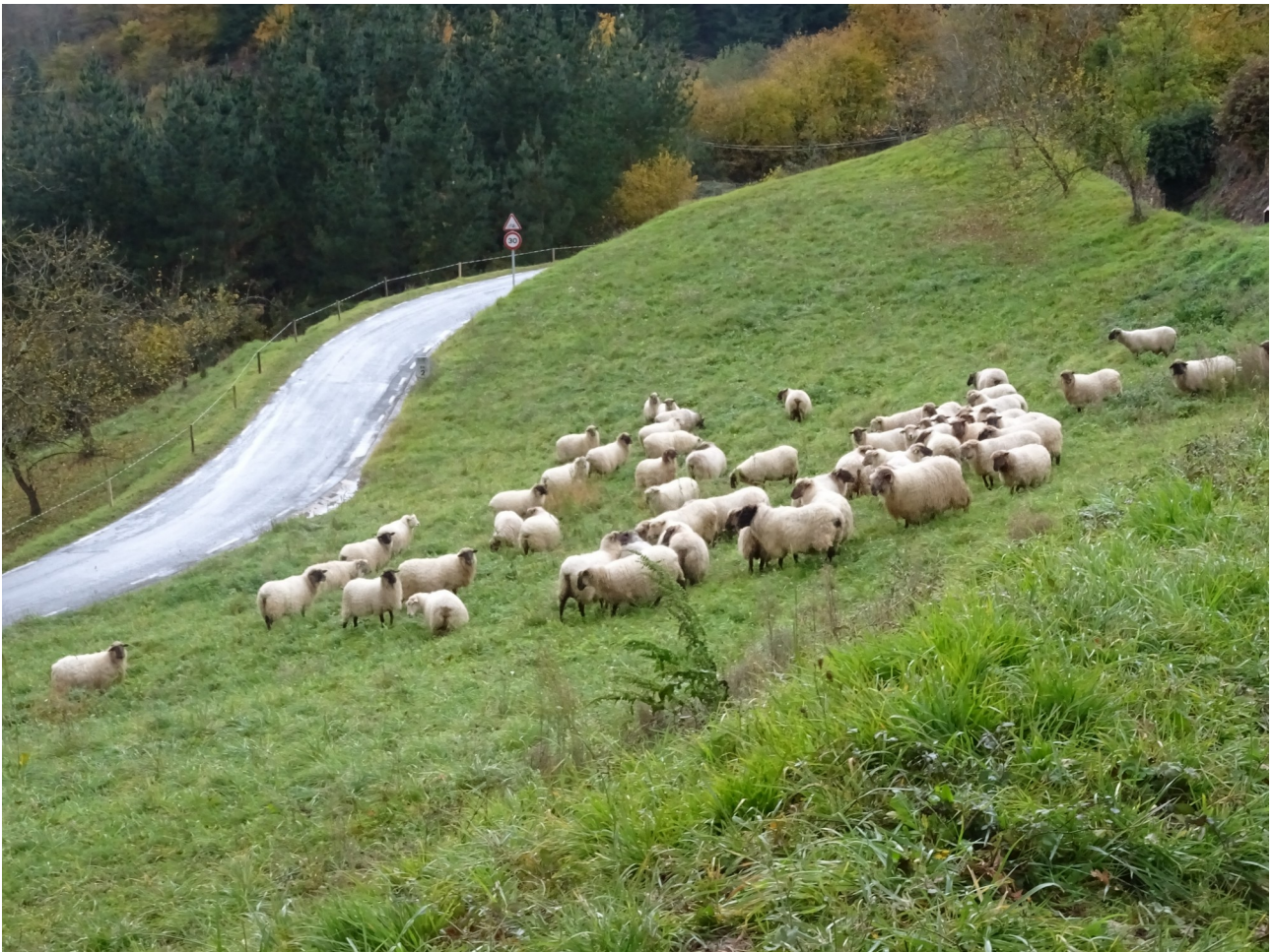
Artaldeek beti ematen diote itxura bukolikoa paisaiari