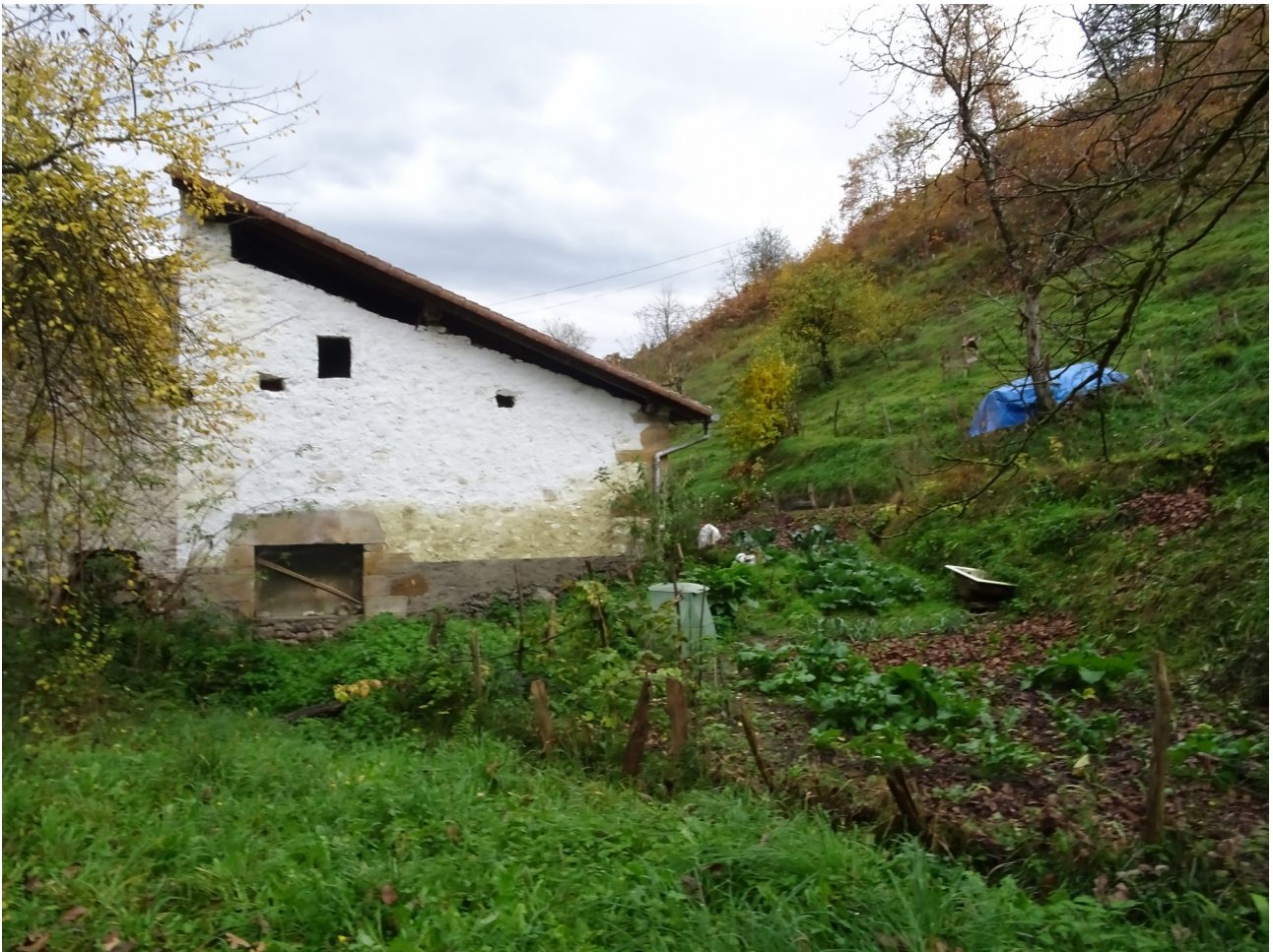
Ibilbideko baserri isolatua eta ez horren isolatuak