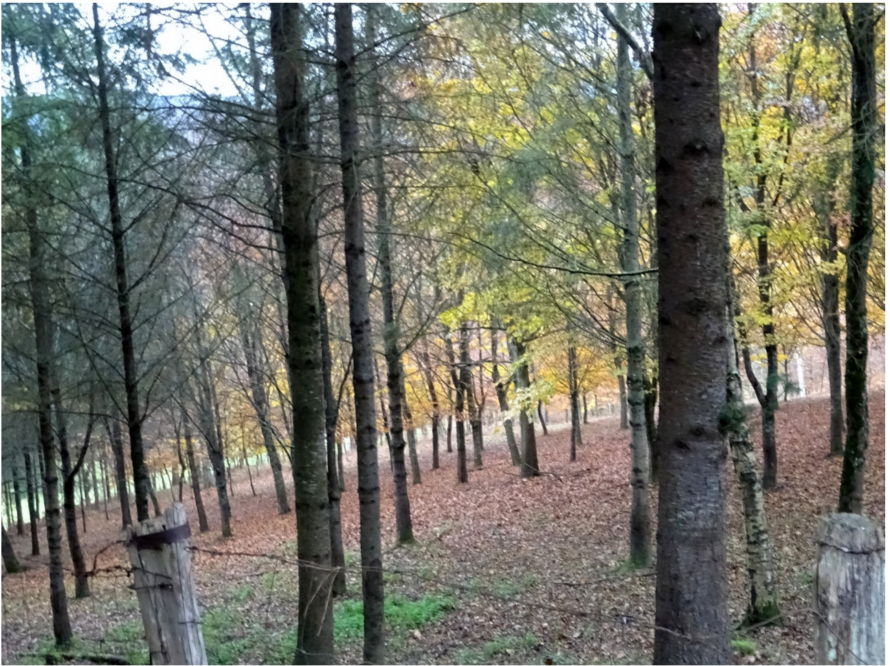
Garaiko paisaia, lurra orbelez estalirik eta zuhaitz gehienak biluzik geratzen