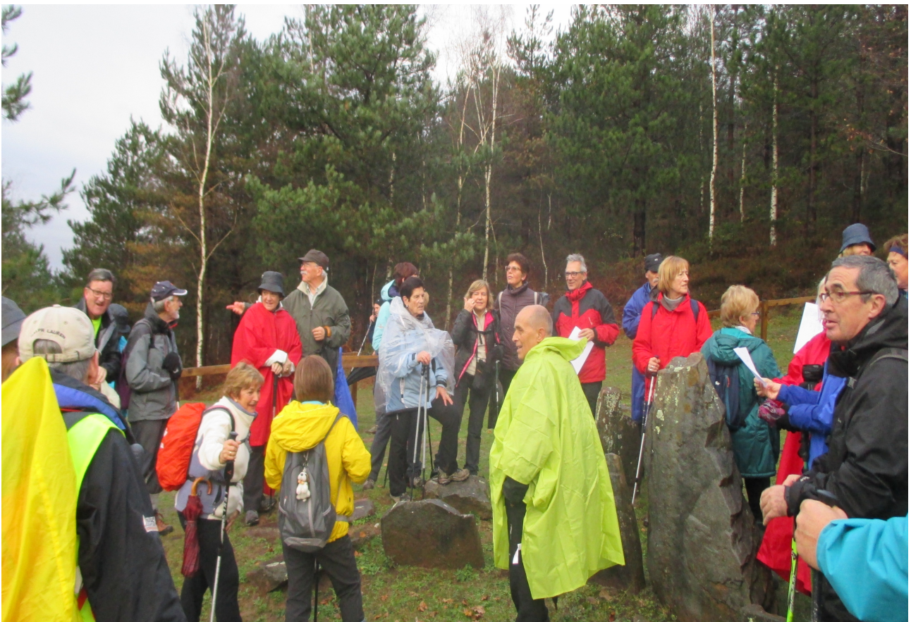
Mulisko Gainean, Ramonen azalpenak entzuteko prest ibiltariok