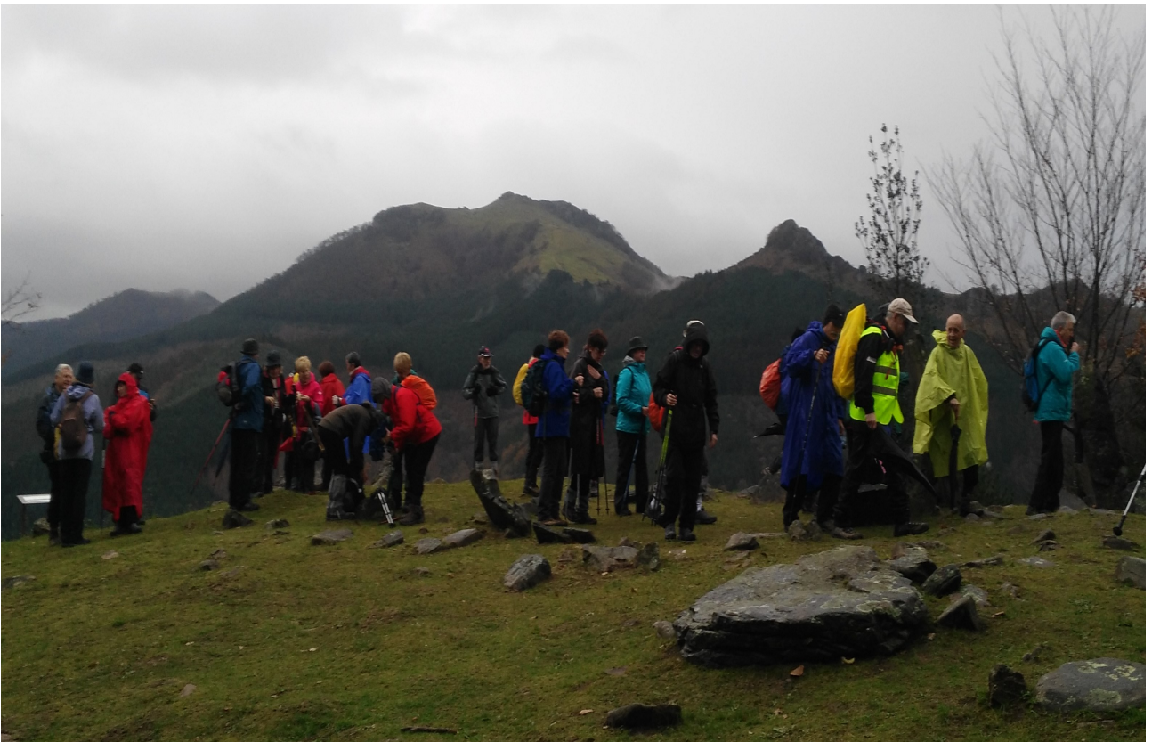
Mendi muinoan ikuspegiak gozaten