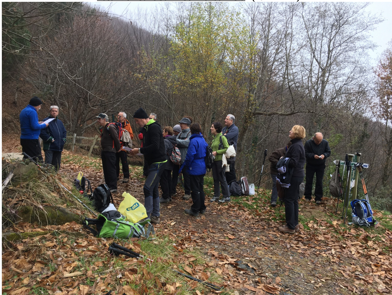
Ibilaldiren erdian, Barahonako olerkariak txakur bati buruzko olerkia irakurri zigun