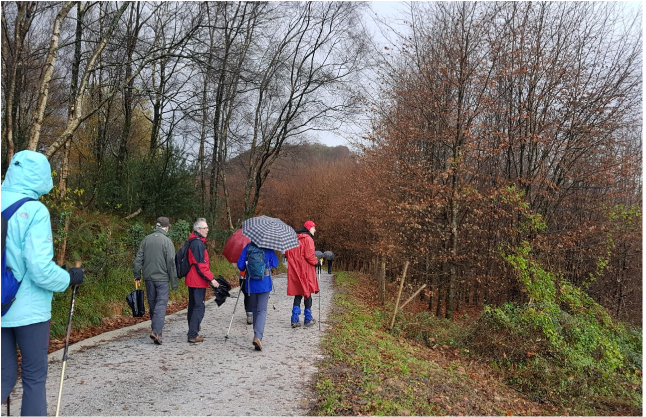
Besabirantz jaisten, Mukisko Gaietik