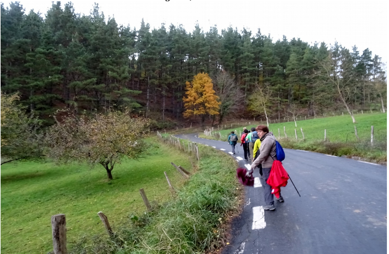
Lierniranzko bidean, aterkia astintzen ari da ibiltari hau