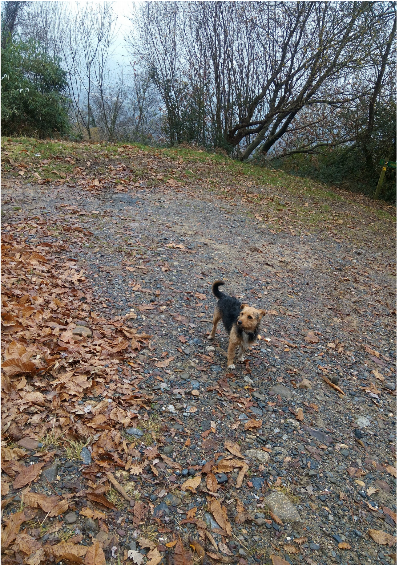
“Aurelio” erne, gidari papera bete nahian