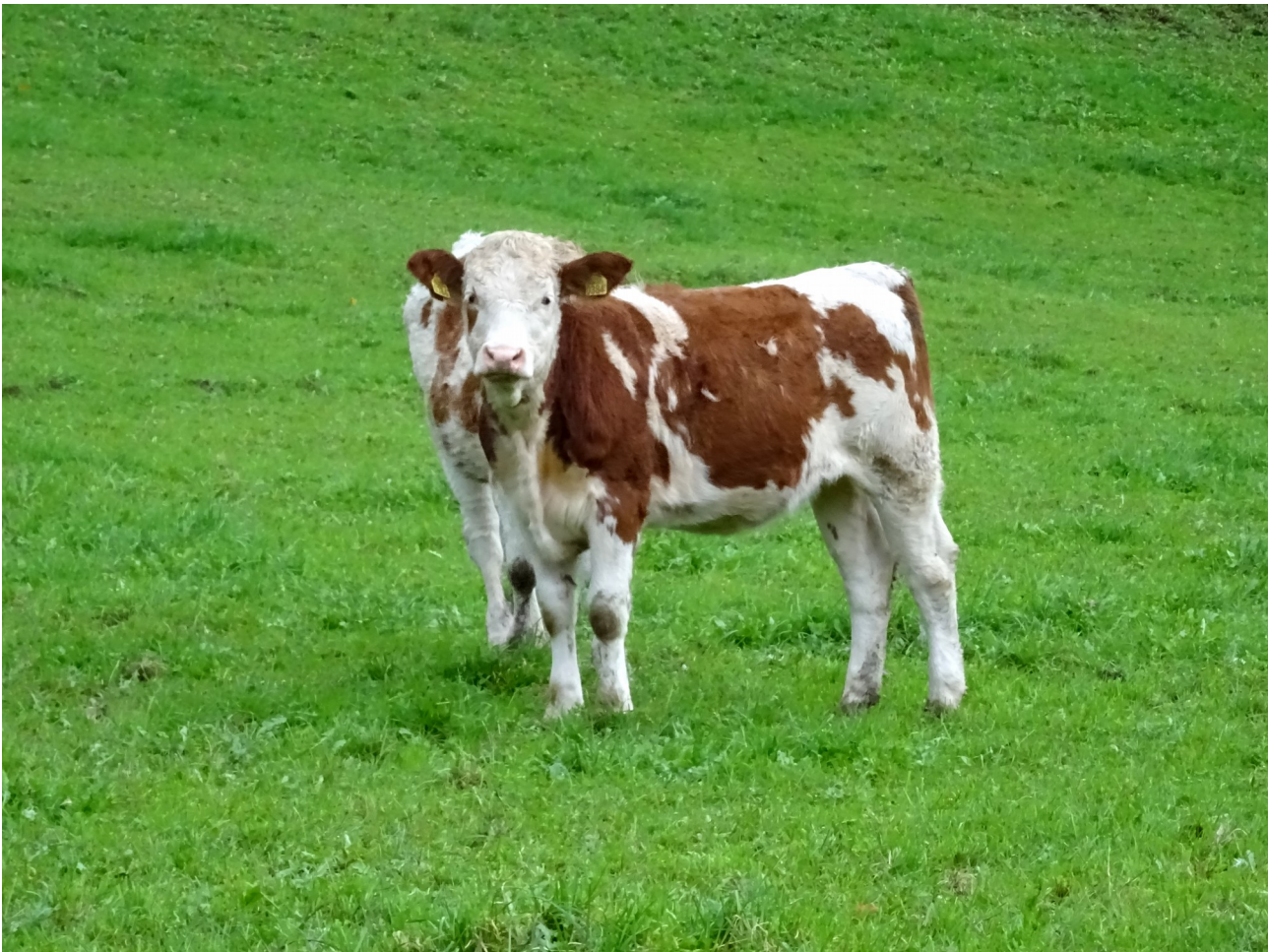
Txahal kuxkuxeroa eta beldurrik gabea