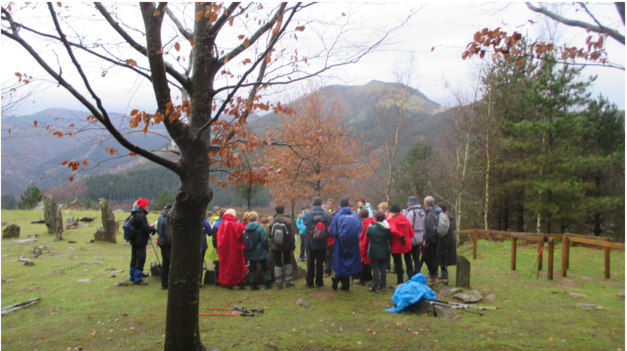
Ramonen azalpenak jende zintzoa entzuten ari delarik