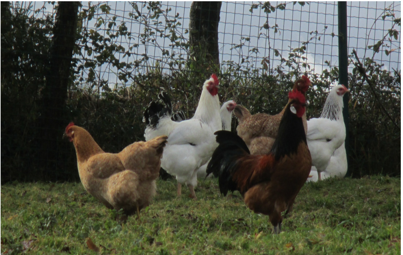
Oilar honek beste bat onartuko al luke bere inguruan?