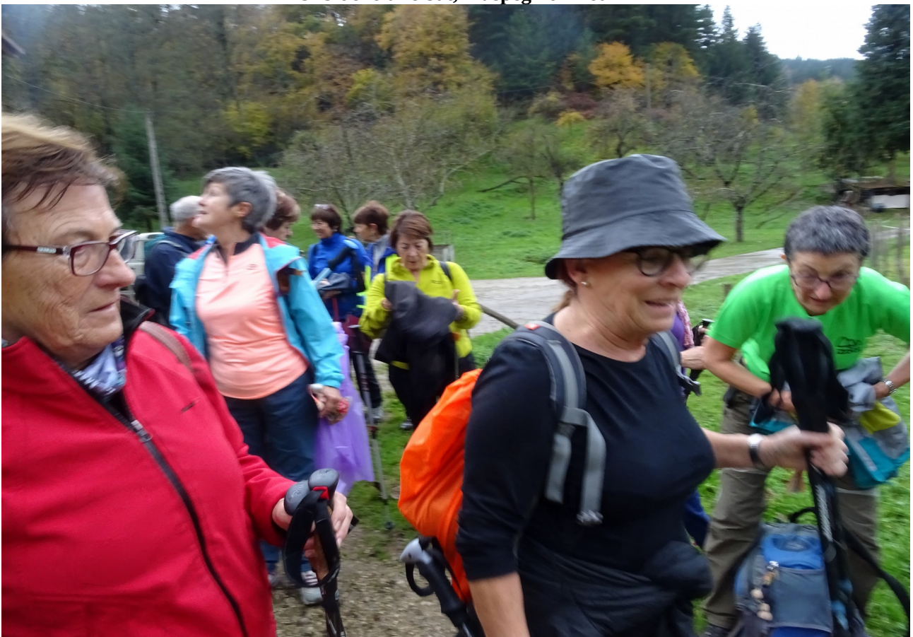
European ibili ondoren, atsedena eta arropa aldatzeko unea