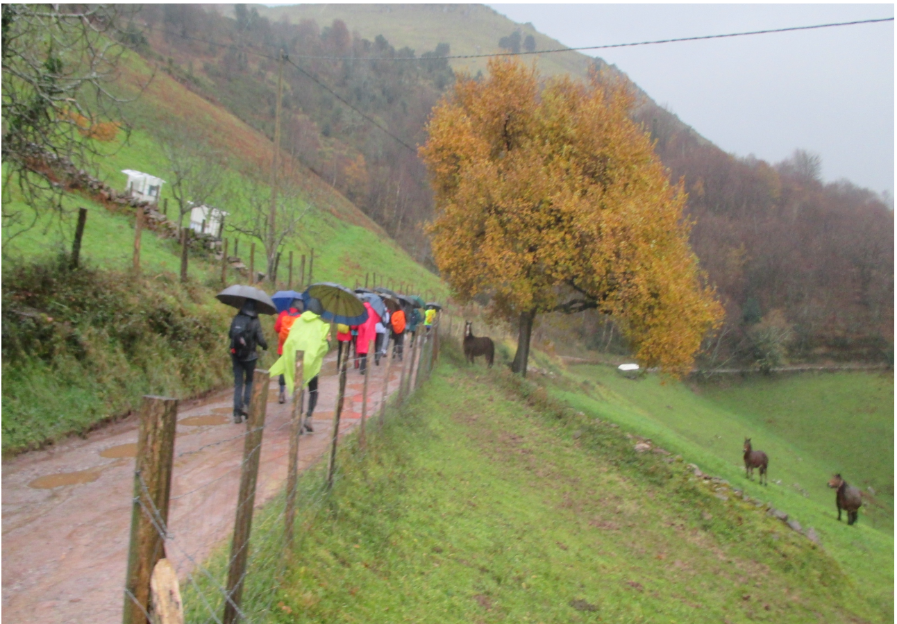
Hiru zaldi begiluze hauek erne, ibiltariok hurbiltzen ari gatzazkielarik, zerbaiten zain