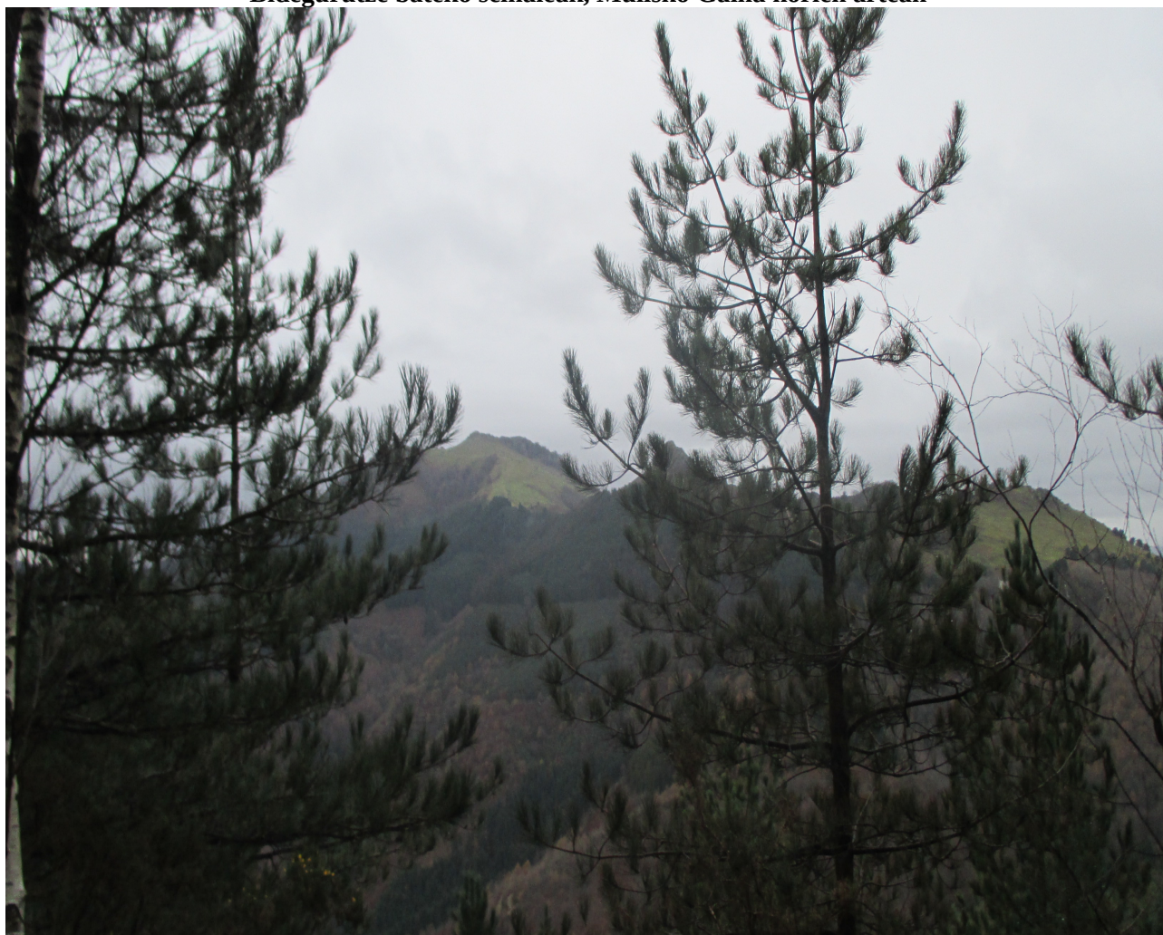
Mulisko alderantz goazela Adarra mendiko hegia