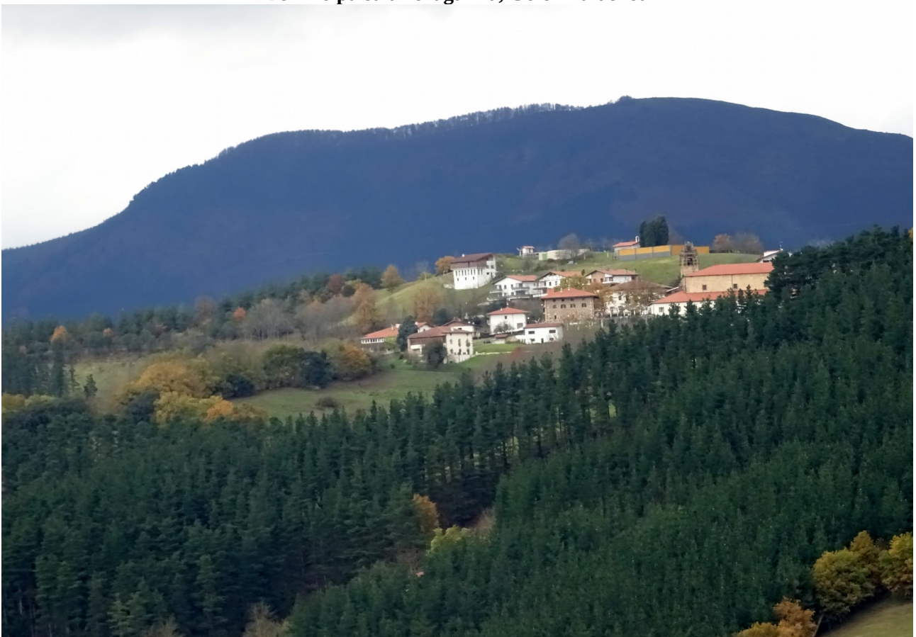
Oker ez bagaude, Mutiloa da ikusten den herria