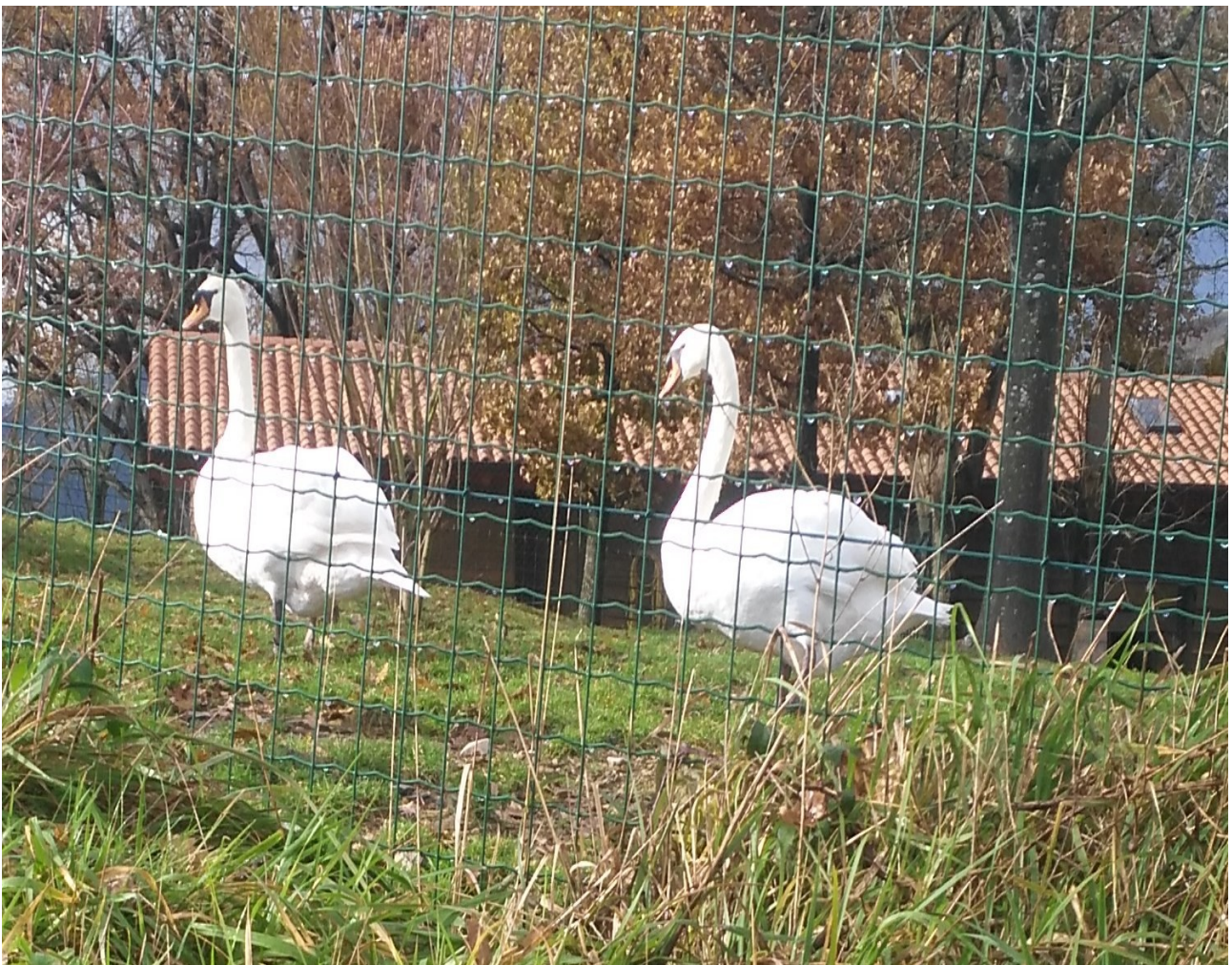
Lehen zisne beltzaki eta orain zuriak, dotore askoak