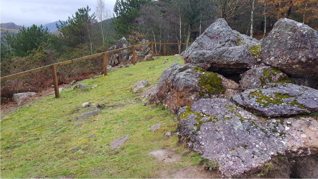
Mulisko Gaineko estazio megalitikoa