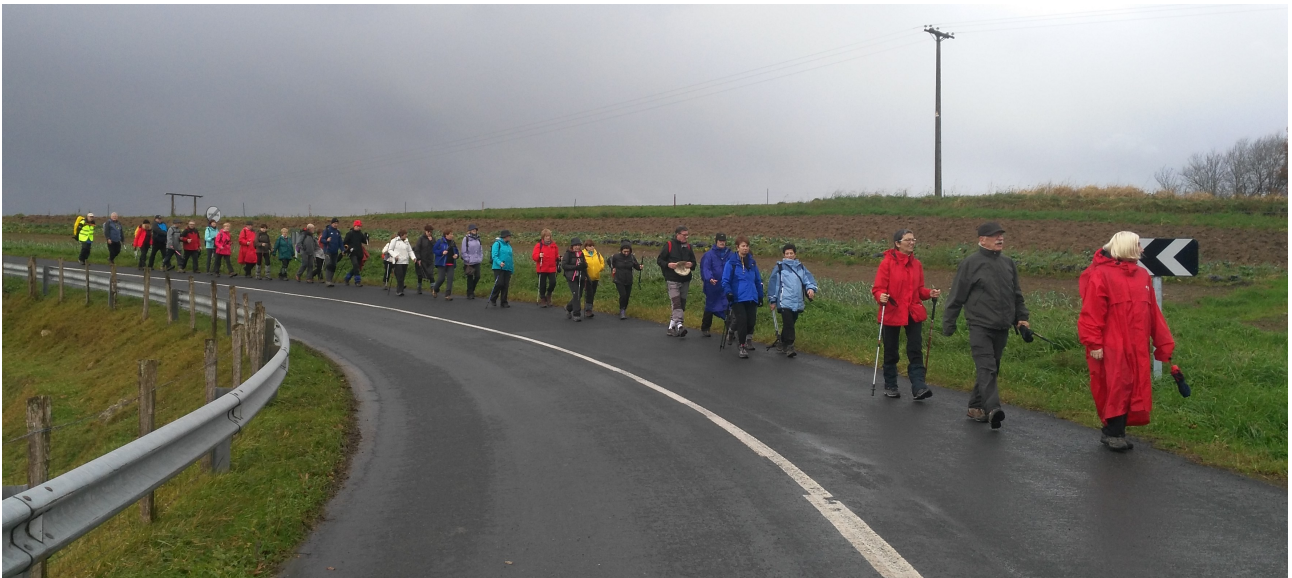
Urnietarantz jaisten, ateri dagoen une batean. Baina handik gutxira...ondorengo