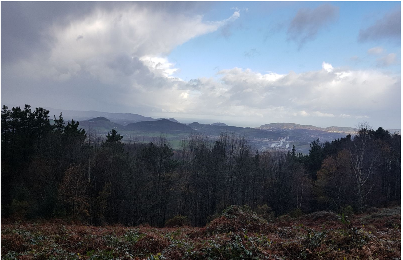
Mulisko Gaietiko paisaia ikusgarriak