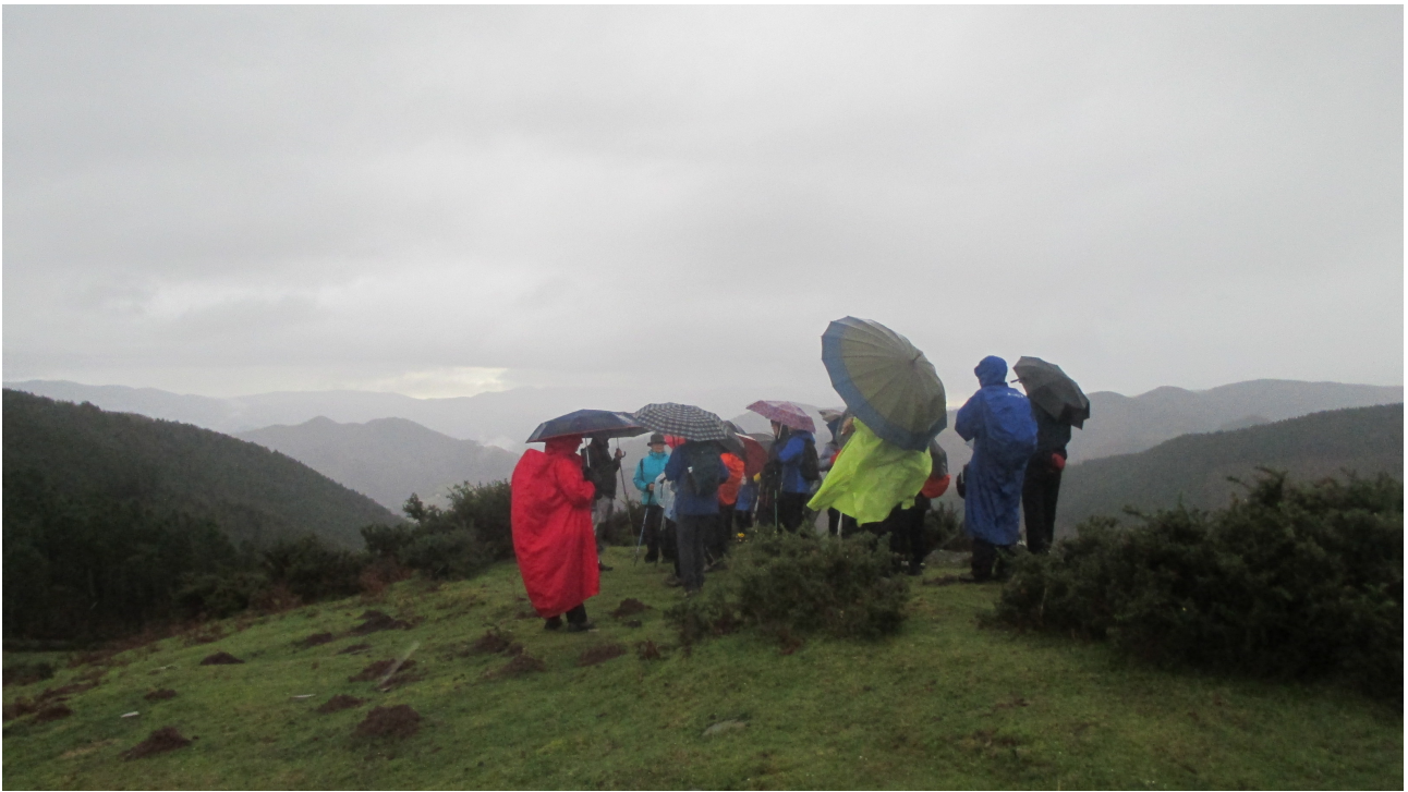
Begira nolako eguraldia egokitu zaigun mendi muino honetan!