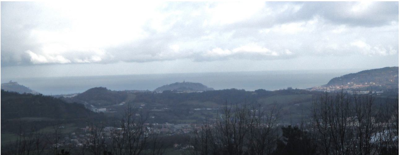
Egun euritsu eta lainotsua izan dugu gaurkoa