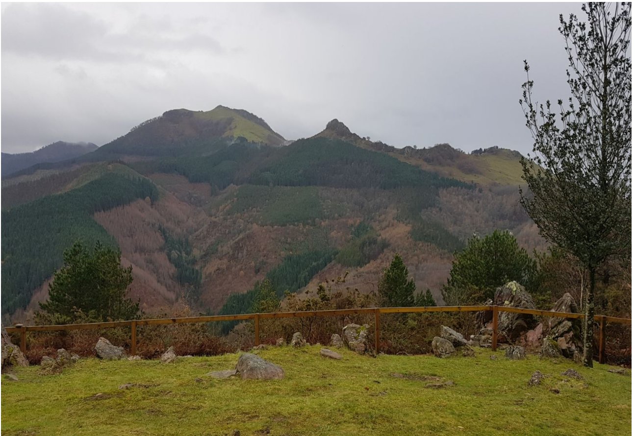
Mulisko Gaietik Adarra mendiranzko paisaia