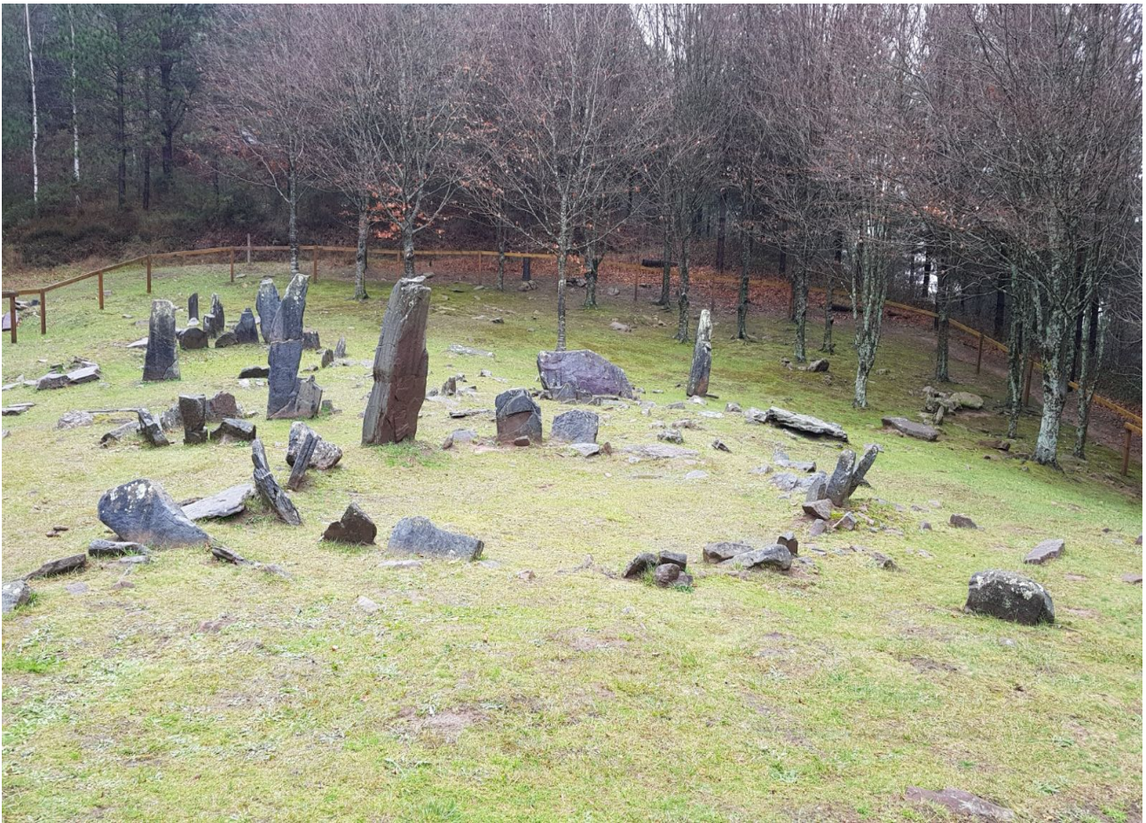
Mulisko Gaineko beste ikuspegi bat