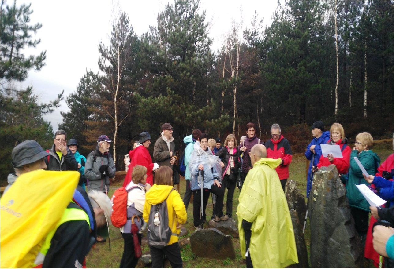
jendea ez da kantujiran, Ramonek prestaturiko papera irakurri eta aztertzen baizik