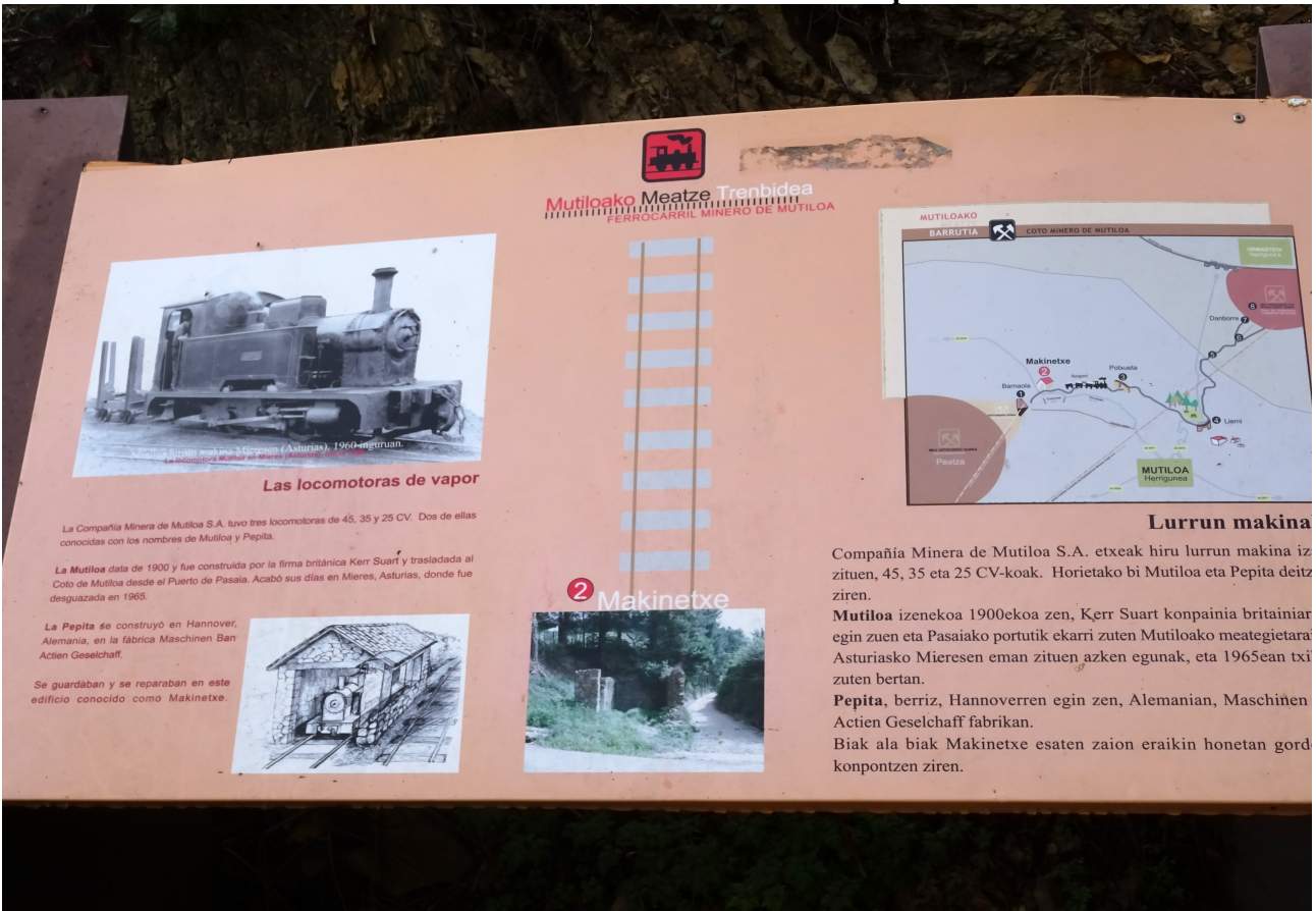
Mutiloako meatzeko historia ohol honetan adierazten da