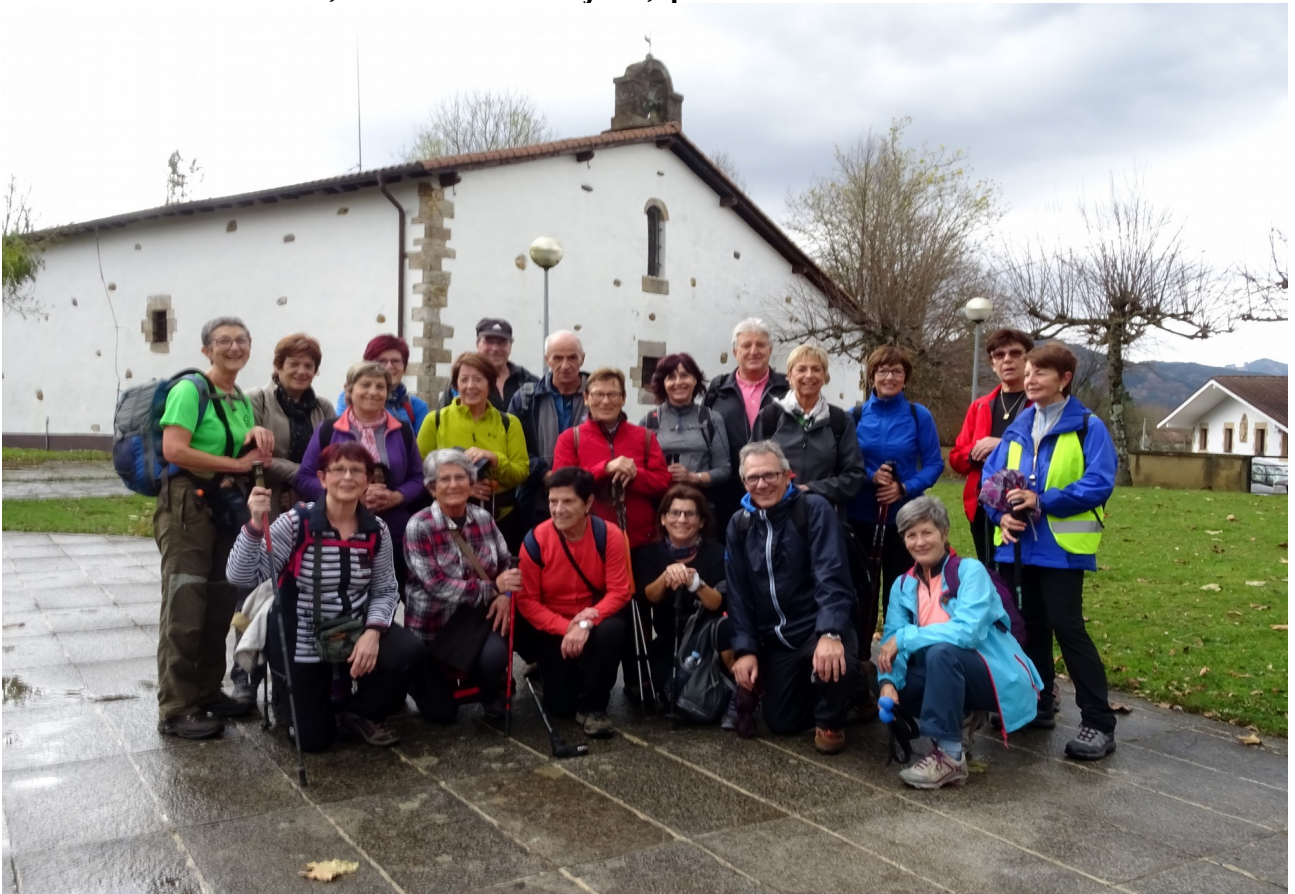
Taldea Liernin, baselizaren ondoan