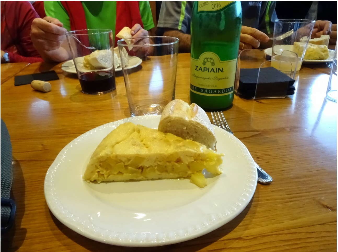
Tortillak ere ezdu itxura makala; zein gustura jaten ari diren...