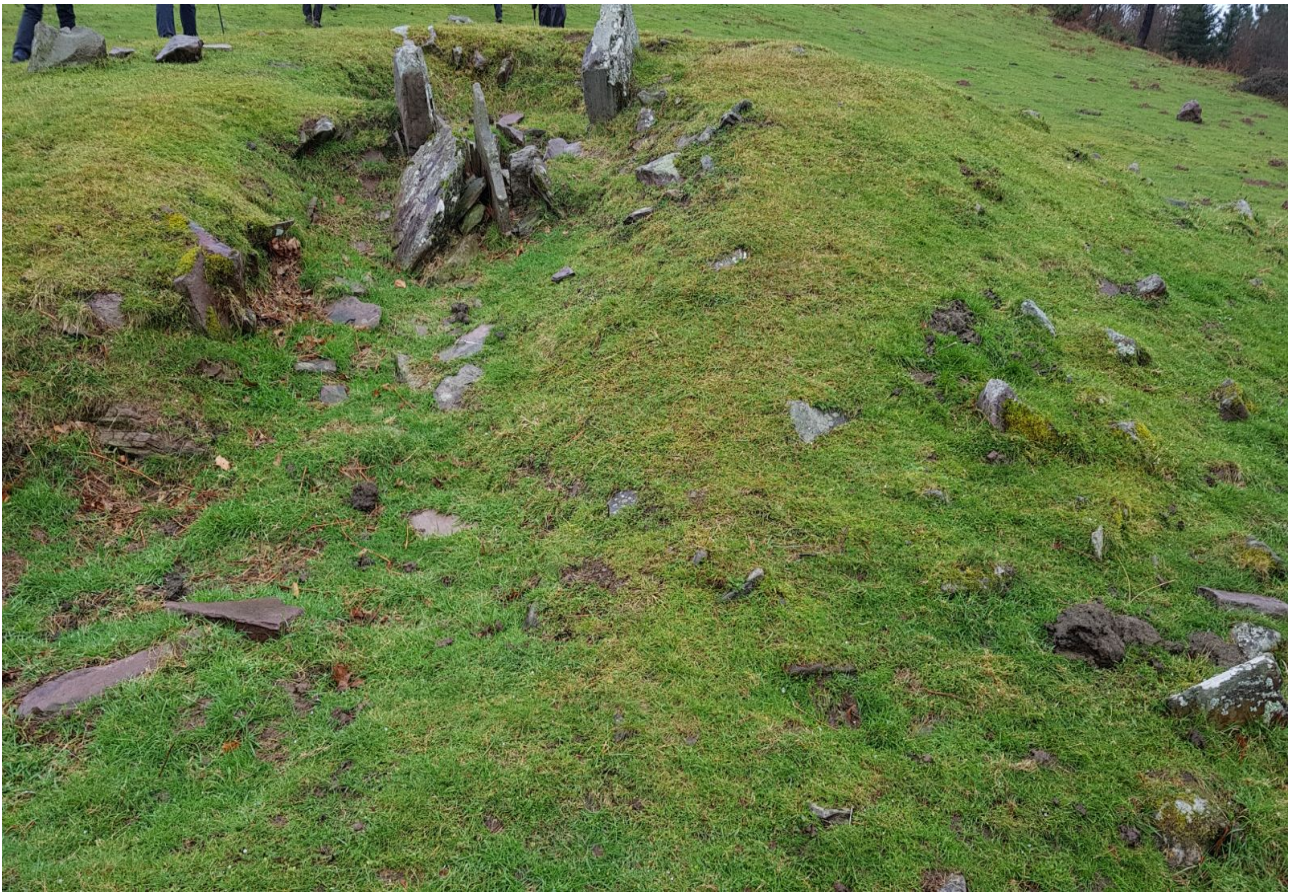
Brontze aroko trikuharria, berriro begibistan