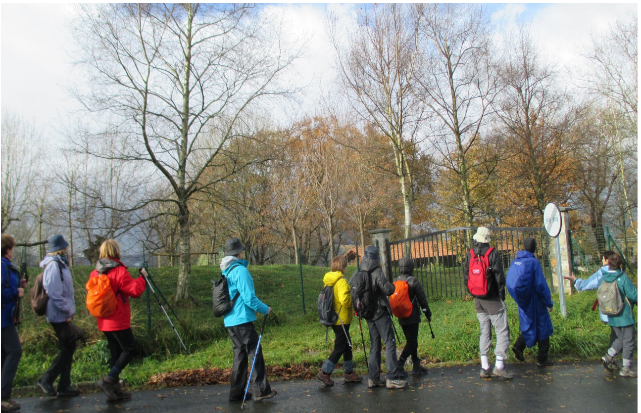
Besabiko inguruetan jendea abian Mulisko Gainerantz