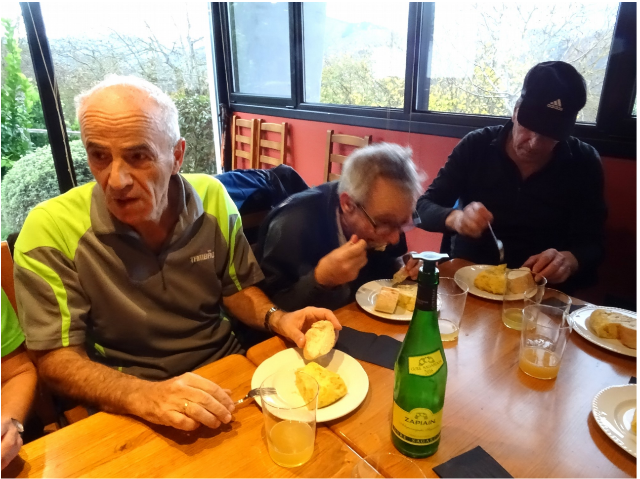
Leturiondo, uzkurturik tortilla jaten, ipotxa dirudi beste bi hauen artean