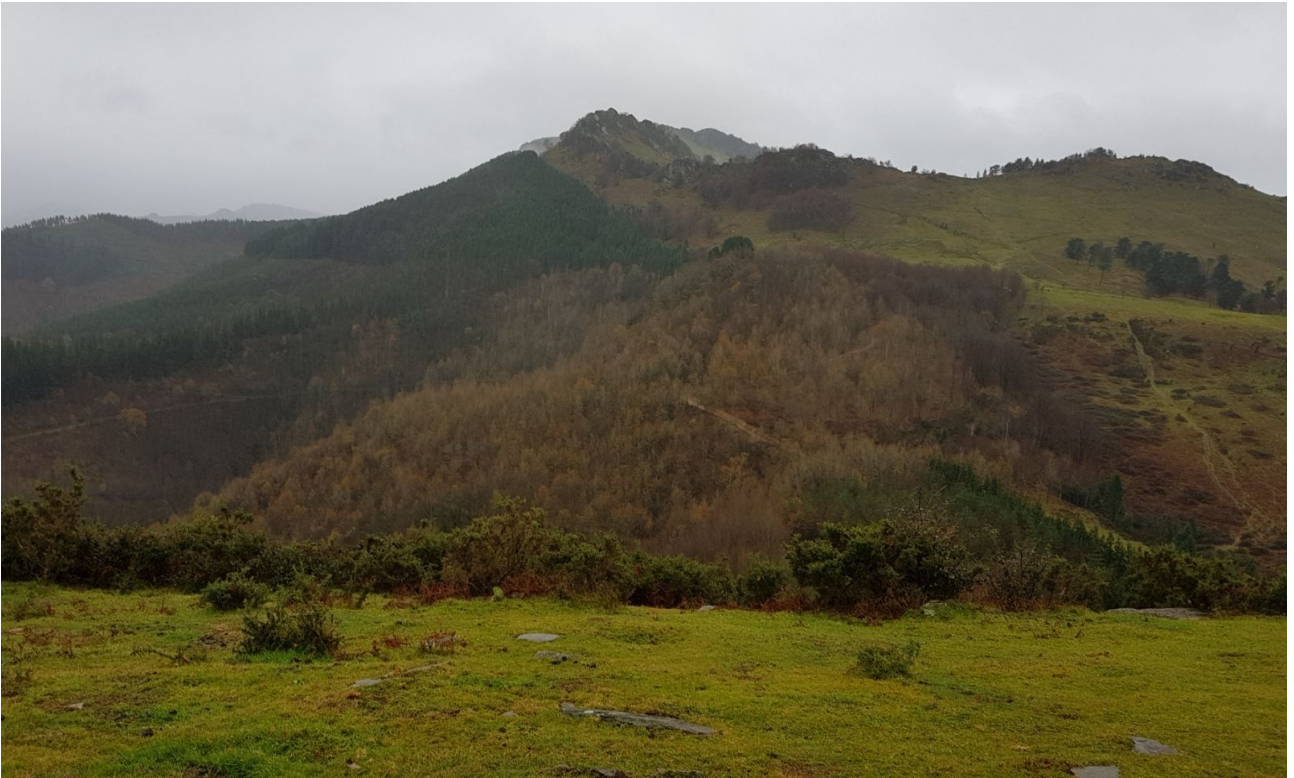
Mulisko gainetik ikusten den paisaia