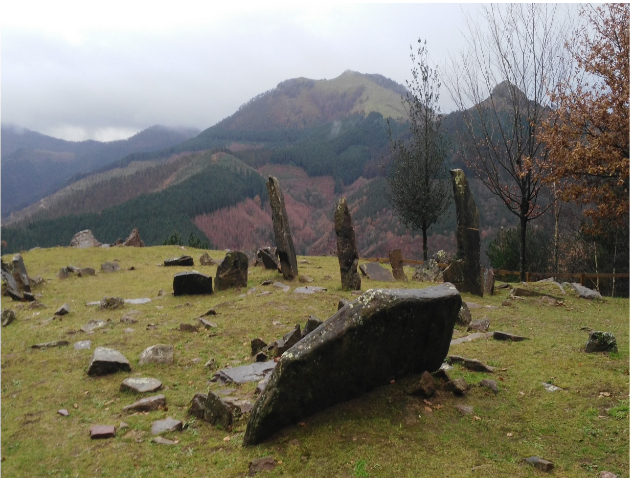
Mulisko gaineko Mairu Baratzak eta trikuharriak