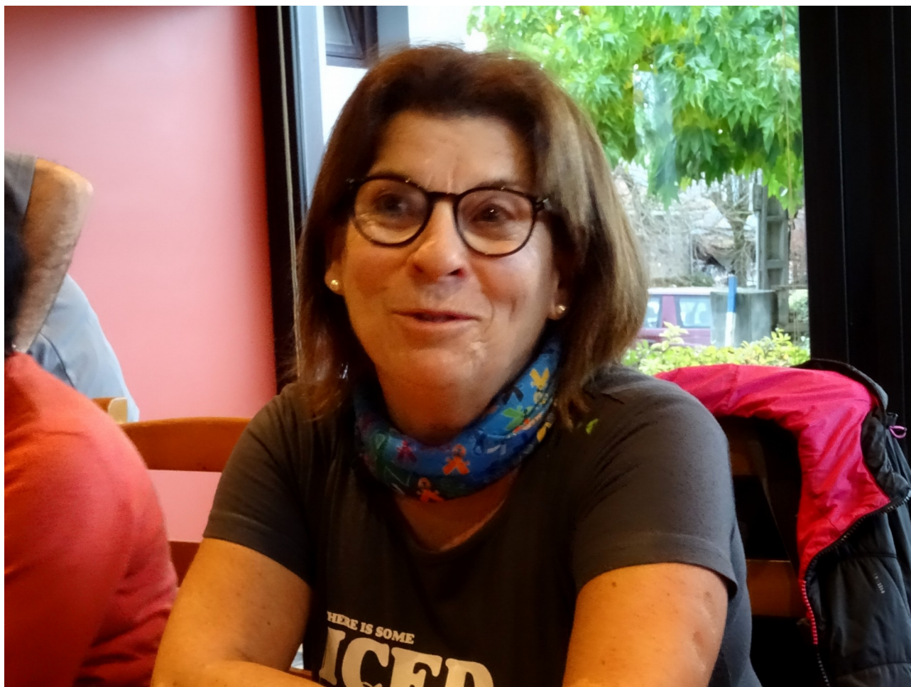
Maite gozoglea Liernin, ibiltarien lisontxak jasotzen eta pastak plateretan banatzen