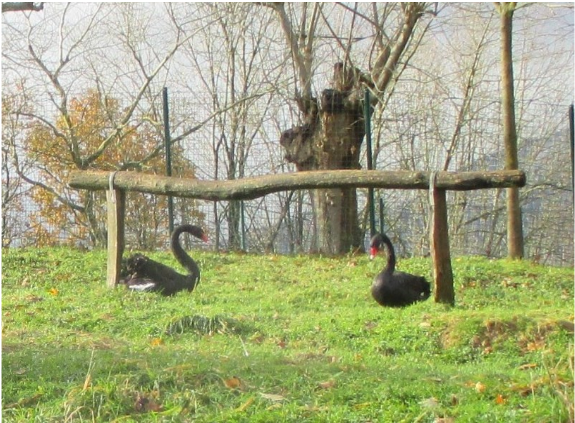
Beltxarga edo zisneak lasai askoan, ibiltarioi kasurik egin gabe