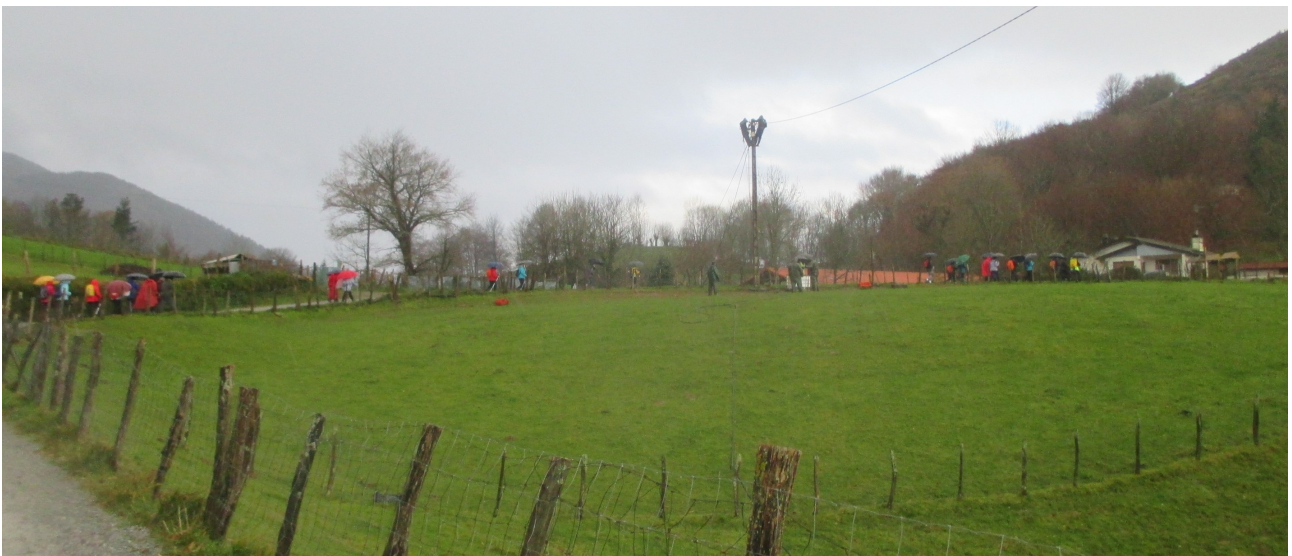
Besabiko inguruak eta baserri bateko oilo eta oilasko ederrak (Gabonetarako?)