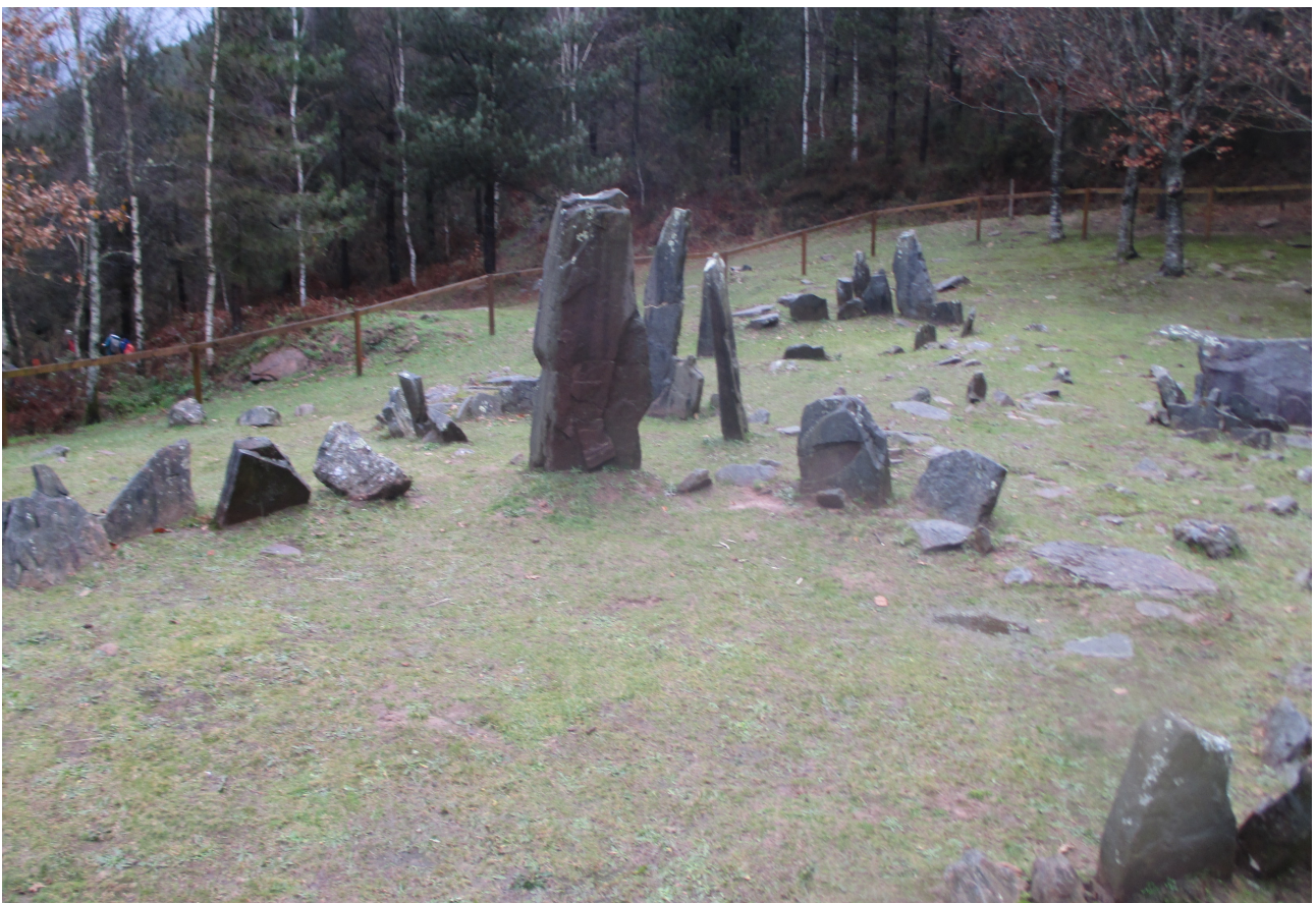
Mulisko Gaineko Burdin Aroko oroitarri arkeologikoa