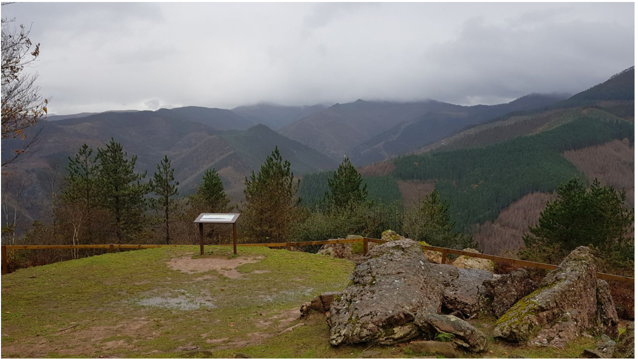
Mulisko Gaineko estazio megalitiko eta bertatiko paisaia