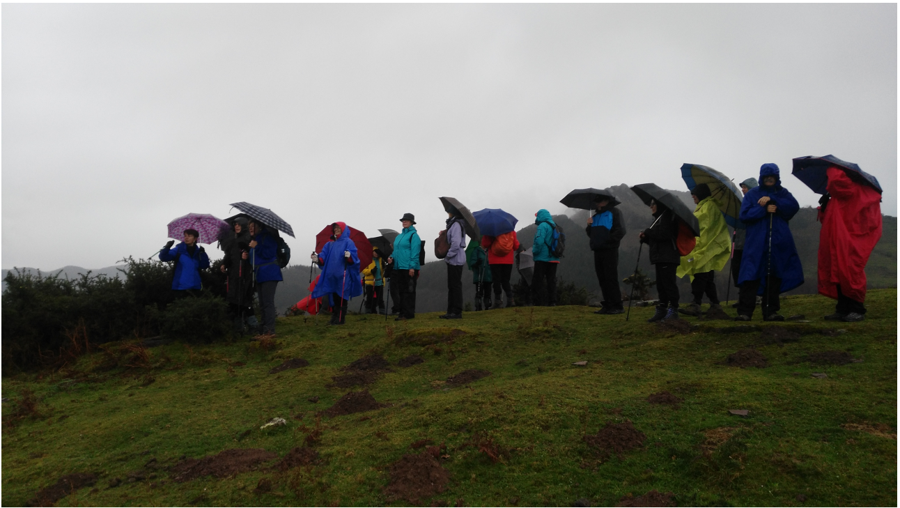
Mendi muinoan haize hotza eta euria