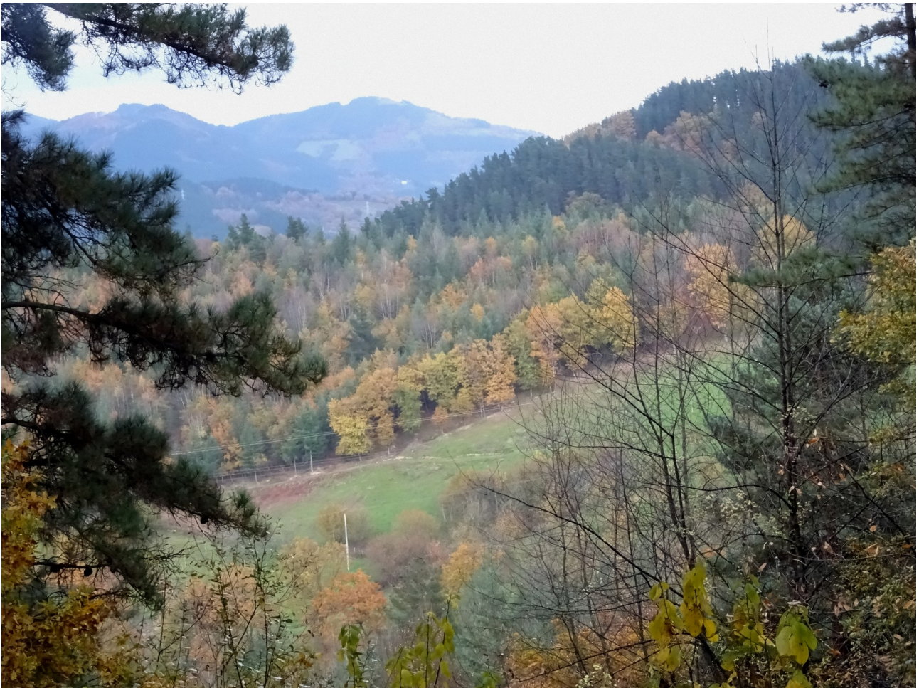
Berriro paisaia zoragarria, Goierri aldekoa