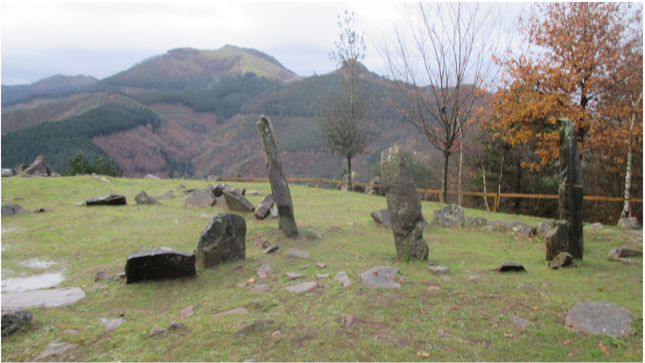
Burdin Aroko Mulisko Gaineko mairu baratzak edo harrespilak eta iruinarriak