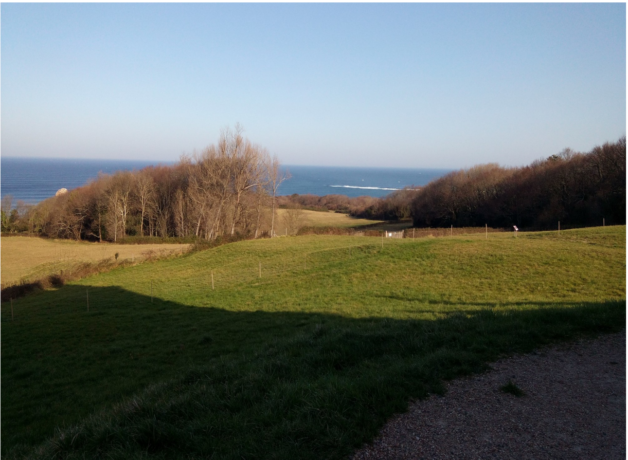
Itsaso eta larreak, ibilbidean zehar