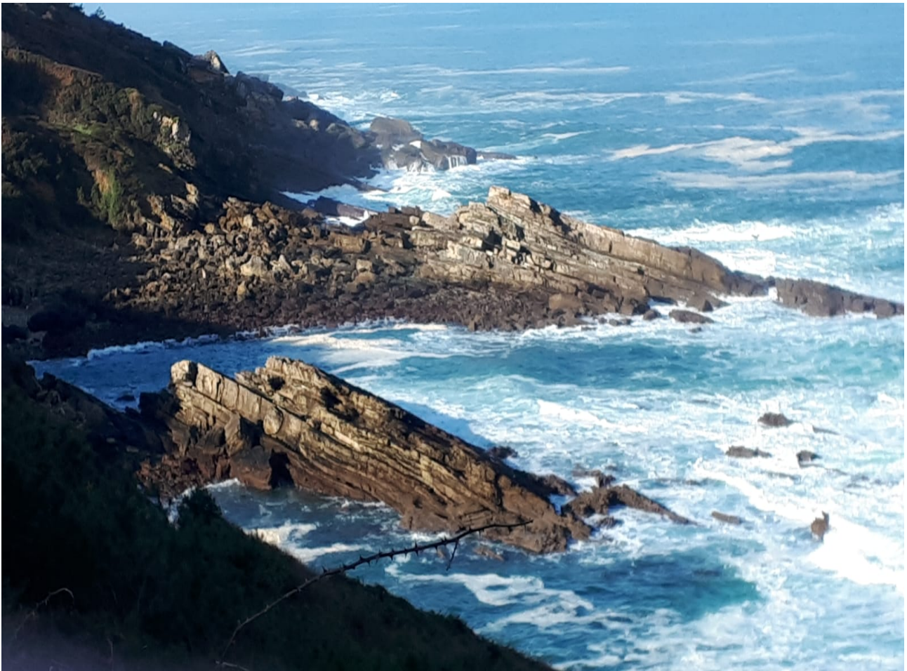
Itsaso zakarra Eiherako bidean. Lanpernak lasai egon daitezke