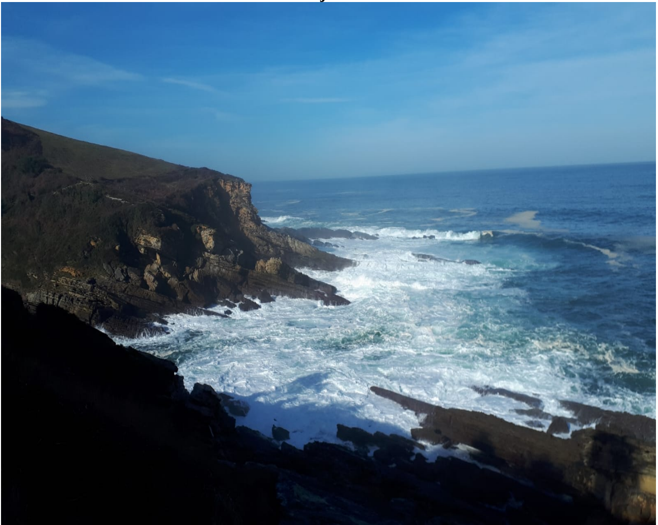
Aparrak adierazten du nolako olatuak dauden inguruan