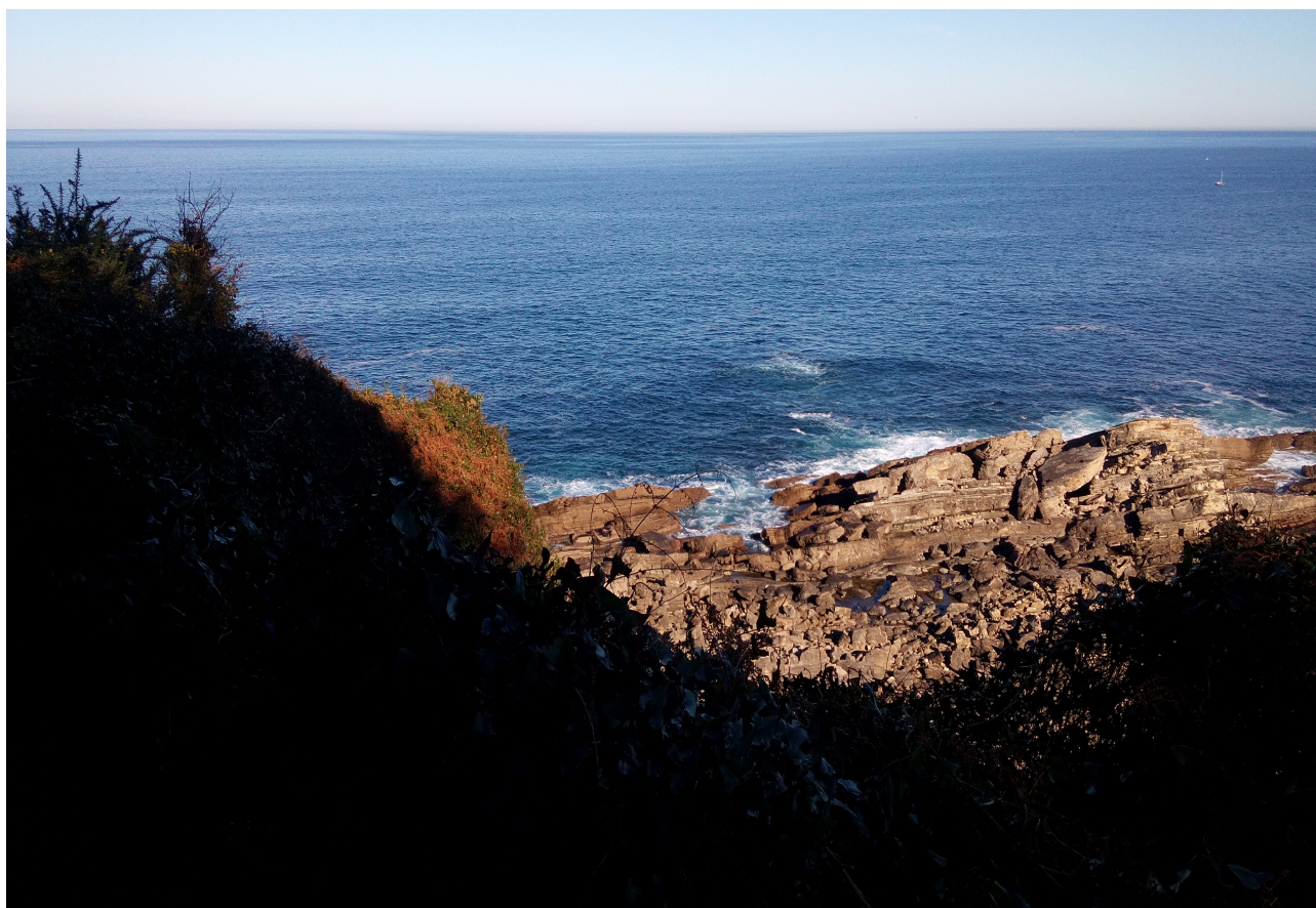
Itsasalde aparta ikusten da alderdi honetan