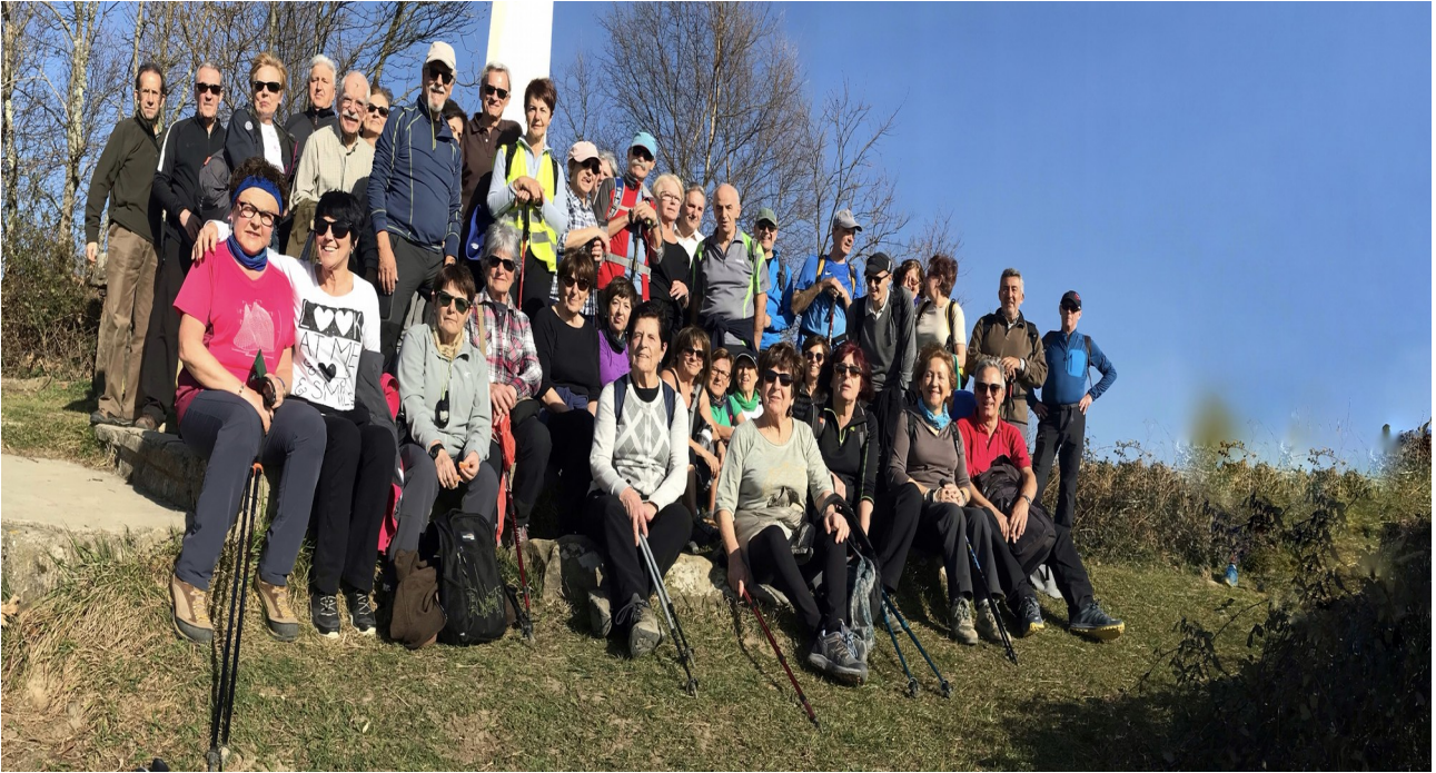
Kukuharri mendi tontorrean, taldearen argazkia