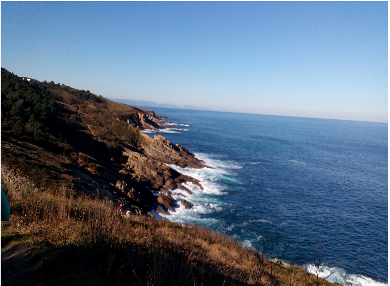
Itsasasartez beterik dago Jaizkibel mendia, Hondarribitik Pasaiaraino