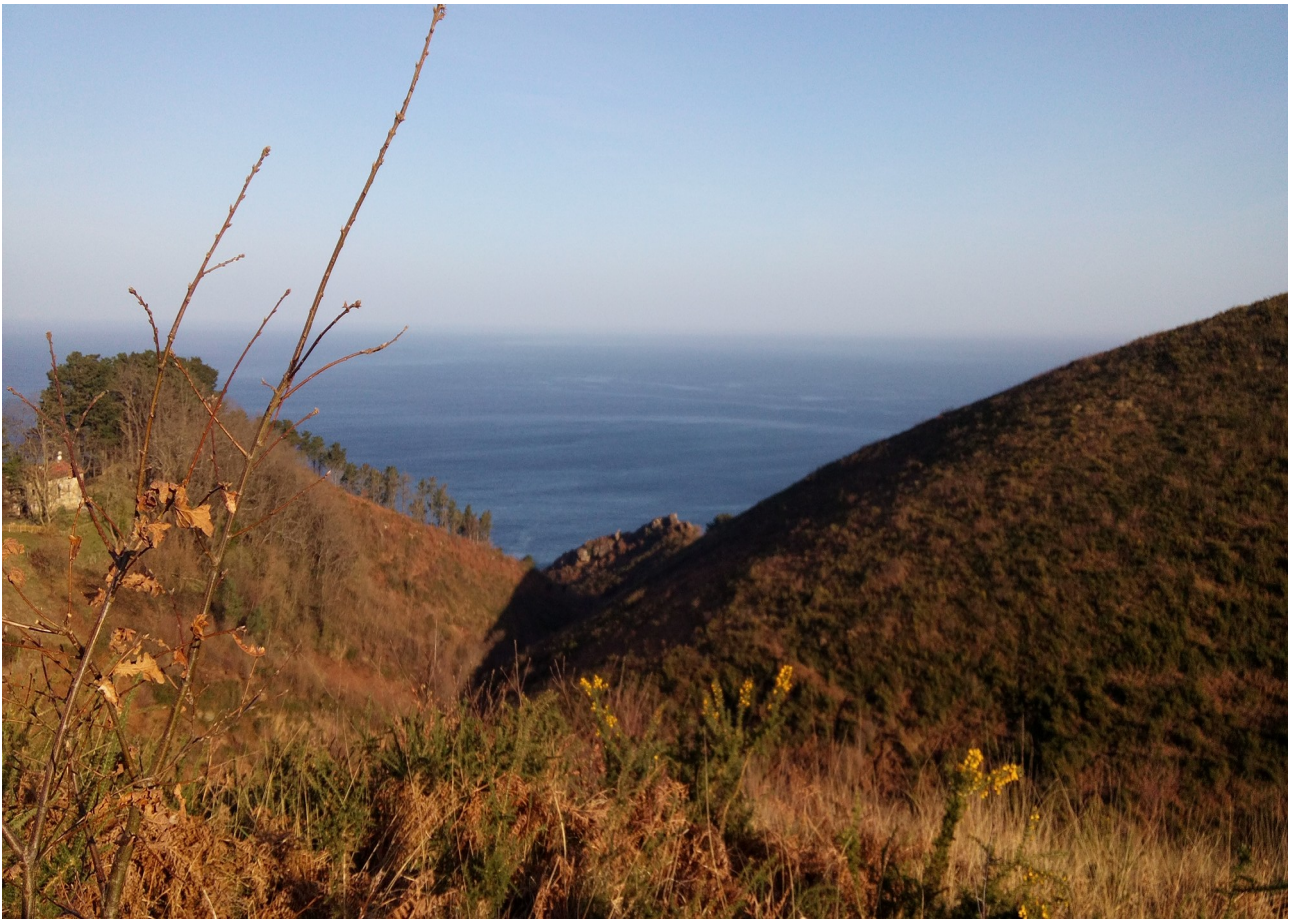
Igeldon zeharreko paisaia