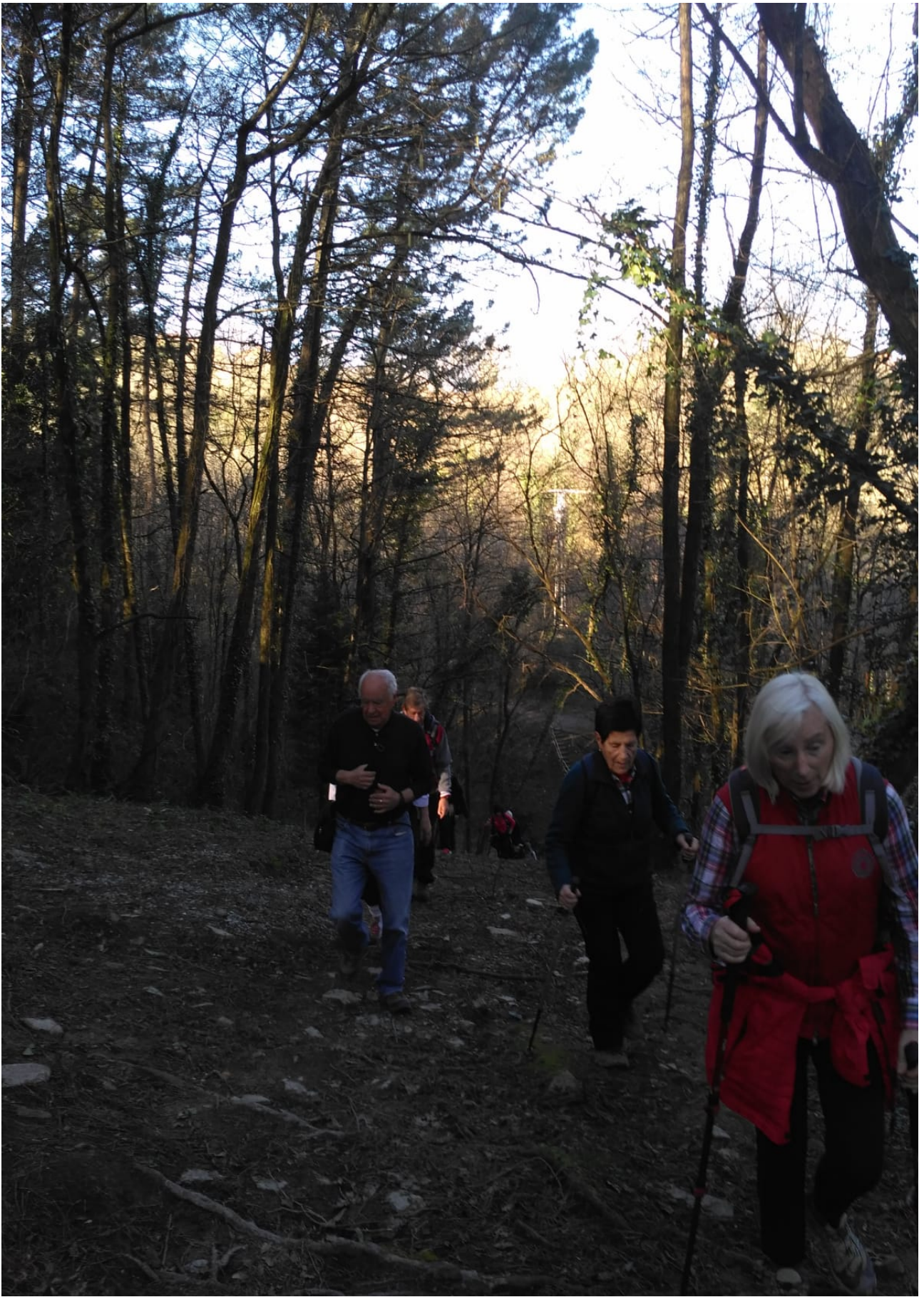
Hemen ere ikus daiteke nolako aldapa igo duten Miramongo parkearen barruan