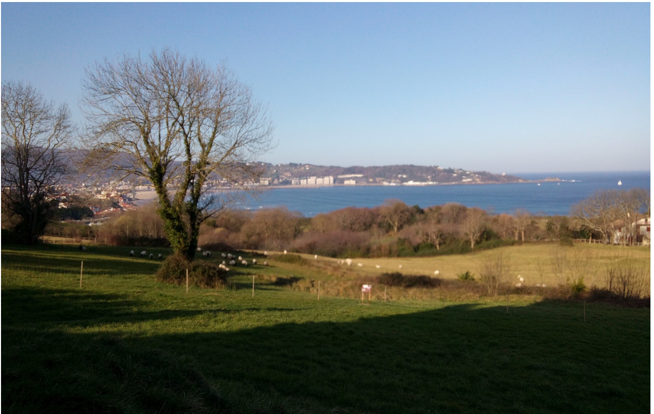
Itsasoa, larrea, artaldea...ibilbidean zehar