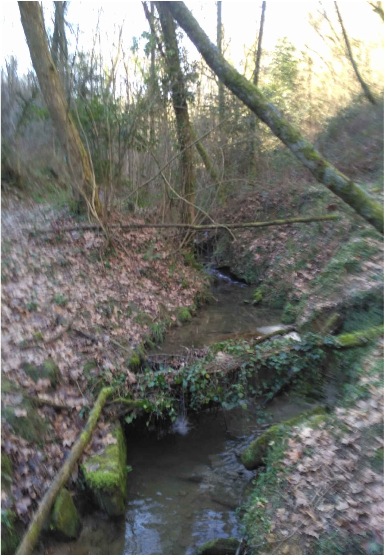
Beheko aldean honelako errekatxoak ikus daitezke