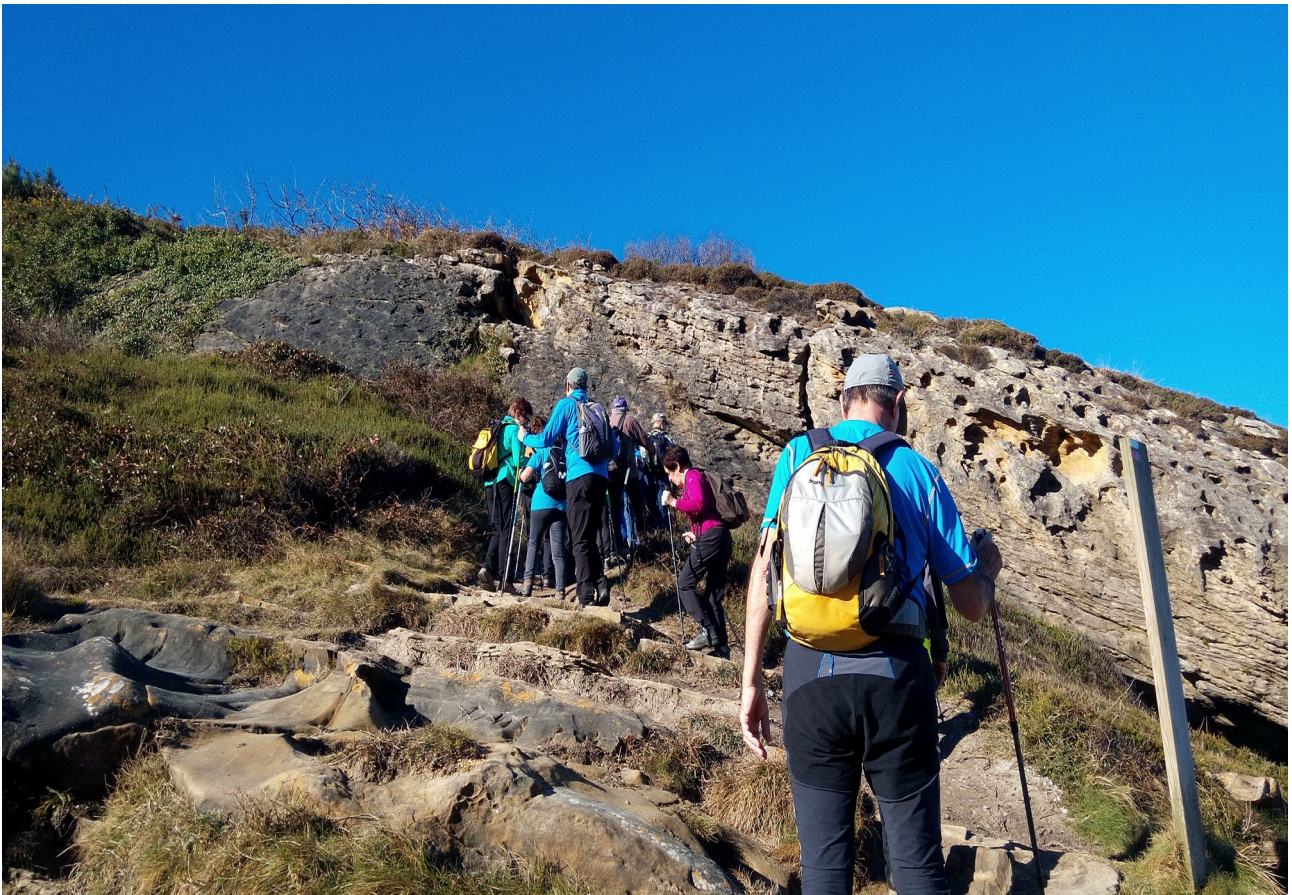
Atseden laburraren ondoren, jendea Eiherarantz abiatzen ari da une honetan