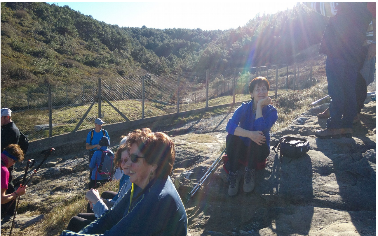
A zer nolako lasaitasuna sumatzen zaien ibiltari hauei!