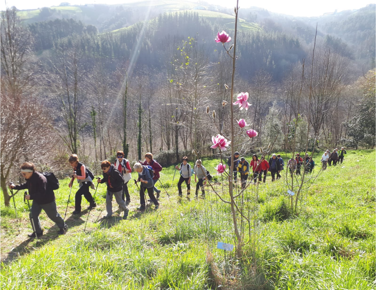
Baina, gero, honelako bidezidor polit eta ederretik igaro behar dugu