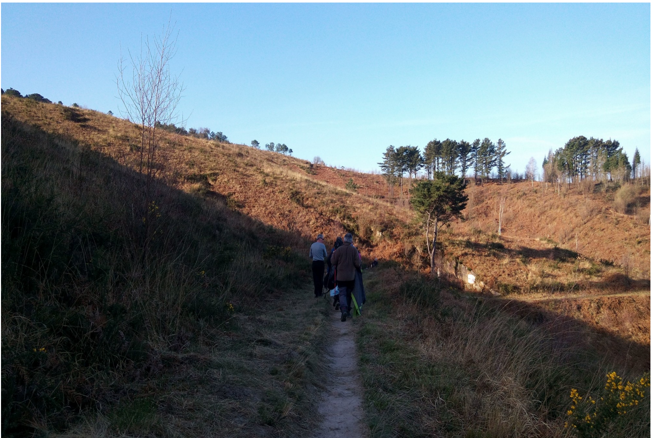
Kukuharri mendirantz doan bidezidorrean