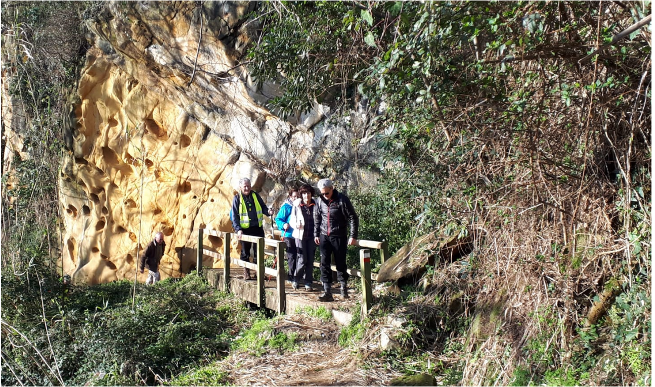
Itsasaldean dagoen egurrezko zubia zeharkatzen