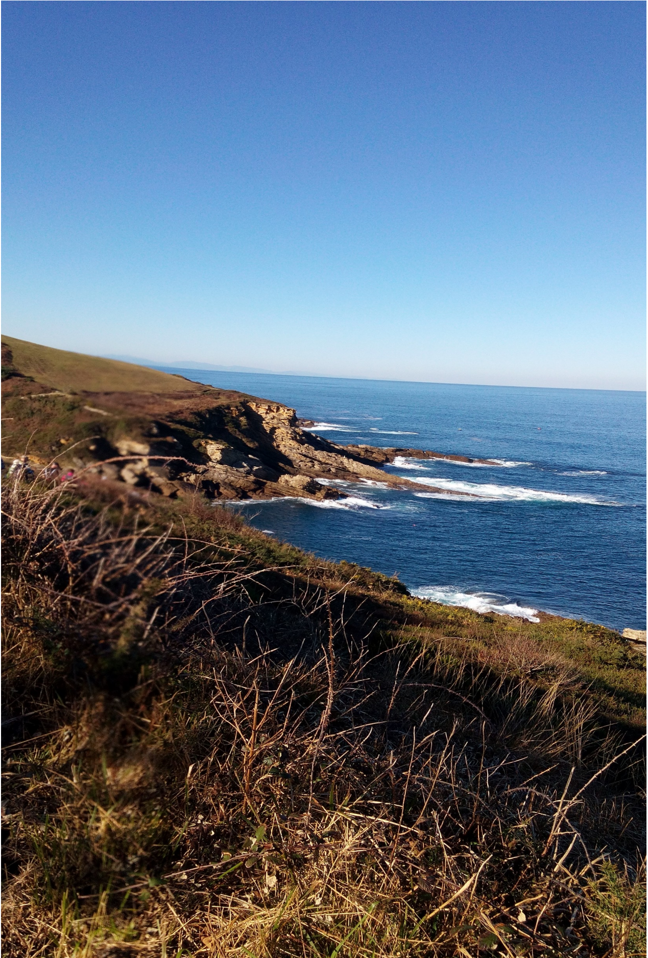
Eiherako itsasarte ederra gure aurrean