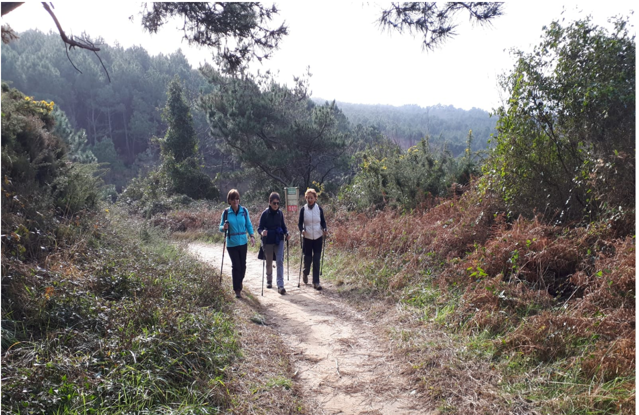
Ez dirudi lokatza izan zutenik, nahiz eta aurreko egunetan euria erruz egin