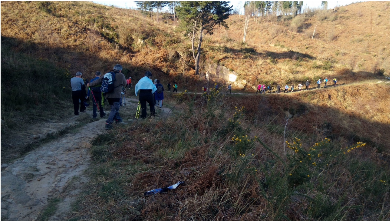
Donejakue bidea jarraitzen dugu etengabe