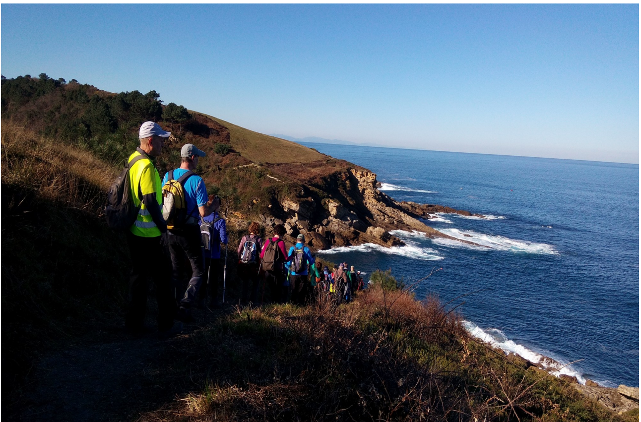
Eiherarako bidean, itsasarterik ederrenetakoa dugu begien aurrean