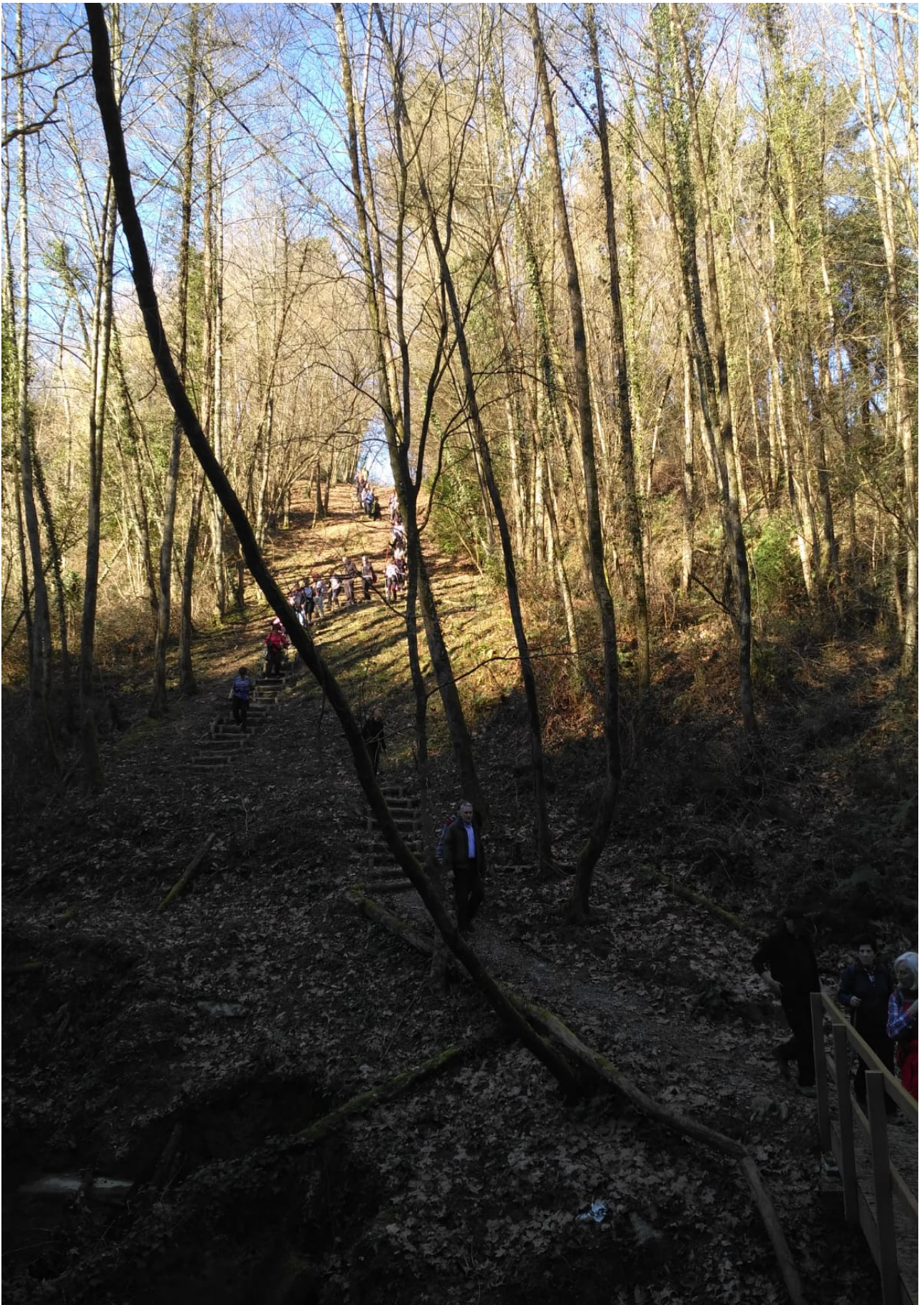
Errekaren zubira iritsi baino lehen, jendeak banan-banan joan behar du eskaileretan zehar