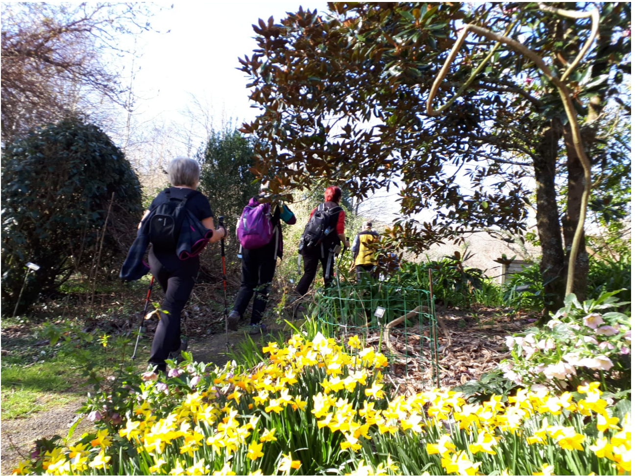
Paisaia loratua nonahi, alderdi honetan