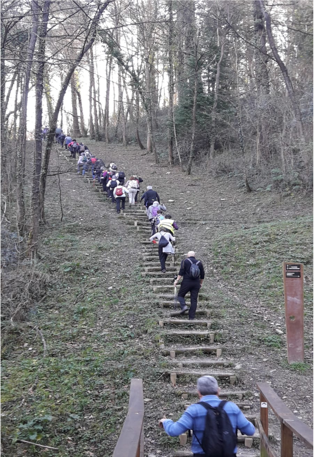
Zubia atzean utzi, eta ibiltarien bihotz taupadek gora egiten dute