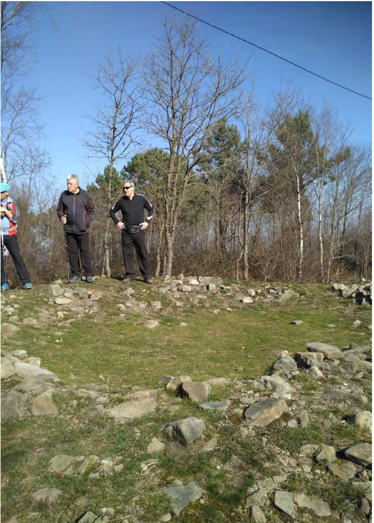
Alpakak edo deritzon animalia harrigarriak, Orioko Bentaren ondoan Igeldoko Tontortxikiko laugarren tumuluaren aurrean