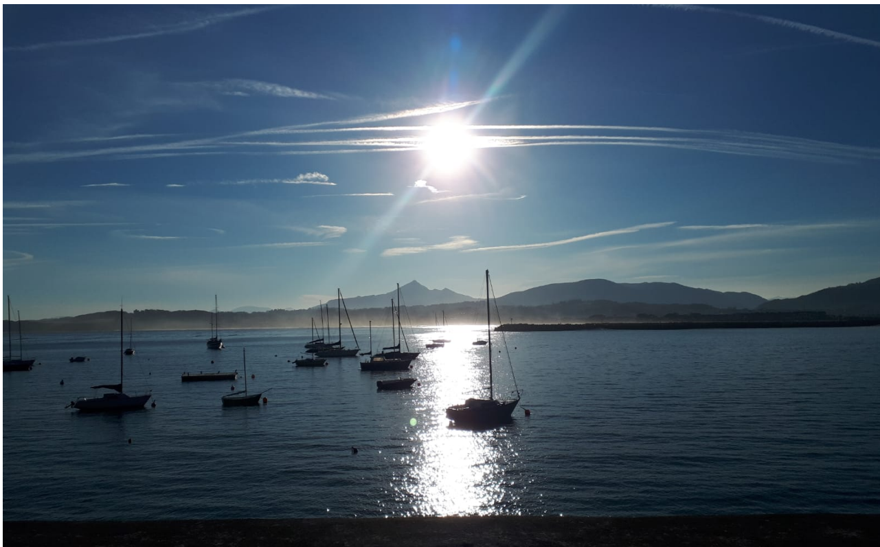
Hondarribiko kaiaren ondotik, Larhun mendia hondo-hondoan ikusten delarik