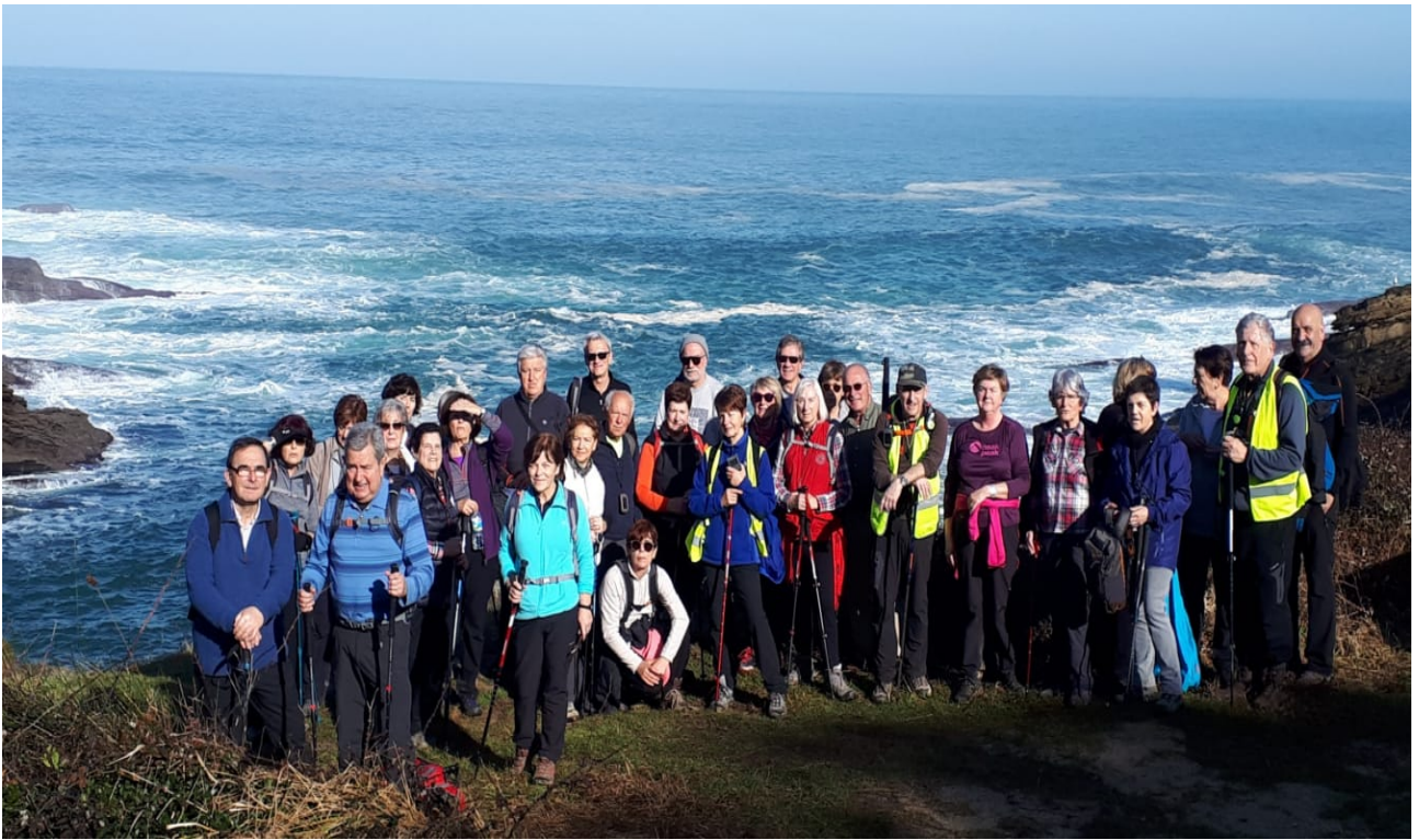
Talde osoaren argazkia, itsasoko ertzaren ondoan