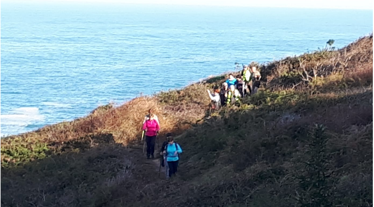
Itsasoaren parean dagoen bidetik, jendea banan-banan