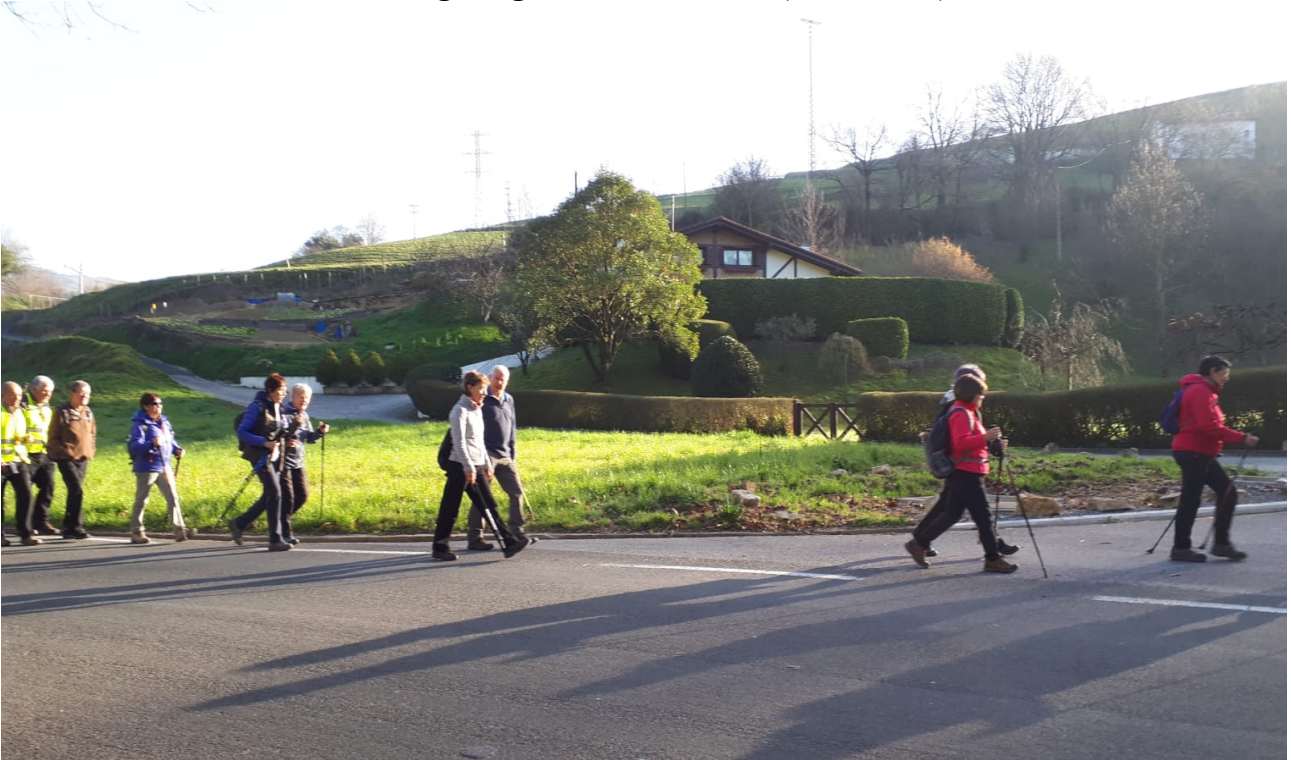
Agorregira joateko, hasieran, errepidea erabili behar da