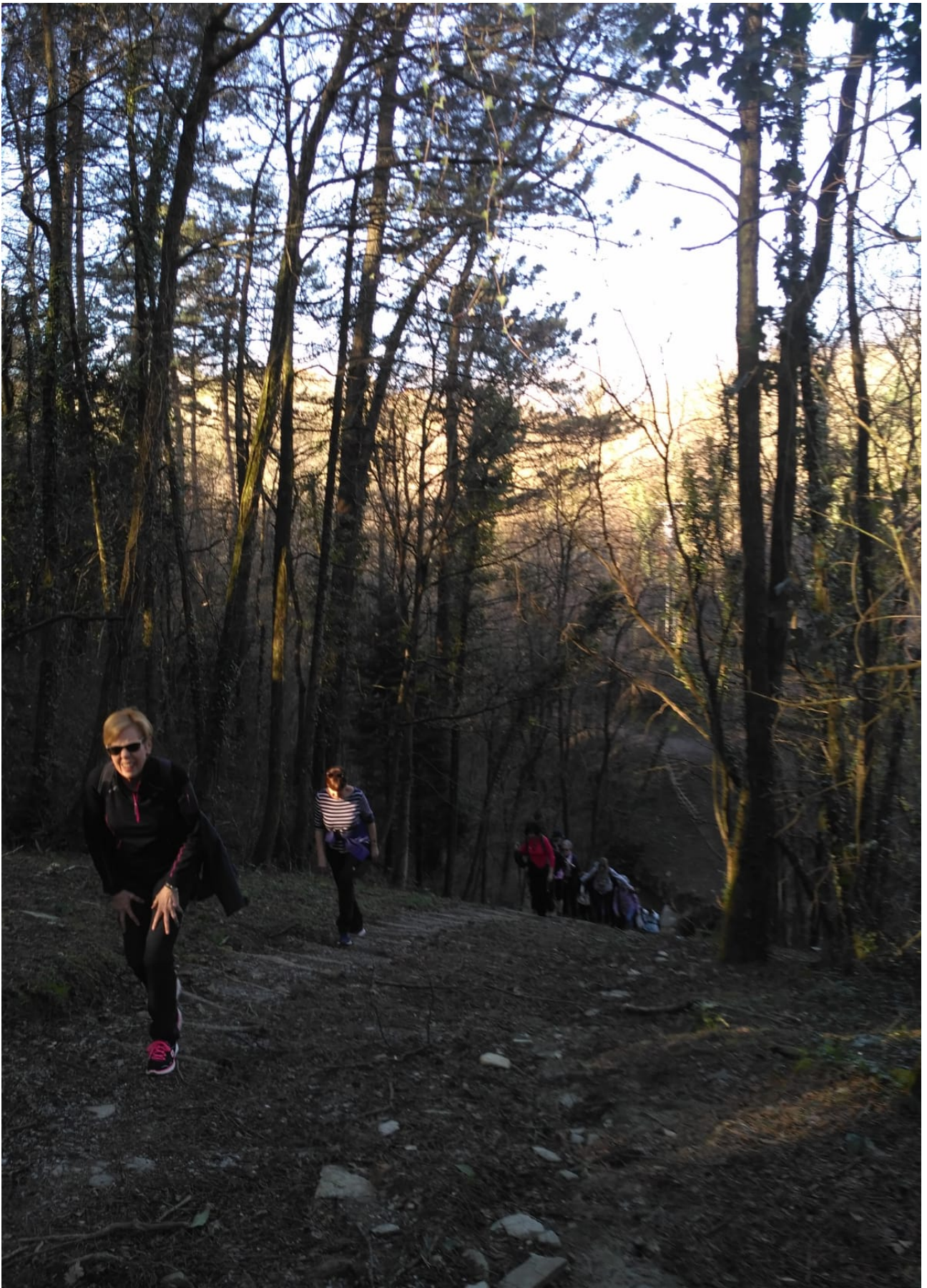
Begira nola eregiten dien bere bi belaunei emakume honek, eskaileretan gora