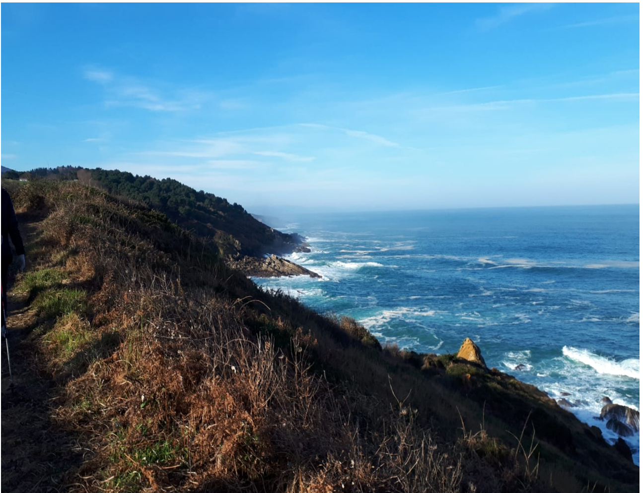
Talaia bidean zehar, itsasoa nahiko haserre