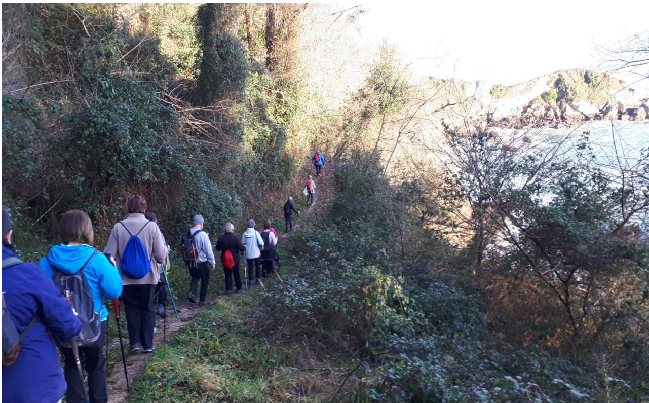
Higer itsasargiranzko bidezidorrean zehar ibiltariak