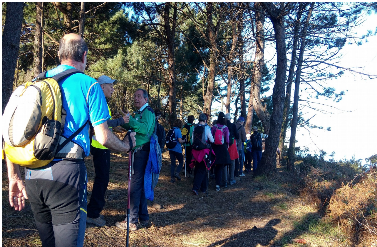
Ibiltariak, atseden laburraren ondoren, elkaturik abian jartzen dira