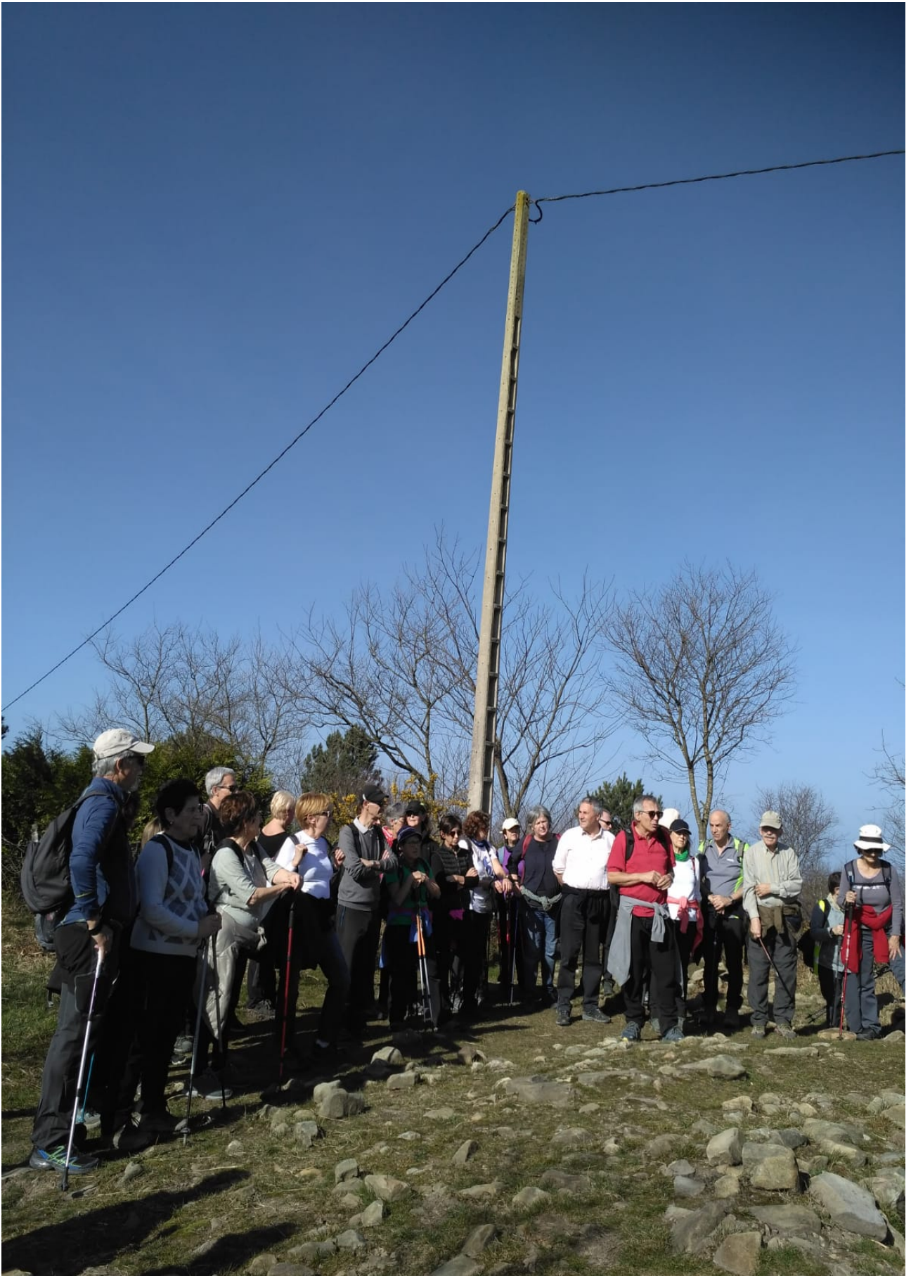
Tontortxikiko tumulu baten aurrean, erramunek azalpenak ematen (lau dira tumuluak)