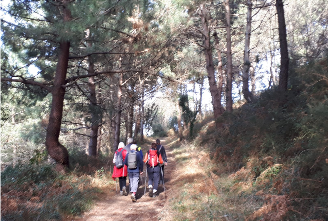
Higer itsasagiranz, ibilaldiaren bukaeran