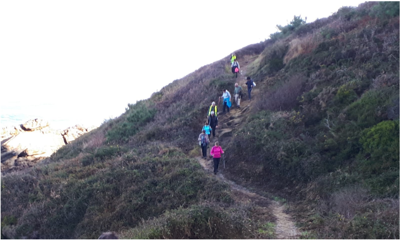
Jaitsieretan beti erne joan behar du ibiltariak