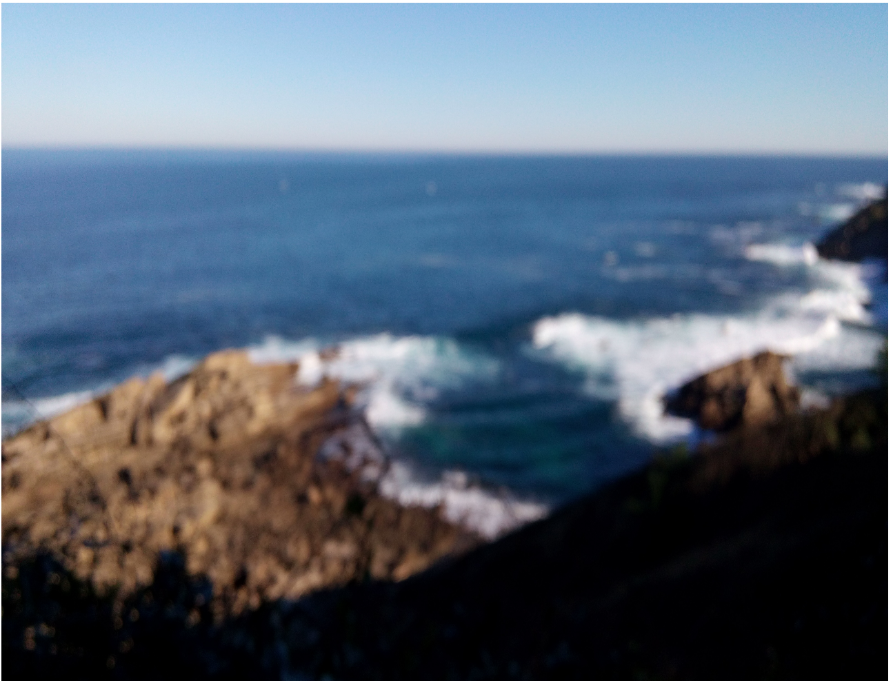
Itsasbazter nahiko nahasian, olatuak harkaitzen kontra