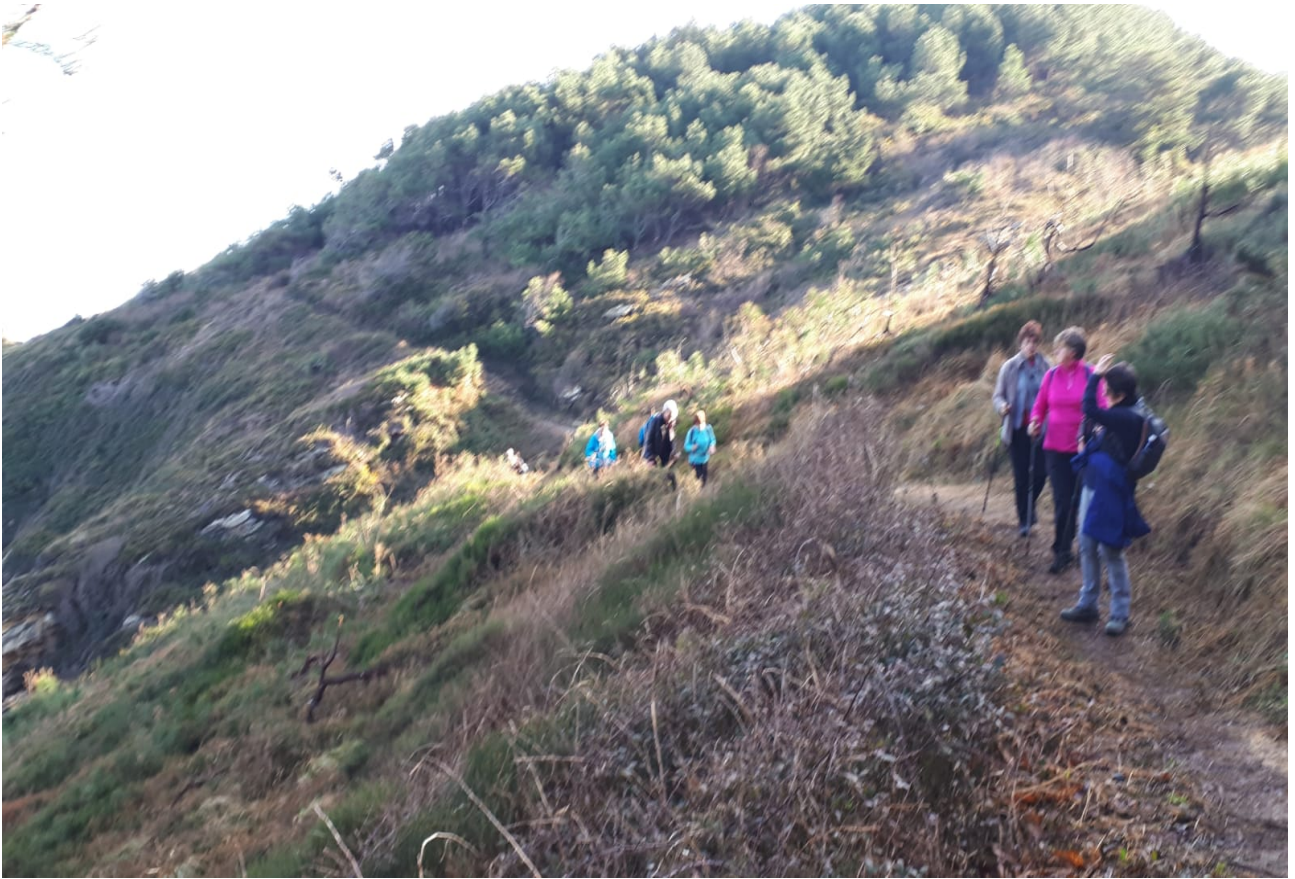
Gozatzeko moduko alderdia da Eiheraren ingurukoa