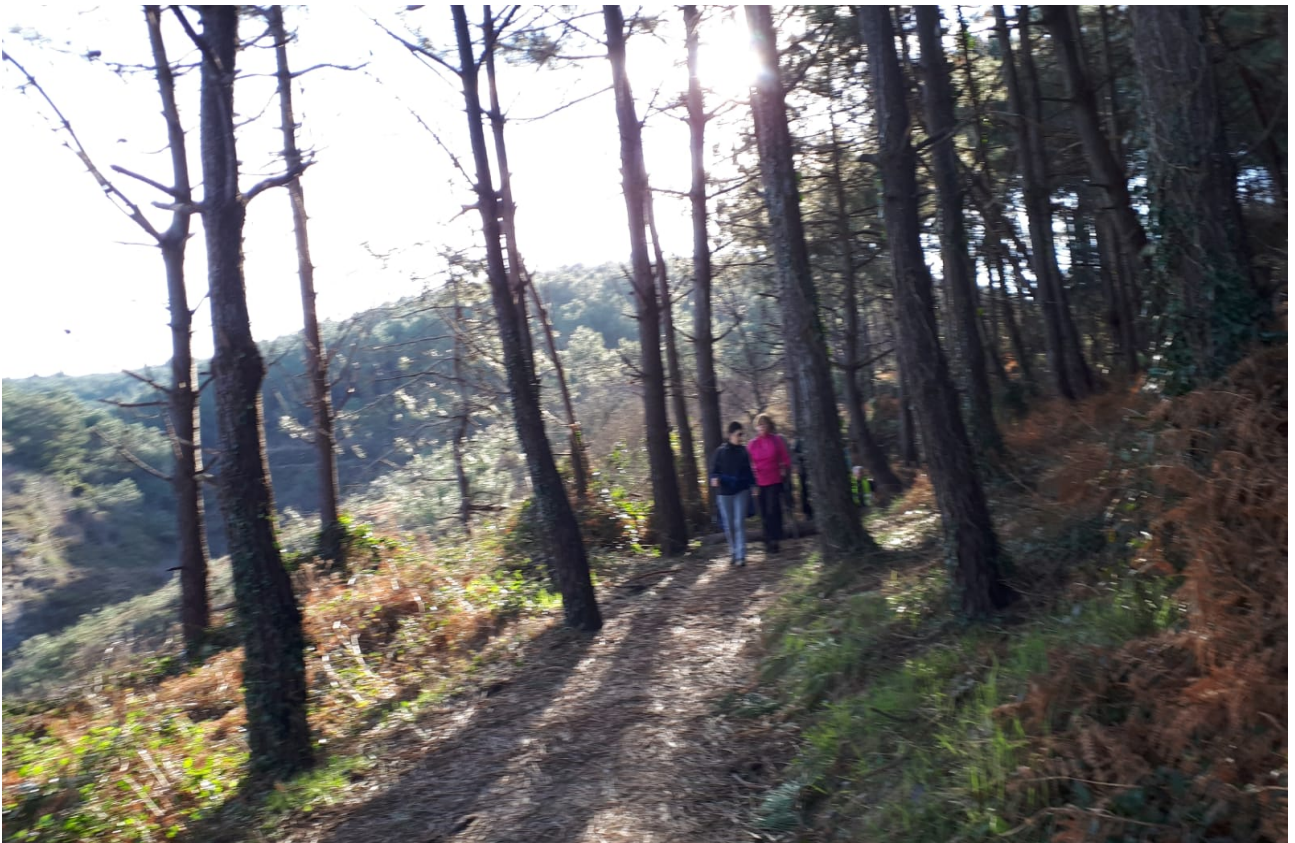
Aurreko irtenaldian Abarzuzak zenbait gibelurdi jaso zuen alderdi honetan