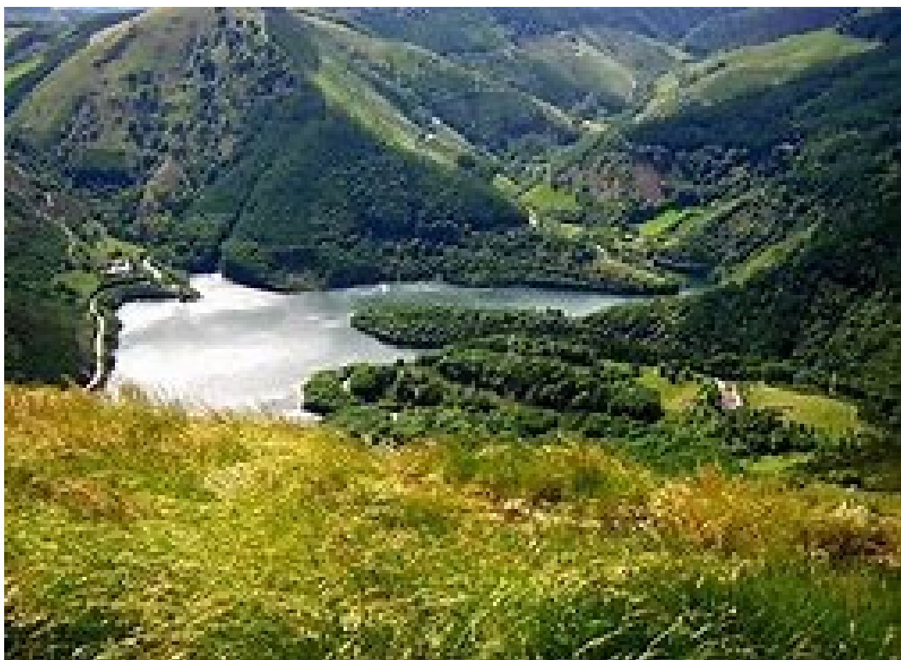
Endara (San Anton) urtegia