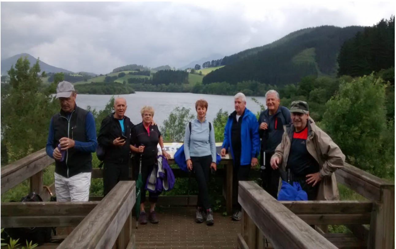
Urkulu urtegiaren inguruan dagoen begiratoki batean