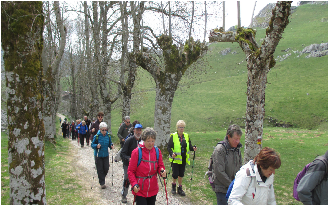
Urbiatik Arantzazuko bidean