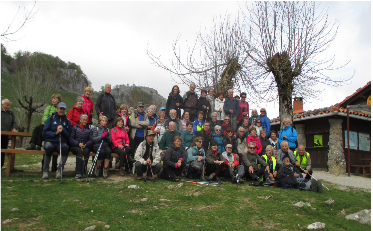
Talde osoa Urbiako ostatuaren ondoan