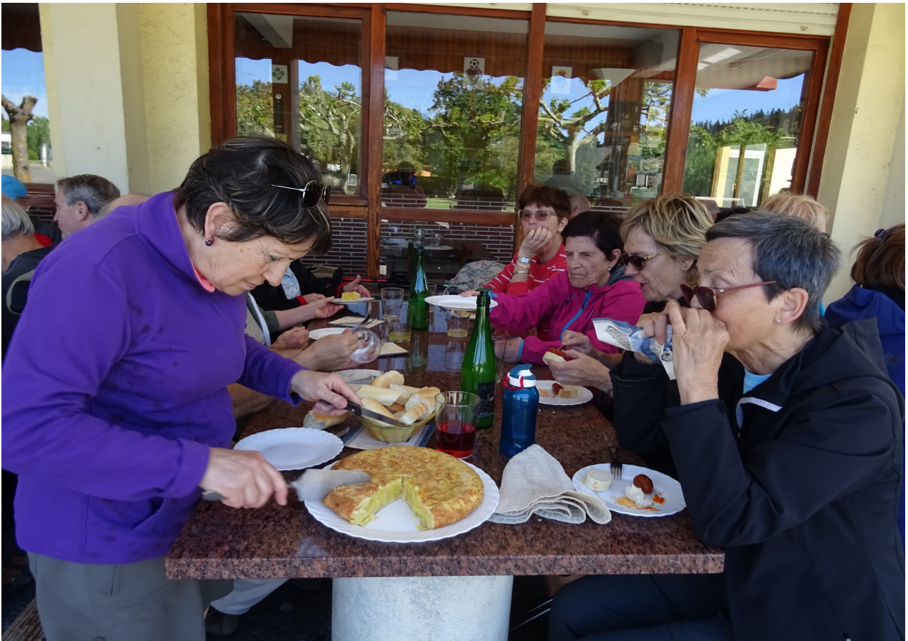
Begira zein ondo zatitzen duen nafarrak patata tortilla!