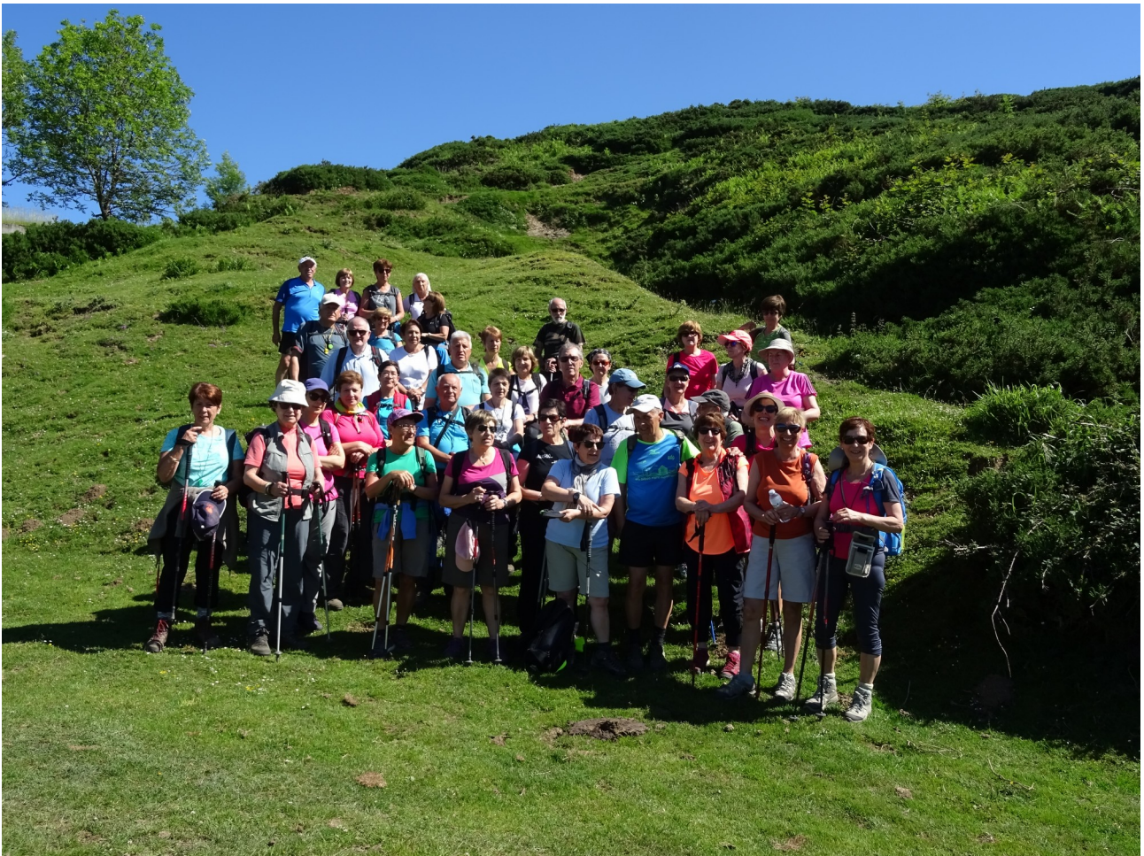
Emakume andana gizon gutxi horiek babestera joan ziren