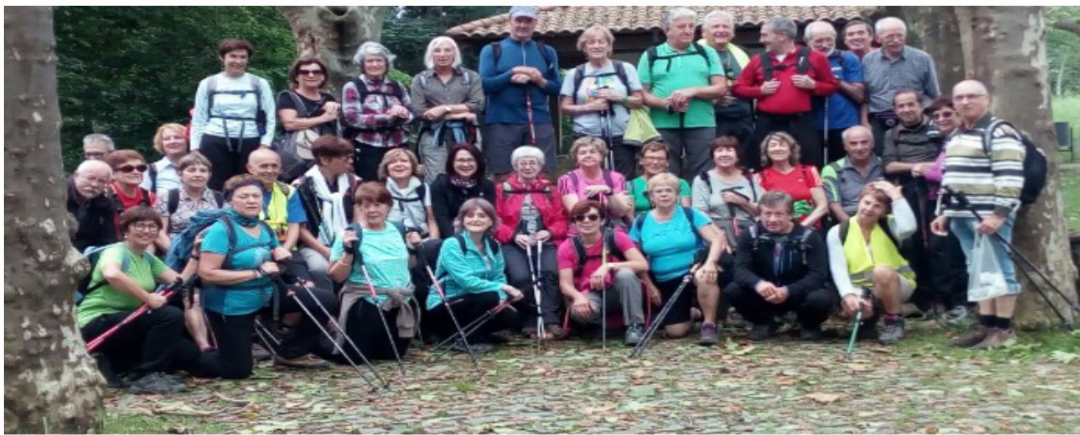
Taldea San Martzial basilizaren ondoan