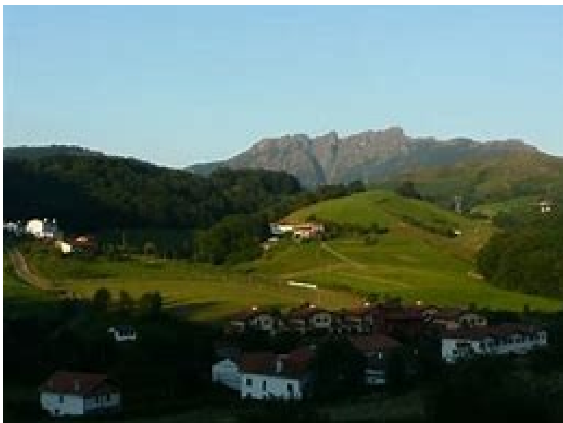
Oiartzun inguruko paisaia, hondo-hondoan, Aiako Harria