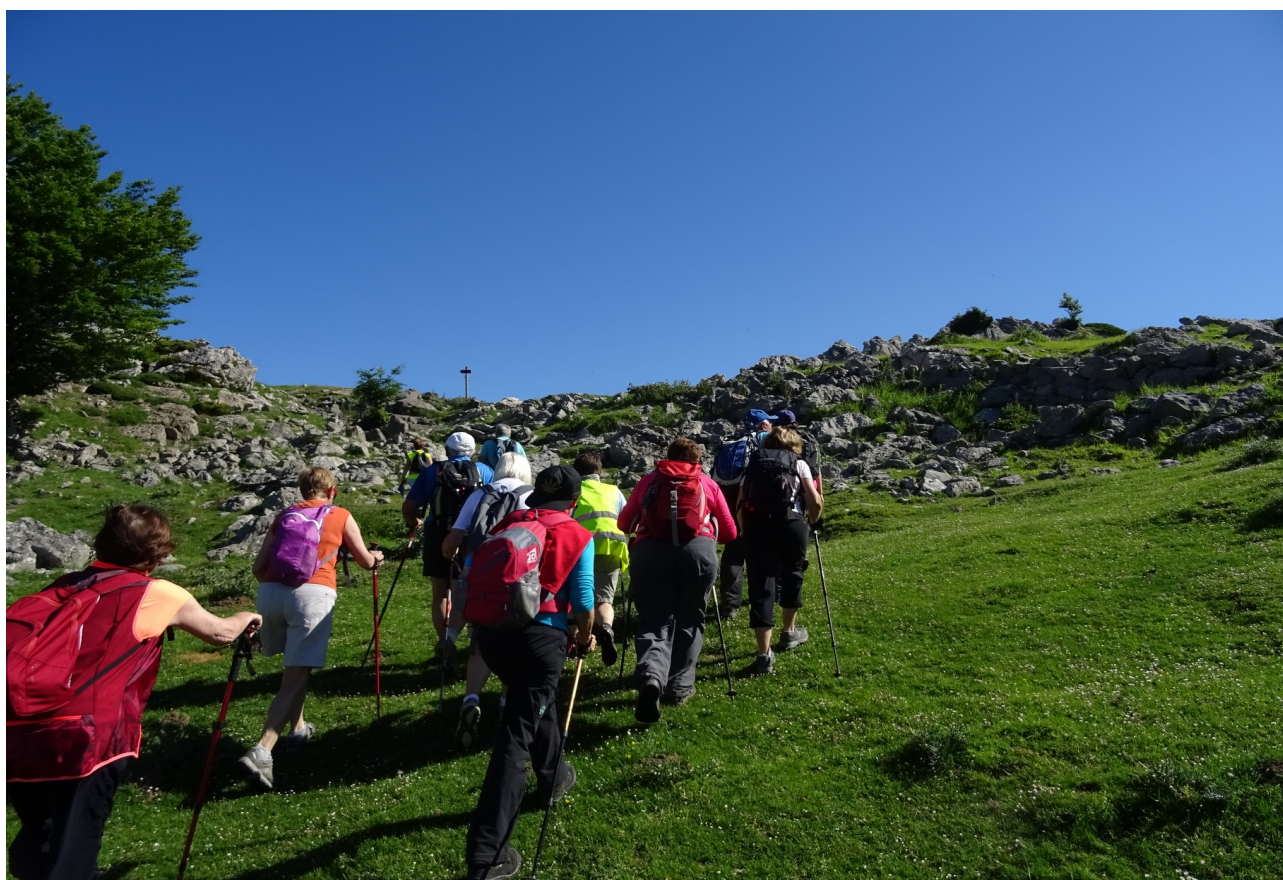
Igaratza inguruan, taldea aldapatxoa igotzen