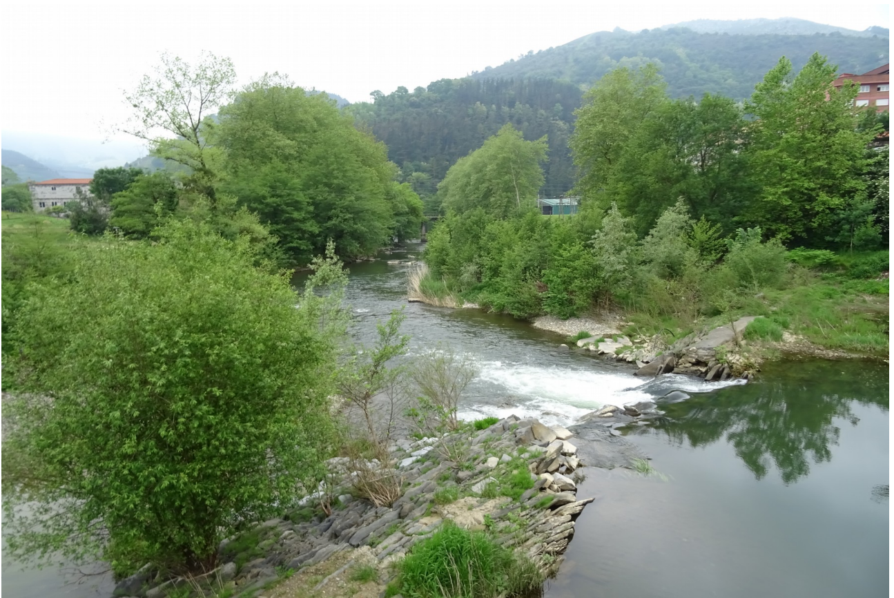
Erreka ondo garbia ikusten da hemen, Lasarantz goazela