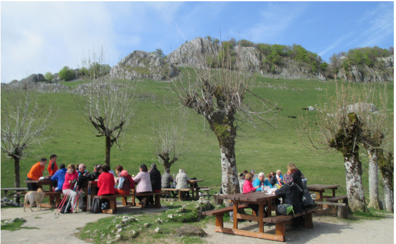
Urbiako landetako eserleku dotoretan hamaiketako dastatzen