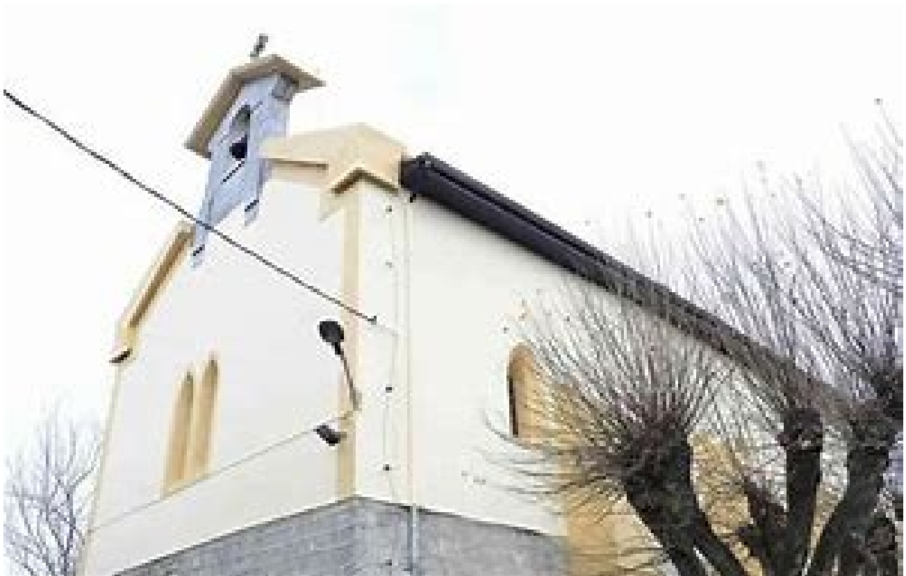
Izaskun auzoko basiliza