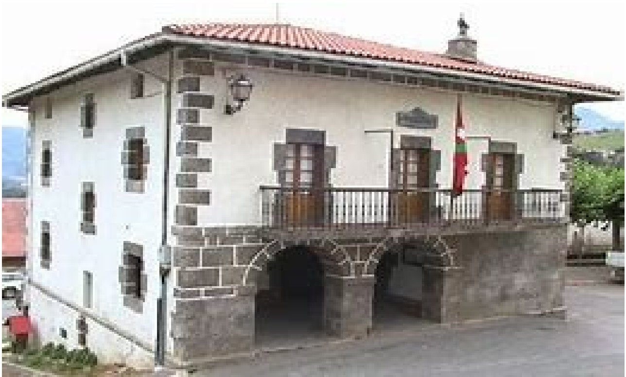
Belauntzako udala, aldapa ederra igo ondoren