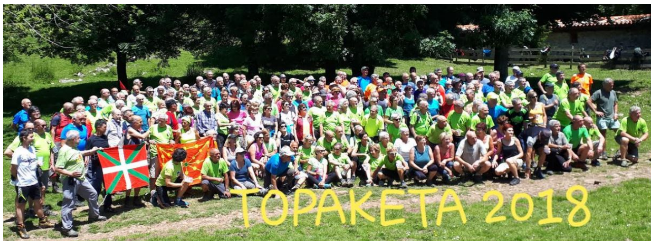
Talde guztiak elkarrekin, lehenengo topaketan