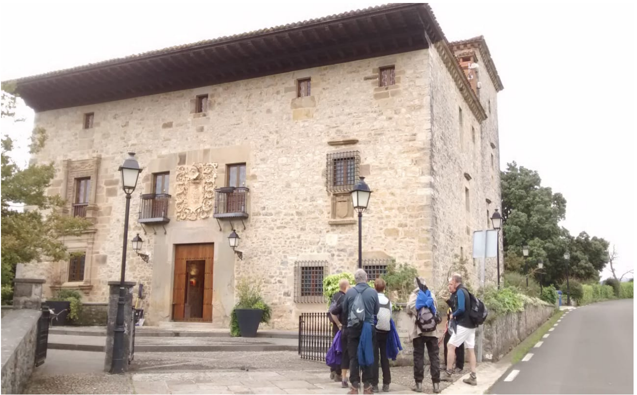
Otalora jauregiaren aurrean batzordekideok