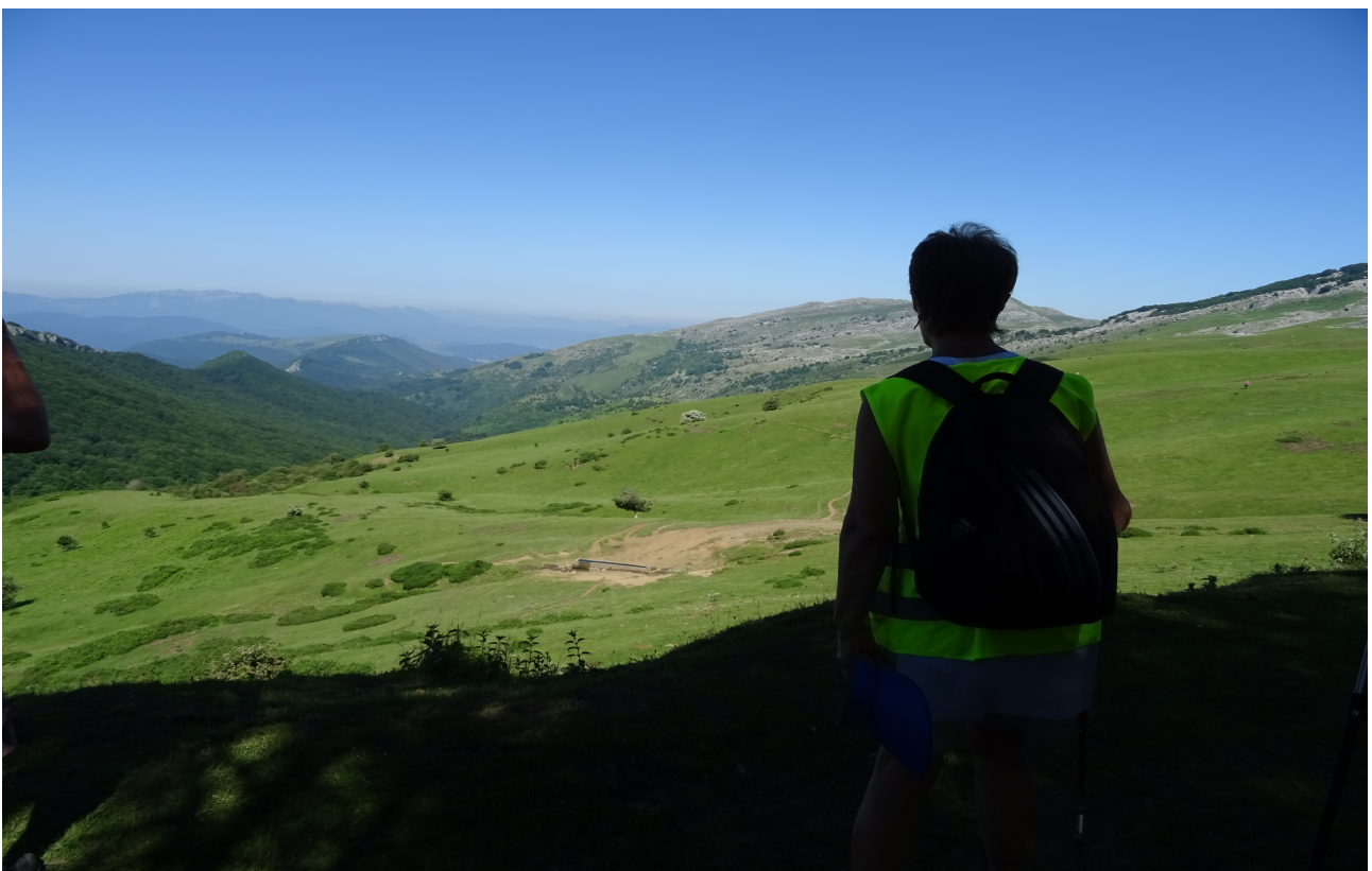
Aitzindaria kapitainaren lekutik paisaia behatzen