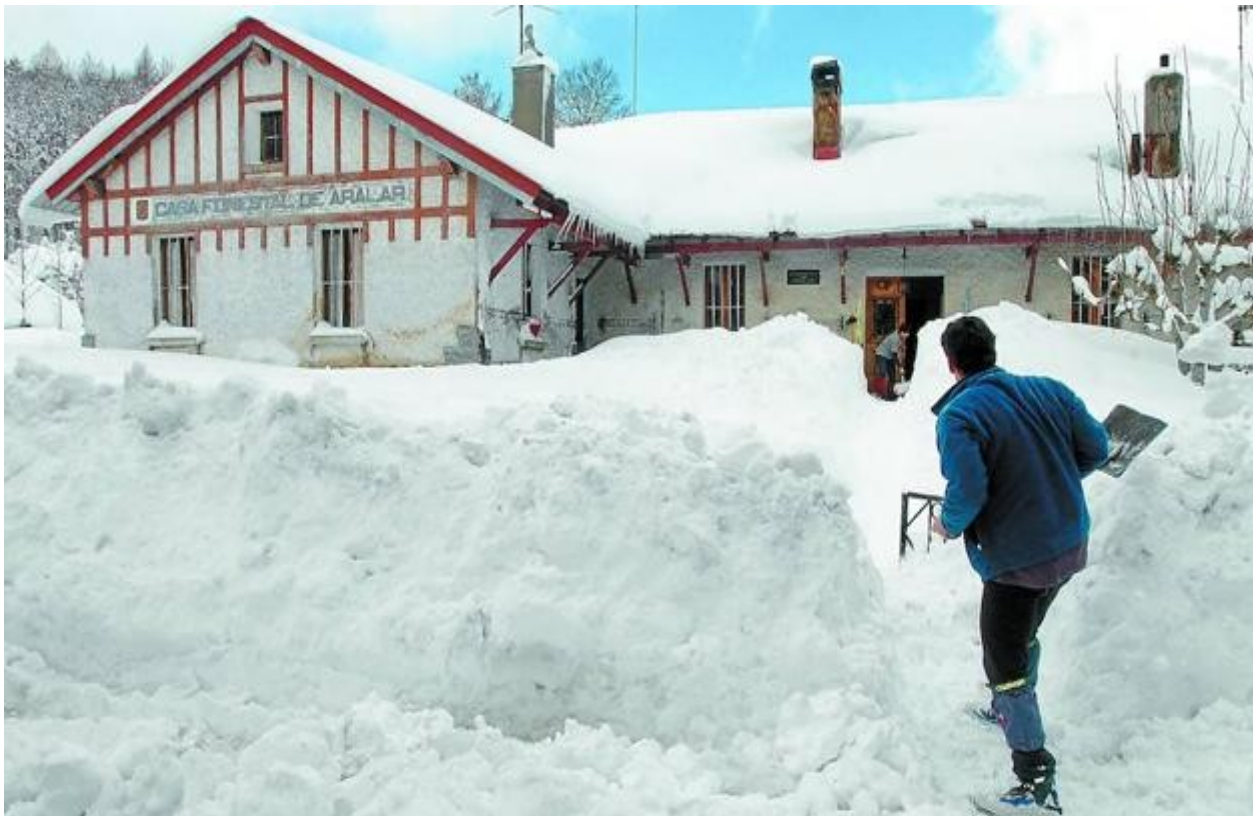
Garai bateko Guardiaetxea, 2009. urtean eraitsia