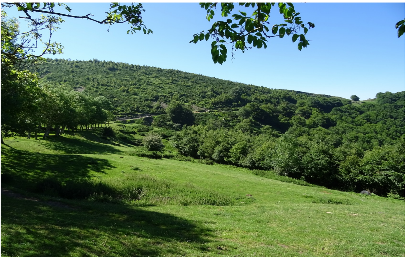
Igaratzako betiko ikuspegia izugarri polita