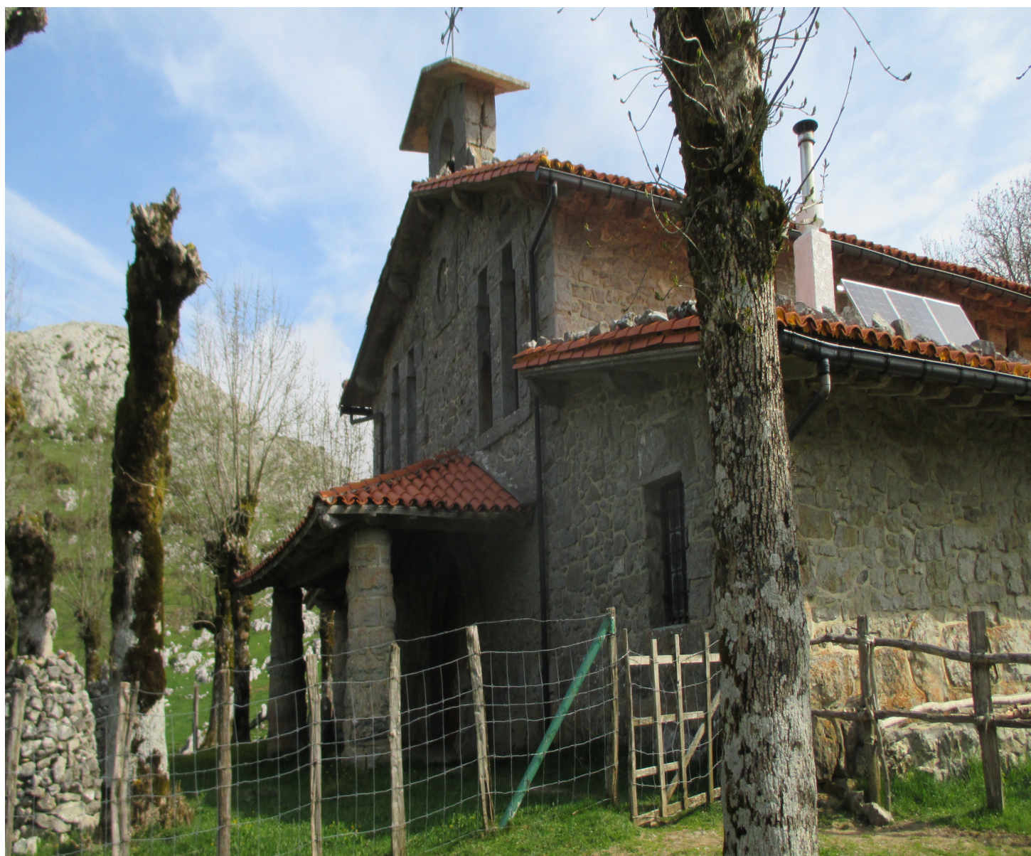
Urbiako baseliza eta zuhaitz kimatuak

Pertsona berez eskuzabala ote da leku orotan? Kalean ez da hori sumatzen mendian, aldiz, askotan. Gaurko honetan jende gazteak bazeukan bere asmotan, andrea altxa goxo-goxorik eramateko besotan.