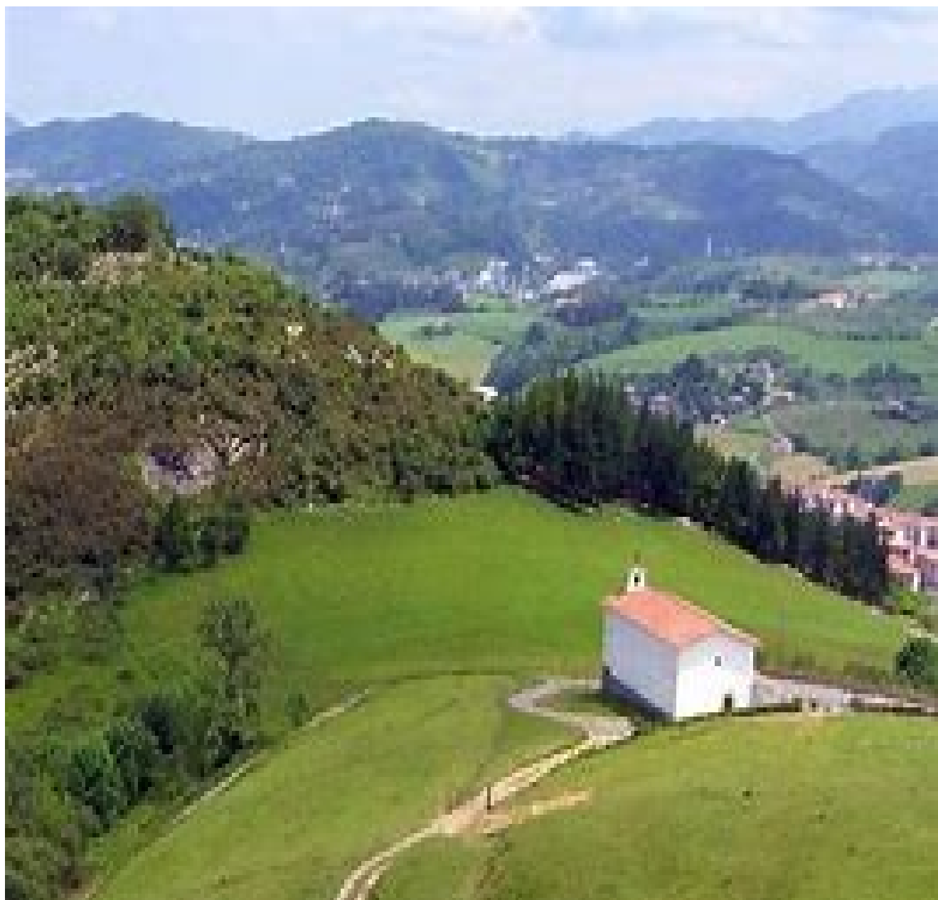
Azkorte inguruko paisaia eta basiliza