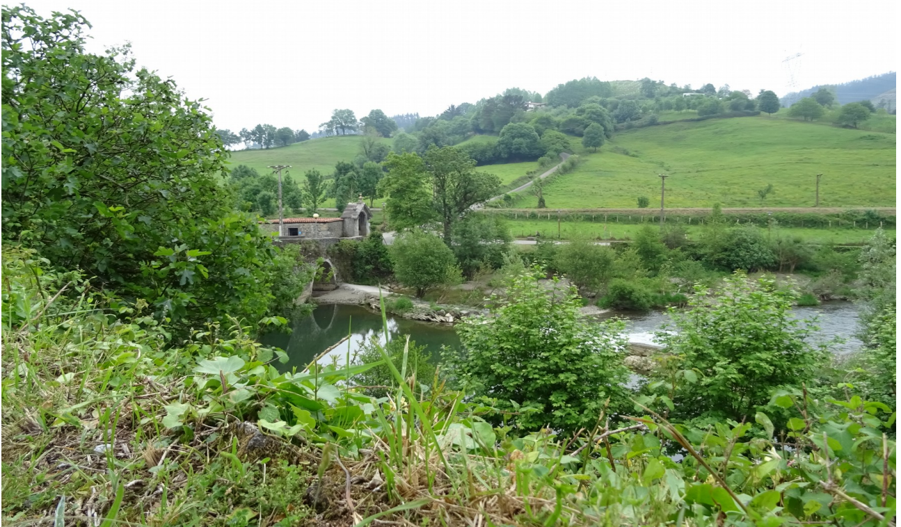
Zestoako garbitegi edo ikuztegia, zubia pasa ondoren dagoena