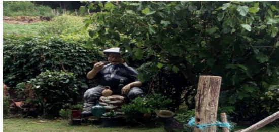
Iorategi ederra duen baserria, Olentzero eta guzti