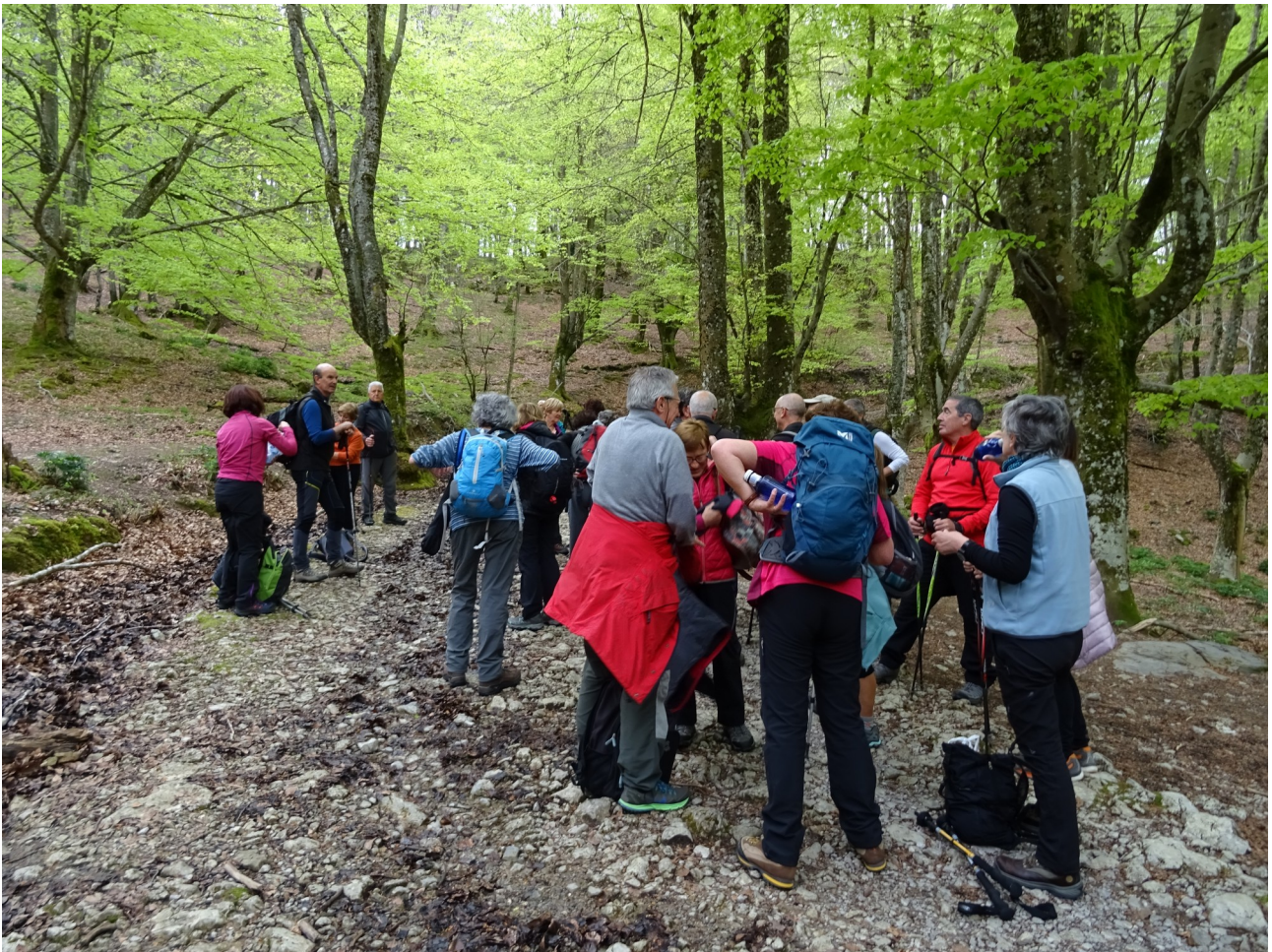
Atsedean laburrean jantziak eransten eta jan-edaten