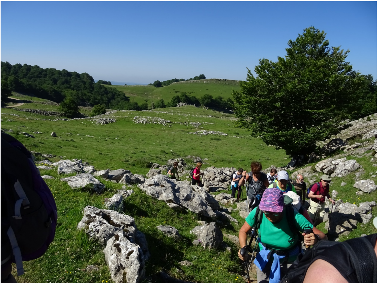
Kareharriaren tartean, ibiltariok erne