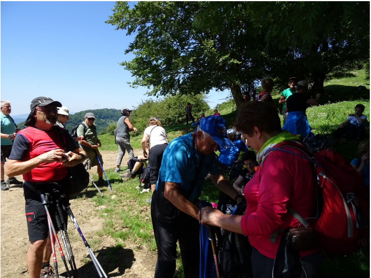
Zein gustura hartzen den atsedenalditxo unea!