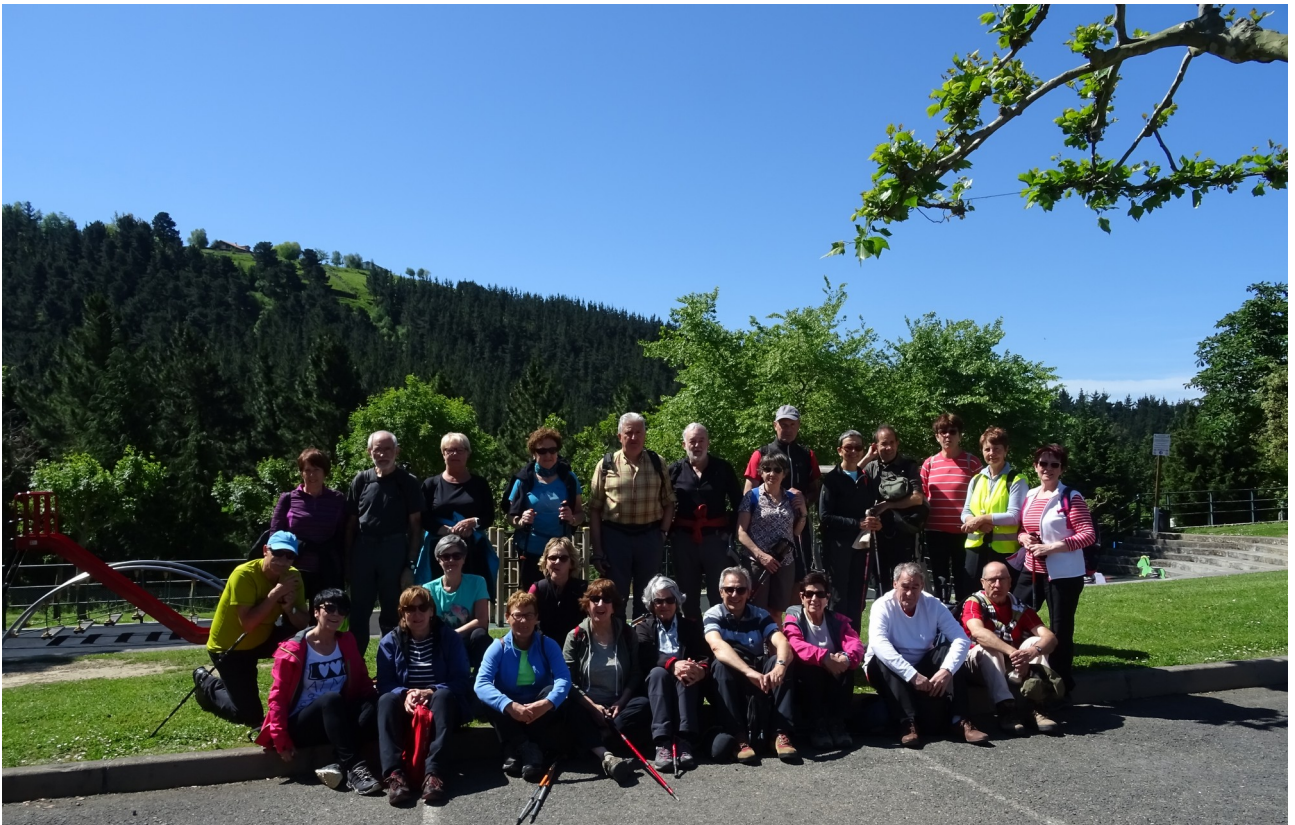
Taldea Galdonamendin, hamaiketakoa hartu ondoren eta hau dastatzen