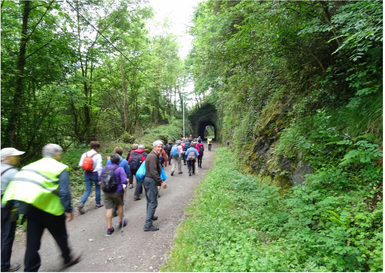
Paisaia berde eta polit askoa Iraetatik Zestoara doana