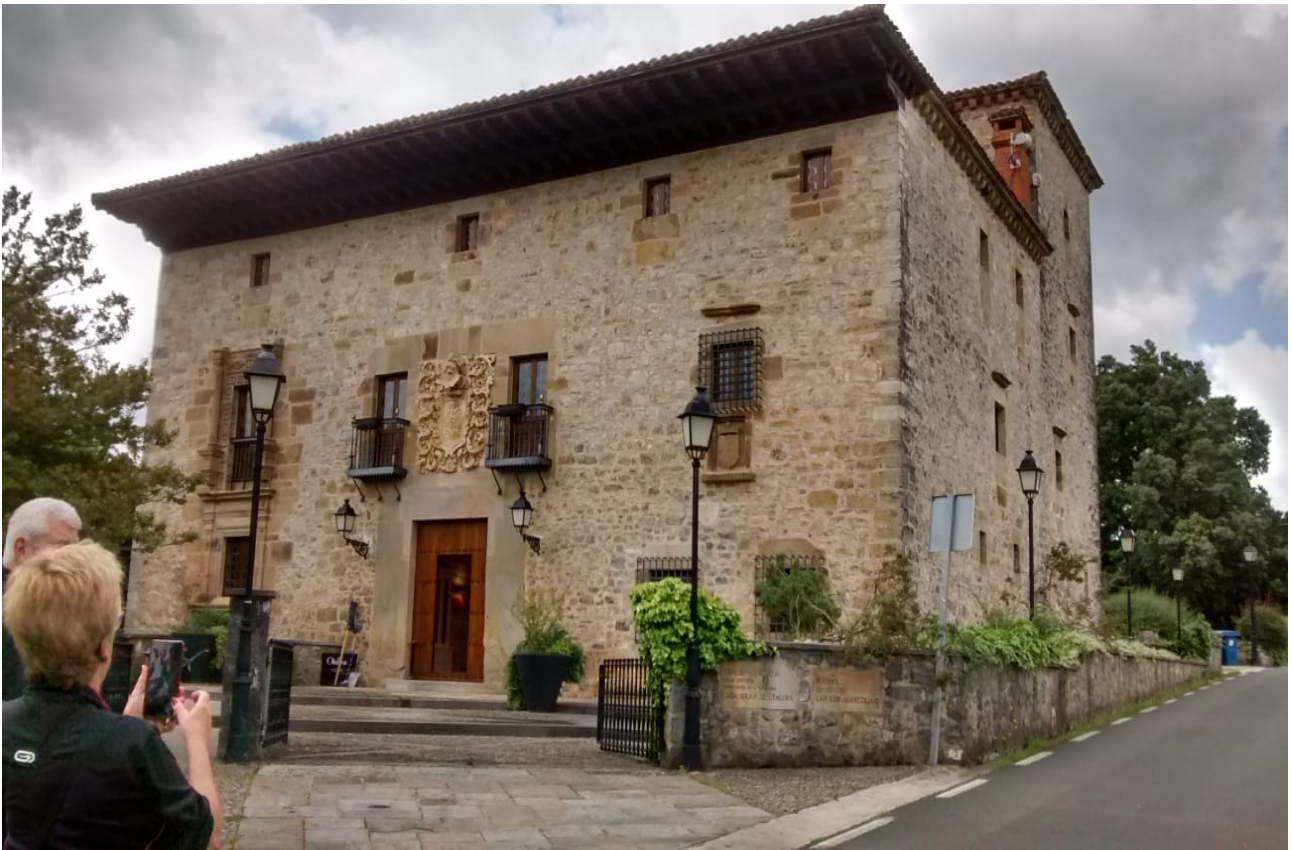
Otalora jauregia, Urkulu urtegiaren ondoan