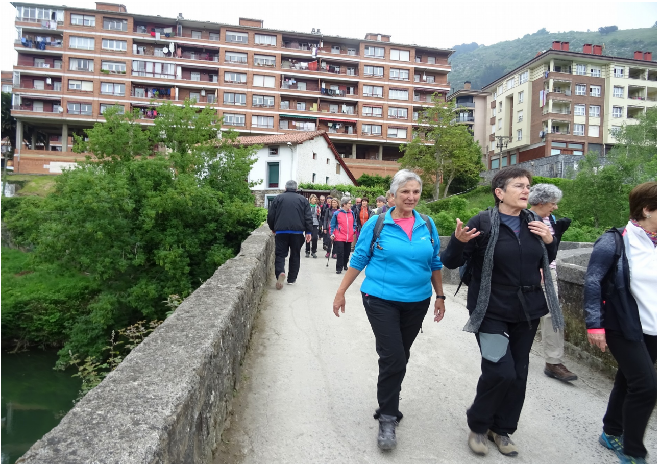
Zestoako zubian, Ekain Berri edo Lasao bidean