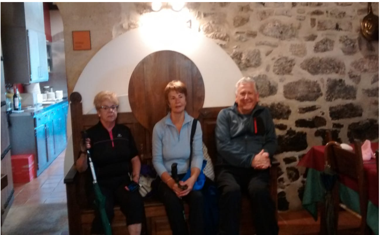
Otalorako familiaren jantokian, hirukotea bazkaltzeko prest