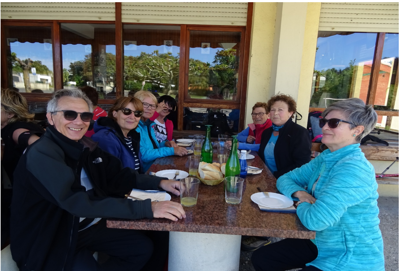
Eta zein gustura dagoen tipo hau emkumez inguratirik