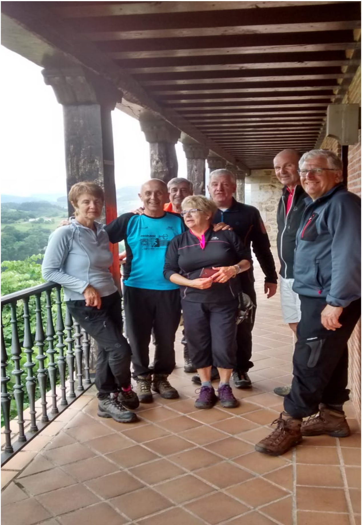
Otalora jauregiko balkoi honetatik, paisaia zoragarria da