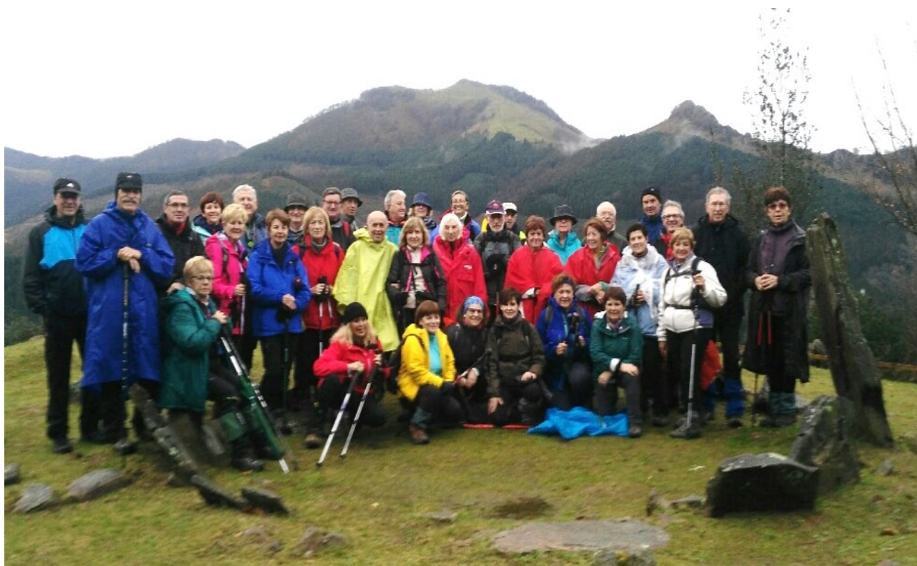
Mendi muino batean, Besabiko bidean

Euria lagun egun osoan eta lokatza orpoan, leku honetan ikus daiteke urki ugari basoan. Burdin arotik brontze arora ibili gara gaurkoan, mairu baratzak, trikuharriak iraun dute luzaroan.