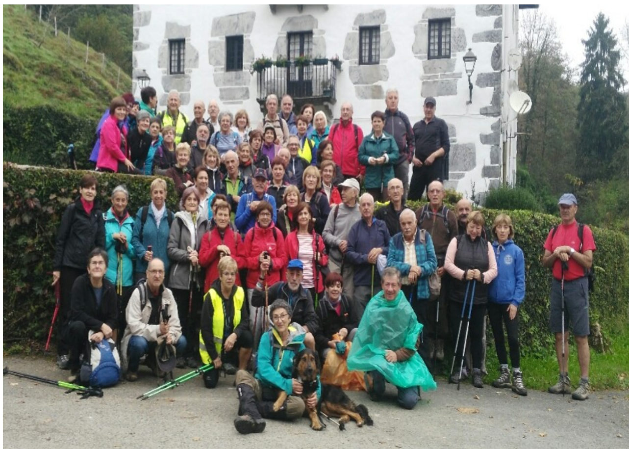
Artikutzako ostatuaren ondoko taldearen argazkia