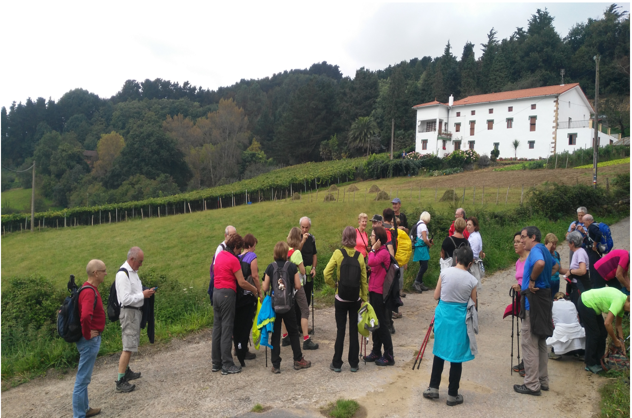
Santa Barbaran, ohiko atsedendian