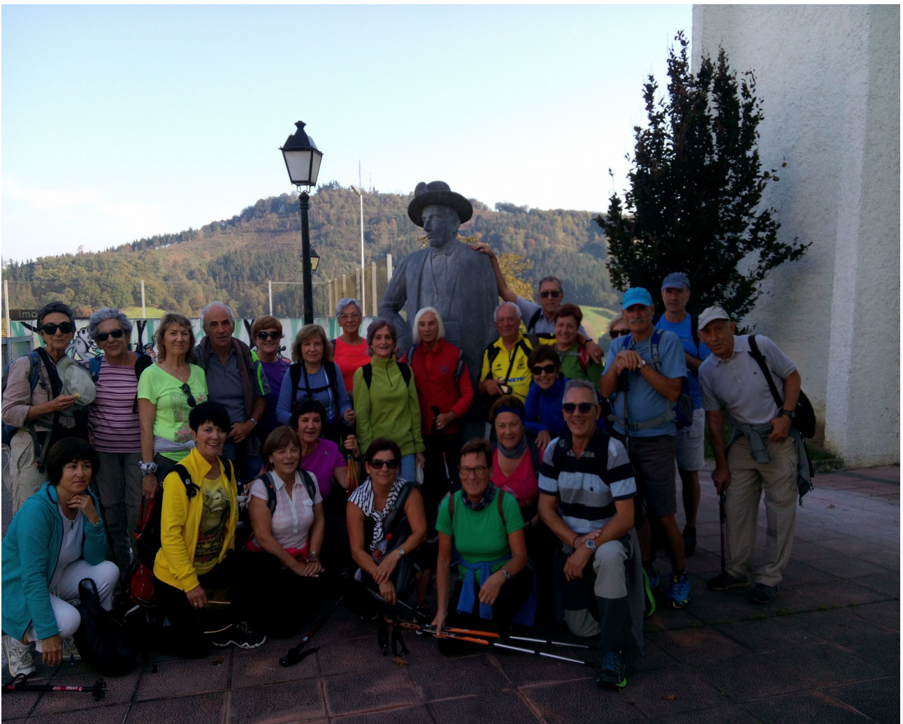
Altzoko Handiaren ondoan ipotxak dirudigu