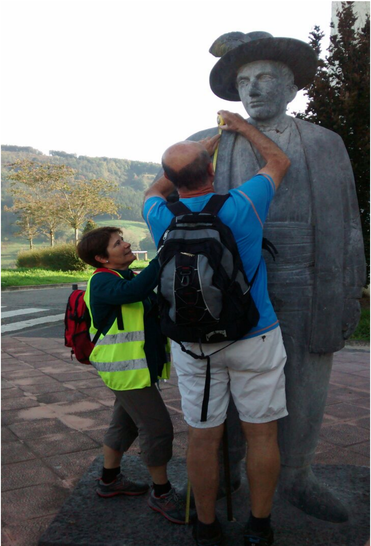
Honaino bi metro; hemendik gora...