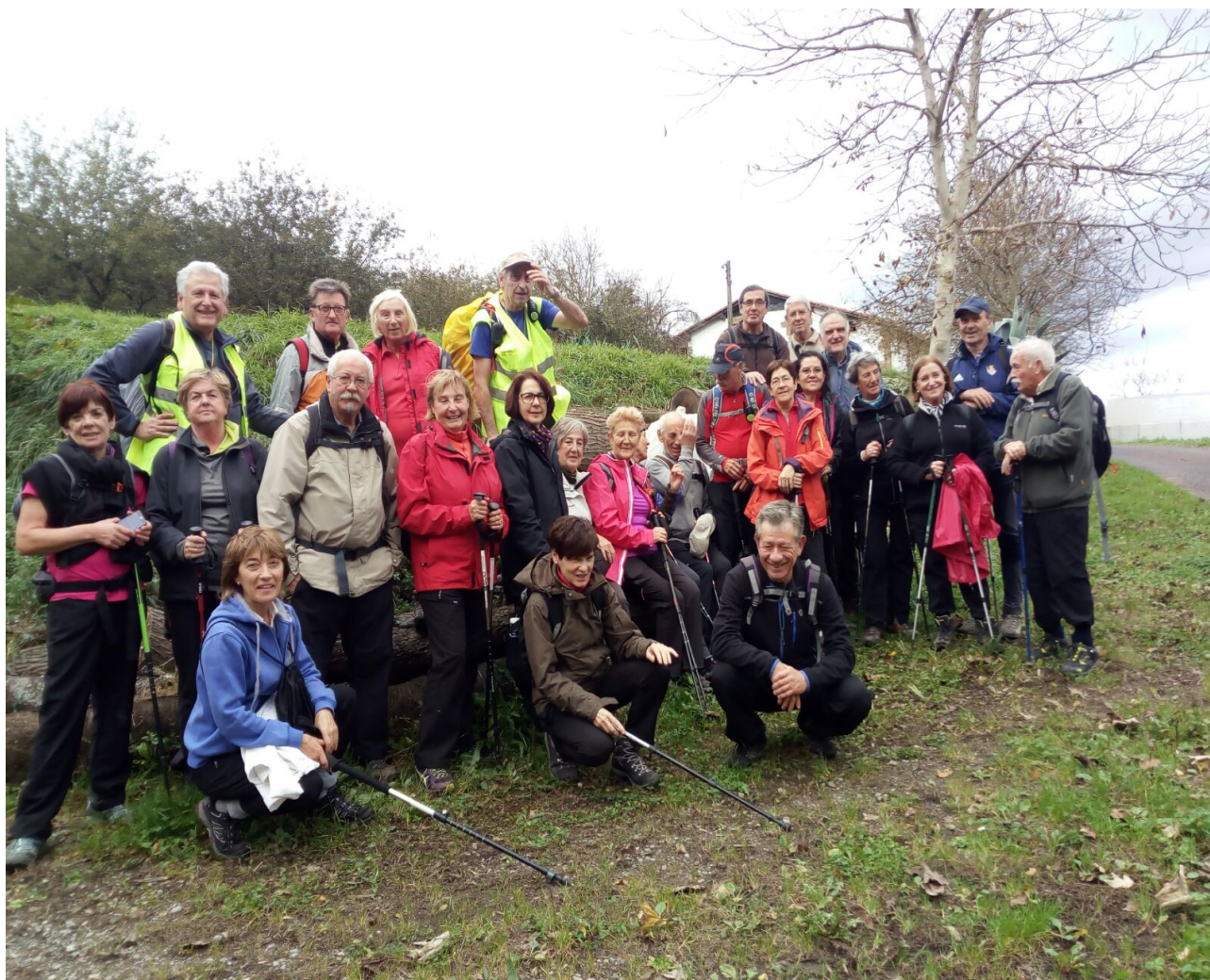
Ibilbidearen ia bukaeran, Anoetarantz jaisten