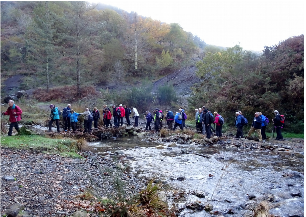
Arditurriko erreka gurutzatzen eta Tolare jatetxeko une bat