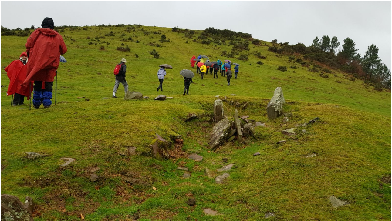
Mendi muino batera igotzen, trikuharria oinetan dugula