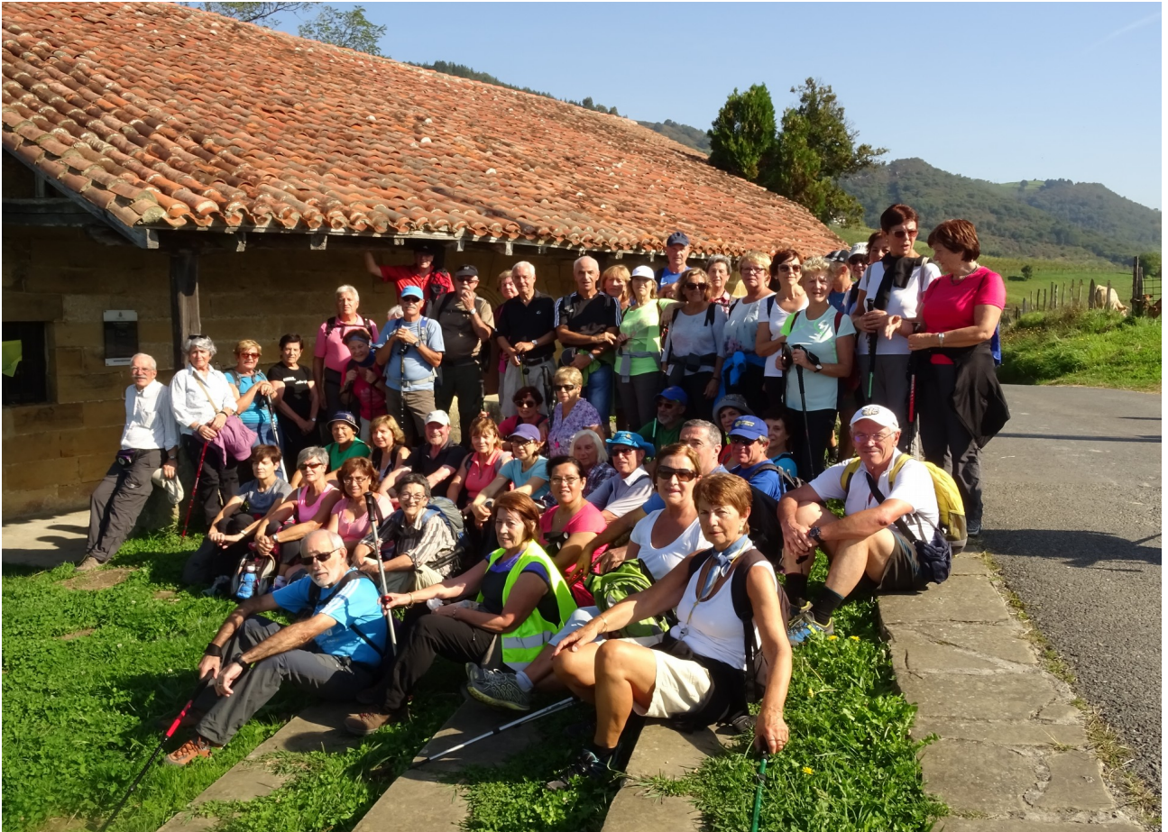
Orioko San Martin basilizaren ondoan, ibilaldiaren bukaeran eta ohiko atsedendian