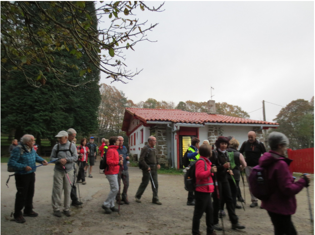
Eskasen, abiatzeko unean, eta Anttonen azalpenak (trenbideari buruzkoak) entzuten