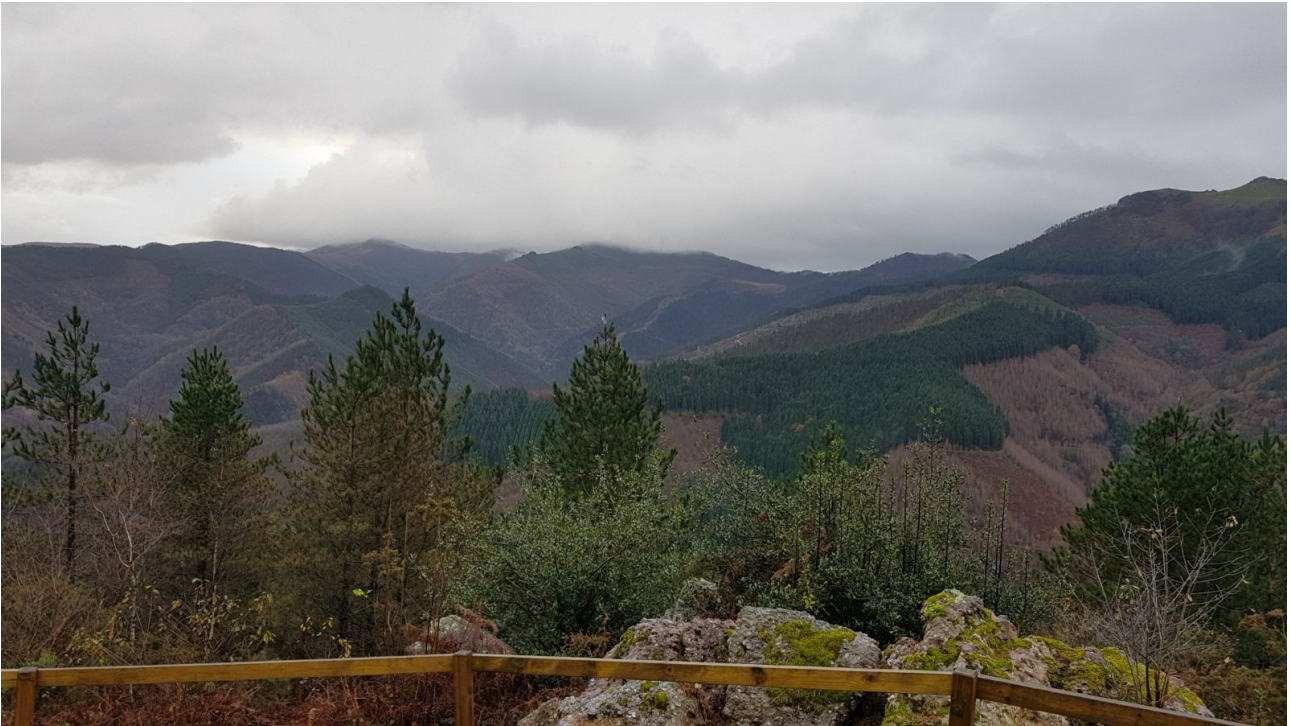
Mulisko Gainekotiko paisaia