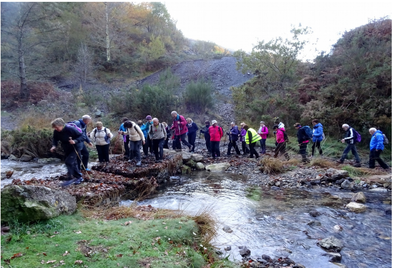
Talde osoa bidegorrian eta Arditurriko erreka zeharkatzen