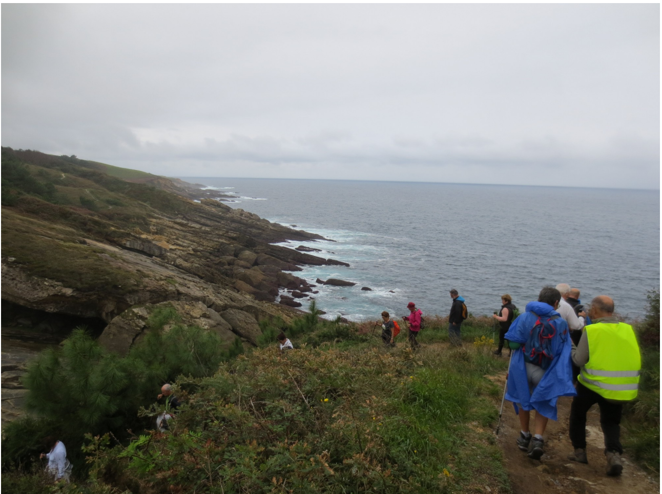
Jaizkibeleko Itsasbazterreko paisaia, Hondarribi aldean