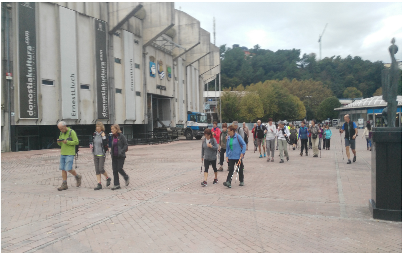
Anoetan, abiadan jartzeko unean