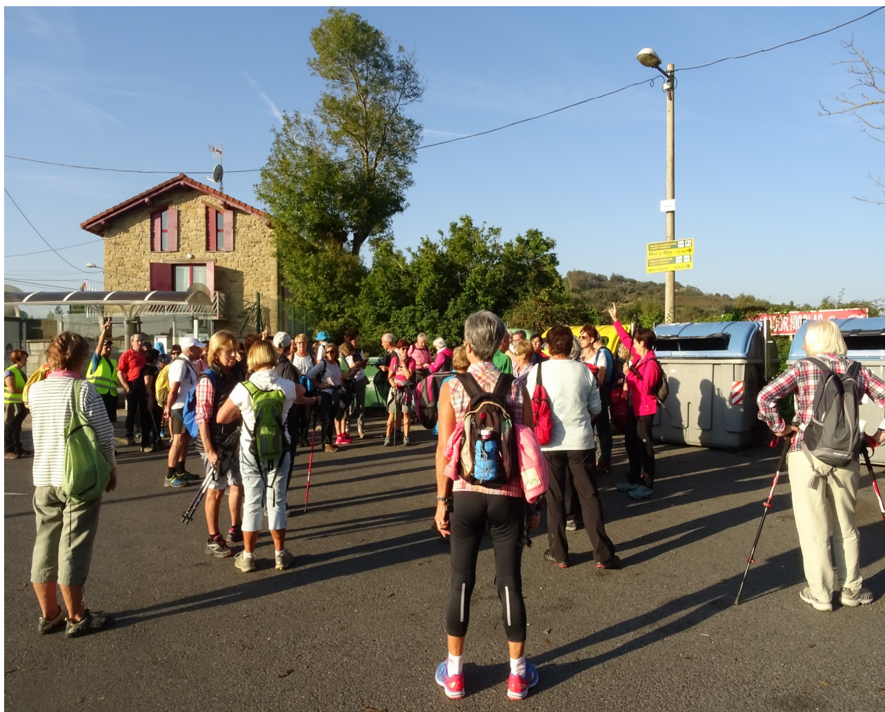
Igeldoko kanpinaren ondoan, ibiltariok abiatzeko prest