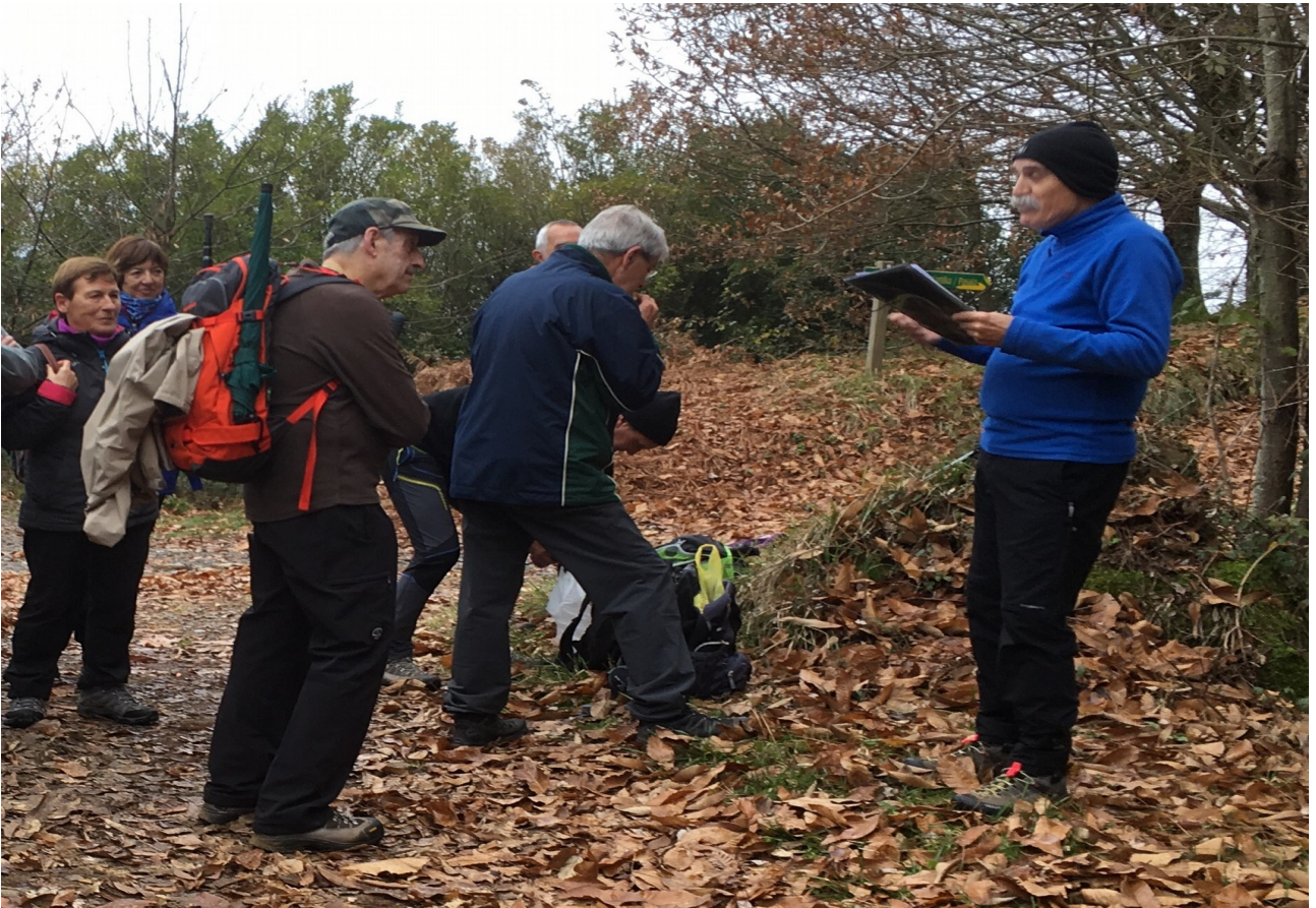
Endrike olerkia irakurtzen ibilbidearen erdian