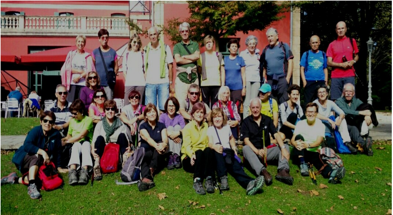
Taldea Topalekuan, tortilla gazia eta pasta gozoak jan ondoren