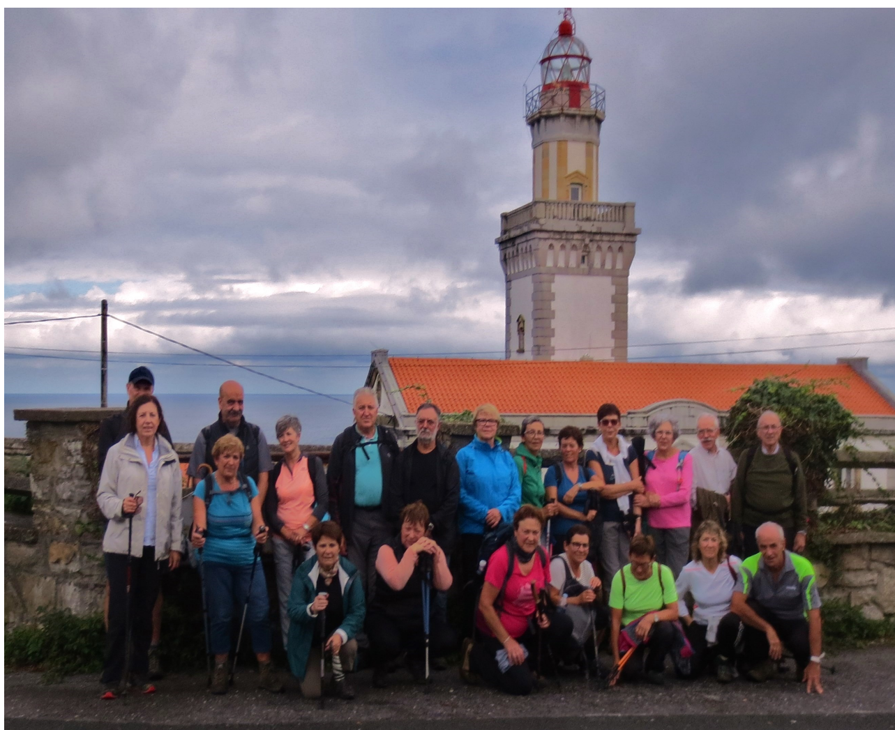
Higer itsasargiaren aurre-aurrean eguneko partaideak