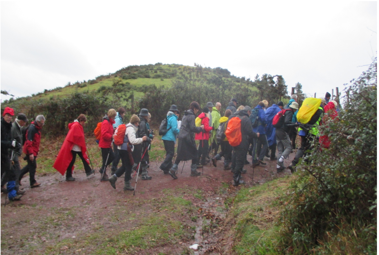
Mulisko gainaren bidean