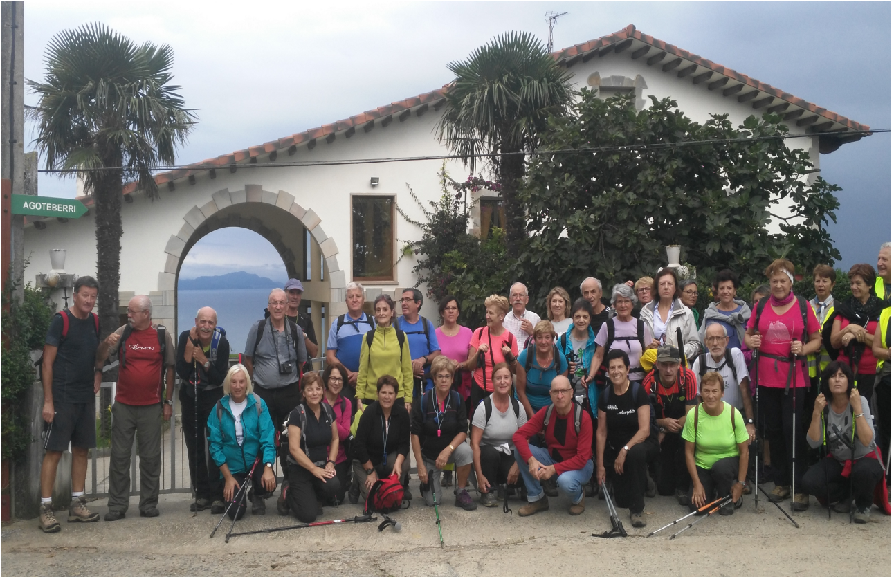
Askizuko etxe eder baten aurrean