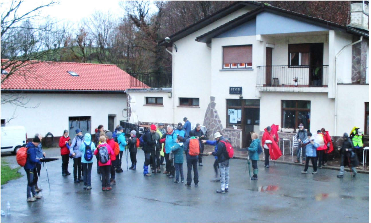
Besabin, abiatzeko prest