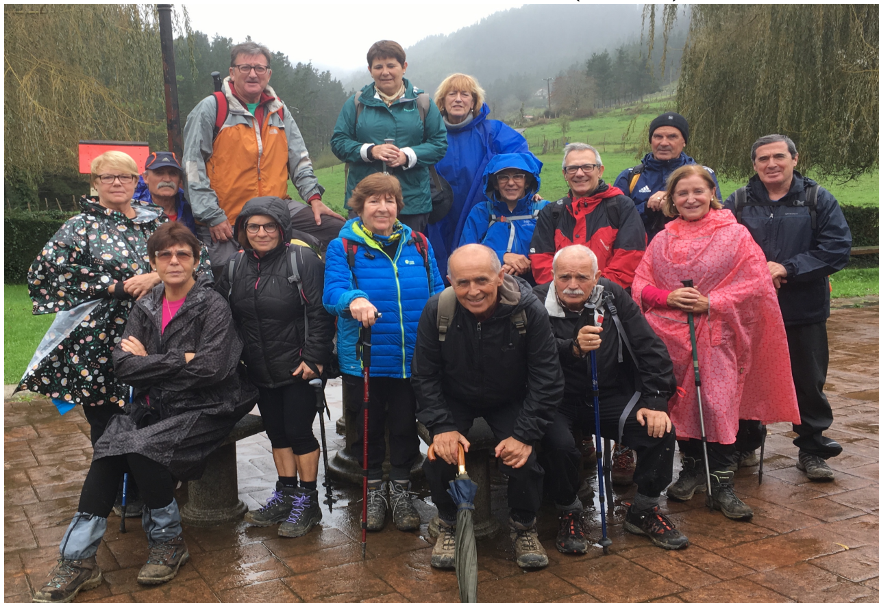
Olatz auzoko jabetxearen atarian, serioak eta barrez (hanka tarteko jostailua aipaturik)