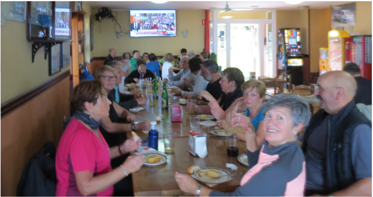
Hamaiketakoaren ordua bertako tabernan