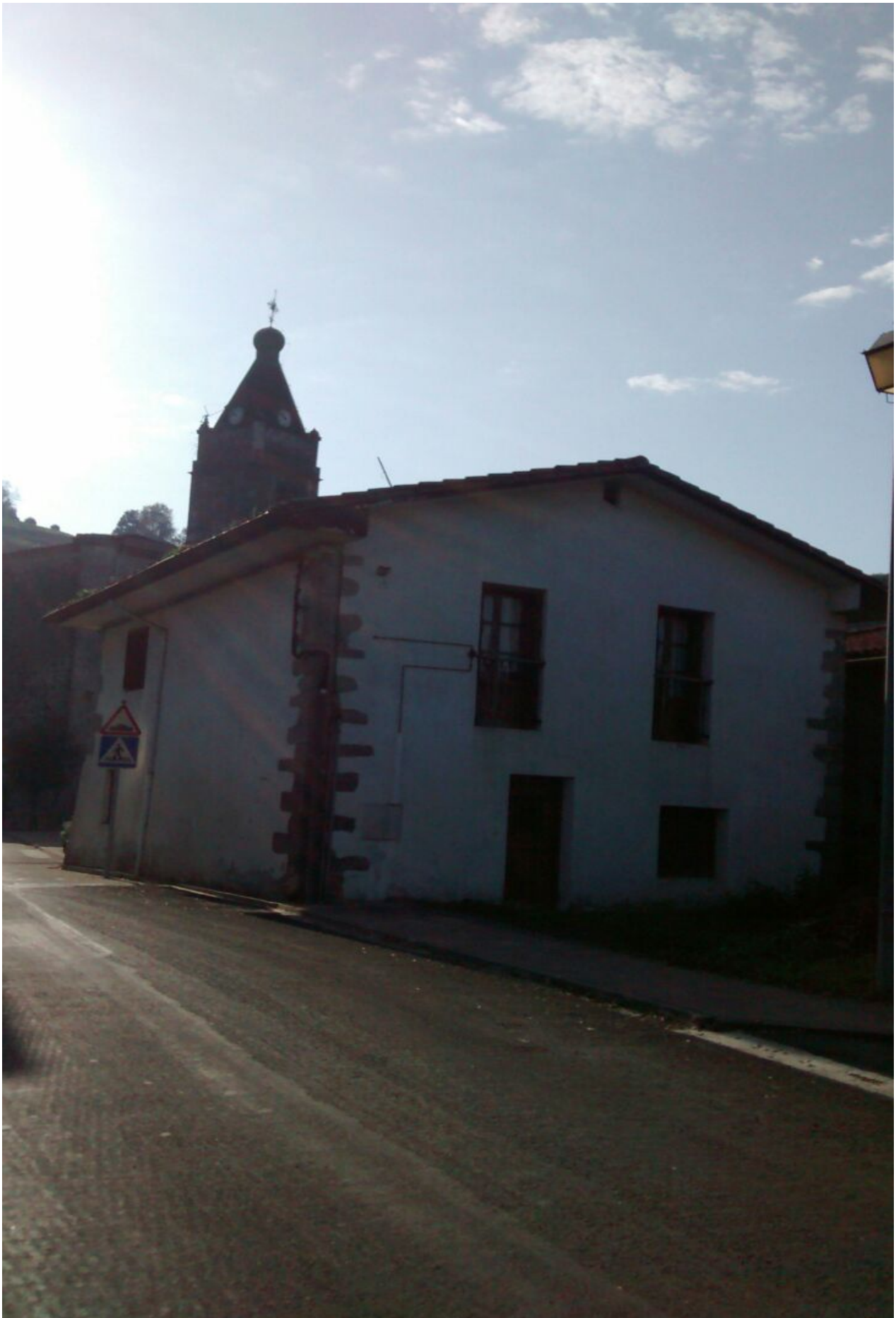
Goiko argazkian, erraldoia neurtzen eta, behekoan, Altzoko etxe bat