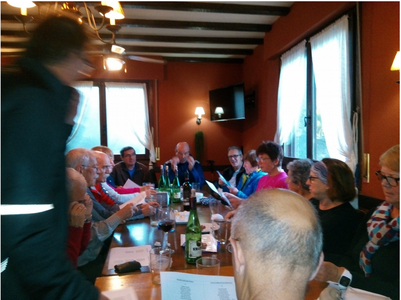
Olatz auzoko jatetxean Helduen Hitzari buruzko habanera abesten