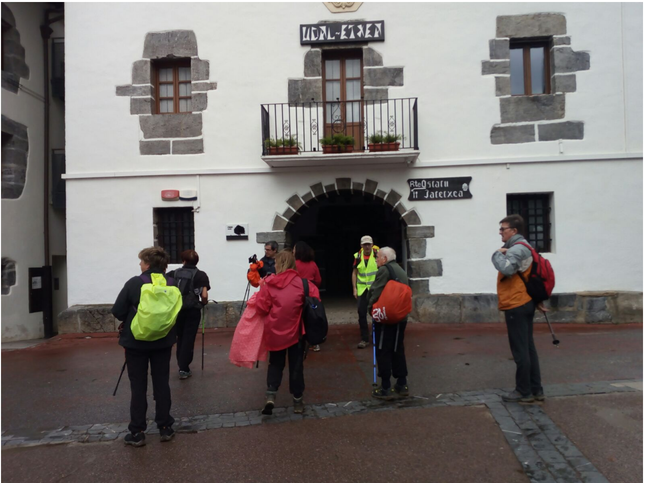
Alkizako Herri Ostatuan sartzeko prest eta bideko enbor sorgindu eroria