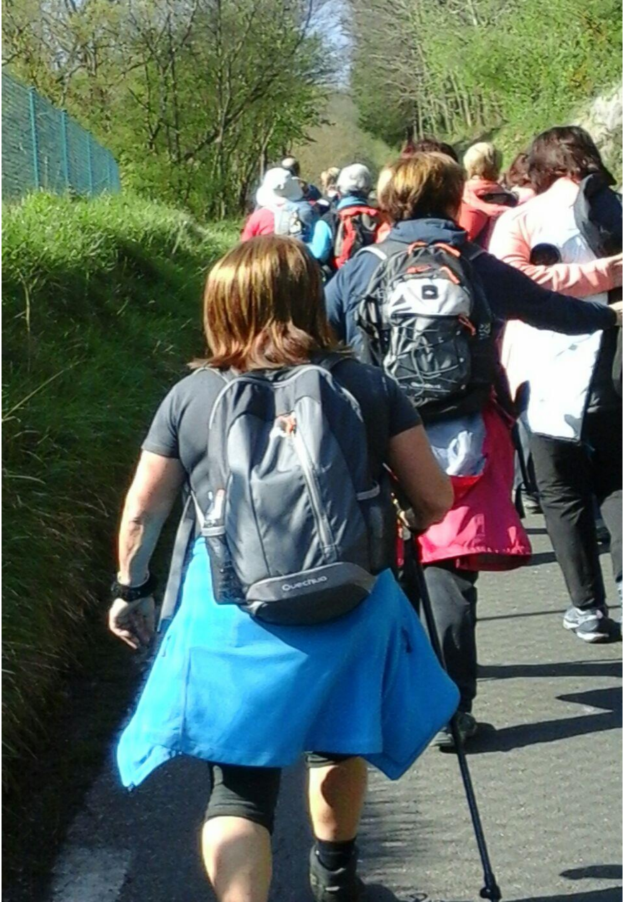
Ibiur eta Baliarraingo inguruetan