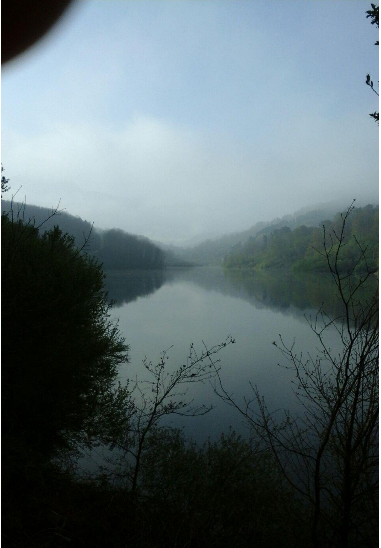
Ibiur urtegia lainopear