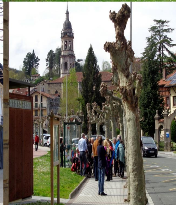
Bazkalondorako prestaturiko bertsoak, oroigarri bat, liburutegi bitxia eta autobus geltokia