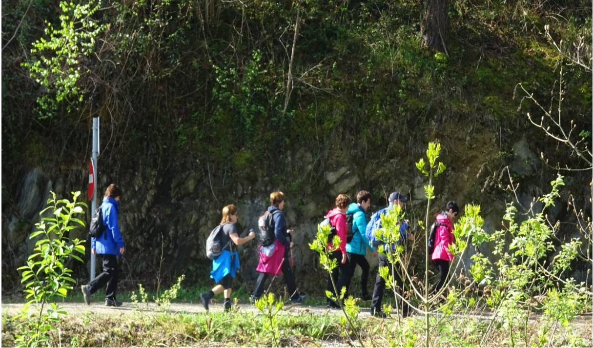
Ibilaldiaren bi une