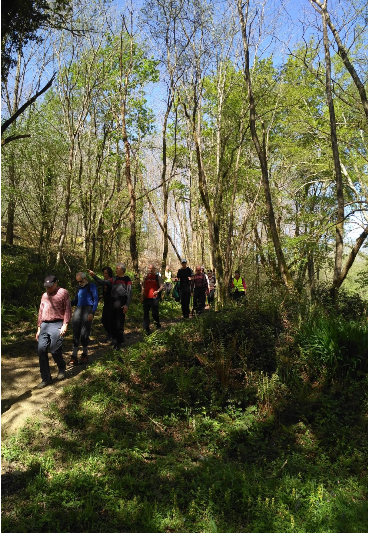
Pagoeta inguruko bidezidorra