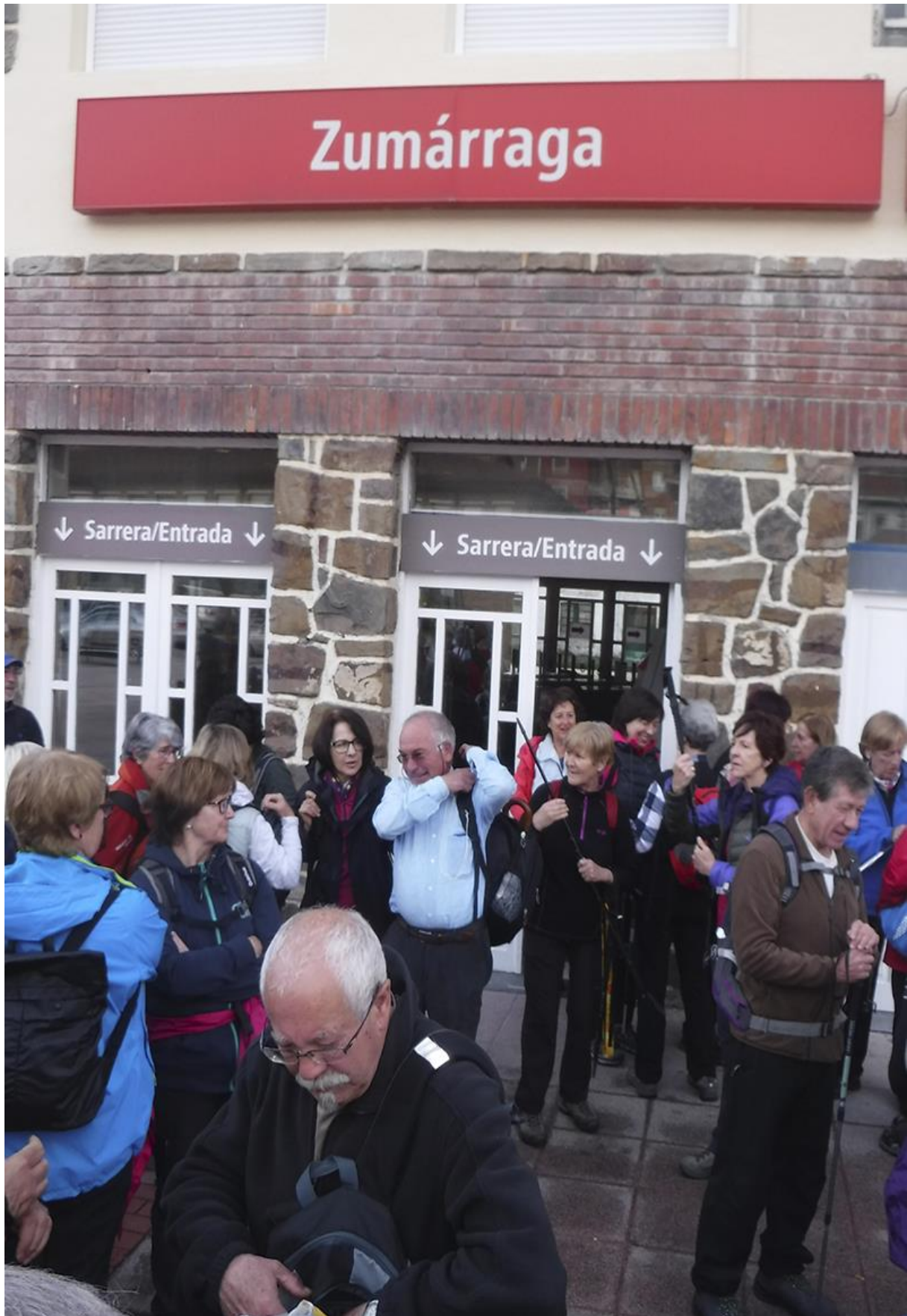
Zumarragako tren geltokian, abiatzeko prestatzen