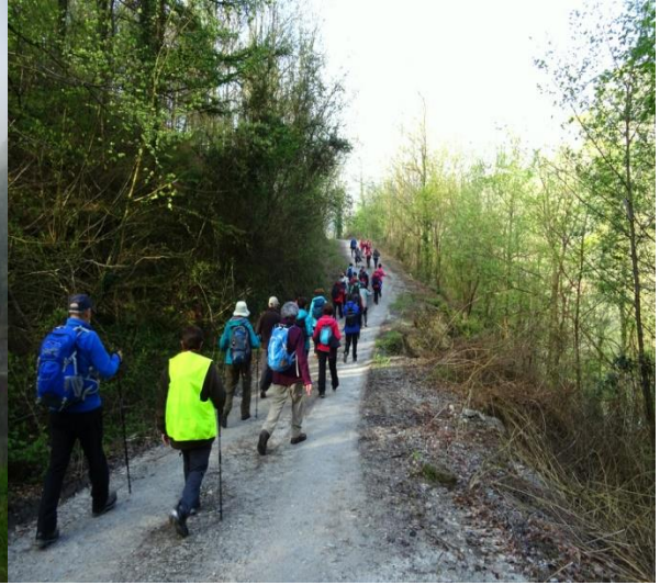
Ibiur urtegia inguratzen