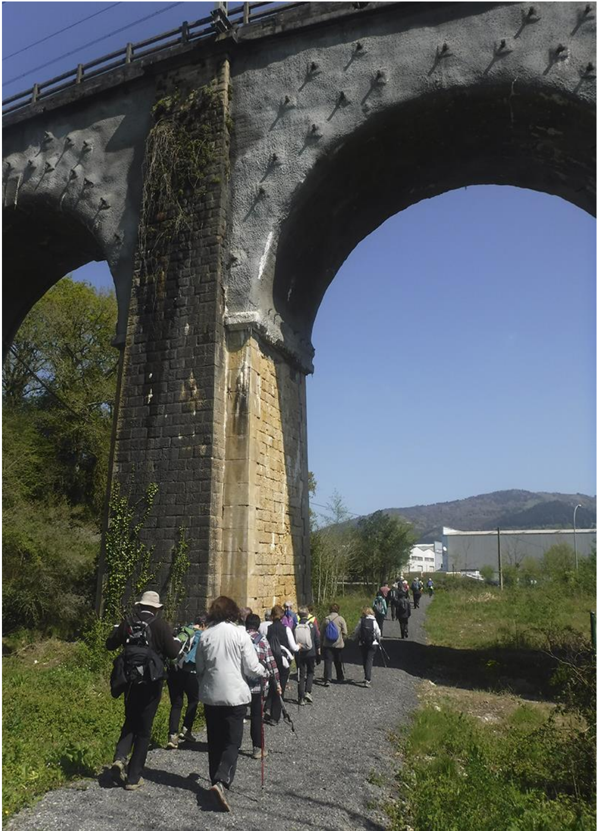
Agorregi eta Pagoetarantz