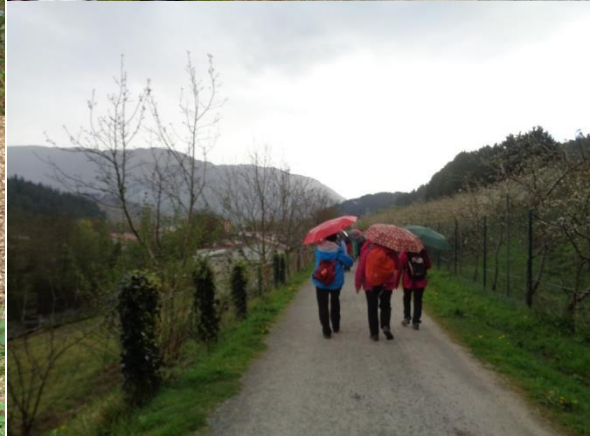
Zumarraga-Azkoitia ibilbidean gustuko atsedenaldi eta hamaiketakoaz gozaten