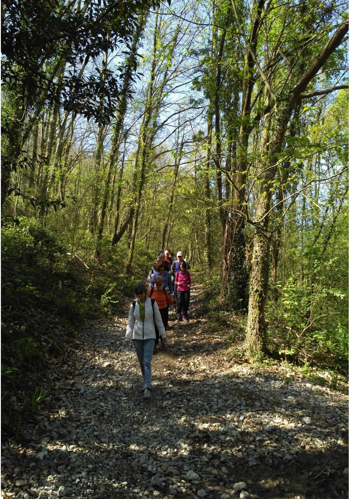
Pagoeta eta Agorregiko inguruetan