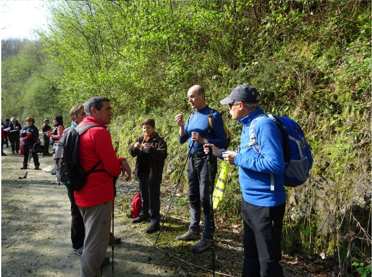
Ibiur urtegiaren inguruan, gosaria dastatzen