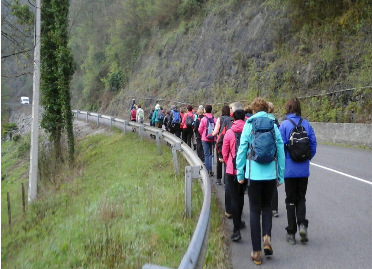
Ibiur urtegirantz igotzen eta Baliarraingo elizaren aurreko horma