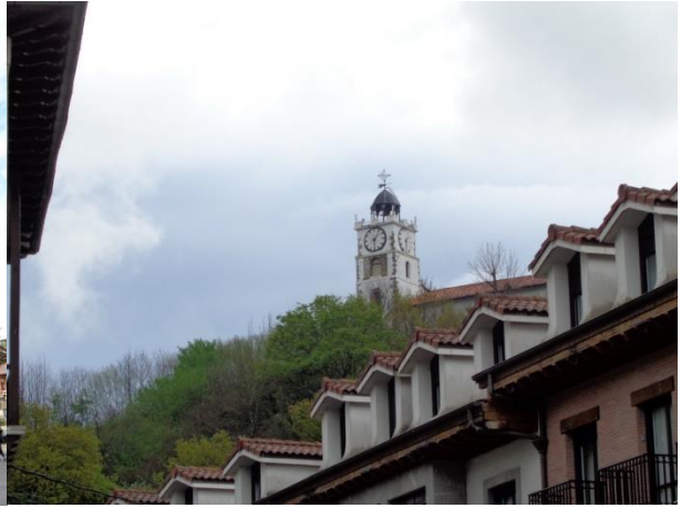
Azkoitiko jauregi eta etxeak