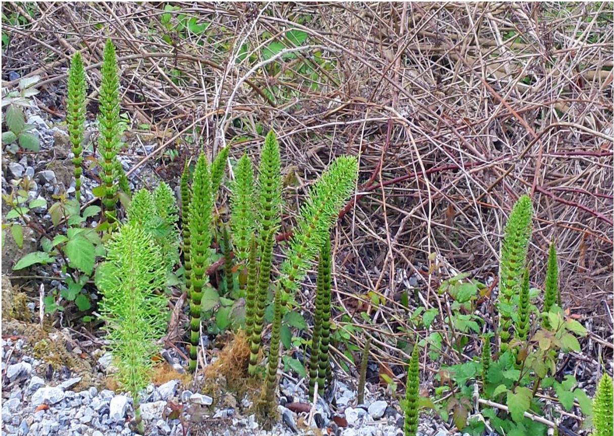
Ibiur urtegia eta bertako landaredia