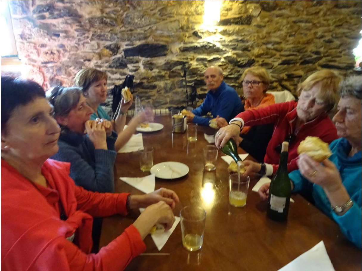
Sagardoaren gozoa sumatzen da