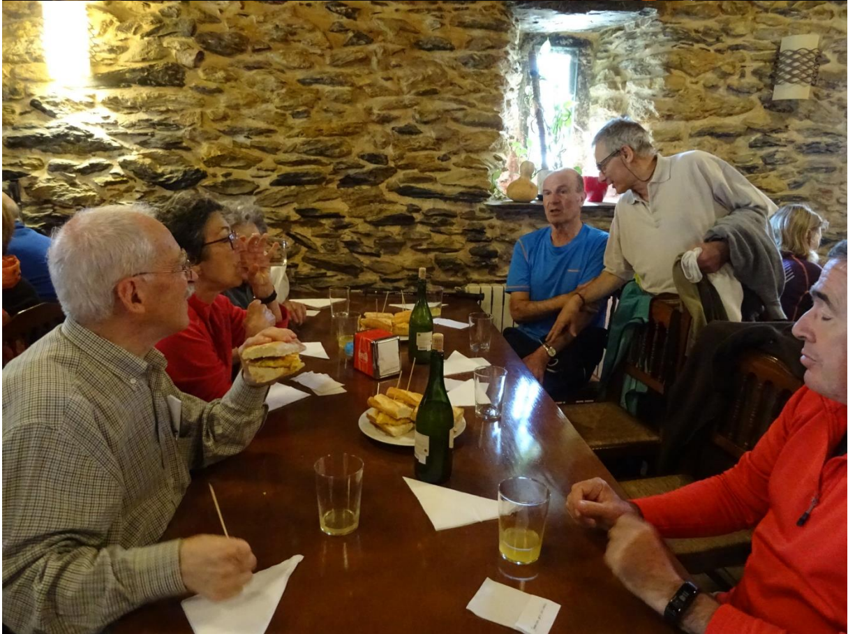
Baliarraingo jatetxean hamaietakoa dastatzen