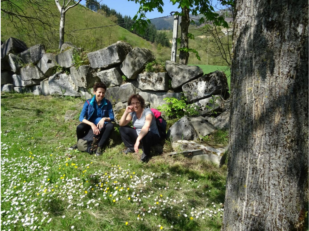
Lore artean bi lore, Ikaztegiako tren geltokiaren atzealdean. Ibilaldiko pottoka bere giroan