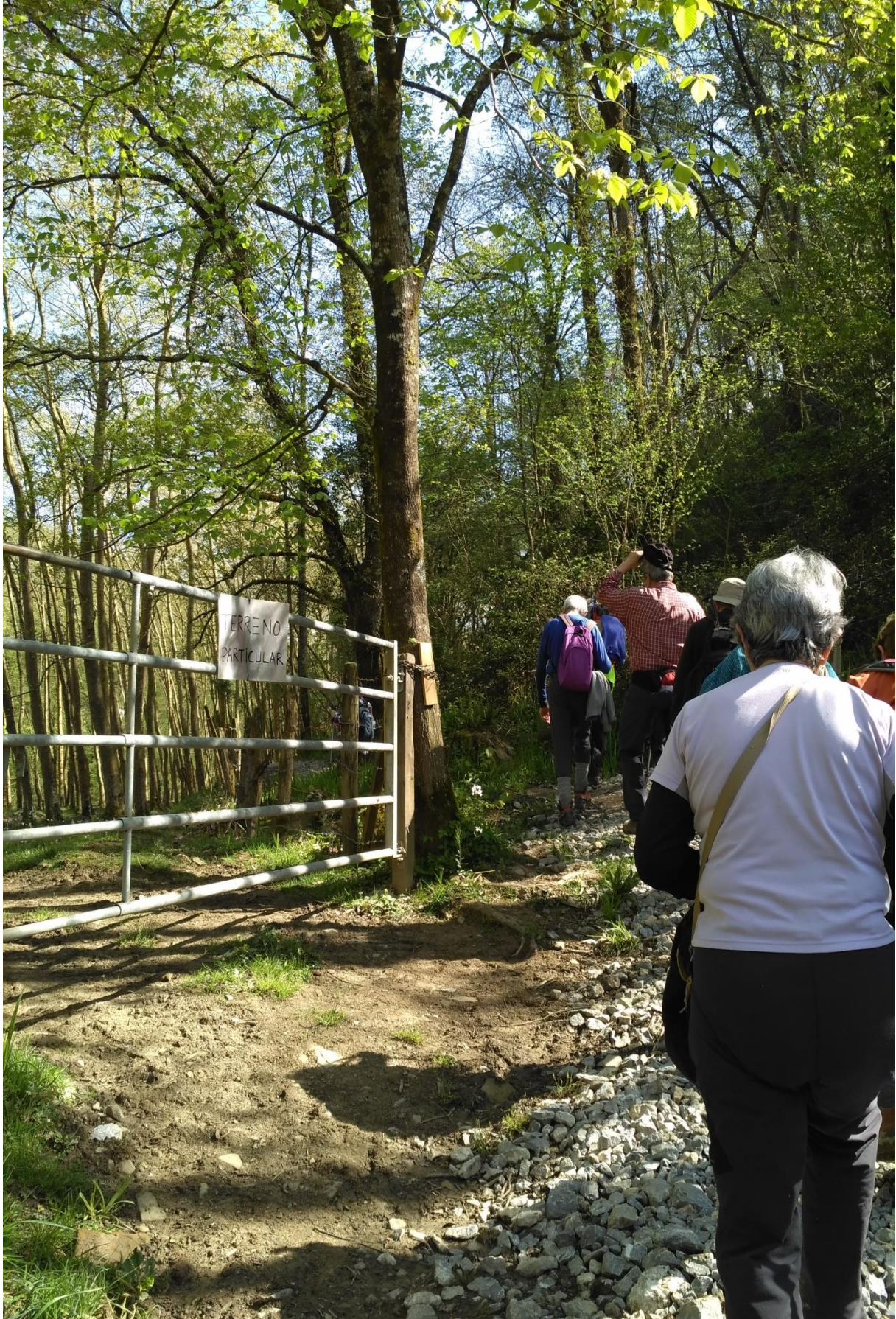
Ibilbide bereko irudia