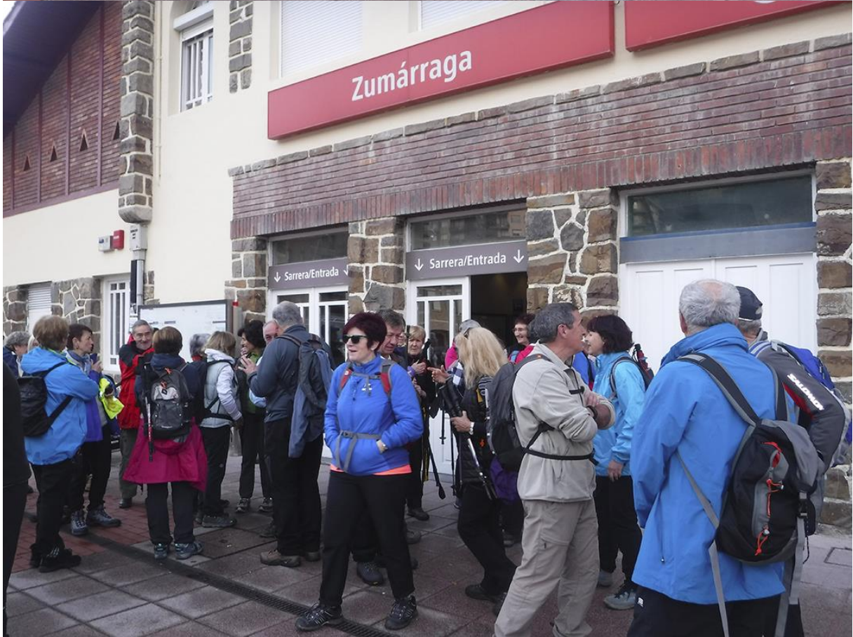
Zumarragako tren geltokian