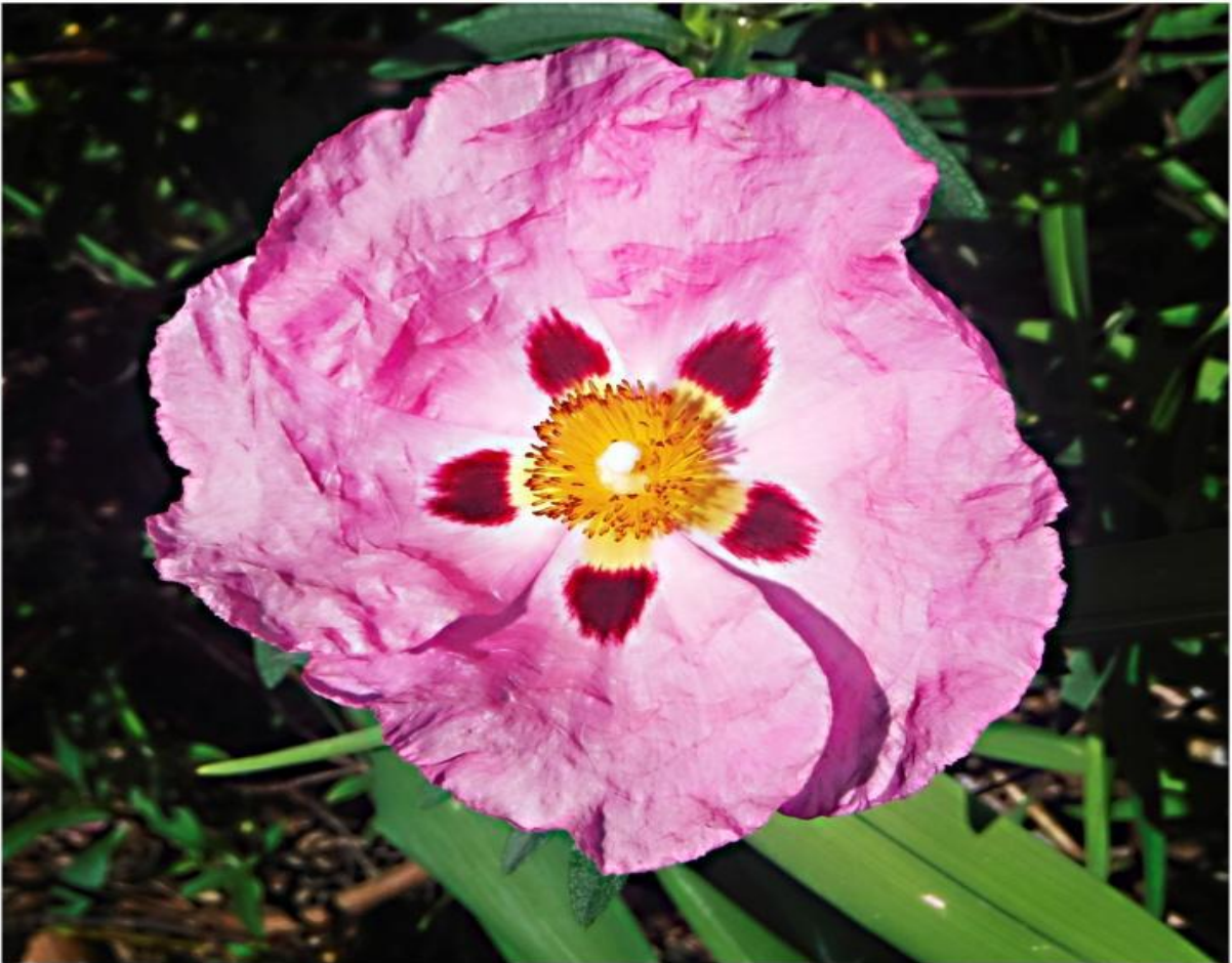
Agorregi inguruko landareak