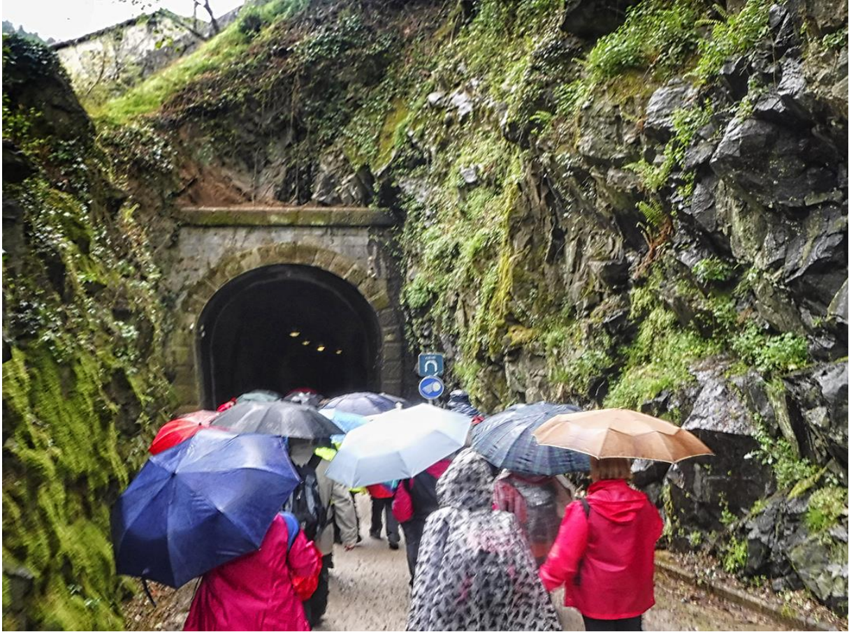
Ibilbideko tunel batean sartzen, euriaz babesteko