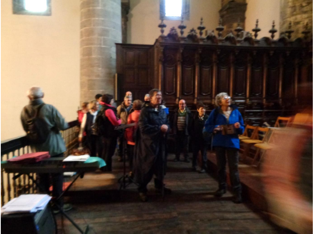
Azkoitiko elizaren koroan eta Ibiur inguratzen