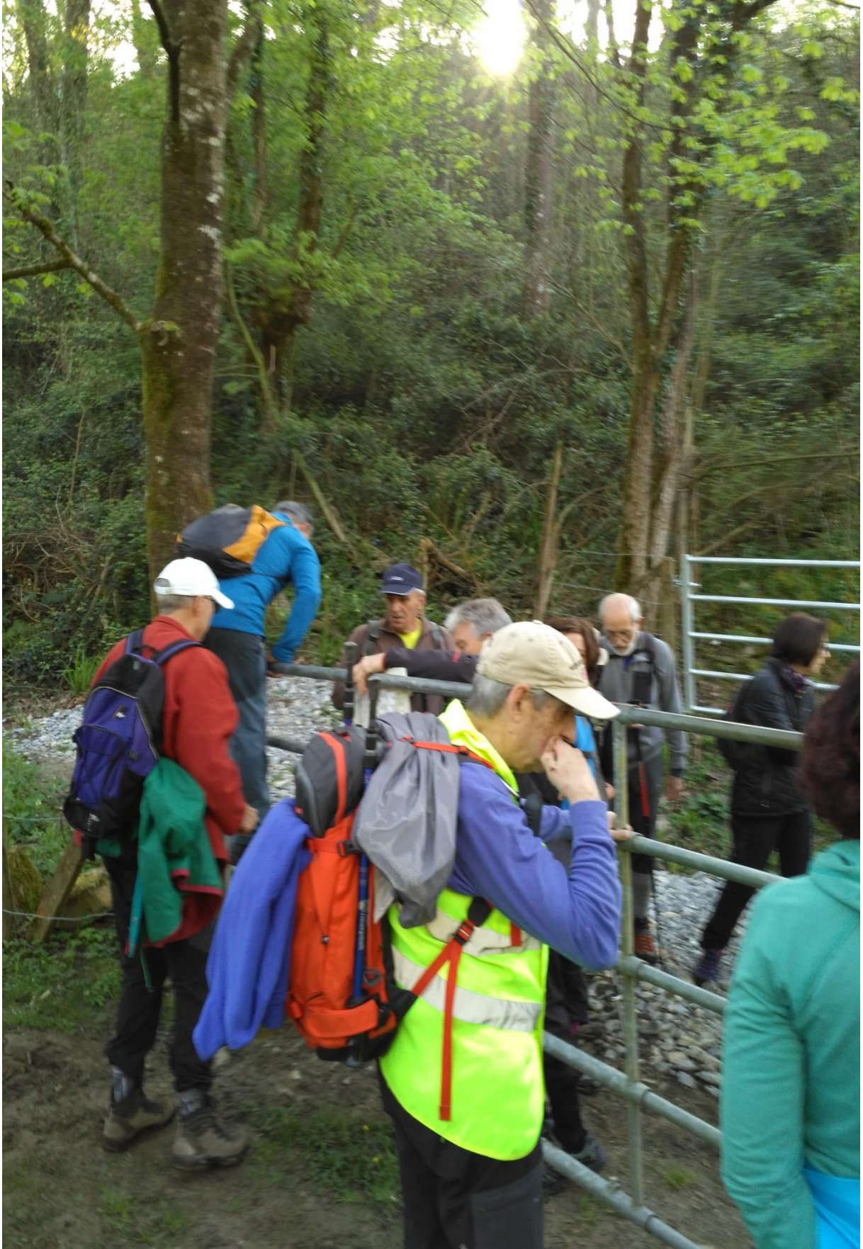
Agorregi eta Iturraran inguruko paisaia: hesia gainditzen