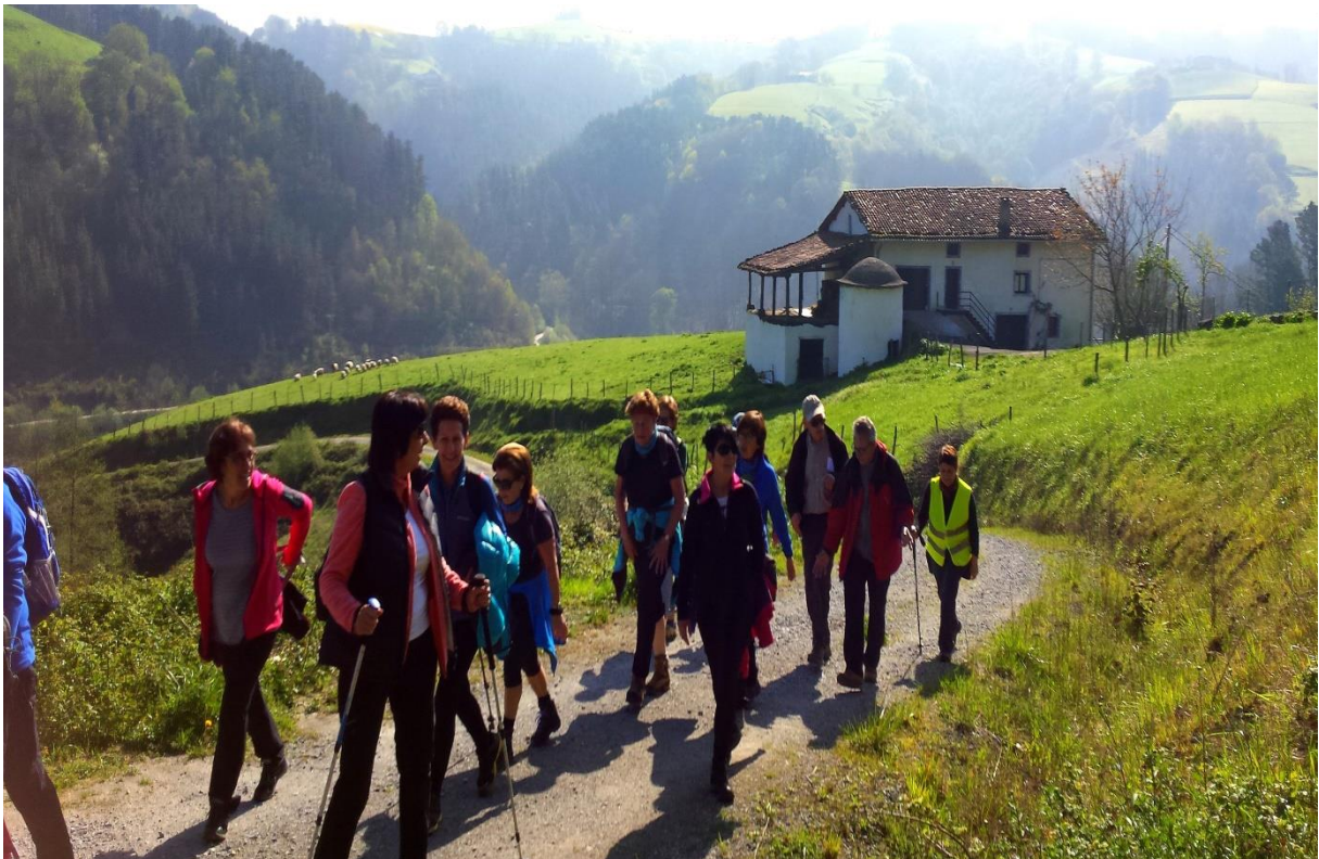
Baliarraingo errepidera iristen