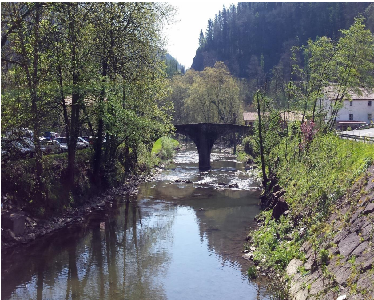
Ibiur urtegiara daraman zubi ondoa eta Legorreta eta Ikaztegieta bitarteko bidegorria