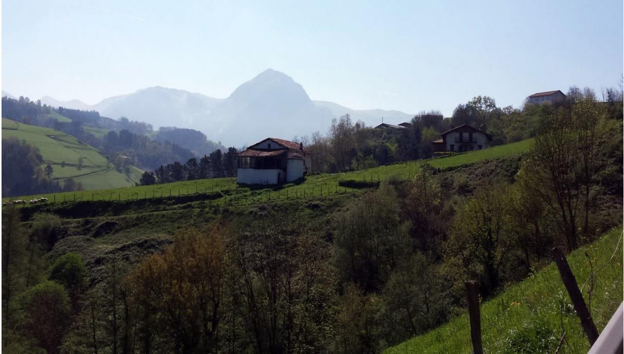
Txindoki hondo-hondoan, Baliarraidik ikusita