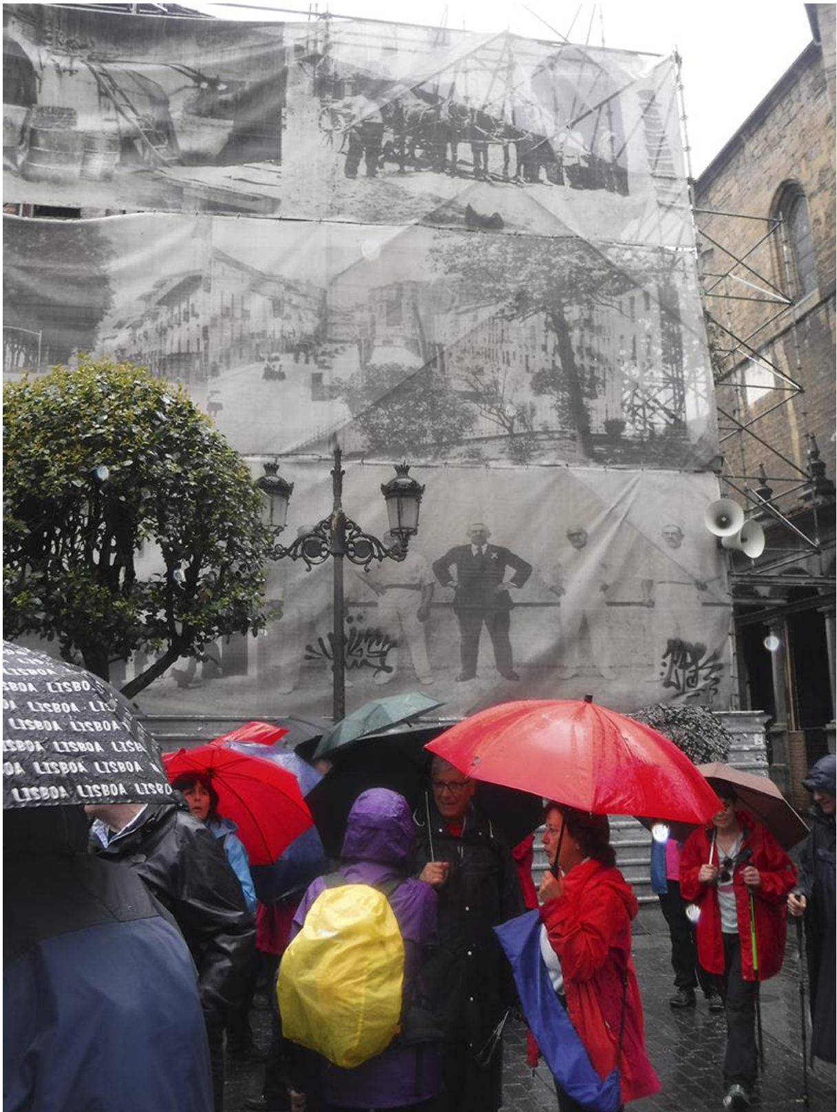
Azkoitiko zenbait une historikoren aurrean