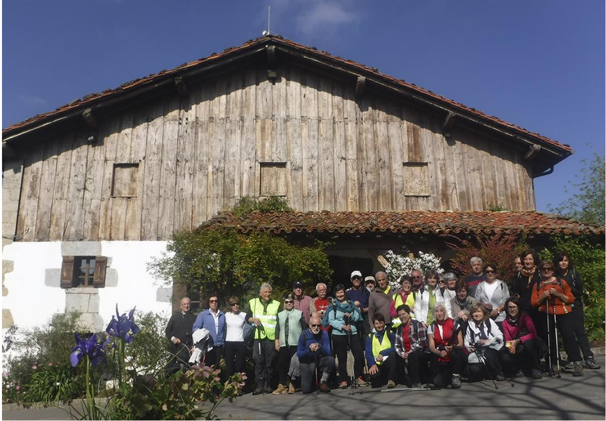
Iturraran baserria eta Agorregiko burdinola