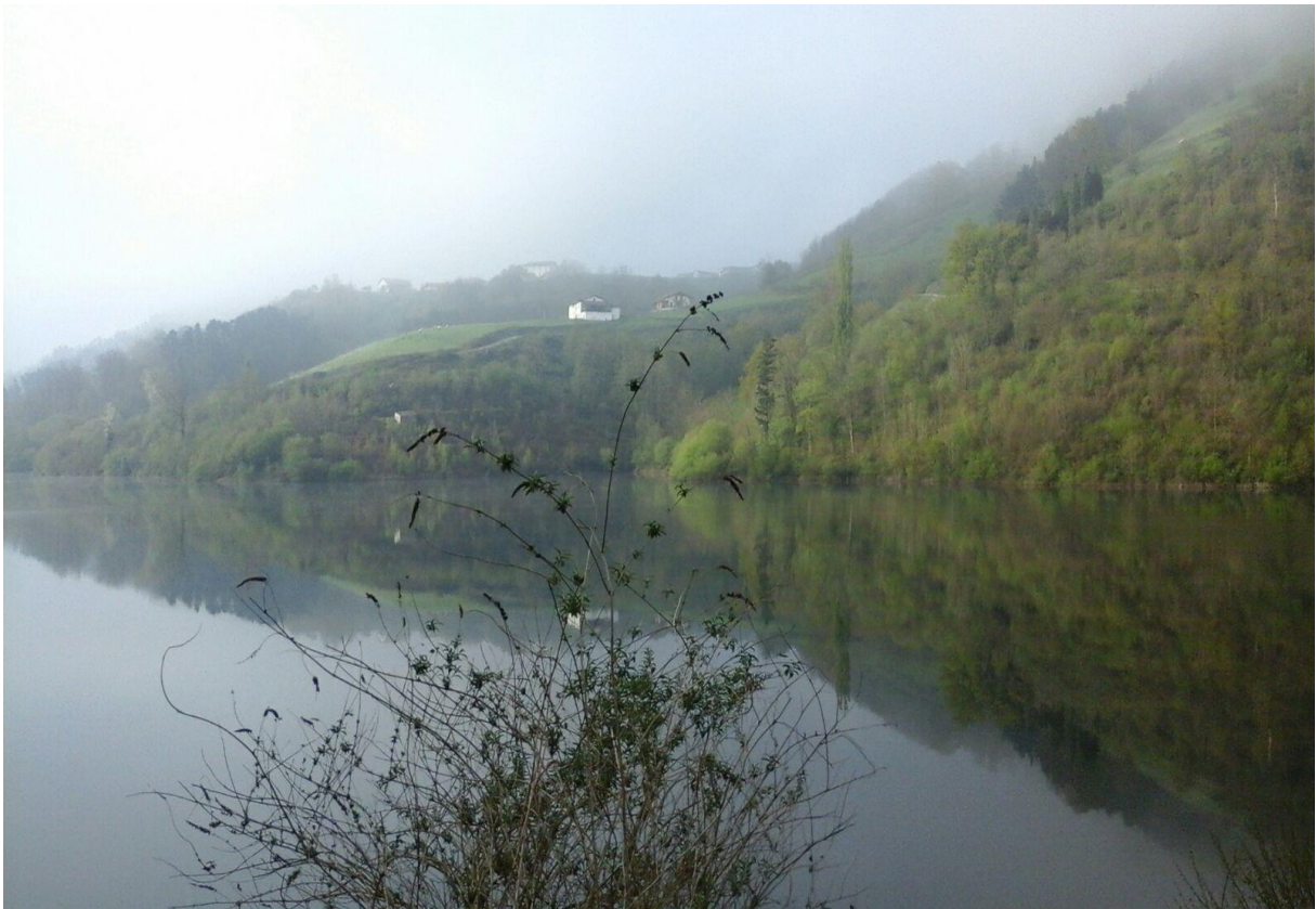
Ibiur urtegia lainocean