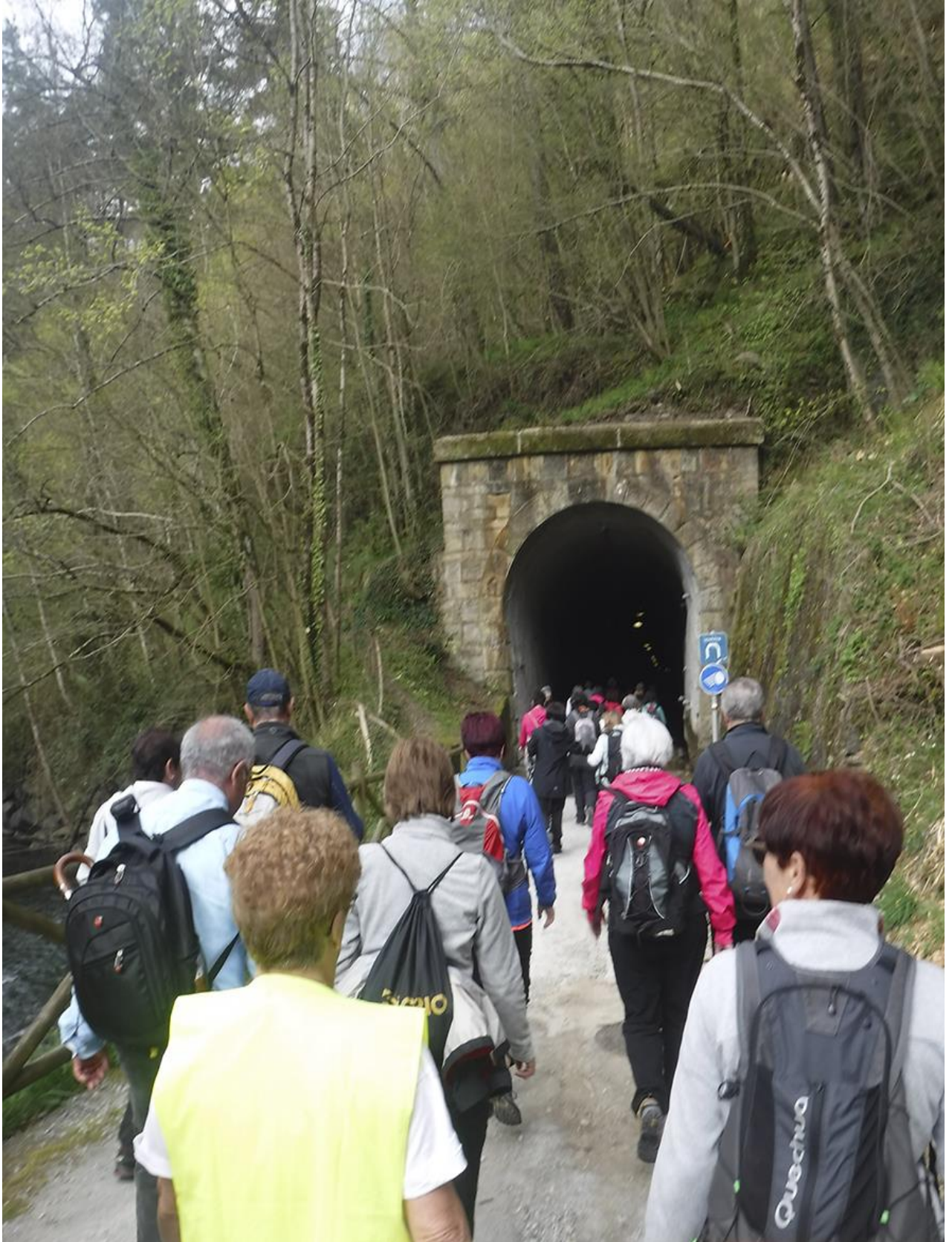
Beste tunel batean sartzen ibiltariak