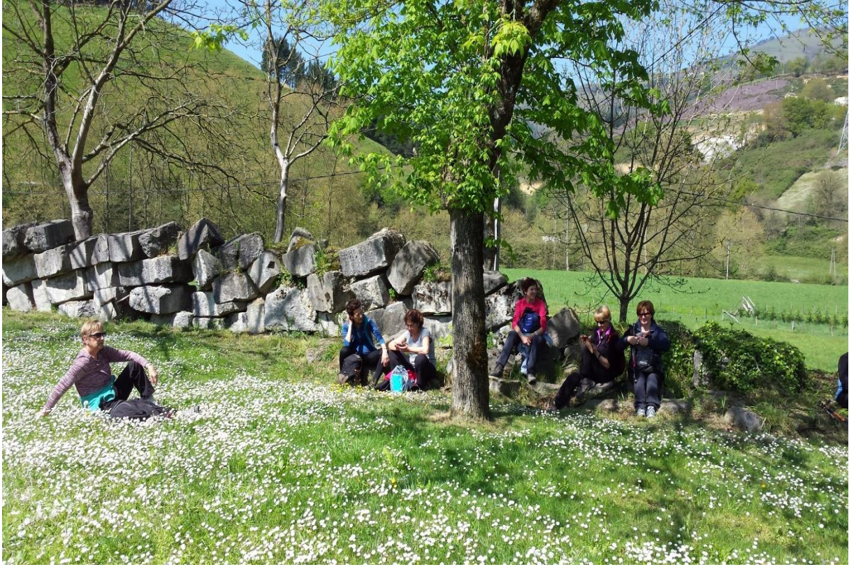
Ikaztegiako tren geltokiaren atzealdean eguzkitan eta lore artean