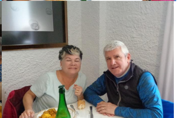
Iturri jatetxean, bazkari ederra dastatzen eta solasean