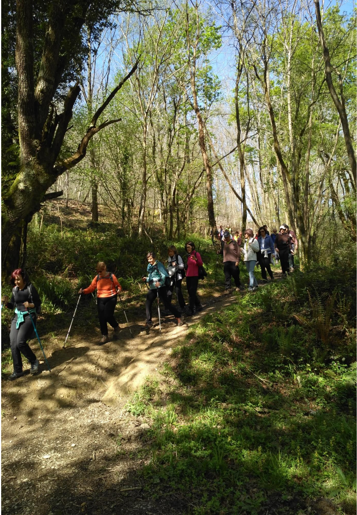
Pagoetako bidezidor batean zehar