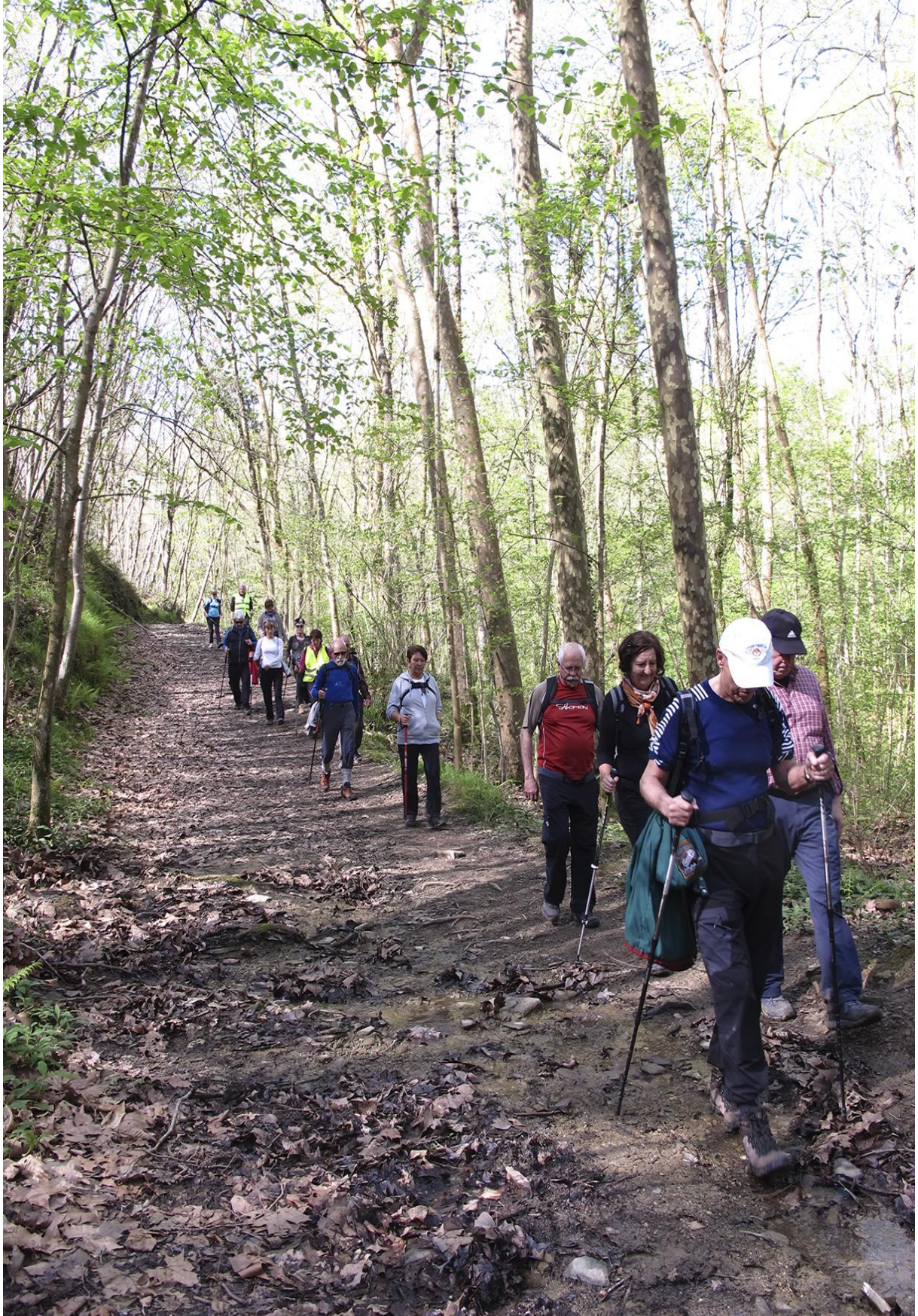
Pagoetako bidezidorretan zehar