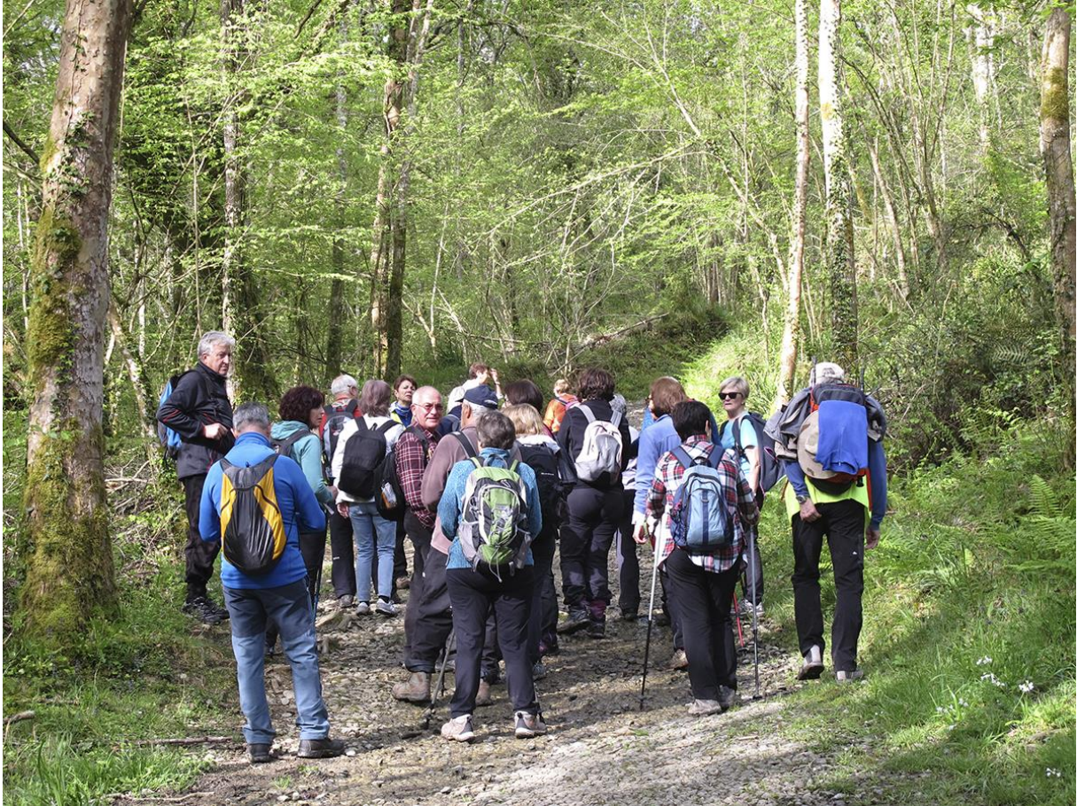
Pagoetako bidezidorra eta Agorregi inguruko errota