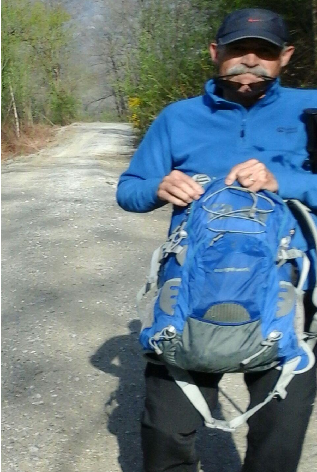
Gure olerkaria motxila prestatzen