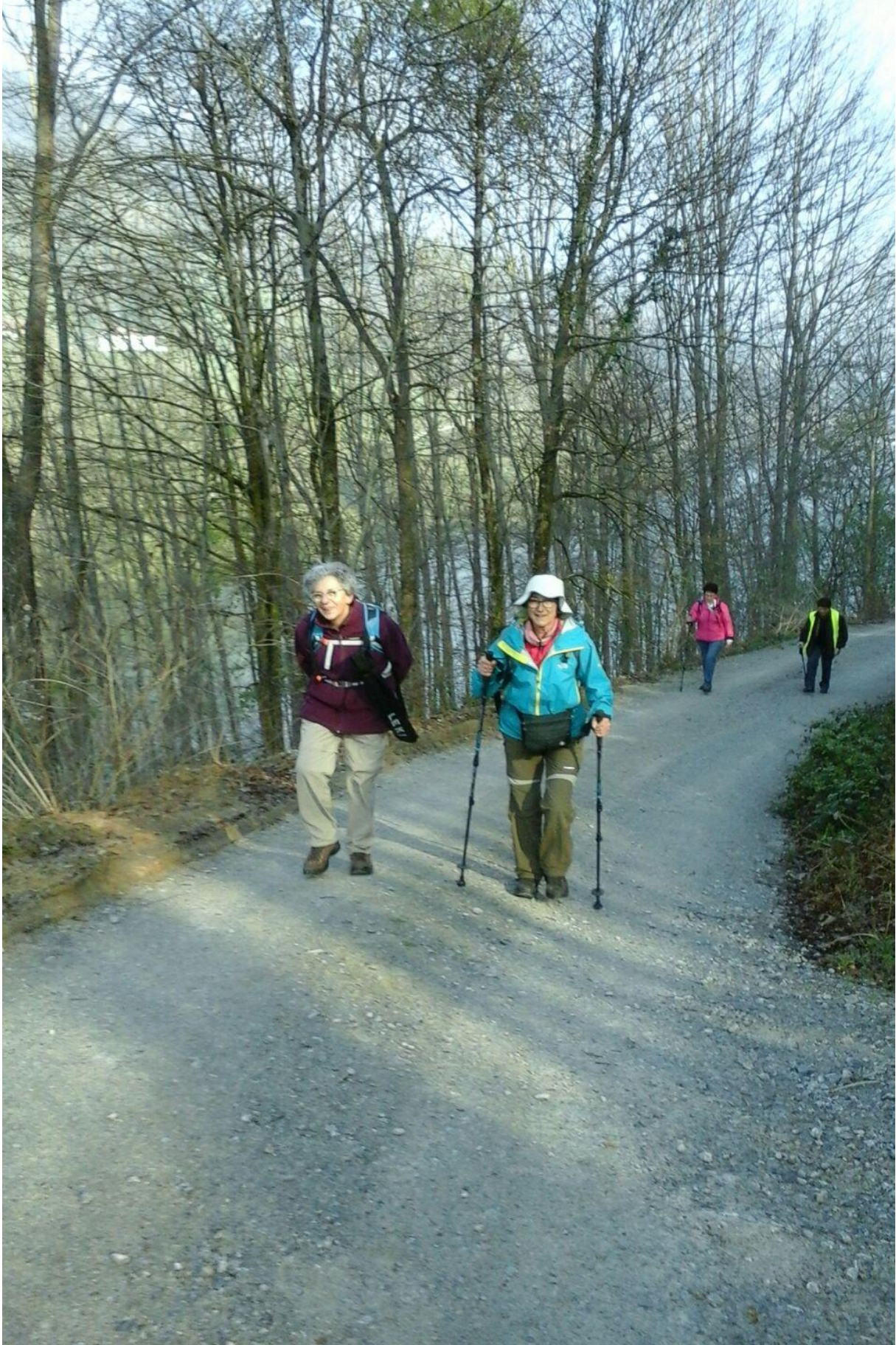
Ibiur urtegia inguratzen