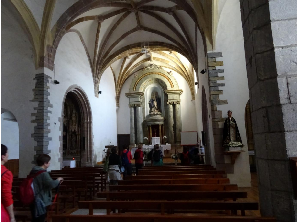
Baliarraingo elizaren barruan eta kanpoan