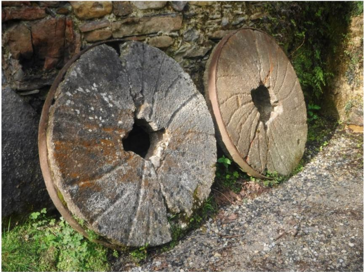
Agorregiko errotarriak eta Baliarraingo jatetxean hamaietakoa dastatzen