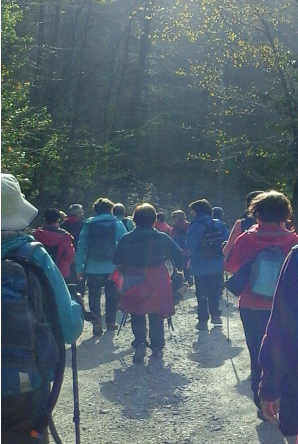
Ibiur inguruko bidezidorra