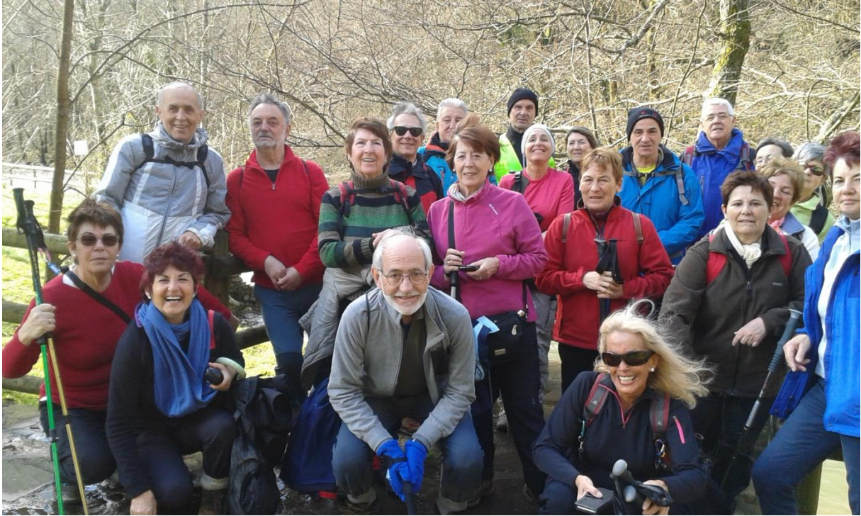
Sorginen zubiaren ondoan