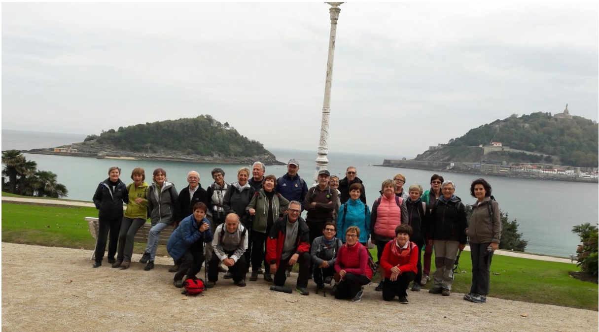
Miramar jauregiaren aurrean