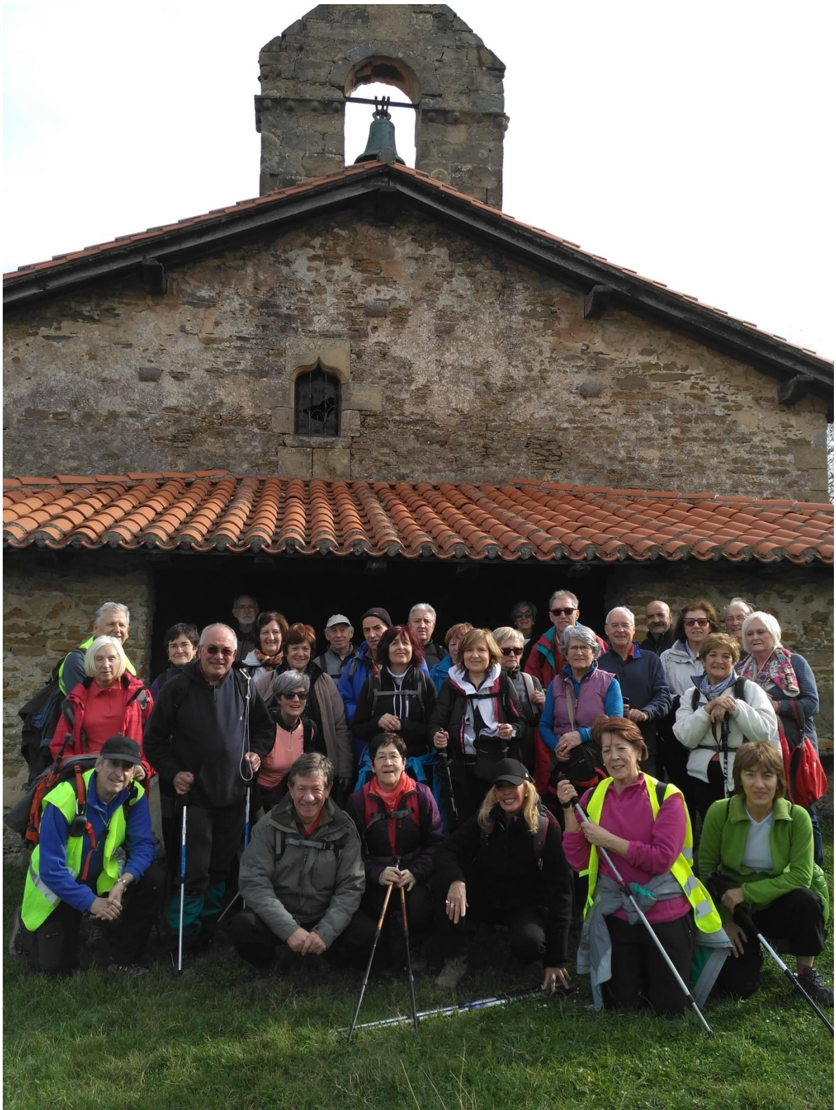
San Lorenzo basilizaren aurrean