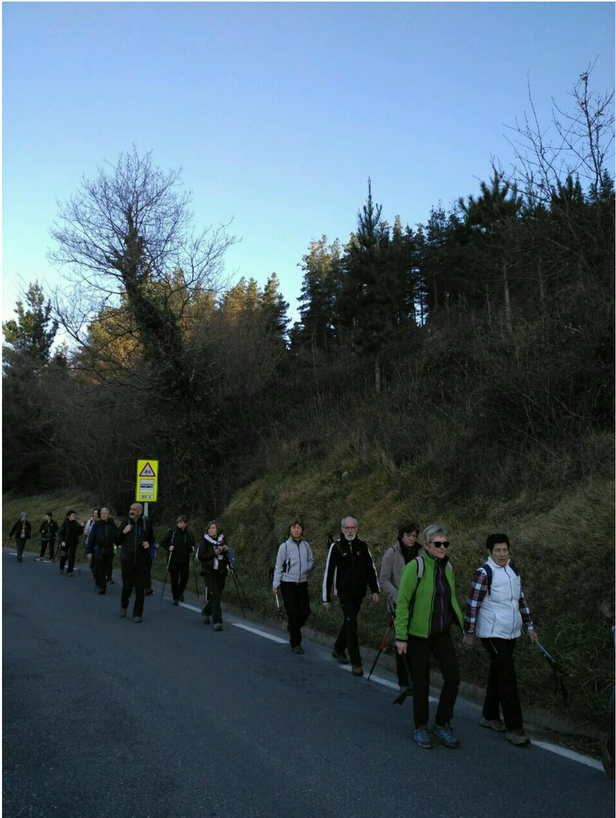
Itziar, Endoia eta Zestoa bitartean ibiltariak paisaiatz gozatzen