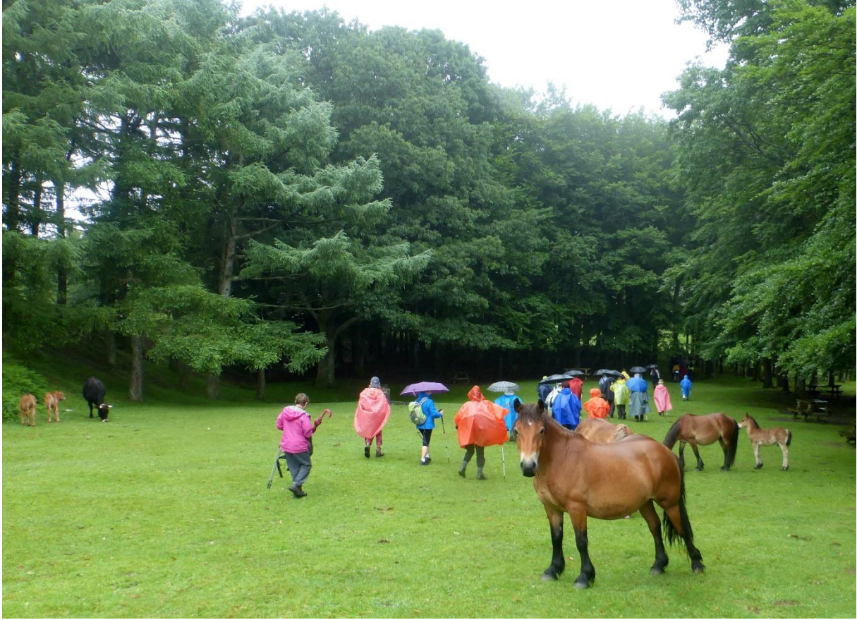
San Anton urtegitik Irunerantz