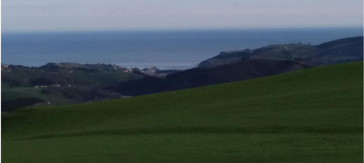
Hondo-hondoan Zumaia eta, behean, bi zaldi begiluze