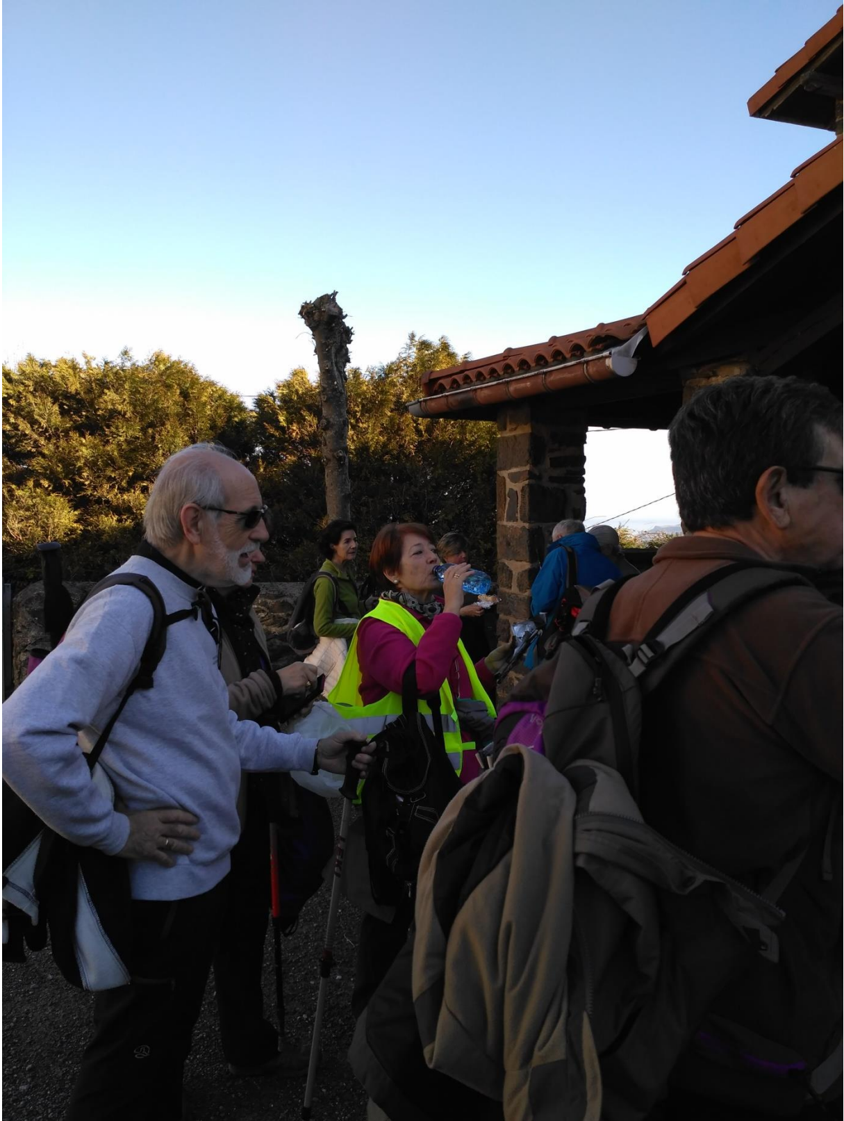
Endoiako basilizaren aurrean egarria asetzen