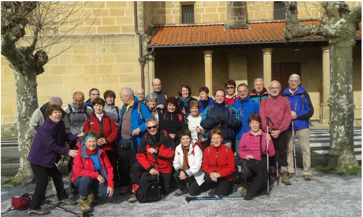
Ama Guadalupekoaren elizaren aurrean