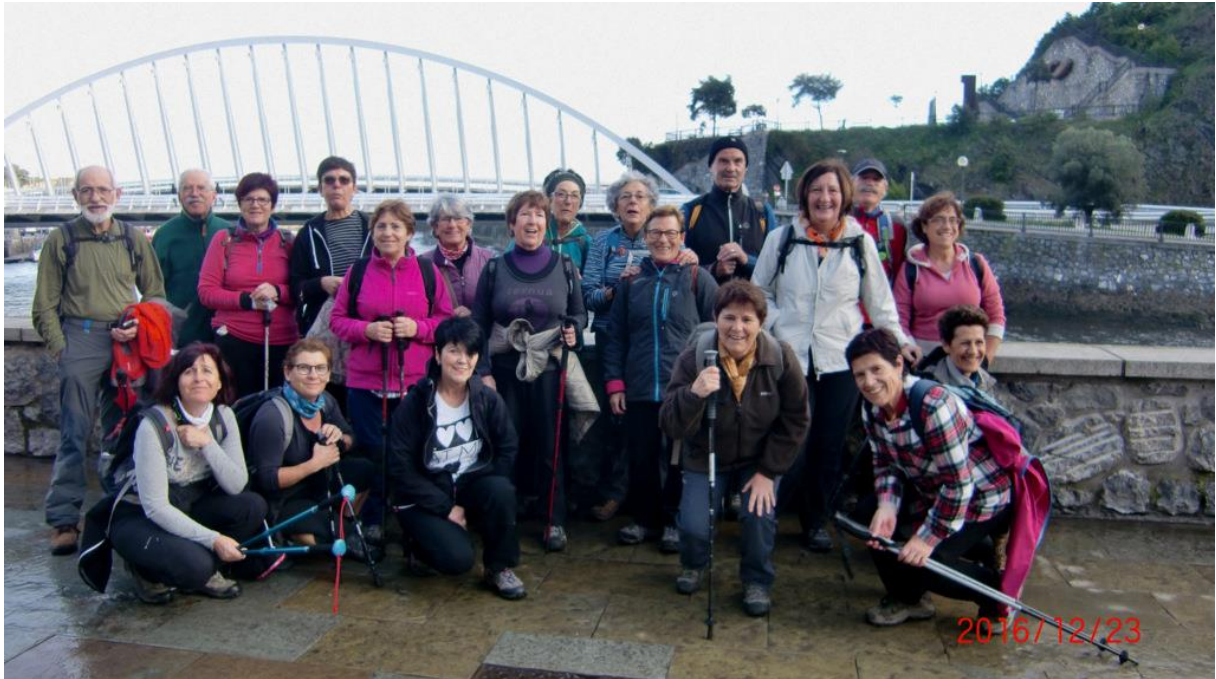
Ondarroako argazkia eta Segurako balkoi loredua