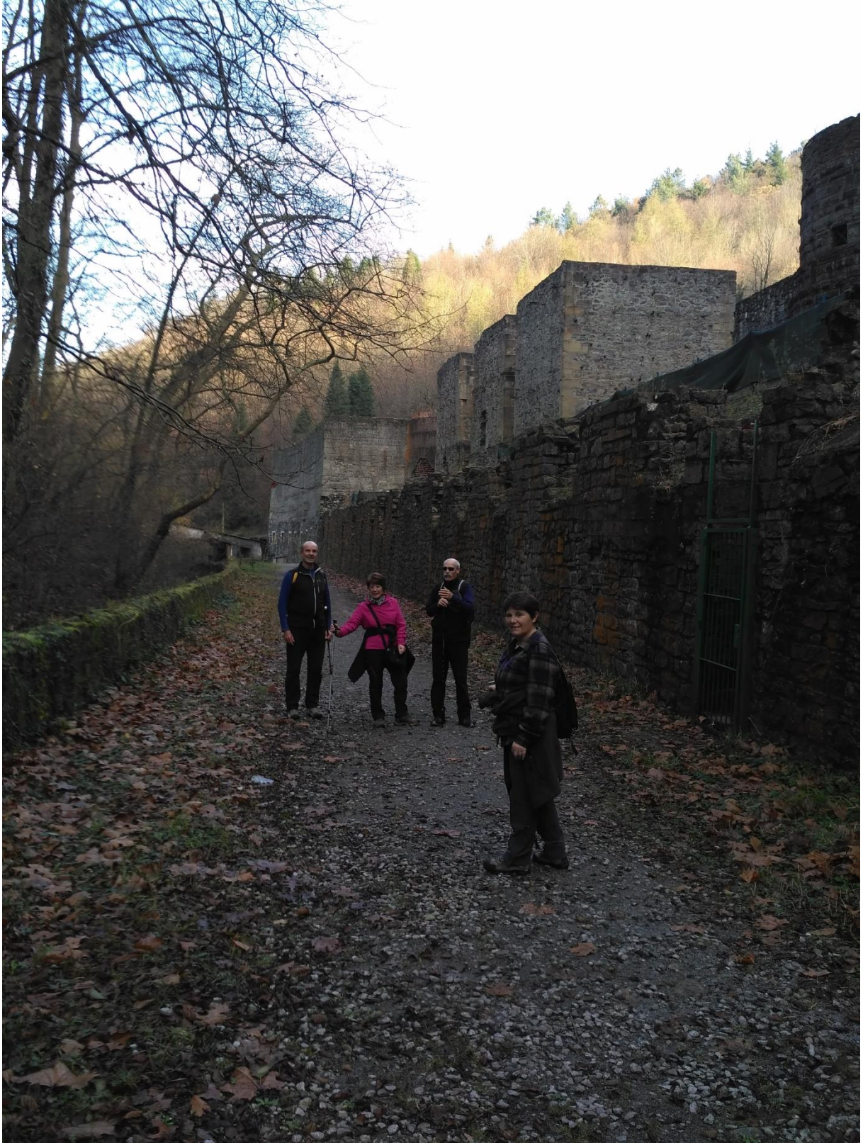
Irungo Hirugurutzetako labeak