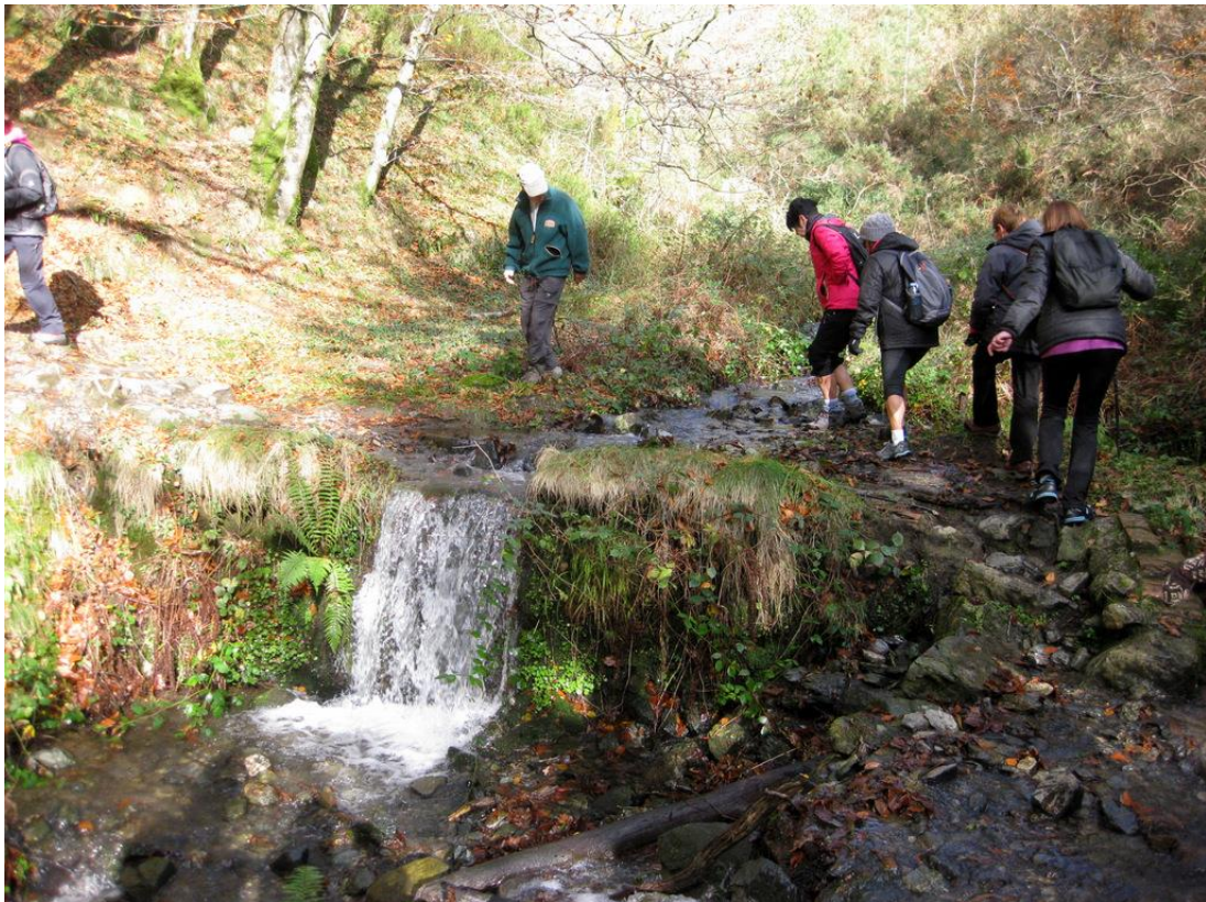
Arditurriko harri-ibia zeharkatzen