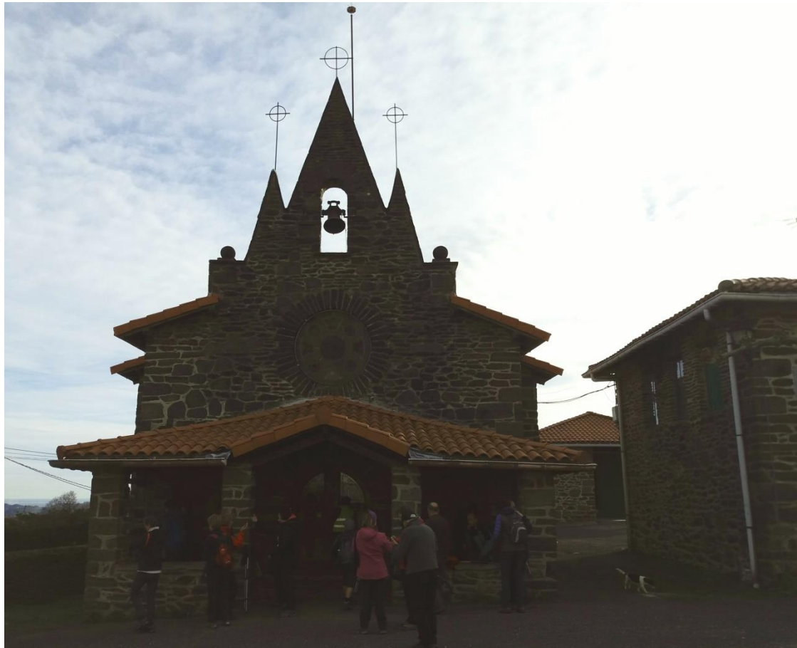
Zestoako Lilli jauregia eta Endoiako baseliza