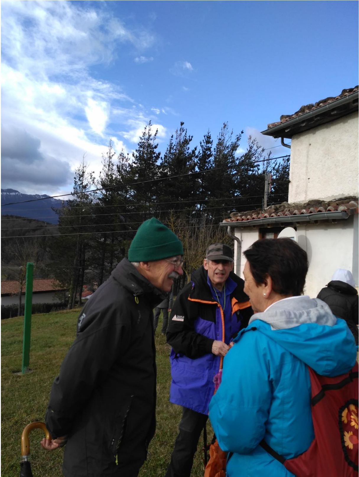
Leku berean, hirukotea solasean