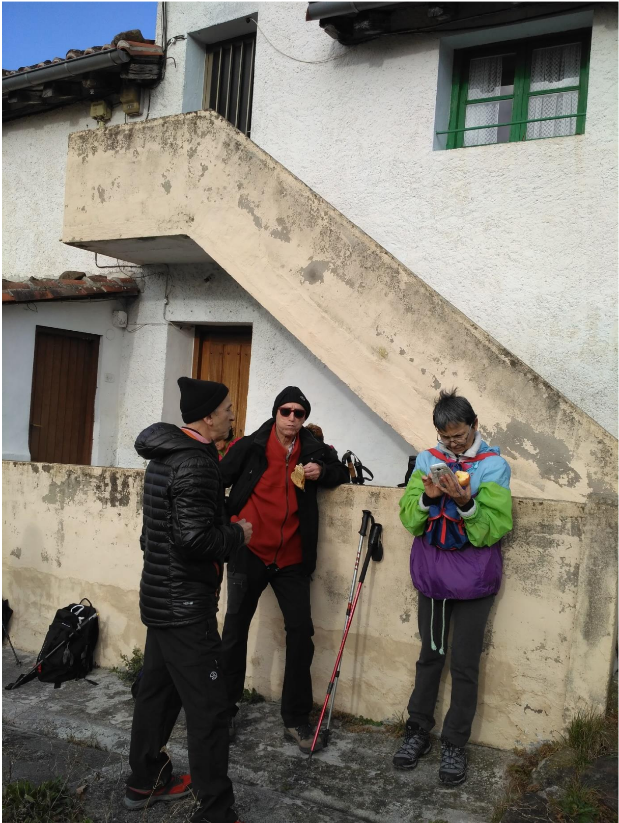
Hirukotea, leku berean, indarberritzen