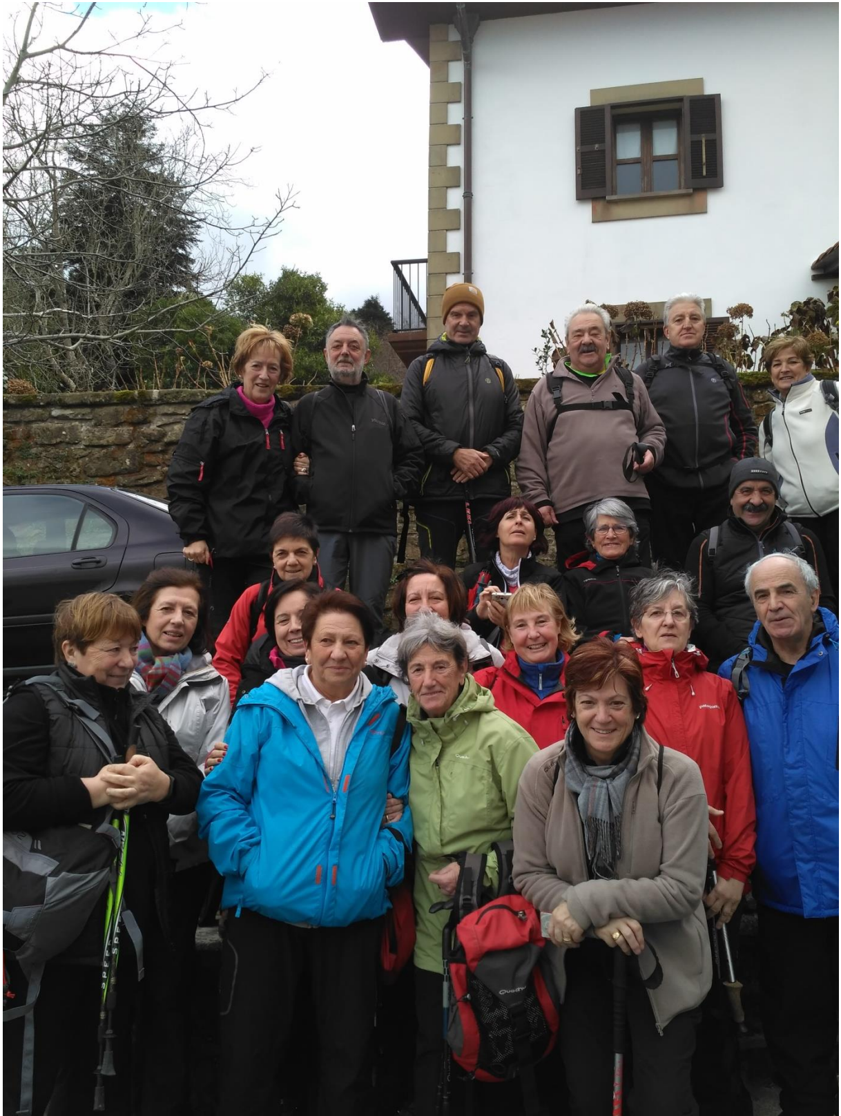
Igeldoko Mendizorrotz jatetxearen ondoan