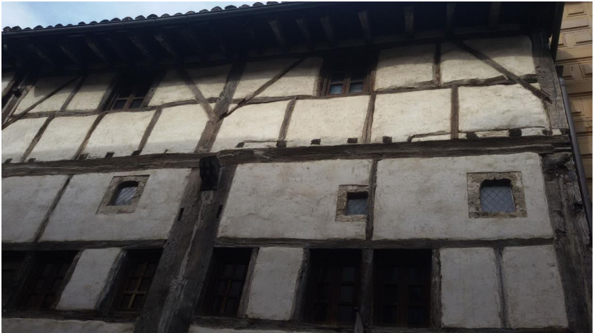
Goiko horiek Olaberriakoak, Ibilbide berekoak eta Segurako erdi aroko etxea Beheko hiru hauek egun berekoak, basilizaren inguruan