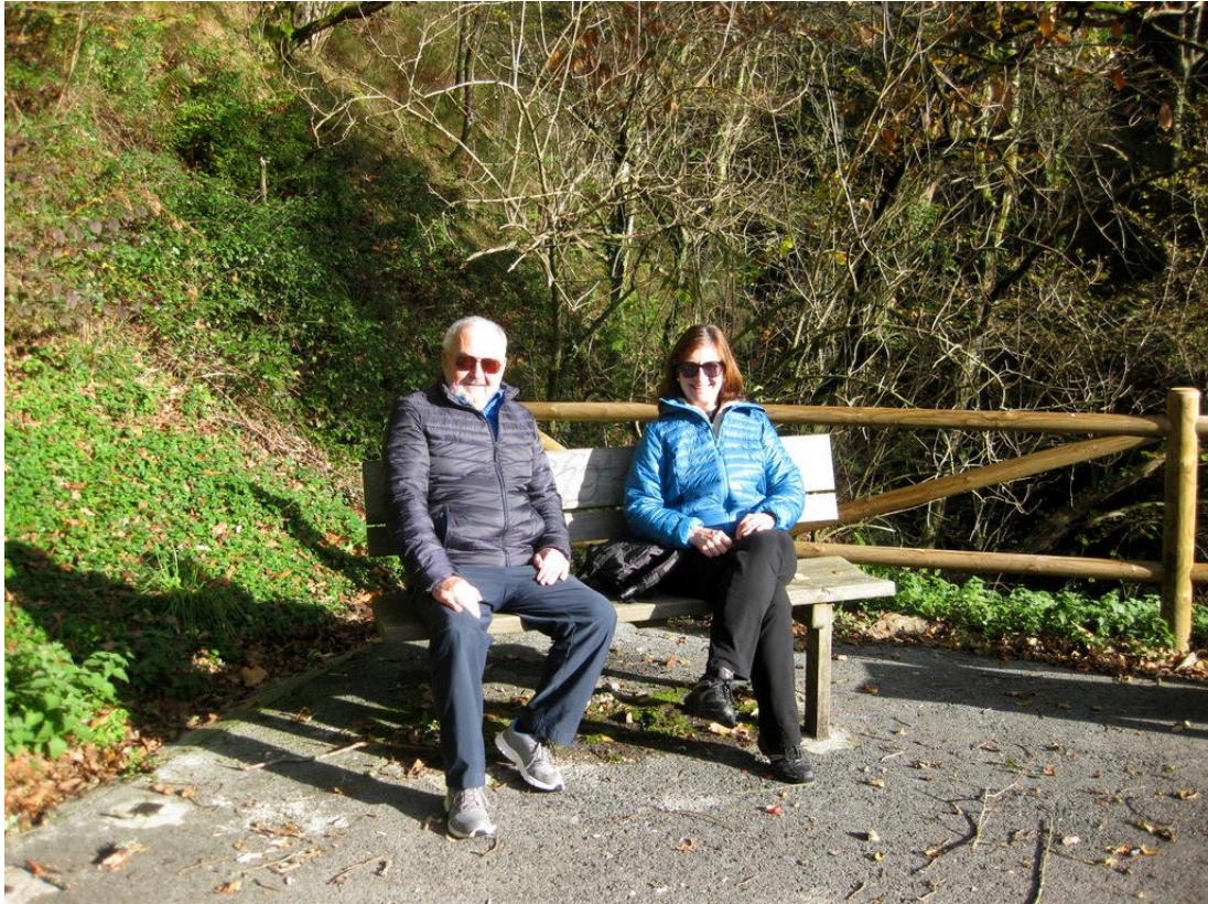
Bikotea patxada ederrean