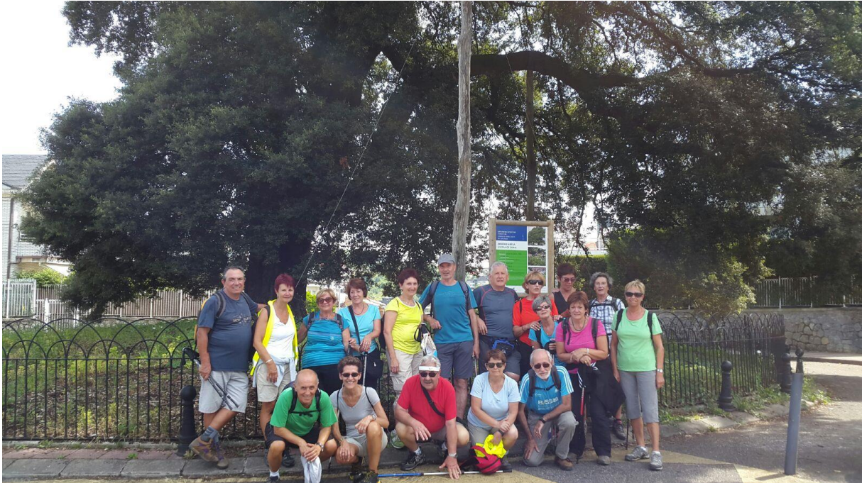
Berioko artearen ondoan