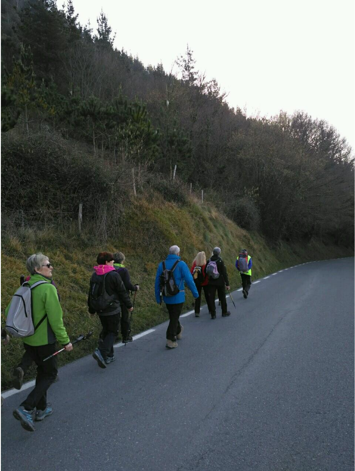
Ibilaldi berean, leku zoragarriak ikusten dira