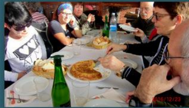
Galdonamendin hamaiketakoa hartzen eta Urdaburu mendia inguratzen