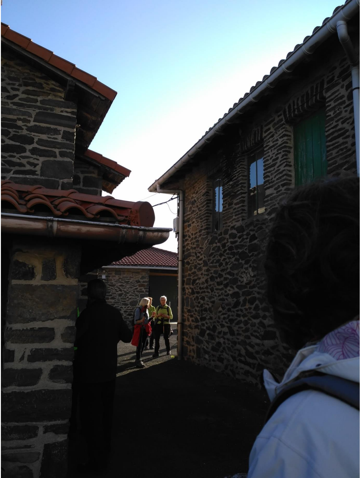
Endoiako baseliza eta Uztapide tabernaren tartean