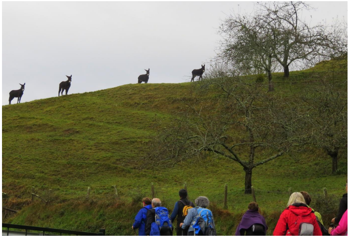
Hernalde eta Alkizako bidean