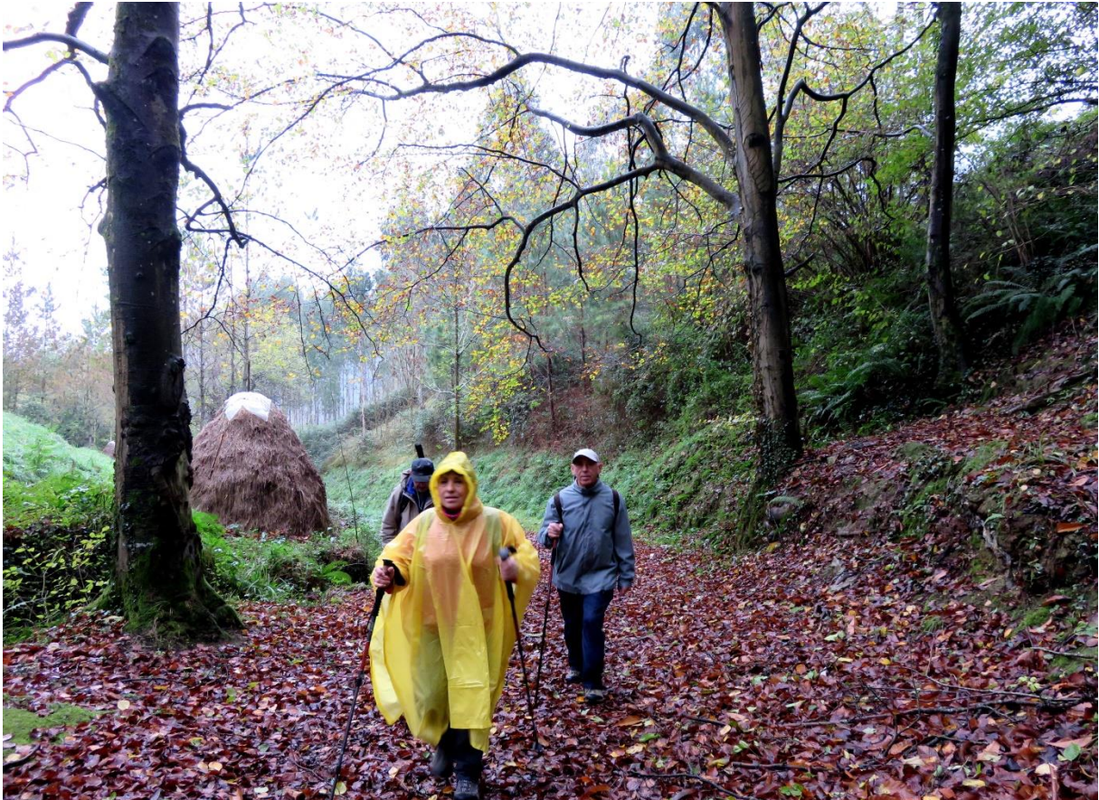
Ondarroako eta Irungo bidean