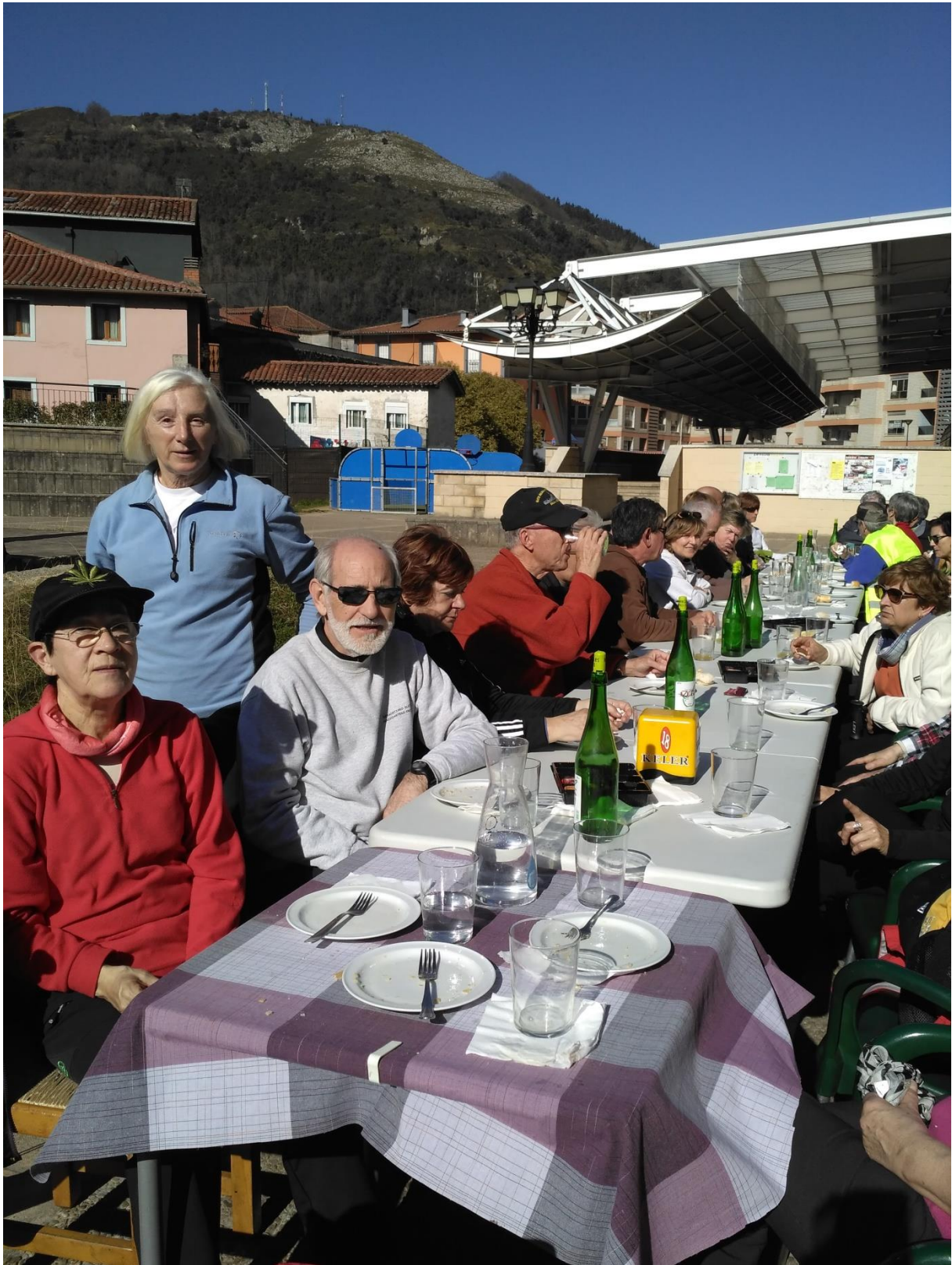
Zestoako tabernan, gudarien atsedena