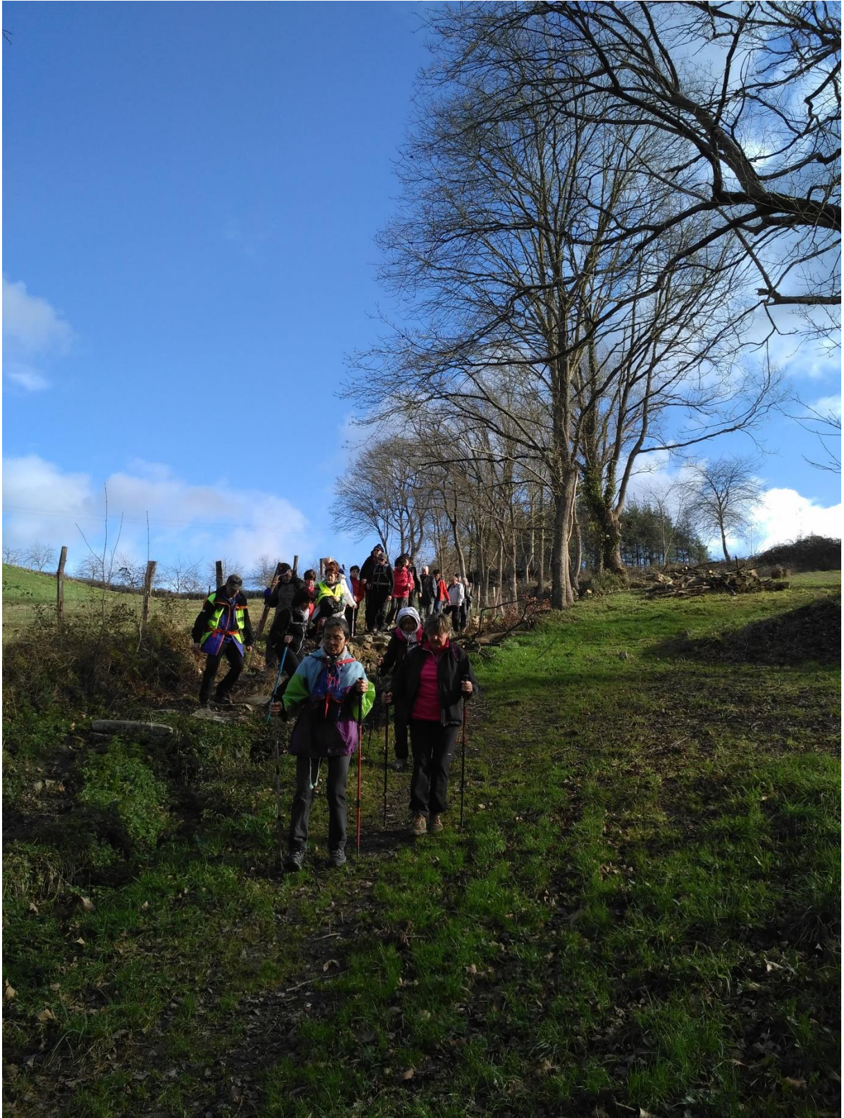
Leku berean, jendea poliki-poliki jaisten