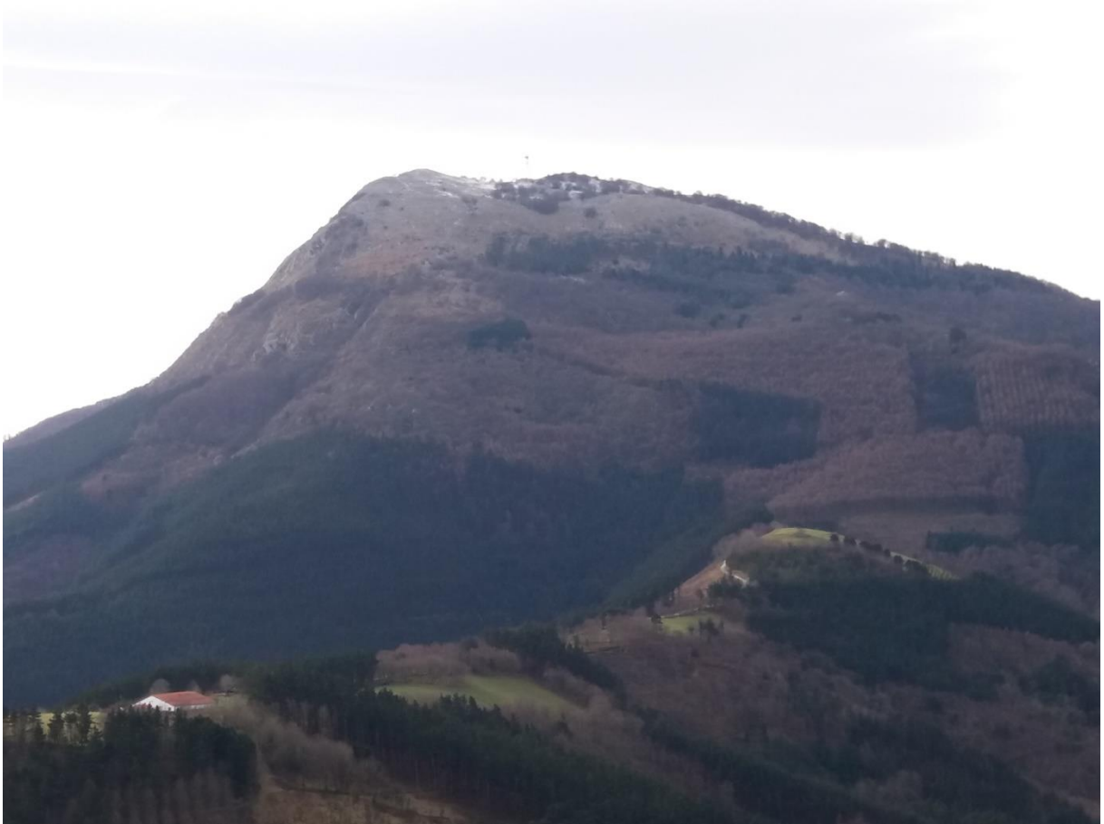
Izarraitz eta Ekain Berri (Zestoan)