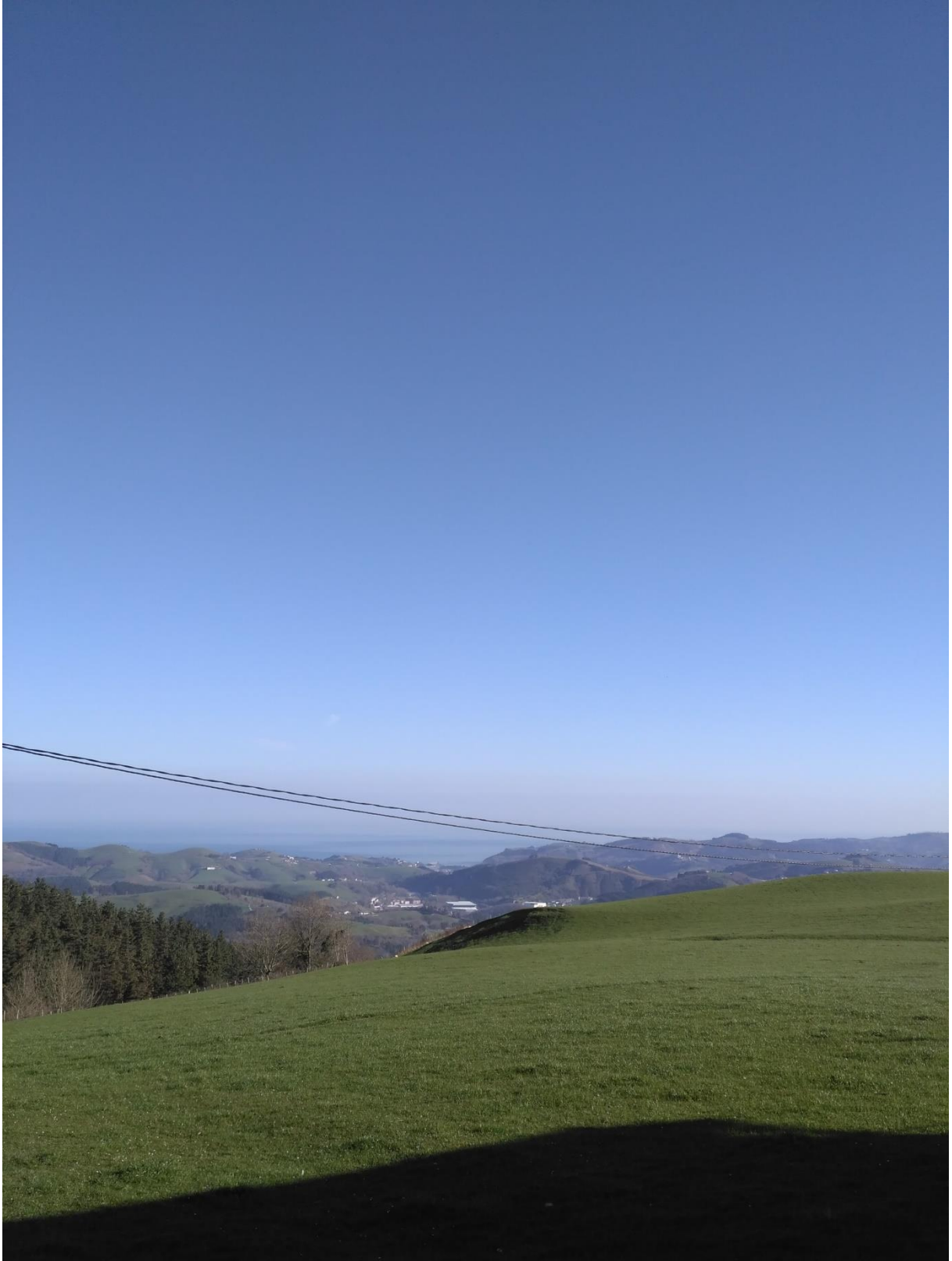
Endoia eta Zestoa bitarteko paisaia aparta