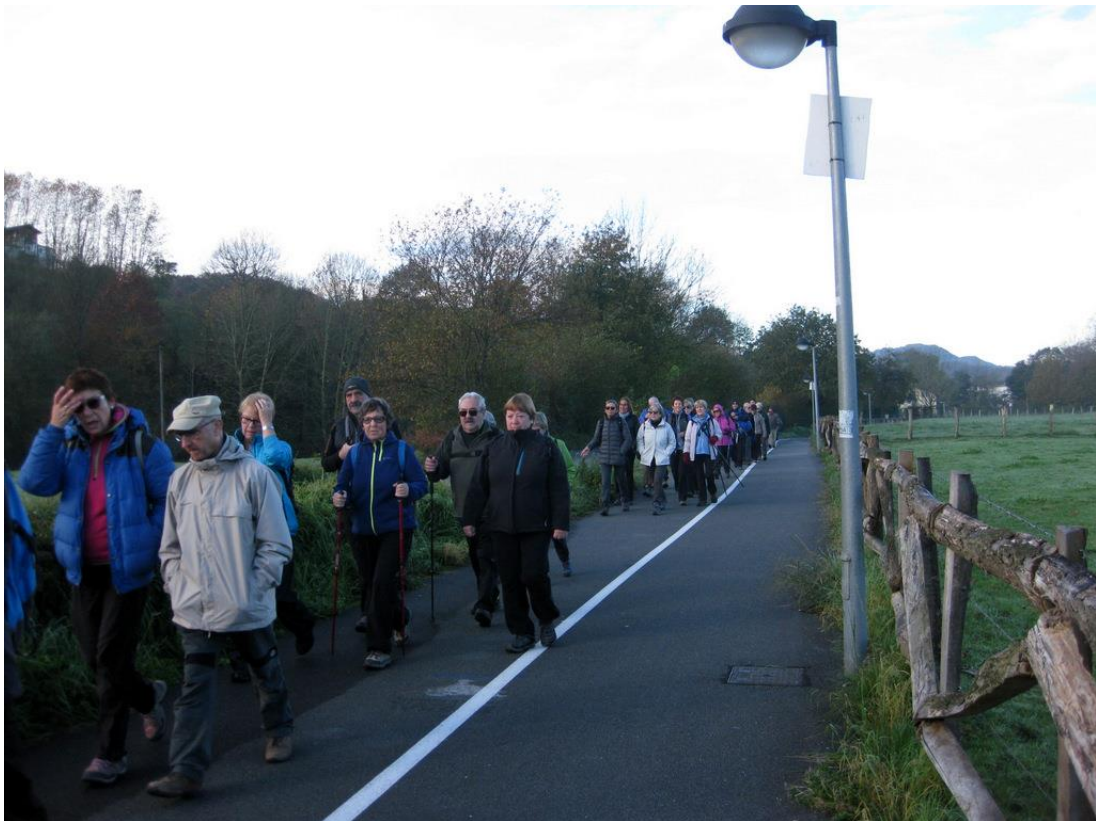
Lasarte, Zubietako inguruetan?