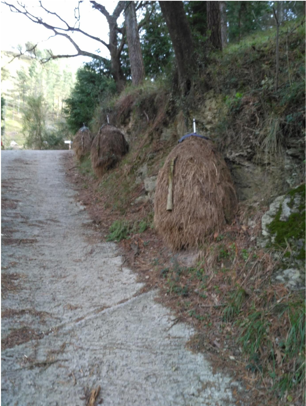
Ibañarrieta bideko aldapa gogorra belar metaz josia