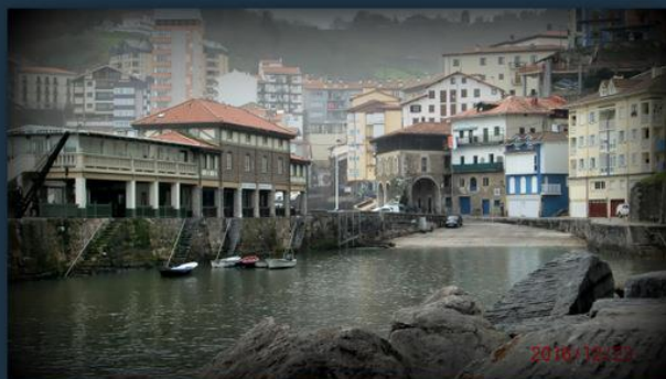
Ondarroako argazkiak eta ibilbidea