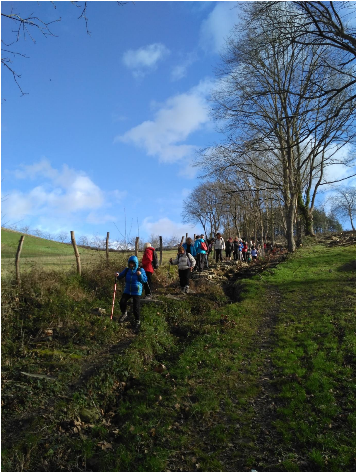
Idiazabalerantz, aldapa irristakor bat jaisten