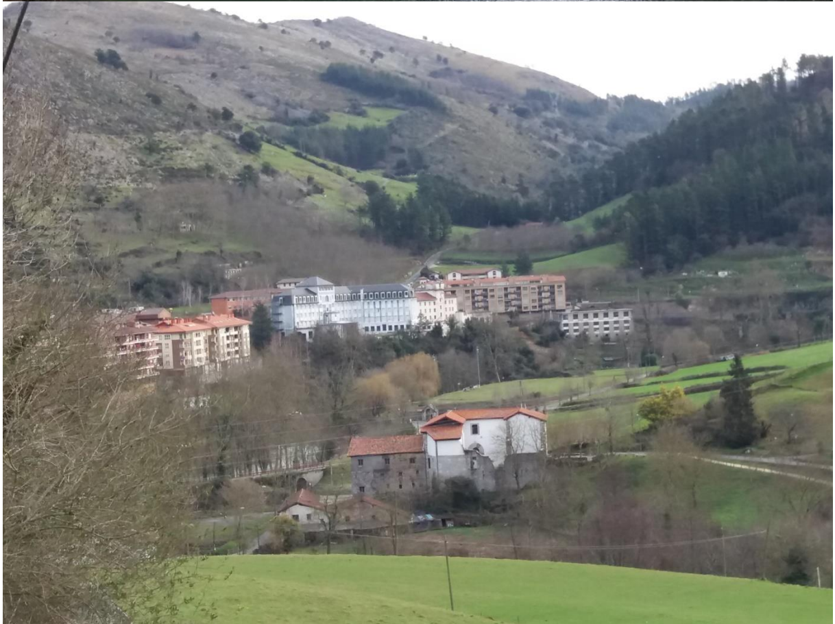
Zestoako bainutegia eta herriaren ikuspegi bat