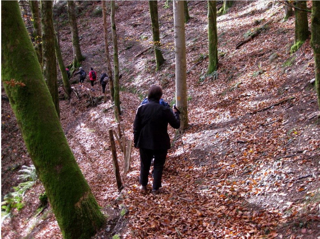
Artikutzako basoan zehar