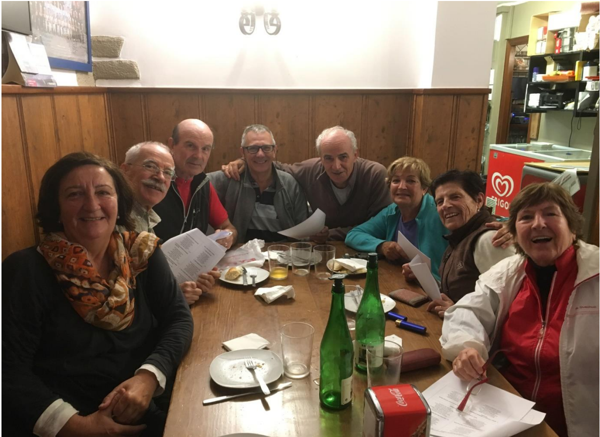
Irungo bidean, San Anton urtegitik abiatuak eta Gurutzen