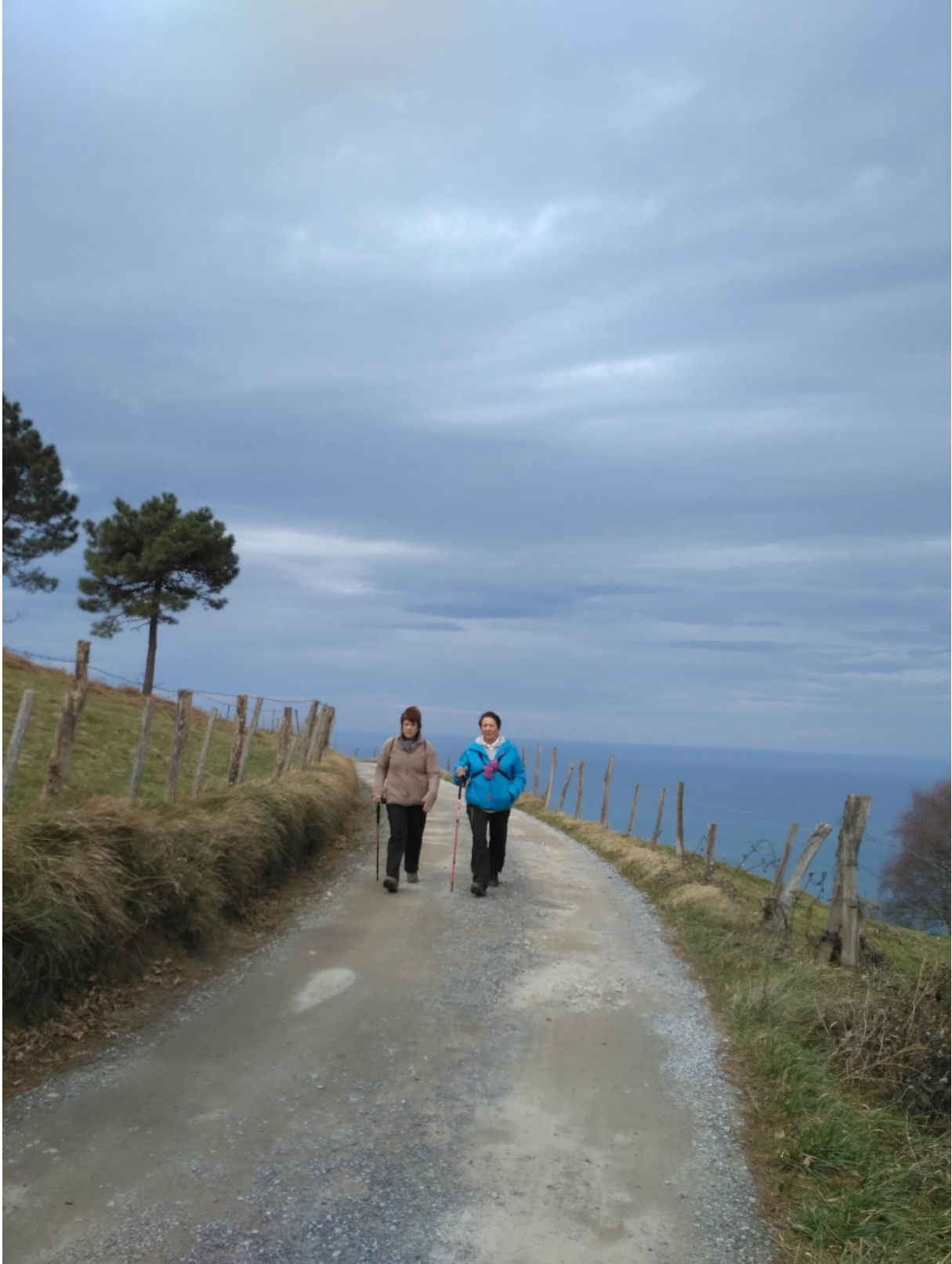
Kostaldeko bidean, horien atzetik datozenak