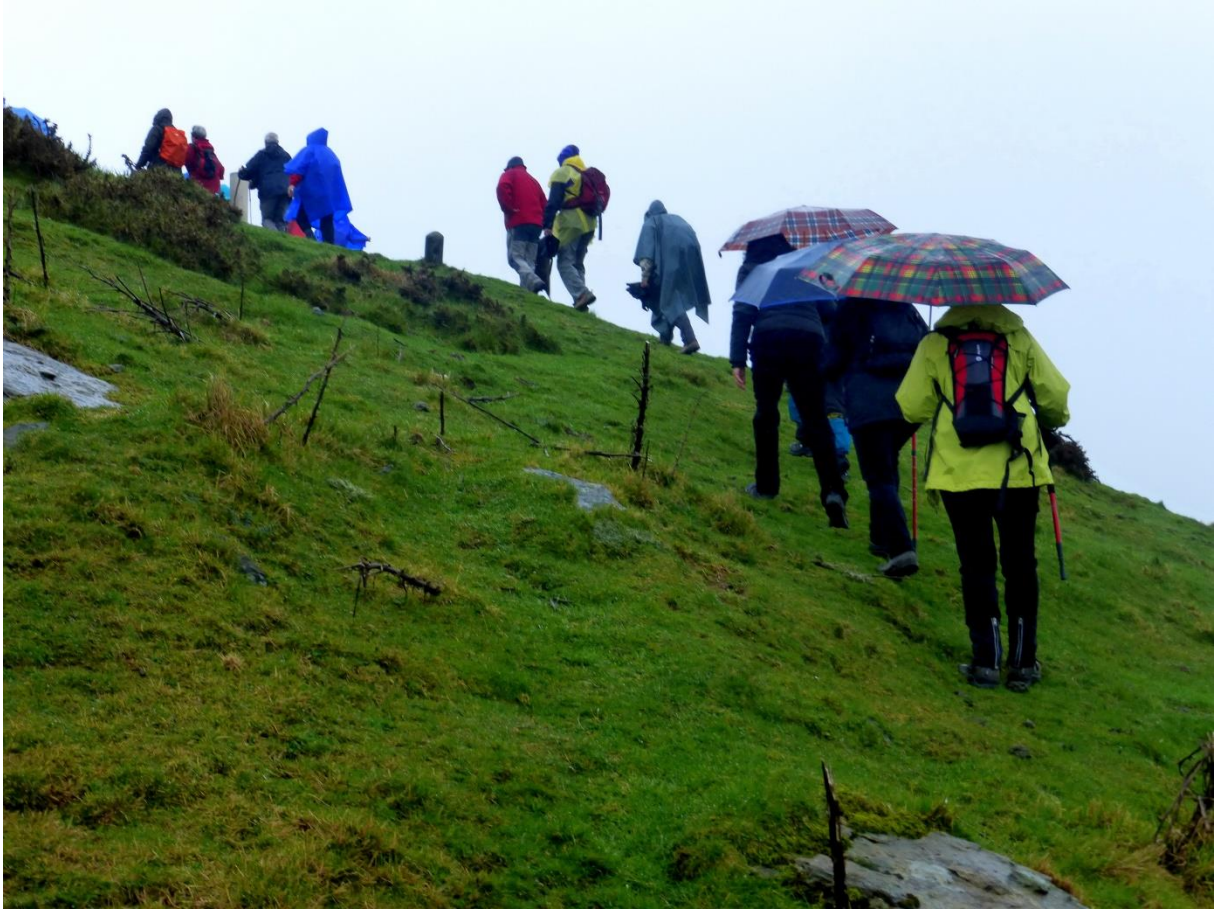
Otarre alderantz igotzen eta San Anton urtegitik Irunerantz