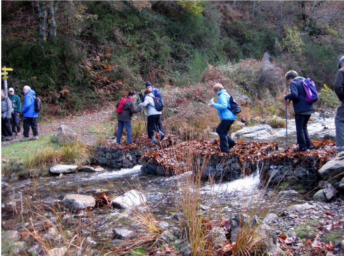
Arditurriko harri-ibia zeharkatzen