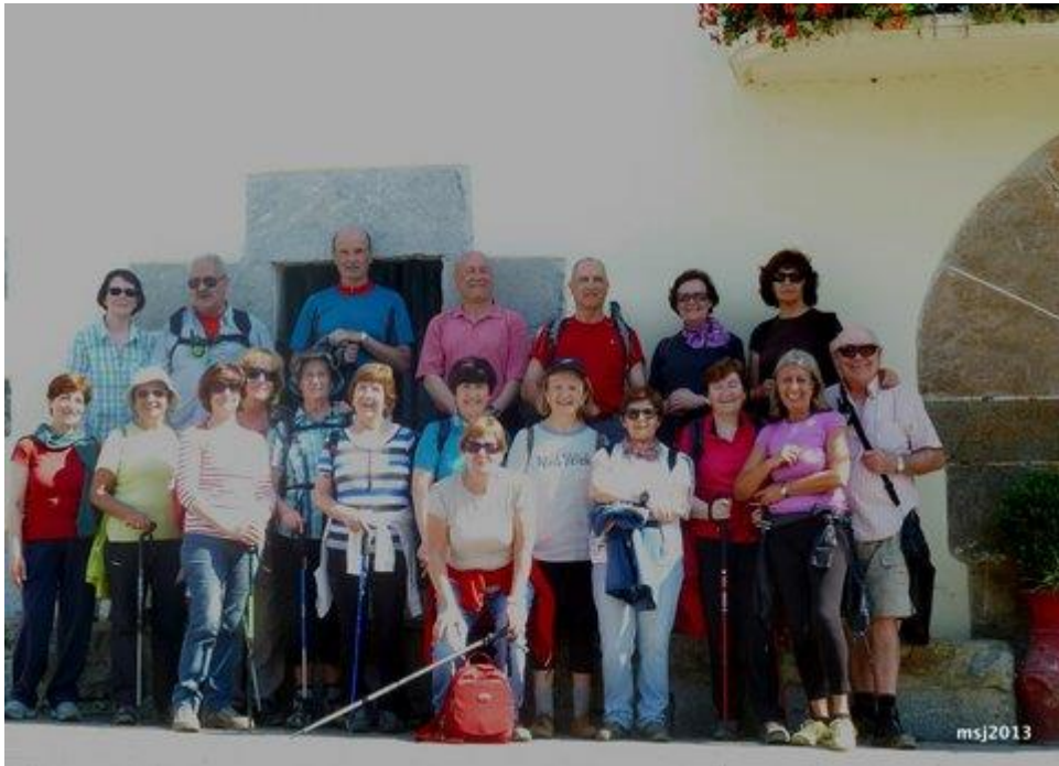
Askizun eta Kuku Harrin