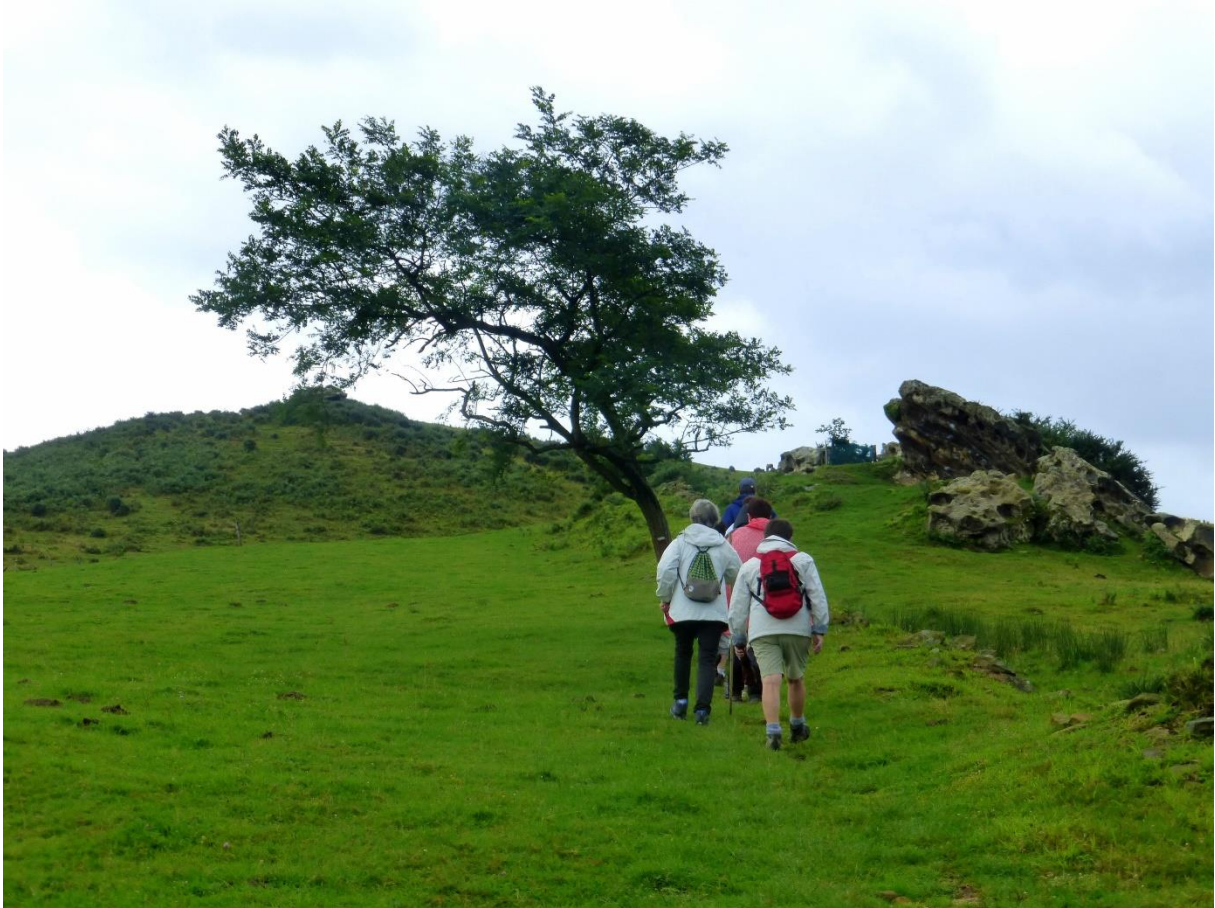
Jaizkibeleko Londres baserriaren inguruan eta Mendiolan zehar