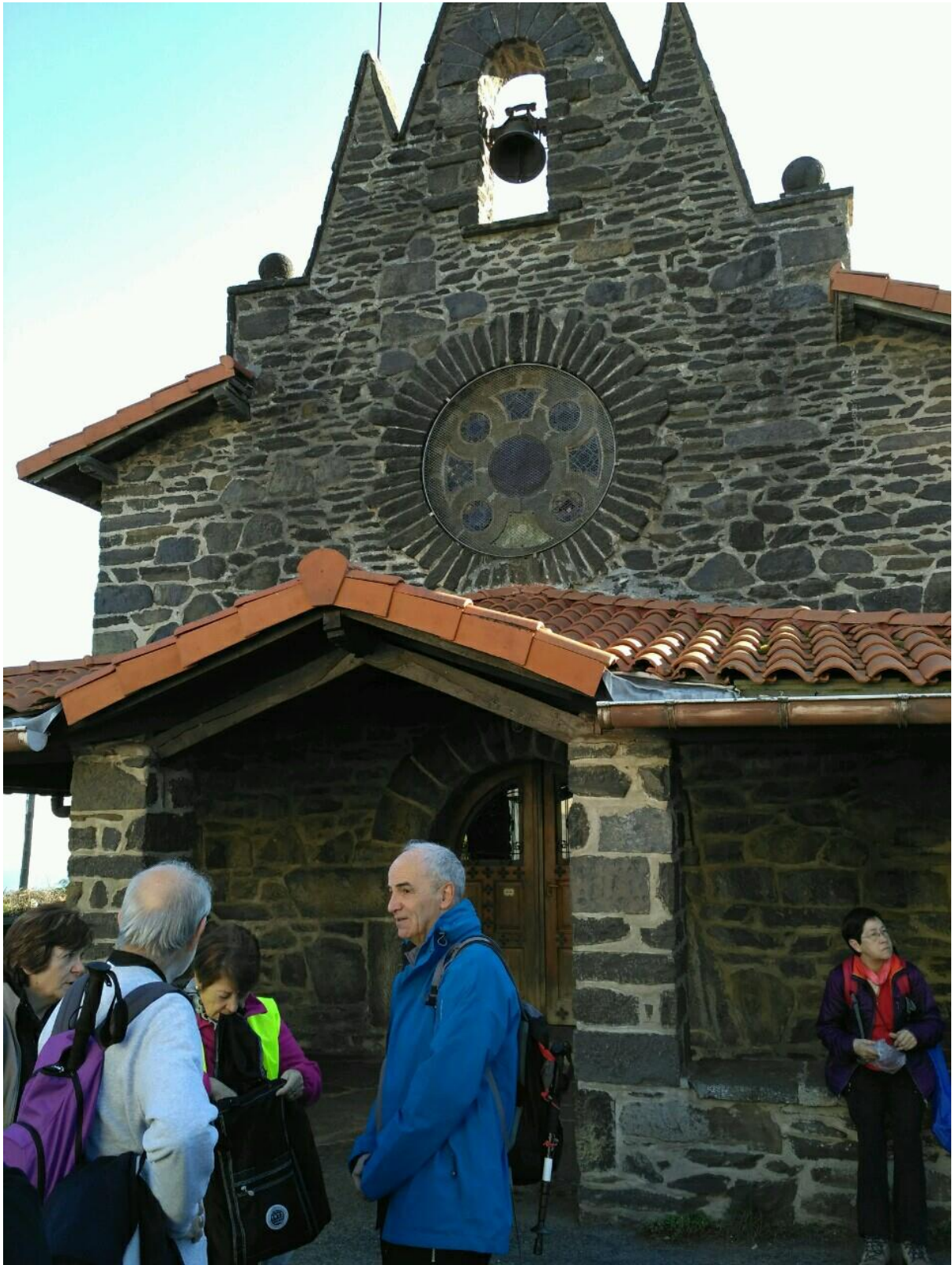
Endoiako basilizaren ondoan atseden hartuz