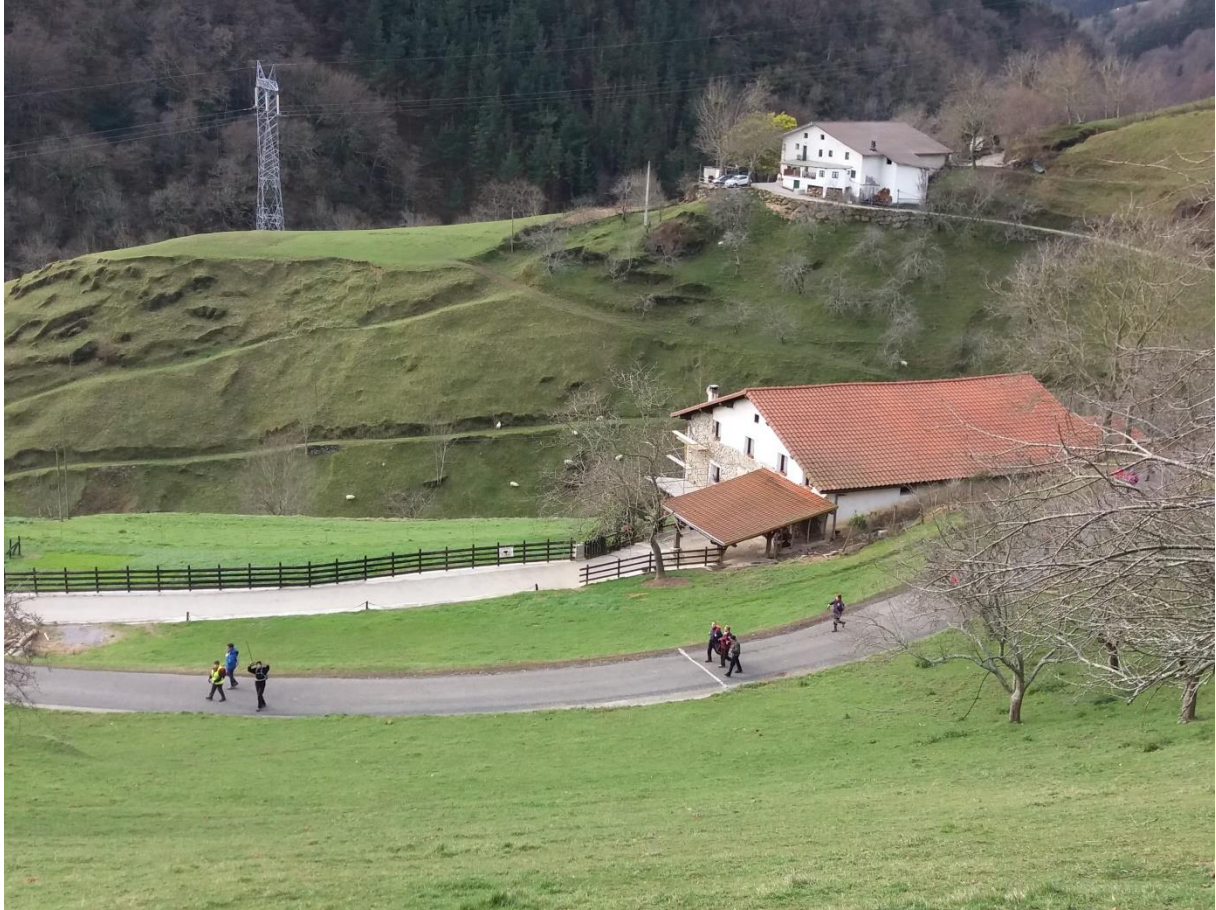
Zestoako bidean paisaia eta baserri apartak