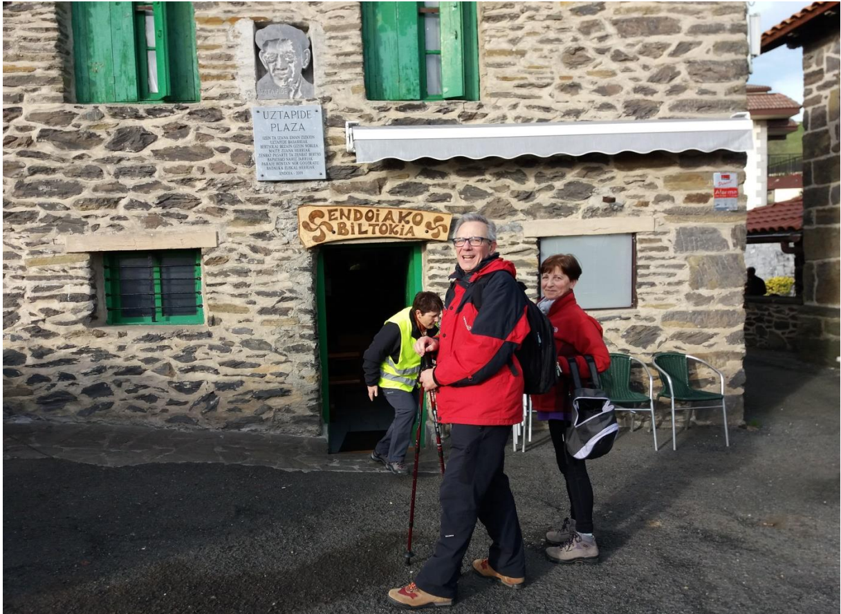
Endoiako Uztapide jatetxea eta bideko arte zoragarria