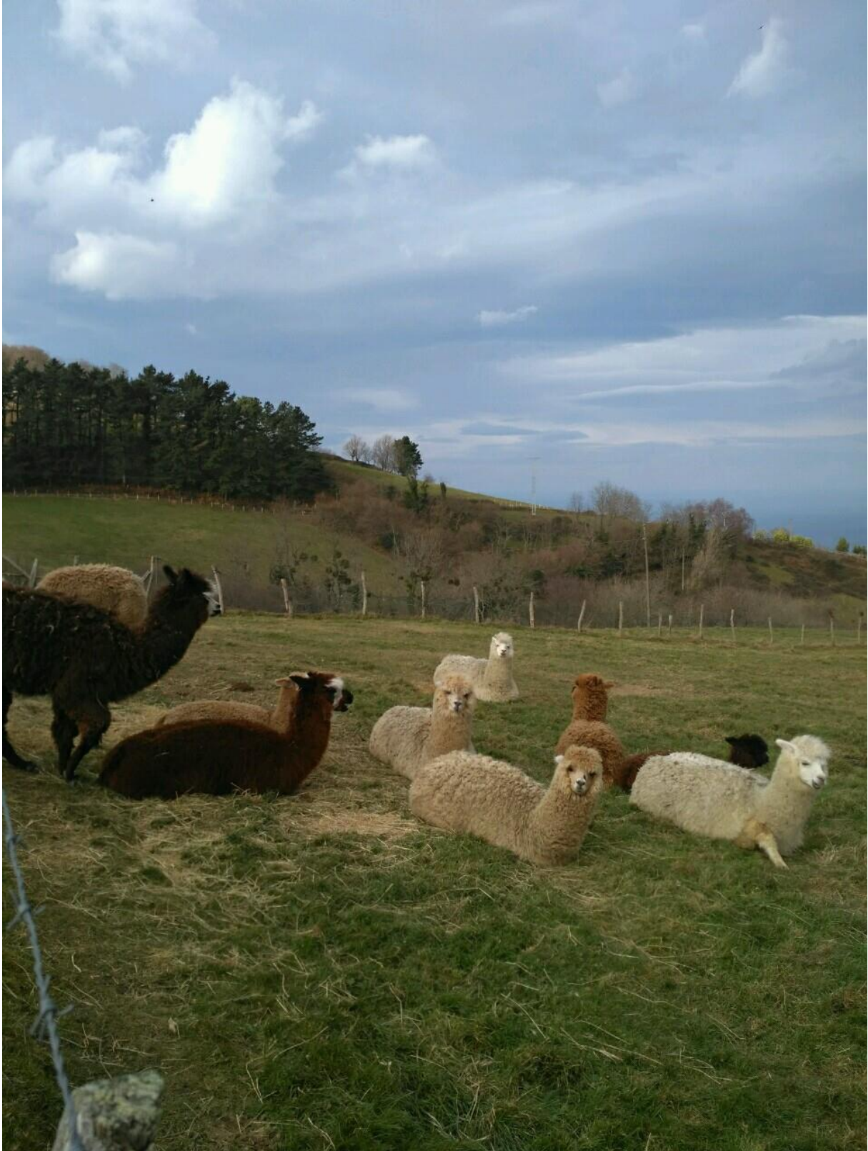
Igeldoko animalia exotikoak, "llamaren antzekoak)