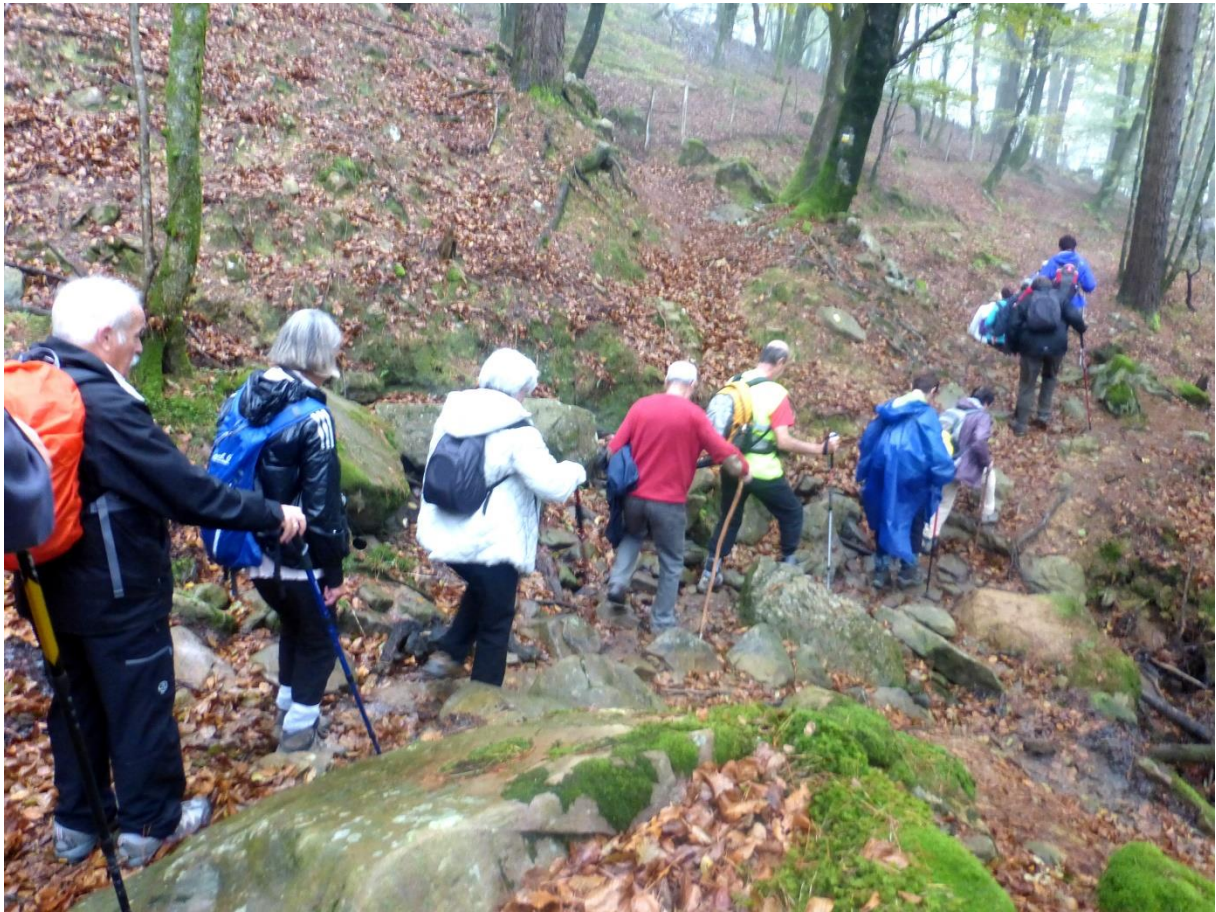
Artikutzako basoan zehar eta San Anton urtegitik Irunerantz