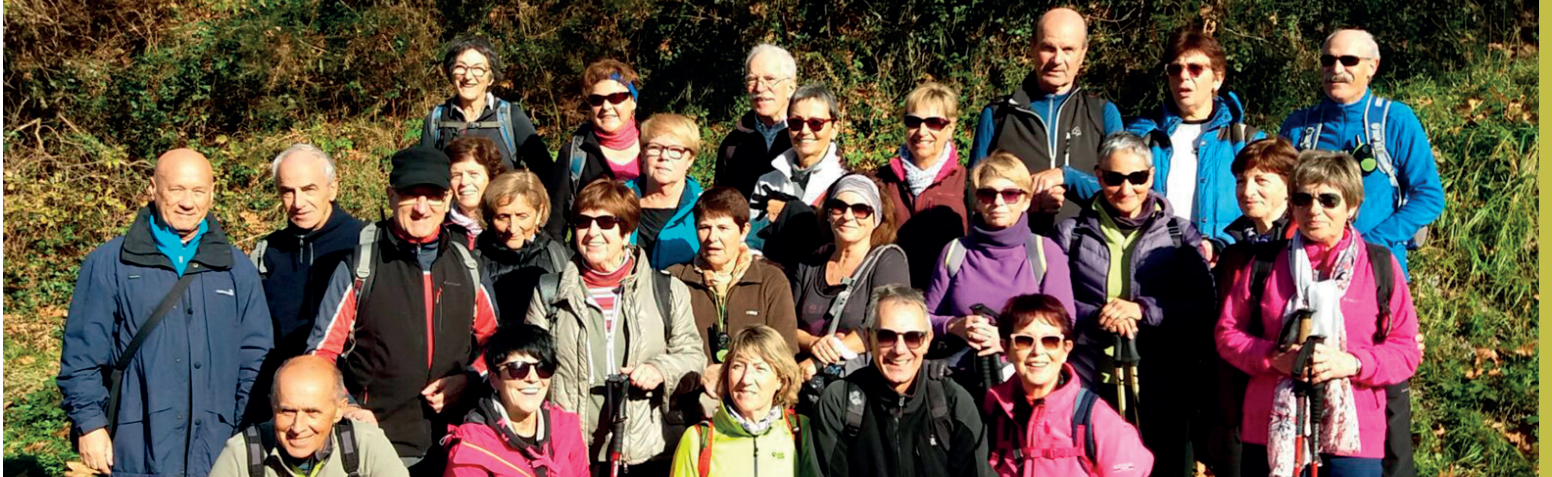
Senderistas en Arditurri-Oiartzun

Bidezidor kirolak, orokorrean, bakoitzarengan sentiberatasun berezia sorrarazten du. Hemen nork bere sentipenak ditu eta izadiaren eta gizadiaren aurrean era desberdineko adierazpenak azaltzen ditugu. Hona ondoren, Mendiolan, zakarrak biltzen ari zen gizon bati buruzko gogoeta: