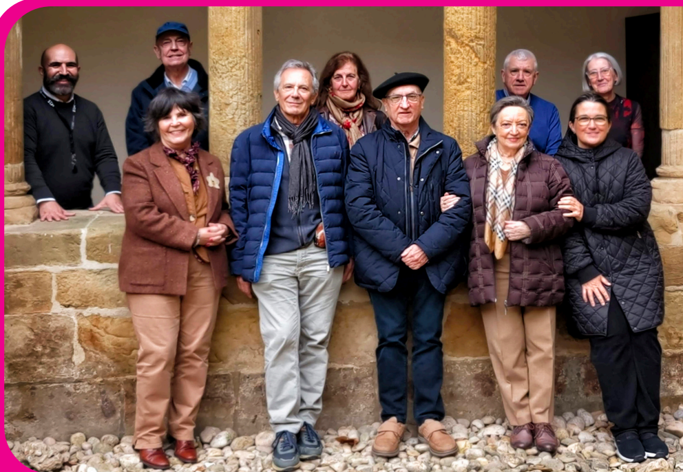
Gidari talde osoa museoko ardunadureekin.